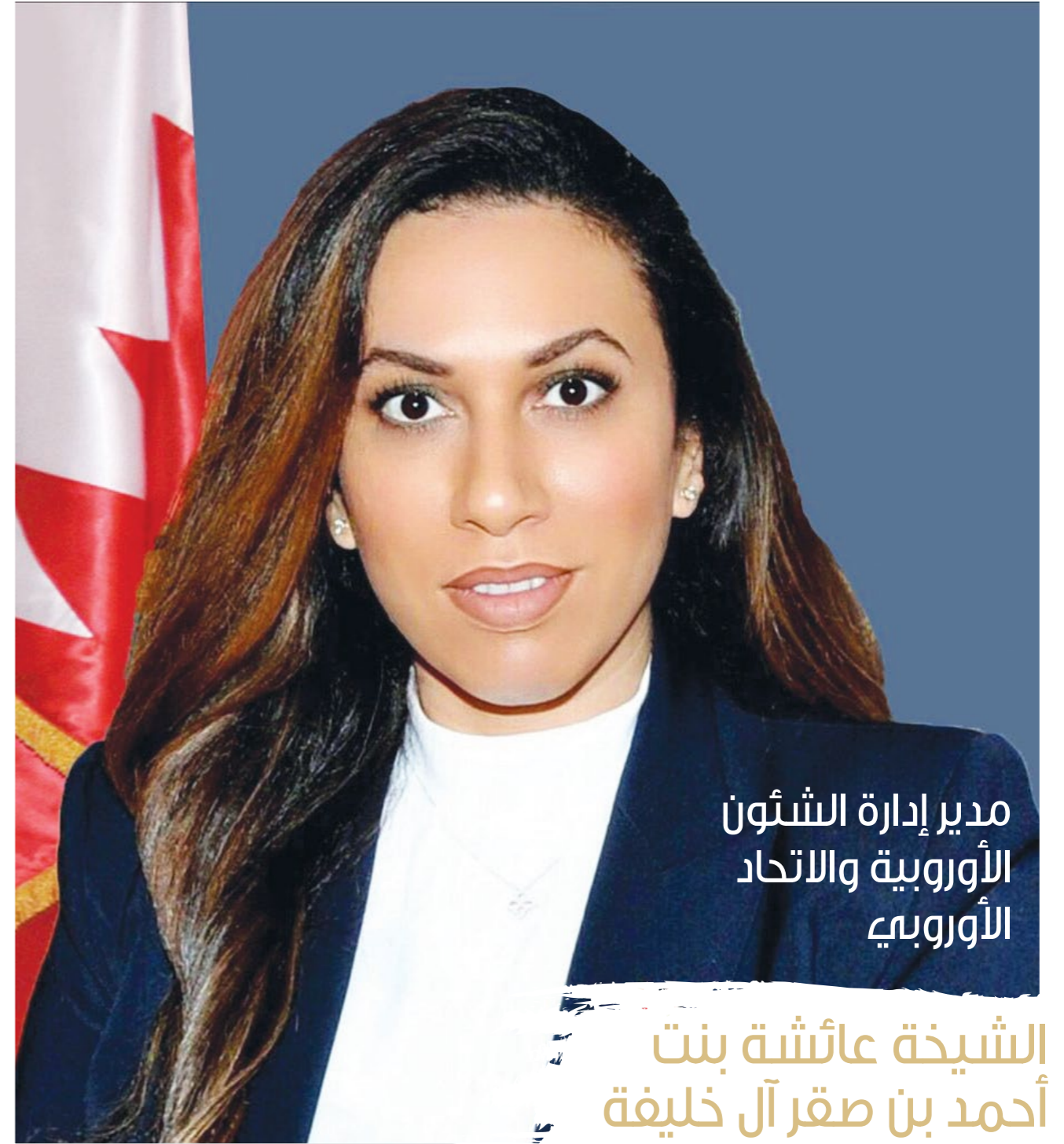
مدير إدارة الشؤون الأوروبية والاتحاد الأوروبي