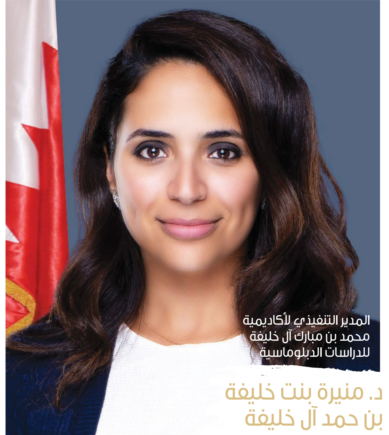
المدير التنفيذي لأكاديمية محمد بن مبارك آل خليفة للدراسات الدبلوماسية