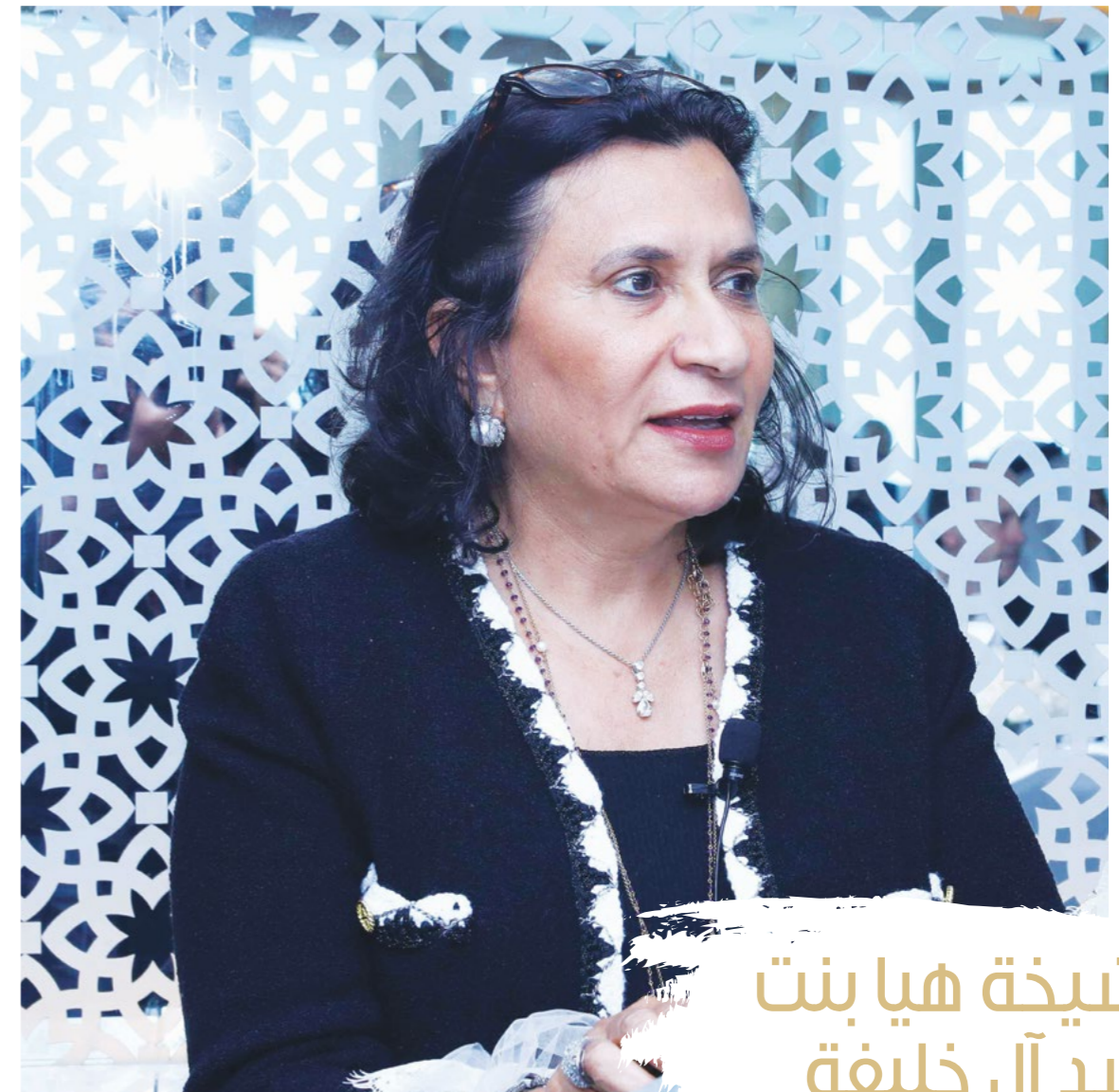
الشيخة هيا بنت راشد آل خليفة

لقد مثلت هذه الوجوه الصورة الحضارية المشرفة للمرأة البحرينية التي تميزت في دراستها ووظيفتها وتبوأَت المراكز المتقدمة لتواصل مسيرة التميز والعطاء.