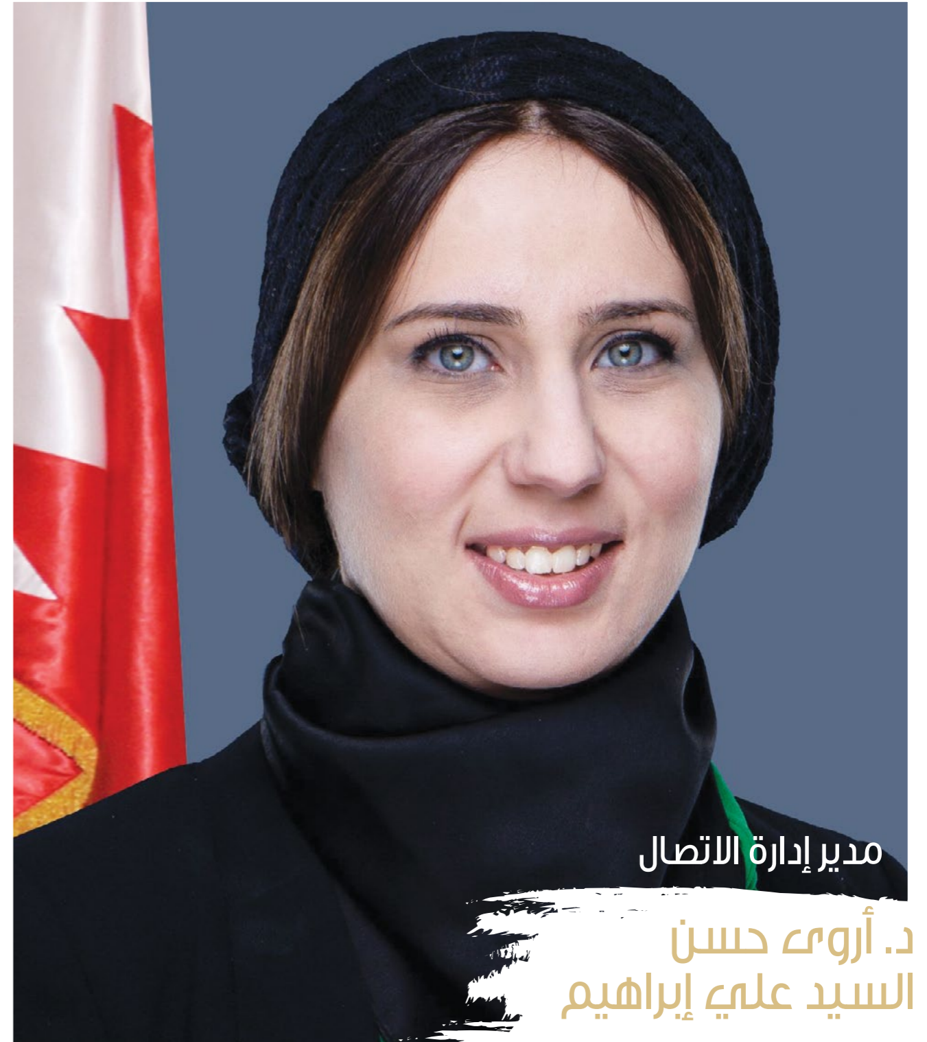
مدير إدارة الاتصال