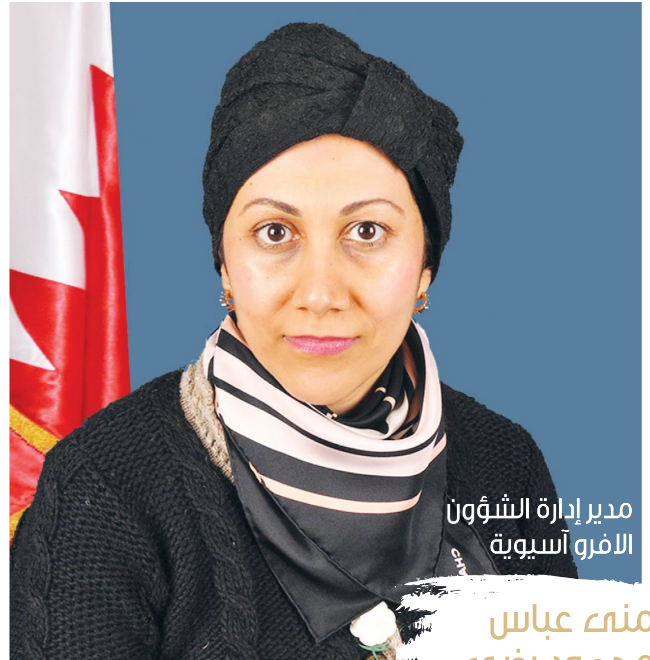
مدير إدارة الشؤون الأفرو آسيوية