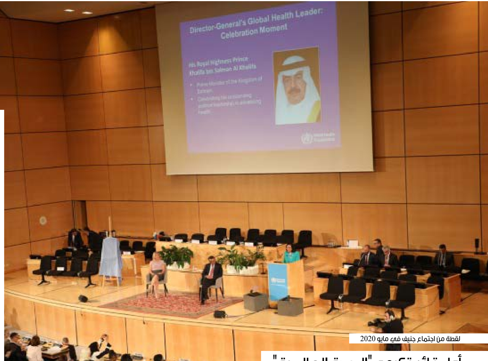
لقطة من اجتماع جنيف في مايو 2020

سموه أكد أن القطاع الصحي كان له النصيب الأكبر من اهتمام الحكومة، التي عملت على توفير بنية صحية عصرية ومتطورة، والارتقاء كما وكيفا بالمنشآت الصحية والعلاجية وتزويدها بأحدث الوسائل التكنولوجية دونما إغفال لتطوير الكوادر البشرية وتأهيلها وفق استراتيجيات وخطط وطنية ممتدة ومتجددة عبر السنوات، كما أكد اعتزاز مملكة البحرين بتعاونها المستمر القائم مع منظمة الصحة العالمية في كل ما من شأنه دعم خطط وبرامج المنظمة في تحقيق أهداف التنمية المستدامة، واهتمام البحرين بتعزيز هذا التعاون خصوصاً عبر "جائزة خليفة بن سلمان