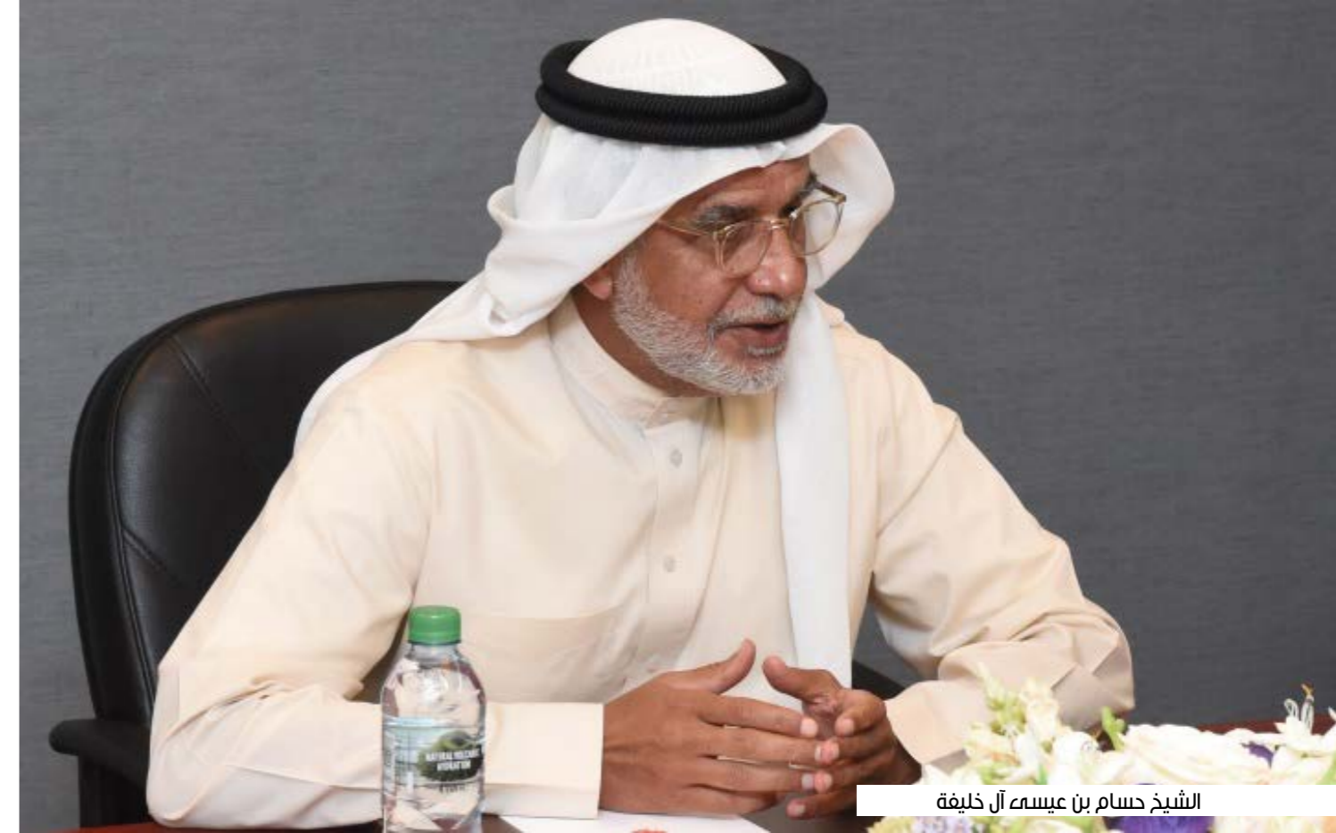
الشيخ حسام بن عيسى آل خليفة

وللمنتسبين للحقل الطبي انطباعهم، والذي عبرت عنه رئيسة جمعية الأطباء البحرينية غادة القاسم بتقديم خالص الشكر وعظيم الامتنان إلى صاحب السمو الملكي رئيس الوزراء، على ما يقدمه سموه من دعم متواصل للأطباء والكوادر الصحية في مملكة البحرين، مؤكدة أن جميع العاملين في القطاع الصحي يلمسون بشكل مستمر ما يكتنه سموه من تقدير كبير لهذه الفئة من أبنائه؛ تقديراً لجهودهم وعطائهم في خدمة الوطن، فهذه المبادرة الكريمة من سموه تحمل الكثير من المعاني النبيلة التي تعكس إيمان القيادة والمجتمع بقيمة وأهمية الطبيب البحريني بوصفه عنصراً فاعلاً في بناء وتنمية الوطن، لذلك، فجميع منتسبي القطاع الصحي في المملكة يتطلعون إلى الاحتفال باليوم الأول للطبيب البحريني وتسليم الفائزين جائزة "خليفة بن سلمان آل خليفة للطبيب البحريني"، التي سيكون لها الأثر الكبير في إثراء القطاع الصحي وتعزيز إسهامه في خدمة الوطن.