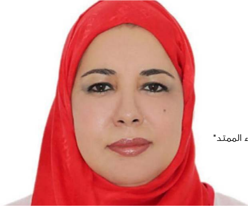
فئة "الوفاء والعطاء الممتد" المرتبة الأولى