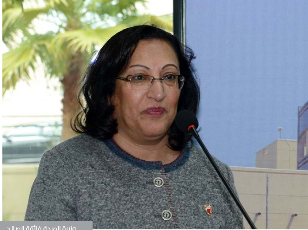
وزيرة الصحة فائقة الصالح

المدير الإقليمي لمنظمة الصحة العالمية إقليم شرق المتوسط ممثلاً عن منظمة الصحة العالمية أحمد سالم المنظري، رئيس جامعة الخليج العربي ممثلاً عن الجامعة خالد عبدالرحمن العوهلي، ورئيس الكلية الملكية الإيرلندية للجراحين - البحرين ممثلاً عن الكلية سمير العتوم.