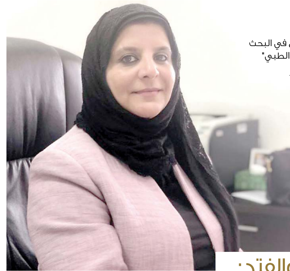
فئة " الابتكار والإبداع في البحث العلاجي والسريري والطبي" المرتبة الثانية مكرر

وأكدت أن الفوز بالجائزة يعد حافزاً ودافعاً نحو تقديم الغالي والنفيس لصالح خدمة الوطن في ظل قيادة جلالة الملك، قائلة إن الوطن أعطى الطبيب البحريني الكثير من الفرص لتحقيق العديد من المنجزات الوطنية، وكل ما يصل إليه الطبيب البحريني من عطاء نجاحات متميزة في العطاء إنما هو بفضل الدعم غير المحدود الذي يحظى به الطبيب.