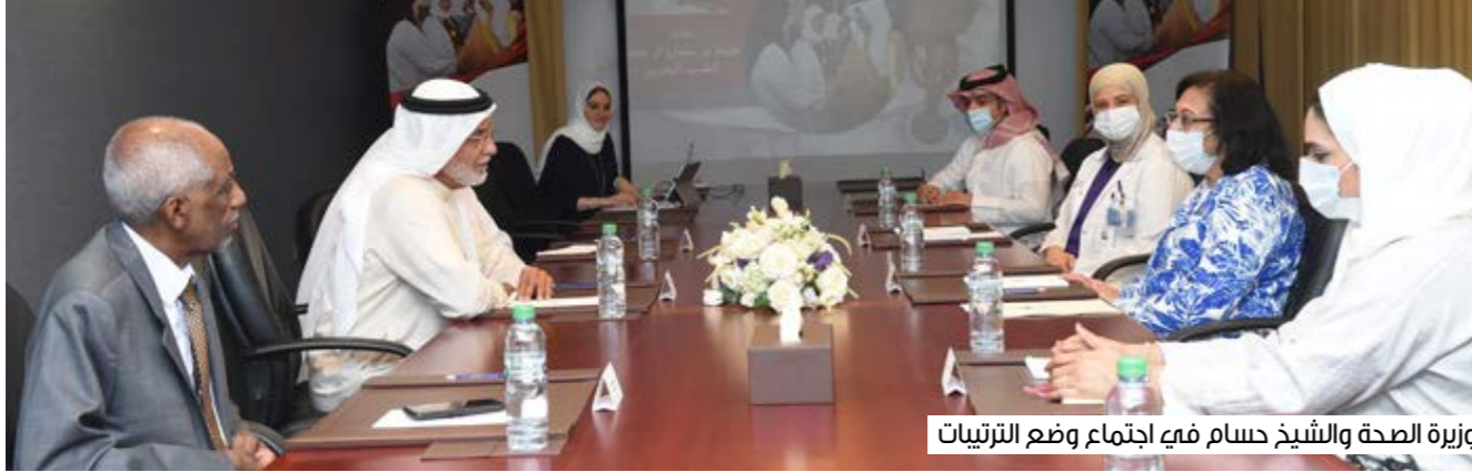
وزيرة الصحة والشيخ حسام فيه اجتماع وضع الترتيبات