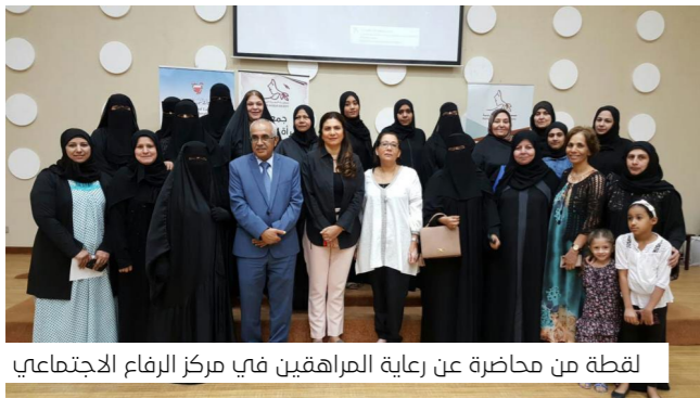
لقطة من محاضرة عن رعاية المراهقين في مركز الرفاه الاجتماعي