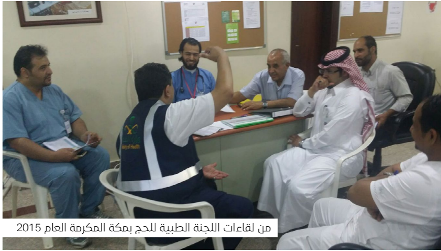
من لقاءات اللجنة الطبية للحج بمكة المكرمة العام 2015

لتطوير ورفع كفاءة أداء الكوادر الطبية بحملات الحج، من خلال إقامة ورشة عمل سنوية، نطلعهم فيها على أهم التعليمات والإرشادات الصحية والعلاجية، ونخضعهم كذلك لتدريبات خاصة بتقديم الخدمات الصحية والعلاجية في الديار المقدسة. وشهدت هذه الورشة السنوية تغييرات نوعية من حيث المحتوى وطريقة التقديم والكادر الطبي الذي يقدمها ومكان إقامتها، في ذات السياق نلتقي سنويًا مع الكوادر الطبية بحملات الحج في الديار المقدسة لمد جسور التعاون لمناقشة الخطط المرسومة لتقديم الخدمات الصحية والعلاجية في الظروف غير الاعتيادية. وقد تبين وبشكل ملحوظ مدى ضرورة هذه اللقاءات وأهميتها في النجاحات التي تسجل بشكل مشترك للجنة الطبية ببعثة مملكة البحرين للحج والكوادر الطبية بحملات الحج في حفظ صحة وسلامة الحاج البحريني والمقيم بمملكة البحرين.