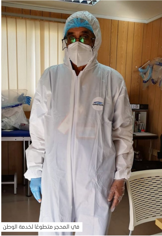
في المحجر متطوعاً لخدمة الوطن

أي القراءات والإصدارات أقرب إلى ميولك؟ تشدني الإصدارات الروائية والفلسفية، أضف إلى ذلك القراءة العلمية، وتجدني أحمل معي أكثر من كتاب، وحسب مزاج القراءة أنتقل من لون إلى لون آخر مع تشكيلة جميلة، وأقرأ لكتاب منوعين، فالرواية الواقعية لها مكانة لدي وكذلك الشعر.