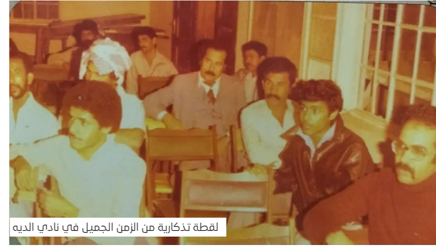
لقطة تذكارية من الزمن الجميل في نادي الديه

ولما للكوادر الطبية بحملات الحج من أهمية في حفظ صحة وسلامة الحاج البحريني والمقيم بمملكة البحرين، فقد حرصنا وبشكل مدروس على التعاون والتواصل المستمر معهم، الذي يهدف بشكل أساس إلى إشراك الكوادر الطبية بحملات الحج وبشكل تكاملي في تقديم خدمات صحية وعلاجية ذات جودة عالية لحجاج بيت الله الحرام، كما عملنا باستمرار