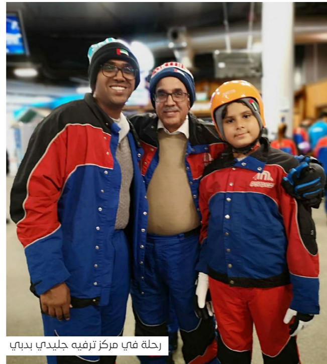
رحلة في مركز ترفيه جليدي بدبي

وماذا عن السفر.. أي البلدان والمدن تحب؟ في السفر، أعشق المدن التاريخية، لا سيما تلك التي تحمل عبق التاريخ والماضي، وأحب الطبيعة بلا شك وأعشقها بشكل كبير، وهناك الكثير من البلدان والعواصم كمدينة سانت بطرسبرغ وتعرف أيضاً سابقاً باسم لينينغراد وبيتروغراد، هي مدينة روسية تقع على دلتا نهر نيفا، شرق خليج فنلندا على بحر البلطيق، وهي ثاني أكبر مدن روسيا وعاصمة سابقة لروسيا القيصرية لأكثر من مئتي عام، كما أنها رابع أكبر مدن أوروبا وميناء مهم على بحر البلطيق، وأحبها لأنك حين تتجول فيها تعيش وكأنك في متحف كبير غني بالحضارات والروائع، ثم أحب إيطاليا ومدنها التاريخية كذلك.