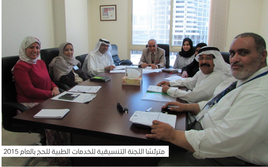
مترئسنا اللجنة التنسيقية للخدمات الطبية للحج بالعام 2015