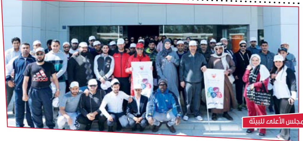
المجلس الأعلى للبيئة