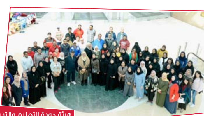
هيئة جودة التعليم والتدريب