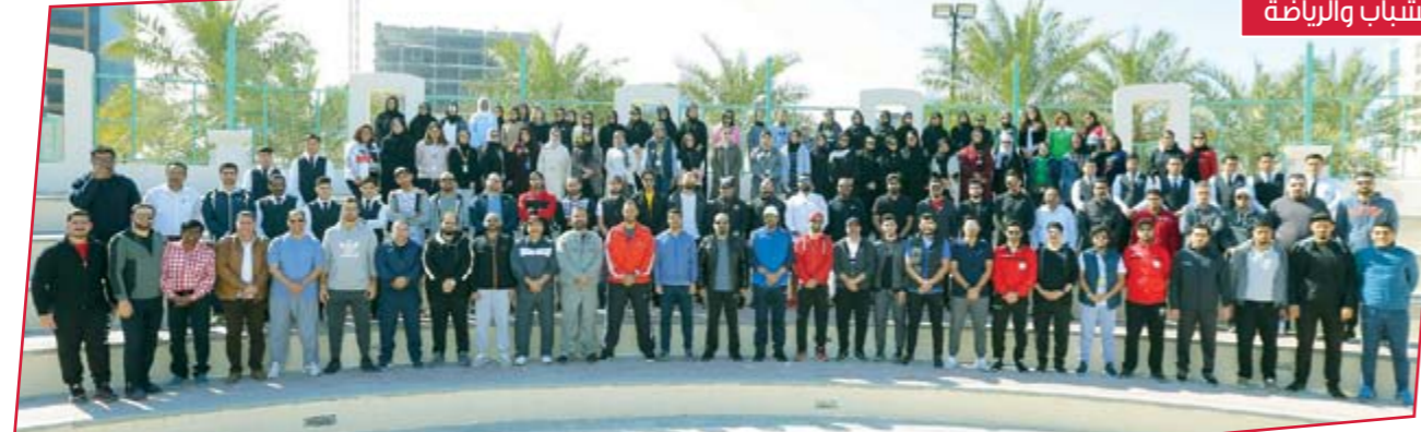
وزارة الشباب والرياضة