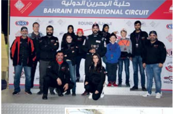
38 تحقيق فريق بابكو تأسس لضم المواهب البحرينية ودعمها