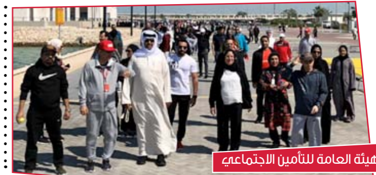
الهيئة العامة للتأمين الاجتماعي