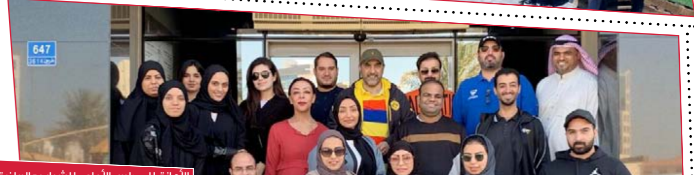
الأمانة للمجلس الأعلى للشباب والرياضة