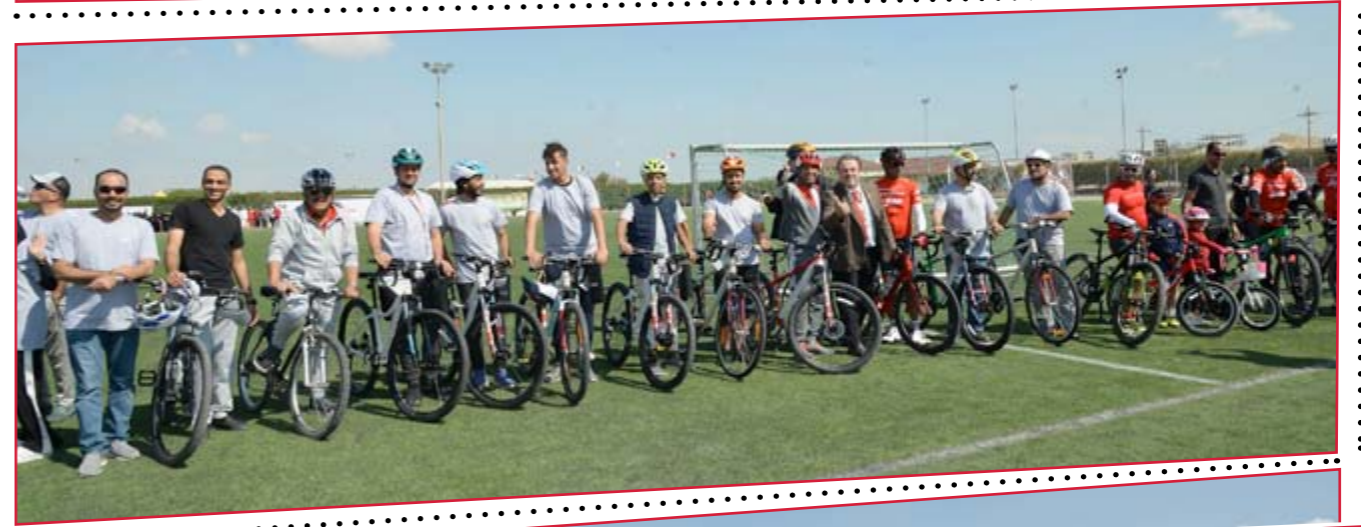
فعايلات بابكو فيه اليوم الرياضي