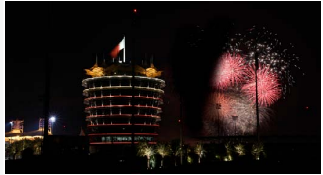
12 بلا حدود