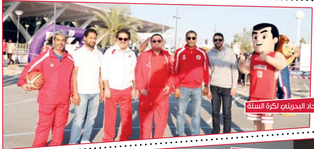
الاتحاد البحريني لكرة السلة