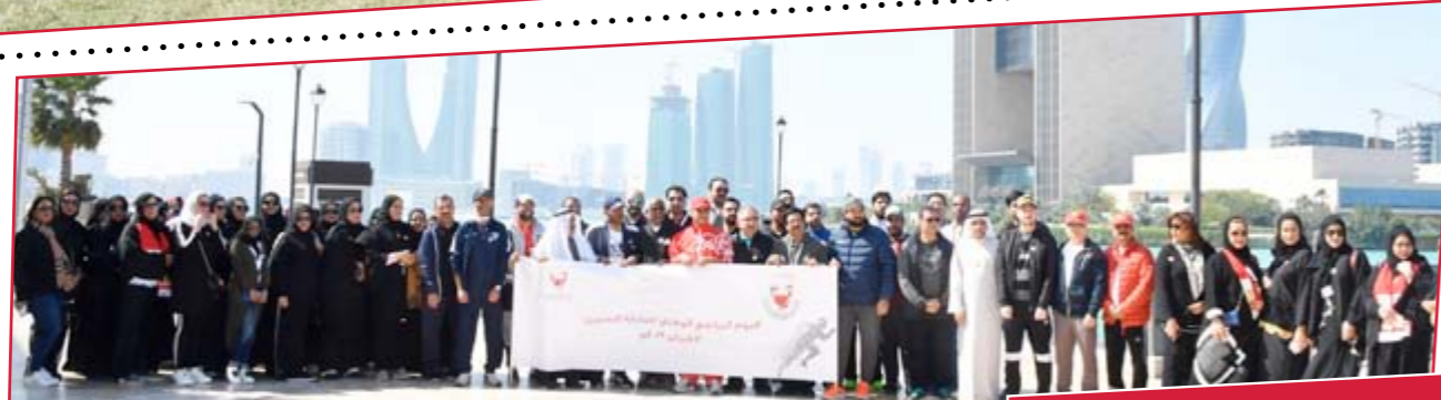
منتسبو ديوان سمو رئيس الوزراء