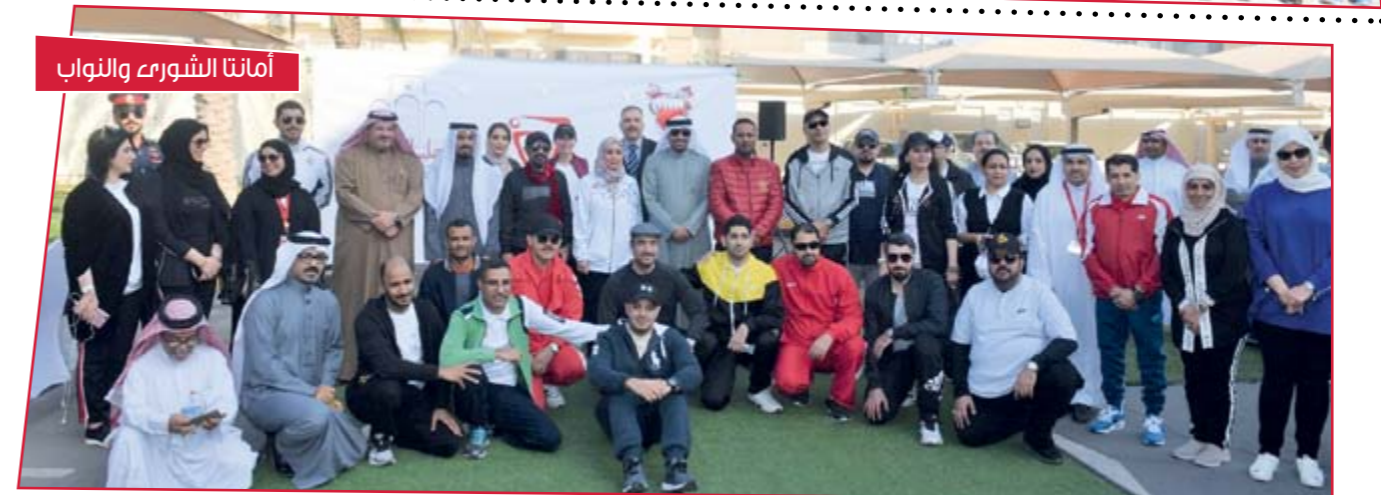
أمانتا الشورى والنواب