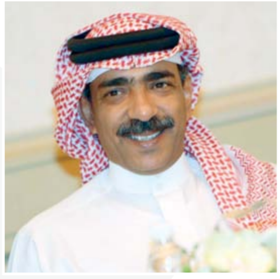
42 استطلاع علي بن محمد: قطار الرياضة لن يتوقف