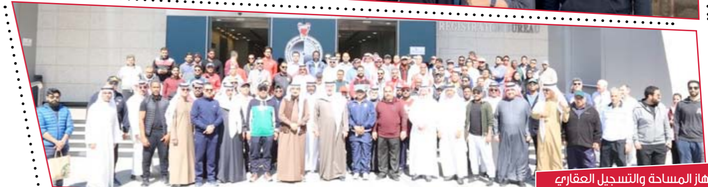
جهاز المساحة والتسجيل العقاري