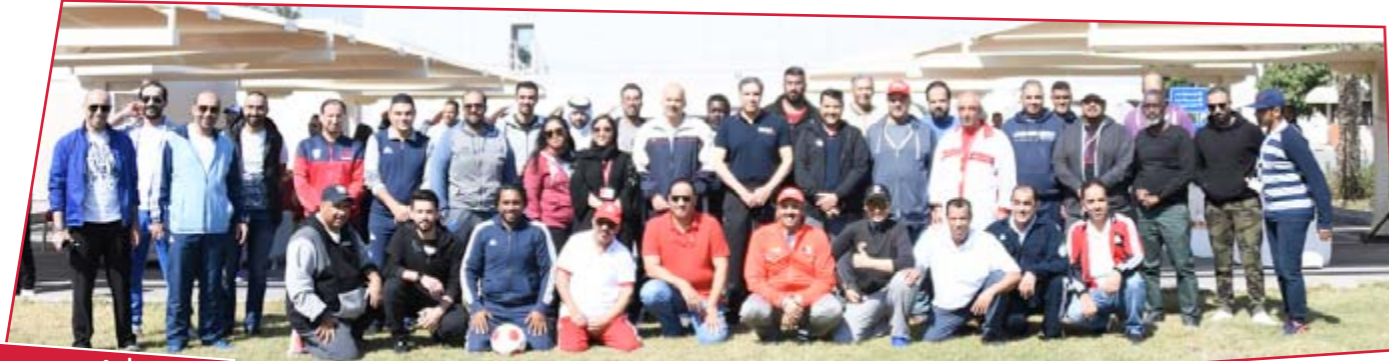
وزارة شؤون الإعلام