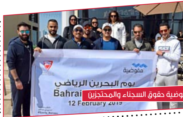
مفوضية حقوق السجناء والمحترزين