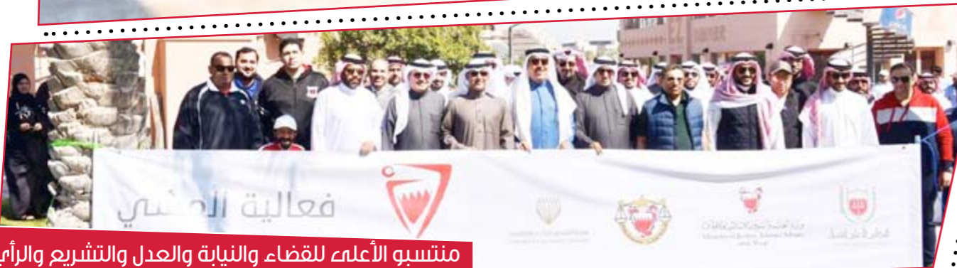
منتسبو الأعلامة للقضاء والنيابة والعدل والتشريع والرأية