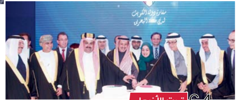
64 تحت الأضواء