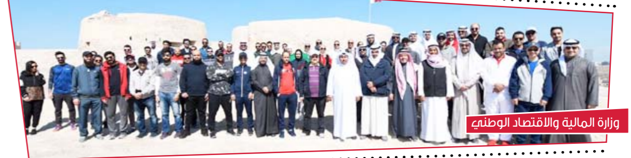
وزارة المالية والاقتصاد الوطني