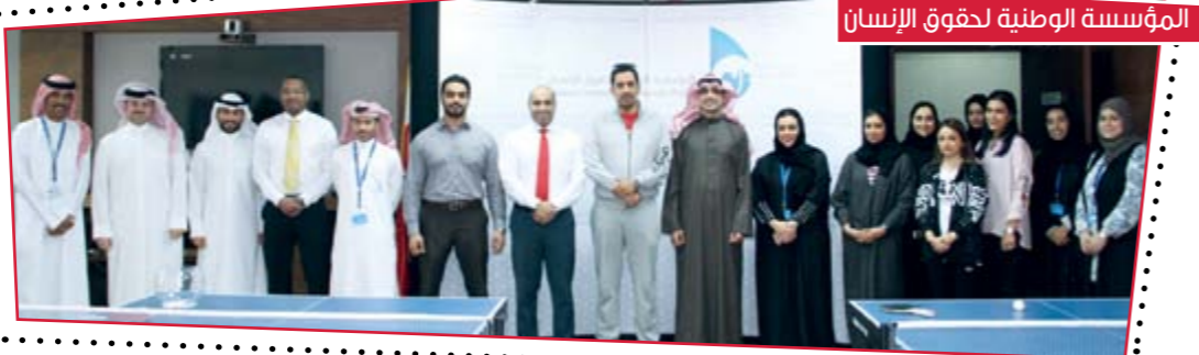
المؤسسة الوطنية لحقوق الإنسان