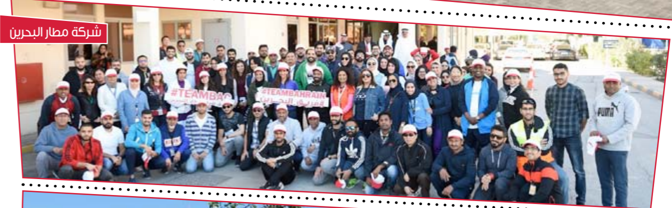
شركة مطار البحرين