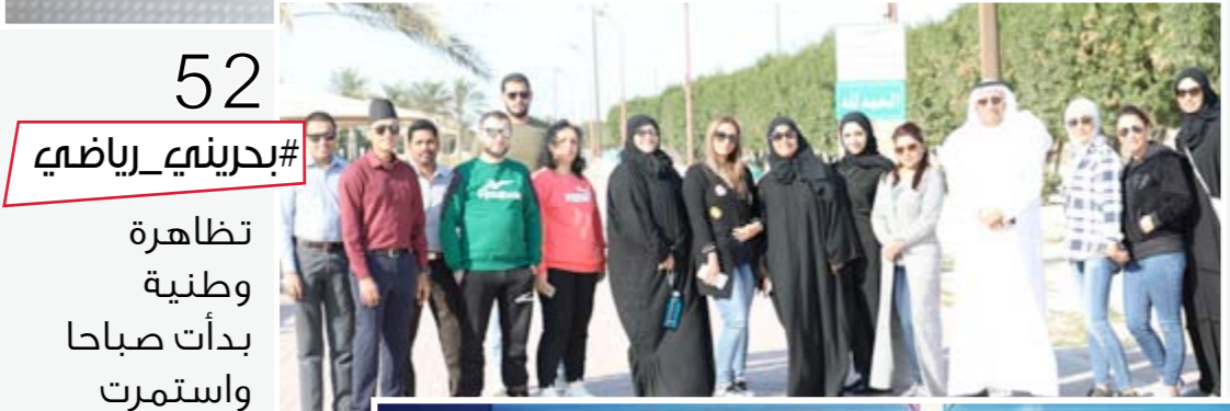
52 #بحرينية_رياضية تظاهرة وطنية بدأت صباحا واستمرت حتى المساء