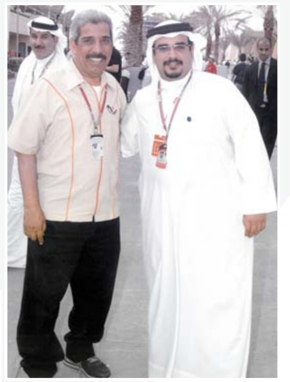
34 من الذاكرة