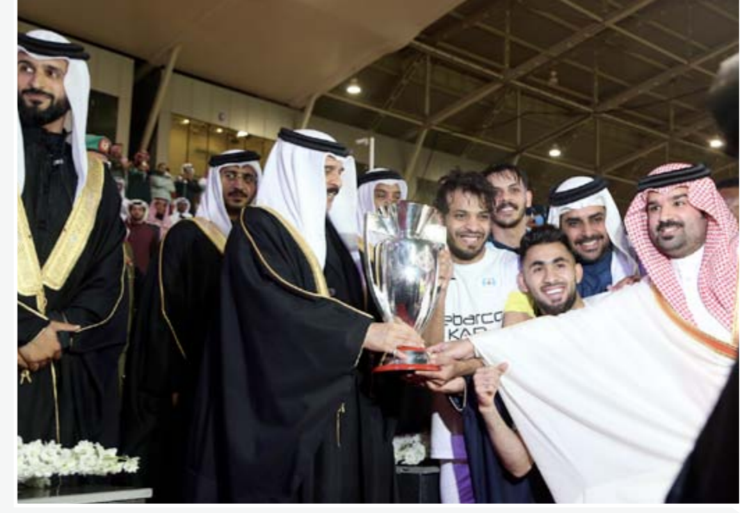
6 حدث الشهر العاهل يشرف نهائي «أعلى الكؤوس»