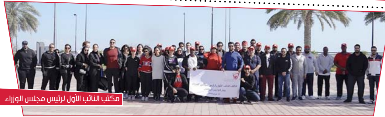
مكتب النائب الأول لرئيس مجلس الوزراء