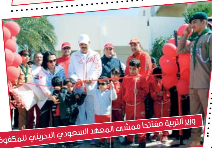
وزير التربية مفتتحا ممشى المعهد السعودي البحريني للمكفوفين