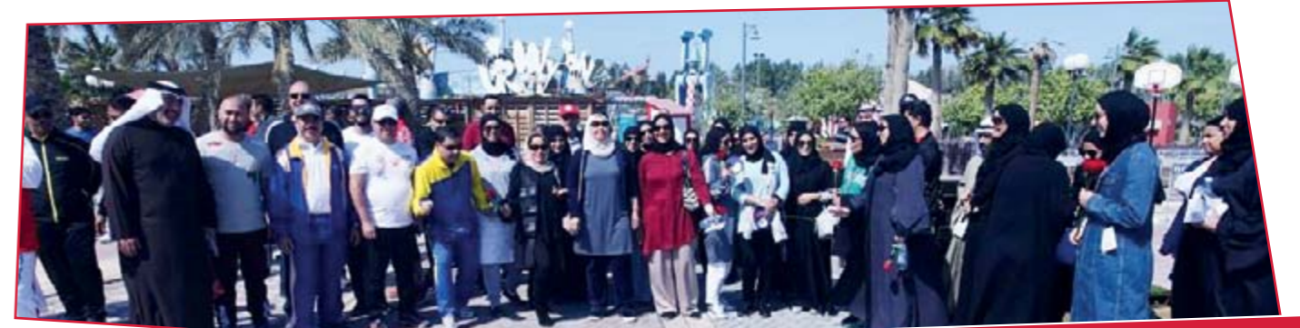
أمانة العاصمة تشارك في اليوم الرياضي بمتنزه عذاري