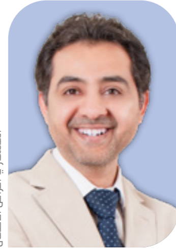
د. إسحاق المبارك

في حين ان مخزون الحديد لدى الطفل في أشهره الأولى يكفي حاجة الطفل حتى حلول فترة الفطام، إلا أن بعض المدارس تميل لإعطاء المواليد الجدد الذين يعتمدون على الرضاعة الطبيعية بشكل كامل جرعة صغيرة من الحديد بشكل يومي، وإعطاء الأطفال جرعة يومية من فيتامين (دال) تقدر بـ 400 وحدة يوميًا؛ وذلك لمنع مشاكل لين العظام، والمساعدة في امتصاص الكالسيوم بشكل كافٍ، ولدور فيتامين (دال) في المناعة خصوصًا مع عدم تعرض الأطفال حديثي