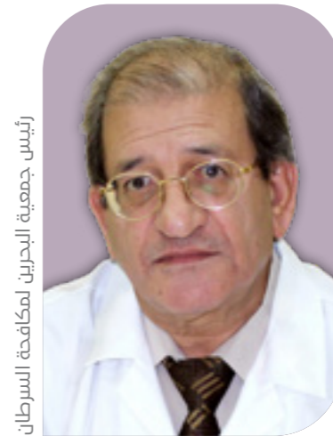
رئيس جمعية البحرين لمكافحة السرطان

ومن هنا يمكن القول إن هذه العوامل ممكن تجنبها لحياة أفضل