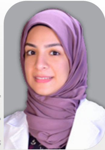
اختصاصية التغذية العلاجية

تعتبر متلازمة القولون العصبي من أكثر الاضطرابات شيوعًا وانتشارًا، والتي تصيب الجهاز الهضمي وتحديدًا الأمعاء الغليظة. وتتراوح أعراض المرض بين آلام البطن، الغازات، إسهال أو إمساك أو كليهما معًا، وتعتبر المتلازمة من الأمراض المزمنة والتي تحتاج لعلاج طويل المدى. وتعتبر الحمية الغذائية إضافة إلى الأدوية ونمط الحياة من أهم عوامل السيطرة على الأعراض الناتجة عن متلازمة القولون العصبي، والتي تمكن المريض من التعايش معه. إن العامل النفسي يحتل دورًا كبيرًا في التعايش مع المتلازمة، إذ إن معرفة كيفية السيطرة على عوامل التوتر والقلق تؤدي إلى السيطرة على أعراض متلازمة القولون العصبي والحد من أعراضه.