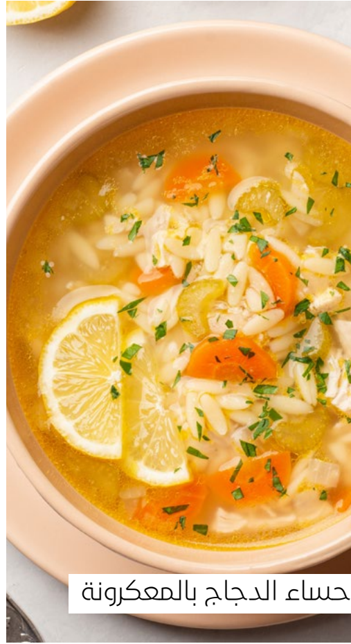
حساء الدجاج بالمعكرونة