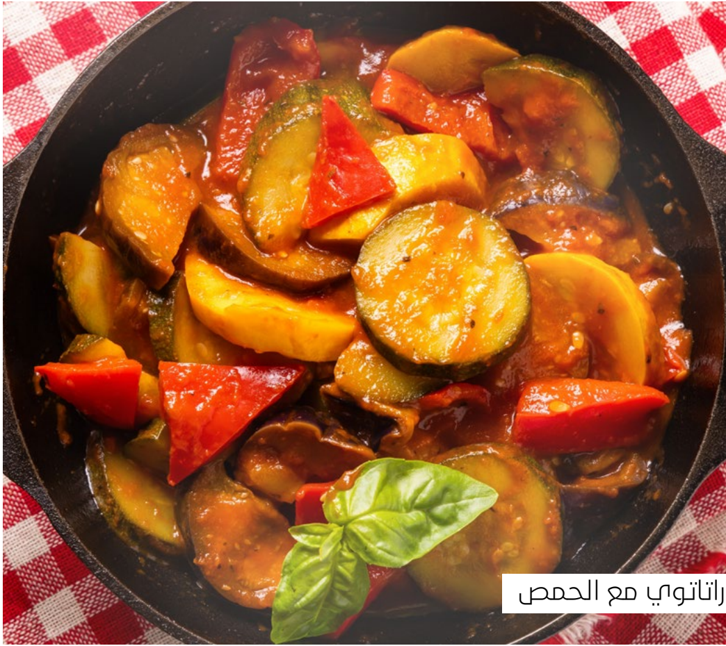
راتاتوي مع الحمص