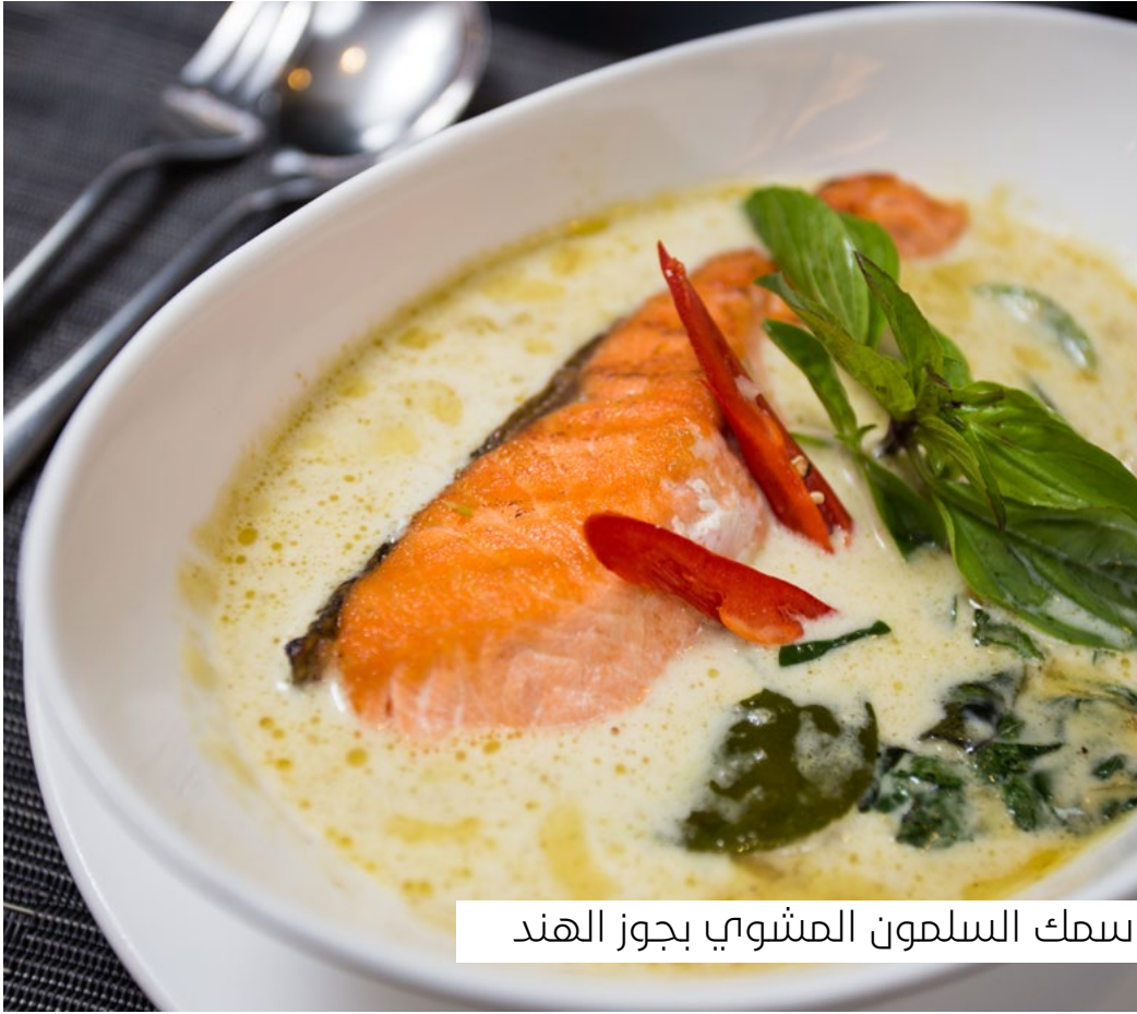
سمك السلمون المشوي بجوز الهند