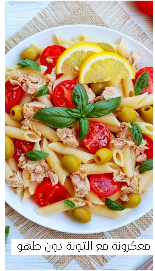
معكرونة مع التونة دون طهو