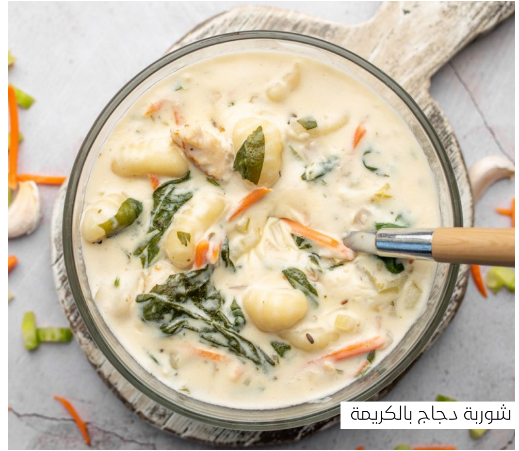
شوربة دجاج بالكريمة