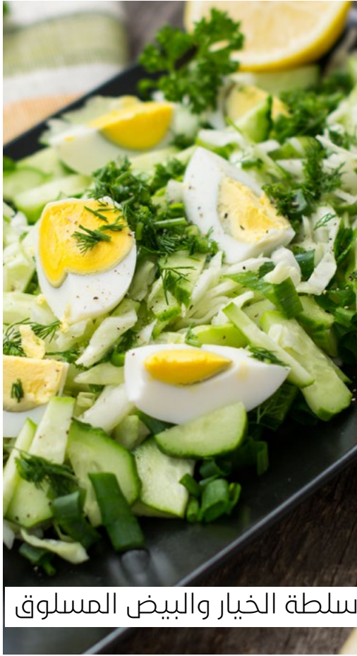
سلطة الخيار والبيض المسلوق