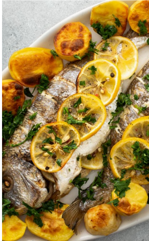
سمك شعري في الفرن