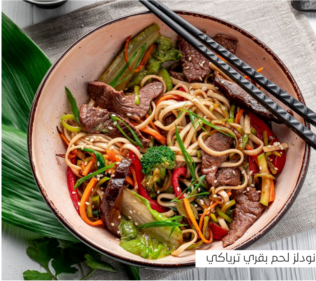
نودلز لحم بقري ترياكبي