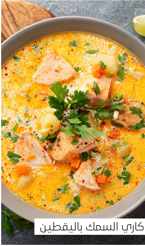
كارهي السمك باليقطين