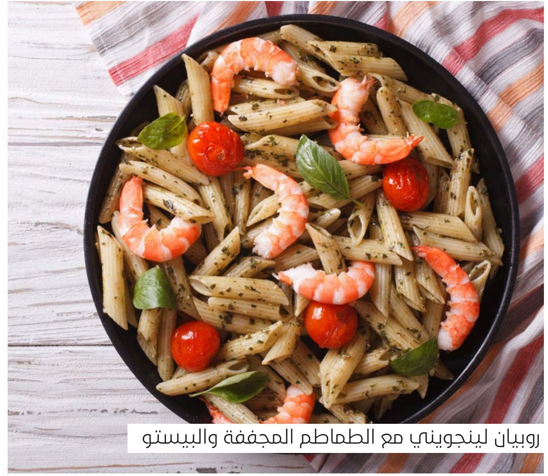
روبيان لينجويني مع الطماطم المجففة والبيستو