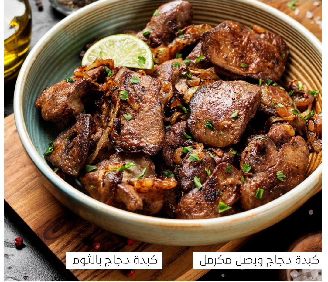
كبدة دجاج بالثوم