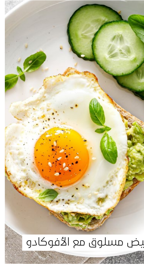
بيض مسلوق مع الأفوكادو