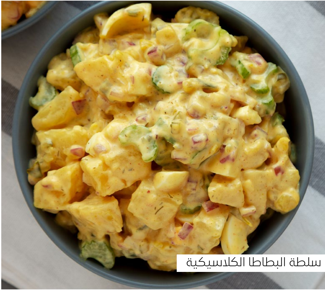
سلطة البطاطا الكلاسيكية