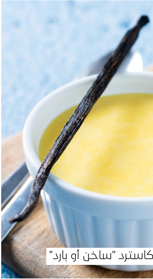
كاسترد "ساخن أو بارد"