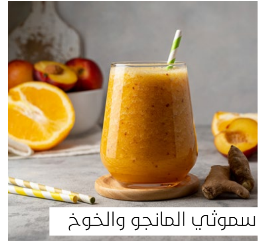
سموثي المانجو والخوخ