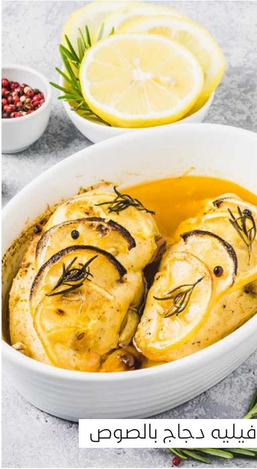
فيليه دجاج بالصوص