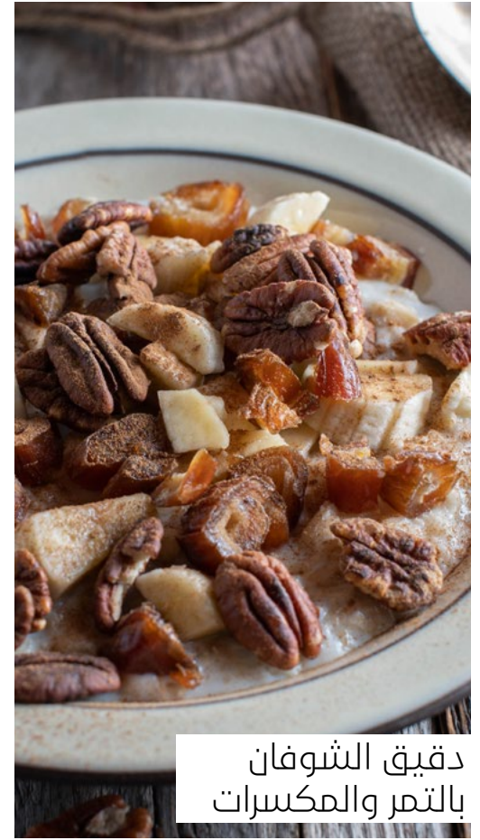
دقيق الشوفان بالتمر والمكسرات