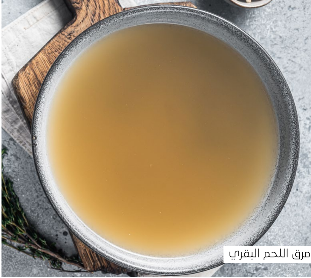
مرق اللحم البقري