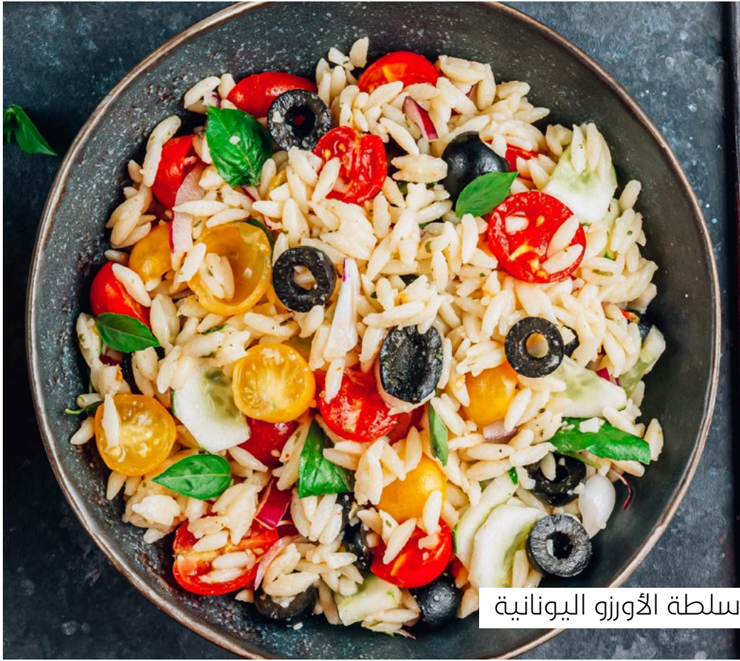
سلطة الأورزو اليونانية