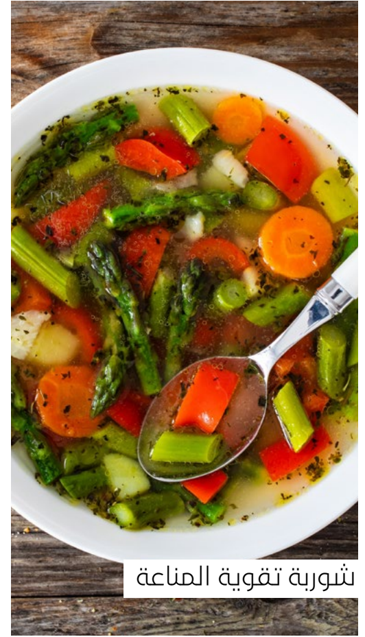
شوربة تقوية المناعة