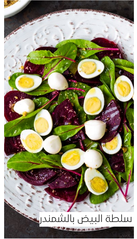
سلطة البيض بالشمندر