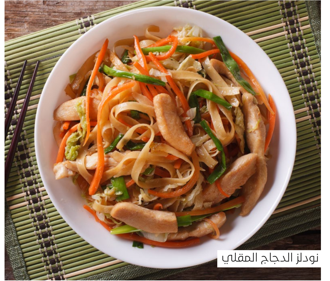
نودلز الدجاج المقلبي