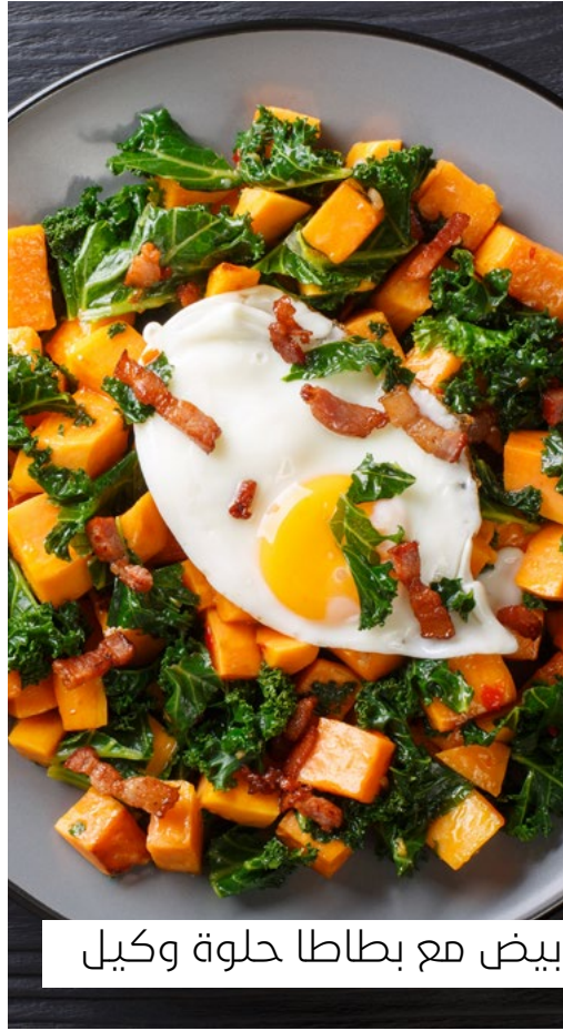
بيض مع بطاطا حلوة وكيل