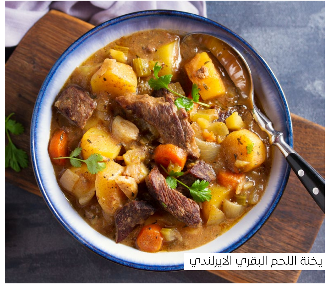
يخنة اللحم البقري الأيرلندي