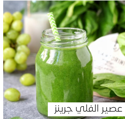
عصير الفلي جرينز