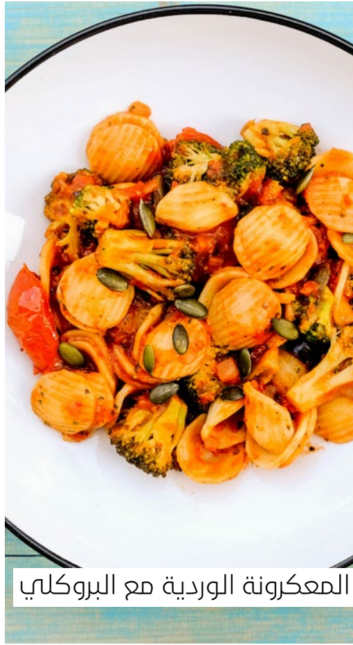
المعكرونة الوردية مع البروكلي