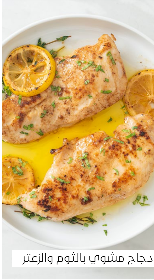
دجاج مشوي بالثوم والزعتر