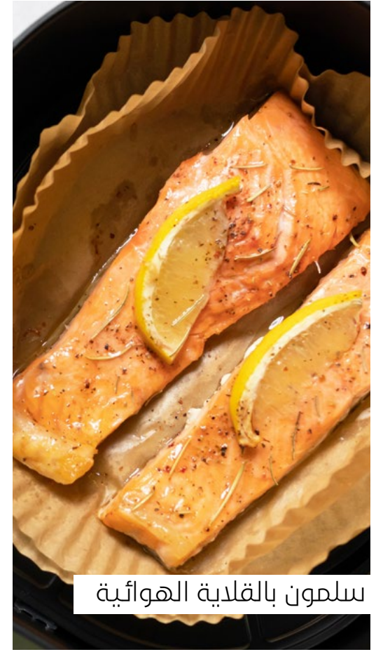
سلمون بالقللية الهوائية