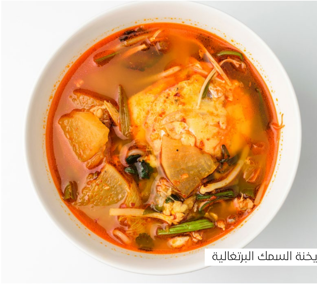
يخنة السمك البرتغالية