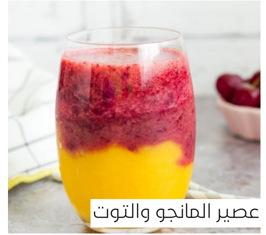
عصير المانجو والتوت