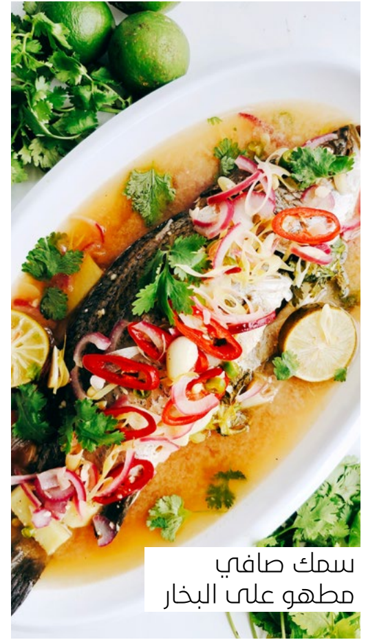
سمك صافي مطهو على البخار