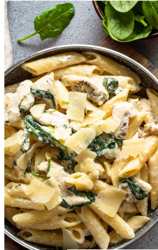
معكرونة بالدجاج والسبانخ بيستو