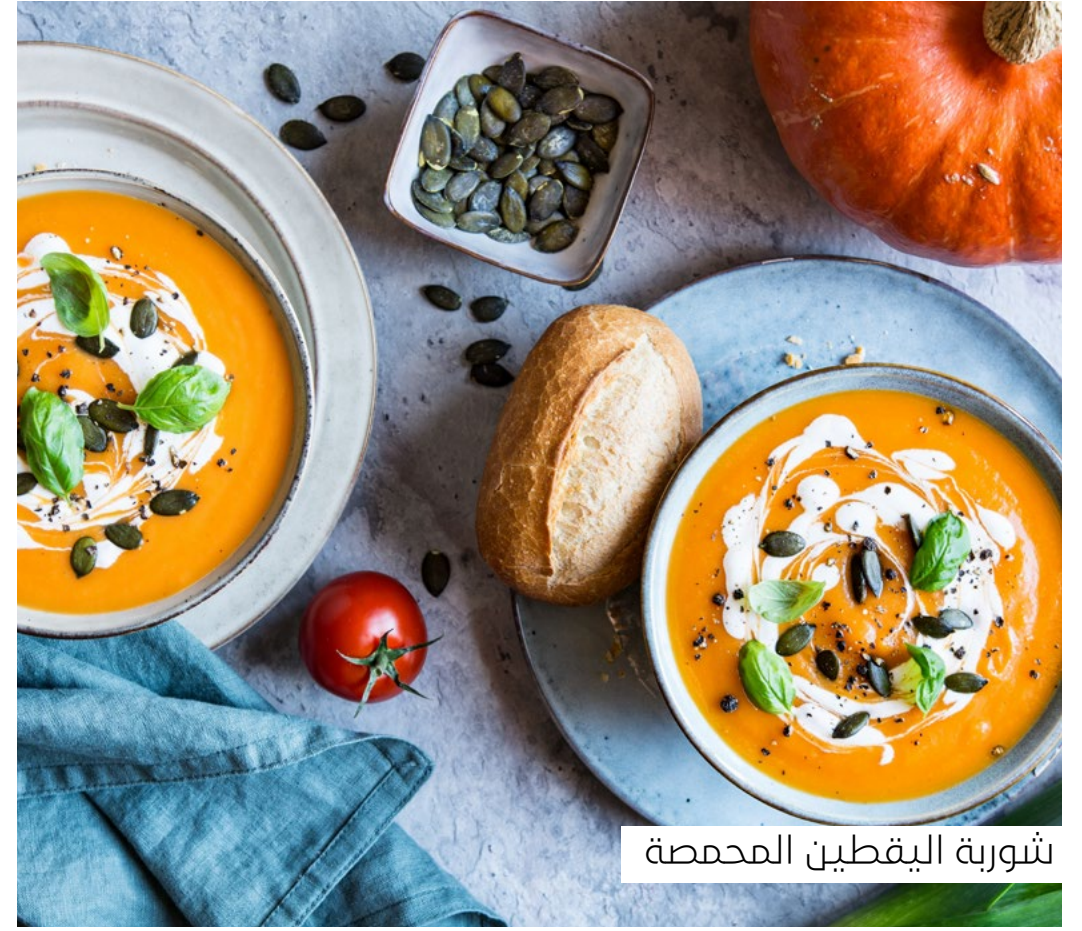
شوربة اليقطين المحمصة