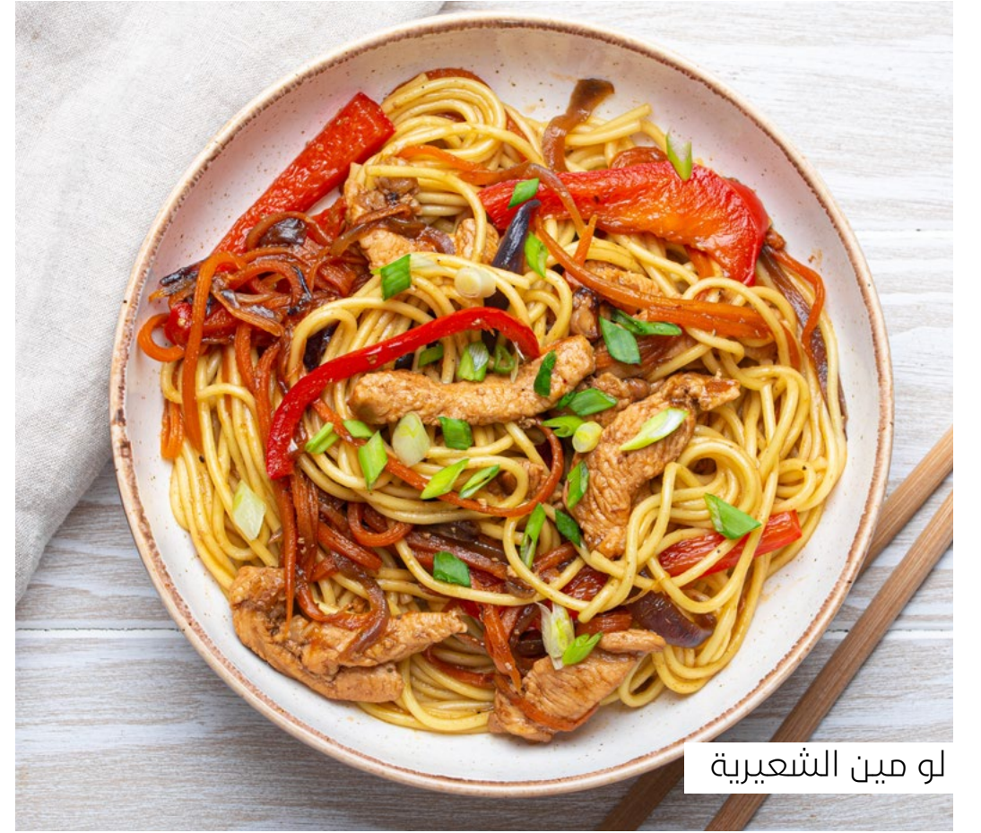
لو مين الشعيرية