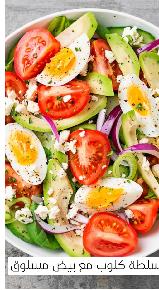
سلطة كلوب مع بيض مسلوقة