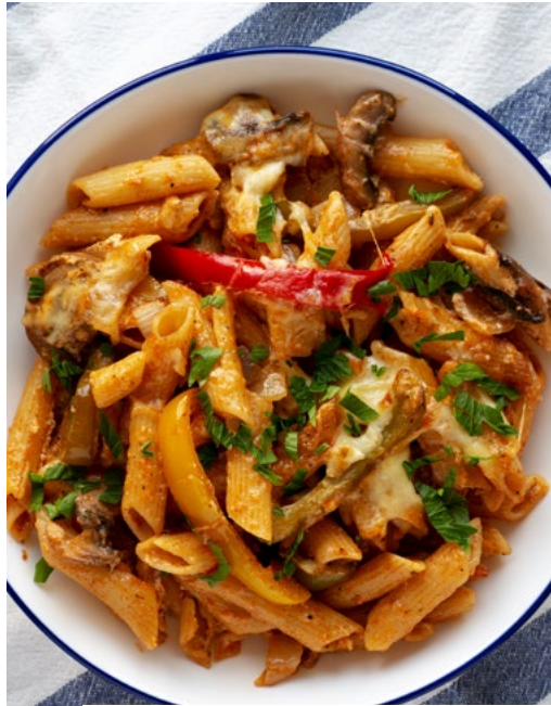
باستا نباتية فاهيتا سهلة