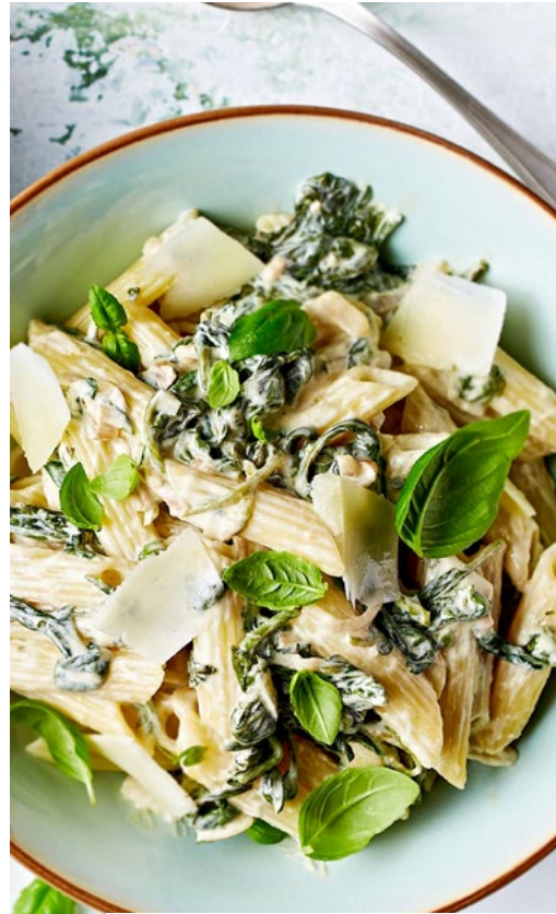
باستا السبانخ والبارميزان