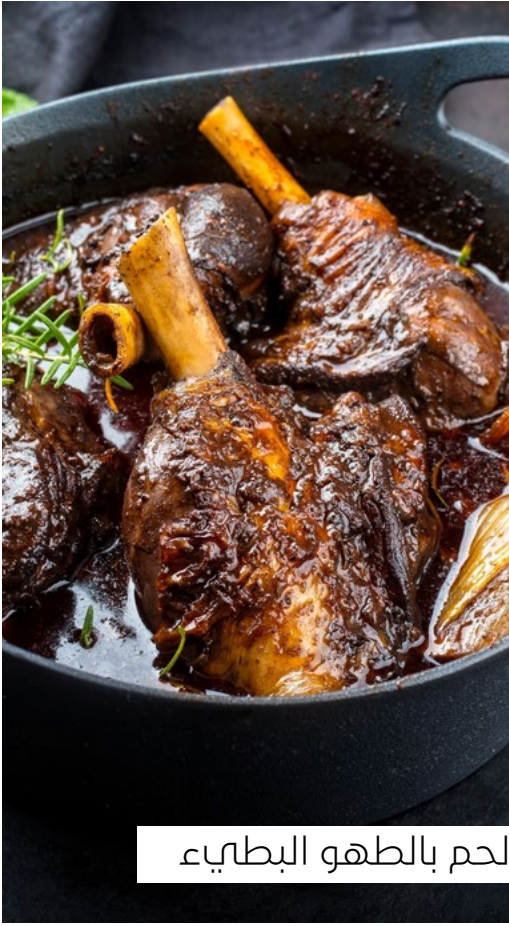
لحم بالطهو البطيء