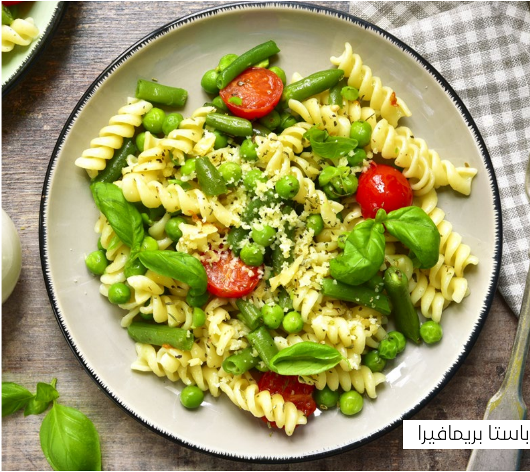
باستا بريما فيرا