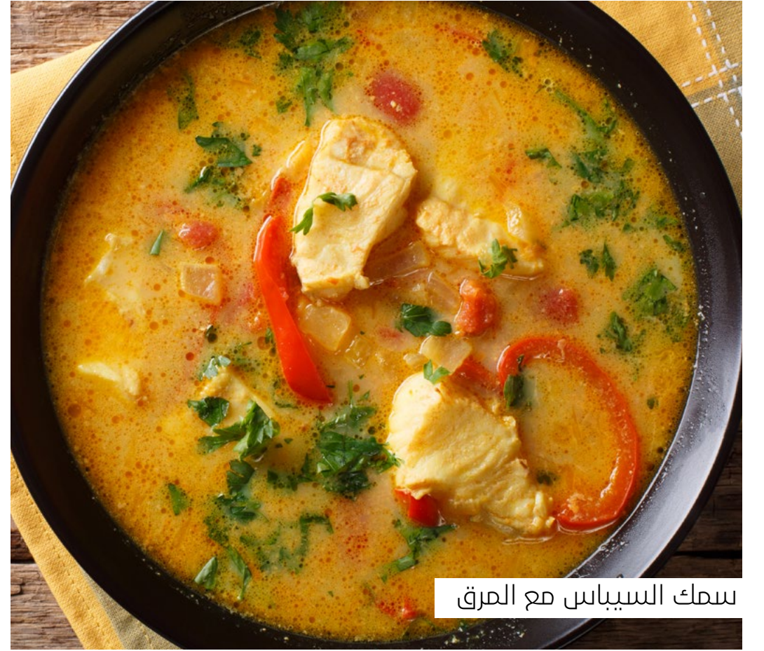
سمك السيباس مع العرق