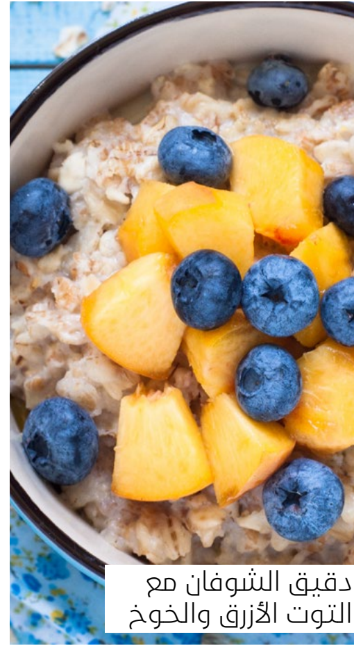
دقيق الشوفان مع التوت الأزرق والخوخ