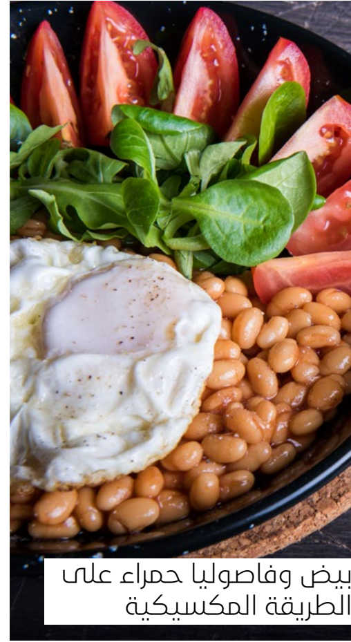
بيض وفاصوليا حمراء على الطريقة المكسيكية