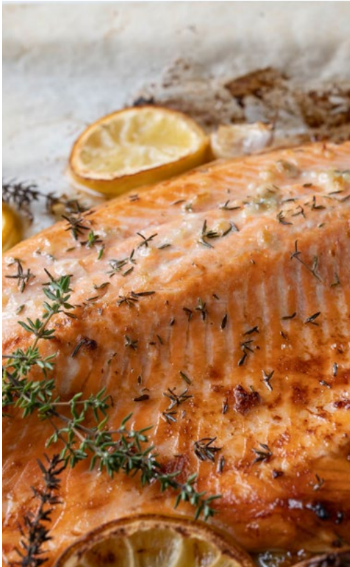
سمك السيباس المخبوز بالريحان