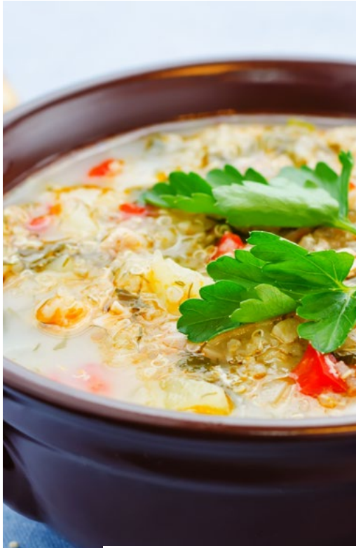
شوربة الكينوا بالخضار