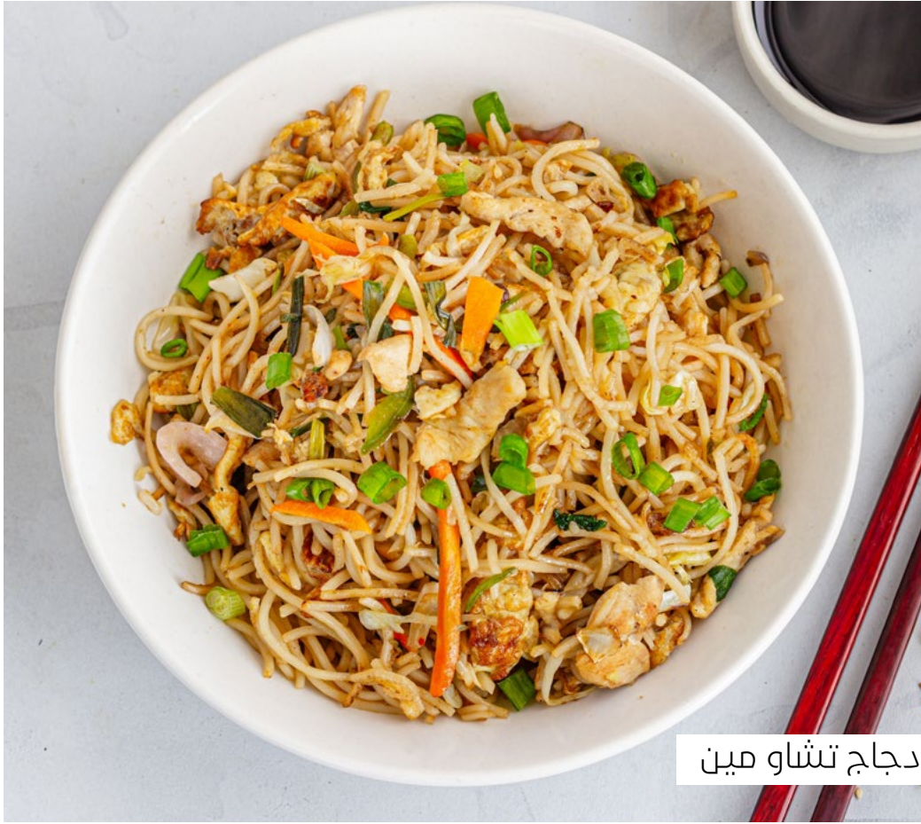
دجاج تشاو مين