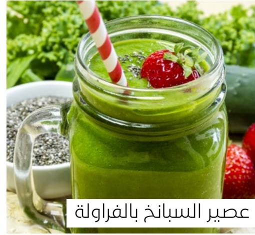
عصير السبانخ بالفراولة