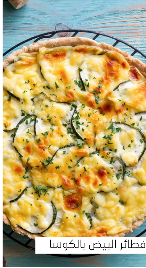
فطائر البيض بالكوسا