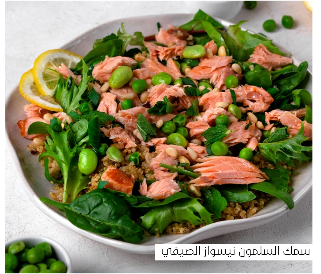
سمك السلمون نيسواز الصيفي