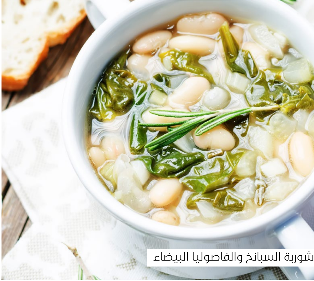
شوربة السبانخ والفاصوليا البيضاء