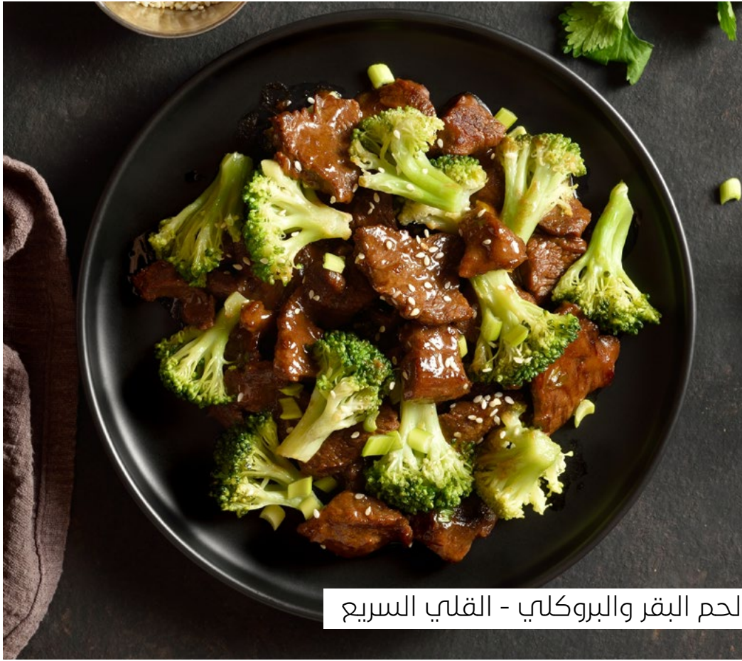
لحم البقر والبروكلي - القلي السريع