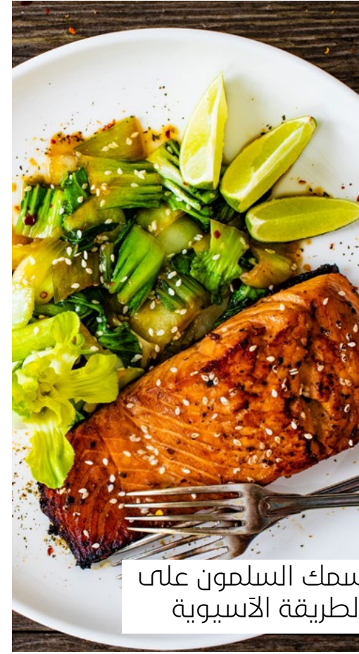
سمك السلمون على الطريقة الآسيوية