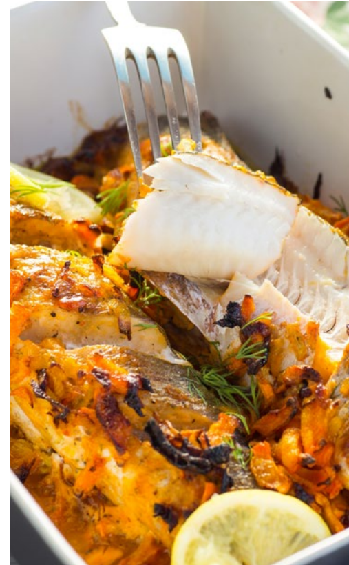
كنعد بحريني في الفرن