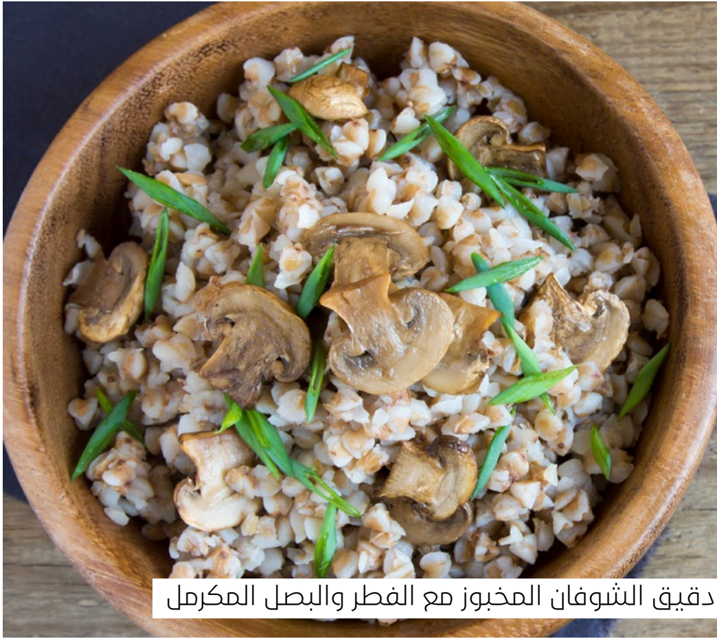
دقيق الشوفان المخبوز مع الفطر والبصل المكرمل