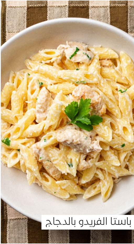
باستا الفريديو بالدجاج