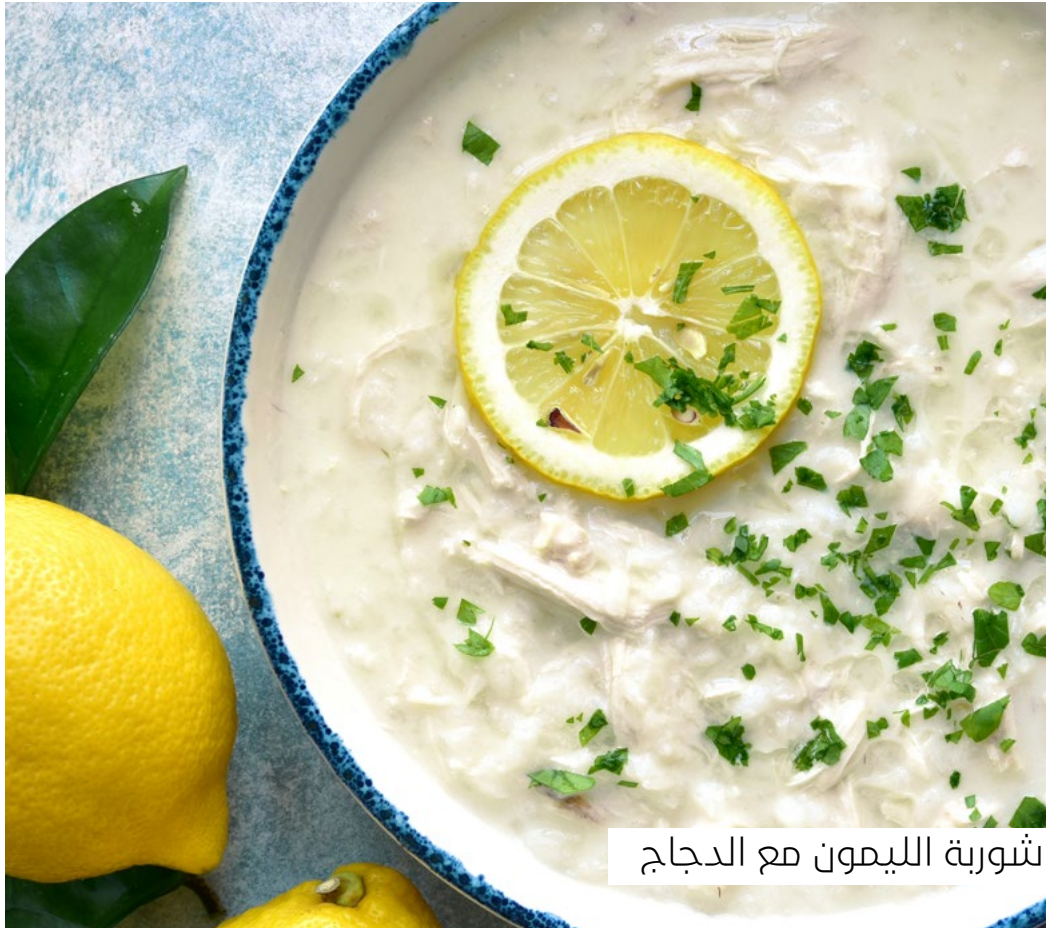
شوربة الليمون مع الدجاج