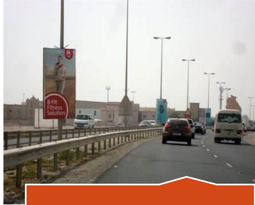
إعلانات أعمدة الإنارة