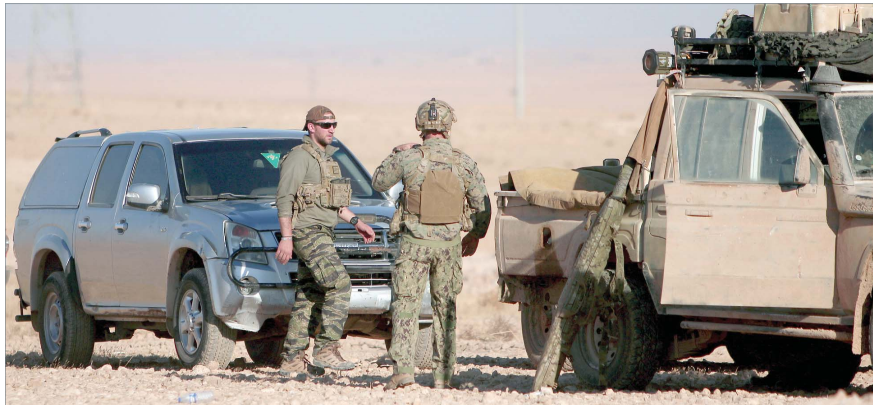
• جنود أميركيون في شمال مدينة الرقة