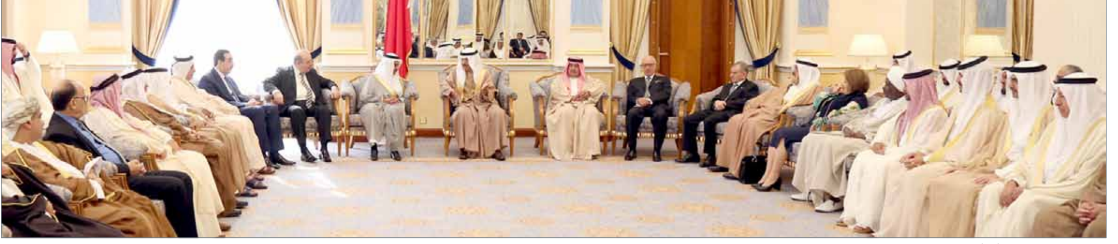
• سمو رئيس الوزراء مستقبلاً عدداً من السفراء والمواطنين

لدى استقبال سموه عدداً من سفراء الدول وجموع المواطنين ... رئيس الوزراء: