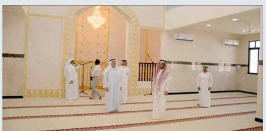
• جانب من الجولة التفقدية لعدد من مشاريع دور العبادة

واستطرد قائلاً: كما انتهت الوزارة أيضاً من بناء مسجد ذو النورين، وقد بلغت تكلفة بناؤه 249,000 دينار، فيما تبلغ مساحته الإجمالية 735 متراً مربعاً ويتسع لـ 485 مصلياً، ويتكون من دورين، حيث يشتمل الأرضي على قاعة صلاة وميضأة ودورات مياه للرجال ومدخل رئيسي ومدخل جانبي بالإضافة إلى قاعة صلاة وميضأة ودورات مياه ومدخل رئيسي للنساء، بمساحة إجمالية تبلغ 559 متراً مربعاً، فيما يشتمل الدور الأول على شقة للمؤذن تتكون من غرفة ودورة مياه ومطبخ، وشقة للإمام تتكون من غرفتين وصالة ودورتين مياه ومطبخ بمساحة إجمالية تبلغ 176 متراً مربعاً.