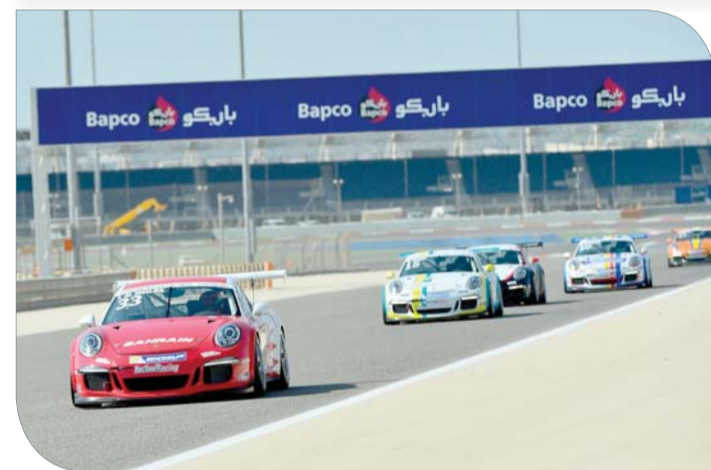
جانب من الفعاليات

وفي الوقت نفسه، فإن حلبة البحرين ستشهد منافسات بطولة MRF الآسيوية للعام الرابع على التوالي التي ستقام بجولتها الأولى على مضمار الصخير، حيث تعتبر هذه الفئة من فئة المقعد الواحد بسيارات أم آر أف F2000، وهذا العام ستطلق هذه البطولة بأربع جولات.