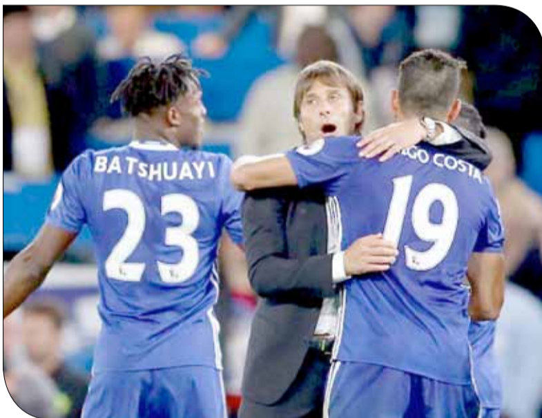
أنطونيو كونتية سعيد لفريقه

وكان رونالدو كومان مدرب إيفرتون - الذي لم يخسر فريقه هذا الموسم سوى بفارق هدف واحد قبل يوم السبت - آمينا في تقييم المباراة. وقال الهولندي "لا يهم ما هي الطريقة التي لعبنا بها. تشيلسي أظهر لنا كيفية الضغط واللعب. الفارق كان كبيرا للغاية بين تشيلسي وإيفرتون".