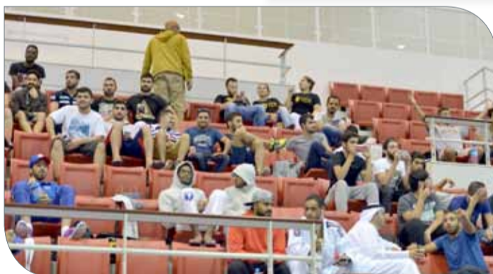
جانب من الحضور الجماهيري

السيدات على الأندية والمراكز البحرينية بل شملت العديد من الدول المشاركة.