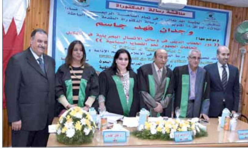
• خلال مناقشة رسالة الجامعة بالقاهرة

وقالت إن الرؤية التي يجب التركيز عليها في مضامين الخطاب الديني كما ينبغي أن تكون هي "النسبية" في القول والانتباه إلى أهمية عدم التعميم، بمعنى أن الفتوى هي ليست رأي الدين، إنما رأي في الدين، أي أنها خاضعة للزمان والمكان والظرف الموضوعي، فليسي لأحد الرأي النهائي والصحيح في أية مسألة لها علاقة بتفسير الدين. وبشأن مسألة تجديد الخطاب الديني في وسائل الاتصال فقد شددت الباحثة في أطروحتها على ضرورة الابتعاد به عن الطائفة والتحشيد من خلال البعد عن الغلو والتطرف وأساليب الوجبات الرقيقة في تلقي المعلومات وعلوم الدين. إذ ينتج الجمهور اليوم في جميع مشاهداتهم للعمل المتقن والمعلومة الصحيحة والفكر