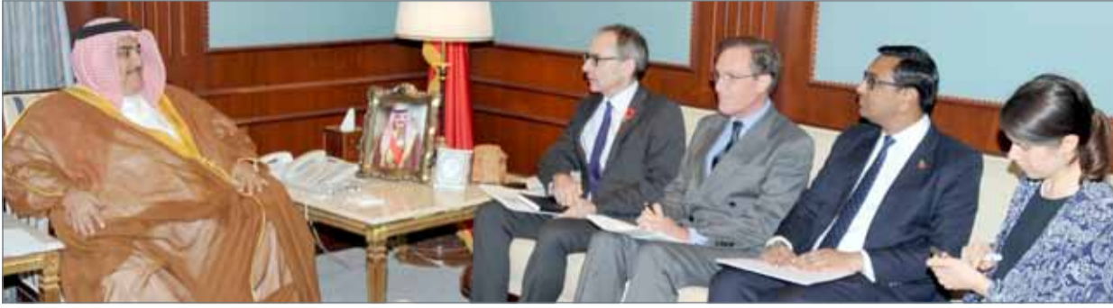
• وزير الخارجية مجتمعاً بالسفير البريطاني

مع مختلف دول العالم وفي مقدمتها المملكة المتحدة، بما يعود بالنفع على الجانبين وينعكس إيجاباً على أمن واستقرار المنطقة. ومن جهته، أعرب سفير المملكة المتحدة عن تقدير بلاده للعلاقات الوثيقة مع دول مجلس التعاون، منوهاً بما تقوم به دول المجلس من دور رئيسي في تثبيت الأمن وتعزيز الاستقرار بالمنطقة والعمل الحثيث على حل المشكلات التي تواجه دولها والسعي نحو تحقيق تطلعات شعوبها في التقدم والرخاء.