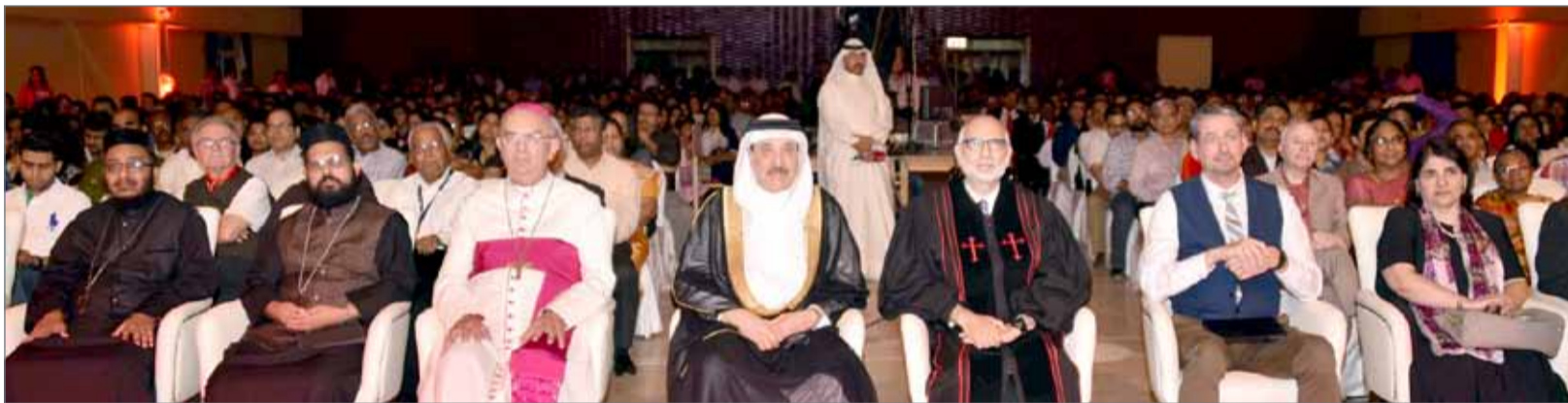
• جانب من احتفال ”رابطة الشباب المسيحيين“

الدينية في مملكة البحرين. وأشاد القس بجهود وزير العمل والتنمية الاجتماعية في تنفيذ سياسة جلالة الملك والقيادة في دعم الكنائس وضمان ممارستها لطقوسها وعباداتها بكل حرية وسلام. يشار إلى أن كنيسة جورني الأميركية تعتبر من أكبر الكنائس في الولايات المتحدة، وتأسست في العام 1930، ويقوم فريق من الكنيسة مكوناً من 20 شخصاً بزيارة لمملكة البحرين حالياً، وزيارة المعالم السياحية والكنائس المنتشرة في المملكة، وهي الزيارة الأولى لهم في منطقة الشرق الأوسط، حيث قدم الفريق عدداً من الاحتفالات في عدد من دول العالم.