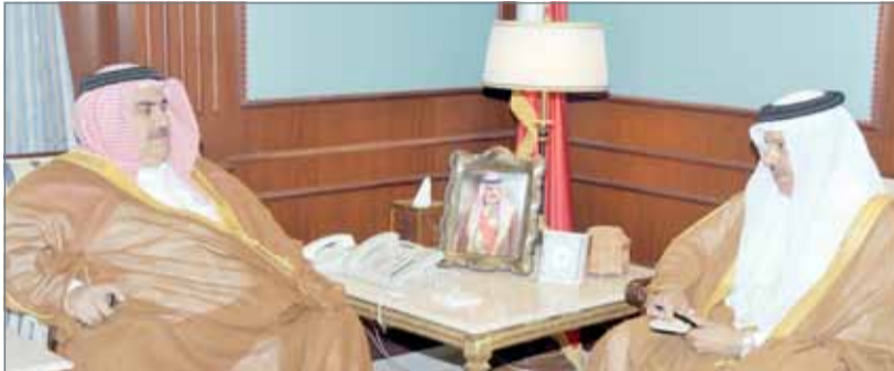
• ... ومجتمعاً مع الأمين العام لمجلس التعاون

مع مختلف دول العالم وفي مقدمتها المملكة المتحدة، بما يعود بالنفع على الجانبين وينعكس إيجاباً على أمن واستقرار المنطقة. ومن جهته، أعرب سفير المملكة المتحدة عن تقدير بلاده للعلاقات الوثيقة مع دول مجلس التعاون، منوهاً بما تقوم به دول المجلس من دور رئيسي في تثبيت الأمن وتعزيز الاستقرار بالمنطقة والعمل الحثيث على حل المشكلات التي تواجه دولها والسعي نحو تحقيق تطلعات شعوبها في التقدم والرخاء.