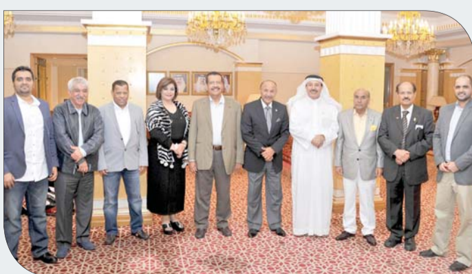
لقطة من المغادرة في المطار

مختلف المجالات وخاصة الجانب الشبابي والرياضي، بالإضافة إلى أن فريق التوأمة البحريني سيقوم بالعديد من الزيارات إلى الأندية المصرية ضمن الجدول المعد وسيطلع الفريق عدداً من المباريات مع الفرق المصرية. وستقام على هامش الزيارة برامج وزيارات ثقافية أخرى.