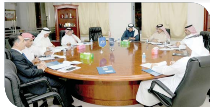
جانب من اجتماع سابق لمجلس إدارة اتحاد الكرة