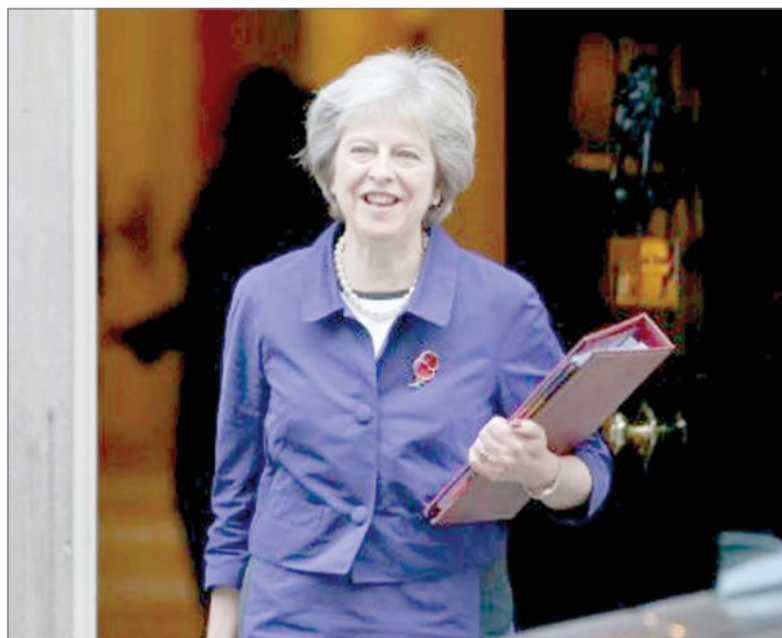
• رئيسة وزراء بريطانيا تيريزا ماي

وقد يؤدي قرار محكمة لندن العليا الى تأخير عملية خروج بريطانيا من الاتحاد، إذ ان النقاشات حول بريكت والاستراتيجية الواجب تبنيها خلال المفاوضات قد تستمر لفترة طويلة في البرلمان، خصوصا ان غالبية من النواب