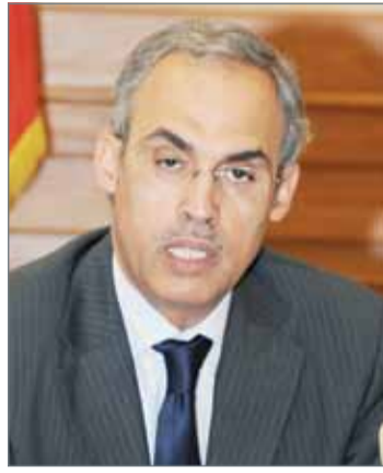
• رشيد المعراج

أكد محافظ مصرف البحرين المركزي رشيد المعراج، أنه تم إغلاق شركة التأمين الإيرانية بشكل نهائي، مبيّنًا أن إغلاق بنك المستقبل في طريق التصفية ولا بد أن يعبر الموضوع عبر القنوات القانونية، والمصفي القانوني يتولى تصفيته حسب القانون. وأضاف أنه بحكم التصفية ستوزع الأصول إلى أصحاب المطالبات فهي جزء من حقوقهم.