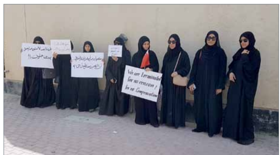
• جانب من الاعتصام

وبشار إلى أن عدد المتدربين المنضويات تحت ما يعرف بقائمة (1912) العالميين في مجال البلديات يبلغ 66 متدربة، حيث لم يصدر حتى الآن أي قرار بتجديد عقودهن التي جرى تجديدها لعدة مرات.