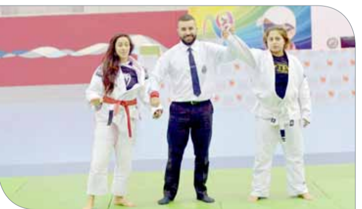
جانب من منافسات السيدات

البطولة، مؤكداً أن الرعاية التي يحظى بها الاتحاد من الشركة لكافة الأنشطة والفعاليات التي ينظمها تؤكد حرص الشركة على دعم الشباب والرياضة.