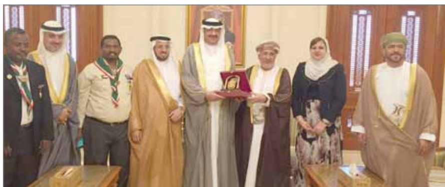
• الوفد ملتقياً رئيس مجلس الدولة العماني يحيى بن محفوظ المنذري

أكد رئيس وفد الشعبة البرلمانية المشارك في أعمال المؤتمر الكشفي العربي 28 المنعقد في سلطنة عمان فؤاد الحاجي عن اعترازه بما حققته مملكة البحرين من إنجازات على مستوى دعم الشباب والتي تعد محل تقدير وإشادة من الجميع، ومن بينها مجال العمل الكشفي الذي يمارسه أبناء البحرين منذ أكثر من نصف قرن. جاء ذلك، على هامش افتتاح أعمال المؤتمر العربي الكشفي التي بدأت في العاصمة العمانية مسقط اليوم الأحد، تحت شعار "الكشافة والارتقاء بالبيئة وصون الطبيعة"، والذي يستمر لغاية 10 نوفمبر الجاري.