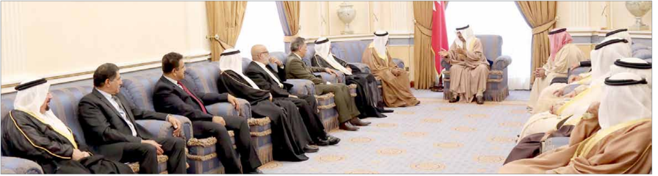
• سمو رئيس الوزراء مستقبلاً أعضاء الهيئة العامة للمواكب الحسينية

“المواكب الحسينية” تؤيد روح التسامح ونبذ الفرقة بين أبناء المجتمع... رئيس الوزراء: