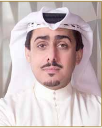
• علي أمر الله

وأهدافنا وراء جذب المزيد من السياح من خلال التعاون مع وكالات السفر والسياحة العالمية، إذ سنتواصل مع عدد من الشركاء التجاريين عبر قنوات وآليات اتصال متنوعة لتحقيق هدف محدد وهو إعلام السياح بوجود مملكة البحرين كوجهة سياحية بارزة.