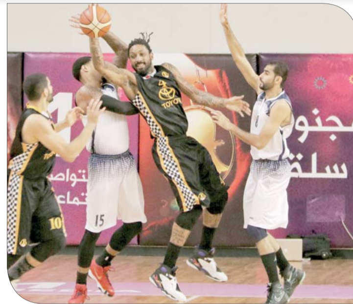
من لقاء الأهلي والنجمة

ورغم محاولات سماهيج في الربع الثاني في إبقاء القرب على فأرق النقاط مع منافسه، إلا أن سترة واصلت أفضليته وتمكن من إيصال الفارق إلى 12 نقطة مع منتصف الربع 22.34، وهو الفارق الذي أنهى به الشوط لصالحه 39.43. وواصل فريق سترة تفوقه في الربع الثالث والذي تقدم في نهايته بفارق 7 نقاط 21.60، قبل أن يتمكن من حسم المباراة بفارق 11 نقطة وبنتيجة 74.85.