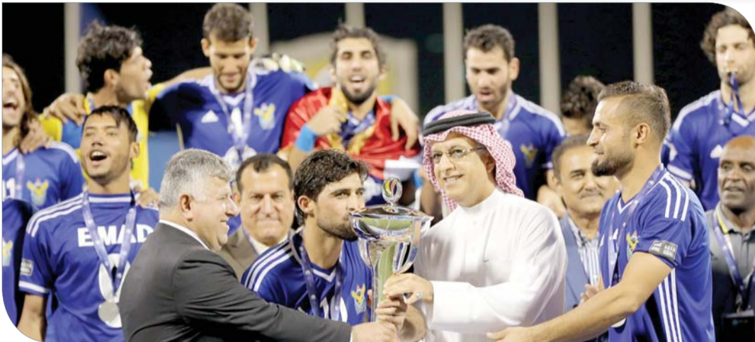
سلمان بن إبراهيم يتوج القوة الجوية بكأس الاتحاد الآسيوي

الدوحة | مكتب رئيس الاتحاد الآسيوي لكرة القدم