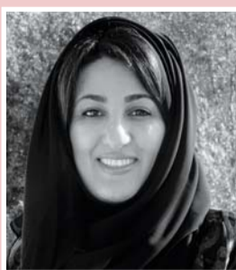
• نجوم الغانم

وأوضح المدير الفني لـ "مهرجان دبي السينمائي الدولي"، مسعود أمر الله آل علي، قائلاً: "جائزة آي دبليو سي هي فرصة ذهبية للمخرجين الخليجيين كي يحولوا قصصهم إلى أفلام مميزة، تعكس القيم التي يقوم عليها