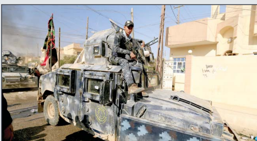
• قوات الأمن العراقية تتوغل في منطقة حمام العليل، جنوب الموصل

القوات بسيارات ملغومة وأحيانا يلوحون برأيات بيضاء وهم يفتربون. وقال اللواء الركن معن السعدي قائد قوات مكافحة الإرهاب للتلفزيون الحكومي إن مقاتلي داعش شنوا أكثر من مئة هجوم بسيارات ملغومة على القوات في الشرق وهي واحدة من عدة جهات في هجوم الموصل. ونشرت وكالة أعمق التابعة لداعش لقطات أمس الأحد لمركبات عسكرية استولى عليها التنظيم أو دمرها بما في ذلك حطام سيارة همفي محترقة قالت إنها أخذت في حي عدن في الشرق. وكان المقاتلون يكبرون وهم يفرغون ذخيرة ومعدات اتصالات.