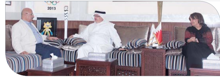
عسكر لدم استقباله الدولتي بحضور الشبيخة حياة بنت عبدالعزيز

على الدورة الفنية للكرة الطاولة التي تقام في إطار برنامج التضامن الأولمبي لتطوير البنية الرياضية الوطنية والتي استغرقت حوالي أربعة شهور. ورحب عسكر بالدولتي مشيداً بجهوده البارزة في الارتقاء بكرة