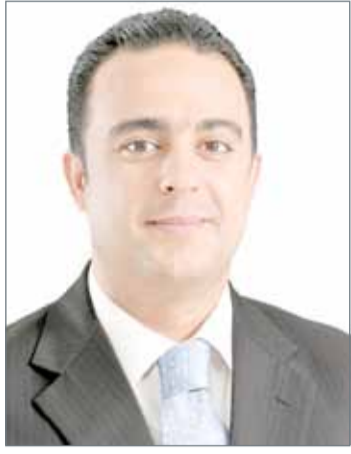
• علي العرادي

القضيبية - مجلس النواب: أشاد النائب الأول لرئيس مجلس النواب علي العرادي بالنتائج التي خلصت لها أعمال الدورة السابعة والثلاثين للمجلس الأعلى لمجلس التعاون، وما بلغه أصحاب الجلالة والسمو قادة دول الخليج العربي من قرارات تصب في مجال تطوير العمل الاقتصادي والأمني والدفاعي المشترك. وأكد أن ما بلغه قادة دول مجلس التعاون يلي احتياجات المرحلة، ويواكب الظروف التي تمر بها منطقة الخليج، لاسيما بشأن الموقف الحكيم من تربع السوق الخليجية المشتركة وصولاً للوحدة الاقتصادية، وهو قرار سوف يفتح آفاقاً أرحب أمام دول المجلس لتعزيز الاقتصاد وإيجاد مزيد من البدائل غير النفطية لرفد الموازنات الخليجية. وأثنى النائب العرادي بما تم التأكيد عليه خلال القمة من السعي للوصول إلى التكامل الخليجي في المجال الاقتصادي والتجاري والدفع باتجاه تطبيق المساواة التامة في المعاملة بين مواطني دول مجلس التعاون في مجال السوق الخليجية المشتركة، إضافة إلى تأسيس وبناء نظام ربط لأنظمة المدفوعات بدول المجلس من أجل تحقيق بيئة آمنة وسريعة للتحويلات المالية، فضلاً عن القرار المهم بضرورة التزام دول المجلس بتنفيذ مشروع سكة الحديد الخليجية، وهي كلها أمور ستصب في تعزيز المكانة الاقتصادية لدول