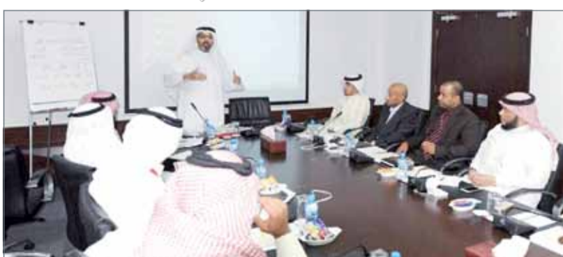
جانب من الدورة التدريبية بمجلس النواب