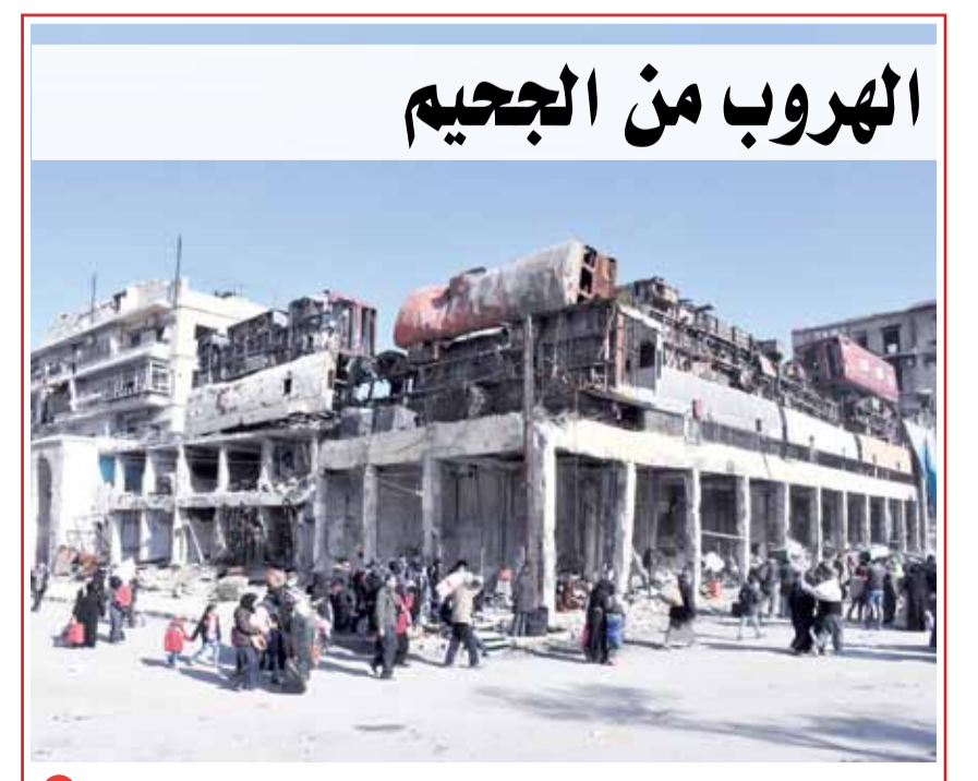
أهالي ينزحون هرباً من المعارك في مدينة حلب الشرقية

لندن - رويترز: حذر مدير الاستخبارات السرية البريطانية (أم أي 6)، أمس الخميس، من أن الأعمال الروسية في سوريا سيكون لها نتائج مأساوية، ويمكن أن تضع أمن بريطانيا في خطر. وجاءت تصريحات اليكس ينغر الذي تحدث للمرة الأولى للصحفيين خلال مؤتمر عقده في مقر الجهاز بالعاصمة البريطانية لندن. ووجه ينجر انتقادات إلى التدخل الروسي في سوريا، وقال إن موسكو تسعى لتحويل مدينة حلب لصحراء عبر قصفها، وبعد ذلك تتحدث جهودها في إحلال السلام، مؤكداً أن تدخل روسيا في سوريا لم يصلح الأوضاع بل زادها سوءاً. وأضاف "أعتقد أن ما تقوم به روسيا في سوريا، تضامناً مع نظام الأسد، يمثل نموذجاً مأساوياً لتبعات تزوير الشرعية. هذا إذا لم يغيروا من توجههم. فباعتبارهم أي شخص يعارض الحكومة الوحشية إرهابياً، فهم يقصون هؤلاء الذين يتعين الاستعانة بم لهزيمة الإرهابيين". وتابع: "يصعب علي التوقع بما ستجلبه السنة المقبلة، لكن ما أستطيع قوله بأننا لن نكون بمنأى عن التهديدات التي تنطلق من هناك لم يضع حد للحرب".