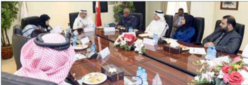
• محافظ الشمالية علي العصفور متركساً الاجتماع

ماجد سيف إلى أنه من بين 282 موقعاً لتجمعات الأمطار تم مباشرة 76 موقعاً، وهناك 30 موقعاً قيد التنفيذ. وبالنسبة لمشاريع هيئة الثقافة والآثار، استمع المجلس إلى شرح مفصل حول جهود تسجيل عدد من مواقع المحافظة التاريخية على قائمة التراث الإنساني، حيث شدد العصفور على ضرورة الاهتمام بالمواقع المختارة من ناحية النظافة واستكمال المرافق، والمبادرة لتبني برنامج تسويقي لتحويل المناطق الأثرية المهجورة إلى مناطق نشطة سياحياً، ومنها تلال الجنيبة ومدينة حمد، مستوطنات: سار، الدراز، باربار، وعين أم السجور، فيما تم اكتشاف مداخل لكهفين لموليين أميناً، أحدهم صدرت عليه عقوبة محط انظار منظمة ”اليونيسكو“، فاعمل جار لتسجيلها على قائمة التراث الإنساني.