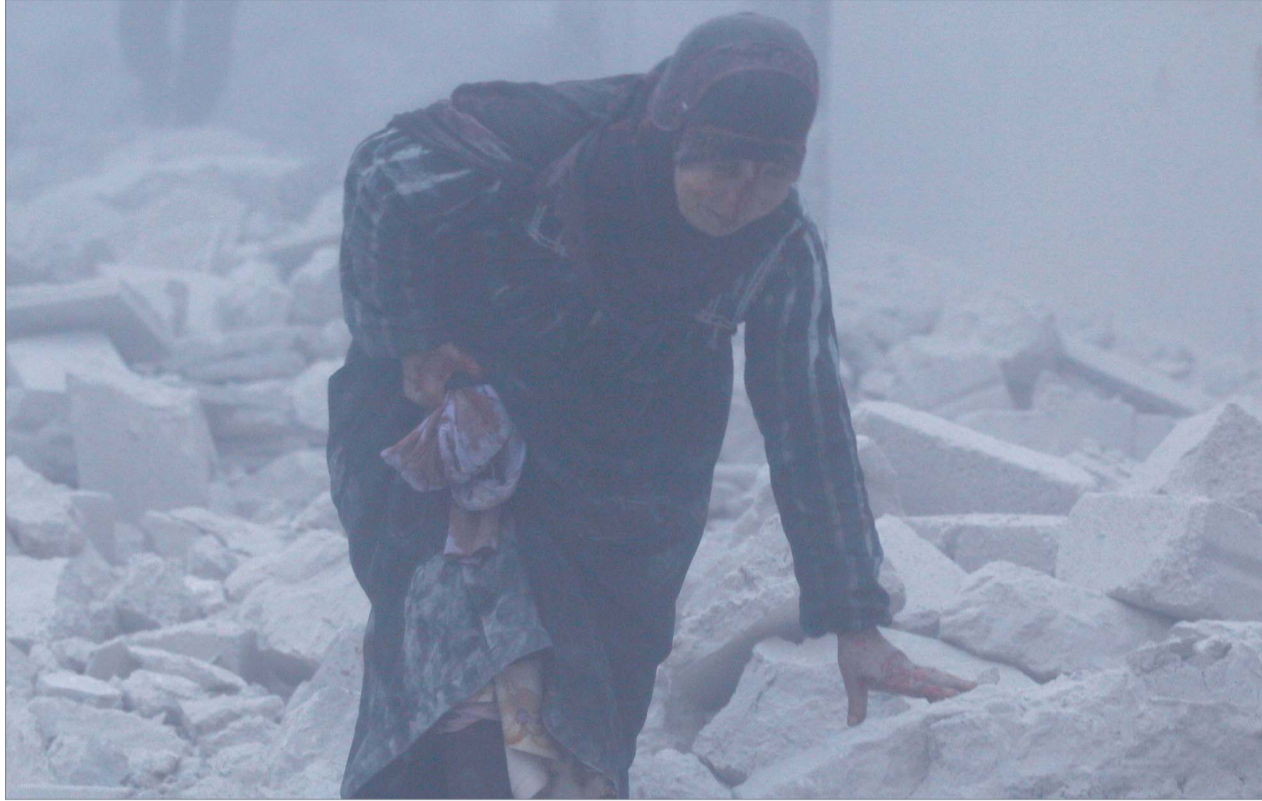
• امرأة جريشة تمشي في موقع تعرض لغارة جوية على حي الأنصاري في حلب

وكان الملك سلمان قد بدأ جولته الخليجية بزيارة الإمارات تلاها زيارة إلى قطر ثم البحرين ليختم جولته بالكويت. وتعد الجولة الخليجية للملك سلمان هي الأولى له منذ توليه الحكم في 23 يناير 2015، كما أنها تعد أول زيارة رسمية له للدول الخليجية الأربعة.