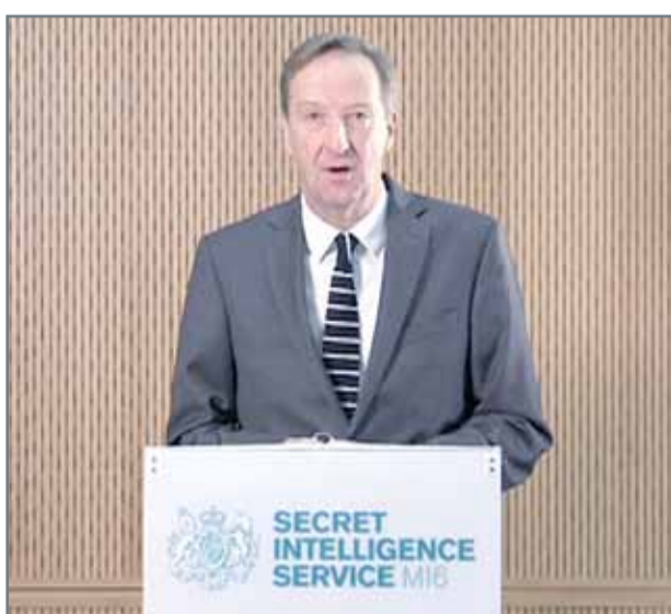
مدير الاستخبارات الخارجية البريطانية (رويترز)

لندن - رويترز: حذر مدير الاستخبارات السرية البريطانية (أم أي 6)، أمس الخميس، من أن الأعمال الروسية في سوريا سيكون لها نتائج مأساوية، ويمكن أن تضع أمن بريطانيا في خطر. وجاءت تصريحات اليكس ينغر الذي تحدث للمرة الأولى للصحفيين خلال مؤتمر عقده في مقر الجهاز بالعاصمة البريطانية لندن. ووجه ينجر انتقادات إلى التدخل الروسي في سوريا، وقال إن موسكو تسعى لتحويل مدينة حلب لصحراء عبر قصفها، وبعد ذلك تتحدث جهودها في إحلال السلام، مؤكداً أن تدخل روسيا في سوريا لم يصلح الأوضاع بل زادها سوءاً. وأضاف "أعتقد أن ما تقوم به روسيا في سوريا، تضامناً مع نظام الأسد، يمثل نموذجاً مأساوياً لتبعات تزوير الشرعية. هذا إذا لم يغيروا من توجههم. فباعتبارهم أي شخص يعارض الحكومة الوحشية إرهابياً، فهم يقصون هؤلاء الذين يتعين الاستعانة بم لهزيمة الإرهابيين". وتابع: "يصعب علي التوقع بما ستجلبه السنة المقبلة، لكن ما أستطيع قوله بأننا لن نكون بمنأى عن التهديدات التي تنطلق من هناك لم يضع حد للحرب".