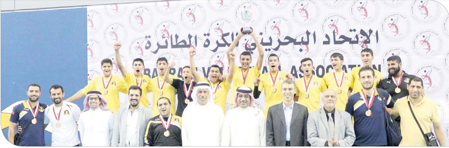
أشاهي متوجاً بكأس ناشئي الكرة الطائرة