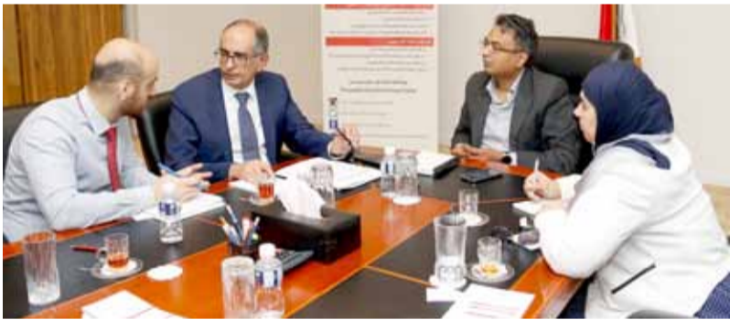
• المؤيد متحدثاً للصحافيين

حكم القانون، لافتاً إلى وجود قائمة سوداء مفعلة، وأن كل القوانين تؤهل الوزارة وتعطيها الحق لتحويل المؤجر الخارج عن القانون لإحالاته للنيابة العامة. وأوضح المؤيد أن المسألة هي ثقافة ووعي مجتمعي، إذ لا يمكن أن يشتري المستهلك من حساب إلكتروني غير مرخص وبعد وجود عطل في السلعة لا يستطيع أن يأخذ حقه عن طريق إدارة حماية المستهلك، لافتاً إلى أنه بحكم القانوني تستطيع الوزارة