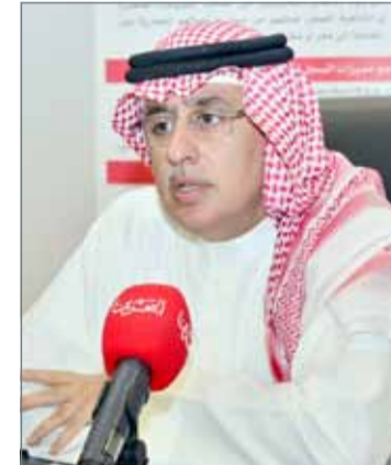
• وزير الصناعة والتجارة والسياحة