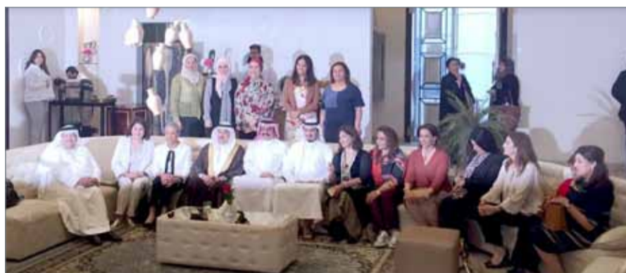
• جانب حضور الفعالية

الأعمال، متمنياً لجميع القائمين على النادي المزيد من التقدم والازدهار. وأردف بالقول: ”كما أن ما أريناه اليوم من خلال هذا المهرجان وورش العمل هو أمر يتلج صدورنا، كوننا نرى أيادي بحرينية شابة متمرسية في الإبداع والابتكار تسعى إلى بناء مستقبلها من خلال إعداد الذات والاعتماد على النفس دون أن تتركز إلى إضاعة الوقت وانتظار الوظيفة الثابتة، وهذا هو المفهوم الذي سعيانا إلى تعميمه وترسيخه في الأذهان عبر الدورات التدريبية والتثقيفية وورشات العمل الفاعلة والعلمية.“ تجدر الإشارة إلى أن مهرجان ”هوى الجسرة 2016“ هو تجربة محلية عقدت هذا العام في مملكة البحرين، ويتطلع لإقامتها خليجياً في العام 2017، ومن ثم عربياً في العام 2018، إلى أن تنتقل إلى ”متيراً“ عاصمة الريادة والإبداع في العام 2019.