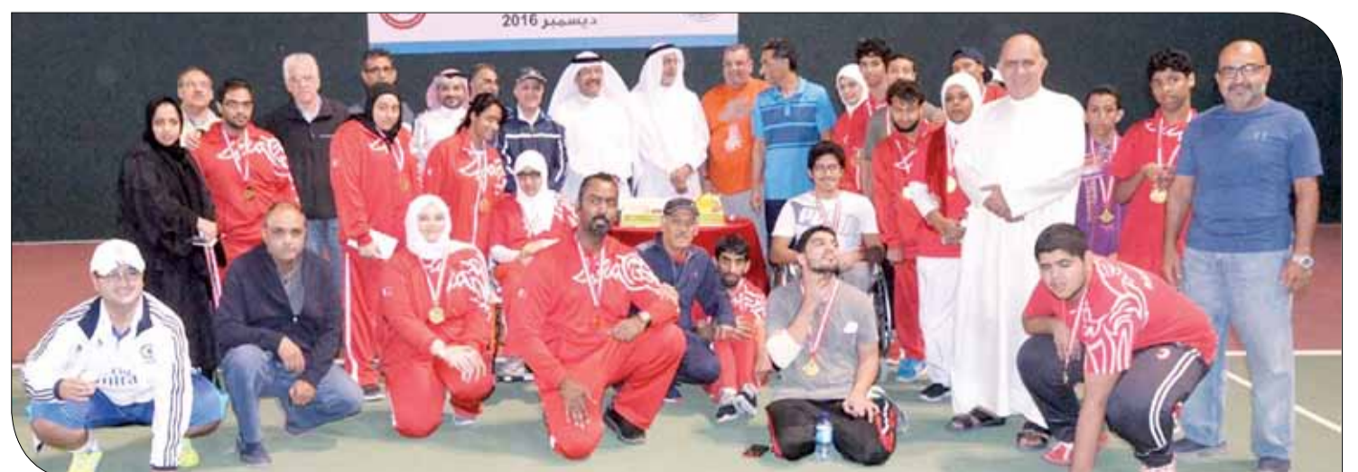
صورة جماعية للفائزين

بحضور رئيس مجلس أمناء المؤسسة الوطنية لخدمات المعوقين الشيخ دعيج بن خليفة آل خليفة ورئيس نادي البحرين للتنس خميس المقلّة، أقام النادي يوماً رياضياً بمناسبة اليوم العالمي لذوي الإعاقة، وذلك بالتعاون مع الاتحاد البحريني لرياضة ذوي الإعاقة.