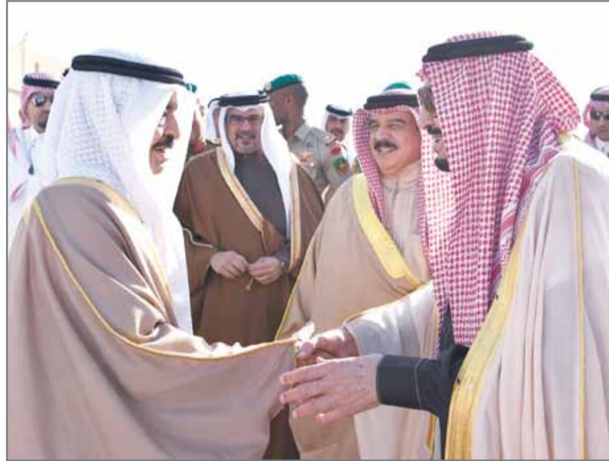
جلالة الملك وسمو رئيس الوزراء وسمو ولي العهد لدى توديعهم خادم الحرمين الشريفين

والفنون من الطبقة الأولى. وقال الوزير لوكالة أنباء الشرق الأوسط "هذا التكريم من شخص الرئيس عبدالفتاح السيسي رئيس مصر وسام على صدري أحتفي به دائماً واشكر عليه الرئيس السيسي، وأن هذا التكريم له أهمية خاصة لأنه من مصر بلد الإسلام والعروبة.