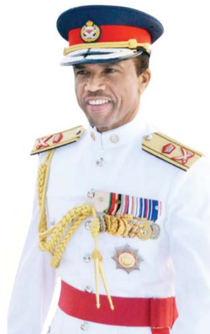
• مبارك نجم

ينظم مركز الجزيرة الثقافي وضمن مبادراته الوطنية احتفالية وطنية ثقافية كبيرة وذلك بتكريم رائدين من رواد الإبداع في الأغنية والموسيقى البحرينية وهما الشاعر المبدع علي الشقاوي بمناسبة عودته من رحلة العلاج بنجاح والمبايستر و اللواء مبارك نجم بمناسبة تكريمه من دار الأوبرا المصرية لإنجازاته الموسيقية في المحافل المحلية والدولية، ويدير هذه الأمسية راشد نجم بمشاركة نخبة من رفقاء الدرب من الشعراء والمطربين والإبداع