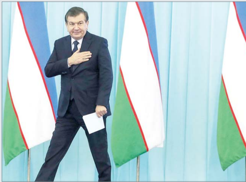
• رئيس أوزباكستان الجديد شوكت ميرزيايف

تناولت مجلة "ذي إيكونوميست" الانتخابات الأخيرة في جمهورية أوزباكستان، وما أفرزته من رئيس جديد "مستبد" بحسب وصفها، والذي اعتبرت أنه لا يختلف عن سابقه الذي حكم البلد حتى مماته، ولمدة 27 عاماً.