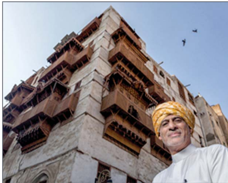
• من أعماله

ومنذ اليوم الأول للمهرجان سيستمتع زوار المهرجان بالحفلة الغنائية للفنان البحريني خالد فؤاد وذلك يوم الأربعاء الموافق 14 ديسمبر، الحفل الغنائي الثاني سيكون للفنائة داليا وذلك يوم الخميس الموافق 15 ديسمبر، كما سيتم الإعلان في الأيام القادمة عن المزيد من الحفلات الغنائية. ودعت طلبة البحرين البلدية والمقيمين وزائري مملكة البحرين مدعوين للاحتفال بالعيد الوطني المجيد وعيد جلوس صاحب الجلالة الملك حمد بن عيسى آل خليفة حفظه