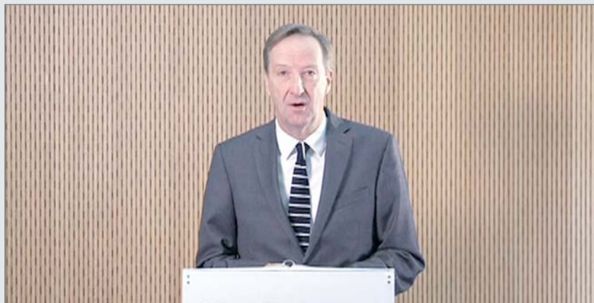
• مدير الاستخبارات الخارجية البريطانية

واعتبر ينجر تدخل الرئيس الروسي فلاديمير بوتين إلى جانب الأسد جيلة تكتيكية فجة تجعل روسيا تصطف مع الأقلية العلوية التي تنظر إليها الغالبية السنية بارتياب. وقال "بتعريفهم كل من يعارض حكومة وحشية على أنه إرهابي فإنهم يستعدون بالتحديد تلك الجماعة التي يجب أن تكون موجودة في جانبهم من أجل هزيمة المتشددين... روسيا والنظام السوري يسعيان إلى إيجاد