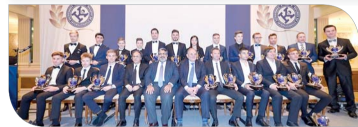
عبدالله بن عيسى متوسماً أبطال الموسم الماضي

أفضل صورة. وخلال الحفل السنوي لتوزيع جوائز لجنة الكارتنغ الدولية، أعرب الشيخ عبدالله بن عيسى آل خليفة عن سعاده لما شهده الموسم الماضي لبطولات الكارتنغ من نجاح كبير و متميز في رياضة الكارتنغ، حيث حرصت اللجنة الدولية سعيًا بخفيف الأعباء على المتسابقين والفرق من خلال تعديل بعض القوانين بما