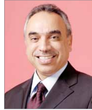
وزير الأشغال وشؤون البلديات

مجالات تنمية الموارد والتطوير الحضري والإدارة المتكاملة للمخلفات. وأضاف في السياق ذاته ”أن العمل البلدي مفهومه الشمولي الحديث يعتبر عنصراً أساسياً من عناصر التنمية المستدامة الشاملة، وقد حرصت الوزارات المعنية بالعمل البلدي بدول المجلس وبناء على الرؤية السامية من أصحاب الجلالة والسمو قادة دول مجلس التعاون على تعزيز وتطوير التكامل بين دول المجلس في مجال العمل البلدي استكمالاً لمنظومة التعاون بين الدول الشقيقة“. واختتم خلف تصريحه بشكره وتقديره للجهود الحثيثة التي تبذلها الأمانة العامة لدول مجلس التعاون لدول الخليج العربي في مجال تعزيز مسيرة التعاون بصورة عامة وفي مجال التنمية البلدية بصورة خاصة.