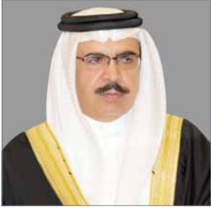
• الشيخ راشد بن عبدالله

ونسأل الله تعالى أن يحفظ مملكة البحرين وأن يديم عليها نعمة الأمن والأمان في ظل قيادة سيدي حضرة صاحب الجلالة الملك المفدى، حفظه الله ورعاه، وما تبذله الحكومة الرشيدة في سبيل تحقيق التنمية وحفظ المال العام.