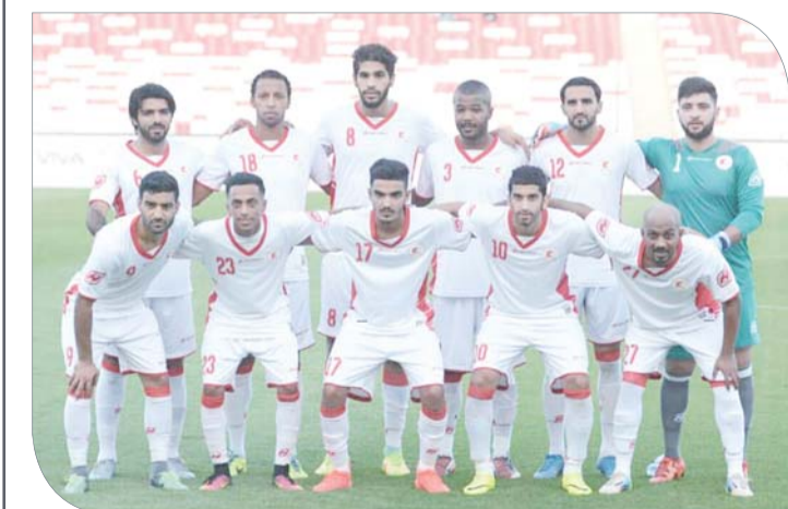
فريق الرفاع الشرقي

أو العودة إليها بالنسبة للرفاع الشرقي الذي لم يتذوق طعم الفوز في الجولتين الماضيتين.