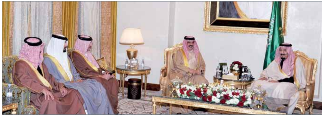
• جلالة الملك يزور خادم الحرمين الشريفين في قصر الصخير

وتعزيز المسيرة المباركة لدول مجلس التعاون لدول الخليج العربية، ونصرة القضايا العربية والإسلامية. كما تم خلال اللقاء استعراض مجمل الأوضاع والتطورات السياسية على الساحتين الإقليمية والعربية.