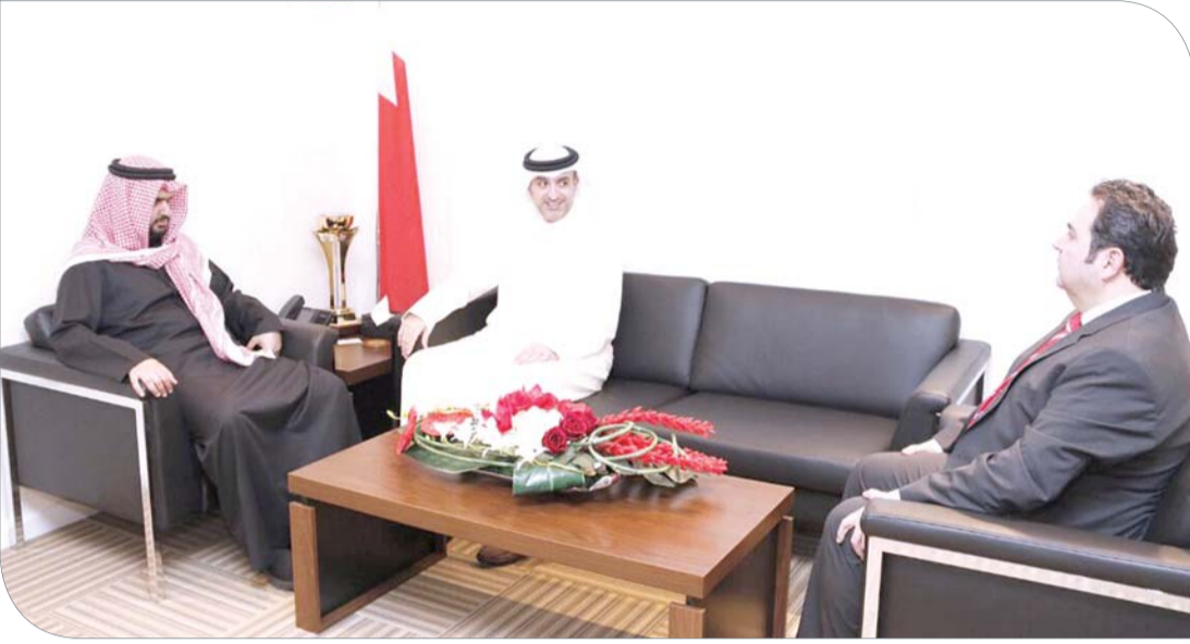
سمو الشيخ عيسى بن علي خلال استقباله الجودر