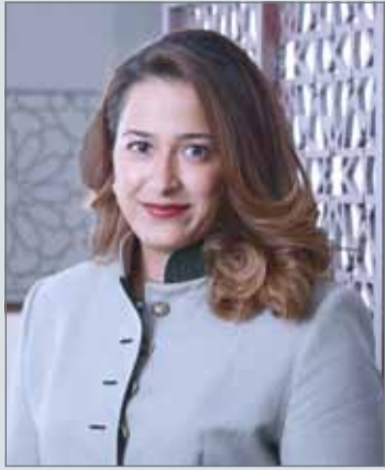
• الشيخة حصة بنت خليفة

النامية-وزارة الإسكان: نظمت وزارة الإسكان دورة تدريبية بالتعاون مع شركة ”كي بي إم جي فخر،KPMG“، وذلك للموظفين المعنيين بالتعامل مع الوثائق والمراسلات، تحت عنوان ”نظام إدارة الوثائق والمراسلات بوزارة الإسكان“، تمهيدا لتطبيق السياسة الخاصة بإدارة وتنظيم المستندات في الوزارة، وتنفيذا لتوجهات الحكومة في الارتقاء بالخدمات الحكومية وتفعيل دور متابعة الأداء الحكومي، وتحسين الخدمة المقدمة.