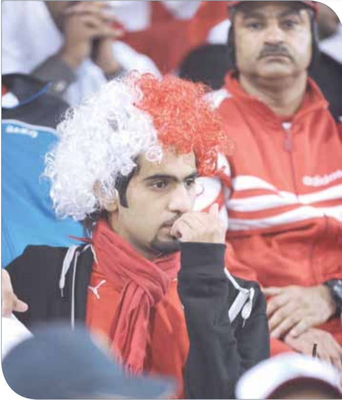
فرصة حقيقية أمام منتخب الشباب لتعويض ضياع حلم التأهل للمونديال

مقعد. ووفقاً للشكل المتداول لتوزيع مقاعد القارات بعد احتساب الزيادة الجديدة في عدد المنتخبات المشاركة في كأس العالم عام 2026 من 32 إلى 48 منتخباً، فإن قارة آسيا يتوقع أن تحصل على 8 مقاعد ونصف، وهذا يعني زيادة حظوظ منتخباتها التي فشلت في اجتياز التصفيات بنظامها الحالي الذي يؤهل الأربعة الأوائل فقط، ويعطي نصف مقعد لصاحب المركز الخامس.