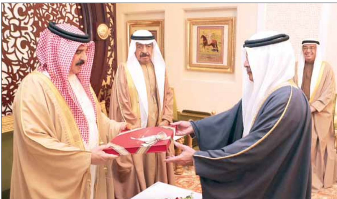
● جلالة الملك مستقبلاً سمو رئيس الوزراء ويتسلم دعوة من سمو الشيخ علي بن خليفة لتتريف حفل زواج نجله

● الملك يتسلم دعوة لتتريف زواج سمو الشيخ خليفة بن علي بن خليفة