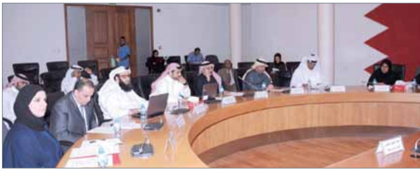
● اجتماع مجلس بلدي المحرق

المرباطي قائلاً "إن هيئة الكهرباء قامت برفع مبلغ مالي مسجل تحت بند (أجرة ثابتة) من 400 فلس إلى دينار واحد، وتم استحداث مبلغ آخر تحت نفس البند وقدره دينار أي بمعنى