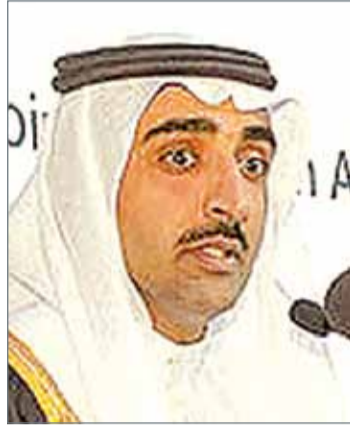
• وزير النفط

وسيمتلك ويدير المشروع شركة البحرين للغاز المسال بموجب اتفاقية مدتها 20 عامًا، وستتولى شركة "جي إس" الكورية للهندسة والإنشاءات أعمال الخدمات الهندسية والشراء والتشييد الخاصة بالمشروع، ومن جهتها ستقوم شركة "تيكاى إل إن جي" بتوريد سفينة وحدة التخزين العائمة للمشروع المشترك وفق اتفاقية تأجير لمدة محددة تبلغ 20 عامًا.