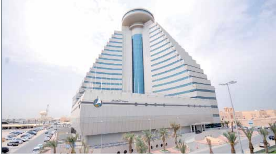
• يضع العديد من التاجر المتعثرين خيار الدعم المادي كأولوية لحل المشاكل المالية التي يعانون منها

مخاطبة النيابة العامة بضرورة النظر في مسائل الشيكات المصرفية، ومحاولة إيجاد سبل أكثر مرونة للتعامل مع الشيكات دون رصيد بدلا من المعامل به حاليا.