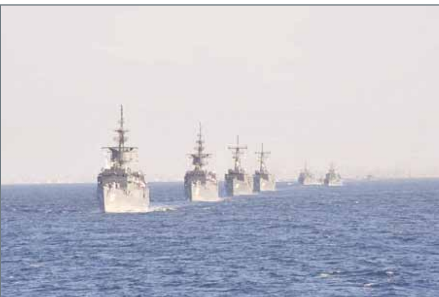
● قطع حربية تابعة للبحرية المصرية

القاهرة. رويترز: قال بيان رئاسي مصري إن مجلس الدفاع الوطني وافق في اجتماع عقده أمس الأحد برئاسة الرئيس عبد الفتاح السيسي على تمديد مشاركة قوات مصرية في العمليات العسكرية باليمن، وجاء في البيان أن المجلس وافق على "تمديد مشاركة العناصر اللازمة من القوات المسلحة المصرية في مهمة قتالية خارج الحدود للدفاع عن الأمن القومي المصري والعربي في منطقة الخليج العربي والبحر الأحمر وباب المندب". ولم يحدد البيان فترة العمل الجديدة للقوات المصرية في منطقة مضيق باب المندب التي يعد الأمن فيها حيوية للملاحة الدولية في قناة السويس. وبدأت سفن وطائرات حربية مصرية العمل في باب المندب بعد بدء عملية عاصفة الحزم التي يشنها تحالف تقوده السعودية منذ مارس 2015.