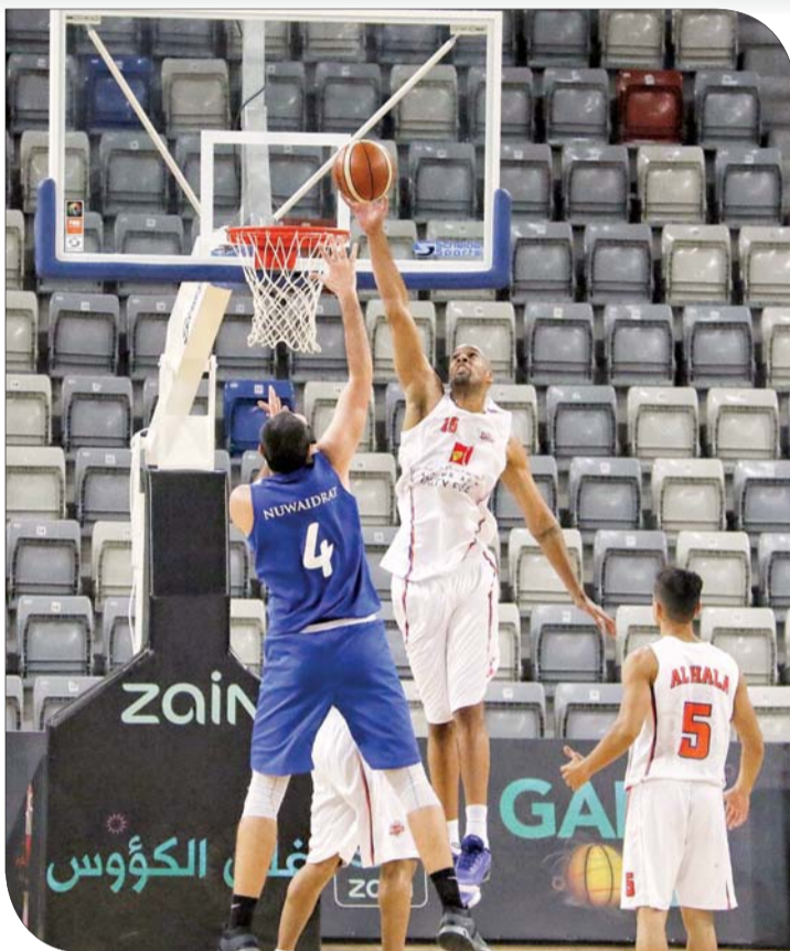
من منافسات الدور نصف النهائي

لبطولة كأس خليفة بن سلمان، وذلك بعد أن تزينت بصورة رئيس الوزراء صاحب السمو الملكي الأمير خليفة بن سلمان آل خليفة، والذي تشرفت وسعدت فيه الرياضة البحرينية بعد أن حملت بطولة كأس اسمه الغالي، ليأتي ذلك ترجمة لرؤية سموه في تحفيز وتكريم المبدعين في جميع المجالات، ومن بينها المجال الرياضي، إضافة إلى مكارمه الجزيلة التي غمرت الجميع وفي مقدمتها القطاع الرياضي. كما ووضعت على أرضية الصالة الرياضية إضافة إلى جوانبها شعار الشركة الراعية للاتحاد البحريني لكرة السلة، وظهرت الصالة بشكل زاهٍ.