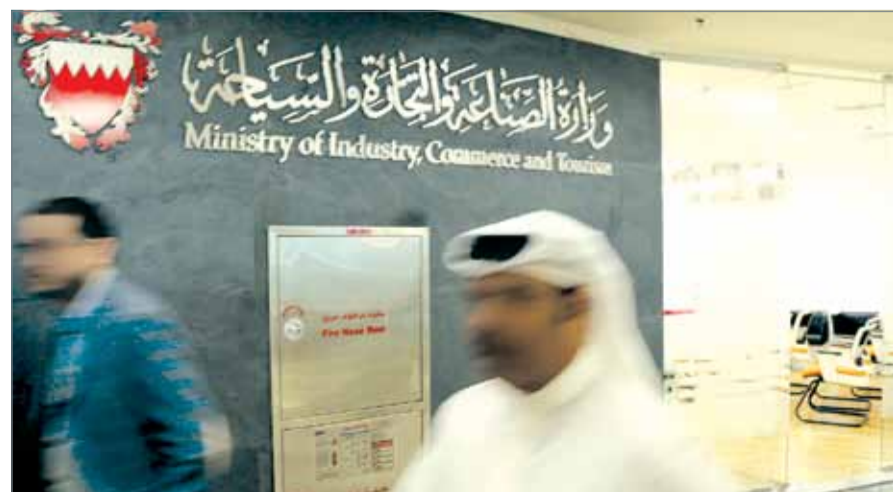
• تعاون مستمر بين إدارة رقابة الشركات ومكاتب تدقيق الحسابات

نفسه تحذر من القيام بتقديم مستندات غير صحيحة إلى الوزارة بفرض الحصول على أي من الخدمات المقدمة من قبلها.