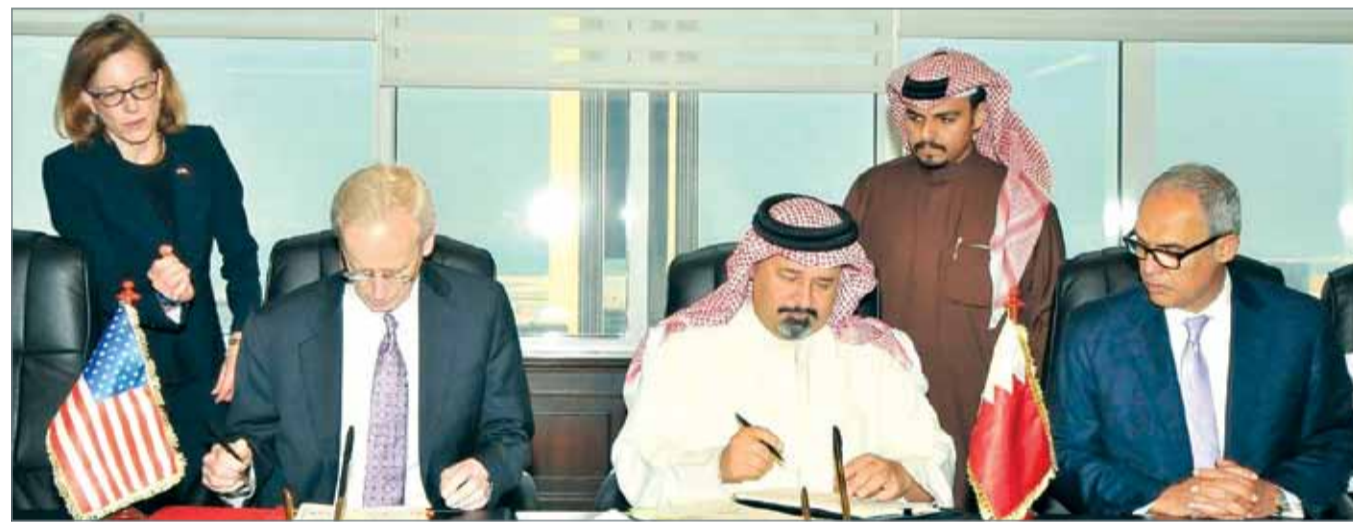
• توقيع الاتفاقية

التشريعية طبقاً لأحكام الدستور والقانون. كما تجدر الإشارة إلى أن الولايات المتحدة الأميركية وقعت اتفاقيات مماثلة مع معظم دول العالم، وذلك في إطار العمل على ضمان تنفيذ قانون الامتثال الفريبي الأميركي للحسابات الأجنبية الصادر العام 2010، والذي يمثل آلية لمكافحة التهرب المالي من خلال النص على قيام المؤسسات المالية غير الأميركية بتزويد وزارة الخزانة في الولايات المتحدة بالبيانات الخاصة بهوية وحسابات عملائها الأميركيين.