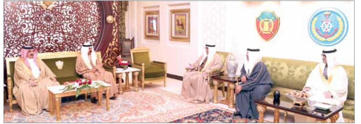
● جلالة الملك مستقبلاً سمو رئيس الوزراء

مملكة البحرين والأجيال القادمة، وموجهًا العاهل إلى مزيد من الاهتمام بقضايا المواطنين والعمل على تلبية احتياجاتهم ومتطلباتهم والنهوض بمستوى الخدمات الحكومية وتوفير أفضل سبل العيش الكريم للمواطن البحريني. هذا، وقد تترافق نائب رئيس مجلس الوزراء سمو الشيخ علي بن خليفة آل خليفة بتقديم دعوة لترشيف جلالة الملك حفل زواج نجله سمو الشيخ خليفة بن علي بن خليفة.