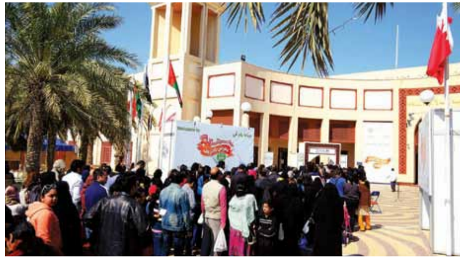
• حضور أحد المعارض السابقة

سيُفتح المعرض يومياً للجمهور من الساعة 12:00 ظهراً حتى 10:00 مساءً يوم 25 يناير، ومن الساعة 10 صباحاً حتى الثانية ظهراً، ثم من الساعة الرابعة حتى العاشرة مساءً يوم 26 يناير، ومن الساعة 12:00 ظهراً حتى 10:00 مساءً يوم 27 يناير ومن الساعة 10 صباحاً إلى 2 ظهراً، ثم من الساعة 4 - 10 مساءً في أيام 28 و29 و30 و31 يناير، ومن الساعة 10 صباحاً إلى 10 مساءً في يومي 1 و2 فبراير. وللمسيدات فقط صباحاً يومي 29 و30 يناير.