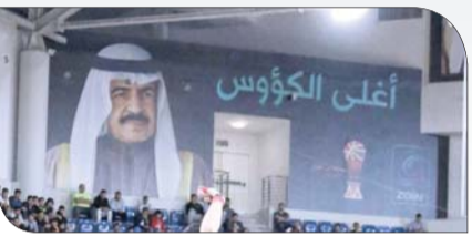
صورة سمو رئيس الوزراء تزين الصالة

ظهرت صالة مدينة خليفة الرياضية الكائنة بمدينة عيسى بأزهى حلة، عندما استضاف الدور نصف النهائي