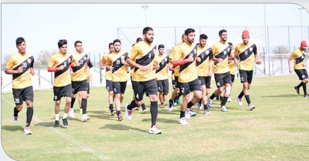
جانب من التدريبات

اليومية بالبعثة عبر الاتصال والتواصل شخصياً مع رئيس الوفد والجهاز الإداري للمنتخب للاطمئنان على أمور المنتخب العسكري، وكذلك الاطلاع على آخر المستجدات للتحضيرات التي يجريها استعداداً للمواجهة المرتقبة التي ستجمعه بالمنتخب القطري يوم غد الثلاثاء، ضمن منافسات دور الثمانية من البطولة، وقد حث الشيخ علي بن خليفة آل خليفة أفراد المنتخب على الظهور المشرف في المباراة المقبلة، والسعي لتحقيق نتيجة الفوز الذي يمنح الأحمر العسكري مواصلة المشوار في هذا الحدث العالمي عبر التأهل للدور قبل النهائي، علماً بأن الشيخ علي بن خليفة لم يتمكن من التواجد إلى جانب البعثة خلال البطولة لظروف عملية خاصة.