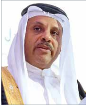
• زافر الجلامه