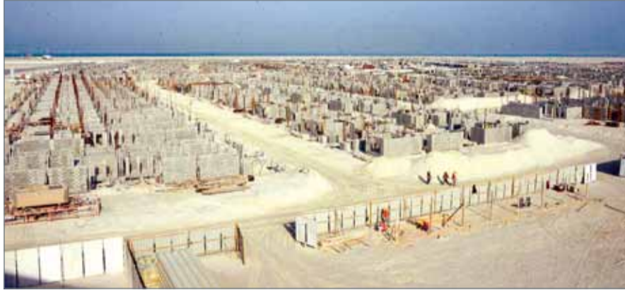
• مراحل البناء والإنشاء بوتيرة منتظمة حسب الجدول الزمني الممد لما