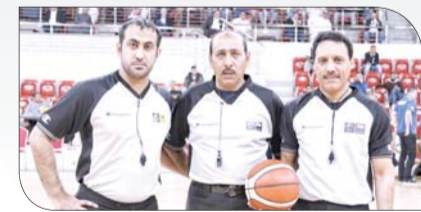
حكام إحدى المباريات

شهدت مباريات الدور نصف النهائي للبطولة، تألقاً من جانب طاقم التحكيم اللذين نجحوا باقتدار في قيادة اللقاءين إلى