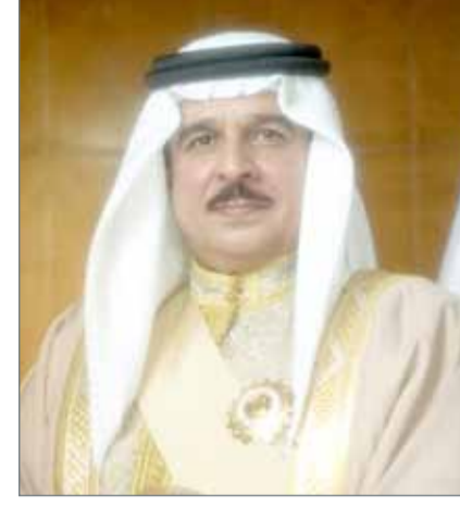
• جلالة الملك

يطيب لنا بكل السرور أن نبعث إلى سموكم بخالص التحيات وعميق التمنيات بموفور الصحة والعافية مقرونة باعتزازنا ببرقية سموكم التي تحمل تمننكم لنا وتهنئة إخوانكم البواسل منسوبي قوة دفاع البحرين قادة وضباطاً وأفراداً، بالذكري التاسعة والأربعين لتأسيس قوة دفاع البحرين