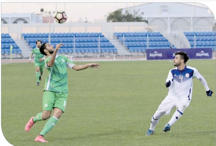
من لقاء النجمة والبحرين