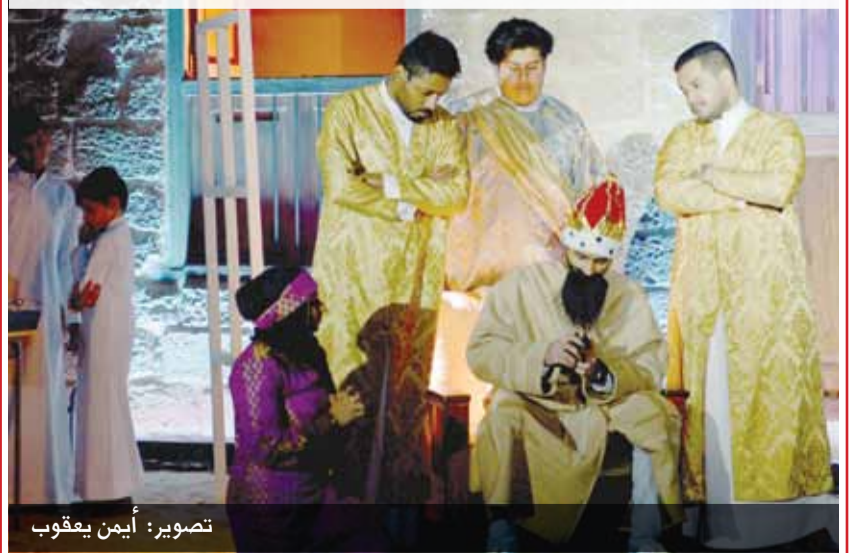
• انطلاق مهرجان ”تاء الشباب“ الثامن في مدرسة الهداية الخليفية بالمرحوق