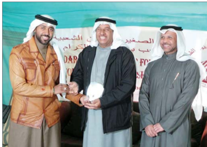
• تكريم الفنان أحمد جمعة