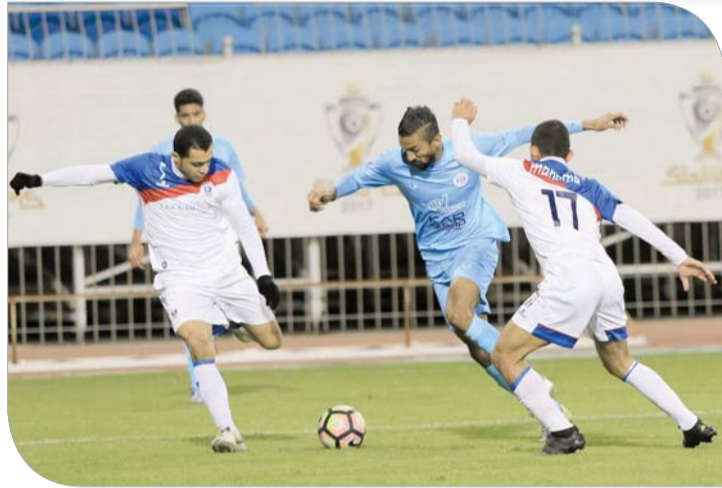
من لقاء المنامة والرافع