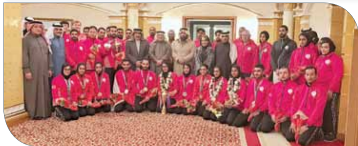
جانب من استقبال أبطال الرماية

البحريني للرماية برئاسة الشيخ سلمان بن خالد آل خليفة، مبدية اعترافها الكبير بنتائج الرميات البحرينية وما وصلن إليه من مستوى متطور. ومن جانبهم، فقد تقدم الأبطال بخالص الشكر والتقدير للجنة الأولمبية البحرينية برئاسة سمو الشيخ ناصر بن حمد آل خليفة على هذا الاستقبال الحافل، مشيدين بالدعم الكبير الذي يحظى به الاتحاد من اللجنة الأولمبية معاهدين القيادة الرشيدة وسمو الشيخ ناصر بن حمد آل خليفة بتحقيق المزيد من النتائج المشرفة لرفع راية البحرين بمختلف المحافل الخارجية.