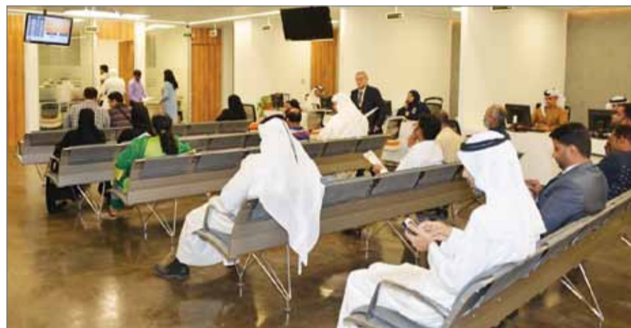
تسجيل الشركات المصنفة ذات المسؤولية المحدودة بنسبة 100 %.

وكان المركز قد رخص إلى 6 شركات جديدة أموال بلغت 53 ألف دينار، وذلك خلال الأسبوع قبل تعمل في أنشطة تجارية مختلفة بإجمالي رؤوس