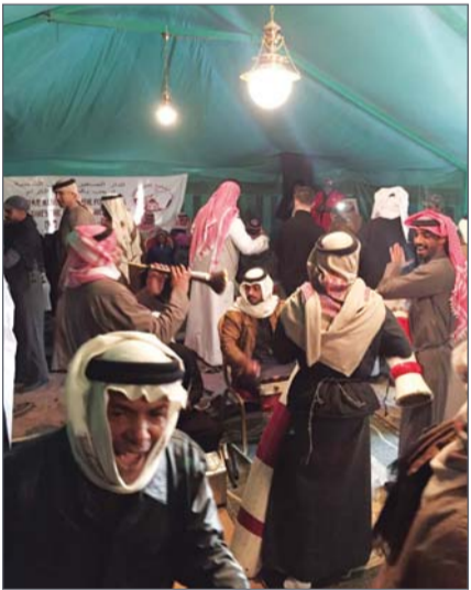
• جانب من الحفل عليها.