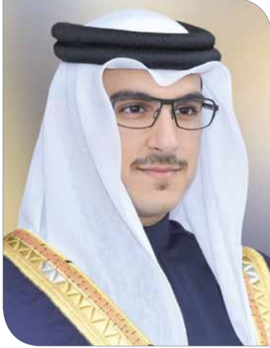
سمو الشيخ عيسى بن سلمان

كما انتهت اللجنة من إنجاز كافة التسهيلات الإعلامية اللازمة لوسائل الإعلام الراغبة في تغطية المؤتمر، مشيراً إلى أنه سيتم الكشف عن الكثير من الفعاليات المصاحبة للإعلاميين، حيث سيتم عقد اجتماع تسيقي آخر غد الاثنين مع ممثلي وسائل الإعلام للوقوف على كافة احتياجاتهم اللازمة والتي تضمن نجاح تغطيتهم المنتظرة للمؤتمر، مشيداً بالدور الكبيرة التي تبذله وسائل الإعلام البحرينية بالتعاون مع اللجنة المنظمة لإنجاح المحفل القادم.