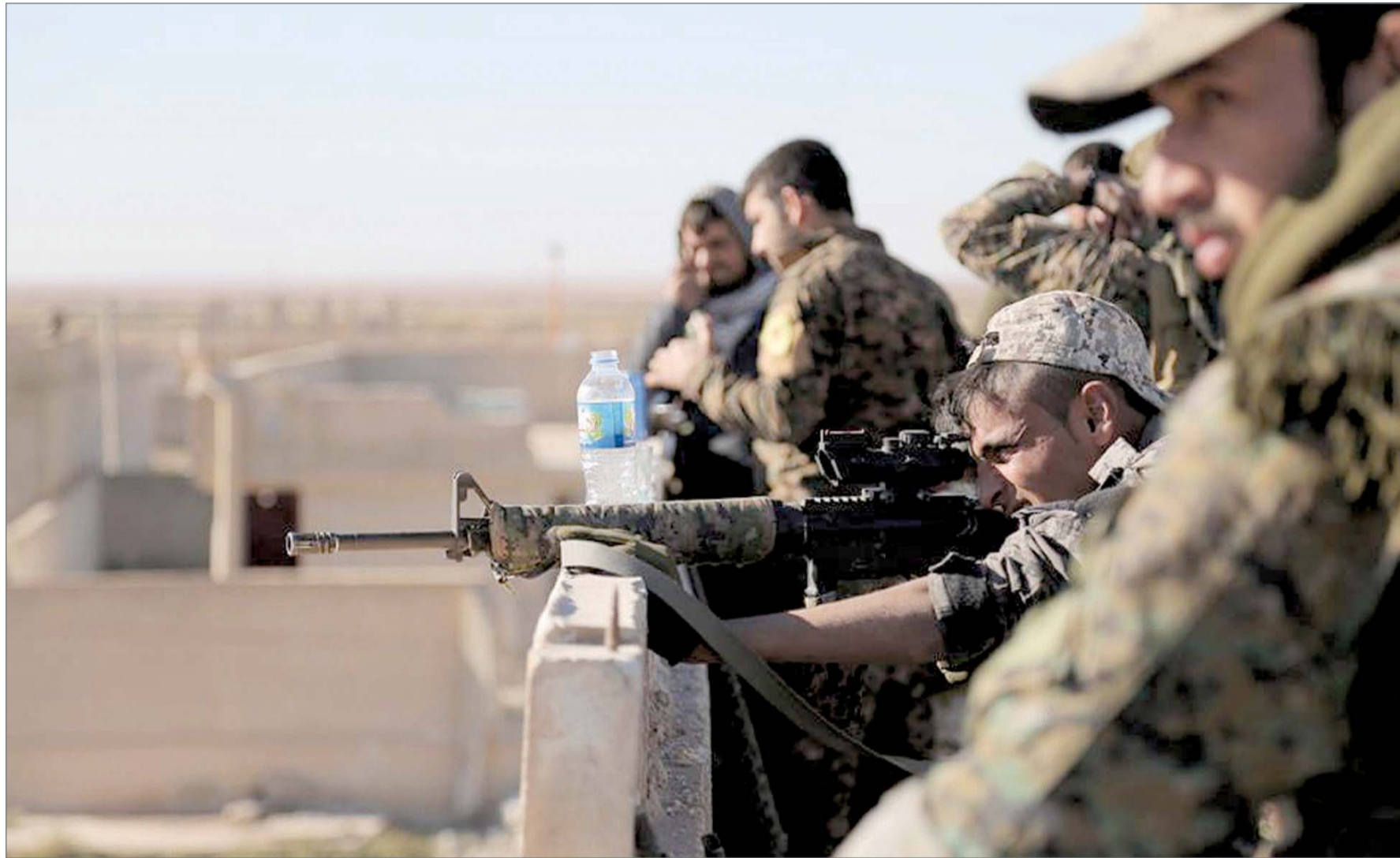
مقاتلون من تحالف قوات سوريا الديمقراطية في قرية شمالي مدينة الرقة يوم 19 نوفمبر 2016

أعلن الجيش الأردني مساء أمس السبت أنه شن غارات على مواقع لتنظيم "داعش" في جنوب سوريا، دمر خلالها مستودعات للذخيرة وثكنات للتنظيم الإرهابي. ونقلت وكالة "بترا" الأردنية للأنباء بياناً صادراً عن القيادة العامة للقوات المسلحة الأردنية، جاء فيه: "دكت طائرات من سلاح الجو الملكي الأردني.. مساء الجمعة الثالث من فبراير 2017 أهدافاً مختلفة لعصابة داعش الإرهابية في الجنوب السوري منها موقع عسكري كانت قد احتلته عصابة داعش المجرمة" وكان يعود سابقاً للقوات النظام السوري. وأضاف البيان "وقامت مقاتلات سلاح الجو الملكي بتدمير مستودعات للذخيرة ومستودع لتعديل وتفخيخ الآليات وثكنات لأفراد من عصابة داعش الإرهابية باستخدام طائرات بدون طيار وقنابل موجهة ذكية". وأكد الجيش الأردني في البيان أن "العملية أسفرت عن قتل وجرح العديد من عناصر العصابة الإرهابية إضافة إلى تدمير عدد من الآليات".