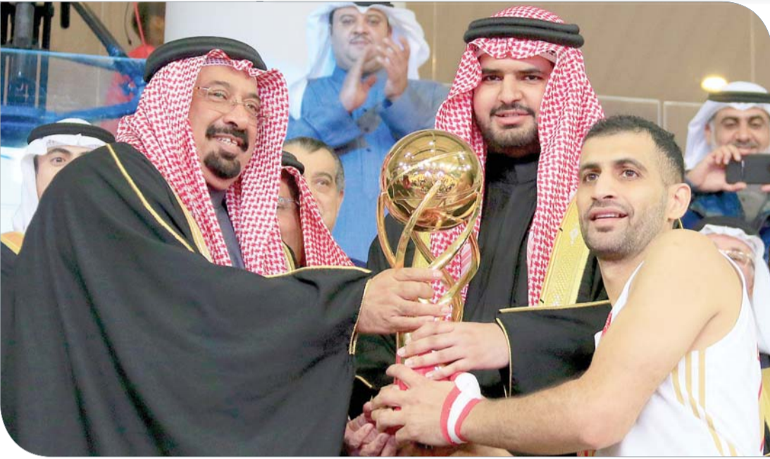
سمو الشيخ عيسى بن علي متوجاً المحرق

الرفاع | الاتحاد البحريني لرياضة ذوي الإعاقة