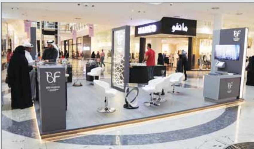
عرض المشاريع العقارية في جناح "بن فقيه"

وتعتبر "بن فقيه" من الشركات الخاصة التي استطاعت خلال أقل من 10 أعوام أن تتبوأ مكانة ريادية في سوق الاستثمار العقارية بالبحرين. وتهدف شركة "بن فقيه" لأن تصبح مساهماً محورياً في توفير الفرص الاستثمارية الجارية، ودمج أفضل الممارسات العالمية وخبرات الاستثمار الإقليمية؛ سعياً منها لتطوير مشاريع ربحية وذات قيمة مضافة للمساهمين والعلاء وشركاء القطاع والموظفين والمجتمعات التي تعمل فيها.