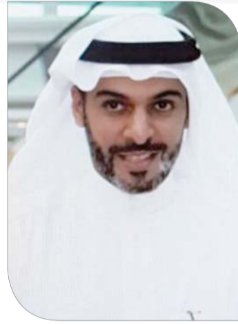
الشيخ محمد بن دعيج

العربية الثالثة عشرة للرمية التي أقيمت بدولة الكويت الشقيقة مؤخراً.