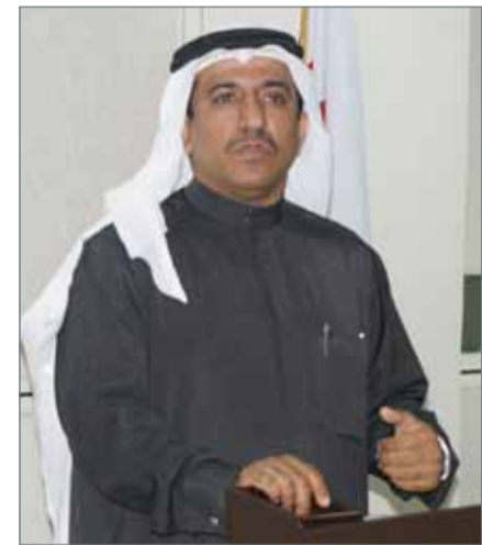
• رئيس هيئة التشريع والإفتاء القانوني