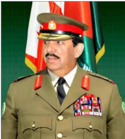
• القائد العام لقوة دفاع البحرين

رئيس مجلس الوزراء برقية تهنئة من القائد العام لقوة دفاع البحرين المشير الركن الشيخ خليفة بن أحمد آل خليفة بمناسبة الذكرى التاسعة والأربعين لتأسيس قوة دفاع البحرين، هذا نصها: