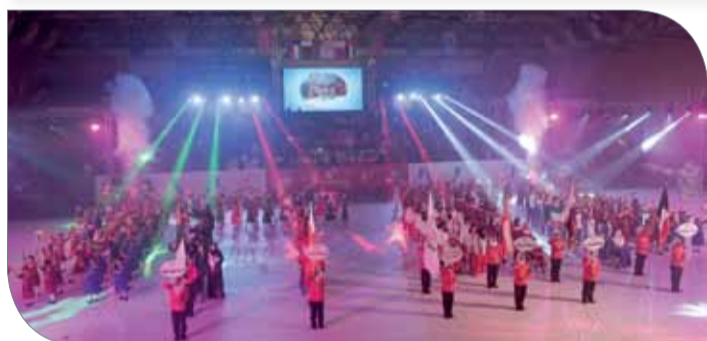
من افتتاح الدورة الرابعة بمسقط

القوى لذوي الاحتياجات الخاصة والمبارزة والبولينج والتنس الأرضي والتايكوندو.