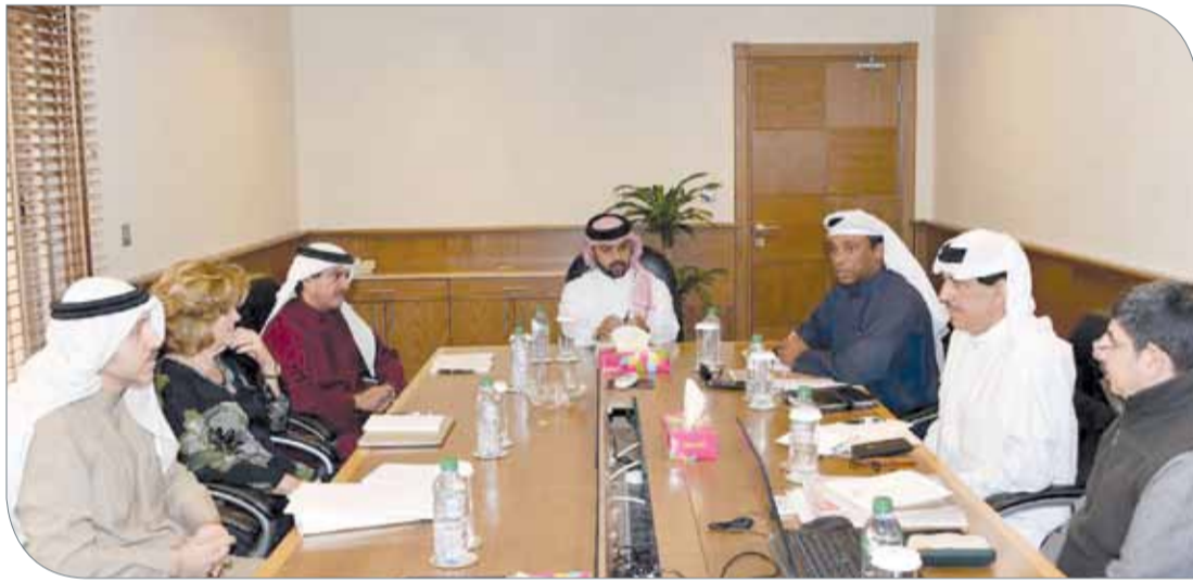
من اجتماعات اللجنة المنظمة

كافة التفاصيل التي تساهم في إخراج المؤتمر بصورة تليق بمملكة البحرين، حيث وجه سمو الشيخ فيصل بن راشد آل خليفة كافة اللجان إلى إنجاز جميع المهام الموكلة إليها، مشيراً إلى أهمية اتخاذ كافة التدابير التي تضمن النجاح الباهر لاجتماعات اللجنة المنظمة العالمية للجواد العربي الأصيل والفعاليات المصاحبة التي ستقام على هامش المؤتمر.