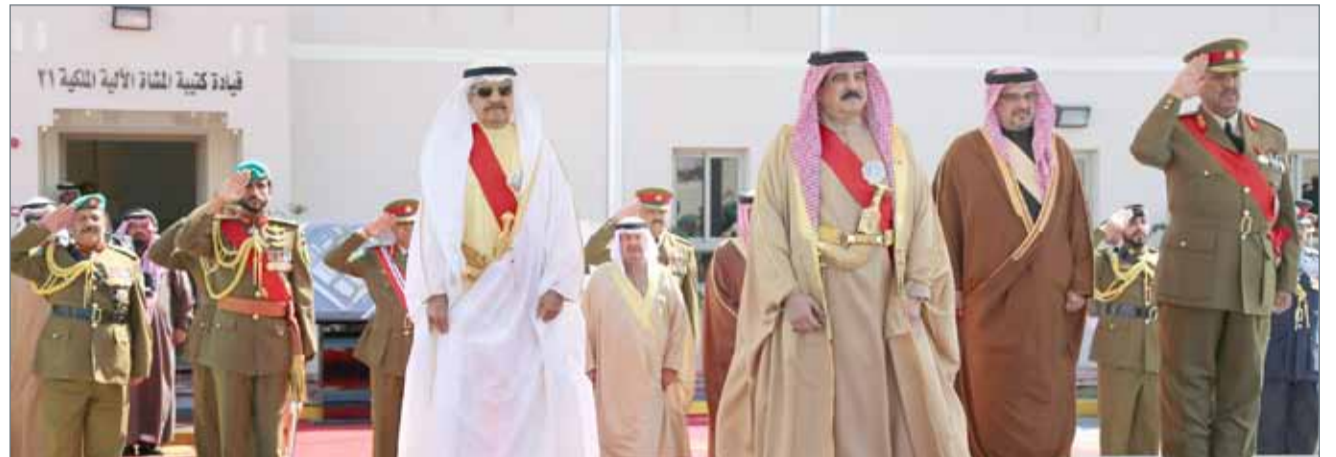
• جلالة الملك يرعى حفل ذكرى تأسيس قوة الدفاع البحرين بحضور سمو رئيس الوزراء وسمو ولي العهد (ارشيفية)

أنها على العهد والوعد، وأنها درع الوطن وحصنه الحصين وأنها أنجزت وتجزت كل المهام التي يطلبها الوطن، وهي تتمتع بأعلى مستويات التدريب والتجهيز والاستعداد، في روح صادقة من الولاء والوفاء والتضحية والفداء.”