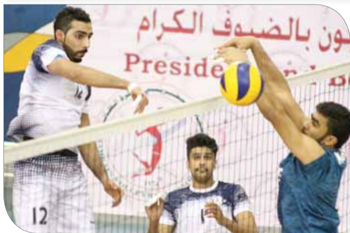
من لقاء النجمة والنبه صالح

عند نقطتين في المركز السابع بعد تلقيه سبع هزائم دون أن يحقق أي انتصار.