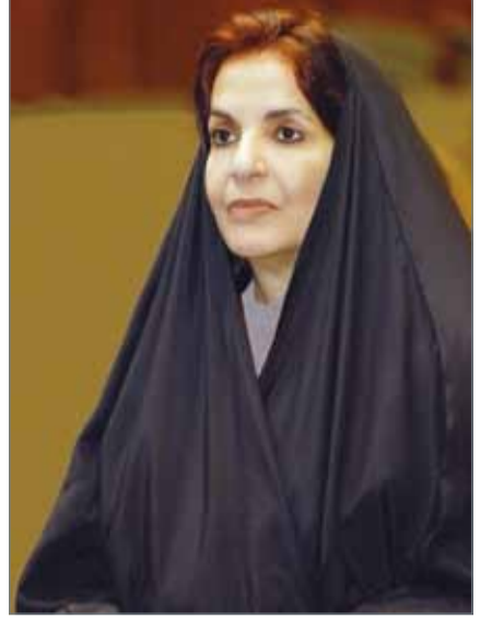
سمو الأميرة سبيكة بنت إبراهيم

الرفاع- المجلس الأعلى للمرأة: تحت الرعاية الكريمة لقريئة العاهل رئيسة المجلس الأعلى للمرأة صاحبة السمو الملكي الأميرة سبيكة بنت إبراهيم آل خليفة تعقد غداً الإثنين الموافق 6 فبراير اجتماعات الدورة الـ 36 للجنة المرأة العربية بجامعة الدول العربية التي تترأسها ملكة البحرين وتستمر حتى 7 فبراير الجاري، بحضور الأمين العام لجامعة الدول العربية.