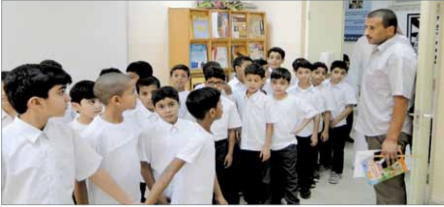
بدء الفصل الدراسي الثاني لجميع المراحل

وستفتح المدارس أبوابها لاستقبال أكثر من 150 ألف طالب ضمن 208 مدارس، وذلك بعد انتهاء عطلة منتصف العام الدراسي التي بدأت يوم الأحد الموافق 22 من الشهر الماضي، بحسب دليل الامتحانات والعطلات المدرسية للعام 2016 - 2017. وبحسب دليل الامتحانات والعطلات المدرسية من المقرر أن تتخلل الفصل الدراسي الثاني من العام الدراسي عطلة يوم العمال التي ستصادف الإثنين 1 مايو 2017، وعطلة عيد الفطر المبارك التي ستكون مدتها 3 أيام بالفترة من 25 إلى 27 يونيو 2017. واستعد أولياء الأمور لشرائح المستلزمات الدراسية وغيرها قبل بدء الترحام على