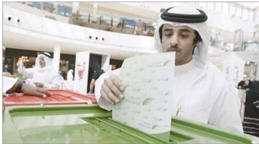
• صورة أرشيفية للانتخابات العامة الماضية

وعن الإزامية الفتوى الصادرة من الهيئة، أوضح البوعيين أن كثيراً من الذين يقرأون النص سواء من المحامين أو السلطة التشريعية أو القانونيين ضنوا بأن الهيئة تصدر الأحكام، إلا أن الرأي القانوني هو رأي تحكيكي ليس إلا. واستكمل ”إذا ما حدث خلاف بين السلطة التنفيذية والتشريعية أو بين النواب والشورى قد يكون هناك خلاف قانوني حول بناء ومبنى نص، فإن الهيئة قادرة على الرجوع إلى المواد التحضيرية السابقة للوصول للمفهوم الصحيح للنص وتفسيره. وأكد الرأي الملزم يأتي بناء على اتفاق الأطراف بداية للوصول إلى الهيئة، ثم إذا ما صدر رأي يفترض أن يكون ملزماً؛ حتى لا يستمر الخلاف إلى ما بعد ذلك.