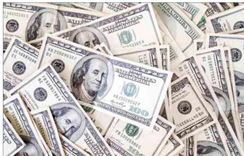
• الدولار يواصل الانخفاض منذ بداية الأسبوع

وانخفض مؤشر الدولار الذي يقيس أداء العملة الأميركية مقابل ست عملات 0.1 % في منتصف التعاملات إلى 99.66.