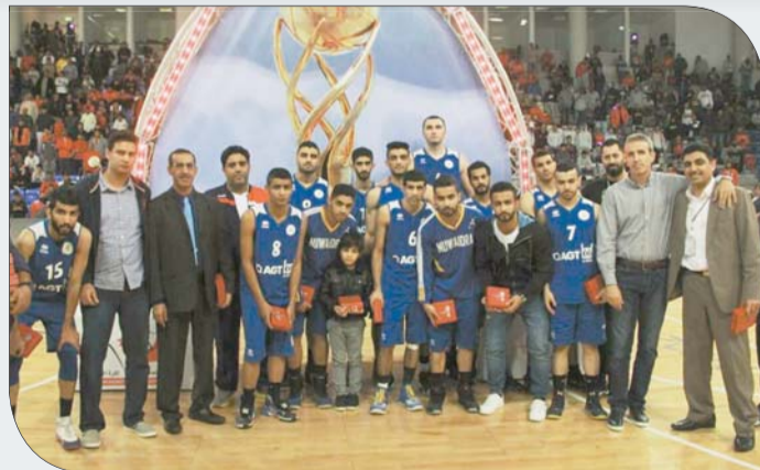
صورة جماعية لفريق النويدرات متوجاً بالمركز الثاني

وأردف رئيس جهاز سلة النويدرات قائلاً "أنا فخور باللاعبين ومشاورهم في البطولة، والمباراة النهائية كانت بمثابة دروس مستفادة، أهمها خوض كل التحديات التي مرت علينا، وتمسكنا بالأمل