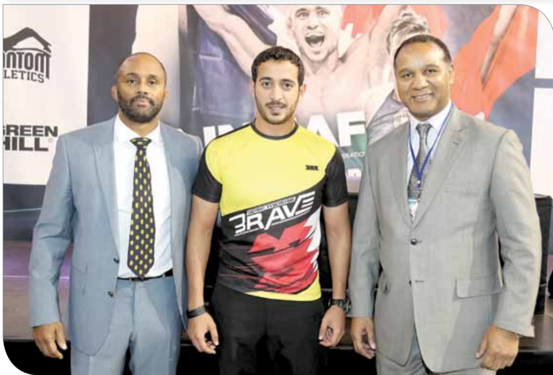
سمو الشيخ خالد بن حمد مع رئيس الاتحاد الدولي والرئيس التنفيذي

الرفاع | المكتب الإعلامي لسمو الشيخ خالد بن حمد آل خليفة