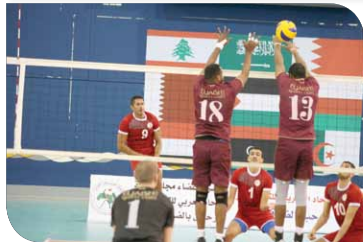
الجيش القطري تجاوز السويحلي الليبي بصعوبة

تستمر منافسات البطولة اليوم بإقامة مواجهتين، الأولى تجمع الريان القطري أمام السلام العماني الساعة 3 ظهراً ضمن المجموعة الرابعة، ثم مباراة الأهلي السعودي وتورين اللبناني الساعة 5 مساءً ضمن المجموعة الثالثة، وأخيراً الشعلة اليمني والجيش القطري الساعة 7 مساءً ضمن منافسات المجموعة الأولى.