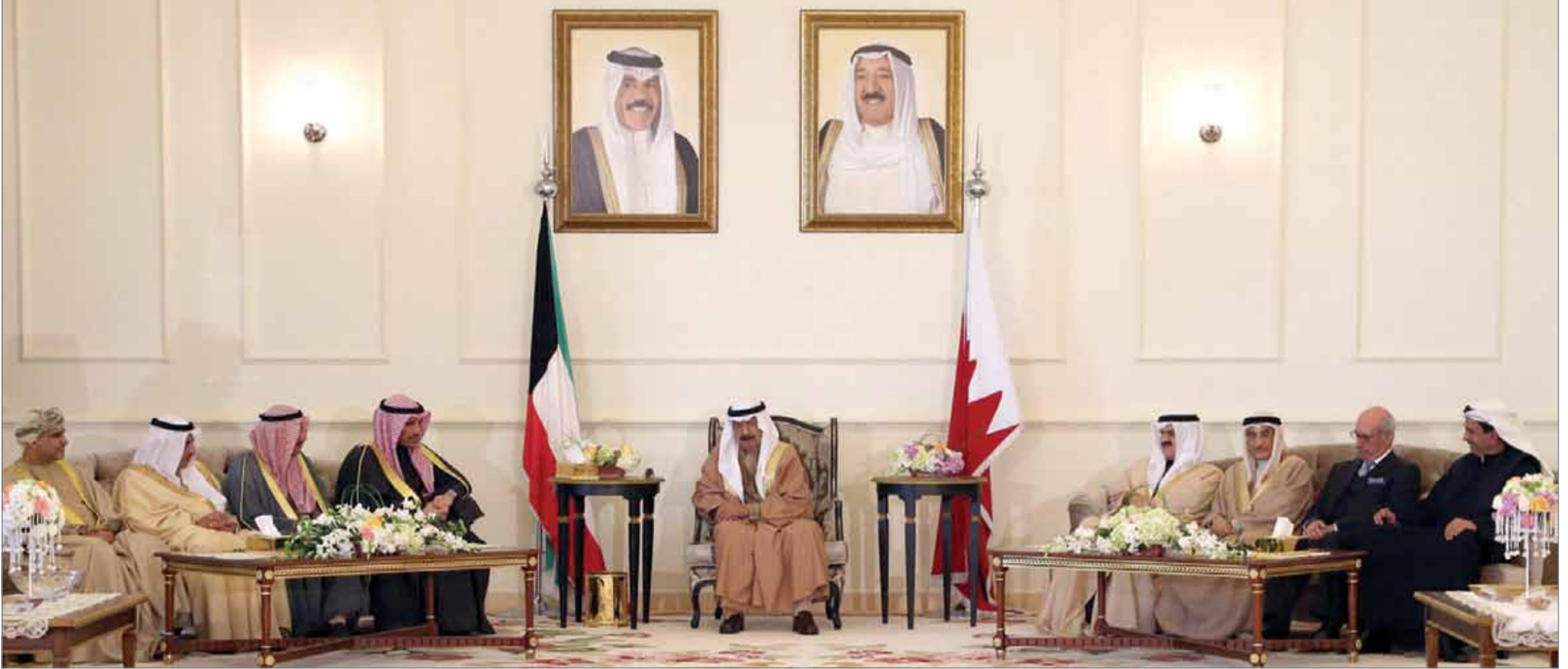
• سمو رئيس الوزراء لدى حضوره الاحتفال بمناسبة العيد الوطني لدولة الكويت

• الدولة الشقيقة تزدان عاماً بعد عام بإنجازات تدعو للفخر والاعتزاز