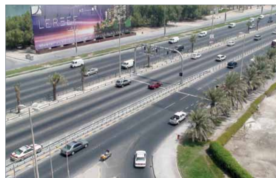
• خطة أشمل لمشاريع شبكة الطرق الإستراتيجية الكبرى

- وتوفير مسار للدوران العكسي عند دوار شارع ولي العهد للحركة المرورية القادمة من الشمال على شارع الشيخ خليفة بن سلمان والمتجهة إلى شارع الشيخ زايد لمنطقة (عالي وسلماباد والمنطقة التعليمية).