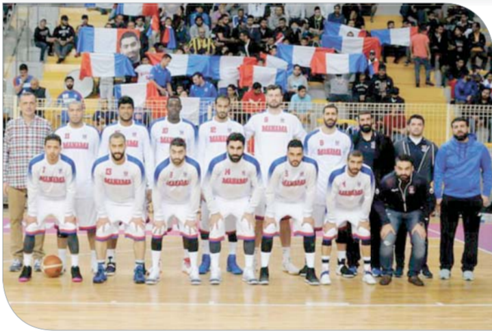
فريق المنامة لكرة السلة

لقاءاته من الدرجات؛ من أجل تحديد نقاط القوة والضعف ويطمح مدربا الفريقين لمواصلة الانتصارات وحصد النقاط