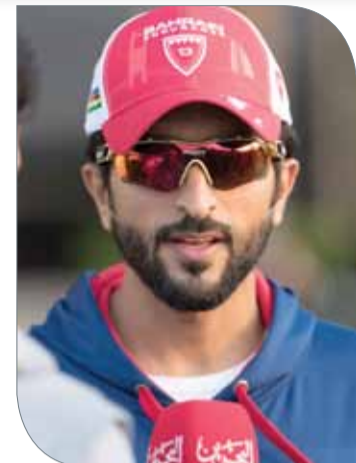
سمو الشيخ ناصر بن حمد آل خليفة

العديد من المقترحات والمبادرات التي ستجعل من النسخة العاشرة أكثر تطوراً وتميزاً من كافة النواحي وتضمن مشاركة كبيرة فيها من قبل الشباب البحريني قبل أن تنطلق رحلتها في شهر رمضان المبارك