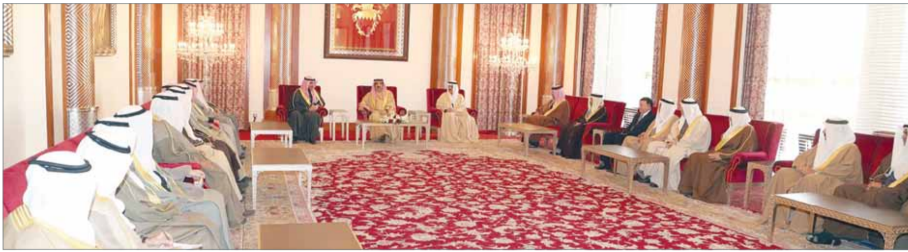
● جلالة الملك يستقبل رئيس مجلس الأمة الكويتي

● رئيس "الأمة" الغانم: حكام البحرين والكويت الكرام عائلة واحدة والعلاقات بين البلدين راسخة وأزلية