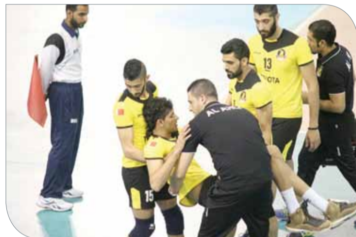
إصابة عنان متأثراً بإصابته

كسب الجيش القطري السويحلي الليبي بصعوبة بعدما فاز عليه بثلاثة أشواط مقابل شوطين ضمن منافسات المجموعة الأولى، حيث انتهى الشوطين الأول والرابع 25/19، 26/24، بينما فاز الجيش الأول والثاني لصالح الجيش القطري 25/21، 25/21، قبل أن يقلب عليه السويحلي الطاولة في الشوطين الثالث والرابع 25/19، 26/24.