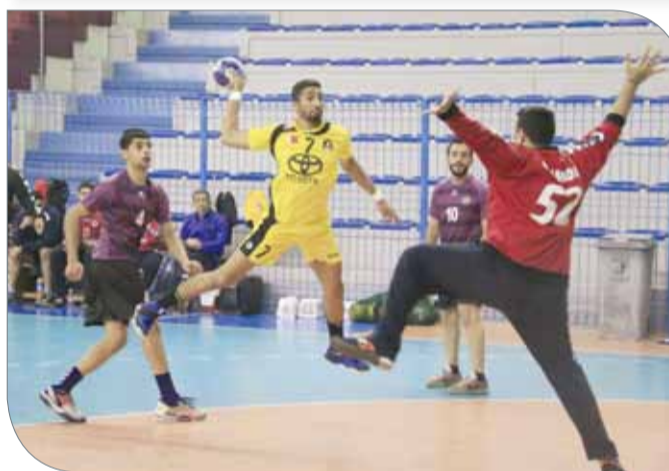
من لقاء باربار والأهلي