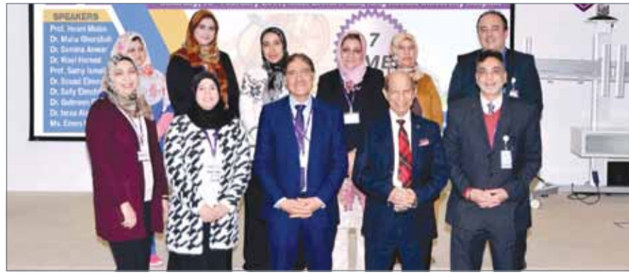
● جانب من الورشة

إلى طرق الاكتشاف المبكر الحديثة في جميع الحالات العلاجية. وأشارت غرابية، أن مستشفى الملك حمد الجامعي يولي اهتمامه بتنظيم ورش العمل والندوات والبرامج التوعوية والتي من شأنها رفع مستوى العاملين في المستشفى لتحقيق الأهداف الإستراتيجية لضمان تقديم رعاية صحية ذات جودة عالية تتماشى وتواكب المستجدات الطبية العالمية، مينة أنه يمكن إجراء تخطيط قلب الجنين أثناء الحمل لغاية 28 أسبوعاً من الحمل والولادة الطبيعية.