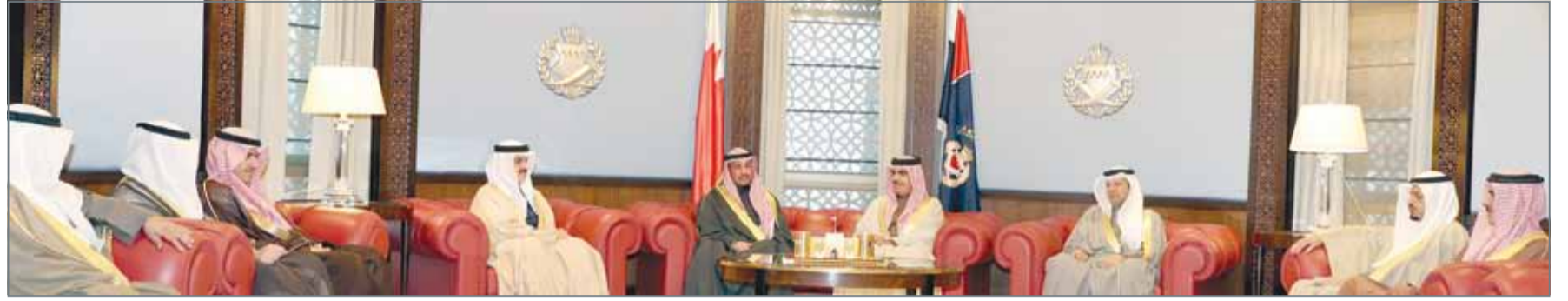
• وزير الداخلية مستقبلاً رئيس مجلس الأمة الكويتي

الشعبين الشقيقين. وشدد وزير الداخلية على أن أمننا الداخلي، كل لا يتجزأ، مشيراً إلى أهمية العمل المتواصل في إطار المسيرة المباركة لدول مجلس التعاون، بما يتناسب مع المستجدات الراهنة والتي تتطلب مزيداً من التعاون والتنسيق، بما يمكننا من التصدي لكافة التحديات من خلال توحيد المواقف واجتماع الكلمة وتضافر الجهود.