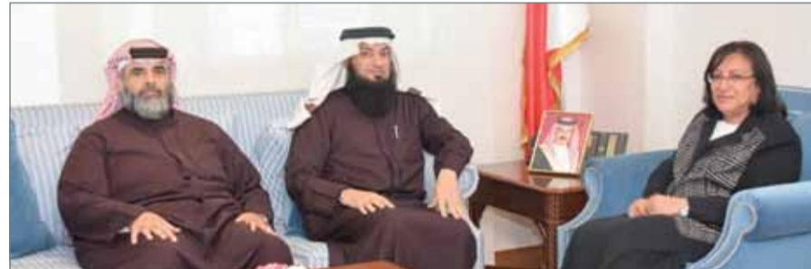
• وزيرة الصحة مستقبلة عضو مجلس النواب عبداللطيف مراد برفاقه رئيس مجلس بلدي الجنوبية

النمامة - وزارة الصحة: استقبلت وزيرة الصحة فائقة الصالح في مكتبها بمبنى الوزارة بالجفير عضو مجلس النواب عبداللطيف مراد برفاقه رئيس مجلس بلدي الجنوبية أحمد الانصاري؛ وذلك بهدف بحث عدد من الملفات الصحية.