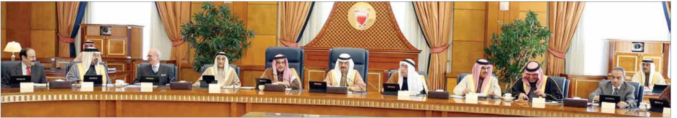
سمو رئيس الوزراء وبحضور سمو ولي العهد مترأساً جلسة مجلس الوزراء أمس

تعزيز مجالات التعاون مع السعودية في المجالات المختلفة اقتصادياً واستثمارياً وأمنياً