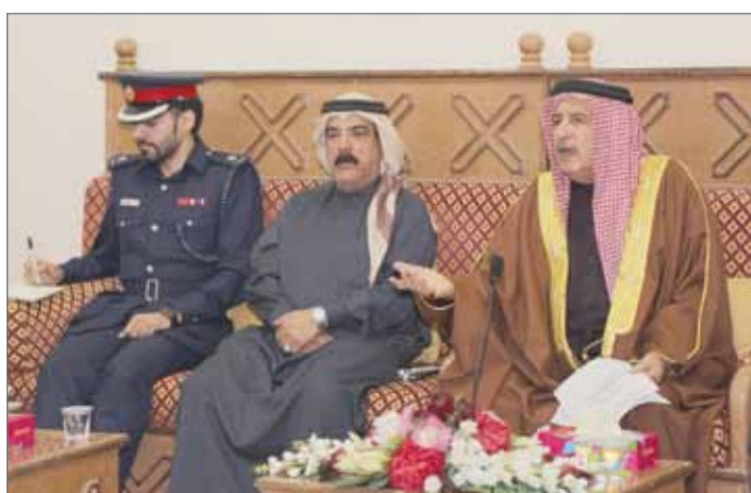
• جانب من المجلس الأسبوعي لمحافظة المحرق