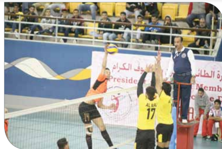
الأهلي خسر من المجمع الجزائري وخيب آمال جماهيره

كسب الجيش القطري السويحلي الليبي بصعوبة بعدما فاز عليه بثلاثة أشواط مقابل شوطين ضمن منافسات المجموعة الأولى، حيث انتهى الشوطين الأول والرابع 25/19، 26/24، بينما فاز الجيش الأول والثاني لصالح الجيش القطري 25/21، 25/21، قبل أن يقلب عليه السويحلي الطاولة في الشوطين الثالث والرابع 25/19، 26/24.