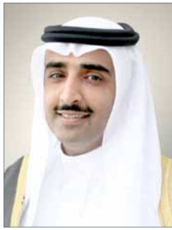
● وزير النفط

وأفادت بأن مشروع توسعة المصفاة سيساهم بشكل أساس في زيادة الإنتاج وتقليل المصاريف مما سيؤدي إلى تعظيم دخل المصفاة وتحقيق عوائد مالية مباشرة للبلاد، علاوة على ما سوف يوفره هذا المشروع الاستراتيجي من فرص عمل جديدة للمواطنين وتحريك الدورة الاقتصادية.