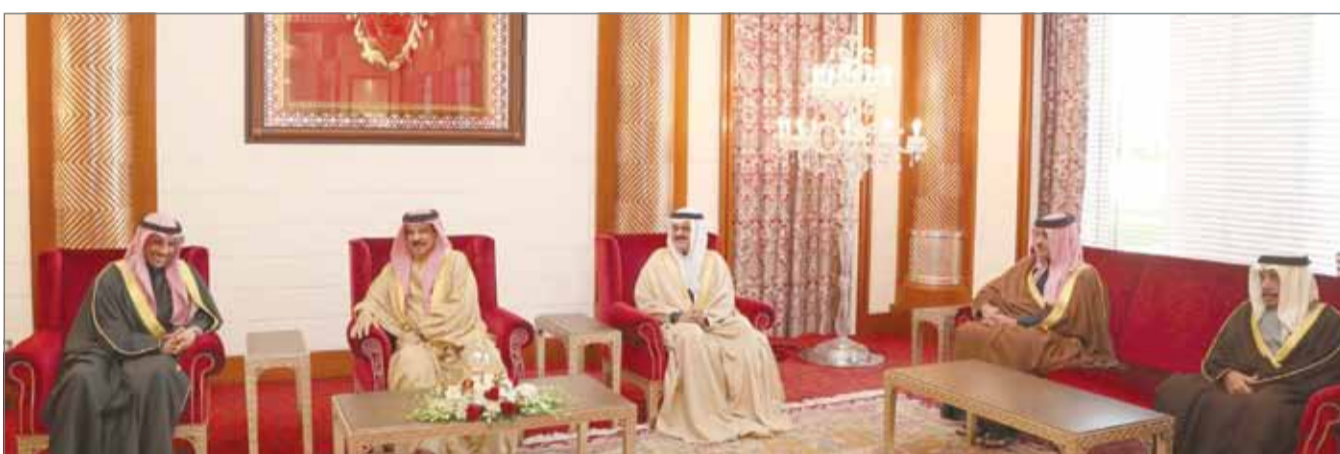
● جلالة الملك يستقبل رئيس مجلس الأمة الكويتي

مشيداً بالإنجازات التي حققتها مملكة البحرين على الصعيد الديمقراطي وما تشهده من تطور وتنمية في القطاعات كافة بفضل قيادة جلالة الملك.