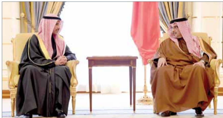
• سمو ولي العهد مستقبلاً رئيس مجلس الأمة الكويتي

على مواصلة رفع مستويات التعاون والتنسيق البرلماني بين البلدين بما يجسد الرؤى والقواسم المشتركة بينهما، ويصون مصالحهما المشتركة.