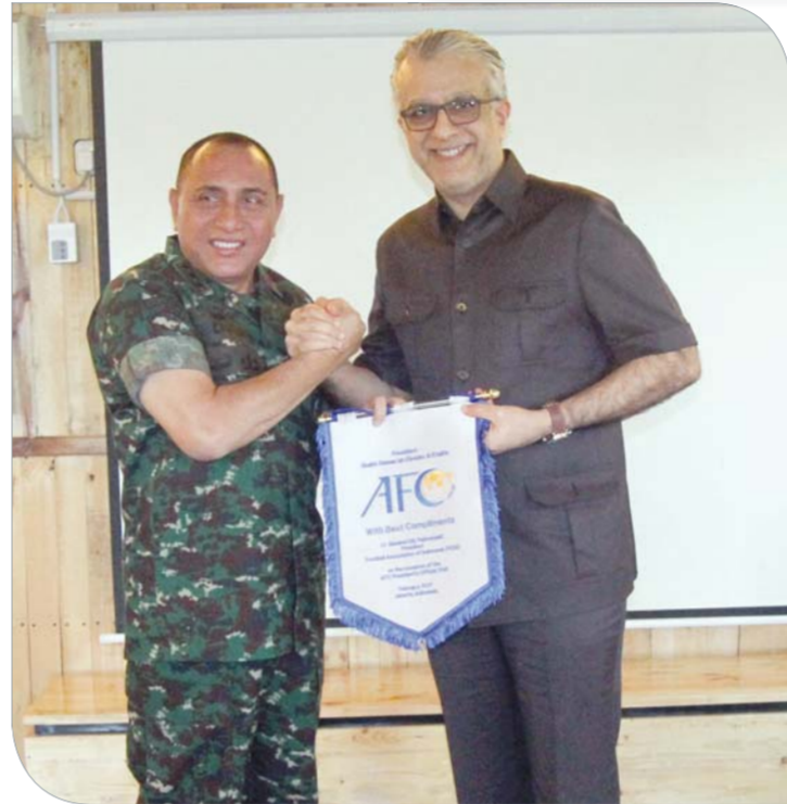
السفير سلمان بن إبراهيم يسلم علم الاتحاد لرئيس الاتحاد الإندونيسي

إبراهيم آل خليفة خلال الاجتماع على خطط وبرامج الاتحاد الإندونيسي الهادفة لتنمية اللعبة في البلاد، مؤكدا حرص الاتحاد الآسيوي على دعم ومساندة تلك الخطط في إطار سعيه الدائم للوقوف مع الاتحادات الوطنية الآسيوية وتحفيزها على التخطيط السليم الذي يعتبر حجر الأساس للوصول إلى طريق الإنجاز. واستعرض رئيس الاتحاد الآسيوي لكرة القدم خلال اللقاء الخطط المستقبلية للاتحاد القاري الهادفة إلى تحقيق المصلحة العليا في مسيرة الكرة الآسيوية على المستويات كافة، مبنياً أن التعاون والتنسيق