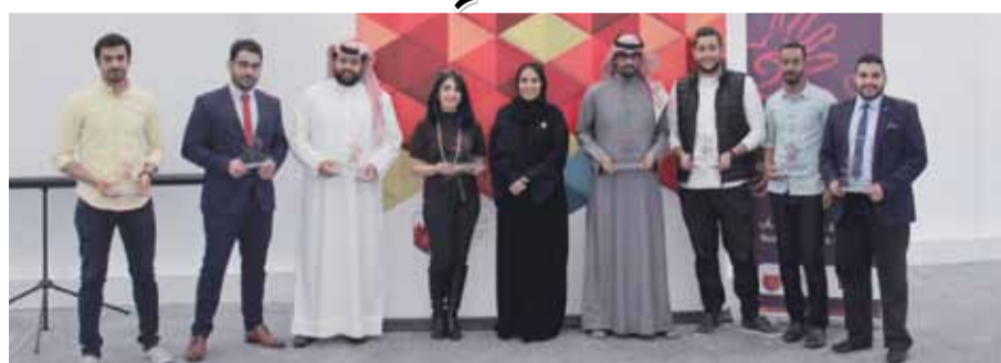
• خلال اللقاء التعريفي

المنامة - مؤسسة المبرة الخليفة: أطلقت مؤسسة المبرة الخليفة سلسلة أنشطة النسخة الرابعة من برنامج إثراء الشباب المنطلق تحت شعار ”تخطيط للحياة“ لهذا العام.