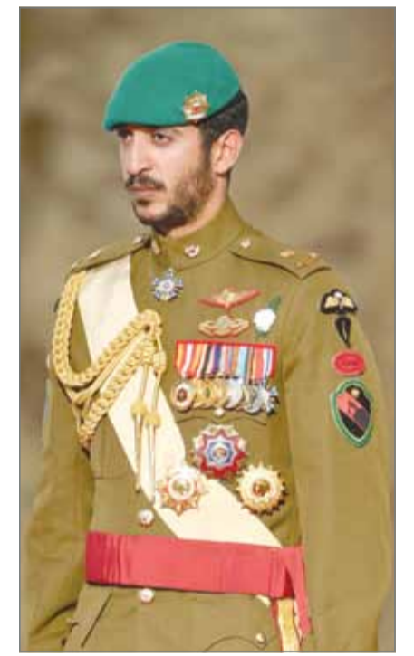
• الرائد سمو الشيخ خالد بن حمد

فرنسا - المكتب الإعلامي لسمو الشيخ خالد بن حمد آل خليفة: يبدأ قائد قوة الحرس الملكي الخاصة الرائد سمو الشيخ خالد بن حمد آل خليفة اليوم الزيارة الرسمية العسكرية لبريطانيا، والتي يزور خلالها قاعة آل خليفة بوحدة المظليين البريطانيين بمعسكر ”سان آتان“ بمدينة ”ويلز“، والتي افتتحها سموه العام 2015، والتي تجسد عمق العلاقات التاريخية والإستراتيجية القائمة بين قوة دفاع البحرين والجيش البريطاني متمثلة بقوة الحرس الملكي الخاصة وكتيبة المظليين البريطانية. ويتضمن برنامج سموه عقد عدد من اللقاءات والمباحثات مع قادة القوات الخاصة البريطانية؛ وذلك لبحث سبل تعزيز العلاقات العسكرية والشراكة بين قوة الحرس الملكي الخاصة والقوات الخاصة البريطانية، من أجل تطوير