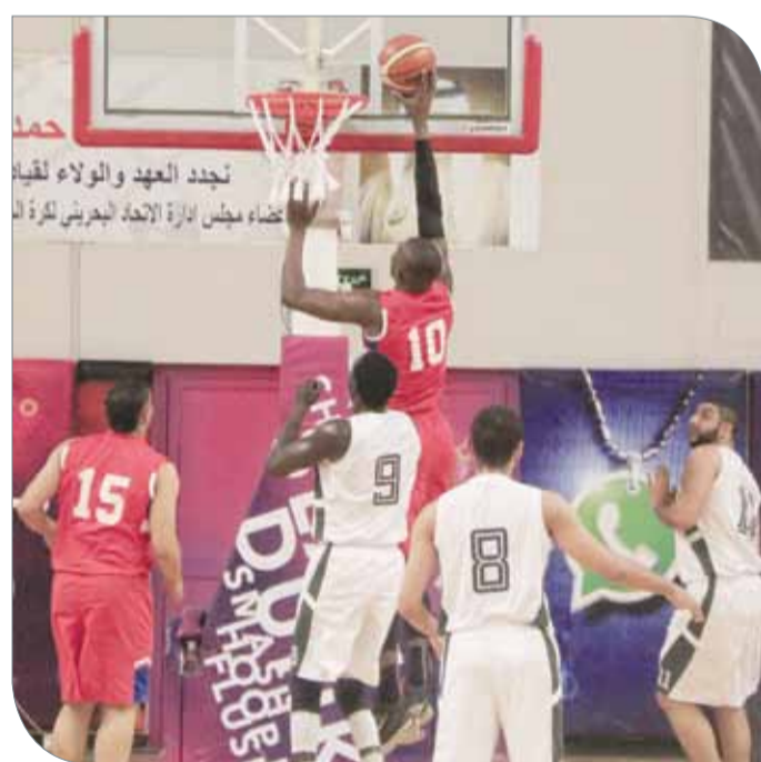
من لقاء باربار والأهلي

في الربع الثاني واستطاع حسمه بنتيجة 33/25، ثم واصل تفوقه في الفترة الثالثة التي تقدم فيها بواقع 46/43. وعاد البحرين بقوة في الربع الأخير وعادل النتيجة في بدايته قبل أن يخطف التقدم، ثم استمر سجالات تبادل النقاط والأفضلية حتى آخر دقيقة التي نجح فيها البحارة من حسم الفوز بنتيجة 64/61. وفي مواجهة الأولى أمس، استعاد مدينة عيسى ذاكرة الانتصارات، بعد تغلبه على سماهيج بنتيجة 83/65. وحافظ مدينة عيسى بهذا الفوز على حظوظه قائمة في التأهل للربع الفضي، إذ رفع رصيده إلى 3 نقاط، فيما تأزم موقف سماهيج بتلقيه الخسارة الثانية على التوالي وبات رصيده 2 نقطتين. وسيطر المدينة على مجريات المباراة، إذ تقدم في الربع الأول 21/14، وواصل تفوقه في الثاني 41/36، ورفع النتيجة في الثالث 65/52، قبل أن يحسم المباراة بواقع 83/65.