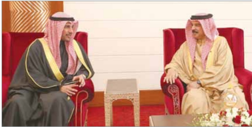
• جلالة الملك مستقبلاً رئيس مجلس الأمة الكويتي