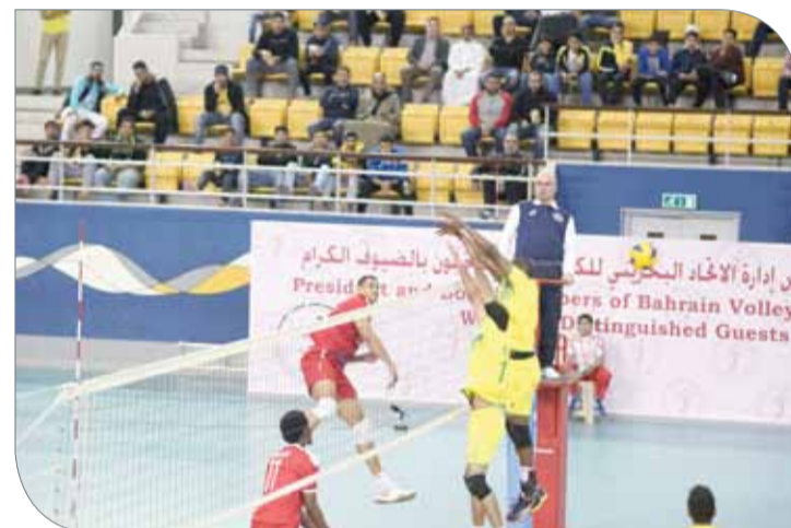
فوز مثير للسبب العماني على الوحدة السعودي