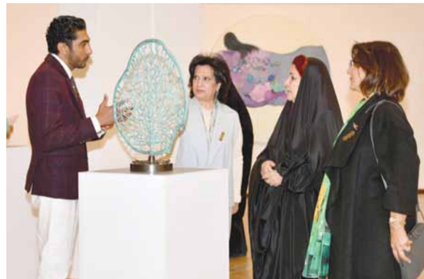
• سمو الأميرة سبيكة خلال جولتها في المعرض

من اللوحات والمنحوتات الفنية، واستمعت خلالها إلى شرح موجز من الفنانين المشاركين عن محتويات المعرض في فروع الرسم والنحت، وما تحمله من معاني ورسائل ذات دلالات متعددة.