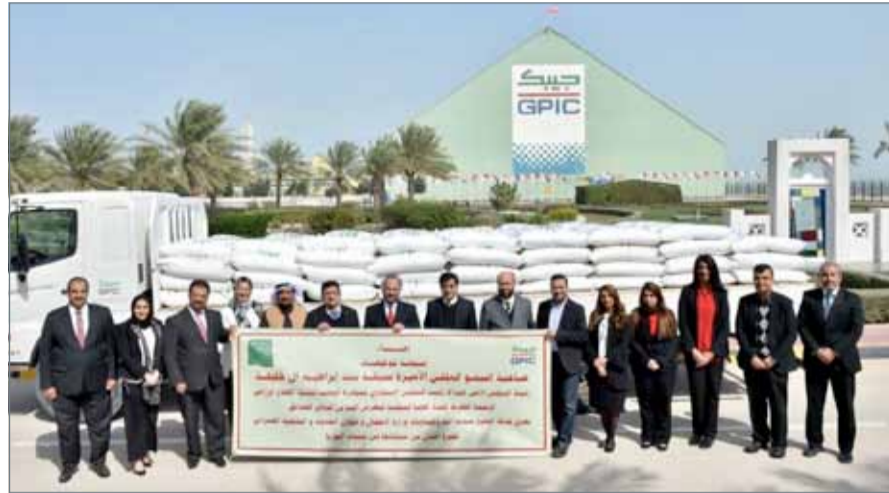
• جانب من الدعم المقدم من الشركة

سترة - جيبك: تنفيذاً لتوجيهات قرينة العاهل رئيسة المجلس الأعلى للمرأة صاحبة السمو الملكي الأميرة سبيكة بنت إبراهيم آل خليفة رئيسة المجلس الاستشاري للمبادرة الوطنية لتنمية القطاع الزراعي، الرئيس الفخري للجنة العليا المنظمة لمعرض البحرين الدولي للحدايق، وضمن توجهاتها لدعم المشاريع البيئية وتشجيع كل ما من شأنه زيادة الرقعة الخضراء وتعزيز الاهتمام المتنامي بالقطاع الزراعي بالمملكة، وانطلاقاً من حرصها المستمر على دعم فعاليات المجتمع التي تهدف إلى تنمية كافة قطاعاته والارتقاء بها، قدمت شركة الخليج لصناعة البتر وكيمويات 10 أطنان من سماد اليوريا الذي تنتجه الشركة إلى وزارة الأشغال وشؤون البلديات والتخطيط العمراني وذلك في إطار دعمها للمزارعين البحرينيين. وفي ضوء ذلك، أشاد وكيل الوزارة للزراعة والثروة البحرية بوزارة الأشغال وشؤون البلديات والتخطيط العمراني الشيخ خليفة بن عيسى آل خليفة بهذه المبادرة التي