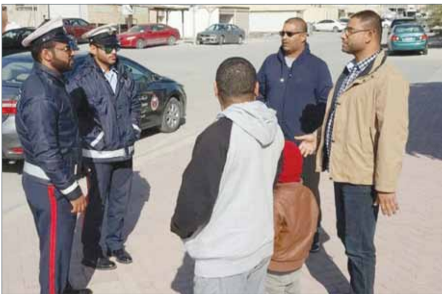
● جانب من الوقفة الاحتجاجية

وانتقدت الأمهات رفض مديرة المدرسة لقاءهن بعد الوقفة الاحتجاجية، وأنها وجهت حراس المدرسة بعدم قبول طلب الانتقاء مع المديرية واكتفت بدخول 3 مندوبين عن أولياء الأمر لتقييد شكوى جديدة لدى المشرقة لتضاهي لقائمة الشكاوى الستين السابقة. وبيّنت الأمهات أن المديرية استدعت شرطة المجتمع لتفريق المشاركين في الوقفة الاحتجاجية، وتم الاتفاق على التوجه لوزارة التربية لتقديم شكوى جديدة. وشكرت الأمهات الوزارة على حسن الاستقبال وقبول الشكوى، والمأمول الاستجابة لما ورد في مضمونها. وقالت الأمهات "إن الصدمة الكبرى أنهن أبلغن بأن الوزارة لم تستقبل من المدرسة أي شكوى سابقاً ضد المعلمة سبب الوقفة الاحتجاجية بعكس ما ذكرته المديرية للأمهات بأنه جرى تحويل الشكاوى السابقة للوزارة واتخاذ الإجراء اللازم".