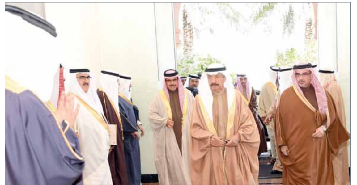
سمو رئيس الوزراء مستقبلاً سمو ولي العهد أمس