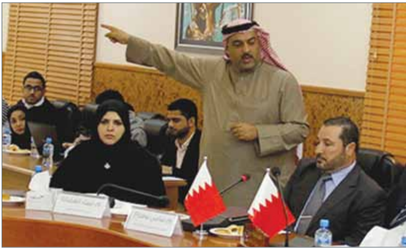
• جانب من اجتماع مجلس بلدي الشمالية