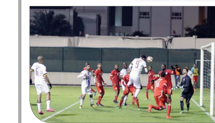
كرة عبد الرأسية في اتجاه مرمره ستره

ويشير ترتيب الدوري حاليا إلى:الشباب في الصدارة برصيد (23) نقطة من 9 مباريات، الاتحاد (21) نقطة من 9 مباريات، البديع (16) نقطة من 10 مباريات، البستين (13) نقطة من 10 مباريات، الاتفاق (11) من 10، قلالي (11) من 10، سرة (9) من 10، مدينة عيسى (9) من 10، وأخيرا التضامن (7) من 10.