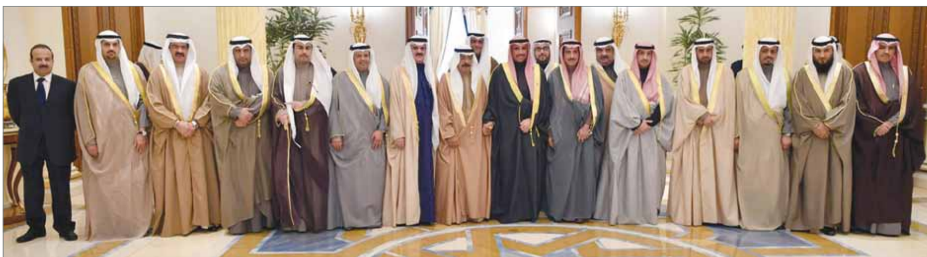
● سمو رئيس الوزراء مستقبلاً رئيس وأعضاء من مجلس الأمة الكويتي

● التحديات تحتاج أن نكون أكثر تقارباً للحفاظ على أمن واستقرار دولنا