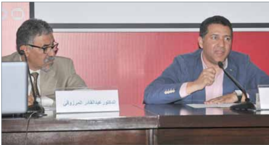
• من محاضرة نادر كاظم

أنواعها وانحيازها لطبقة أو جنس أو فئة، معززاً بذلك من أهمية ومكانة أدوات التأثير في النص وإحداها المجاز، حيث النقد قبل السبعينات كان أيديولوجياً، مشتبهاً بقضايا ملحة ولم يكن النقد بعيداً عنها أو منفصلاً بعمومه عن التحولات الاجتماعية والتغيير السياسي والتنوير، وكان النقد جزءاً من الفكر العربي، وذكر كاظم أن انفجار النقد العربي وظهور الدراسات النقدية الحديثة من بنوية وأسلوبية وغيرها حدث في أواخر عقد السبعينات وبداية الثمانينات من القرن الماضي، وظلت حتى اليوم تسير في مجادلة تحويل النقد إلى علم لديه منهجية منضبطة، فلم يعد النقد يقوم بالوظيفة التقليدية بحكم الدخول في عصر جديد الغالب عليه لغة التخصص، ناهياً إلى ما أشار إليه الأديب إدوارد سعيد بوصفه الناقد بالمتكف المحترف وهو يعني بذلك الناقد صاحب المرحقة التي تدر عليه المال.