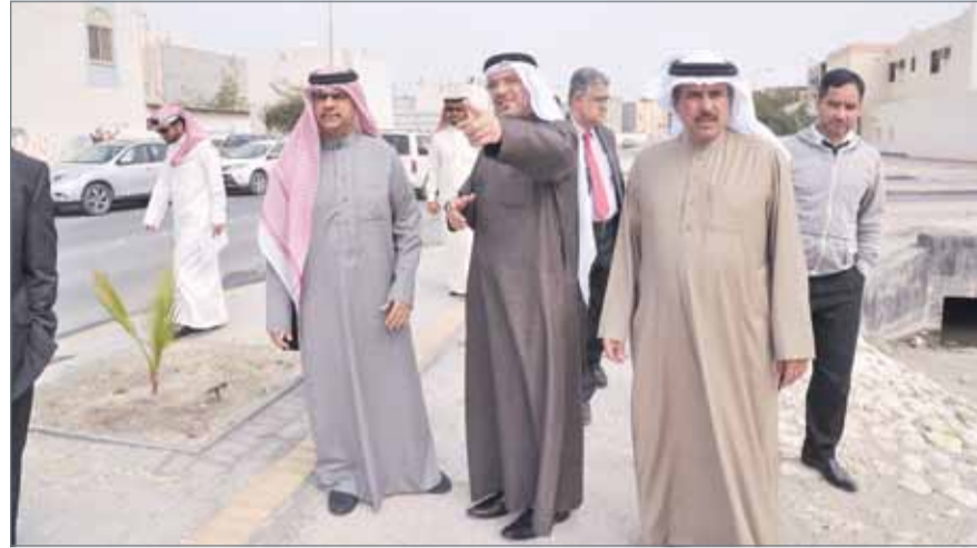
• جانب من زيارة ميدانية سابقة لمجموعة مسؤولين مع النجار