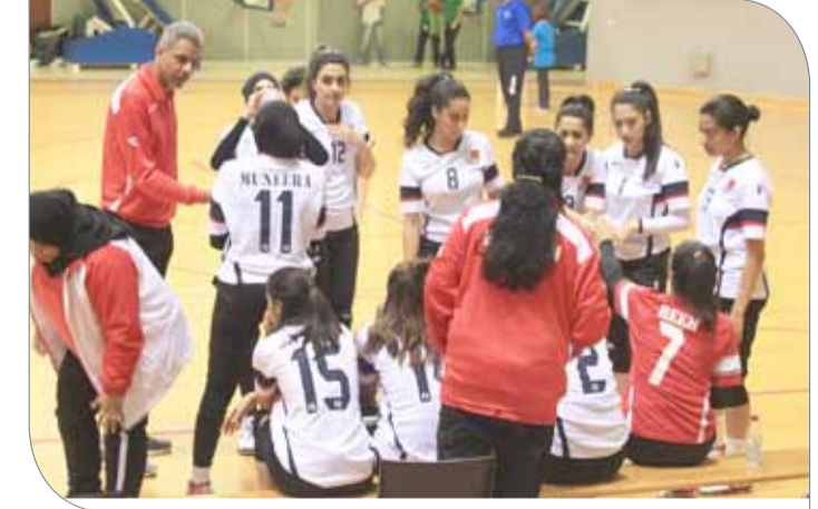
فتيات الطائرة ينطلقن للميدالية الفضية

وأضاف الهدار "لم تقدم لاعباتنا أدائهن الحقيقي في المواجهة الافتتاحية أمام الإمارات تماماً، ولقد عمدنا إلى تصحيح بعض الأخطاء عقب المباراة بالنسبة لاستقبال الكرة الأولى والاستفادة من الكرات المرتدة (الجانس بول)". وقال الهدار بأن اللاعبات لديهن جميع مقومات الفوز في مواجهة اليوم متمنياً بأن يتمكن من الفوز للحصول على المركز الثاني وتحقيق نتيجة أفضل من النسخة الماضية التي حقق خلالها المنتخب المركز الثالث.