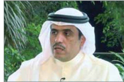
• وزير الإعلام

● مجهولون يقودون حملة ضد الوزارة بـ "السوشيل ميديا"