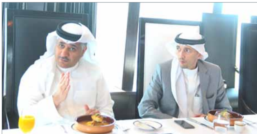
• الوزير متحدثاً في اللقاء

النامية - فلك للاستشارات: أكد وزير المواصلات والاتصالات كمال بن أحمد أهمية الشراكة بين القطاعين الخاص والحكومي لتحقيق المزيد من التنمية والتطوير، مشيراً إلى أن هناك العديد من المشاريع المشتركة بين القطاعين في مجالات تطوير المواصلات والاتصالات والبنية التحتية.