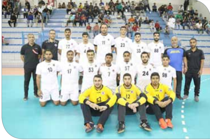
فريق باربار لكرة اليد

في اللقاء الأول، وعطفاً على مستويات ونتائج الفريقين بالجولات السابقة وللأسماء التي يمتلكها كل من توبلي (3 نقاط) والأهلي (9 نقاط)، فإن الأخير له الأفضلية المطلقة في تحقيق الفوز وحصد 3 نقاط ليعزز حظوظه في صدارة الترتيب التي قد ينفرد بها إذا ما سقط غريمه التقليدي النجمة أمام باربار. وتوبلي، المهمة بالنسبة صعبة وليست مستحيلة، ولكن ما يقدمه مؤخراً لا يعطي مؤشراً بحدوث شيء مخالف لما ذكرناه.