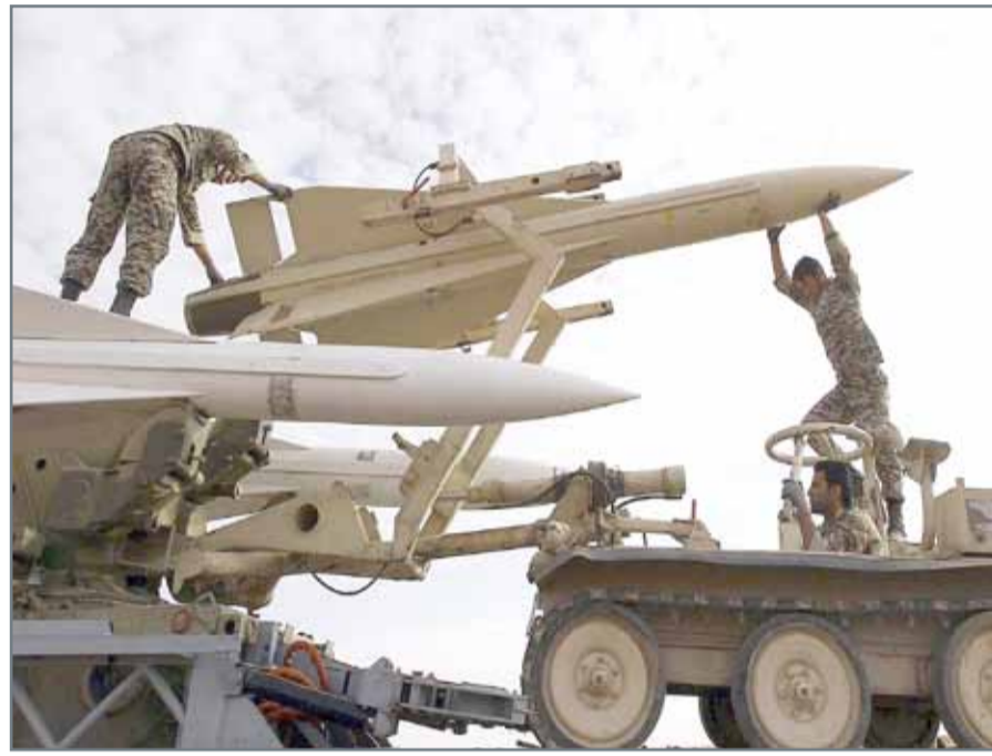
التجربة الصاروخية الجديدة تأتي في خضم توتر إيراني أمريكي حاد

عواصم. وكالات: أعلنت إيران أنها أجرت بنجاح تجربة جديدة لإطلاق صاروخ في بحر عمان، في خطوة يرجح أن تزيد قلق واشنطن التي تنشر سفنها قرب المياه الإقليمية الإيرانية، في حين رأت موسكو أن التجربة لا تعد انتهاكا لتعهدات إيران الدولية. في حين قال قائد القيادة المركزية الأمريكية الجنرال جوزيف فويتل، أمام جلسة للجنة القوات المسلحة في مجلس الشيوخ، إن إيران تمثل تهديدا طويل الأمد لاستقرار المنطقة. يأتي هذا غداة انتقاد وزارة الدفاع الأميركية (البنتاغون) السلوك "غير المهني" للبحرية الإيرانية عقب حادثتين منفصلتين في مضيق هرمز الأسبوع الماضي. وفي تعليقه على الحادثتين، أوضح المتحدث باسم البنتاغون النقيب جيف ديفيس الثلاثاء أنه "تم تقييم (ما حصل) على أنه مزيج من السلوك غير الآمن وغير المهني".