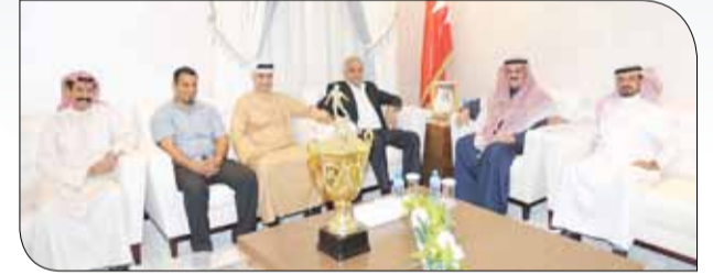
جانب من الاستقبال

استقبل رئيس مجلس النواب أحمد الملا اللجنة المنظمة لبطولة مجلسي الشورى والنواب الحادية عشرة لكرة القدم للعهدة والولاء للوطن 2017، والتي تنظمها وتشرف عليها مفروشات أحمد شريف، وأشاد بالجهود الكبيرة التي يبذلها أعضاء اللجنة من أجل تطوير البطولة عاماً بعد عام، وهو ما أدى لاستمرارها للنسخة الحادية عشرة على التوالي، جاء ذلك بحضور النائب البرلماني إبراهيم الحمادي رئيس لجنة الشباب والرياضة بمجلس النواب.