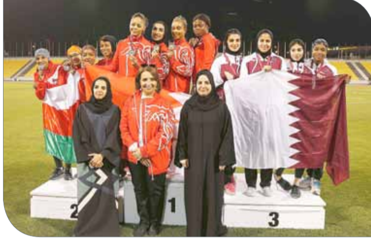
جانب من التتويج