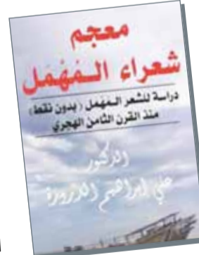
• غلاف الكتاب

ما زال الكاتب السعودي الدكتور علي بن إبراهيم الدرورة يحتل المقام الأول بين الأدباء السعوديين وللمعالم الخامس على التوالي من حيث تعدد وتنوع الإصدارات الثقافية.