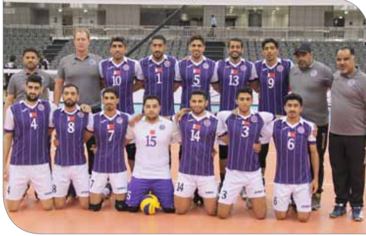
فريق داركليب لكرة الطائرة

وتابع: "المنافسة ستكون قوية لأن هناك 5 أندية ترغب في تحقيق اللقب، وما أتمناه هو أن نكون في أفضل حالاتنا حتى نحرز اللقب الخليجي للمرة الأولى في تاريخ القلعة الصفراء".