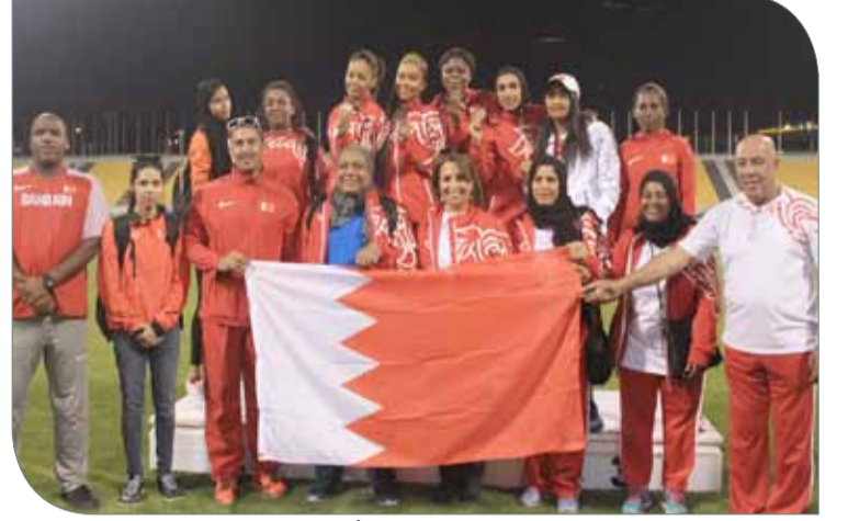
البعثة تحتفل بالفوز ورفع علم المملكة