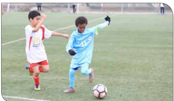
من مباريات دوري البراعم

نقطة، الأهلي والمحرق والمنامة 13، قلالي 9، سترة 5، البديع 4، ومدينة عيسى صفر. والمجموعة الثانية: النجمة 15، الرفاع 15، الحد 13، الرفاع الشرقي 11، البحرين والبستين 9، المالكية والحالة 8، والاتفاق صفر.