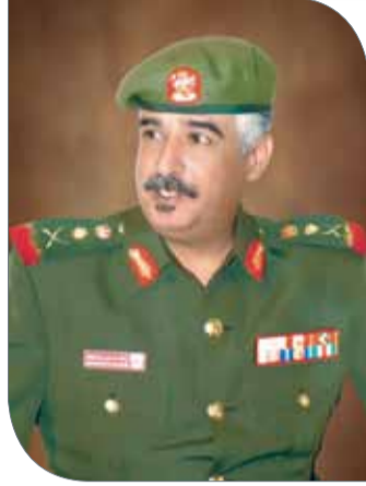
سمو الشيخ محمد بن عيسى