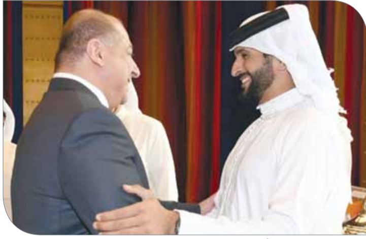
سمو الشيخ ناصر بن حمد مستقبلا الفائزين بالمراكز الأولى

مهدت الطريق لتحقيق المركز الأول عربيا وخليجيا". وفي شأن تحقيق نادي المنامة للقب كأس جلالة الملك لكرة القدم قال سموه "نهنيئ فريق نادي المنامة بمناسبة فوزه ببطولة أعلى الكؤوس للمرة الأولى في تاريخ النادي، الذي يعتبر من الأندية الوطنية التي دائما ما تسعى إلى التطوير المستمر، وهو الأمر الذي جعله يحقق لقب كأس الغالي بعد مستويات كبيرة قدمها لاعبو الفريق وإصرارهم على طباعة اسم نادي المنامة في سجلات الأندية الحاصلة على اللقب وسط دعم