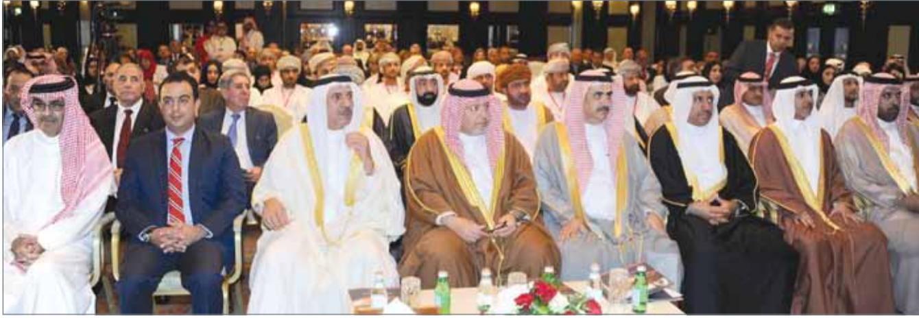
• وزير العدل مفتتحاً مؤتمر المحامين العرب

المنامة - بنا: أناب رئيس الوزراء صاحب السمو الملكي الأمير خليفة بن سلمان آل خليفة، وزير العدل والشؤون الإسلامية والأوقاف الشيخ خالد بن علي آل خليفة لافتتاح أعمال المكتب الدائم لاتحاد المحامين العرب، الذي عقد أمس برعاية صاحب السمو الملكي رئيس الوزراء تحت عنوان "أمن الخليج العربي جزء لا يتجزأ من الأمن القومي العربي". وفي بداية الاجتماع، أعربت رئيس جمعية المحامين البحرينية رئيسة لجنة المرأة باتحاد المحامين العرب هدى المهزوع عن خالص شكرها وتقديرها لرئيس الوزراء صاحب السمو الملكي الأمير خليفة بن سلمان آل خليفة، على رعايته المؤتمر ودعمه المتواصل لمهنة المحاماة والمحامين.