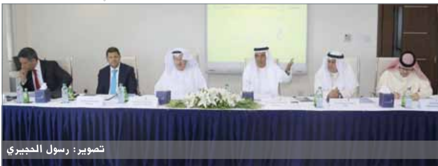
أثناء الجمعية العمومية

وقال إن الأرباح الفنية بلغت في نهاية العام 1.76 مليون دينار بالمقارنة مع 3 ملايين دينار في العام 2015. ويأتي هذا الانخفاض بسبب احتساب مخصصات إضافية في قسم تأمين السيارات؛ وذلك لمواجهة المطالبات غير المبلغ عنها بناء على تقرير الخبير الاكتواري الخارجي، والتي بلغت ما يقارب 953 ألف دينار. وعن تطلعاته للعام 2017، قال إن التوقعات تشير إلى أن العام 2017 سوف يكون عاماً صعباً على القطاع المالي عموماً وقطاع التأمين خصوصاً، وأضاف "عقدنا العزم على مواجهة هذه التحديات وسوف نقوم بمضاعفة الجهد لتنفيذ الأهداف التي وضعناها مسبقاً؛ لتحقيق أفضل عائد ممكن للمساهمين".