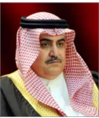
• وزير الخارجية

بيدها البلدان لتنمية مجالات التعاون الثنائي وتوسيع مدامها، وتعزيز التنسيق والتشاور تجاه مختلف القضايا التي تهمهما وتدعم مصالحهما. وأثنى وزير الخارجية على الدور المحوري الذي تقوم به الولايات المتحدة في التعامل مع مختلف التحديات الإقليمية والدولية وفي دعم الحرب الدولية ضد الإرهاب، وضمان الاستقرار في المنطقة، مؤكداً موقف مملكة البحرين الداعم لهذه الجهود.