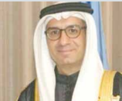
• عبدالله الدوسري

المنامة - وزارة الخارجية، ترأس مساعد وزير الخارجية عبدالله الدوسري أمس الاجتماع الثاني المتعلق بمتابعة إعداد تقرير مملكة البحرين بشأن حقوق الطفل، وحقوق الأشخاص ذوي الإعاقة.