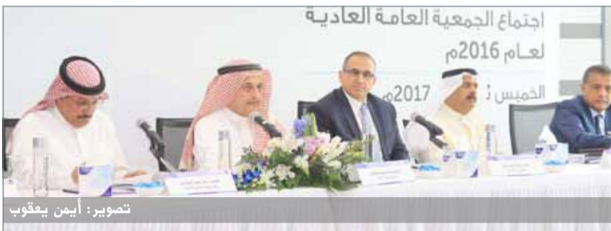
من اجتماع الجمعية العامة العادية

ووافقت الجمعية العامة العادية للبنك اعتماد توصية مجلس الإدارة بتخصيص صافي أرباح السنة الماضي كالتالي: تحويل مبلغ وقدره 842,144 ديناراً إلى الاحتياطي القانوني، توزيع أرباح نقدية على المساهمين قدرها 5,051,007 دينار، أي ما يعادل 5% من رأس المال المدفوع بواقع 5 فلوس للسهم الواحد وتحويل مبلغ 2,391,656 ديناراً إلى الأرباح المستترة.