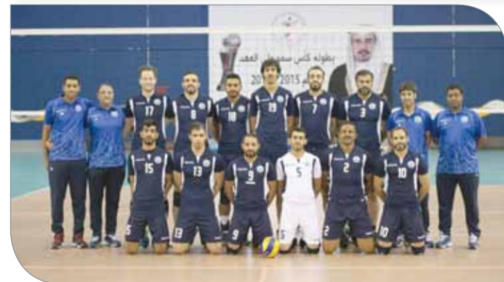
فريق البسيتين لكرة الطائرة