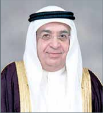
• سمو الشيخ محمد بن مبارك

رسالة مملكة البحرين الإنسانية للعالم عبر دعم أي جهد وخدمة إنسانية تهدف للتخفيف من معاناة الإنسان أينما وجد وفي مختلف المجالات الإنسانية. بعد ذلك ناقش المجلس الترتيبات اللازمة لحفل توزيع الجائزة في دورتها الثالثة 2017، إذ اطلع المجلس على فيلم وثائقي جديد يجسد حياة سمو الأمير الراحل، إذ أبدى المجلس تقديره وملاحظاته تجاه الفيلم والمادة الوثائقية المستخدمة في إعداده وإخراجه.