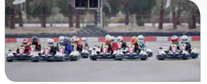
جانب من سباق موجو ماكس للكارتنج