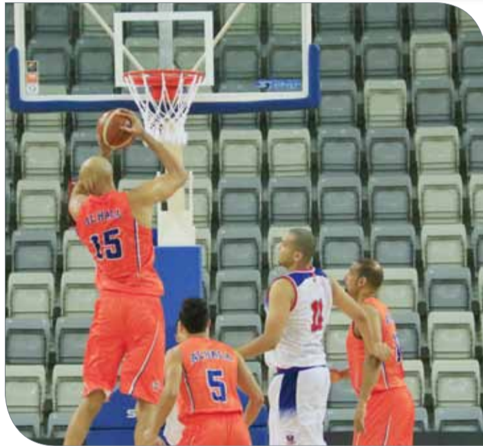
من لقاء الفريقين بالجولة الأولى

الاستغناء عن خدمات المدرب السابق الصربي دراغان راكا. وستقع على عاتق ميلاد اليوم مسؤولية كبيرة في تهيئة الظروف المناسبة للاعبين؛ من أجل خوض هذا اللقاء بكل روح وقوة بهدف الظفر بالمباراة.