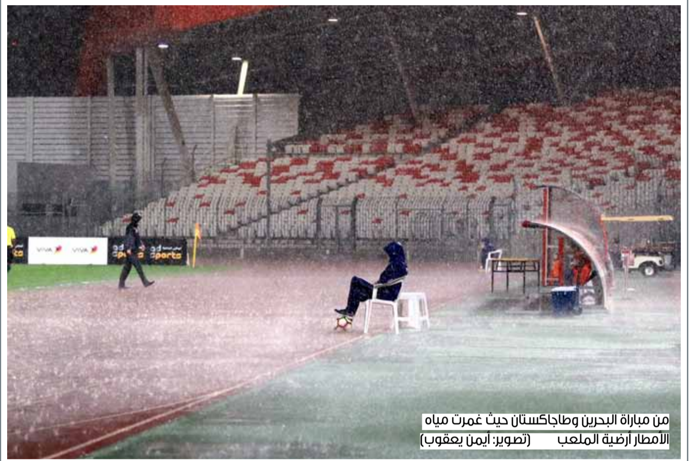
من مباراة البحرين وطاجكستان حيث غمرت مياه الأمطار أرضية الملعب

وقدم الباحثون النتائج التي توصلوا إليها في دراسة نشرت، الأربعاء، في مجلة الطب الانتقالي العلمي.