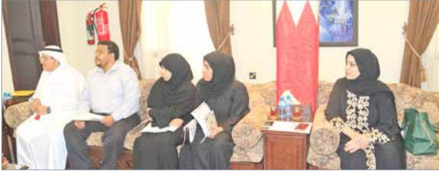
• أعضاء جمعية الكوثر

بالتعاون مع الجمعية في فعالياتها المقبلة، مقدما المختلفة خصوصا العطاء لليتيم، وأشاد محافظ الشمالية بالدور الذي تقوم به الجمعية ومساهماتها في الشراكة الاجتماعية مرجحا الشكر لهم على جهودهم التي تسهم في إثراء الشراكة المجتمعية.