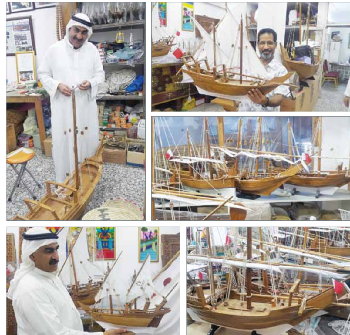
مجموعة من السفن

وإستخدم أيضاً المسامير والفيتل والدامر والصلل والحبال وغيرها من الأدوات التي تدخل في صناعة السفن الأصلية والكبيرة.