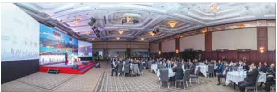
• جانب من المشاركين في المنتدى

التركية رفعت هيسار جيكي إن قوة الاقتصاد التركي تعتمد على القطاع الخاص بشكل أساس، مضيفاً أن تركيا نجحت في العام الماضي في زيادة حجم الصادرات بنسبة 4%. وأضاف أن نسبة الاستثمارات بتركيا ارتفعت بعد عملية الانقلاب الفاشلة مما يثبت قوة وديناميكية الاقتصاد التركي، مشيراً إلى تأسيس 5390 شركة أجنبية في تركيا خلال العام الماضي، إذ يبلغ إجمالي عدد الشركات الأجنبية في تركيا حوالي 46 ألف شركة. ويهدف المنتدى إلى تعزيز ثقة المستثمرين في السوق التركية ولا سيما في تعزيز التعاون في مجالات العمل المصرفي والتمويل والمقاولات.