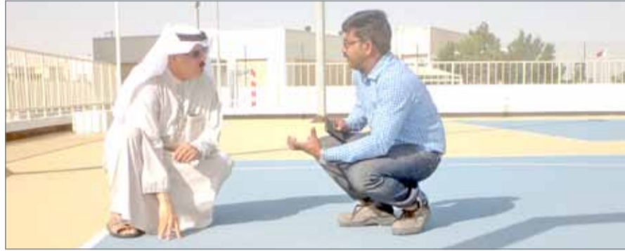
• وزير التربية لدى تفقده عددا من المدارس الجديدة

ومتطور، بحيث تتكون المدرسة من مبنى واحد بالشكل العمودي، يحوي 30 إلى 47 فصلاً دراسياً، تستوعب 1000 إلى 1600 طالب، مع توفير مصاعد كهربائية، ونظام تكييف مركزي، وخدمة الإنترنت "واي فاي"، ومختبرات علمية متطورة، وصلات متعددة الأغراض، ومرافق متكاملة للمباني الإدارية والتعليمية، مع مراعاة متطلبات الطلبة ذوي الاحتياجات الخاصة كافة.