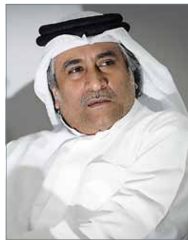
• مؤسس المردي

ويشارك المردي في الجلسات الافتتاحية والرئيسة للمنتدى، حيث يتحدث عن موضوع "التدخلات الإيرانية في الشؤون البحرينية"، وستتم في المنتدى مناقشة عدة موضوعات ذات الصلة.