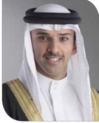
الشيخ علي بن خليفة

نظمها الاتحاد بحضور مدربي وممثلي الأندية. وشدد رئيس اتحاد الكرة على ضرورة عرض محاور الإستراتيجية والتوصيات المذكورة في هذا الصدد على رؤساء مجالس إدارات الأندية الأعضاء؛ بهدف المناقشة، واتخاذ القرارات المناسبة لتطوير المسابقات. وبناء على ذلك، فقد قرر مجلس إدارة الاتحاد البحريني لكرة القدم دعوة رؤساء مجالس إدارات الأندية الـ 19 المنضوية تحت مظلة الاتحاد؛ لحضور اجتماع خاص بالموضوع المذكور؛ لمناقشة إستراتيجية تطوير المسابقات المحلية للفترة (-2017). (2020)