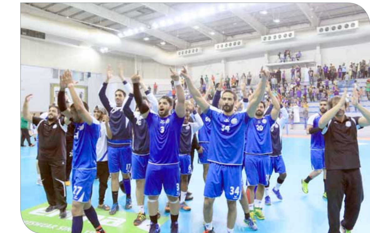
جانب من الفرقة

وقال الشنو الذي يعتبر أول بحريني وخليجي يتبوّأ رئاسة المجلس الرياضي العسكري في تقديره بنها عبر حساباه الخاص على تويتر “سأجد عضوية سوريا إذا لم يتحرك مجلس الأمن جدياً.. فالأطفال والشعب يقتلون بدم بارد بالكيمايو كاشترات.. لا تزيد أن تشارك العالم ما ير به من منعطف أخلاقي خطير..” يذكر أن المجلس الدولي للرياضة العسكرية الذي يعرف اختصاراً بـ “السيريز” عبارة عن اتحاد رياضي مؤلف من الكوالات المسلحة في الدول الأعضاء التي توافق عليها الجمعية العمومية ويسمح لكافة الدول الانضمام إلى السيريز والهدف من هذا الكيان هو تعزيز المنافسة الرياضية والتربية البدنية بين القوات المسلحة في مختلف دول العالم كوسيلة لتعزيز السلام العالمي، ويتجسد هذا الهدف في شعار السيريز (الصداقة عبر الرياضة)، وتهدف الأحداث الرياضية والاجتماعات التي يتم تنظيمها إلى الثقة الرياضيين من كافة القوات المسلحة في العالم للاحتفال بالسلام العالمي بروح الصداقة الميمرة والتضامن الذي يجمع كافة الدول الأعضاء في السيريز. ومنذ أن فاز مرشح مملكة البحرين المقدم الركن عبدالحكيم الشنو بمنصب رئيس المجلس الدولي للرياضة العسكرية (السيريز) في الانتخابات التي أقيمت عام 2014 بالمصانة الأكوادورية كويتو إثر حصوله على 44 صوتاً مقابل 26 صوتاً للمرشح الأوروبي الذي العقيد الركن ميسود سيريت في إنجاز تاريخي يحسب للبحرين والعرب في شرف رئاسة هذه المنظمة العالمية التي تعني بالرياضة العسكرية فإنه يندل جهوداً كبيرة في سبيل تعزيز السلام من خلال الزيارة وأنشطته وبرامجه التي يقوم بها من حين لآخر.