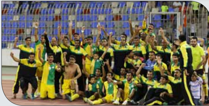
فرحة ملكاوية بالصدارة