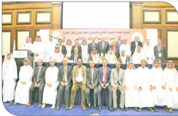
صورة جماعية للمشاركين في اجتماع الجمعية العمومية