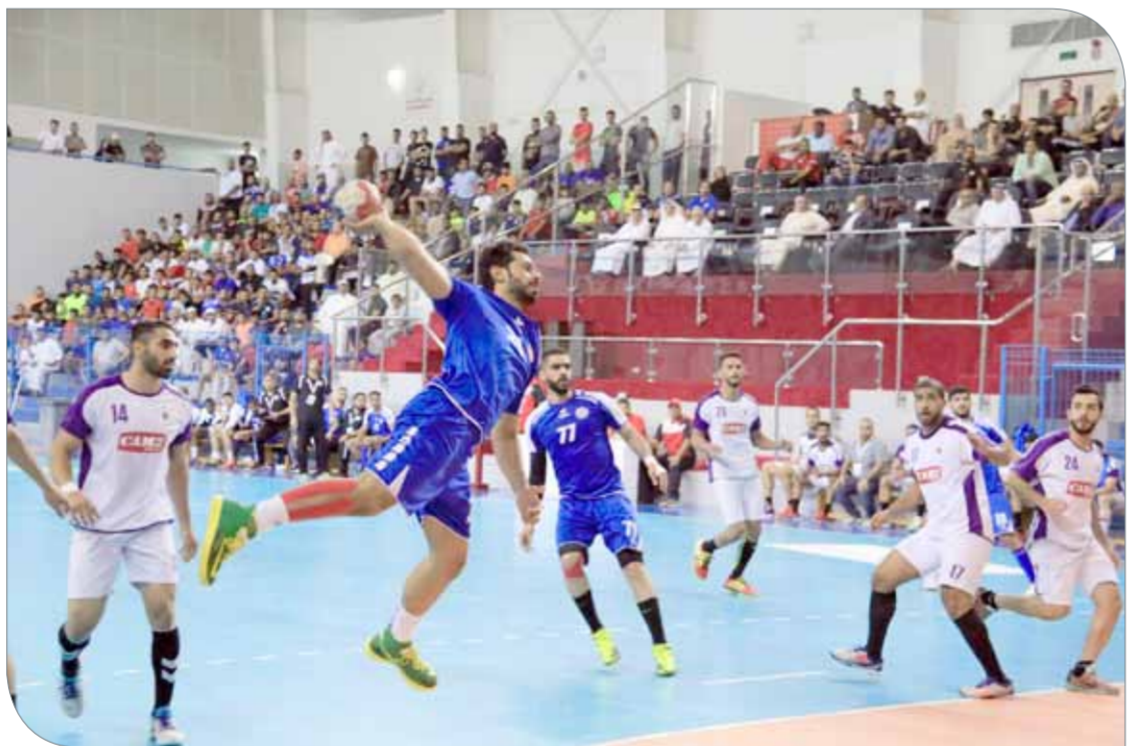
من لقاء باربار والنجمة