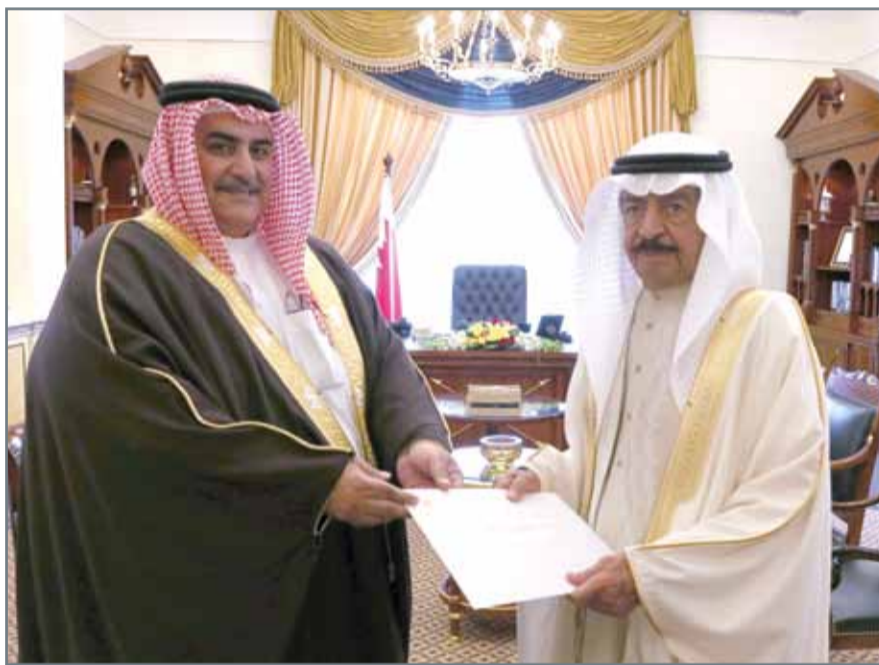
• سمو رئيس الوزراء لدى تسلمه دعوة الأمين العام لجامعة الدول العربية من وزير الخارجية

وخاصة القول، إن جامعة الدول العربية بمنحها ”درع العمل التنموي“ صاحب السمو الملكي رئيس الوزراء، فإنها بذلك تسلط الضوء على نموذج مضيء في مجال العمل التنموي بشكل القدوة والمثل، وعامل تحفيز وتشجيع في دعم العمل العربي المشترك والاهتمام بقضايا التنمية وخدمة الإنسانية، وإن رمزية منح سموه ”درع العمل التنموي“ هو تقدير عربي من ”بيت العرب“ جميعاً لسموه، ويجسد في الوقت ذاته ما يولييه سموه من دعم لجهود المجتمع الدولي في مجال التنمية المستدامة ومبادراته في هذا المجال، ومنها الجائزة الدولية التي خصصها سموه وتحمل اسمه ”جائزة الأمير خليفة بن سلمان للتنمية المستدامة“، والتي شكلت عنصراً دفعاً للقيام بأعمال نبيلة عبرت القارات دعماً للعمل الإنساني والتنموي التي يؤمن بها سموه، مما أعطى مملكة البحرين سمعة دولية، ووجهت البحرين من خلالها رسالة إلى العالم بأنها تشجع على البناء والتنمية.