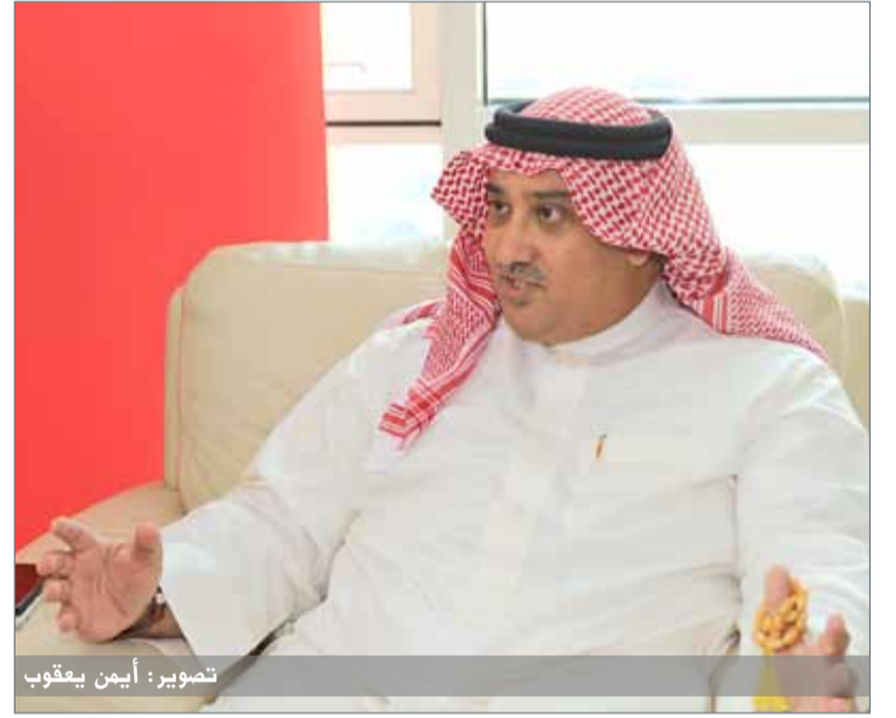
المدير العام لمعهد الإدارة العامة في حوار مع "البلاد"