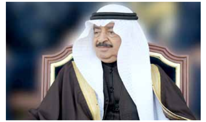
بقلم: الدكتور عبدالله الحواج

قال رئيس مجلس بلدي المحرق محمد آل سنان إن وزارة العمل والتنمية الاجتماعية وافقت على إنشاء دار رعاية للوالدين في مجمع 204 بالمحرق. وبين أنه تم رفع الطلب لوزير العمل والتنمية الاجتماعية جميل حميدان خلال اللقاء الذي جمعه مع وفد من المجلس مؤخراً ولاقى موافقة وترحيباً منه. وكشف آل سنان لـ "البلاد" عن اتفاقه مع الوزارة لتقديم الكثير من طلبات التوظيف التي ترد للمجلس البلدي بشكل يومي لمختلف التخصصات. وأوضح "تم عرض السير الذاتية