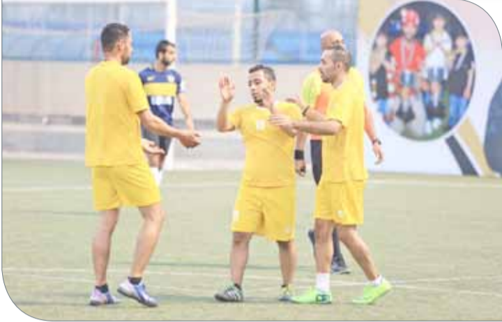
فرحة إحداهم الفرق بالفوز في خماسيات كرة القدم

بلوغ مباريات كل دور من الأدوار النهائية، والشركة المنظمة تسعى من خلال شراكتها وتعاونها اللامحدود مع اللجنة المنظمة العليا لـ "ناصر 10"؛ لإبراز هذه البطولة بما يتناسب وتطلعات سمو الشيخ ناصر بن حمد آل خليفة؛ لتحقيق الأهداف لنجاح هذا الحدث.