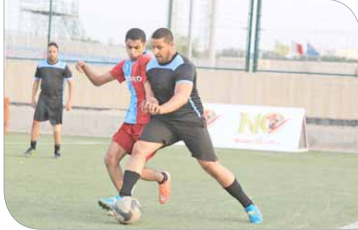
جانب من مباريات اليوم الرابع لخماسيات كرة القدم

النهائية، حيث سيتم توزيع 70 دينارا على كل فريق نجح في الوصول لمنافسات دور الـ 16، وسيتم توزيع مبلغ 105 دنانير لكل فريق يستطيع التأهل لمباريات دور الثمانية، وتم تحديد مبلغ 175 لكل فريق ينجح في الوصول للدور قبل النهائي، وهذه الخطوة تأتي تشجيعاً للفرق التي استطاعت