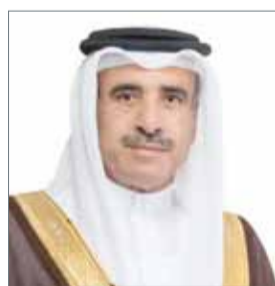
• وزير الإسكان