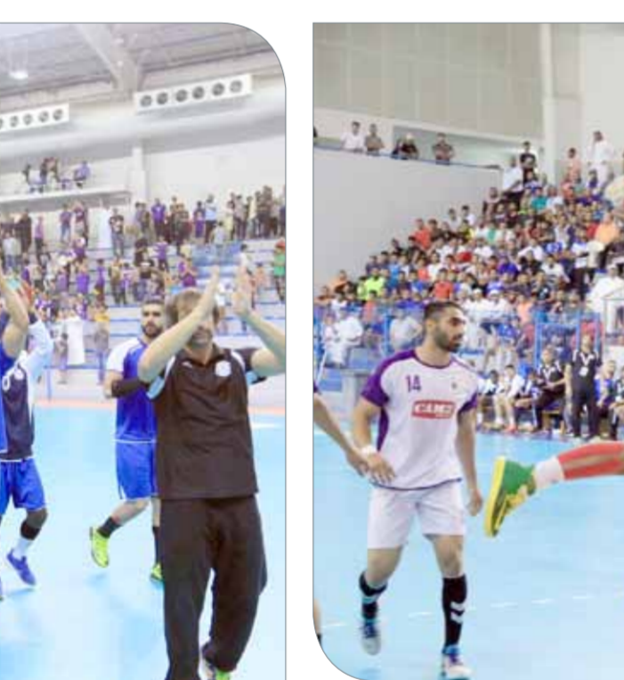
من لقاء باربار والنجمة