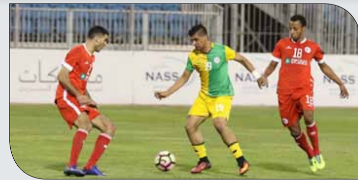
من اللقاء

فردان، إلا أن الكرة وجدت تألق الأخير الذي أبعد الخطر عن مرماه (44). وبينما الشوط يتجه لنهايته، حاول الملكاوي سيد علي عيسى بكرة سددها من جهة اليسار، إلا أنها مرت جوار القائم الأيسر (45+2).