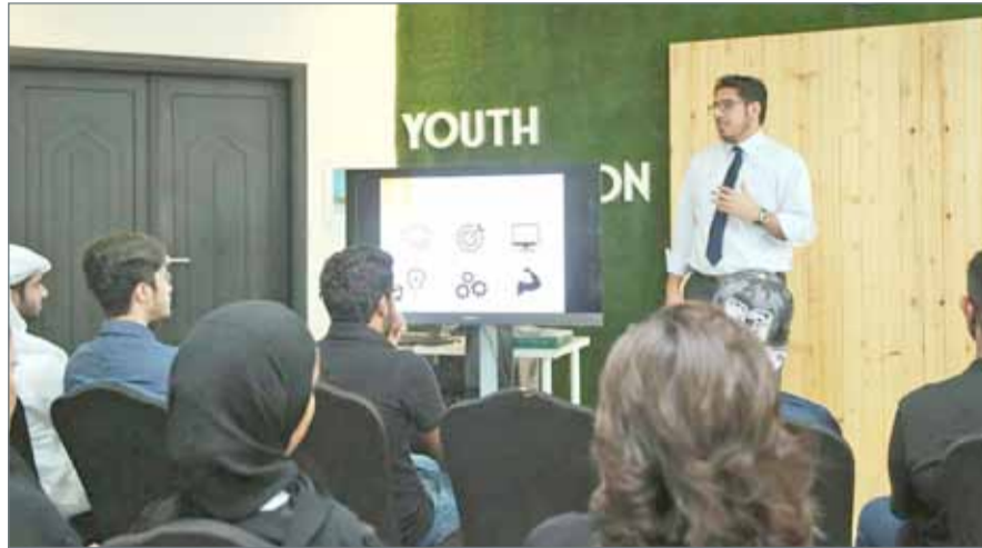
• طلبة رايات أثناء إحدى ورش العمل

سيشاركنا الملتقى نخبة من القاديين في المجتمع لتشجيع الشباب ليكونوا فاعلين في المجتمع مثل وزير الخارجية الشيخ خالد بن أحمد بن محمد آل خليفة، ووزير شؤون الشباب والرياضة هشام الجودر، والعديد من الشخصيات المؤثرة في المجتمع من مملكة البحرين ودول مجلس التعاون.