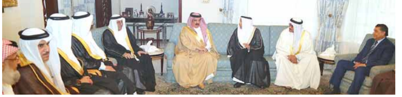
جلالة الملك يقدم التعازي إلى عائلة الفقيه محمد يوسف جلال