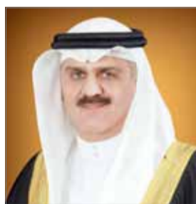
• رئيس مجلس النواب

الوقت ذاته دوركم البارز على الصعيد الدولي وما تشكله شخصيتكم الدولية من مكانة استحققت كل هذا التكريم الذي يشعرون بالفخر. اسمح لي يا صاحب السمو أن أعبر بهذه المناسبة عن حبنا وتقديرنا في جمعية ميثاق العمل الوطني التي يكن أعضاءها كافة كل الامتنان والتقدير لسموكم ويسعدكم كل ما تحققونه من مكانة عالية يعود خيرها على البحرين وطناً وشعباً. وإننا في جمعية ميثاق العمل الوطني نعبر لكم عن سعادتنا بهذا التكريم الذي هو شرف لبلادنا ونيابك منكم درع العمل التنموي الذي يعكس إنجازات سموكم حفظكم الله في جعل البحرين نموذجاً للدولة الحديثة وهذه المكانة المتميزة التي تحتلها المملكة بين الأمم بفضل جهودكم المتواصلة في القيادة الحكيمة.