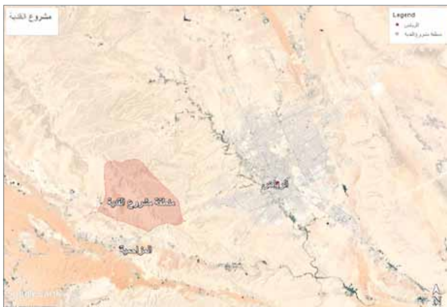
• موقع المدينة الترفيهية

ومن المتوقع أن يضم المشروع مدينة (Six Flags) الترفيهية كأحد عناصر الجذب الرئيسة في المشروع. وتوقع الأمير محمد بن سلمان أن يحقق المشروع منافع اقتصادية واجتماعية قيمة؛ بوصفه أفضل الوجهات الترفيهية المهمة التي تقدم خيارات متنوعة تجذب العائلات للاستمتاع بقضاء أجمل الأوقات، وذلك من خلال توفير أنشطة رياضية متميزة تدعم طاقات الشباب وتحفزهم على التميز في المسابقات الرياضية الإقليمية والعالمية، واكتشاف المواهب وتطويرها، وصقل مهارات الشباب السعودي وتنمية قدراتهم في مختلف المجالات الرياضية والتعليمية.