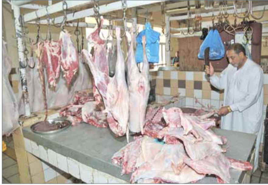
• ارتفاع أسعار اللحوم إلى 2.2 دينار للكيلو مقارنة بـ 1.8 دينار العام الماضي

وأوضح أن رفع الدعم خلق سوقا تنافسية وتجارب لدى المواطنين الذين يبحثون عن الأرخص حتى وإن لم يكن مطبياً.