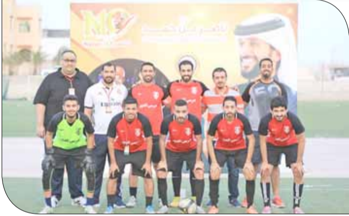
من منافسات الدور التمهيدي للبطولة

نصف النهائي ومباراة تحديد المركزين الثالث والرابع والمباراة النهائية يوم غد الأربعاء. ومن المتوقع أن تشهد مواجهات الدور النهائية إثارة كبيرة في ظل تقارب المستويات الفنية بين الفرق بحسب ما أظهرته مباريات المرحلة الأولى من البطولة، إضافة إلى الرغبة الجامحة منها في الوصول لأبعد نقطة في البطولة، إلى جانب ما تمتلكه من خامات وإمكانات فردية ظهرت في المرحلة السابقة.