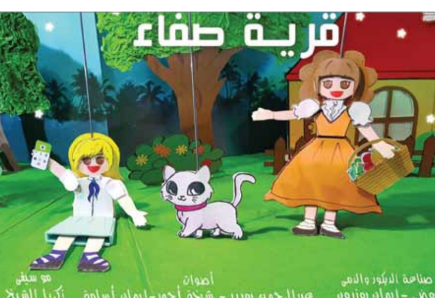
صاحبة الأوبرا والدمى عباد الرحمن بوبر - قرية صفاء - إيمان أحمد جاسم