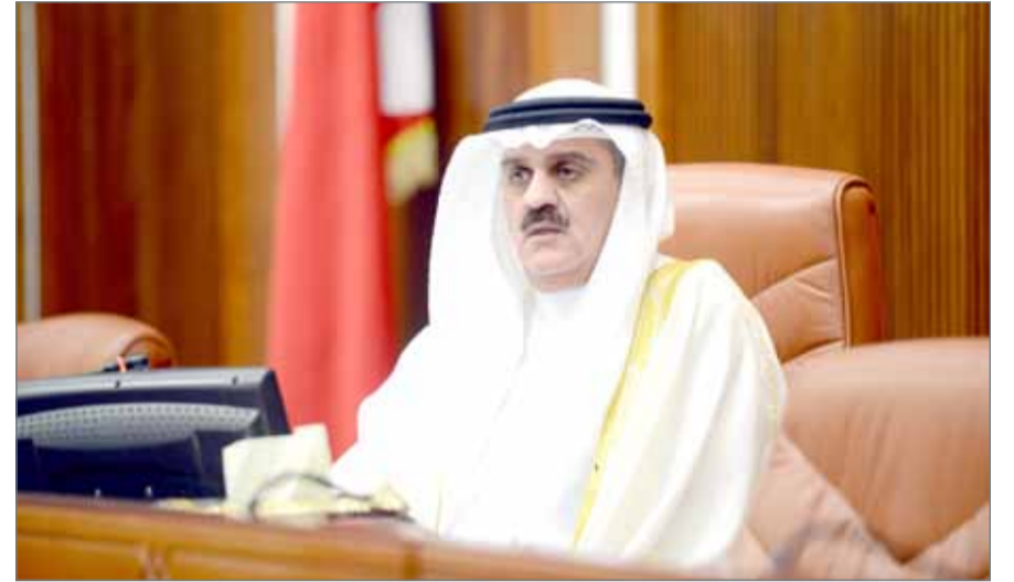
• أحمد الملا

يتجه مجلس النواب لإقرار تعديل تشريعي بقانون العقوبات العسكري يجيز محاكمة الإرهاب أمام القضاء العسكري، وذلك بجلسته الأسبوعية المقررة نهار اليوم برئاسة أحمد الملا. ويأتي هذا التشريع من بعد إجازة التعديل الدستوري الأخير الذي مد من اختصاص القضاء العسكري، والذي أقره مجلسي النواب والشورى، وصدق عليه جلالة الملك. ومن المقرر من بعد إقرار التعديل التشريعي بجلسة المجلس المنتخب نهار