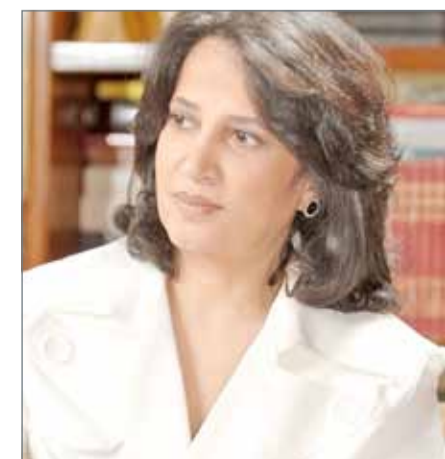
• الشيخة مي بنت محمد

التواصل معه بما يرتقي مجتمعاتنا، فالثقافة بوابة للتنمية في كل النواحي الاجتماعية منها والاقتصادية". وأشادت بجهود دولة الإمارات العربية في الترويج لغنى الثقافة العربية التي يحق للجميع أن يفخر بها، مشيرة إلى تكامل هذه الجهود بما تبذله على ذات الصعيد مملكة البحرين من صناعة حراك ثقافي يشكل نقطة جذب حضاري إلى المنطقة كلها. ونوهت بأن هيئة الثقافة تعمل حالياً على التحضير لإطلاق برنامج سنة 2018، حيث تكون مدينة المحرق عاصمة للثقافة الإسلامية ويستكمل العمل في طريق اللؤلؤ المسجل على قائمة التراث الإنساني العالمي لمنظمة اليونسكو.