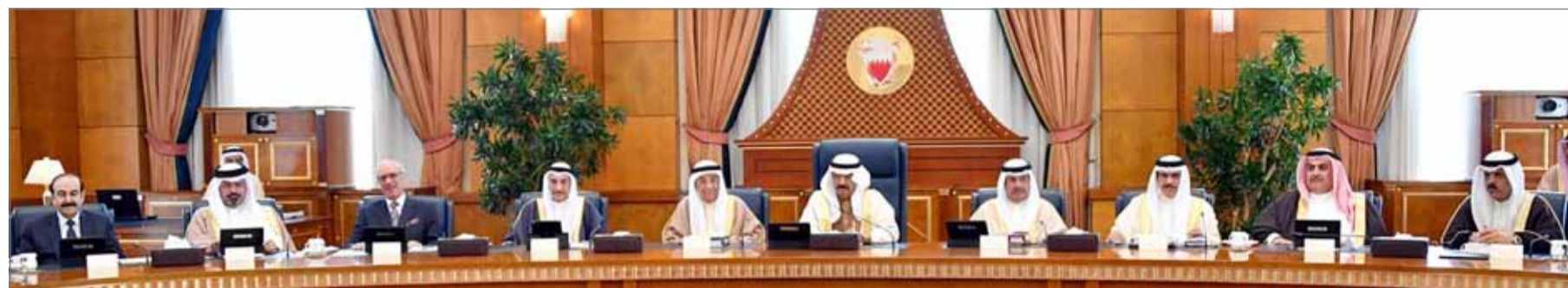
• سمو رئيس الوزراء متراساً جلسة مجلس الوزراء أمس

سموه يؤكد أن جائزة الدرع التنموي جاءت بفضل الشعب • الإرهاب الأسود لن ينجح في النيل من قوة الوحدة في مصر