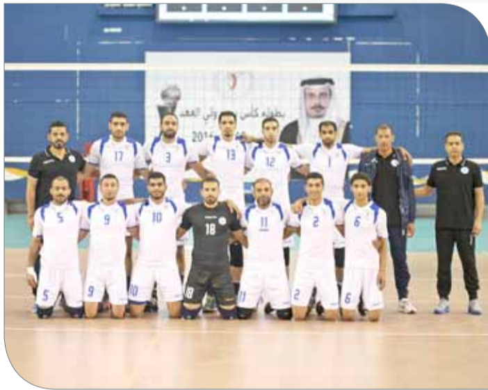
فريق النصر لكرة الطائرة