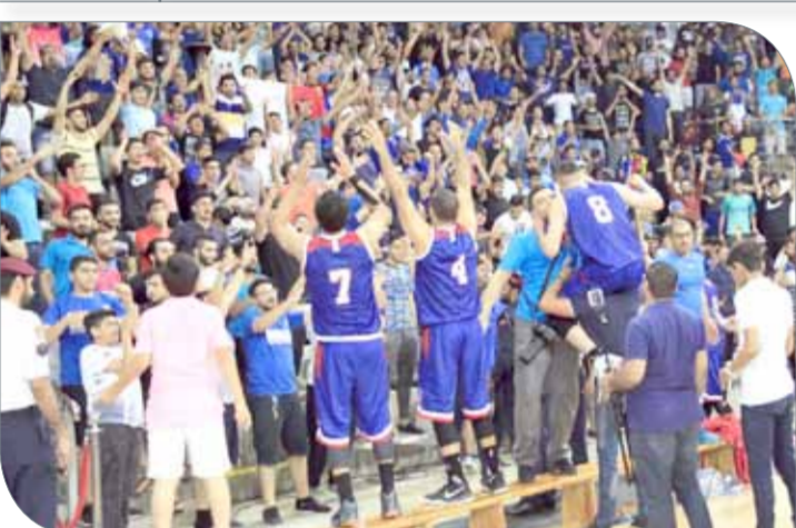
من فرحة المنامة بالفوز أمس