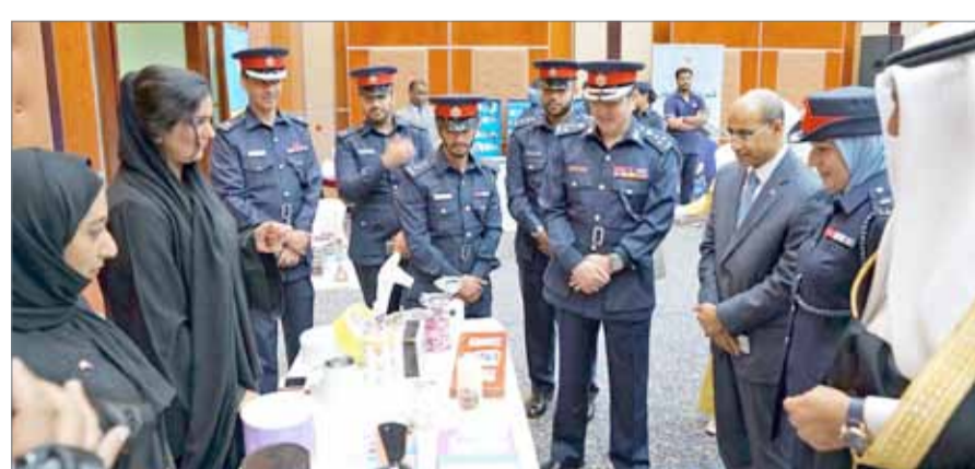
• إدارة الشؤون الصحية والاجتماعية بوزارة الداخلية تحتفل بيوم الصحة العالمي

وأشارت إلى أن الفعالية، نجحت في جمع كل المتخصصين والمهتمين بمرض الاكتئاب، وتميزت هذا العام بالتعاون مع برنامج منظمة الأمم المتحدة الإنمائي، مؤكداً أن إدارة الشؤون الصحية والاجتماعية تعد أول إدارة بوزارة الداخلية تتعاون مع برنامج الأمم المتحدة الإنمائي لتطبيق أهداف التنمية المستدامة ضمن الاتفاقية التي انضمت لها مملكة البحرين، حيث تختص الإدارة بتطبيق الهدف رقم 3 والمتعلق بضمان الصحة والرفاه. واشتملت الفعالية على عرض تمثيلي حي على المسرح يحاكي البيئة التي يعيشها المصاب بمرض الاكتئاب والوسائل التي يجب اتباعها في