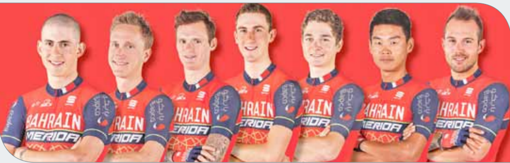
فريق البحرين ميريديا

وقال بأن مستوى المباراة كان عالياً وأنها جاءت مثل مستويات الدولة