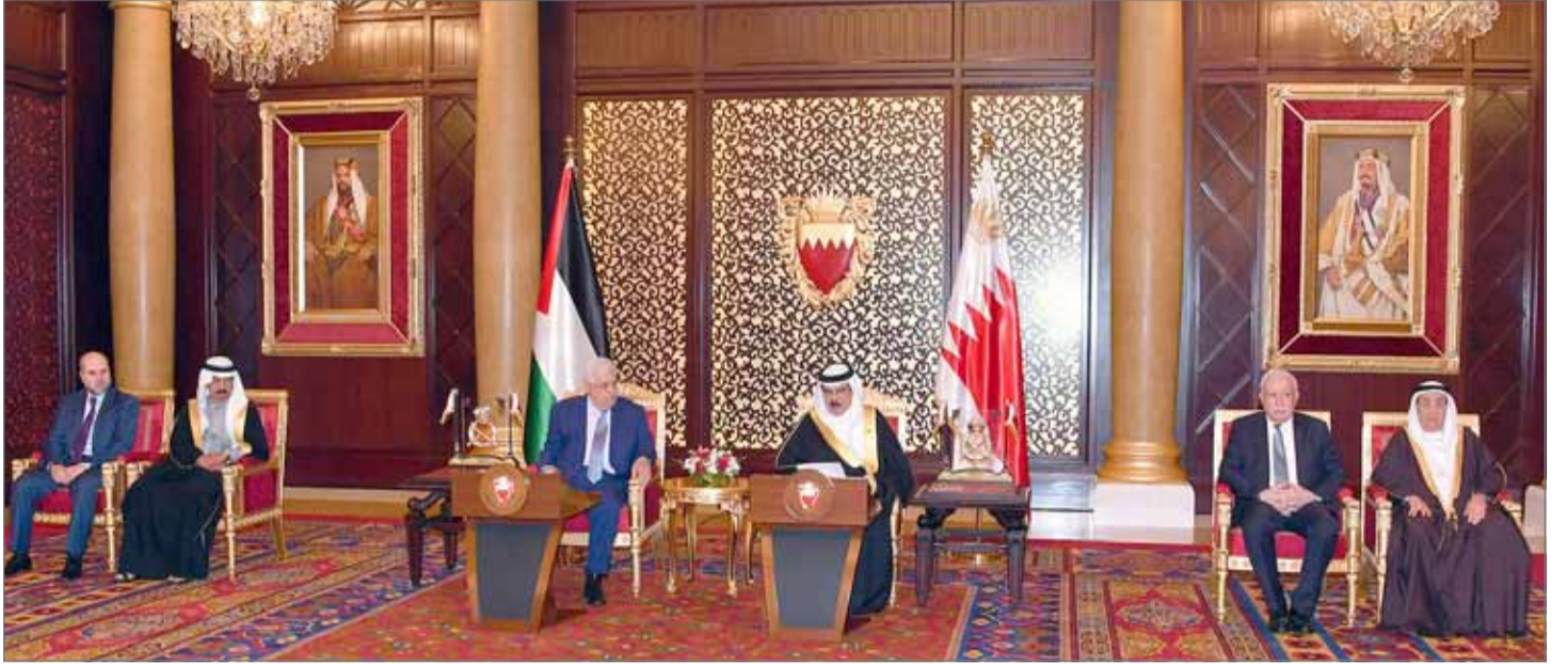
• جلالة الملك مستقبلاً الرئيس الفلسطيني