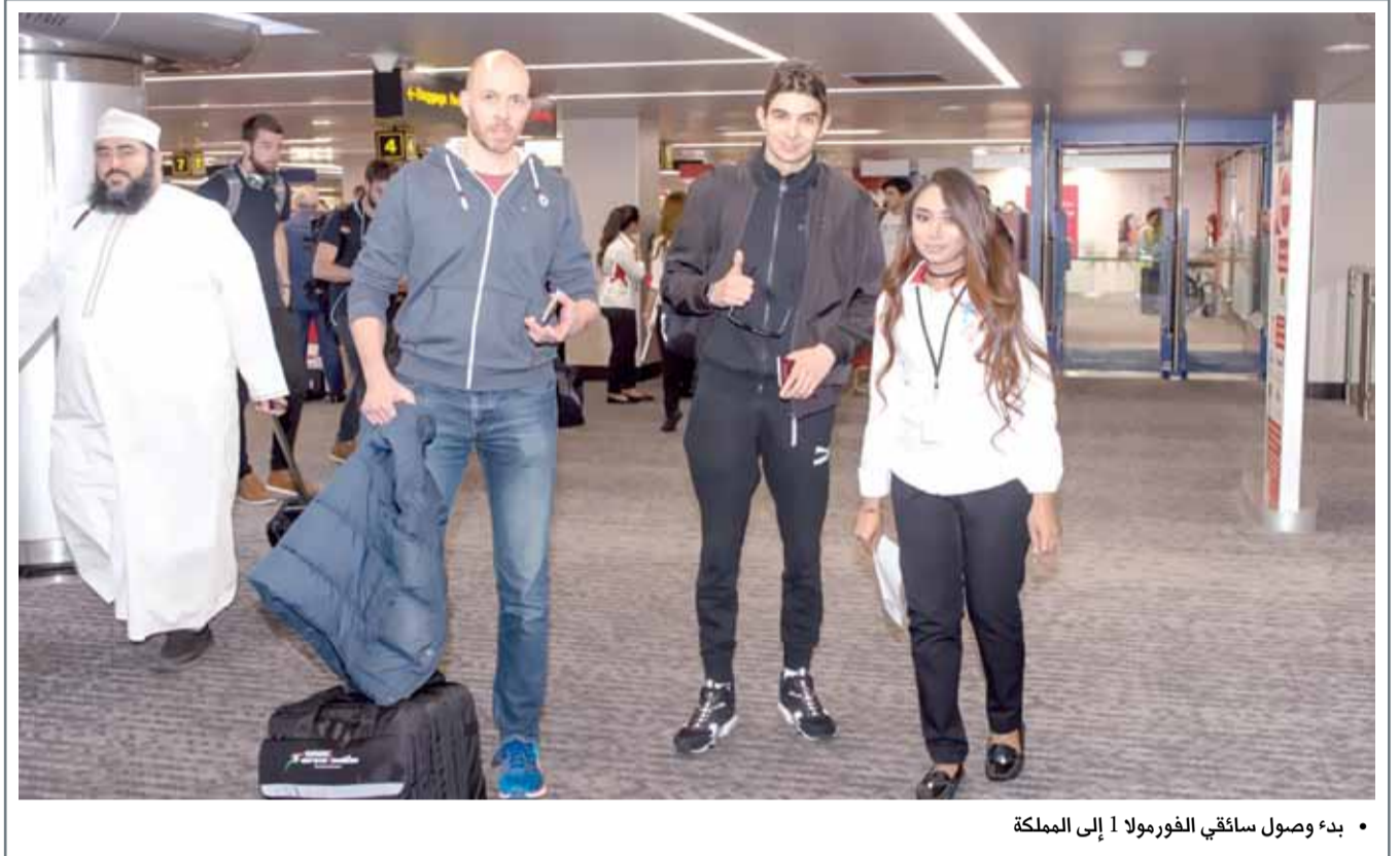
• بدء وصول سائقي الفورمولا 1 إلى المملكة

المنامة - وزارة الداخلية: ذكر مدير عام مديرية شرطة محافظة العاصمة أن شرطة المديرية، وخلال 24 ساعة، تمكنت من القبض على 3 بحريين، أبلغ أحدهم أن سيارته سرق منها مبلغ 21 ألف دينار قيمة رواتب موظفي الشركة التي يعمل فيها سابقاً، غير أنه اتضح لاحقاً اتفاقه مع آخر كان يعمل بالشركة سابقاً على تنفيذ الجريمة. وأضاف أنه فور تلقي بلاغ من السائق برقة المبلغ من السيارة تمت مباشرة عمليات البحث والتحرير والتي كشفت عن اتفاق المشتبه بهما على ادعاء الرقعة ومن ثم تقاسم المبلغ، وعليه تم القبض عليهما ومعهما شخص ثالث كان مشاركا في الواقعة. وأشار مدير عام مديرية شرطة العاصمة إلى أنه جار اتخاذ الإجراءات القانونية اللازمة تمهيدا لإحالة القضية إلى النيابة العامة.