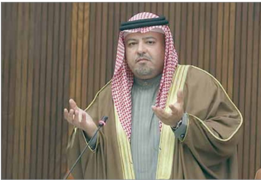
• الشيخ خالد بن علي

وأوضح وزير العدل والشؤون الإسلامية والأوقاف الشيخ خالد بن علي آل خليفة أن التعديل الوارد في مشروع قانون العقوبات العسكري جاء تنفيذاً لما ورد في التعديل الدستوري الذي تم في 30 مارس 2017. وقال الوزير للجنة الشؤون الخارجية والدفاع والأمن الوطني النيابية إن التعديل التشريعي مبني على الأصل العام وهو حماية المجتمع من الأعمال الإرهابية