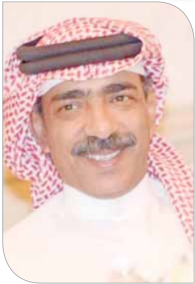
الشيخ عليه بن محمد