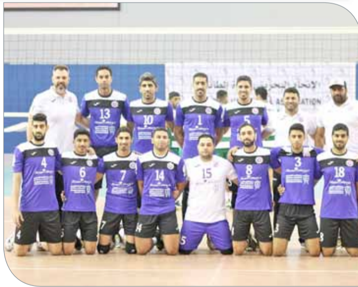
فريق داركليب لكرة الطائرة

حيث يتفوق عليه الأهلي في النقاط (31 نقطة)، أما اتحاد الريف السابع (7 نقاط) بقيادة المدرب الوطني محمد حسن بورويس فإنه سيدخل من غير ضغوط بعدما ضمن البقاء بدوري الدرجة الأولى إثر فوزه القيصري على النبيه صالح 3/2، الأمر الذي ربما يعزز حظوظه في تحقيق الفوز الذي لن يؤثر على موقع المحرق الذي ضمن هو الآخر المركز الرابع.