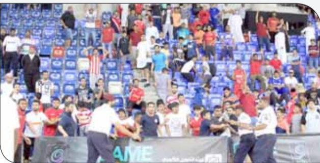
من الأحداث التي راقت المباراة

♦ خرجت بعض من جماهير الفريقين عن النص بعد انتهاء المباراة، وأخذت في تبادل تقاتف علب المياه، في تصرف مرفوض في الصالات المغلقة، ودولا تدخل العقلاء من جانب ناديين والاتحاد ورجال الأمن الذين صتمكوا من السيطرة على الوضع سريعاً قبل أن يتطور إلى ما يحمد عقباه.