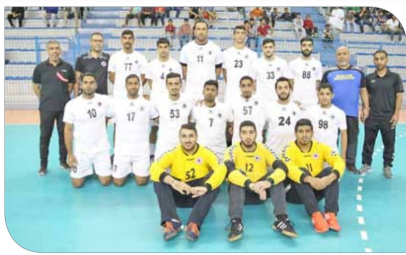
فريق باربارا لكرة اليد

♦ سيكون عشاق لعبة كرة اليد على ضيغ ساخن اليوم الثلاثاء لمناخبة قمة تجمع فريقي النجمة وباربارا في المباراة الفاصلة لتحديد هوية المتأهل لنهائي دوري أندية الدرجة الأولى، وذلك عند الساعة 7 مساءً على صالة اتحاد اللعبة بأم الحصم. ومن المتوقع أن تمثلت مدرجات الصالة عن بكرة أيها من قبل أنصار ومحبي الفريقين خصوصاً ومحبي لعبة الأوقياء عموماً؛ كون لقاء اليوم لا يقبل القسمة على اثنين، بعدما نجح كل منهما في الفوز في مواجهة واحدة، ليخوضا مباراة ثالثة أخيرة.