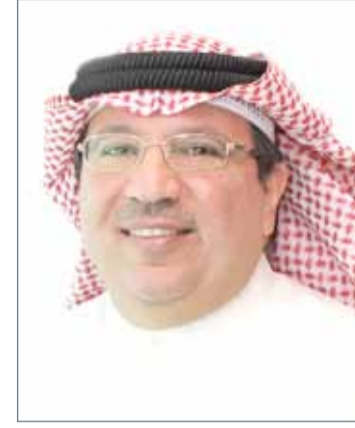
مبادئ الشريعة الإسلامية الفراء ومقبولة بجميع أنحاء العالم. وكان المصرف قد أعلن في وقت سابق عن

أعلن المصرف الخليجي التجاري؛ أحد المصارف الإسلامية الرائدة بمملكة البحرين، عن إطلاق حملته "مكافآت 2017 مع الخليجي"، وذلك لحاملي بطاقاته الائتمانية والتي تقدم لهم جملة من التخفيضات والعروض الحصرية مع أكثر من 40 جهة مختلفة، منها عروض خاصة مع طيران الخليج والدخول المجاني لعدد من قاعات كبار الشخصيات في المطارات العالمية وتخفيضات مع عدد من المطاعم وشركات التأمين وتأجير السيارات ومراكز الخدمات الطبية.