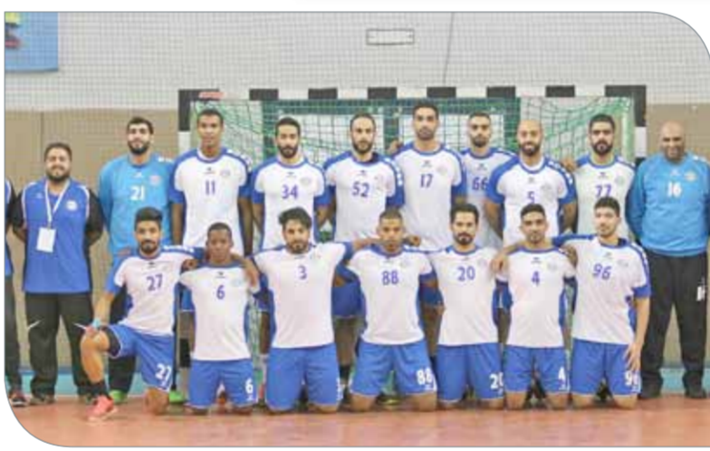
فريق النجمة لكرة اليد