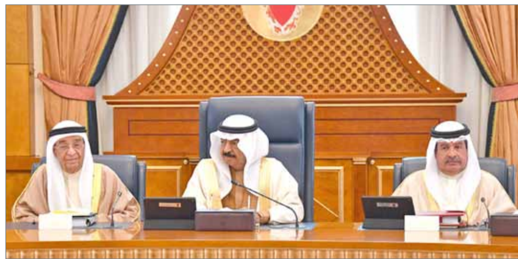
• سمو رئيس الوزراء مترأساً جلسة مجلس الوزراء أمس

بن سلمان آل خليفة قد ترأس الجلسة الاعتيادية الأسبوعية لمجلس بقر القضية امس وبحث المجلس في اجتماعه مشروع قانون بشأن العقوبات والتدابير البديلة من أهم ملامحه أنه يجيز للقاضي أن يقضي أو يأمر بعقوبات بديلة بدلاً من العقوبات الأصلية، وهي الحبس والسجن وذلك وفقاً لشرط ووضوابط نص عليها مشروع القانون.