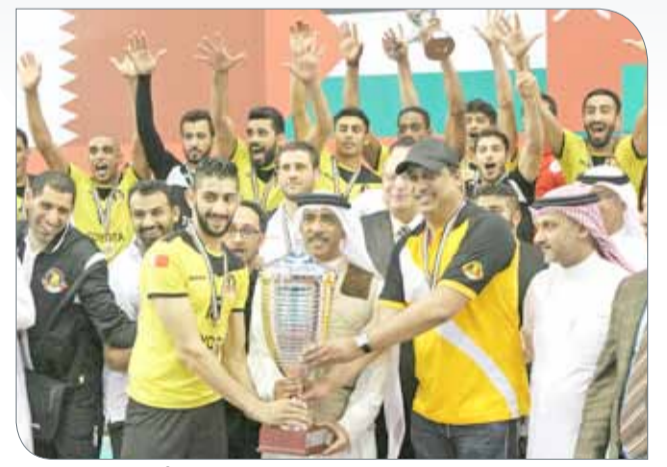
الأهلي بطل العرب