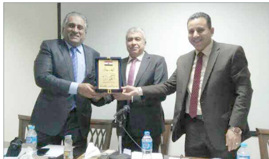
• تكريم رئيس التحرير بعد مشاركته في الندوة

وظفت طهران ألتها الإعلامية للمجوم على البحرين وزعة استقرارها. يذكر أن مركز الحوار للدراسات السياسية الأعلى للثقافة.