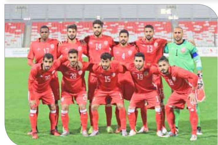
منتخبنا الوطني الأول لكرة القدم

قبل المباراة المهمة أمام تركمانستان، والتي سيسعى فيها المنتخب لتجاوز آثار التعادل في الجولة الأولى أمام