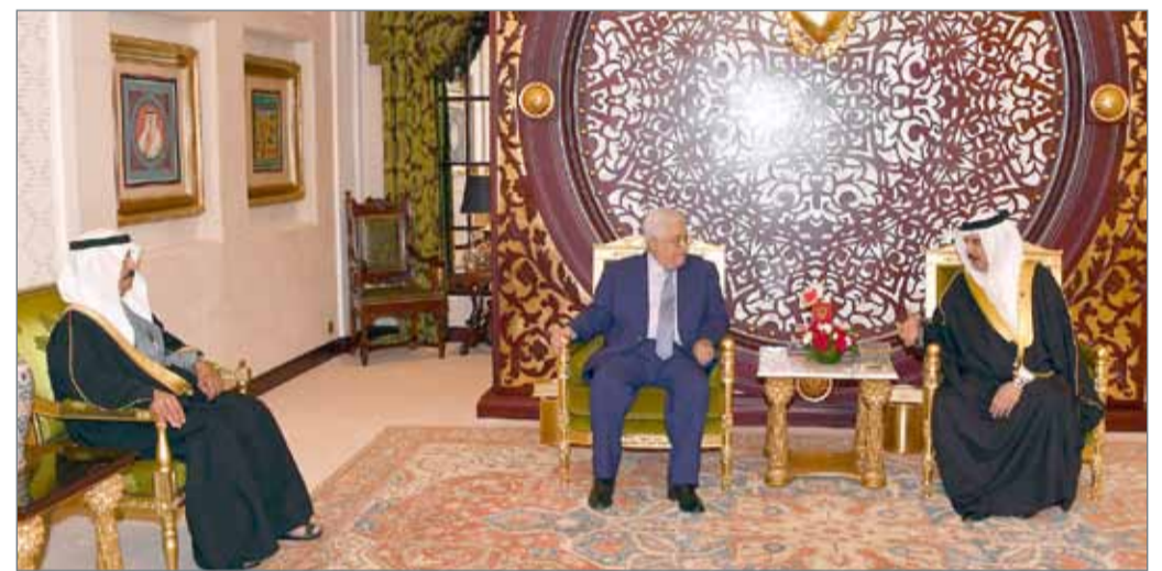
• جلالة الملك وبحضور سمو رئيس الوزراء مستقبلاً الرئيس الفلسطيني أمس

المنامة - بنا: عقد عاهل البلاد صاحب الجلالة الملك حمد بن عيسى آل خليفة جلسة المباحثات مع رئيس دولة فلسطين الشقيقة محمود عباس بحضور رئيس الوزراء صاحب السمو الملكي الأمير خليفة بن سلمان آل خليفة. وقال جلالة الملك في كلمة سامية بهذه المناسبة: "يسعدنا كما هو الحال دوماً، أن نرحب بكم في ربوع بلدكم الشقيق، الذي يكن لكم قيادته وشعبه، كل محبة وتقدير، والذي يقف مسانداً في كل الأوقات والظروف لقضيته الأولى".