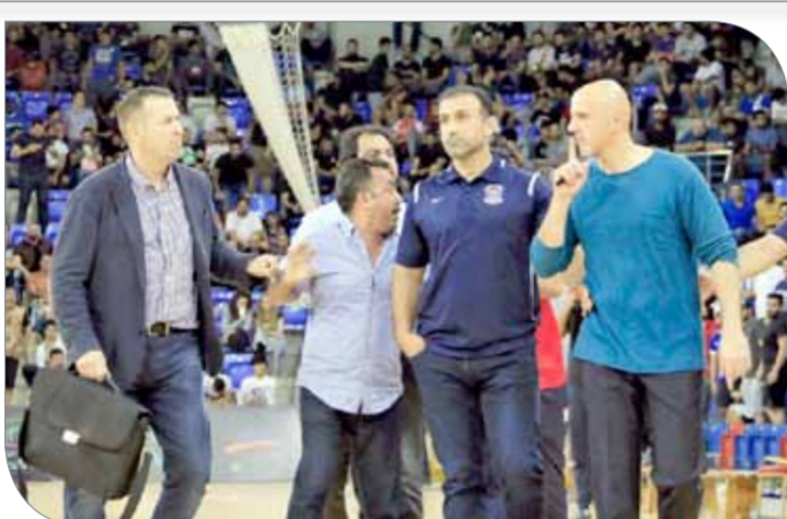
مشادات كلامية بين مدربي الفريقين