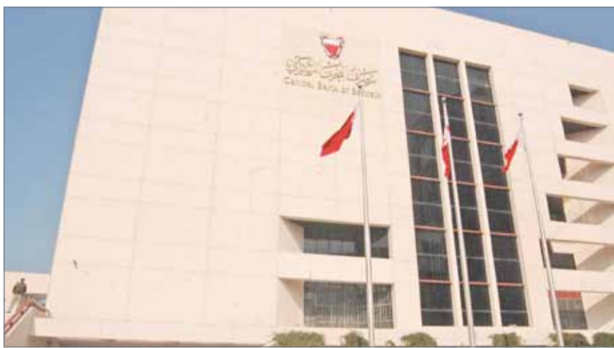
• مصرف البحرين المركزي

وبلغت موجودات المصارف الإسلامية لنفس الفترة (نهاية يناير الماضي) نحو 25.8 مليار دولار منها 17.3 ملياراً محلية، و8.5 ملياراً أجنبية.