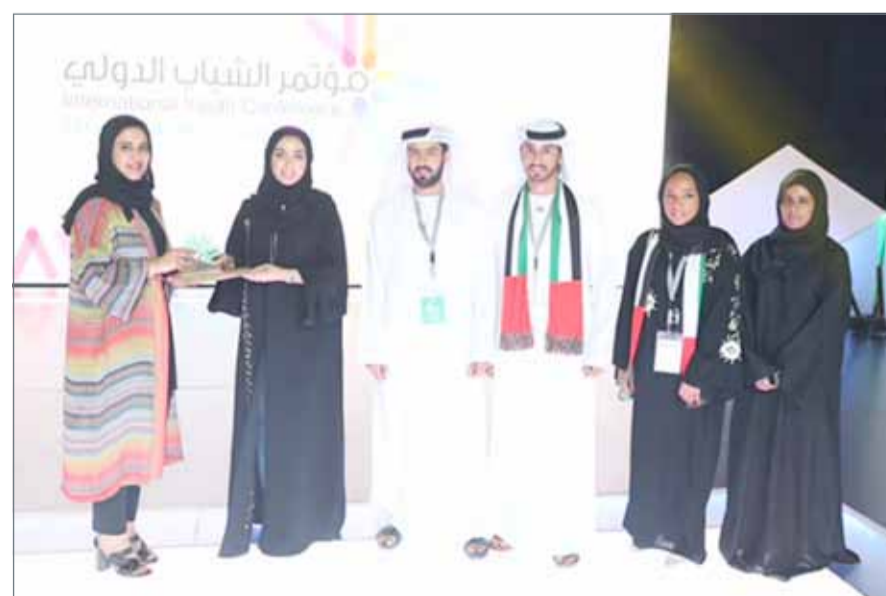
• جانب من الحفل الختامي

تقديم الدعم لهم وإعداد قائمة من جانب منظمة الأمم المتحدة تتضمن الاحتياجات حسب الأولويات وطريقة تقديم الدعم، على أن تعمم هذه القائمة على الدول الأعضاء كبادرة لتوجيه مؤسسات الدول ومؤسسات المجتمع المدني؛