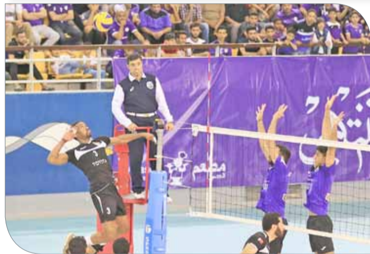
الأهلي يطيح بطائرة العنيد ويؤجل الحسم للفاصلة