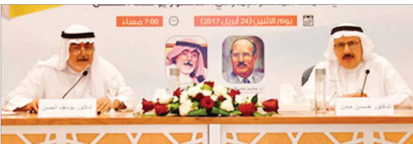
• ندوة المفكر الإماراتي الحسن

وفي ختام مراجعته استعرض المفكر الإماراتي يوسف الحسن، عدداً من الملاحظات على كتاب الأنصاري، أولها أن الكتاب بدأ بدراسة الشخصية وخصوصيات التكوين والعقل السياسي العربي، لكن الصعوبة تكمن في كون الوطن العربي لا يخضع لتماثل واحد فيه، فهناك تنوع جغرافي ومناخي وتعدد بشري وإثني، وحتى داخل القطر الواحد، مشيراً إلى أن وضع الوطن العربي في تجربة واحدة لم يكن موفقاً في تقديم هذا الاختلاف في هذه البيئات، بل إن التعدد والتنوع هو إثراء للوطن والمجتمع العربي، وهو ما يمكن الاستفادة منه بقرار سياسي.