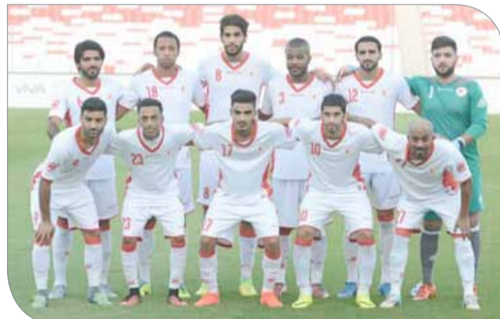
فريق الرفاع الشرقي