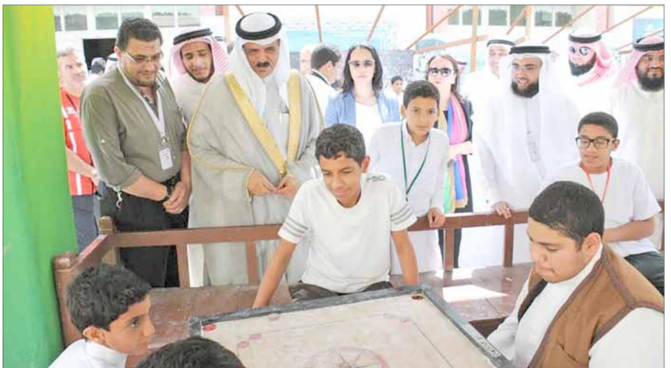
• جانب من المهرجان