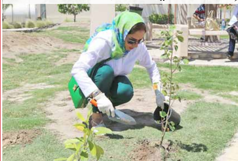
• جانب من مشاركة المواطنين بفرس النخيل والشجيرات بحديقة سترة