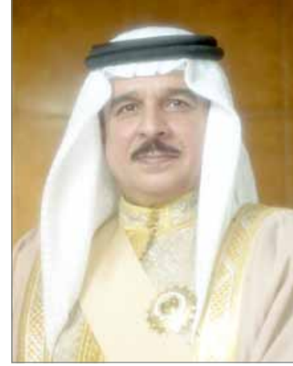
• جلالة الملك

المنامة - بنا: بعث عاهل البلاد صاحب الجلالة الملك حمد بن عيسى آل خليفة ببرقية تعزية ومواساة إلى أخيه عاهل المملكة العربية السعودية الشقيقة خادم الحرمين الشريفين الملك سلمان بن عبدالعزيز آل سعود، أعرب فيها جلالته عن خالص تعازيه وصادق مواساته بوفاة المغفور له بإذن الله تعالى صاحب السمو الملكي الأمير ناصر بن سلطان بن عبدالعزيز آل سعود، داعياً لجلالته المولى عز وجل أن يتغمده بواسع رحمته ويسكنه فسيح جناته.