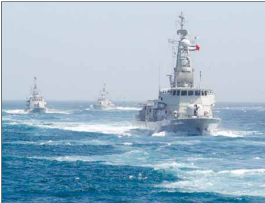
• قوات التحالف العربي البحرية

وأوضحوا وفق ما نقلت رويترز أن هذه المساعدات تشمل توسعة نطاق معلومات المخابرات التي تقدمها واشنطن. ولم يستبعد مسؤولو الإدارة الأميركية أن تقدم الولايات المتحدة مساعدة في المعركة التي سيخوضها التحالف والجيش اليمني على ميناء الحديدة، موضحين أنها لن تشن ضربات على أهداف للحوثيين أو تنتشر قوات برية. ووفق مصادر فإن الدعم البحري سيكون عبر عملية المراقبة البحرية ومنع تهريب الأسلحة للمليشيات عبر البحر الأحمر أما الاستخباراتية فمن خلال تأمين معلومات أكثر عن تحركات الحوثيين التي يحصل عليها الأميركيون عبر الأقمار الاصطناعية.