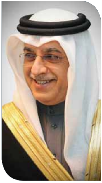
الشيخ سلمان بن إبراهيم

في التطوير الرياضي، والتخطيط للأداء العالي (الرياضيين النخبة) وعالم مبتكر وعملي، وقد قام المجلس الأعلى للشباب والرياضة واللجنة الأولمبية البحرينية بتوجيه الدعوة للحضور إلى عدد من المسؤولين في وزارة التربية والتعليم ووزارة العمل والتنمية الاجتماعية ووزارة الصحة والجهات ذات العلاقة.