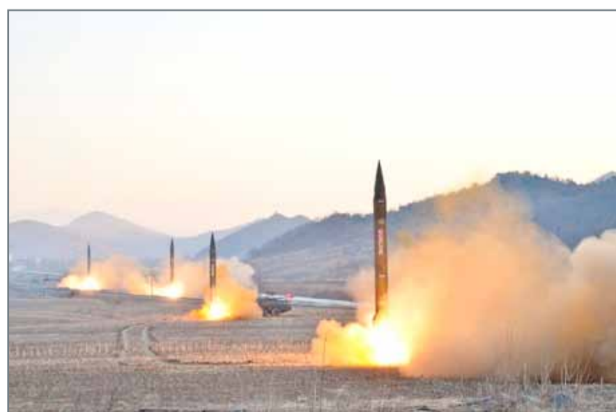
• إحدى تجارب الصواريخ الباليستية في كوريا الشمالية

عواصم . وكالات: قال الرئيس الأميركي دونالد ترامب، إن من المحتمل أن يندلع صراع كبير مع كوريا الشمالية في المواجهة بشأن برامجها النووية والصاروخية، لكنه يفضل إنهاء النزاع بالسبل الدبلوماسية. وأضاف ترامب في مقابلة مع رويترز: هناك احتمال أن ينتهي بنا الأمر إلى صراع كبير جداً مع كوريا الشمالية. بالطبع، لكن ترامب قال إنه يريد حل الأزمة التي واجهها عدة رؤساء للولايات المتحدة سلمياً، وهو النهج الذي يؤكده هو وإدارته من خلال إعداد مجموعة متنوعة من العقوبات الاقتصادية الجديدة مع الإبقاء على الخيار العسكري الذي لا يزال مطروحاً.