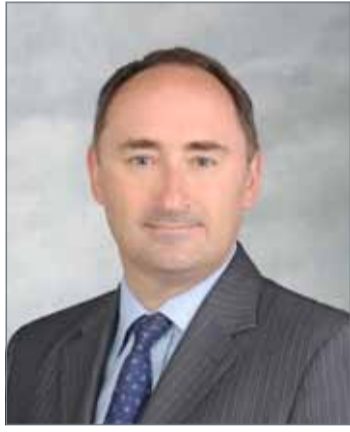
• سايمون جالبن

السوية لصندوق النقد الدولي ومجموعة المصارف العالمية والتي تجري بحضور قرابة 10,000 مشارك من بينهم وزراء مالية ومحافظي مصارف مركزية ورؤساء تنفيذيين بالقطاع المالي ومستثمرين وأكاديميين من مختلف أنحاء العالم، وتشكل فرصة مواتية للتعريف بالفرص الاستثمارية الجاذبة في مملكة البحرين، وموقع البحرين كمنصة انطلاق نحو السوق الخليجي الكبير. وأكد الطرفان خلال الاجتماع أهمية المضي قدماً في تعزيز مكانة البحرين كمركز مالي إقليمي رائد على مدى أكثر من أربعين عاماً، وأهمية استكشاف الأفق الحديثة لتطور وتطوير هذا القطاع، ومن ذلك التوجه نحو ما بات يسمى بـ "التكنولوجيا المالية" خاصة مع سعي مجلس التنمية الاقتصادية الجاد لجعل مملكة البحرين لاعباً رئيسياً في هذا المجال من خلال الكفاءات الوطنية المؤهلة في العمل المصرفي وتقنيات التمويل المتطورة.