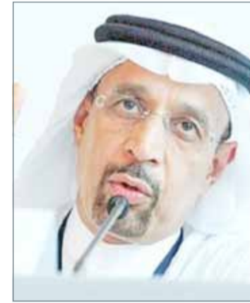
• خالد الفالح

وقال متعاملون إن مكاسب أوبك جاءت بفعل قول أوبك إنها ترغب في التوصل إلى اتفاق لخفض فائض إمدادات الوقود. وكانت منظمة البلدان المصدرة للبترول (أوبك) ومنجوتون آخرون من بينهم روسيا، قد اتفقوا على خفض الإنتاج نحو 1.8 مليون برميل يوميًا في النصف الأول من السنة. لكن أوبك تواجه ضغطًا لتمديد التخفيضات بحيث تشمل 2017 بأكمله من أجل تصريف الإمدادات الزائدة. وقال جريج مكينا، كبير محللي السوق لدى أكسي تريدر للوساطة في العقود الآجلة "أوبك قالت عملياً إن خفض الإنتاج سيُمدد في مواجهة إعادة تشغيل حقل نفط لبي كبير واستمرار زيادة إنتاج النفط الصخري الأميركي". ويرجع استمرار تخمة المعروض جزئياً إلى تنامي الإنتاج الأميركي الذي زاد 10 % منذ منتصف 2016 إلى 9.27 مليون برميل يوميًا. وكان الرئيس التنفيذي لارامكو السعودية قد إن سوق النفط تتحرك صوب استعادة التوازن مدعومة بتحسين العوامل الأساسية للعرض والطلب واتفاق خفض المعروض بقيادة أوبك.