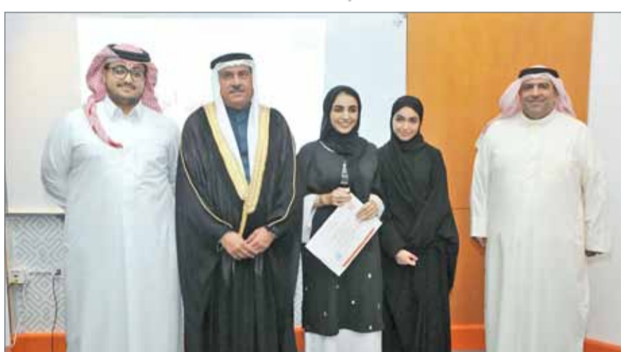
• صورة أرشيفية لفعالية سابقة لمعهد التنمية السياسية

يشار إلى أن المعهد متخصص في إشاعة الثقافة السياسية والديمقراطية، ولملق بمكتب رئاسة مجلس الشورى، وأنشئ بمرسوم ملكي صادر بالعام 2005. ومن أبرز أهداف المعهد نشر ثقافة الديمقراطية وترسيخ مفهوم المبادئ الديمقراطية والسليمة، وتوفير برامج التدريب والدراسات والبحوث المتعلقة بالمجال الدستوري والقانوني، ونشر وتنمية الوعي السياسي بين المواطنين، ودعم وتنمية البحوث العلمية في مجال النظم السياسية والقانون الدستوري.