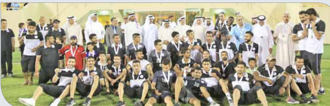
من تتويج الاتحاد