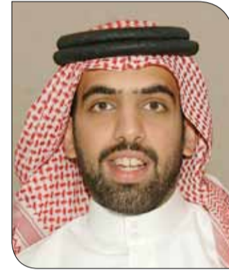
خالد بن سلمان

♦ اعتبر قائد فريق جنز يوناتيد الشيخ خالد بن سلمان آل خليفة قرعة البطولة متوازنة ومنطقية بحسب التصنيف الذي اعتمدهت اللجنة العليا للفرق، مؤكداً أن هدف فريقه الأساس والأهم من هذه المشاركة هو إنجاز البطولة كما جرت عليه العادة مع كل سنة بغض النظر عن النتائج. وأضاف "مشاركتنا في البطولة ككل عام هدفها الرئيس والأساس هو المساهمة في إنجاحها بجميع الوسائل سواء فنيا عبر منحها زخماً فنياً أو عن طريق جلب الرعاية وغيرها من الخطوات التي تساهم في إنجاز البطولة". وعن طموحات فريقه هذا العام من البطولة في الجانب التنافسي قال خالد بن سلمان: "نسعى لمواصلة النجاح في المنافسة على لقب البطولة كما تعودنا عليه في السنتين الأخيرتين عندما حللنا وصيفا للبطول، وسنعمل على ذلك هذا العام عبر أسلوب