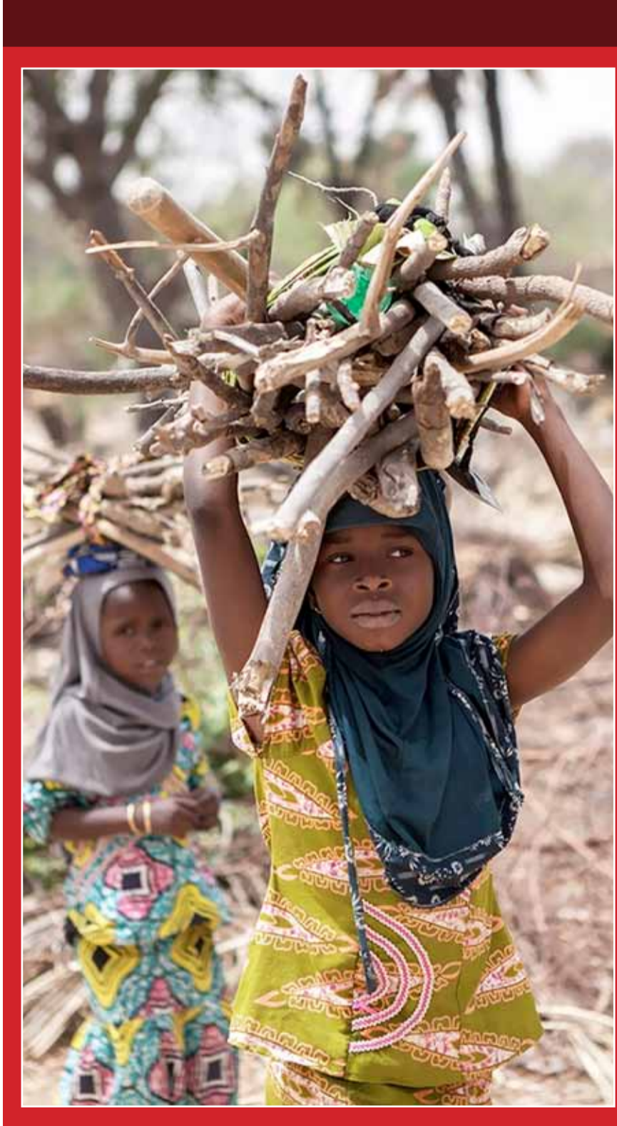
فتيات يحملن حطب النار في ضواحي مدينة داماسك شمال شرق نيجيريا

وأوضح مسؤول في منظمة "رحلات القمم السبع" في نيبال، أن ستيك قتل في المعسكر 1 بجبل "نابستي"، لافتاً إلى أنه تم نقل جثته من موقع الحادث إلى لوكلا، حيث يوجد المطار الوحيد في جبل إيفرست. وما زال من غير الواضح كيف لقي تريك حتفه، لكنه كان ينوي تسلق مسافة تصل إلى 8850 متراً من جبل إيفرست، إضافة إلى جبل لوتس الشهر المقبل، وفق ما ذكرت وكالة أسوشيتد برس.