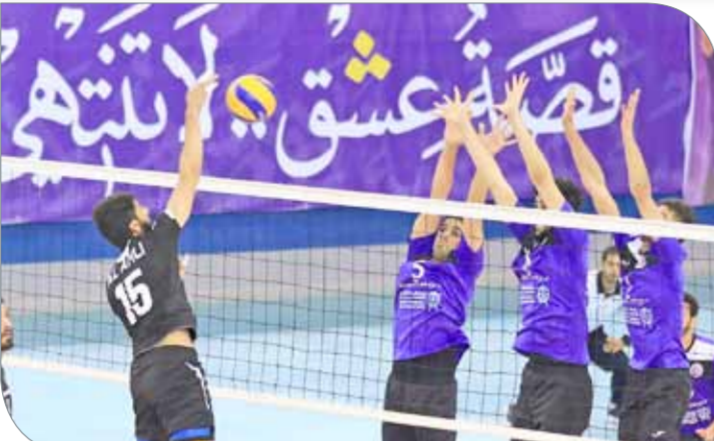
الأهلي يتجاوز طائرة العنيد وتأهل للنهائي بجدارة