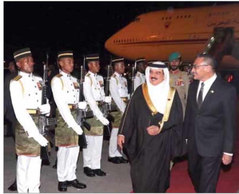
• جلالة الملك يصل إلى ماليزيا

كوالالمبور - بنا: قال عاهل البلاد صاحب الجلالة الملك حمد بن عيسى آل خليفة في تصريح له أمس إن مملكة البحرين وماليزيا الشقيقة تمتلكان نموذجين متميزين ناجحين ومؤثرين في محيطهما الإقليمي والدولي، مما يزيد من طموحاتنا في علاقات ثنائية أكثر تنوعاً ويدعم تطعاتنا نحو تعاون أكثر وثوقاً يضمن