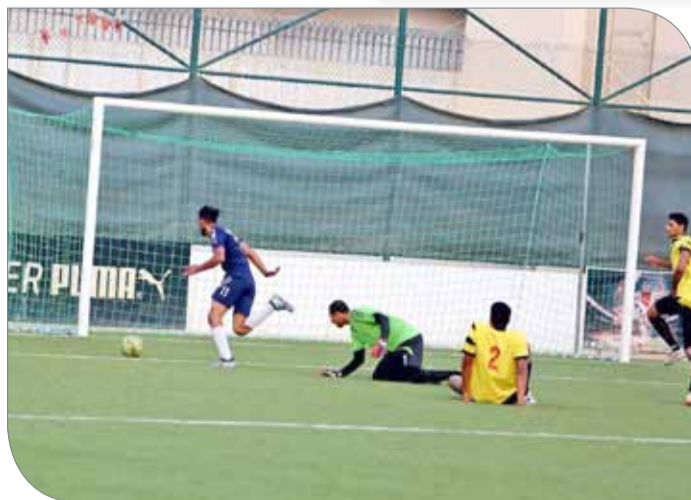
جانب من المنافسات