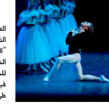
باليه بطرس جرج

يذكر أن مبنى دار المحرق - الواقعة بالقرب من ميني دار جناح بمدينة المحرق - المبنى يكون مركزاً للتدريب والبحث بفنون الموسيقى الشعبية في ملكة البحرين.