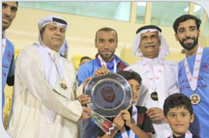
من تتويج الشباب