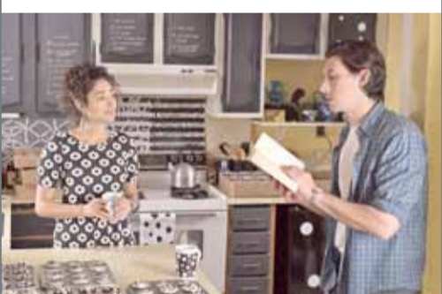
لقطة من الفيلم

يفرض نادي البحرين للسينما يوم بعد غد الأربعاء الفيلم الفرنسي الأمريكي الألمان المشترك "باترسون" للمخرج جيم جيموموش. تدور أحداث الفيلم في مدينة صغيرة مادية تدعى باترسون وبطله سائق حافلة عامة يدعى باترسون وزوجته ربة المنزل لورا. يلتزم باترسون بروتين يومي بسيط فهو يسوق الحافلة في نفس الطريق ويكتب الشعر في دفتر ملاحظات صغير ويذهب إلى الحانة حيث يشرب كأساً واحدا فقط من البيرة ثم يذهب إلى منزله لزوجته لورا. على النقيض من ذلك عالم لورا يتغير باستمرار حيث تحلم ألاماً مختلفة كل يوم تقريبا والزوجان يجان بعضهما فهو يدعم طموحاتها الجديدة وهي تعجب كثيرا بموهبتها الشعرية. ومن خلال الفيلم نراقب بعمد انتصارات ومراهم الحياة اليومية في أصغر التفاصيل. تم ترشيح الفيلم لجائزة السعفة الذهبية في مهرجان كان السينمائي.