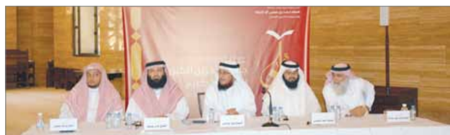
المسابقة سجلت أعلى نسبة مشاركة منذ انطلاقتها الأولى

الملك الأمير سلمان بن حمد آل خليفة، على خدمة كتاب الله تعالى ونشر تعاليمه وقيمه بين مختلف فئات المجتمع والعناية بحفاظ القرآن الكريم وحملته. وأشاد في ذات السياق بدعم واهتمام رئيس المجلس الأعلى للشؤون الإسلامية سمو الشيخ عبدالله بن خالد آل خليفة بالجائزة؛ باعتباره المؤسس الأول لها، إذ ارتقت وتطورت هذه الجائزة تحت مظلة وإشراف ورؤيته السيدية.