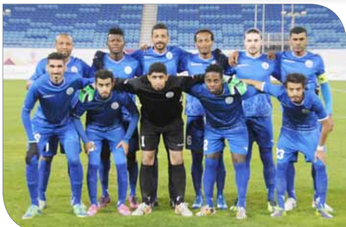
فريق الحد لكرة القدم