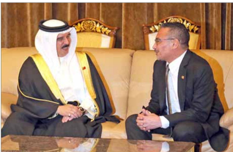
• جلالة الملك لدى وصوله ماليزيا

وكان في مقدمة مودعي جلالة الملك ولي العهد نائب القائد الأعلى النائب الأول لرئيس مجلس الوزراء صاحب السمو الملكي الأمير سلمان بن حمد آل خليفة، وعدد من كبار المودعين والقائم بأعمال السفارة الماليزية في البحرين.