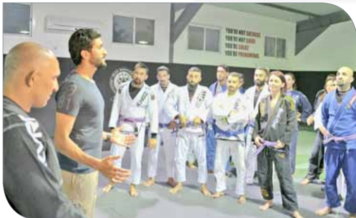
لقطة من الزيارة

وتقديره للسيد منفرد على ما يبذله من جهود في تطوير ورفع مستوى الألعاب القتالية بالمملكة. من جهته، أعرب رضا منفرد عن بالغ شكره وتقديره إلى سمو الشيخ ناصر بن حمد آل خليفة نظير ما يوليه سموه من حرص واهتمام لتطوير رياضة الدفاع عن النفس في المملكة من خلال متابعتها المستمرة ودعمه للمراكز واللاعبين. وفي ختام الزيارة قدم منفرد هدية تذكارية لسمو الشيخ ناصر بن حمد آل خليفة.