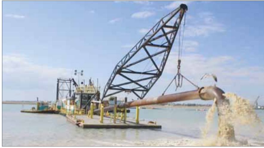
الرمل أصبح شحيحاً ونداراً في السوق

ووضع تقرير لـ "ميد" قطاع التشييد والبناء في البحرين ضمن قائمة الأسواق الثلاث الناشط خليجياً خلال الأشهر الثلاثة الأولى من العام الجاري. وأشار التقرير إلى أن أقوى الأسواق في المنطقة خلال الأشهر الـ 12 الماضية هي دبي والكويت والبحرين.