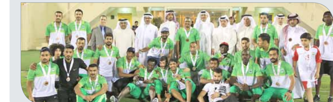
من تتويج البديع

42 نقطة، الاتحاد 36 نقطة ، البديع 25 ، البسيتين 20 ، سرة 17، الاتفاق 17 ، مدينة عيسى 15 ، التضامن 13 وأخيرا للاتي 12 نقطة. وبحسب المبالغ المرصودة من قبل اتحاد الكرة، فإن مكافأة الفريق البطل تبلغ 25 ألف دينار، فيما يحصل