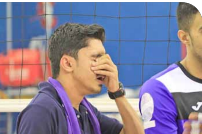
دسرة وهكاه فيه عفيف العنيد

أن يقلص الفارق إلى نقطة عند النتيجة 24/23 لكن ارسال المحترف تيتون الصانع أهدى الأهلي النقطه الخامسة والعشرين ليتبني الشوط 25/23. واصل الأهلي عرضه الجماعي الرفع في الشوط الثاني بفضل نجاعة ضاربيه في تخليص الكرات الهجومية من