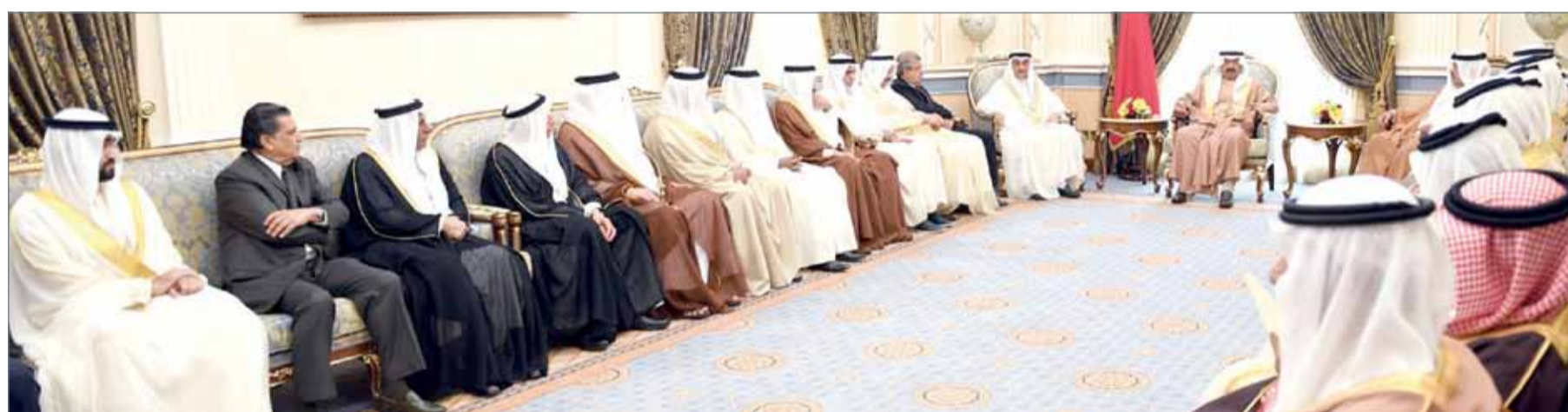
● سمو رئيس الوزراء مستقبلاً عدداً من الفعاليات الفكرية والاقتصادية

● تحقيق التطلعات السامية وتنمية الوطن وراحة الشعب تتصدر أولويات العمل الحكومي