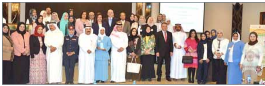
• وزيرة الصحة تحضر حفل اليوم العالمي للتطعيم

وتوجيهاتها السيدة بشأن ضرورة متابعة آخر المستجدات في مجال اللقاحات وسبل مكافحة الأمراض وتأكيداً على وقاية صحة المجتمع عبر توفير التطعيم اللازمة. كما لا ننسى الجهود المبذولة من قبل العاملين في الحقل الصحي ومقدمي خدمات اللقاحات في القطاعين الحكومي والخاص والتي كان لها أثير الأثر في استمرار تقدم المملكة في هذا المجال، مشيرة الي إشادة منظمة الصحة العالمية للبرنامج الإلكتروني والمعني بإدخال كافة البيانات المتعلقة باللقاحات خلال اجتماع برنامج التمنيع الموسع الأخير. إذ أكدت المنظمة العالمية أن هذا النظام يعد من البرامج المتطورة.