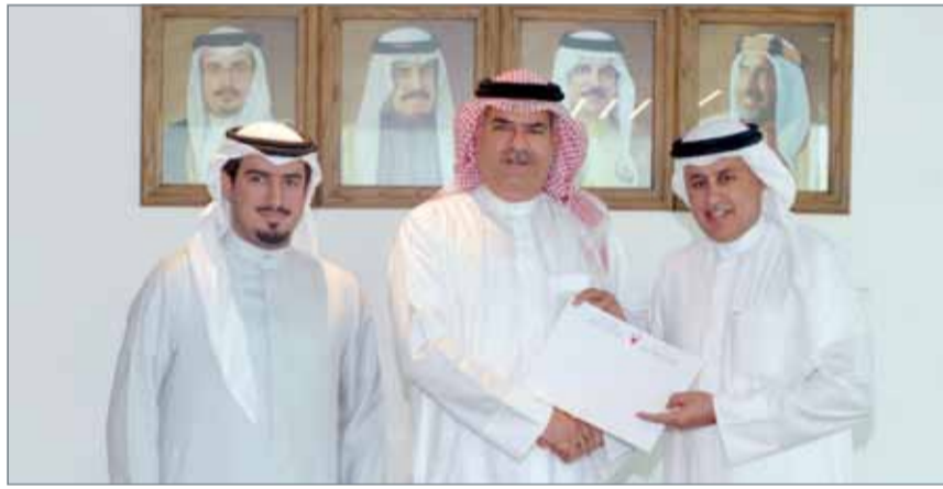
• الزباني يكرم علي فولاذ بحضور الشيخ خالد بن حمود

الكبيرة التي توفرها البحرين لاستقطاب المقبلين على الزواج من فنادق فاخرة ومرافق سياحية متميزة". وقال الرئيس التنفيذي لهيئة البحرين للسياحة والمعارض، الشيخ خالد بن حمود آل خليفة "يعد هذا الزفاف أول الأحداث الضخمة التي ستستضيفها المملكة ضمن الخطة الاستراتيجية للهيئة، والتي تأتي كجزء من الخطة العامة لترويج البحرين كوجهة سياحية؛ لما تتمتع به من مميزات تجعل منها وجهة مفضلة للعديد للسياح. واستفاد من تنظيم هذا الزفاف كثير من الجهات والشركات المتعلقة بهذا المجال، حيث كان ذا أثر اقتصادي إيجابي وملحوظ في اقتصاد المملكة".