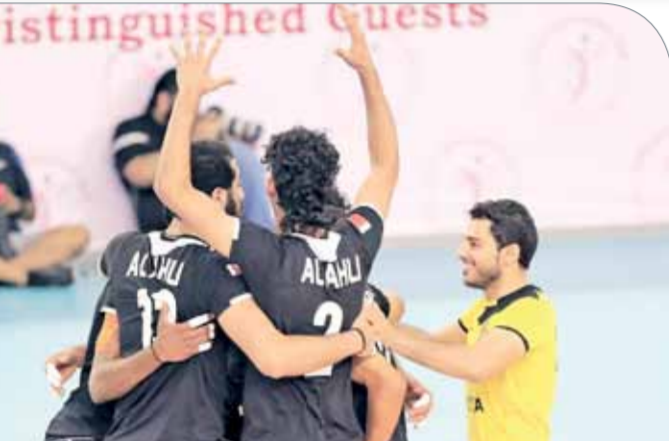
لاعبو الأهلي يحتفلون بالفوز