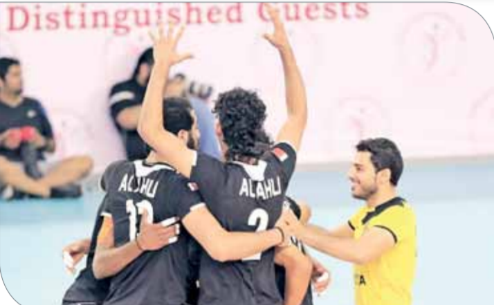
لاعبو الأهلي يحتفلون بالفوز