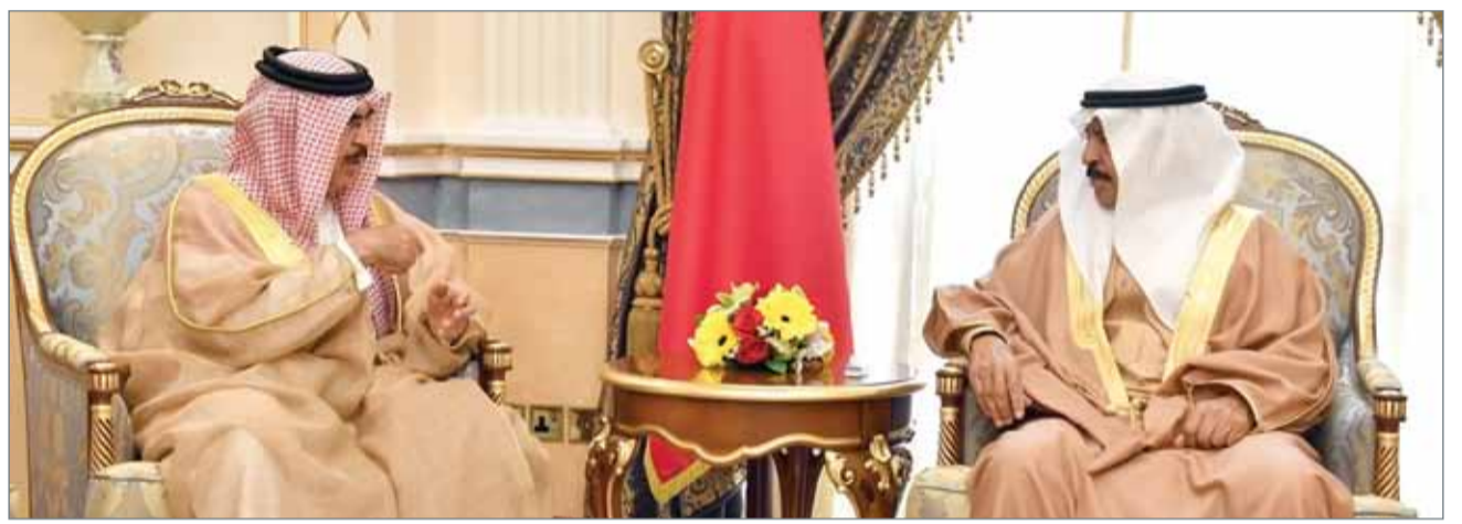
• سمو رئيس الوزراء مستقبلاً وزير الداخلية أمس

تحقيق راحة الشعب تتصدر أولويات العمل الحكومي