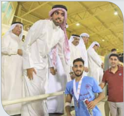
من تتويج الشباب

الوصيف على 20 ألف دينار، و15 ألف دينار لصاحب المركز الثالث، و10 آلاف دينار للراب، و7 آلاف دينار للخامس، و6 آلاف دينار للسادس، و5 آلاف دينار للساب، بالإضافة إلى 4 آلاف دينار لصاحب المركز الثامن، و3 آلاف دينار لصاحب المركز التاسع.