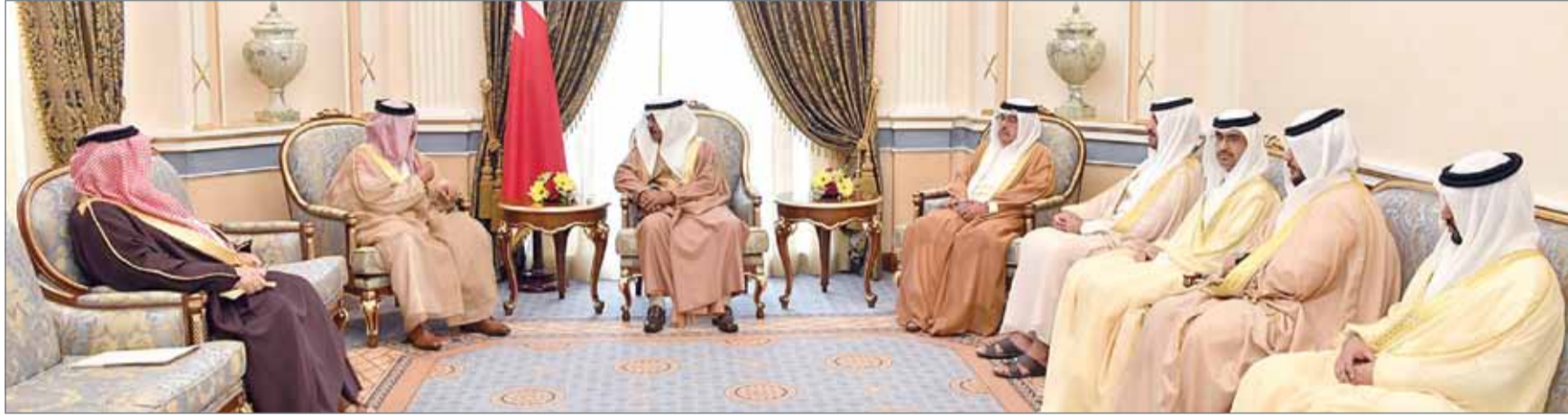
• سمو رئيس الوزراء مستقبلاً وزير الداخلية أمس

● نواجه خطراً مشتركاً يتطلب ثباتاً في مواجهته عبر أقصى درجات التنسيق