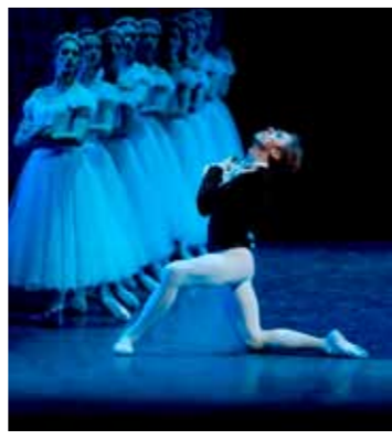
باليه بطرس جرج

والفنون في جمهورية روسيا الاتحادية، وتتمتع عروض الباليه الروسية بشهرة عالمية واسعة، بفضل الأداء الاحترافي، والدقة في تصميم الرقصات والسجام الكلاسيكية المرافقة. يذكر أن مسرح البحرين الوطني استضاف منذ افتتاحه العديد من الفعاليات الثقافية المميزة، والعروض الفنية العالمية التي شهدت نجاحاً طويلاً. يذكر أن مسرح واحدًا من أهم الصروح الثقافية بملكمة البحرين والمنطقة.