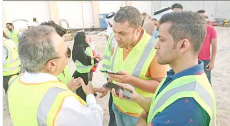
وزير الأشغال والبلديات متحدثاً للصحافة

صغيرة ذات أثر كبير، إلى حين تنفيذ المشاريع الاستراتيجية التي يتطلب إنجازها فترة زمنية أطول. وفيما يتعلق بتحسين شبكة الطرق عند منطقة سلماباد ومدينة زايد، قال الوزير إن العمل قائم على توسعة الشارع المقابل لمبنى وزارة العمل إلى 3 مسارات في كل اتجاه، وذلك من