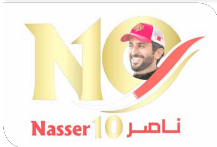
شعار دورة ناصر 10

الرعاية الإعلامييون: جريدة أخبار الخليج، جريدة الأيام، جريدة الوسط، جريدة الوطن، جريدة البلاد، جلف ديلي نيوز، ميادين، باور آب، بحرين ويبكلي.. بالإضافة إلى هيئة شؤون الإعلام (تلفزيون البحرين).