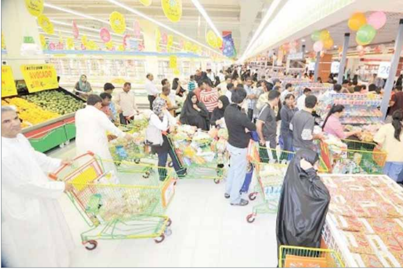
• صورة أرشيفية

وكانت أهم المجموعات التي ارتفعت أسعارها في شهر أبريل من العام 2017 مقارنة بشهر مارس من العام 2017، هي: مجموعة "السلع والخدمات الأخرى" التي ارتفعت أسعارها بنسبة 3.5 %، ومجموعة "المسكن والمياه والكهرباء والغاز وأنواع الوقود الأخرى" ارتفعت أسعارها بنسبة 3.1 %، مجموعة "التعليم" بنسبة 2.6 %، في حين انخفضت أسعار مجموعة "الملابس والأحذية" بنسبة 2.6 %.