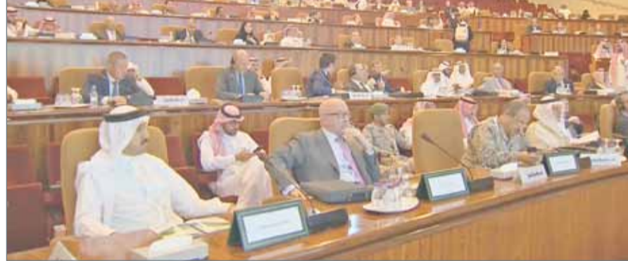
الشيخ عبدالله بن أحمد يشارك في منتدى الرياض لمكافحة التطرف ومحاربة الإرهاب

الإسلامية السامة. وحذر الشيخ عبدالله بن أحمد آل خليفة من خطورة قيام جهات خارجية معروفة، تتبنى أيديولوجيات ثيوقراطية بتصدير العنف والإرهاب لدول المنطقة بالصور والأشكال كافة من خلال تدريب الإرهابيين وتهريب الأسلحة والمتفجرات، فضلاً عن التصريحات الإعلامية التريضية والدعم اللوجستي للجماعات الإرهابية.