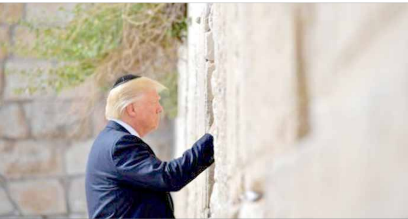
• الرئيس الأميركي دونالد ترامب عند حائط البراق في القدس المحتلة

السماح لها مطلقا بامتلاك أسلحة نووية. وأضاف ترامب في تصريحات علنية خلال اجتماع في القدس مع الرئيس الإسرائيلي بنيامين نتنياهو "لأنهم هو أن نعلن الولايات المتحدة وإسرائيل بصوت واحد أنه يتعين عدم السماح لإيران على الإطلاق بامتلاك سلاح نووي وأن عليها وقف تمويل وتدريب وتسليح الإرهابيين والميليشيات وأن نتوقف عن ذلك على الفور".