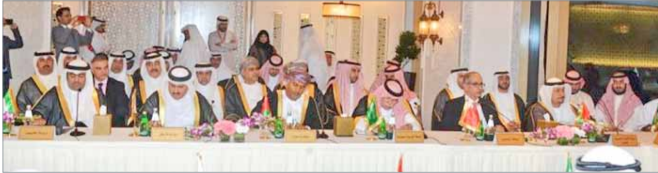
• اللقاء التشاوري الخليجي بحث تسهيل حركة التجارة البيئية