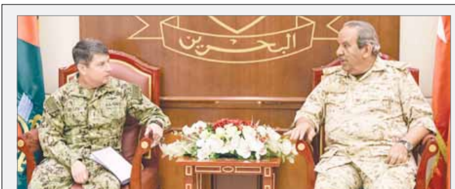
محمد هاشم السادة. كما حضر اللقاء من الجانب الأميركي سفير الولايات المتحدة الأميركية لدى البحرين العقيد ستيفن فستنت.

وخلال اللقاء رحب القائد العام لقوة دفاع البحرين بقائد الأسطول الخامس قائد القيادة البحرية المركزية الأميركية، مشيداً بالعلاقات القائمة بين مملكة