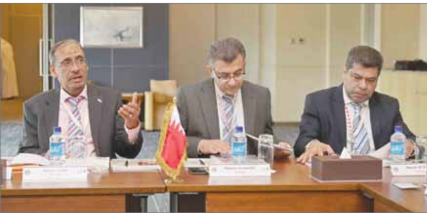
• مشاركون في الاجتماع الدوري الأربعين للجنة التنسيقية للشركات النفطية الوطنية

تحقيق أفضل مردود للشركات الوطنية، وأضاف كما تهتم بتقديم المساعدة أثناء الطوارئ بين شركات النفط الوطنية بما فيها استغلال المعدات والخبرات المتوفرة، وتوحيد الجهود في مجالات الصحة المهنية والسلامة والبيئة، ووضع أسس وسبل ترشيد الإنفاق في شركات النفط الوطنية للوصول إلى الأهداف المرجوة بأقل تكلفة ممكنة من خلال الاستعانة بأحدث التقنيات. وقد ناقش أعضاء اللجنة جميع أنشطة فرق العمل وماتم إنجازها هذا العام حسب معايير الأداء للعام 2017، إضافة إلى افتتاح الموقع الإلكتروني الخاص باللجنة التنسيقية وجميع فرق العمل المنبثقة عنها.