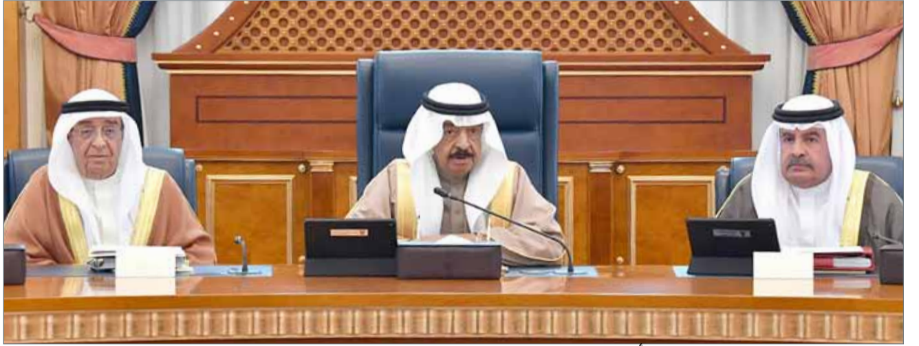
سمو رئيس الوزراء يترأس جلسة مجلس الوزراء أمس

رئيس الوزراء؛ متابعة احتياجات جنوسان وتلبية طلبات السنابس الإسكانية