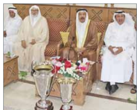
• تهنئة بفوز الحد بكأس الاتحاد والسوبر

الشيخ ناصر بن حمد آل خليفة للنظر في أسباب نزول مستوى نوادي محافظة المحرق. وقال الحضور إن ناديين من نوادي المحرق وهما الحالة والبحرين ولهما تاريخ كبير دون المستوى الذي عرفه الجماهير.