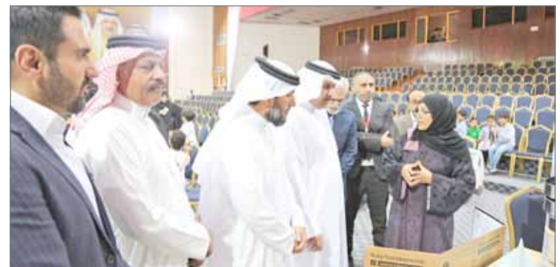
جانب من حفل تدشين مشروع "الإيكو باص"

دشنت بلدية المنطقة الشمالية مشروع "الإيكو باص"، وهو أحد المشاريع التثقيفية والتوعوية، وهي تجربة جديدة تطرح لأول مرة في البحرين، وذلك بالتعاون والتنسيق مع شركة النظافة (أوربايس).