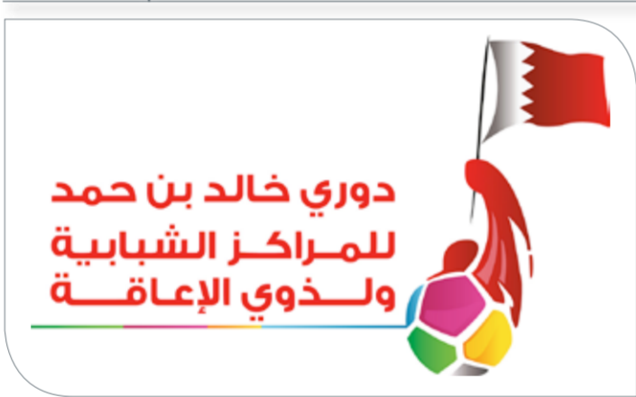
شعار دوريه خالد بن حمد للمراكز الشبابية

يُعقد في 5 من عصر اليوم (الثلاثاء) الاجتماع الفني الخاص بدوري خالد بن حمد للمراكز الشبابية ولندوي الإعاقلة لكرة قدم الصالات في نسخته الخامسة تحت شعار #ملتقى الأجيال، وذلك في مقر وزارة شؤون الشباب والرياضة بضاحية السيف.