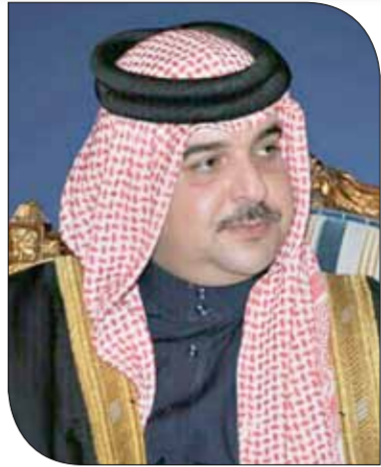
سمو الشيخ عبدالله بن حمد

المشاركة في الفريق الذي تم إنشاؤه العام 2005، وهو يمثل مملكة البحرين محلياً وإقليمياً ودولياً، متمنيا سموه لفريق "بحرين 1" النجاح والتوفيق في سباقات السرعة الدولية القادمة. يذكر أن السائق العالمي ستيف جاكسون قاد كسر الرقم السابق وحقق رقفاً جديداً في رياضة سباق السيارات، حيث التقى سموه برئيس اتحاد الكرة الشيخ علي بن خليفة بن أحمد آل خليفة ونائب الرئيس