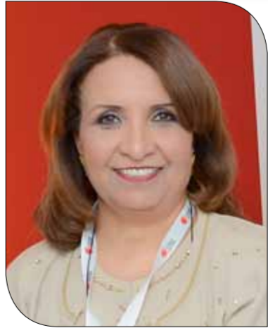
الشيخة حياة بنت عبدالعزيز

سيدمرتضى حسين في الدور نصف النهائي. وسينوج راشد سندن وحسين الهاشمي بعد أن تأهلا للمباراة النهائية بفوزهما على لاعب سار أنسو مكي ولاعب سار