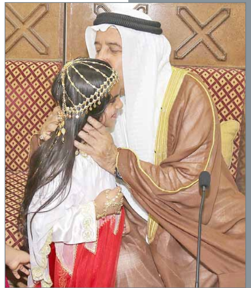
• قدمت طالبات مدرسة زبيدة الابتدائية للبنات عرضاً شعبياً لمجلس المحافظ احتفالاً بقدوم شهر رمضان

وبين أن مشروع سعادة سيربط بين مواقف السيارات وسوق المحرق. وأوضح ممثل المحافظة أن المشروع عبارة عن واجهة بحرية فيها مجموعة من المطاعم المطلة على البحر، إضافة إلى مرافق ورحلات بحرية ترفيهية. وبين أن المشروع يقع بين مصنع الثلج