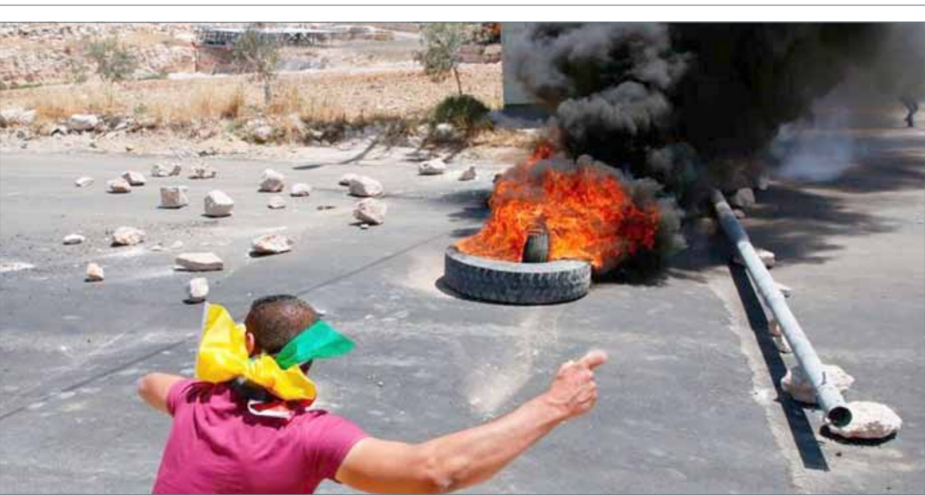
• جانب من الاشتباكات التي شهدتها رام الله

ويأتي ذلك بالتزامن مع اندلاع اشتباكات عنيفة بين شبان فلسطينيين وهوات جيش الاحتلال الإسرائيلي، عند حاجز قلنديا جنوبي رام الله في الضفة الغربية، خلال تفريق مسيرة انطلقت دعماً للأسرى الفلسطينيين المضربين عن الطعام في سجون إسرائيل.