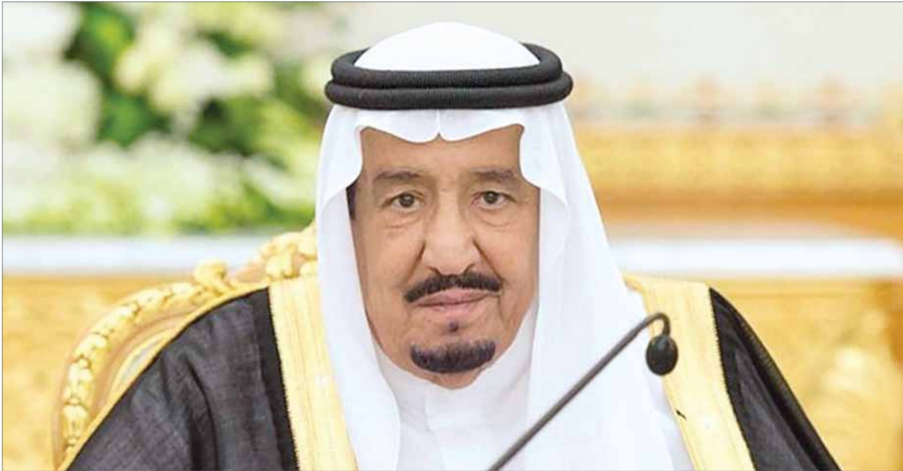
• خادم الحرمين الشريفين يتزأس جلسة مجلس الوزراء

دبي، العربية نت: اعترض عناصر من ميليشيات الحوثي مدججة بالأسلحة الرشاشة، موكب المبعوث الخاص للأمين العام للأمم المتحدة إلى اليمن اسماعيل ولد-الشيخ أحمد، عقب خروجه من صالة مطار صنعاء، حسب ما أفاد شهود عيان أمس الاثنين. وأطلق أحد هؤلاء العناصر الحوثة النار باتجاه موكب المبعوث الأممي، ما دفع أفراد الحماية الأمنية المكلفة بحراسة ولد الشيخ للرد عبر إطلاق النار وتفريق المتظاهرين وإعادة فتح الطريق. وكان ولد الشيخ أحمد قد وصل إلى صنعاء في إطار جولة تبدأ بأمام الأسبوع الماضي في الرياض، في محاولة لإحياء مشاورات السلام المتوقّعة منذ أغسطس العام الماضي، بعد مشاورات الكويت التي استمرت ثلاثة أشهر وانتهت برفض الانقلابيين التوقيع على اتفاق عرضه المبعوث الأممي في نهاية المفاوضات. وسبق وصول ولد الشيخ إلى صنعاء بساعات قليلة، انتقادات وجهها المتحدث باسم المتحدرين الحوثيين محمد عبد السلام للأمم المتحدة ووصفها بالمجازرة، وعدم الوفاء بتعهداتها.