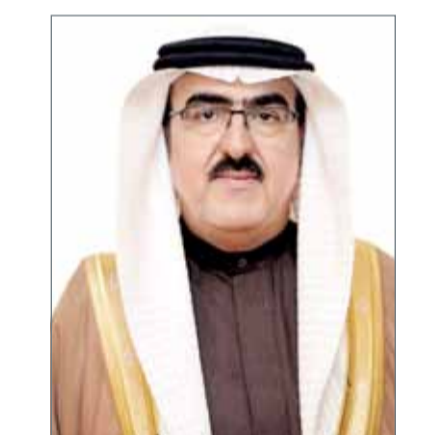
• ياسر الناصر

الوزارة وزارة الإسكان بالإسراع في تلبية احتياجات أهالي السنابس من الخدمات الإسكانية واستيعاب أصحاب الطلبات القديمة منها في المدينة الشمالية وفق المعايير المعتمدة، كما وجّه سموه وزارة الإسكان إلى الوقوف على احتياجات أهالي جنوسان الإسكانية، فيما وجّه صاحب السمو الملكي رئيس الوزراء وزارة الأشغال وشؤون البلديات والتخطيط العمراني إلى توفير مزيد من مواقف السيارات في حالة بو ماهر واتخاذ ما يلزم بشأن الاستملاكات التي تمت لهذا الغرض.