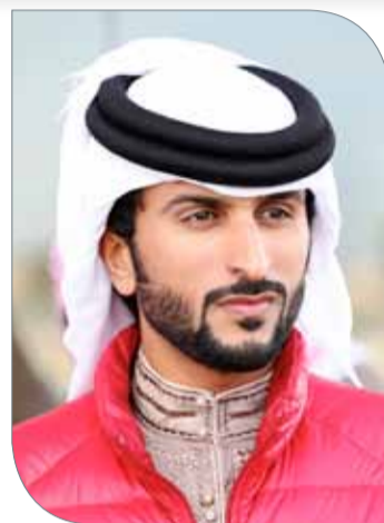
سمو الشيخ ناصر بن حمد آل خليفة

من خلال كافة وسائل الإعلام للبطولة حتى تأخذ حقها من كافة الجوانب نظراً للجهود التي بذلتها لخدمة القطاع الشبابي والرياضي في المملكة. والشركات الراعية هي: مجموعة آل شريف، تمكين، اللجنة العليا للمشاريع