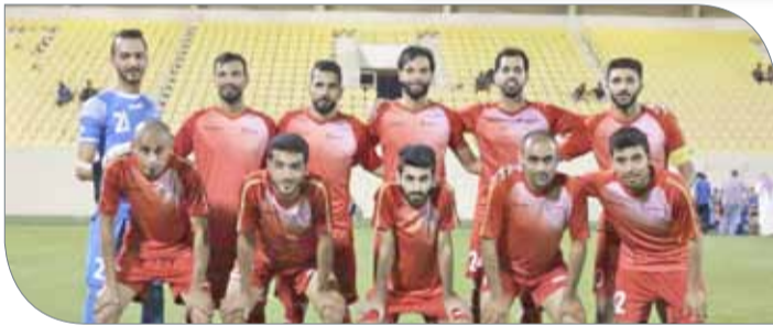
فريق الأحلام الخبير في البطولة يرغب فيه انطلاقاً موفقة