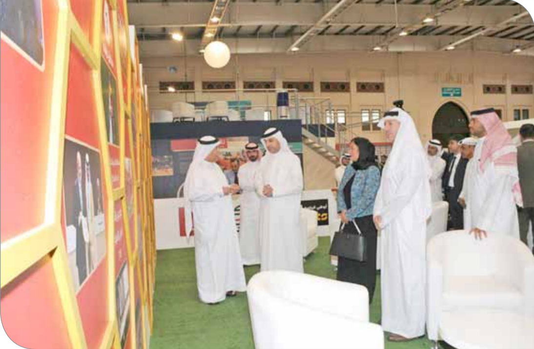
جالساً من جناح اتحاد الكرة في المعرض