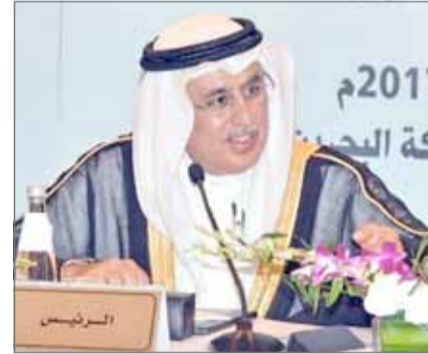
• الزباني يتأسس اللقاء