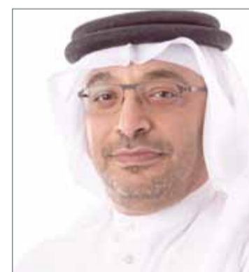
• الشيخ خالد بن إبراهيم

الجفير - ديوان الخدمة المدنية: نظم ديوان الخدمة المدنية ورشة عمل ضمن برنامج "الحقيبة التدريبية"، حيث تأتي هذه الورشة ضمن سلسلة ورش العمل للبرنامج والذي يعد أحد البرامج التدريبية التي تنظمها إدارة المعلومات الإدارية بديوان الخدمة المدنية للتدريب على صلاحيات نظام المعلومات الإدارية للموارد البشرية (HoRISON). من جانبه، أكد المدير العام للتوظيف والمعلومات الشيخ خالد بن إبراهيم آل خليفة أن البرنامج التدريبي يعد بمثابة أداة عملية تأتي امتداداً للجهود التي يبذلها ديوان الخدمة المدنية لتمكين إدارات الموارد البشرية في الجهات الحكومية من أداء مهامهم على أكمل وجه، من خلال تدريب المختصين بالموارد البشرية على استخدام صلاحيات نظام المعلومات الإدارية للموارد البشرية (HoRISON) بالشكل الأمثل.