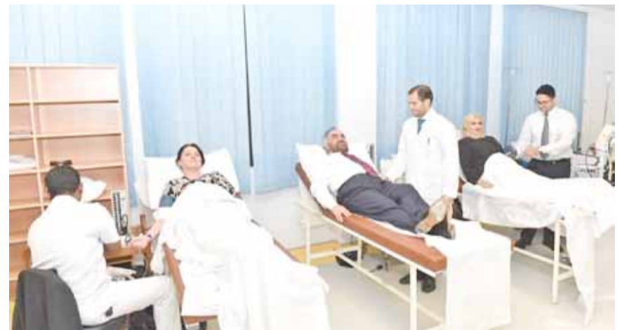
• من حملة التبرع بالدم

وبلغ عدد المتقدمين للتبرع 99 عاملاً بالشركة، مما يدل على توافر درجة عالية من الإحساس بالمساهمة الإنسانية وإدراك المعنى النبيل من وراء هذا التبرع. وجاءت الحملة في إطار سياسة الشركة لدعم المؤسسات والجهات الرسمية والحكومية والأهلية في المملكة، ومن منطلق قناعتها ودورها الرائد في الشراكة المجتمعية. وأشاد