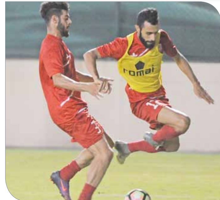
من تدريبات المنتخب