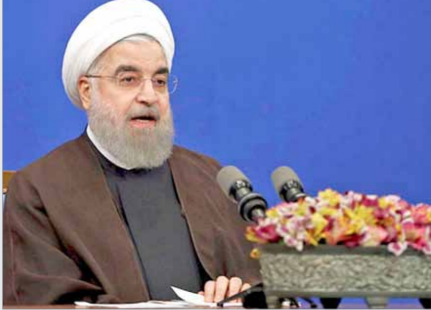
• الرئيس الإيراني حسن روحاني

منافسه المتشدد إبراهيم رئيسي كانت بمثابة رسالة إلى العالم أن طهران جاهزة للتوافق مع المجتمع الدولي، مضيفاً: "أردنا أن نقول للعالم إننا جاهزون للتفاعل على أساس الاحترام المتبادل والمصالح المشتركة". وأكد أن الانتخابات التي فاز فيها على