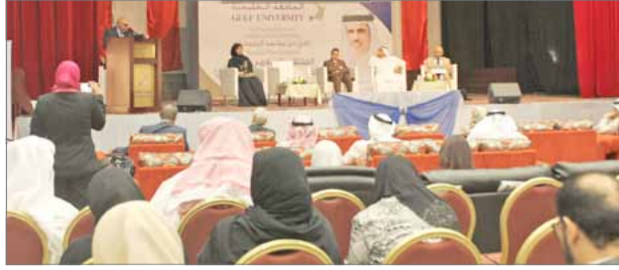
الجامعة الخليجية اختتمت فعاليات الملتقى الإعلامي الأول

الإعلاميين بالنظم والسياسات الاقتصادية حتى يتمكنوا من المعالجات الاقتصادية بشكل مهني، وإفتتاح أقسام جديدة للإعلام الاقتصادي يؤهل خريجه لممارسة الكتابة والبحث الاقتصادي بشكل إعلامي وأسلوب مهني يمكنه من معالجة الازمات الاقتصادية وفترات التحول التي تمر بها منطقة الخليج خصوصا والمنطقة العربية عموما.