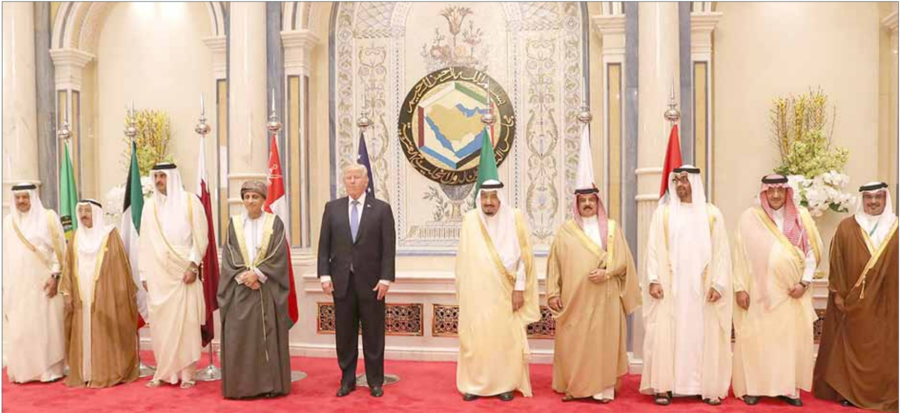
• القمة الاستثنائية الخليجية الأميركية استنكرت محاولة إيران بث الفرقة وإثارة الفتنة الطائفية

المنامة - بنا: برعاية كريمة من رئيس الوزراء صاحب السمو الملكي الأمير خليفة بن سلمان آل خليفة، تقيم الهيئة العامة للتأمين الاجتماعي وبالتنسيق مع جمعية الحكمة للمتقاعدين في التاسعة والنصف من صباح اليوم، الاحتفال السنوي الثاني لتكريم متقاعدي المملكة من القطاعين العام والخاص بفندق "آرت روتانا أمواج". وتأتي الرعاية الكريمة لسمو رئيس الوزراء الموقر للعام الثاني على التوالي لهذه الاحتفالية، تكريماً مضاعفاً للمكرمين من أصحاب العطاء في القطاعين العام والخاص الذين خدموا الوطن وساهموا في بناء نهضته لأكثر من 40 عاماً. الجدير بالذكر أنه قد تم اختيار المكرمين استناداً إلى عدة معايير تمثلت في عدد سنوات الخدمة مع الأخذ في الاعتبار سن المتقاعد وسبب انتهاء الخدمة، حيث سيتم تكريم حوالي 150 متقاعداً ومتقاعدة من القطاعين العام والخاص تقديراً لجهودهم المخلصة في بناء الوطن.