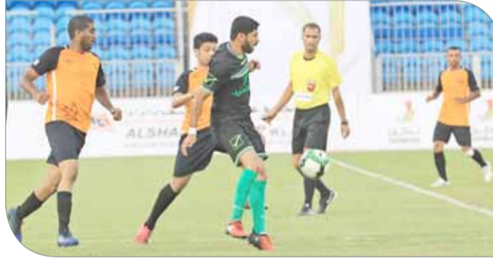
الوحدة يخطف أول 3 نقاط بتجاوزه الصقر الأبيض