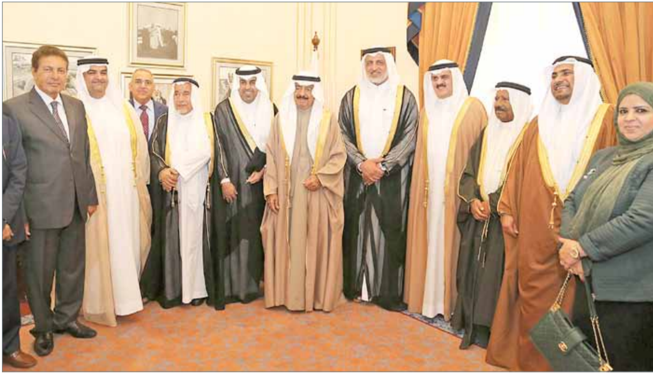
• سمو رئيس الوزراء مستقبلاً رئيس وفد البرلمان العربي

وخلال اللقاء، تسلم صاحب السمو الملكي رئيس الوزراء "درع البرلمان العربي" من السلمي، تقديراً لجهود سموه ودوره في دعم البرلمان العربي للقيام بأهدافه النبيلة في تعزيز العمل العربي المشترك.