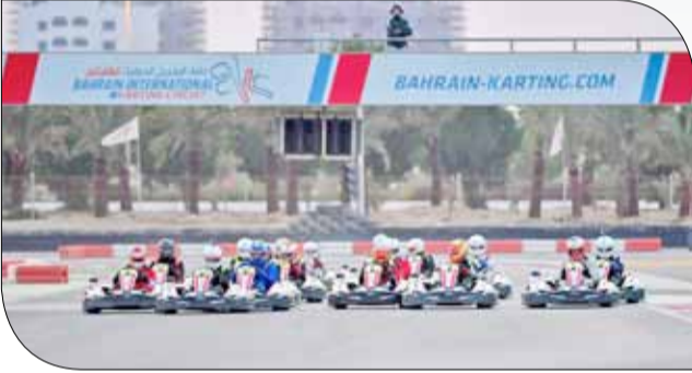
من بطولة الكارتنج

◆ الصخري - حلبة البحرين الدولية: تنطلق بطولة تحدي الكارتنج الرمضانية خلال شهر رمضان الكريم، وذلك لأول مرة على الإطلاق على مضمار حلبة البحرين الدولية للكارتنج، وذلك بجولتين حيث من المؤكد أن تشهد البطولة الأولى من نوعها مشاركة كبيرة ومميزة. وتقام هذه البطولة بتنظيم من حلبة البحرين الدولية للكارتنج والاتحاد البحريني للسيارات وذلك على مضمار CIK والباليغ طوله 1.414 كيلومتر، وسيارات من نوع سودي للكارتنج RT8 390CC. وتنطلق البطولة بجولتين الأولى في 5 يونيو والثانية 12 يونيو، كما وتشمل البطولة فئتين للمشاركة ضمن منافساتها الأولى للبالغين من عمر 15 سنة وأكثر، والفئة الأخرى للجونيوز من 12 سنة حتى 14 سنة، التسجيل لا يزال مفتوحاً للمشاركة ضمن أولى بطولة من نوعها، فلا تفوتوا فرصة المشاركة. وسيتم تكريم الفائزين بالبطولة الرمضانية بعدد من الجوائز القيمة أبرزها تجربة قيادة سيارة الكليو كب، اختبارك الأول في عالم رياضة السيارات، وذلك على مضمار حلبة البحرين الدولية، إلى جانب جولات بسيارات الرتاكس وذلك على مضمار حلبة الكارتنج. وتبدأ فعاليات الجولتين الأولى والثانية من 9:30 مساءً، وتدعو حلبة البحرين الدولية للكارتنج الجماهير للحضور ومحبي رياضة السيارات مجاناً لمشاهدة إثارة التحدي والمنافسات خلال شهر رمضان الكريم.