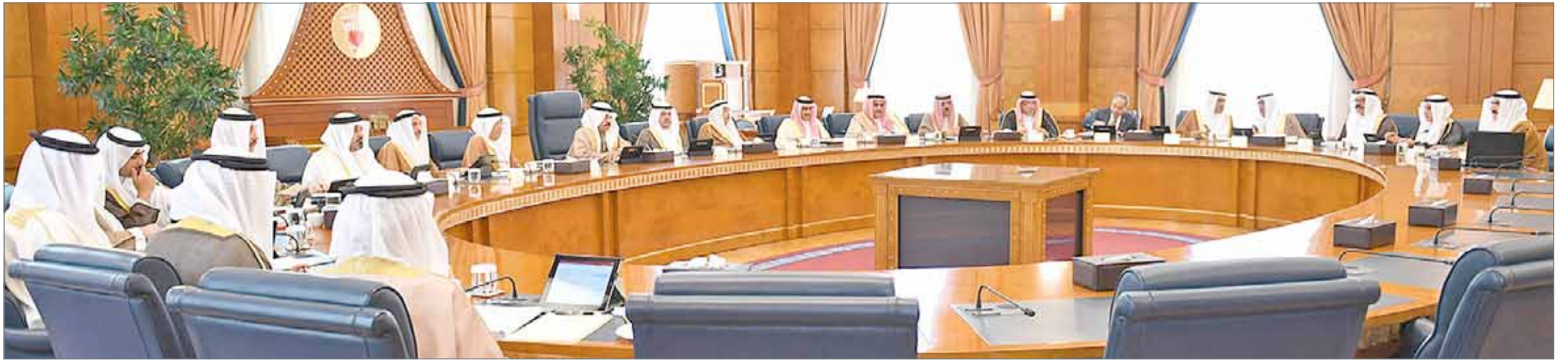
• سمو رئيس الوزراء مترشفا جلسة مجلس الوزراء أمس