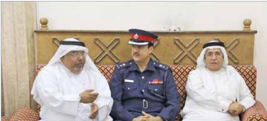
• جانب من النقاشات بالمجلس

يقع بين مصنع الثلج وجسر المحرق القديم البدء بمشروع "سعادة" ... مطاعم بحرية ورحلات