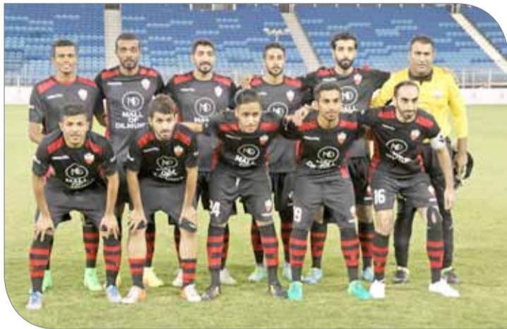
صقور البحرين يربد الوصول للانتصار الثاني

ربح النهائي وسيحسمانها بانتظار مواجهتهما في الجولة الثالثة لتحديد المتصدر، وفي المقابل فإن فريق فينكتوريس والفخامة وخصوصاً الأول فينكتوريس بهدف نظيف، ولهذا فإن انتصار الفريقين إن حدث فإنهما سيقطعان بطاقتي العبور والتأهل للدور