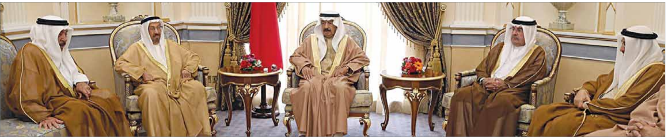
• سمو رئيس الوزراء مستقبلاً عدداً من أفراد العائلة المالكة الكريمة والمسؤولين بالمملكة