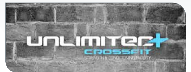
شعار "أونليمتد بلاس كروس فت"

♦ تقام في الساعة التاسعة من صباح يوم غد الجمعة منافسات بطولة اللياقة البدنية على صالة نادي "أونليمتد بلاس كروس فت" وذلك ضمن منافسات وفعاليات دورة ناصر بن حمد الرمضانية الثالثة للألعاب الرياضية "ناصر 10"، التي تحظى بشعبية كبيرة وحب فريد من نوعه ومتابعة جماهيرية واسعة ومنوعة على أكثر من صعيد رياضي واجتماعي، وفتح القائمون على التنظيم في النادي باب التسجيل في مسابقات البطولة والمشاركة في منافساتها للجنسين بهدف فتح المجال لجميع محبي وممارسي هذه الرياضة للاستفادة من هذه الفرصة المتميزة وما يوفره المنظمون للبطولة من أجواء رياضية مثالية للغاية وتسهيلات عديدة وجوائز قيمة تقدم إلى الفائزين وإلى الجماهير التي تحرص على الحضور وتهتم بمتابعة المسابقات المقامة ضمن هذا الحدث الرياضي الكبير. وحثت اللجنة المنظمة للبطولة جميع الراغبين في المشاركة من الجنسين على أهمية استثمار الوقت المتبقي والمبادرة بتسجيل أسمائهم والإسراع في تأكيد مشاركتهم من خلال زيارة صفحة النادي في الشبكة العنكبوتية على العنوان http://unlimited-pluscrossfit.com/enents ، وتأتي هذه البطولة إلى جانب بقية الألعاب المصاحبة لـ "ناصر 10" التي تحظى بعناية واهتمام سمو الشيخ ناصر بن حمد آل خليفة، وفي إطار حرص اللجنة المنظمة لهذا الحدث الرياضي الكبير على إشراك كافة الألعاب ضمن الاحتفالية بالنسخة العاشرة التي انطلقت منذ فترة زمنية بالعديد من الألعاب التي حققت مشاركة واسعة ولاقت النجاح الذي تستحقه، ويتوقع الجميع أن تنال بطولة اللياقة البدنية أيضاً نصيبها من النجاح المبهر على المستويين التنظيمي والفني وكذلك على مستوى المشاركة الواسعة والمتنوعة.