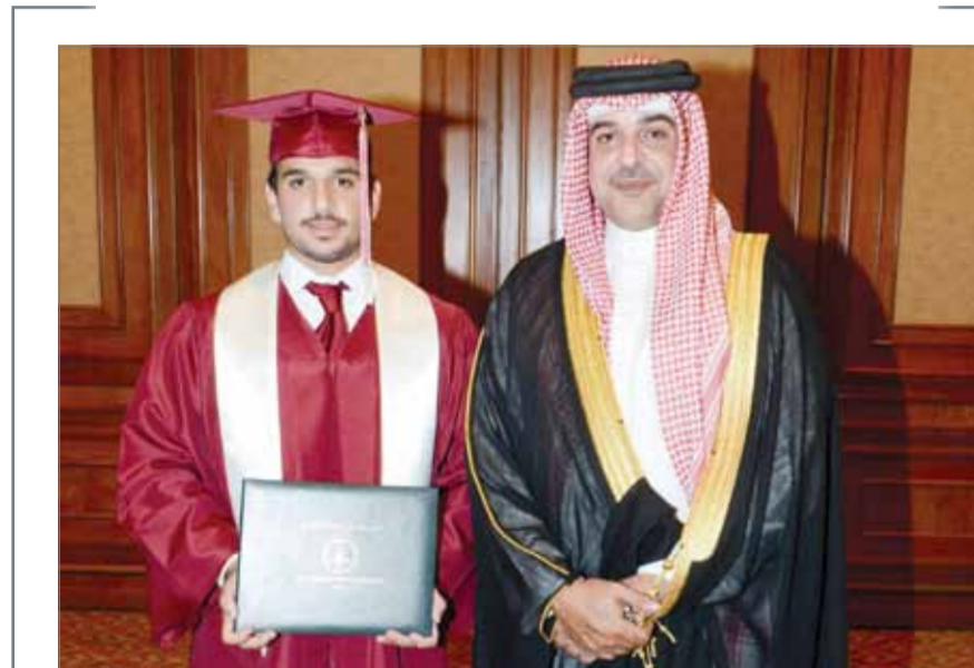
عبدالله بن حمد يهنئ نجله بتخرجه

المنامة - بنا: هنا الممثل الشخصي لجلالة الملك سمو الشيخ عبدالله بن حمد آل خليفة خليفة بن علي آل خليفة. كما هنا سموه جميع الطلبة والطالبات الخريجين، مشيداً بالمستوى المتميز الذي حققوه في دراستهم، متمنياً سموه لهم دوام التوفيق والنجاح. وهذه المناسبة، أعرب سمو الشيخ عيسى بن عبدالله آل خليفة عن سعاده التي أقامت مدرسة ابن خلدون الوطنية تحت رعاية رئيس الوزراء صاحب السمو الملكي الأمير خليفة بن سلمان آل خليفة مساء أمس في فندق الخليج. وأشاد سمو الشيخ عبدالله بن حمد آل خليفة بما بذله نجله سمو الشيخ عيسى بن عبدالله آل خليفة من جهد ومثابرة خلال مسيرته الدراسية، متمنياً سموه لسمو الشيخ عيسى بن عبدالله دوام التوفيق والنجاح، مبدياً سموه اعتزازه وفخره بالمستوى المتقدم الذي وصل إليه أبناء مملكة البحرين وحرصهم على طلب العلم لخدمة مجتمعهم ورفهته وازدهار وطنهم في ظل دعم ورعاية الوالد عامل البلاد صاحب