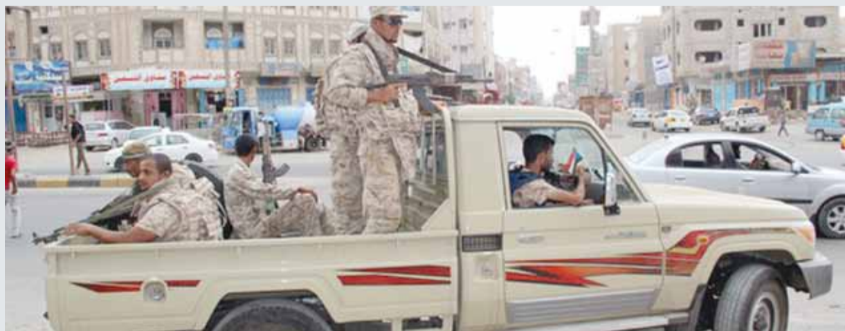
• عناصر من الجيش اليمني