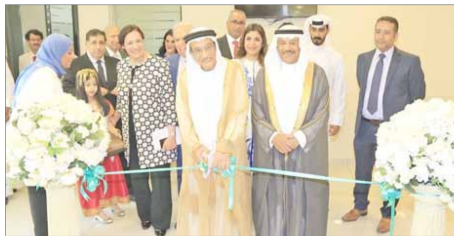
• خلال الافتتاح

فاعل في توفير الخدمات الصحية في المملكة، ومن جهة أخرى، يفتح النظام الباب لشركات التأمين الخاصة لتقديم خدماتها لمن يرغب من المواطنين والمقيمين مثل عمال الشركات بتوفير حزمة الخدمات المقررة بالاتفاق مع المستشفيات وصندوق الضمان بما يفتح باب المنافسة بين الجميع.