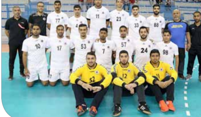
فريق باربار لكرة اليد