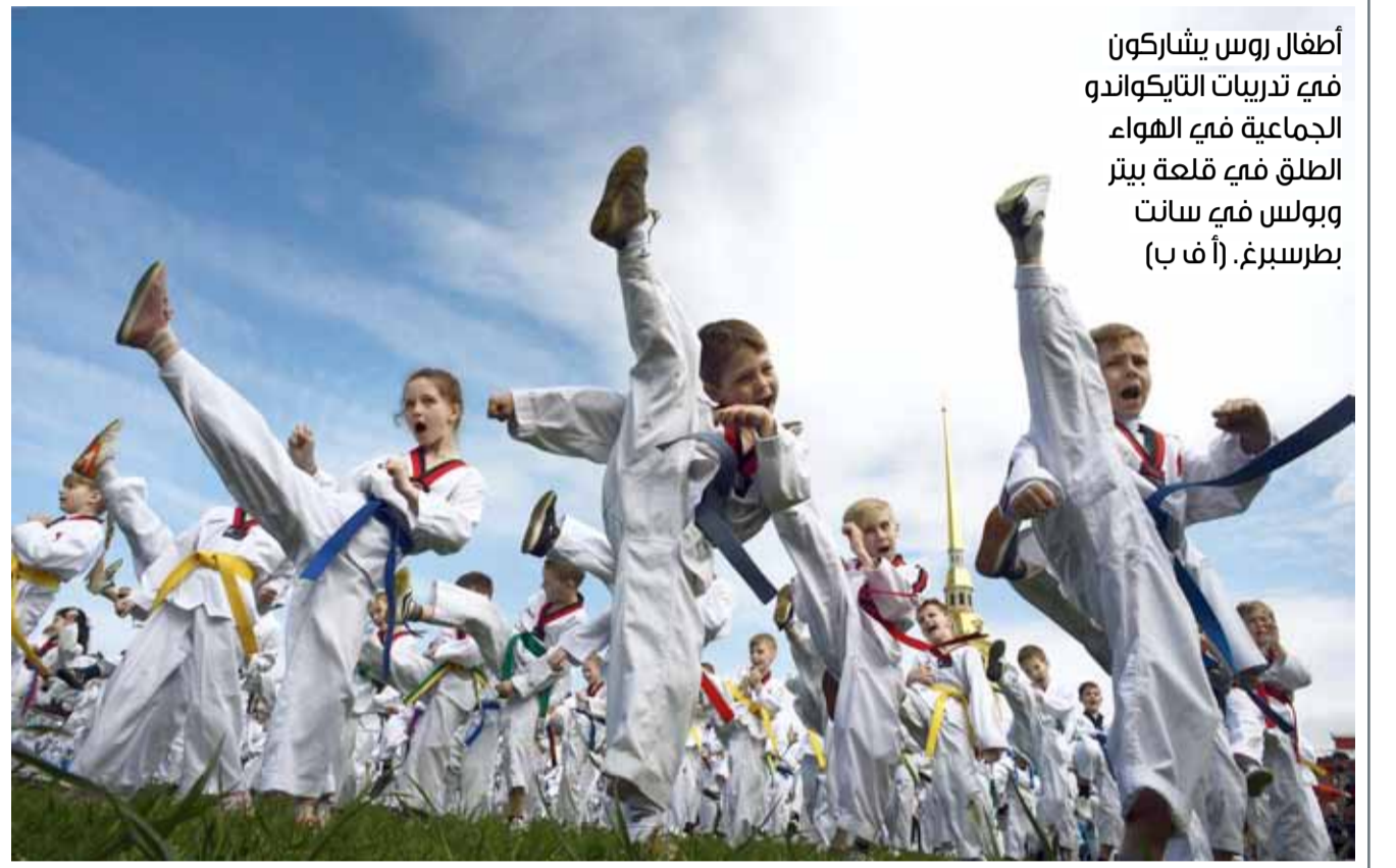
أطفال روس يشاركون في تدريبات التايكواندو الجماعية في الهواء الطلق في قلعة بيتر وبولس في سانت بطرسبرغ.

ولم يفلت مهرجان كان من سهامها أيضاً، إذ إنه لم يمنح جائزة السعفة الذهبية إلا مرة واحدة إلى امرأة هي النيوزيلندية جاين كامبيون عن فيلم "دي بيانو" العام 1993.