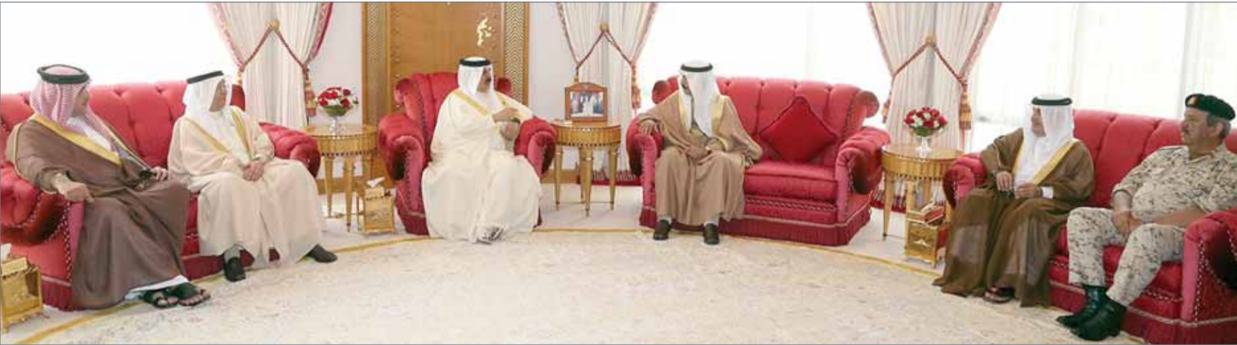
• جلالة الملك مستقبلاً سمو رئيس الوزراء وعدداً من كبار المسؤولين

المنامة - بنا: استقبل عاهل البلاد صاحب الجلالة الملك حمد بن عيسى آل خليفة في قصر الصخير أمس، رئيس الوزراء صاحب السمو الملكي الأمير خليفة بن سلمان آل خليفة وعدداً من كبار المسؤولين. واستعرض جلالته الملك في بداية اللقاء النتائج الطيبة للقاء التشاوري السابع عشر لقادة دول مجلس التعاون لدول الخليج العربية وقمة قادة دول مجلس التعاون والولايات المتحدة الأميركية، والقمة العربية الإسلامية الأميركية والتي استضافتها المملكة العربية السعودية. وأشاد جلالته بنجاح هذه اللقاءات والقمة المباركة والتي ستسهم بمشيئة الله في توطيد علاقات الشراكة الوثيقة والتعاون المشترك ونشر قيم التسامح والتعايش والسلام وترسيخ دعائم الأمن والاستقرار والسلم في المنطقة والعالم. وأكد أن هذه اللقاءات ستؤسس لمرحلة جديدة ومنطلق لتعزيز أمن واستقرار دولنا وشعبونا ومواجهة مختلف التحديات الراهنة في ظل ما تشهده المنطقة من أحداث ومتغيرات متلاحقة. وأشاد جلالته الملك في هذا الجانب بجهود المملكة العربية السعودية الشقيقة بقيادة خادم