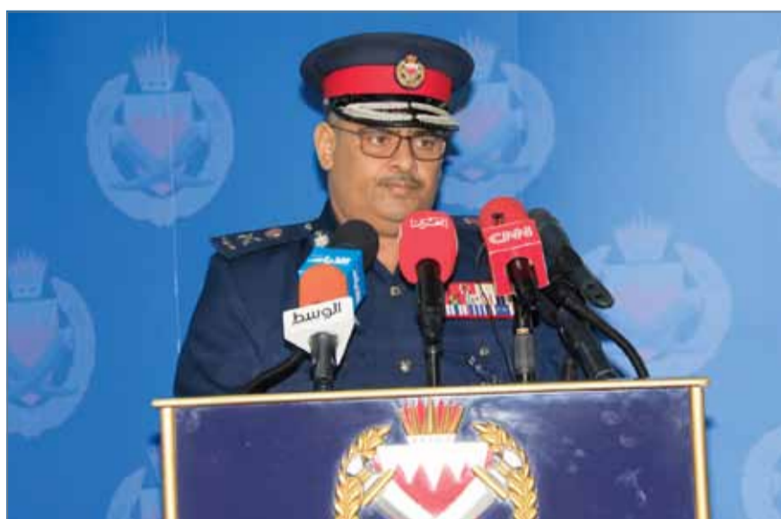
• اللواء طارق الحسن متحدثا في المؤتمر

التي تعرض لها رجال الأمن، فهي ترجع إلى أننا نتعامل بنهاية المطاف مع مواطنين، وحين يكون الأمن. وفي سؤال آخر من "البلاد" عن الغلبة الهاربة من السجن المركزي بجو، وإذ ما تم اعتقال أي فرد منها قال "مازلنا نفرز المتهمين، ولم يتبين لنا بعد إذ ما كان أي منهم من الهاربين من سجن جو المركزي، وعملية التحقيق والتأكد من الهويات تأخذ بعض الوقت". وفي سؤال ثالث من "البلاد" عن الأسباب التي حالت دون استخدام رجال الأمن القوة النارية عند تعرضهم للمجموعات القاتل والأسياخ والقنابل اليدوية والفؤوس قال الحسن "استخدام القوة النارية محول حسيما حدده القانون، وعلى هذا الأساس يتم التصرف، ووفقا لطبيعة الحدث نفسه".