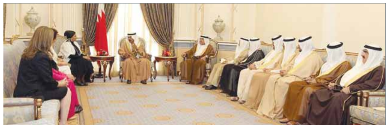
• سمو رئيس الوزراء مستقبلاً مجلس إدارة جمعية سيدات الأعمال البحرينية

بإعجاب العالم ومنظماتها. ونوهت بالمكانة المتميزة التي تبوأتها المرأة البحرينية على مختلف الأصعدة السياسية واقتصادية واجتماعية، وما تحظى به من تقدير ودعم مستمر من جانب الحكومة برئاسة سموه، مؤكداً أن دعم صاحب السمو الملكي رئيس الوزراء للمرأة زاد من حصص مشاركتها في الحياة الاقتصادية وأسهم في تمكين المرأة وزيادة قدراتها على قيادة دفة العمل الاقتصادي والسياسي والاجتماعي.