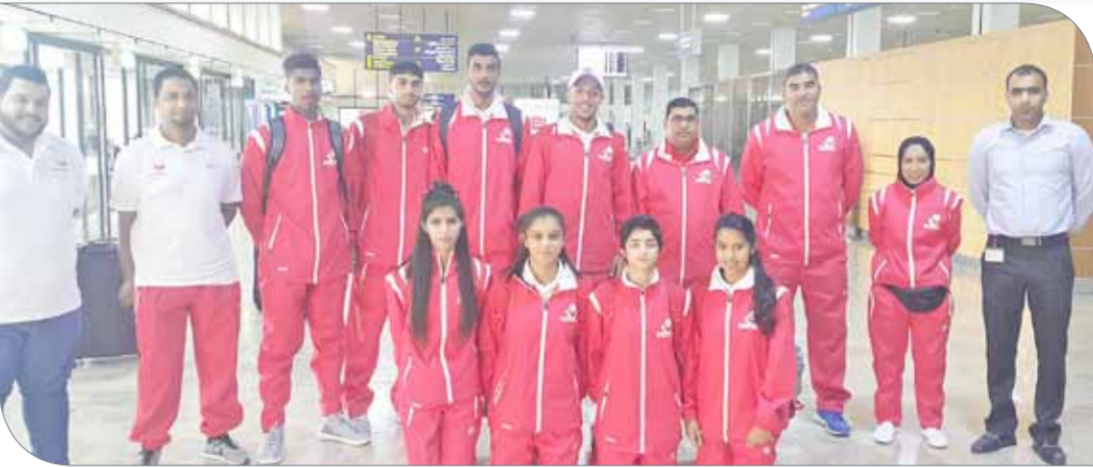
صورة جماعية للمنتخب

على توجيحات رئيس الاتحاد البحريني الظهور المشرف في هذه البطولة لكرة السلة سسمو الشيخ عيسى بن علي بن خليفة آل خليفة على أهمية فوزاً، وعبر التنسيق مع الجهاز الفني للمنتخب لتقديم الخطة الشاملة للتدريبات، حيث حرص الاتحاد على تقديم كافة أشكال الدعم والمساندة للمنتخب مستقبلاً زاهراً ومشرفاً.