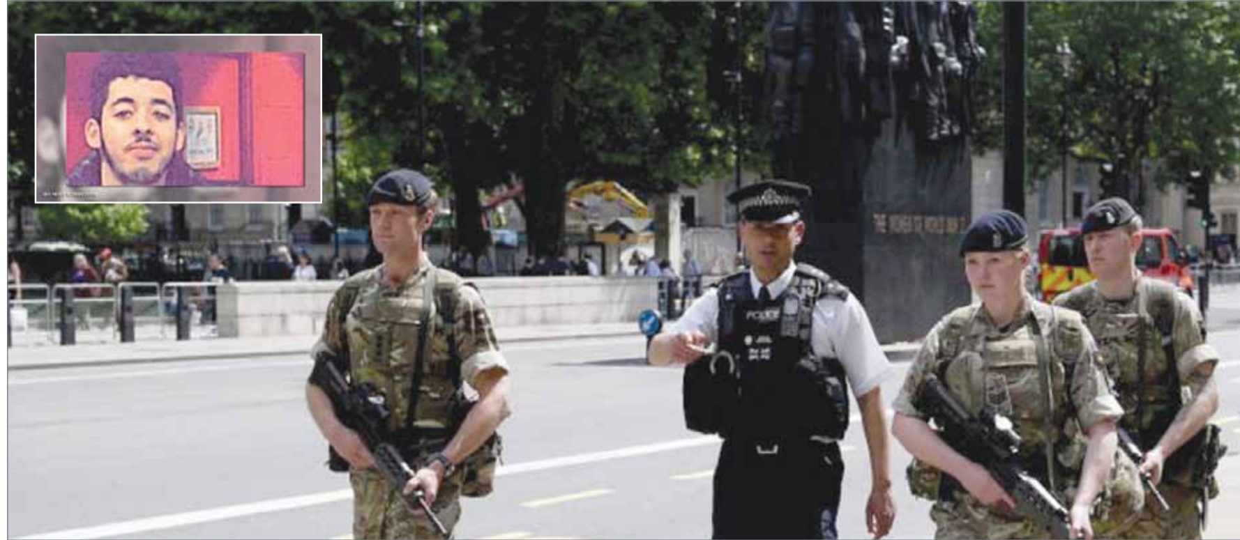
• عناصر من الجيش البريطاني انتشروا في الشوارع وفي الإطار منفذ التفجير

نفى الرئيس المصري عبدالفتاح السيسي أمس الأربعاء اتهامات الرئيس السوداني عمر البشير لمصر بدعم متمردين في السودان. ويوم الثلاثاء قال البشير إن الجيش السوداني صادر مركبات مصرية مدرعة من المتمردين في منطقة دارفور بغرب البلاد التي يمزقها الصراع. وقال السيسي في مؤتمر صحافي مع المستشار النمساوي كريستيان كيرن بالقصر الجمهوري بالقاهرة "سياسة مصر ثابتة ولا تتغير ولن تتغير... وهي عدم التدخل في شؤون الآخرين". وأضاف أن "النقطة الثانية التي أكدها: مصر لا تتأمر". ودبت خلافات بين مصر والسودان في الأشهر القليلة الماضية بشأن قضايا عدة بدءا من أراضٍ متنازع عليها في جنوب مصر وانتهاء بقيود تجارية وشروط خاصة بتأشيرات السفر هدفت العلاقات التجارية بين البلدين. ومن المقرر أن يزور وزير الخارجية السوداني مصر الأسبوع المقبل للعمل على تخفيف حدة التوتر بين البلدين.