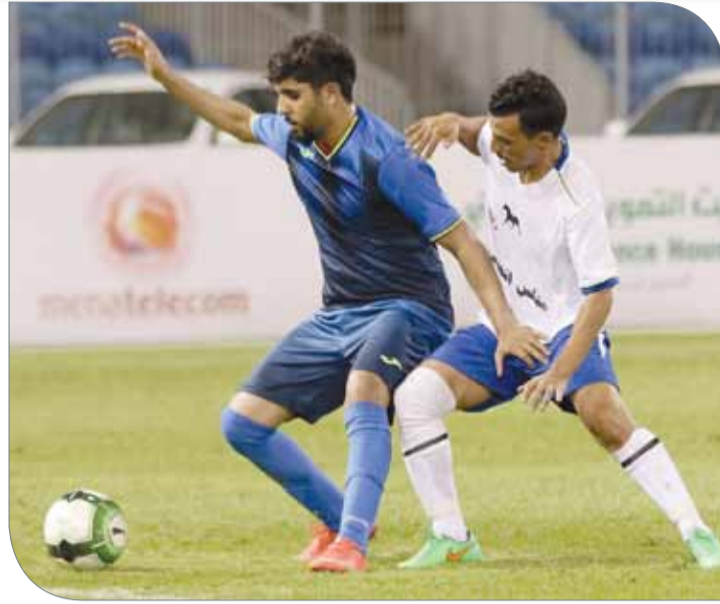
من لقاء الحصان الأسود والزعيم

بالتعادل الإيجابي بهدف لمثله بين الفريقين ليخرج كل فريق بنقطة واحدة، لتكون فرق المجموعة الرابعة في دورة ناصر 10 جميعها