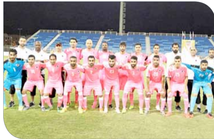
فينكتوريس في صراع تعويض خسارة المباراة الأولى

وصقور البحرين برصيد متساو "3 نقاط" لكليهما بعد تفوق جرناس على الفخامة للسيارات بهدفين نظيفين، وصقور البحرين الذي أسقط فينكتوريس بهدف نظيف، ولهذا فإن انتصار الفريقين إن حدث فإنهما سيقطعان بطاقتي العبور والتأهل للدور