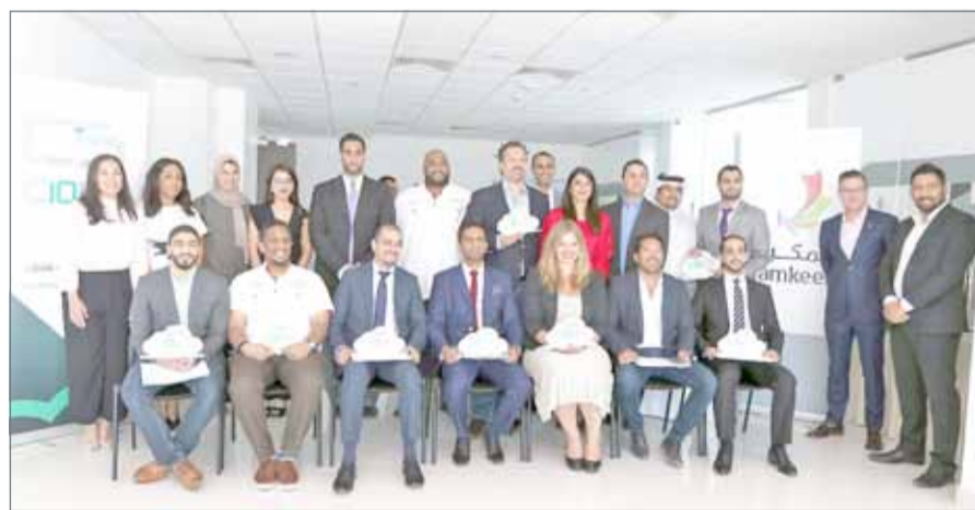
ممثلو الشركات الثمان المشاركة في البرنامج

إذ يقوم بتقديم الإرشادات للشركات الناشئة من خلال سلسلة دورات تدريبية منظمة تسمح لهم بالنفاذ إلى شبكة دولية من المستثمرين والعلاقات التجارية.