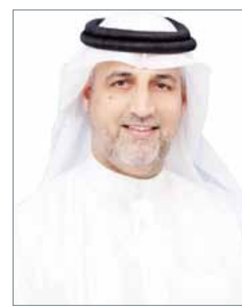
• محمد الجودر

حزم، وأرسلت رسالة واضحة للمتأمرين في الخارج والداخل بأننا لسنا لقمة سائغة ولن نقف مكتوفي الأيدي أمام من يريد التشر لدولتنا ولحكمانا. وجدد الجودر ندائه وتحذيره للشباب المغرر بهم ومثيري الشغب، الذين يعيثون في الممتلكات فساداً ويتعدون على مصالح المواطنين والمقيمين، مشيراً إلى أن هؤلاء يعملون بإرادتهم على تدمير مستقبلهم وهم شروة الوطن الحقيقية، داعياً الأهالي لتحصين أبنائهم من الأفكار الطائفية المستوردة، وغرس قيم المواطنة والتعايش في قلوبهم.