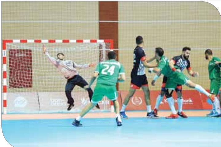
جانب من منافسات الدورة في كرة اليد

وشعب مضياف منفتح على العالم، ومن خلال استضافة دورة الألعاب