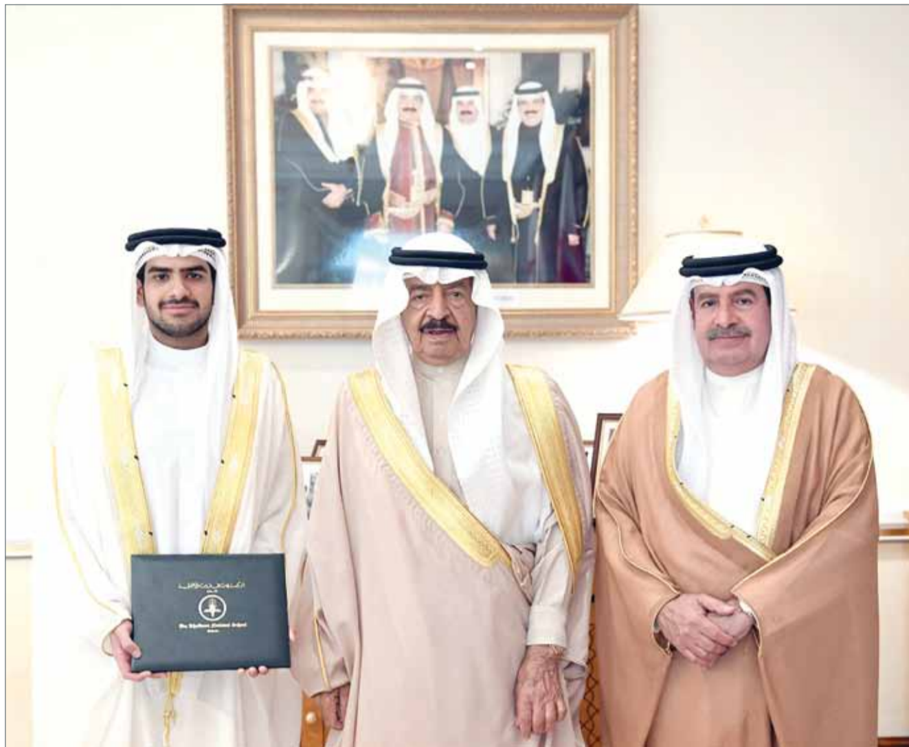
• سمو رئيس الوزراء وبحضور سمو الشيخ علي بن خليفة مستقبلاً حفيد سموه سمو الشيخ خالد بن علي

المنامة - بنا: استقبل رئيس الوزراء صاحب السمو الملكي الأمير خليفة بن سلمان آل خليفة، بحضور نائب رئيس مجلس الوزراء سمو الشيخ علي بن خليفة آل خليفة، حفيد سموه سمو الشيخ خالد بن علي بن خليفة آل خليفة؛ وذلك بمناسبة تخرجه بتفوق عال ضمن الفوج السادس والعشرين من مدرسة ابن خلدون الوطنية. وهنا صاحب السمو الملكي رئيس الوزراء حفيد سموه سمو الشيخ خالد بن علي بن خليفة آل خليفة بمناسبة تخرج سموه بتفوق عال مما يعكس روح المثابرة التي تميز بها طوال فترة الدراسة وحرصه على التميز العلمي، مشيداً سموه بما يبديه سمو الشيخ خالد بن علي من اهتمام دائم بالتحصيل العلمي والشغف لكل ما هو جديد في ميادين العلم والمعرفة.