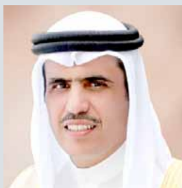
• وزير الإعلام