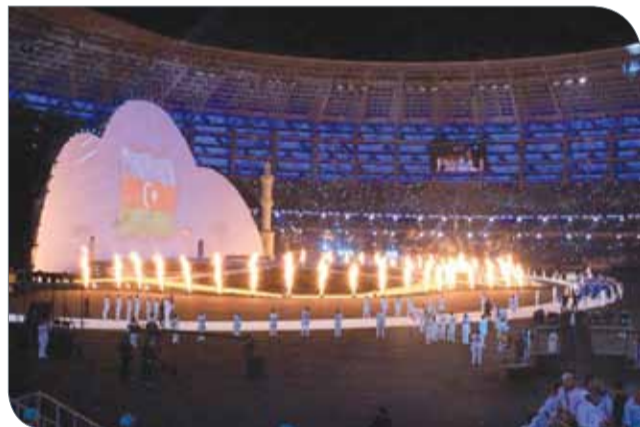
الافتتاح تضمن لوحات فنية رائعة

حفل الختام الذي أقيم على ستاد باكو الأولمبي لم يكن أقل جمالا من حفل الافتتاح، حيث استعرض فقرات تراثية وتاريخية للحضارة الإسلامية مكملا ما تم سرده من أحداث فريدة واستعراضات متنوعة في حفل الافتتاح.