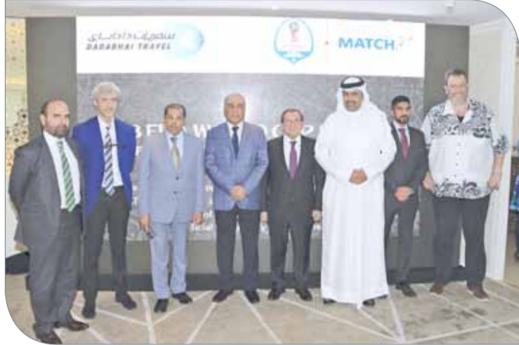
السفير الروسي يتوسط كبار الحضور والمتحدثين