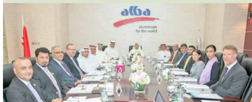
• اجتماع مجلس إدارة ”ألبا“