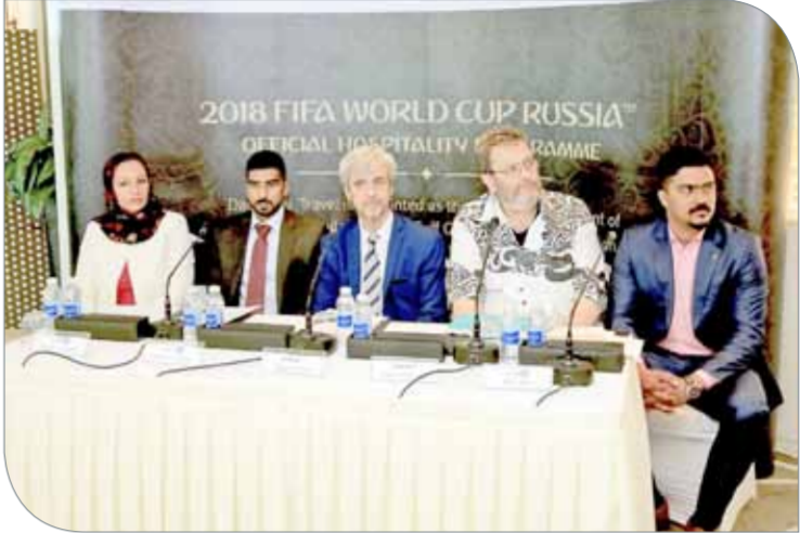
جانب من المؤتمر الصحافي