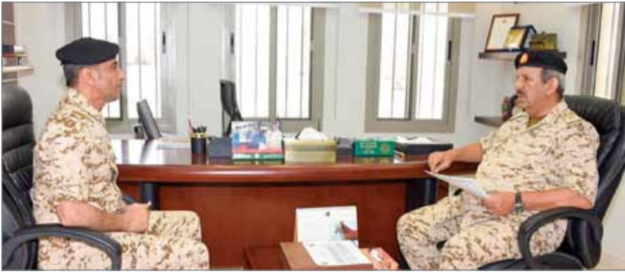
القائد العام متفقدًا إحدى الوحدات

لتحقيق جاهزية القتالية المنشودة لمواجهة سائر التحديات. وأضاف "نفخر بأبناء هذا الوطن الغالي من رجال قوة الدفاع الذين ينفذون الواجب الوطني بكفاءة عالية وروح معنوية راسخة في مختلف مواقع العمل العسكري داخل مملكة البحرين وخارجها".