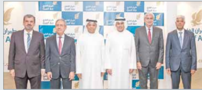
• أعضاء مجلس الإدارة

المحرق - طيران الخليج: عقد أمس الاجتماع الأول لمجلس إدارة شركة طيران الخليج الجديد بعد تعيين أعضائه الجدد برئاسة وزير الصناعة والتجارة والسياحة زايد الزياني، والذي شهد مناقشة عدد من الشؤون الداخلية للناقلة. وفي معرض حديثه أكد الزياني: إننا متفائلون بما يحمله المستقبل بالنسبة لطيران الخليج، وما ستنتج عنه الجهود المشتركة لمجلس إدارة الناقلة وفريق إدارتها وقواها العاملة ومختلف شركائها التجاريين لتنفيذ إستراتيجية الأعمال التي ستسهم بشكل كبير في تحقيق الأهداف الرئيسية للناقلة الوطنية، وتعزيز مكانة طيران الخليج كأحد أصول البنية التحتية الوطنية التي تخدم صناعة الطيران والمصالح الاقتصادية للمملكة". وأشار إلى أن مجلس الإدارة سيمضي في مراجعة الخطة الإستراتيجية لطيران الخليج، لكي تتوافق مع المستجدات والظروف المستقبلية حتى تؤدي رسالتها