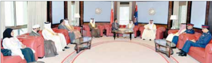
وزير الداخلية مستقبلاً عدداً من النواب

الموضوعات ذات الاهتمام المشترك والتي من شأنها تعزيز التعاون والتنسيق بين وزارة الداخلية ومجلس النواب؛ وذلك تحقيقاً لمزيد من الأمن والاستقرار في ربوع البلاد. وفي نهاية اللقاء، جدد أعضاء مجلس النواب دعمهم الثابت لوزارة الداخلية ومنتسبها كافة، لما فيه خدمة الوطن والمصالح العام، وحرصهم على أهمية تطوير التشريعات، بما يضمن حفظ الأمن والأمان للمواطنين والمقيمين وحماية مقدرات الوطن.