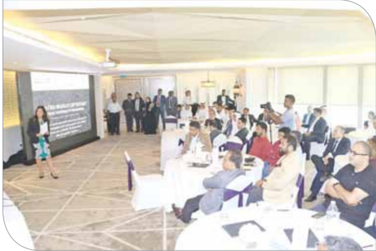
مقدمة المؤتمر تعرف بالنواقيص