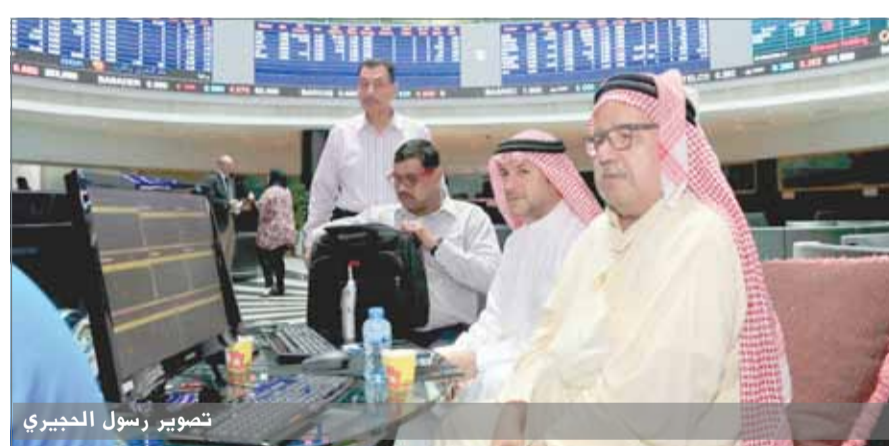
• متداولون في بورصة البحرين

عسكر - ألبا: قطعت شركة ألمنيوم البحرين (ألبا)، خطوات ثابتة على طريق تحقيق مشروع الخط السادس للتوسعة، وذلك وفق تصريح لرئيس مجلس إدارة شركة ألبا الشيخ دعيج بن سلمان بن دعيج آل خليفة. جاء التصريح خلال الاجتماع الفصلي الثاني لمجلس الإدارة لهذا العام، والذي عقد أمس الخميس. وأضاف الشيخ دعيج آل خليفة: ”نحن سعداء لتمكنا من تأمين القسم الأول من القرض الممنوح من قبل وكالة الصادرات الائتمانية بقيمة حوالي 700 مليون دولار، ومن المتوقع أن نتكمن من إغلاق القسم الثاني من هذا القرض - والذي يتراوح بين 300 و400 مليون دولار - مع نهاية الربع الثالث من هذا العام، مما سيؤمن تمويل مشروع الخط السادس للتوسعة بالكامل. وأردف: ”نتطلع لاستئناف الإنتاج في الخط الخامس بالكامل بشكل آمن وفي أقرب وقت ممكن“. وصادق المجلس على محضر الاجتماع السابق الذي عقد بتاريخ 9 فبراير 2017 وعضوية اللجان الثلاث التابعة لمجلس الإدارة.