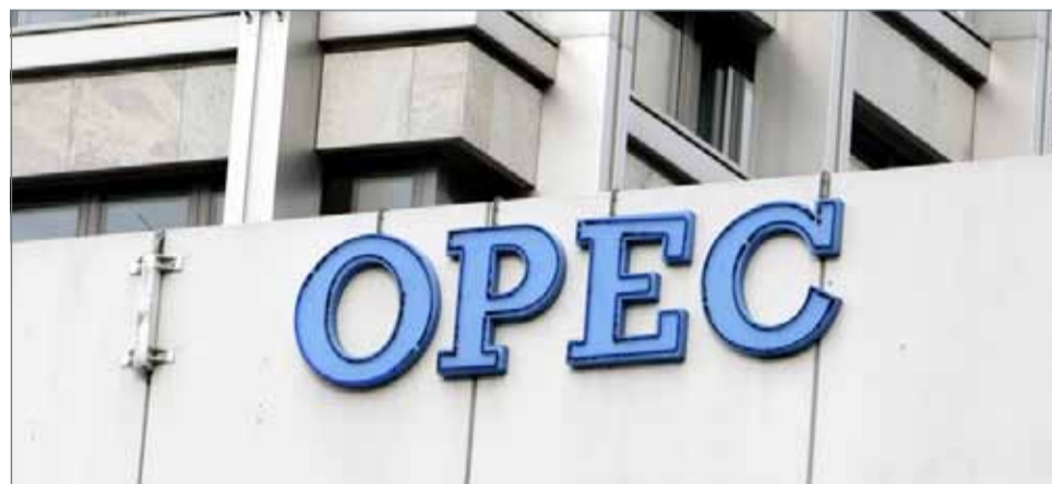
● منظمة أوبك