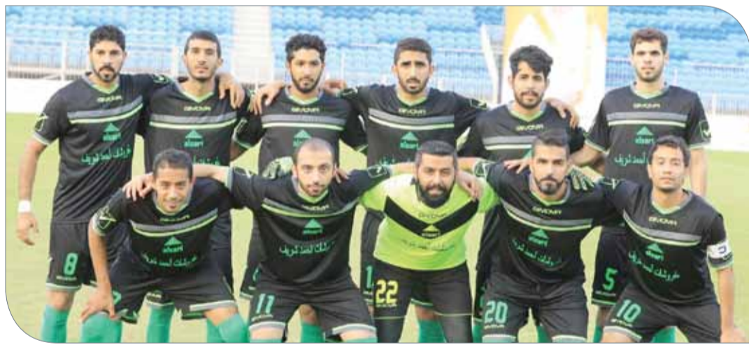
سعيه وحداه في بلوغ النقطة السادسة

◆ تُقام اليوم "الجمعة" على استاد مدينة خليفة الرياضية، مباريات الجولة الثانية لحساب المجموعة الثالثة من الدور الأول في منافسات كرة القدم بدورة "ناصر 10"، حيث تقام مواجهتين الأولى تجمع بين فريقي النوايف والوحدة عند الساعة الخامسة وخمسين دقيقة مساءً، والثانية تجمع بين فور إيغر والصقر الأبيض عند الساعة الثامنة مساءً، وإذا كان اليوم هو الأول من شهر رمضان المبارك فستبدأ المباراة الأولى عند التاسعة مساءً والثانية الساعة الحادية عشرة والربع. اللقاء الأول سيكون الأبرز في مواجهات هذا المساء، فهو يجمع المنتشيان فريقياً النوايف والوحدة والقادمين من انتصارين ثمينين بالجولة الأولى في هذه المجموعة، فالنوايف نجح في تسجيل فوز مهم على حساب فريق فور إيغر بنتيجة هدف نظيف، فيما استطاع الصقر الأبيض تجاوز عقبة الصقر الأبيض بهدفين مقابل هدف. المباراة الثانية، ستكون مهمة لفريق فور إيغر وفريق الصقر