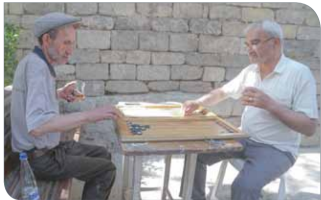
الشعب الأذربيجاني طيبة وبساطة

يتمتع الشعب الأذربيجاني بروح مرحية وأخلاق عالية ورغبة كبيرة في تقديم يد العون والمساعدة لجميع ضيوف الدورة، ورغم أن الغالبية منهم لا يجيدون التحدث باللغة الإنجليزية أو العربية بطبيعة الحال إلا أنهم يسعون لتقديم المساعدة قدر الإمكان إذا ما فهموا بالإشارة أو بقليل من الكلمات الإنجليزية، أما المتطوعون والمتطوعات فإنهم لا يدخرون جهداً في تقديم كافة أشكال الدعم والمساعدة وتقديم النصح والمشورة، والأهم من ذلك انعدام حالات النصب والاحتيال من قبل سواق التاكسي أو المطاعم وباقي الخدمات الأخرى، مع توفر عنصر الأمن والأمان وتراجع مستوى الجريمة في هذا البلد الذي يعيش كأُسرة واحدة بمختلف طوائفه وأديانه، كما تتميز العاصمة باكو بصورة عامة بالعصرية والحداثة والنظافة والمباني العملاقة الفاخرة.