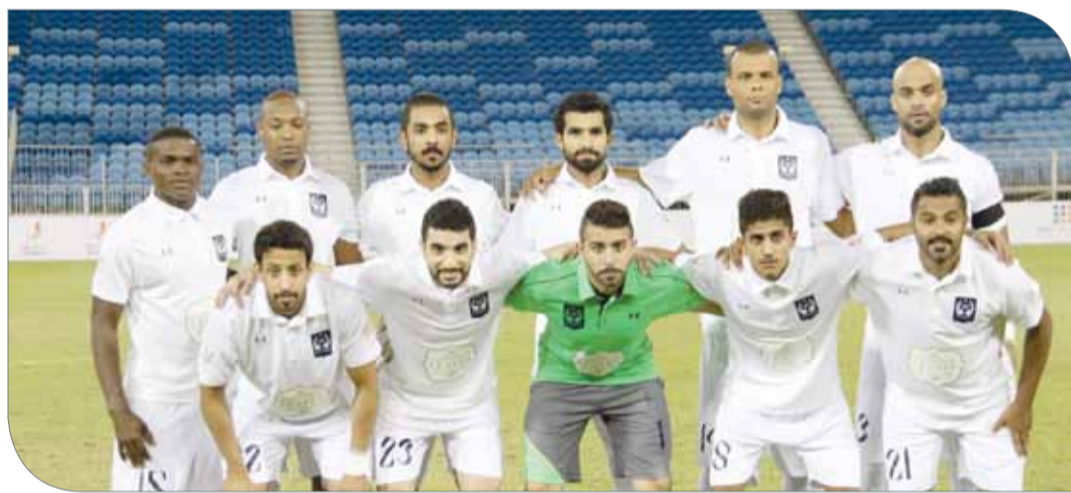
النوايف يرغب في تحقيق الفوز الثاني على التوالي