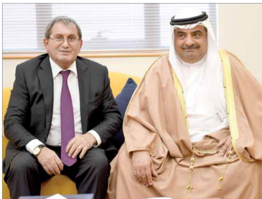
• سمو الشيخ سلمان بن خليفة مستقبلاً السفير الروسي

المنامة - بنا: استقبل مستشار صاحب السمو الملكي رئيس مجلس الوزراء سمو الشيخ سلمان بن خليفة آل خليفة سفير جمهورية روسيا الاتحادية لدى مملكة البحرين فاغيف غاراييف، حيث سلم سموه خطاب من مستشار الرئيس الروسي أناتولي فيج كوبيكوف. وأعرب سموه عن خالص شكره وتقديره، مثنيا على الجهود التي يبذلها سفير جمهورية روسيا الاتحادية في مملكة البحرين من أجل تعزيز العلاقات المثمرة بين بلدينا الصديقين والتي من شأنها تعزيز العلاقات الاقتصادية والتجارية والاستفادة من خبرات الشركات الروسية في مجالات مختلفة. من جانبه عبر سفير جمهورية روسيا الاتحادية لدى مملكة البحرين عن خالص شكره وتقديره لسمو الشيخ سلمان بن خليفة آل خليفة على التشجيع والدعم لتعزيز العلاقات بين البلدين الصديقين.