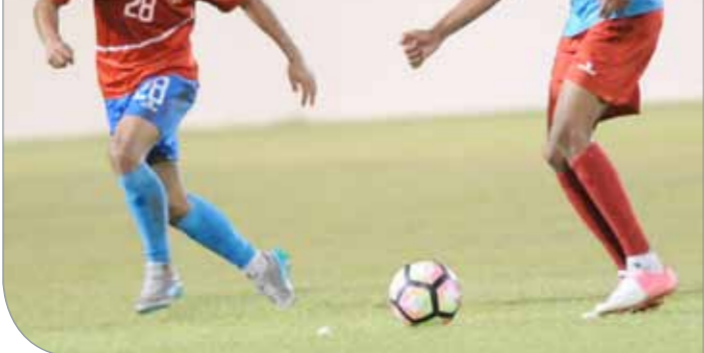
من المباراة أمس

التحضيرات قبل المباراة الودية التي ستجمعه منتخب فلسطين يوم 6 يونيو المقبل على أرضية استاد البحرين الوطني، إذ سيدخل المنتخب مسعكرا داخليا قبل يومين من مواعدها. وسيغادر المنتخب بعد لقاء فلسطين الودي إلى تركمانستان وبالتحديد يوم 11 يونيو، إذ