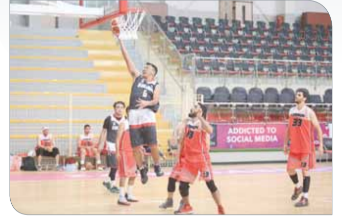
من منافسات الدور التمهيدي لبطولة جاليات كرة السلة

◆ تقام اليوم "الجمعة" منافسات الدور قبل النهائي لبطولة كرة السلة للجاليات والتي تقام ضمن فعاليات دورة ناصر بن حمد للألعاب الرياضية الثالثة "ناصر 10" على صالة الاتحاد البحريني لكرة السلة. ويواجه في المباراة الأولى الفريق الأمريكي منافسه الفريق الهندي وذلك عند الساعة 10 صباحاً على أن تقام المباراة الثانية والتي ستجمع بين الفريق الفلبيني C والفلبيني B في تمام الساعة 11:30 صباحاً بينما ستقام مباراة تحديد المركزين الثالث والرابع عند الساعة 3:45 عصرًا. وحددت اللجنة المنظمة للدورة يوم الجمعة الموافق 2 يونيو موعداً لإقامة المباراة النهائية لبطولة الجاليات لكرة السلة. وشارك في البطولة 6 فرق تم تقسيمهم على مجموعتين وضمت المجموعة الأولى الفريق الأمريكي والفريق اللبناني والفريق الفلبيني B فيما وضمت المجموعة الثانية كل من الفريق الفلبيني A والفريق الهندي والفريق الفلبيني C. يذكر أن بطولة الجاليات لكرة السلة تأتي متوافقة مع توجيهات سمو الشيخ ناصر بن حمد آل خليفة في إشراك الجميع في دورة سموه للألعاب الرياضية باعتبار البطولة إحدى ثمار الشراكة المجتمعية بين اللجنة المنظمة العليا وفئات المجتمع المحلي والجاليات علاوة على أن المشاركة الكبيرة من قبل الجاليات تؤكد حرصهم على التفاعل المستمر مع البطولات الرياضية.