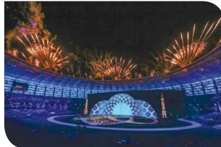
جانب من حفل الافتتاح

والمجمعات التجارية وشبكة المواصلات وكوادر بشرية على أعلى المستويات