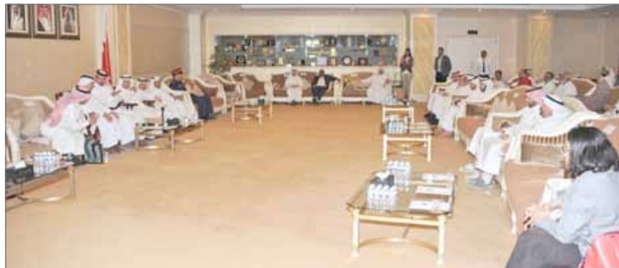
• الشيخ أحمد بن حمد أثناء لقاء الغرف الخليجية أمس