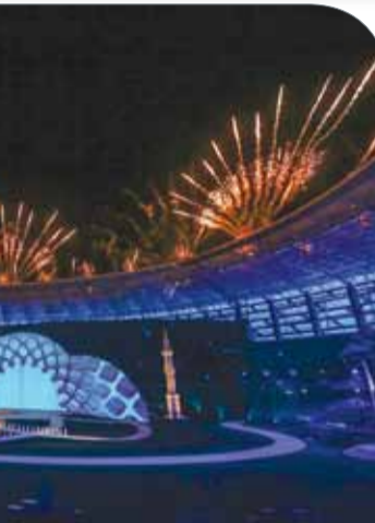
جانب من حفل الافتتاح

بنس تحتية متطورة وملاعب حديثة وخدمات رائعة مثل الفنادق والمطاعم