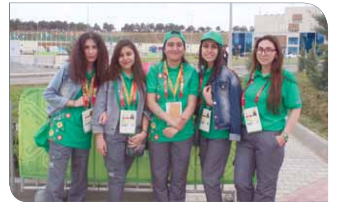
المتطوعات في الدورة

استطاعت اللجنة المنظمة أن تروج للدورة في كافة أنحاء باكو، فمُنذ أن وطأت أقدامنا مطار حيدر علييف الدولي، اتضح لنا الاستعدادات المكثفة، لدرجة أن المطار تحول إلى خلية نحل، من خلال وجود أعداد كبيرة من المتطوعين الذين كانوا في استقبال المنتخبات المشاركة مرتدين الزي الرسمي للدورة، وتزينت شوارع العاصمة باكو بشعارات وأعلام الدورة، وخصصت اللجنة المنظمة سيارات تاكسي خاصة وضعت عليها ملصقات وشعارات الدورة، بالإضافة إلى الحافلات الخاصة بنقل الرياضيين من القرية الرياضية إلى الملاعب، وانتشرت أكشاك بيع التذكارات في جميع المجمعات التجارية وسط إقبال كبير على شرائها، وفي قلب العاصمة باكو في السوق القديم خصص مكان لبيع جميع المتعلقات التذكارية الخاصة بالدورة مثل التوعية والشعارات وغيرها، كما استطاعت اللجنة المنظمة أن تصل إلى الكثير من الجماهير باستخدام مختلف وسائل الإعلام وبالأخص وسائل التواصل الاجتماعي الخاصة بالدورة إضافة إلى قنوات التلفزة والصحف التي خصصت مساحات واسعة لتغطية فعاليات الدورة.