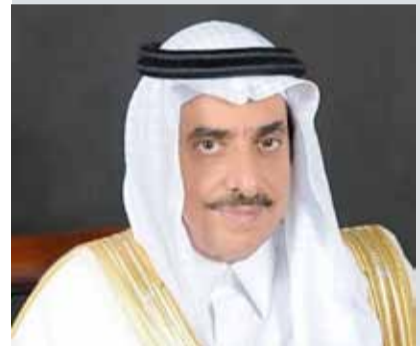
عبدالله آل الشيخ

المنامة - بنا: أكد سفير خادم الحرمين الشريفين في مملكة البحرين عبدالله بن عبدالمك آل الشيخ أن أمن مملكة البحرين جزء لا يتجزأ من أمن المملكة العربية السعودية بشكل خاص، وأمن دول مجلس التعاون الخليجي بشكل عام. وقال آل الشيخ في تصريحات لوكالة أنباء البحرين "بنا" إن السعودية تقف إلى جانب البحرين وتؤيد الإجراءات كافة التي تتخذها لحفظ أمنها واستقرارها وسلامة وأمن مواطنيها. وأوضح أن الإجراءات الأخيرة التي اتخذتها وقامت بها الأجهزة الأمنية لحفظ النظام العام والسلم الأهلي وتطبيق القانون في إزالة المخالفات والتجاوزات، وإرجاع الوضع الطبيعي كانت شرعية ومطلوبة وتصب في اختصاص وزارة الداخلية؛ من أجل حماية الأمن الداخلي والمواطنين، وتسهيل وتيسير مصالحهم على أرض المملكة.