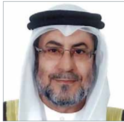
• غانم البوعيين

والخدمات الطبية الملكية التابعة لقوة دفاع البحرين والخدمات الطبية بمستشفى الملك حمد الجامعي، وإدارة الشؤون الصحية والاجتماعية بوزارة الداخلية، ومنهم 1945 فقط بوزارة الصحة. وبخصوص ما تم الإشارة إليه حول رد وزير شؤون مجلسي الشورى والنواب غانم البوعيين نود التنويه أنه كان يتعلق فقط بعدد الذين تم توظيفهم ضمن المجالات الطبية في وظائف تخصصية بالكادر الطبي والطبي المساند والبيطري في القطاع الحكومي فقط خلال السنوات من 2011 إلى 2016م والبالغ عددهم 540 موظف. وختاماً نود الوزارة التأكيد على أهمية أن تكون وسائل الإعلام شريكة للوزارة بنقل المعلومات الصحيحة التي تكتب وتنشر للرأي العام في تطوير العمل الصحي والتعاون مع الوزارة بما يخدم مصالح الوطن والمواطنين، على أن يكون التواصل مستمر من خلال قنوات التواصل الرسمية التي حدتها الوزارة.