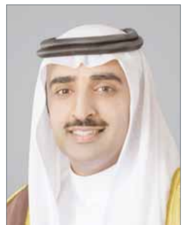
● الشيخ محمد بن خليفة

سيساعد على إحداث توازن في السوق النفطية والمحافظة على متوسط أسعار مناسبة لجميع الأطراف.