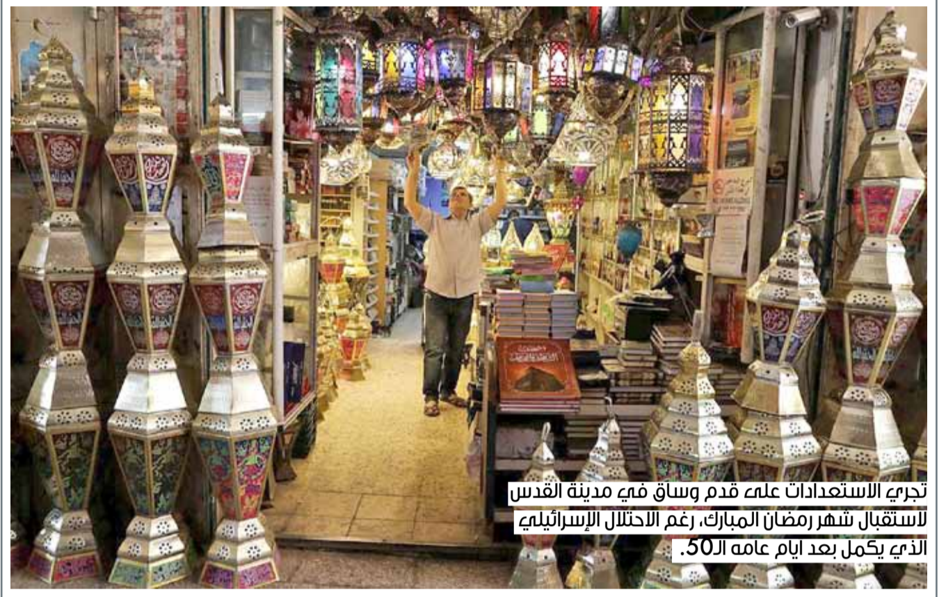
تجربة الاستعدادات على قدم وساق في مدينة القدس لاستقبال شهر رمضان المبارك، رغم الاحتلال الإسرائيلي الذي يكمل بعد أيام عامه الـ50.

الرياح شمالية غربية من 13 إلى 18 عقدة وتصل من 20 إلى 25 عقدة أحيانا. ارتفاع موج البحر من قدم إلى 3 أقدام قرب السواحل، ومن 3 إلى 6 أقدام في عرض البحر. درجة الحرارة العظمى 36 درجة مئوية، والصغرى 28 درجة مئوية.