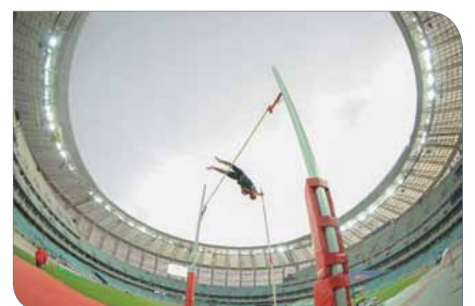
ستاد باكو الأولمبي تحفة رياضية

تعتبر المنشآت والملاعب الرياضية من أهم الركائز الأساسية لاحتضان الدورات والبطولات الرياضية، حيث إن المعيار الأساسي في إسناد عملية التنظيم لأي دولة هي المنشآت التي تقام عليها الحصص التدريبية والمنافسات الرياضية، وأذربيجان تمتلك منشآت عصرية حديثة في روعة الجمال ومصممة وفقا للمعايير الدولية، فستاد باكو الأولمبي الذي يتسع لـ 60 ألف متفرج احتضن منافسات ألعاب القوى وحفلي الافتتاح والختام وهو مصمم بطريقة رائعة وحديثة ومجهز بكافة الخدمات، وهناك مركز باكو للرماية الذي يحتوي على صالة ضخمة لرماية المسدس والبنديقية وميدان خارجي لرماية الشوزن، بالإضافة إلى صالة حيدر علييف التي أقيمت على منافسات المصارعة، وأما بالنسبة لباقي المنشآت فلم يتسن لنا رؤيتها إلا أن ما أظهرته شاشات التلفزة وعدسات المصورين توضح جماليتها وروعيتها.