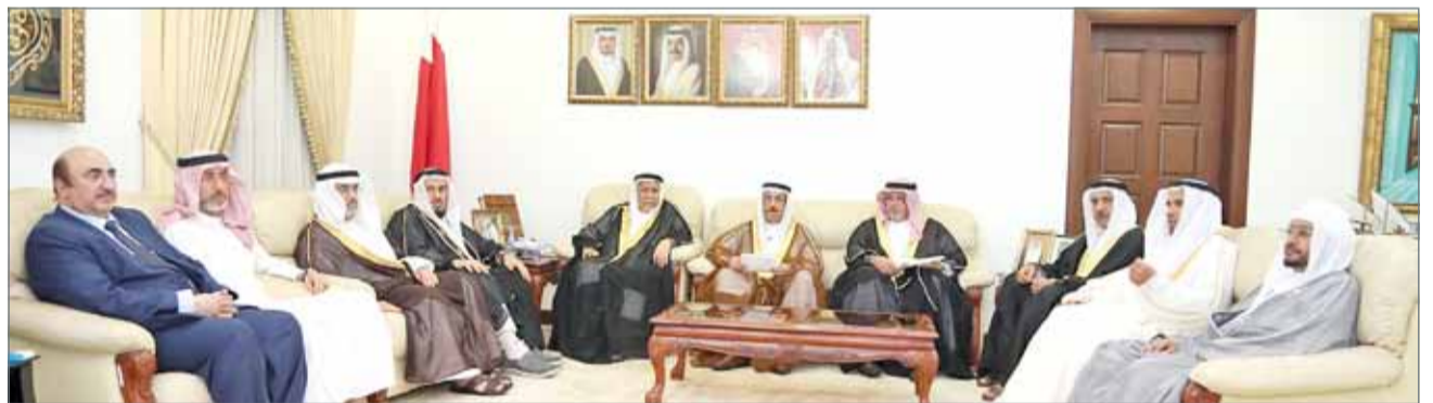
• من اجتماع المجلس الأعلى للشؤون الإسلامية

والسلام على سيدنا ونبينا محمد وعلى آله وصحبه ذوي التقى والإيمان، وبعد.. فحيث إن دخول شهر رمضان لا يثبت شرعاً إلا برؤية الهلال أو بإكمال عدة شعبان، وحيث إن شهر شعبان لعام 1438 هـ ثبت دخوله حسب تقاويم دول مجلس التعاون الخليجي المعتمدة، يوم الخميس الموافق 27 من شهر أبريل 2017م أن الثلاثين منه يكون يوم الجمعة الموافق 26 من شهر مايو 2017م ومن المحتمل أن يهل فيه هلال شهر رمضان، وحيث إنه لم يتقدم لهيئة الرؤية أحد يدلي بشهادته، كما لم يتقدم أحد للشهادة برؤية هلال شهر شعبان مساء يوم الأربعاء التاسع والعشرين من شهر رجب لهذا العام 1438 هـ رغم ترائيه في الدول المجاورة، وعليه فإن