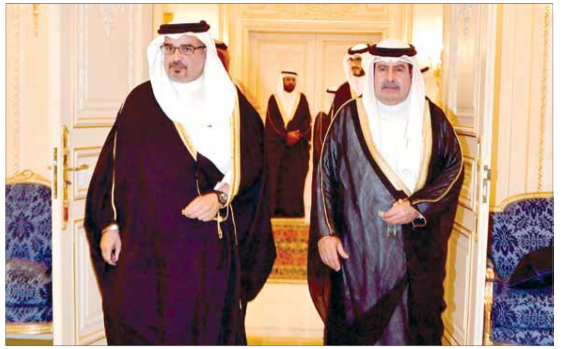
• سمو ولي العهد يزور مجلس سمو الشيخ علي بن خليفة

سموه دعا أبناء الوطن لاستشراف آفاق المستقبل الواعد... ولي العهد: