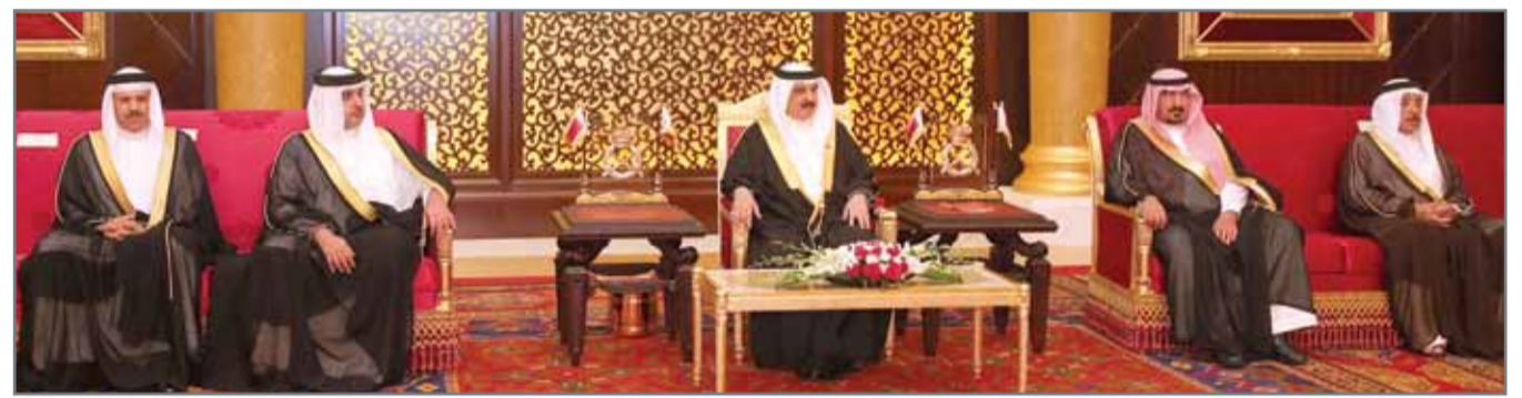
• جلالة الملك مستقبلاً أهالي المحافظة الجنوبية