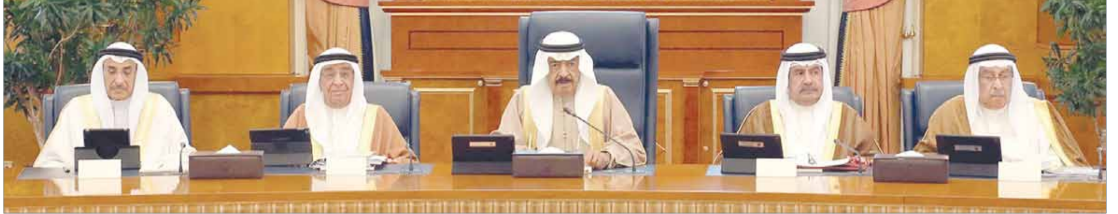
• سمو رئيس الوزراء مترشحا للجلسة الاعتيادية الأسبوعية لمجلس الوزراء

المنامة - بنا: ترأس رئيس الوزراء صاحب السمو الملكي الأمير خليفة بن سلمان آل خليفة الجلسة الاعتيادية الأسبوعية لمجلس الوزراء بقصر القضيبي صباح أمس، وأدى الأمين العام لمجلس الوزراء ياسر بن عيسى الناصر عقب الجلسة بالتصريح التالي: وجه صاحب السمو الملكي رئيس الوزراء إلى دراسة إعادة تخطيط وتطوير بعض المناطق في البلاد؛ من أجل ضمان وصول الخدمات الضرورية إليها بكل سهولة ويسر، وبما يسهل التعامل مع أي طارئ فيها ويتيح ربطها من خلال منافذ متعددة بشبكة الخدمات الحكومية المختلفة بكفاءة، وأحال سموه ذلك إلى اللجنة العليا للتخطيط العمراني. بعدها، أذاع مجلس الوزراء بشدة حادث الهجوم الإرهابي المسلح الذي استهدف حافلة كانت تقل مواطنين أقياط من محافظة المنيا المصرية مما أسفر عن سقوط عشرات القتلى والجرحى، وعبر المجلس عن وقوف مملكة البحرين مع جمهورية مصر العربية الشقيقة حكومة وشعباً ودعمها إجراءاتها كافة في مواجهة الإرهاب، معرباً المجلس عن ثقته في أن جمهورية مصر العربية الشقيقة الدولة والشعب أكبر من أن ينال الإرهابيون فيها مقاصدهم في التأثير على وحدتها الوطنية المتينة، كما استكر مجلس الوزراء حادث الاعتداء الإرهابي الذي ضرب