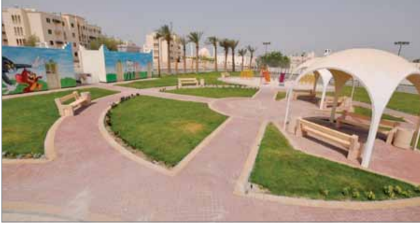
• حديقة مدينة حمد مجمع 1204 (ارشيفية)

الموازنات لترى النور. وبين رؤساء المجالس في الوقت ذاته أن ميزانية المشاريع هذه لا تشمل الميزانية المخصصة لمشروع تنمية المدن والقرى (الترميم)، والبالغة 600 ألف دينار لكل هيئة بلدية، بإجمالي 2.4 مليون دينار لكل عام.