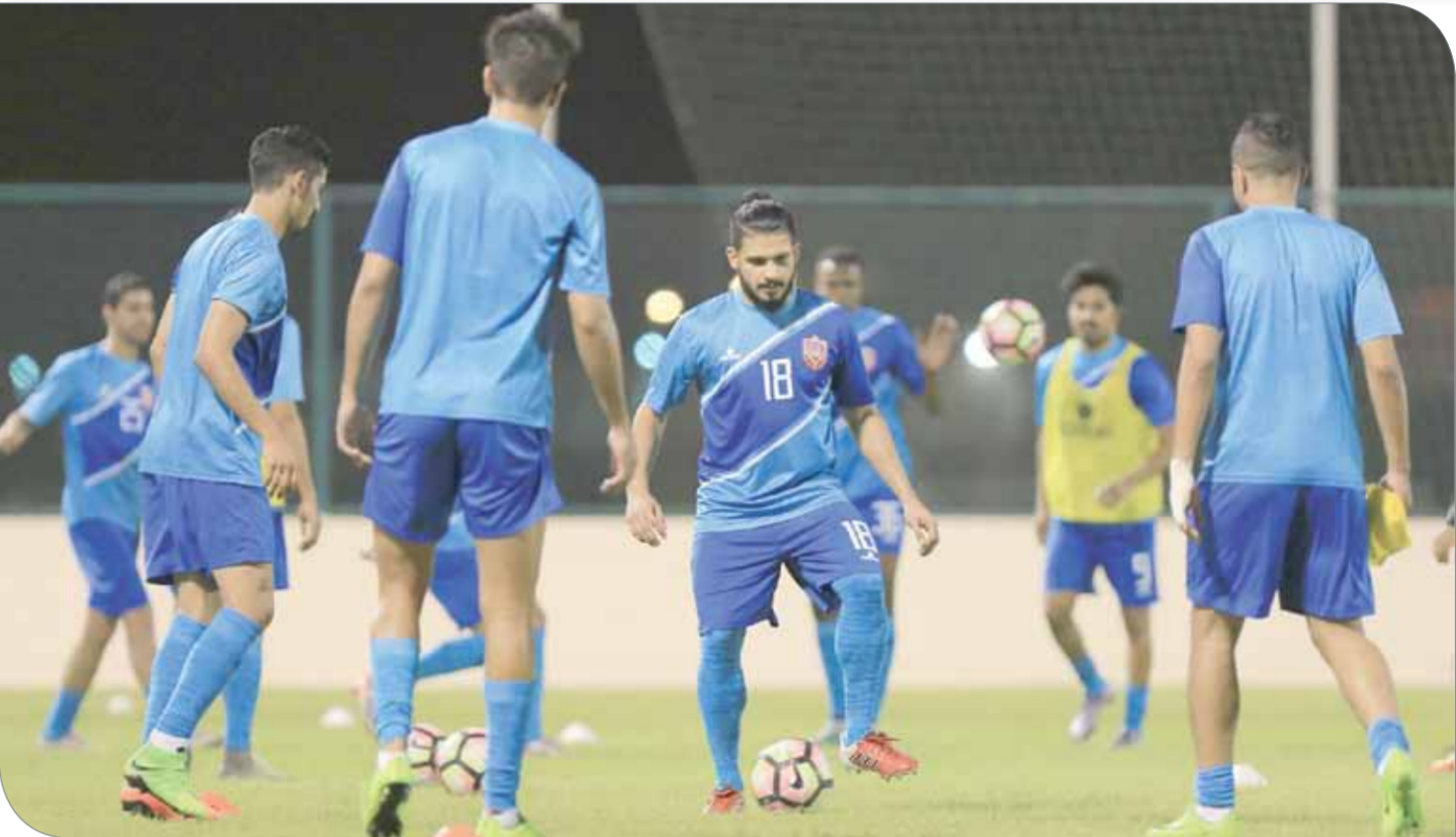
من تدريبات المنتخب

داخلياً يوم 4 يونيو؛ تحضيراً للمباراة التي سيديرها الحكم المصري محمد