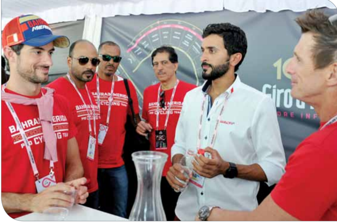
سمو الشيخ ناصر بن حمد أثناء حضوره السباق

وشدد سمو الشيخ ناصر بن حمد آل خليفة أن فريق البحرين ميريدا سيواصل حضوره ومشاركته القوية في مختلف البطولات العالمية، وقال "وضع الجهاز الفني لفريق البحرين ميريدا خطة لمشاركة الفريق في مختلف البطولات العالمية لتحقيق الإنجازات باسم المملكة، ونتطلع أن يوفق الفريق في الصعود إلى منصات التتويج، إذ إن ما حققه الفريق في سباق طواف إيطاليا الشهير يدعونا إلى التفاؤل بمستقبل أفضل".