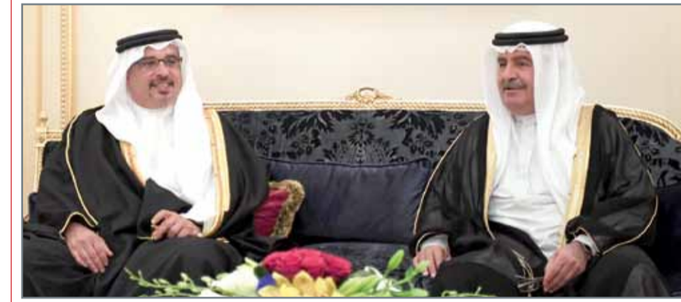
• سمو ولي العهد في زيارة لمجلس سمو الشيخ علي بن خليفة

سمو الشيخ علي بن خليفة: المجلس تكرر قيم الشراكة