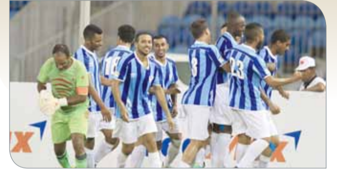
فرحة تسجيل الأهداف

شهدت مباريات الجولة الثانية من الدورة "8 مباريات" غزارة تهديفية عالية وصلت إلى 36 هدفاً، وهو عدد كبير ينم عن القوة الهجومية التي تتمتع بها الفرق، إلى جانب التفاوت الكبير في المستويات الفنية بين الفرق، وبلغت نسبة الأهداف في المباريات الثماني "4.5 هدف" للمباراة الواحدة، وارتفع عدد الأهداف في الدورة لغاية الجولة الثانية 57 هدفاً، وتتصدر المجموعة الثانية بعدد الأهداف بتسجيل فرقه الأربعة "21 هدفاً"، ثم المجموعة الرابعة برصيد "18 هدفاً"، والثالثة سجلت "10 أهداف"، وتعتبر المجموعة الأولى الأقل تهديفاً بعدما سجلت فرقه "8 أهداف" فقط.