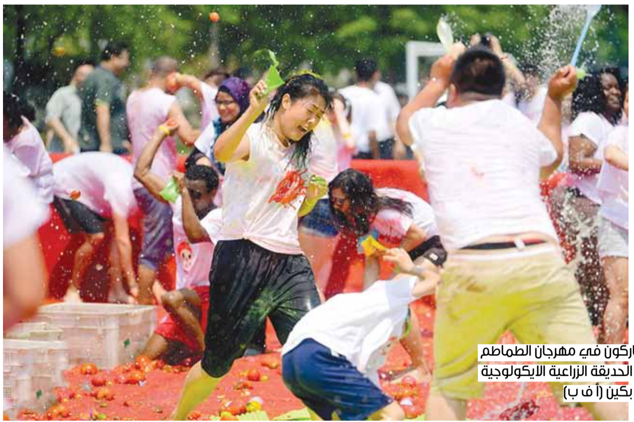
مشاركون في مهرجان الطماطم في الحديقة الزراعية الأيكولوجية في بكين