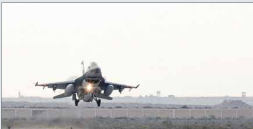
• الغارات المصرية تنتقل من شرق ليبيا إلى وسطها

ولا تزال ميليشيات اللواء السابع التابعة لمسلحي ترهونة موجودة في المطار. لكن مصادر ليبية ذكرت أن كتائب مرزقة قد انسحبت.