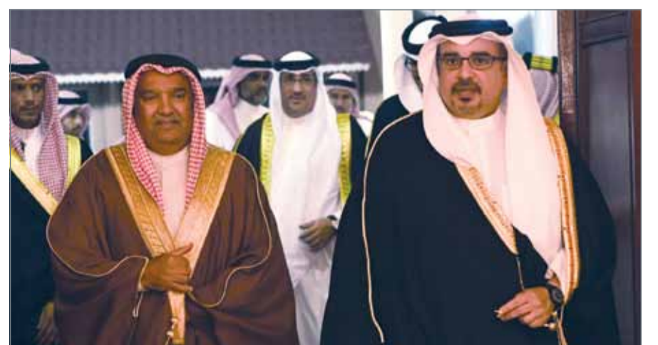
• سمو ولي العهد في زيارة لمجلس سمو الشيخ حمد بن محمد