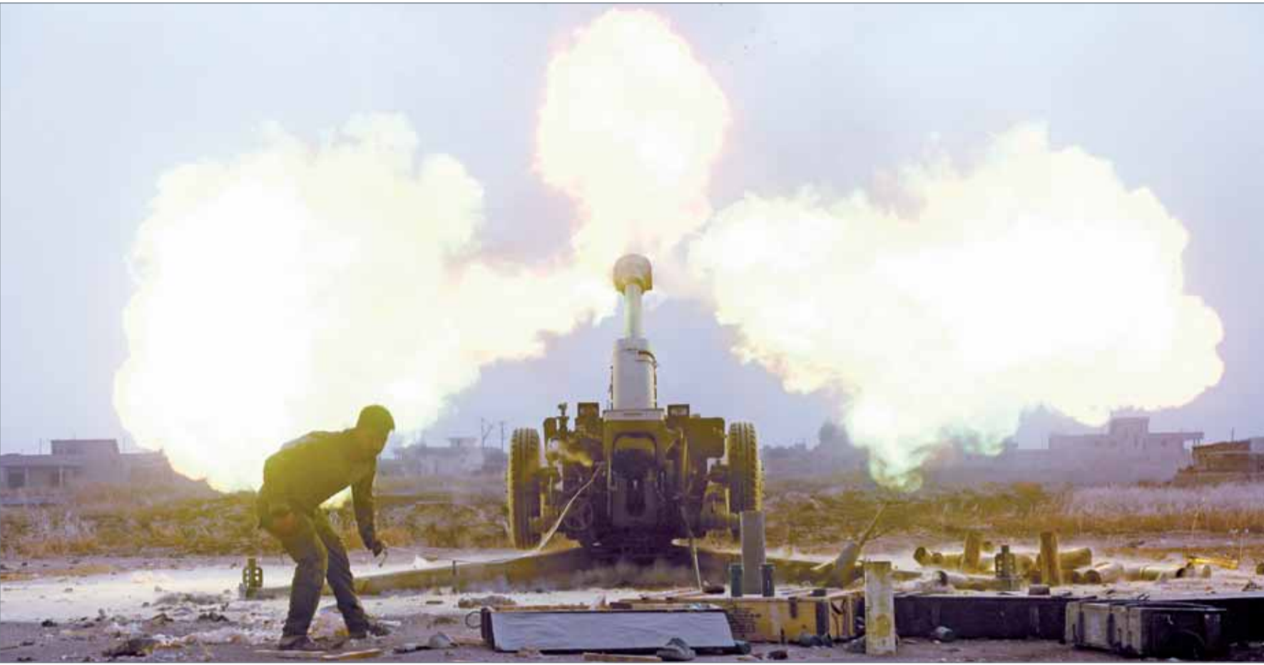
• قوات الحشد تطلق قذائف أثناء المعركة ضد "داعش" غرب الموصل

القاهرة - سكاى نيوز: أعرب الأمين العام لجامعة الدول العربية أحمد أبو الغيط عن تطلعه لأن تلعب روسيا دورا إيجابيا دافعا لتحقيق التسوية السياسية المنشودة لأزمات الشرق الأوسط. وقال المتحدث باسم الجامعة العربية محمود عفيفي، إن أبو الغيط أكد خلال لقائه وزير الخارجية الروسي سيرغي لافروف في مقر الجامعة بالقاهرة، على أن الثقل الذي تتمتع به روسيا في ساحة العلاقات الدولية وتداخلها المباشر في الأزمة السورية يمكنها من لعب دور في تسوية الأزمة السورية سياسيا، بما يتسق مع طموحات ومصالح جميع أبناء الشعب السوري. وأكد أيضا أهمية الدور الروسي في دفع الطرف الإسرائيلي للعودة مرة أخرى إلى طاولة المفاوضات السياسية مع الطرف الفلسطيني "بهدف الوصول إلى تسوية نهائية للقضية الفلسطينية تتأسس على حل الدولتين وقيام دولة فلسطينية مستقلة على حدود الرابع من يونيو 1967 وعاصمتها القدس الشرقية". وذكر المتحدث أن اللقاء تناول أيضا مستجدات الأوضاع في كل من ليبيا واليمن والجهود الرامية لمواجهة ظاهرة الإرهاب في مناطق مختلفة من العالم وعلى رأسها منطقة الشرق الأوسط.