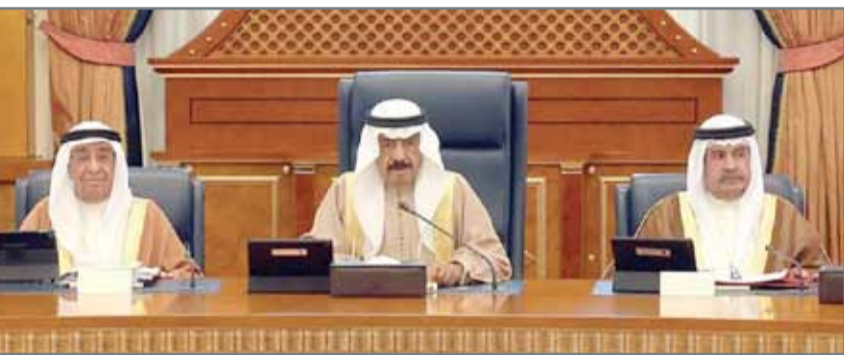
• سمو رئيس الوزراء مترئسا الجلسة الاعتيادية الأسبوعية لمجلس الوزراء

لمجلس الوزراء بقصر القضيبي صباح أمس. ووافق المجلس في اجتماعه على تعديل قانون حظر ومكافحة غسل الأموال وتمويل الإرهاب باستحداث حكم جديد يؤتم جمع أو إعطاء أو تخصيص أية أموال أو أملاك أو عائدات أو تقديم الدعم بأي وسيلة لفرد أو مجموعات يمارسون نشاطا إرهابيا.