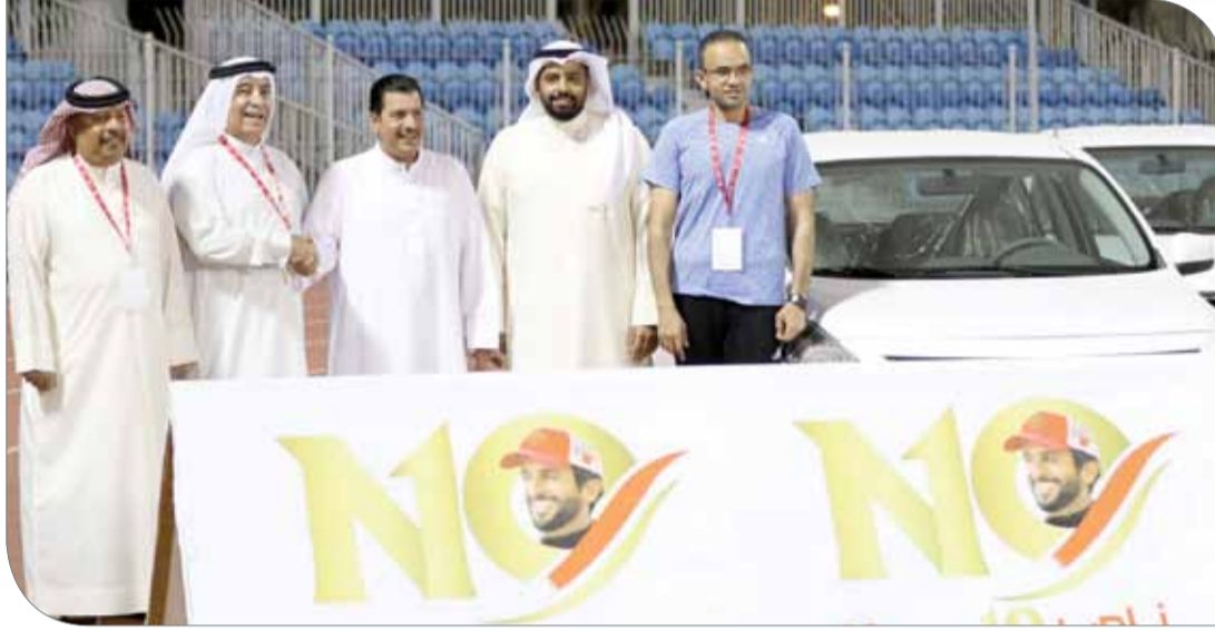
من تسليم السيارة لفائز الأول

وسيواصل السحب على السيارات، وسيكون السحب الثاني يوم بعد غد الخميس، إذ سيتم تخصيص سيارة لفائز واحد بشرط أن يكون متواجداً في الملعب وقت السحب.