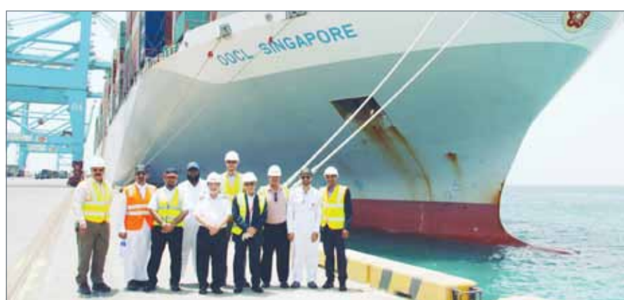
• على هامش استقبال أكبر سفينة حاويات بالميناة

على متن السفينة لترحيب برانها وطاقمها، كما تم تسليم الدروع التذكارية احتفاءً بوجود السفينة على أرصفة الميناة، وشارت السفينة عمليات إنزال الحاويات بالميناة، حيث قامت بإنزال 2018 حاوية نمطية.