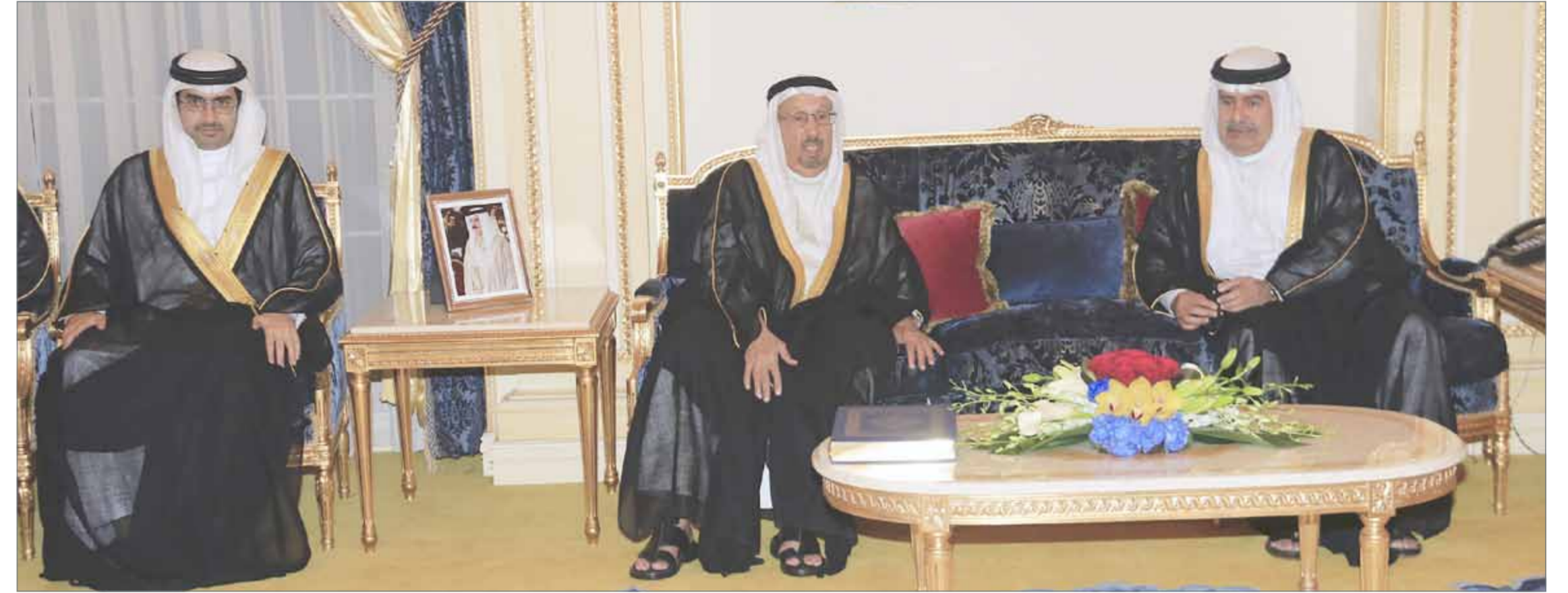
• سمو الشيخ علي بن خليفة مستقبلاً عدداً من كبار أفراد العائلة المالكة ورجال الدين والصحافة والإعلام ورؤساء البعثات الدبلوماسية والمواطنين

المنامة - بناءً على تأكيد نائب رئيس مجلس الوزراء سمو الشيخ علي بن خليفة آل خليفة دور المجالس الرمضانية في تعزيز التعاون والتواصل بين أبناء المجتمع البحريني وتبادل الآراء لمواجهة التحديات. جاء ذلك خلال استقبال سمو نائب رئيس مجلس الوزراء، مجلسه مساء أمس، عدداً من كبار أفراد العائلة المالكة ورجال الدين والصحافة والإعلام ورؤساء البعثات الدبلوماسية والمواطنين، الذين رفعوا التهنئة لسمو نائب رئيس مجلس الوزراء بمناسبة شهر رمضان المبارك. ورفع سمو الشيخ علي بن خليفة آل خليفة الشكر والتقدير الى صاحب السمو الملكي ولي العهد نائب القائد الأعلى النائب الأول لرئيس مجلس الوزراء على زيارته الكريمة لمجلس سموه مؤكداً أن زيارات سموه للمجالس الرمضانية تعكس حرصه على التواصل مع الجميع في هذه الأيام المباركة. وقال سمو نائب رئيس مجلس الوزراء: "إننا في هذه الأيام المباركة وما تحمله من نفحات إيمانية، نسال الله جلّت قدرته أن يديم على مملكة البحرين نعمة الأمن والأمان ومزيداً من التقدم والرفعة في ظل القيادة الحكيمة لعاهل البلاد صاحب الجلالة الملك حمد بن عيسى آل خليفة وبجمود الحكومة برئاسة رئيس الوزراء صاحب السمو الملكي الأمير خليفة بن سلمان آل خليفة، وبدعم ومساندة