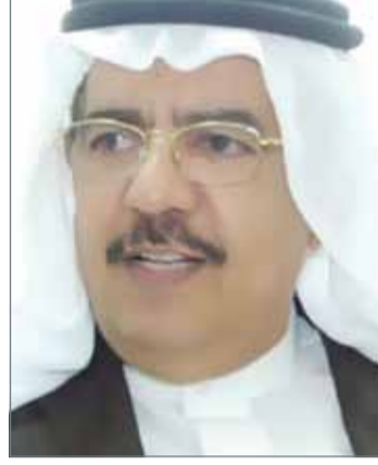
• خميس المقلّة

كافة وسائل الإعلام من صحف، ومجلات، وفضائيات، ووسائل التواصل الاجتماعي، بالإضافة إلى الطرق والشوارع، زيادة خلال هذه الأيام.