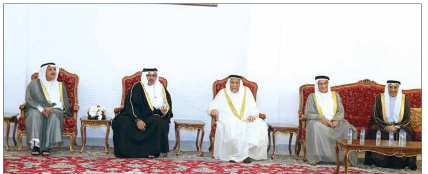
• سمو ولي العهد يزور مجلس سمو الشيخ عبدالله بن خالد