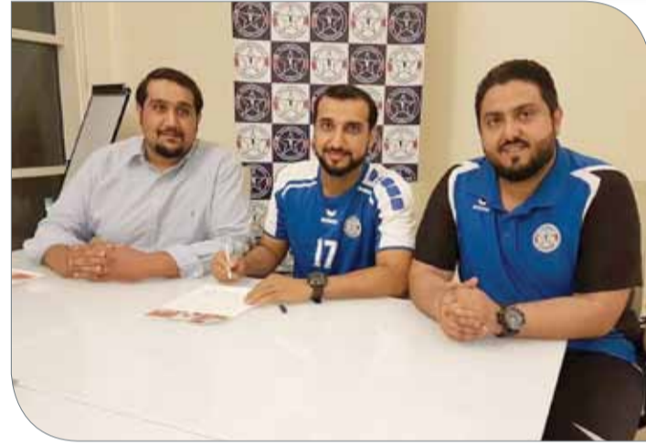
"حمانيه" يوقع عليه عقده التدريبي مع النجمة

فهو تمكن من الحصول على عقد احترافي في دولة الكويت من بوابة نادي كاظمة لموسمين متتاليين ونجح في اعتلاء منصة التتويج معه بتحقيق بطولة الدوري على حساب الكويت "محتكر البطولات"، بالإضافة إلى أنه يعتبر سبباً من الأسباب التي لعبت دوراً في فئات العمرية لنادي النجمة حينما كان متواجداً فيه.