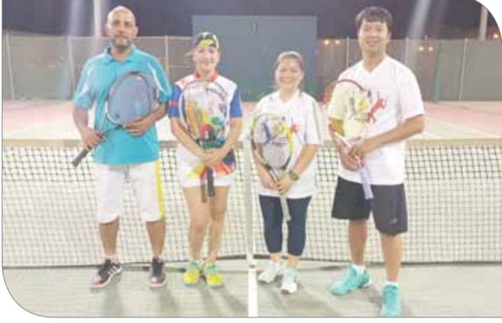
جانب من المشاركين بالبطولة