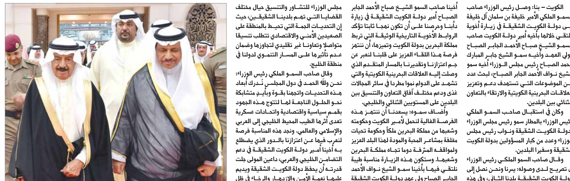
• سمو رئيس الوزراء لدى وصوله الكويت

• الأثر الطيب للقمم وصل إلى المحيط العربي والإسلامي والعالمي