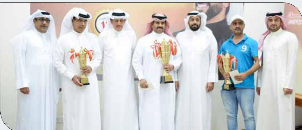
الصالحي يتوج الفائزين في بطولة الدامة

التي وضعها ممثل جلالة الملك للأعمال الخيرية وشؤون الشباب رئيس المجلس الأعلى للشباب والرياضة رئيس اللجنة الأولمبية البحرينية سمو الشيخ ناصر بن حمد آل خليفة والرامية إلى تنوع الألعاب الرياضية ضمن الاحتفالات بالذكرى العاشرة للدورة، مؤكداً أهمية بطولة الدامة التي تتوافق مع الخطط والبرامج التي تم وضعها من جانب اللجنة المنظمة العليا والرامية إلى مساعدة الاتحادات الرياضية في النهوض بالألعاب الرياضية في المملكة.