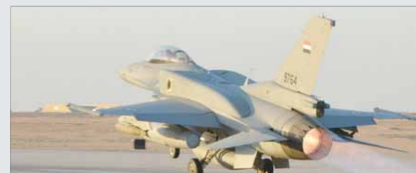
• صورة من صفحة المتحدث باسم الجيش المصري على فيسبوك