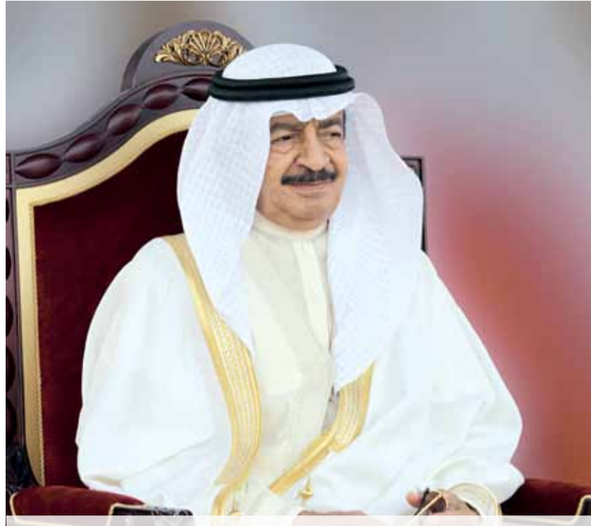
قصيدة مرفوعة إلى مقام سيدي رئيس الوزراء الموقر صاحب السمو الملكي