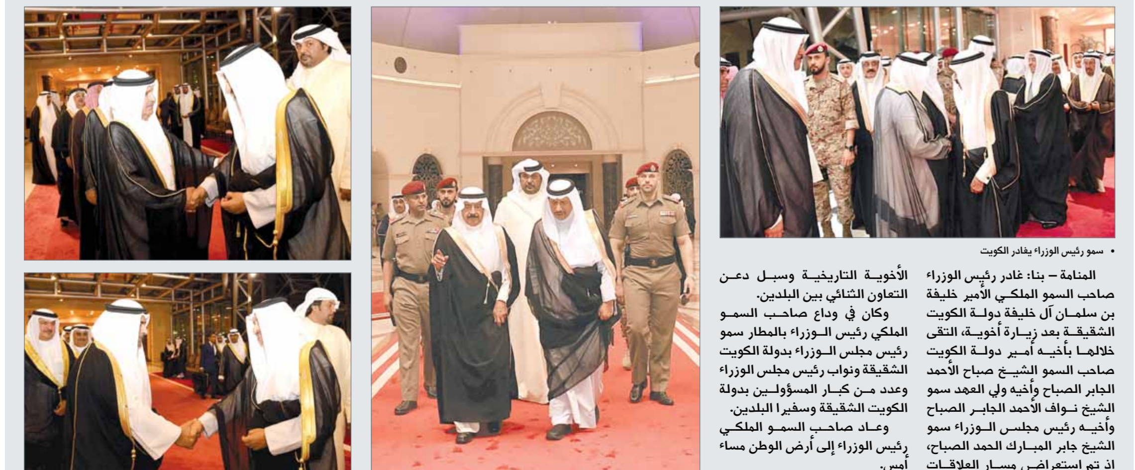
• سمو رئيس الوزراء يغادر الكويت

الأممية - بنا: غادر رئيس الوزراء صاحب السمو الملكي الأمير خليفة بن سلمان آل خليفة دولة الكويت الشقيقة بعد زيارة أخوية، التقى فيها سمو رئيس مجلس الوزراء بدولة الكويت الشقيقة ونواب رئيس مجلس الوزراء وعدد من كبار المسؤولين بدولة الكويت الشقيقة وسفيرها البلدين. وعاد صاحب السمو الملكي رئيس الوزراء إلى أرض الوطن مساء أمس. الأخوية التاريخية وسبل دعن التعاون الثنائي بين البلدين. وكان في وداع صاحب السمو الملكي رئيس الوزراء بالمطار سمو رئيس مجلس الوزراء بدولة الكويت الشقيقة ونواب رئيس مجلس الوزراء وعدد من كبار المسؤولين بدولة الكويت الشقيقة وسفيرها البلدين. وعاد صاحب السمو الملكي رئيس الوزراء إلى أرض الوطن مساء أمس.