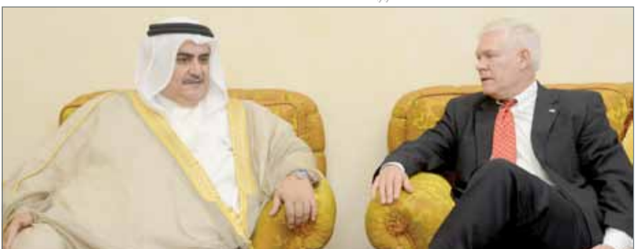
• وزير الخارجية مستقبلاً وفداً من مجلس النواب الأميركي

العربية السعودية الشقيقة، مؤكداً أن هذه النتائج تحقق المصالح المشتركة وتدفع بمجالات التعاون المشترك وبأفاق العلاقات لمستويات متقدمة على المستويات كافة الاقتصادية والسياسية والأمنية وتعزيز مستوى التنسيق في مكافحة الإرهاب.