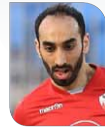
الشيخ سعود بن فيصل

◆ أعرب قائد فريق صقور البحرين الشيخ سعود بن فيصل آل خليفة عن سعادته الكبيرة بحصول فريقه على بطاقة العبور الأولى لدور الثمانية بالبطولة، بعد أن نجح في التأهل كمتصدر عن المجموعة الأولى بعد تعادله مع فريق جرناس في آخر مواجهات الفريق، مؤكداً أن فريقه قدم أداءً جيداً بمنافسات الدور الأول، والذي استحق من خلاله أن يكون متصدراً للمجموعة، وأن يتأهل للدور الثاني، مضيفاً أن المهمة لم تنته بعد، فهناك مهمة أكبر تبدأ بمنافسات دور الثمانية عندما يلاقي فريقه صاحب المركز الثاني بالمجموعة الثانية، مشيراً إلى أن الفريق سيسعى بكل قوة لتحقيق الانتصار في المباراة التي ستكون البوابة الحقيقية لمواصلة الفريق مشواره نحو بلوغ المباراة النهائية، معرباً في الوقت ذاته عن ثقته بالجهاز الفني بقيادة المدرب الوطني محمد سعد خليفة والطاقم المعاون، وكذلك بزملائه اللاعبين في التحضير الجاد والاستعداد بالشكل الأمثل فيما تبقى من منافسات؛ للوصول لأبعد نقطة في هذه المشاركة.