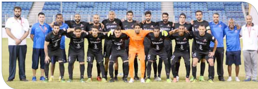
فريق جنرز يوناييتد يرغب فيه الانتصار الثالث

أكون؛ لإحراز النقاط الثلاث التي تمكنه من الحصول على فرصة العبور لدور الثمانية، وهو لديه 3 نقاط الآن، بينما الأحلام بقيادة مدربه إبراهيم سويد لا يملك أي نقطة بعد أن خسر مباراته السابقتين.