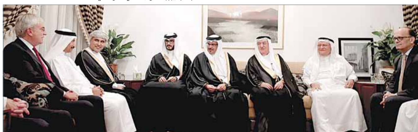
•...وسموه في زيارة لمجلس خالد المؤيد

من جانبهم، أعرب أصحاب المجالس عن تقديرهم لصاحب السمو الملكي ولي العهد نائب القائد الأعلى النائب الأول لرئيس مجلس الوزراء على هذه الزيارات التي يحرص سموه عليها في هذا الشهر الفضيل مشيدين بما يوليه سموه من دعم كبير لمختلف أوجه التنمية في البلاد.