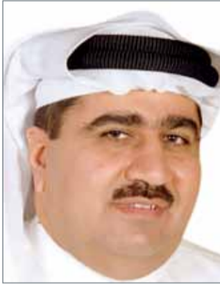
• ناصر الاهلي

ورداً على سؤال حول حجم المبالغ المستحقة للقطاع الخاص، قال مرهون "إنه لا يعلم حجم هذه المبالغ، ولكن غالبية المستحقات هي للمشروعات الكبيرة من المشروعات السكنية، وأعمال البنية التحتية"، منوهاً إلى أن بعض التأخير في تسديد هذه الالتزامات المالية تجاوز السنوات الأربع.