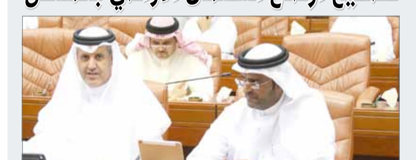
خليفة الغانم وعبدالله بن حويل

استعمال الأراضي بمختلف المناطق. وفي موضوع آخر، طمأن الوزير النائب عبدالرحمن بوعلي وبقيّة النواب أن المجلس الأعلى للبيئة يرفض أي طلب لفتح مصنع لا يستوفي الاشتراطات البيئية المطلوبة والمعايير الموضوعية لذلك فضلا عن إجراء زيارات ومراجعات للمصانع.