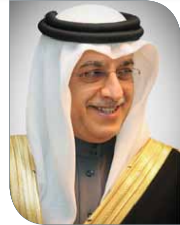
الشيخ سلمان بن إبراهيم

◆ أكد الأمين العام للمجلس الأعلى للشباب والرياضة الشيخ سلمان بن إبراهيم آل خليفة أن التطور المتنامي الذي تشهده دورة سمو الشيخ ناصر بن حمد آل خليفة للألعاب الرياضية (ناصر 10) يؤكد المكانة الكبيرة التي باتت تحتلها الدورة على الساحة الرياضية المحلية، وقدرتها على اجتذاب اهتمام أفراد الأسرة الرياضية الذين يتطلعون لمعايشة مجرياتها بصورة سنوية. وأشار الشيخ سلمان بن إبراهيم آل خليفة أن التطوير المستمر في إدارة