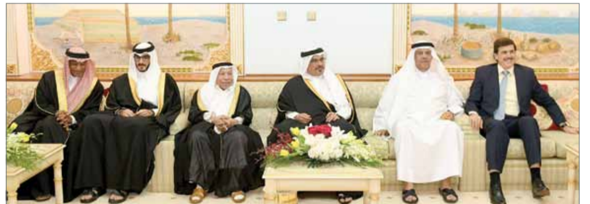
• سمو ولي العهد في زيارة لمجلس الحاج أحمد منصور العالي

أواصر المحبة وترابط المجتمع البحريني وتماسكه، مشيداً بإسهامات العائلات التجارية في دعم الحركة الاقتصادية في البلاد ومشاركة الجميع في العمل نحو المزيد من التطور والبناء.