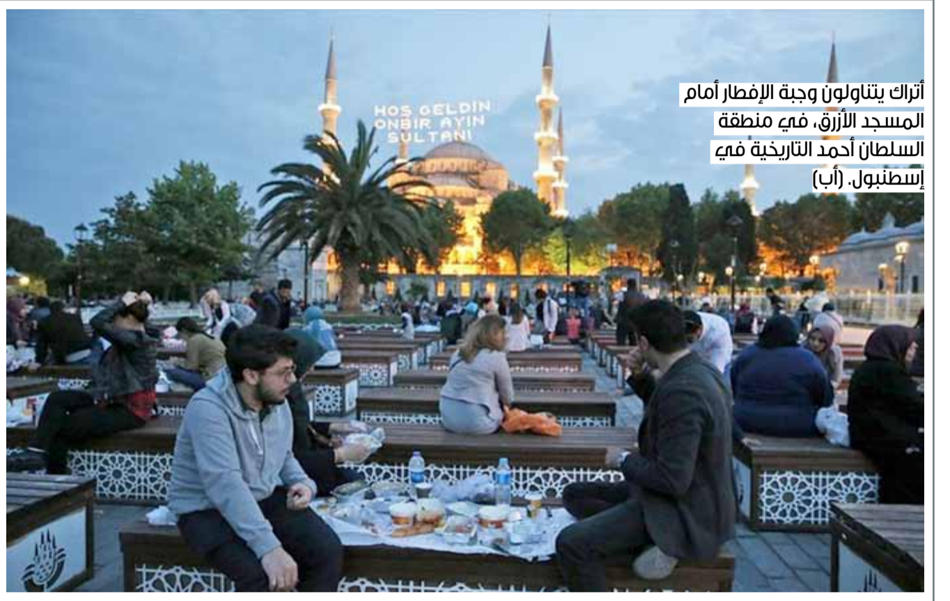
أتراك يتناولون وجبة الإفطار أمام المسجد الأزرق، في منطقة السلطان أحمد التاريخية في إسطنبول.