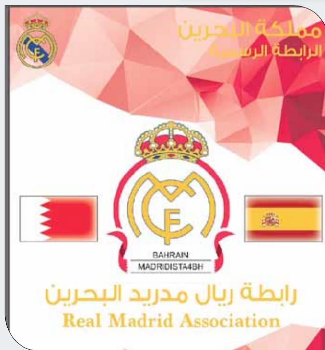
شعار رابطة ريال مدريد

وتحضر الرابطة الكثير من الجوائز القيمة والمفاجآت الضخمة لأعضائها وعشاق جماهير النادي الملكي الذين سيحضرون على الحضور إلى الخيمة الرمضانية بالفندق لتابعة المباراة، وهي عبارة عن تذاكر سفر وإقامة في العاصمة الإسبانية مدريد، علاوة على العديد من الجوائز المحضرة للحضور.