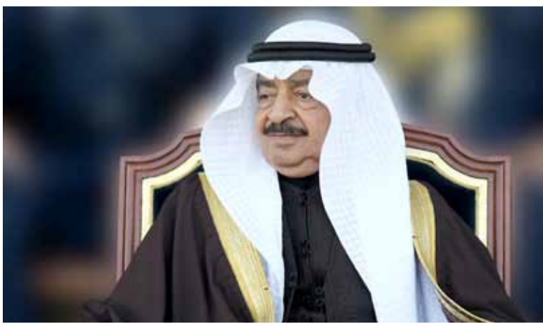
بقلم: الدكتور عبدالله الحواج