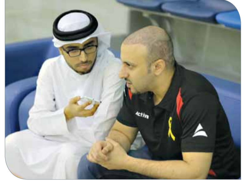
بوجيري متحدثاً لـ "البلاد سبورت"