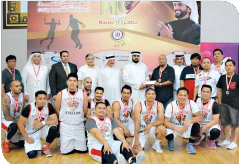
سمو الشيخ عيسى بن علي يتوج أبطال بطولة الجاليات للسلطة