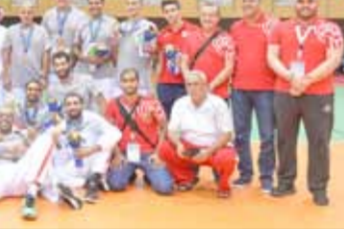
منتخب الرجال المتوجر بلقب بطولة الخليج بالدامام ٢٠١٥