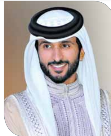
سمو الشيخ ناصر بن حمد آل خليفة

◆ توج رئيس الاتحاد البحريني لكرة السلة سمو الشيخ عيسى بن علي بن خليفة آل خليفة الفريق الأمريكي بطلا لبطولة كرة السلة للجاليات وفريق وزارة الداخلية بطلا لمنافسات بطولة 3 on 3 لكرة السلة، وذلك ضمن منافسات دورة ناصر بن حمد الثالثة للألعاب الرياضية "ناصر 10" التي أقيمت على صالة الاتحاد البحريني لكرة السلة، وشهد المباراة الحاضرة التي شجعت الفريقين من أجل تقديم أفضل مستوياتهم في المباراة. وجاء تحقيق فريق وزارة الداخلية للمركز الأول في بطولة 3 أون 3 بعد فوزه في المباراة النهائية على فريق "ناصر 12" بنتيجة 18-11 فيما جاء في المركز الثالث فريق ذا هويرز. وقام سمو الشيخ عيسى بن علي آل خليفة بتوقيع الفائزين بالميداليات