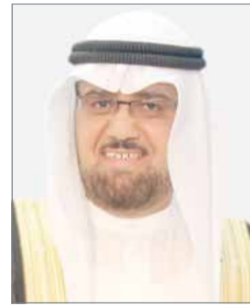
• فريد المفتاح

المغفور له بإذن الله تعالى صاحب العظمة الشيخ عيسى بن سلمان آل خليفة، ثم تعامدتها الرعاية الملكية السامية لعاهل البلاد حتى يومنا هذا، علاوة على اهتمام وحرص الحكومة الرشيدة برئاسة رئيس الوزراء صاحب السمو الملكي الأمير خليفة بن سلمان آل خليفة، وولي العهد نائب القائد الأعلى النائب الأول لرئيس مجلس الوزراء صاحب السمو الملكي الأمير سلمان بن حمد آل خليفة، على نشر تعاليم وقيم كتاب الله تعالى بين مختلف فئات المجتمع والعناية بحفاظ القرآن الكريم وحملته، مشيداً بدعم رئيس المجلس الأعلى للشؤون الإسلامية الشيخ عبدالله بن خالد آل خليفة بهذه الجائزة؛ بوصفه المؤسس الأول لها، إذ ارتقت وتطورت هذه الجائزة تحت مظلة وإشرافه ورؤيته السديدة، وشهدت تطورات كثيرة من حيث تحولها لجائزة قرآنية تضم تحتها 5 مسابقات، وتشتمل كل مسابقة على عددا من الفروع للذكور والإناث. ودعا الوكيل جميع المواطنين والمقيمين لحضور الحفل الختامي للمسابقة؛ من أجل دعم حفظه القرآن والمشاركة في تشجيع شرائح وفئات المجتمع كافة؛ للإقبال على كتاب الله تعالى حفظاً وتلاوةً وتجويداً وتفسيراً.