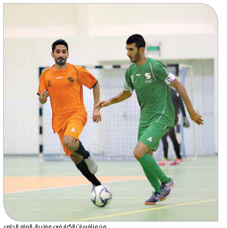
من منافسات الكبار في مونديال العام الجاري