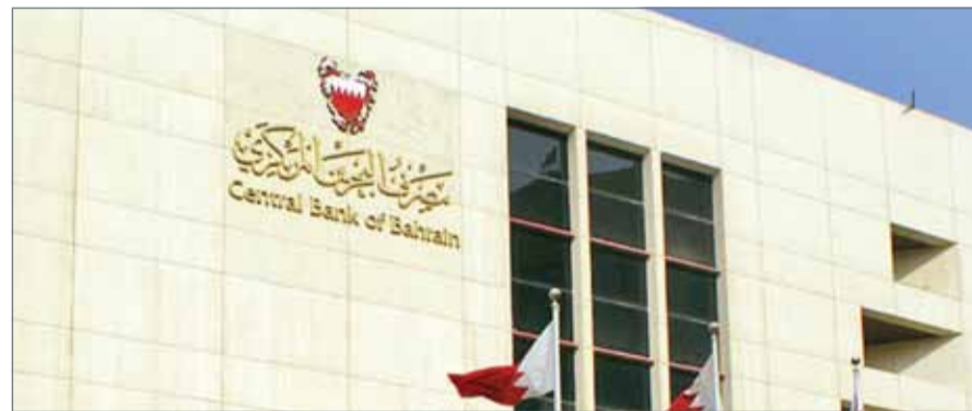
• مصرف البحرين المركزي

على الاستقرار بما في ذلك مستويات إيداعات غير المقيمين. وتوقعت الوكالة تقلص العجز المالي تدريجياً بفترة التوقعات، وأن يؤدي تمويله إلى زيادة موقف صافي الأصول البحرينية الخارجية.