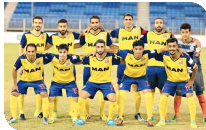
الفخار يسعد لشق طريقه بنجاح نحو اللقب

جمعها من فوز وتعادل. ولن تختلف نوايا الفريق عند النوايف في هذه المباراة، خصوصا وأن الفريق يتطلع للوصول للمباراة النهائية والمنافسة