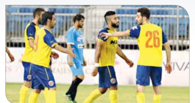
من فرحة الفخار بأحد أهدافه في البطولة

يعتبر فريق الفخار الأقوى هجوماً بين الفرق الأربع المشاركة في مباريات اليوم، حيث يمتلك الفريق 11 هدفاً، فيما يحتل المركز الثاني فريق الزلزال برصيد 7 أهداف، ويأتي ثلثا فريق النوايف الذي يمتلك في سجله 5 أهداف، فيما يحتل الصقر الأبيض المركز الرابع بعد أن اكتفى بتسجيل 4 أهداف. بينما يحتل النوايف صدارة فرق هذه الليلة على مستوى خط الدفاع، حيث لم تهز شبكه سوى مرتين، يليه فريقا الفخار والصقر الأبيض اللذين تعرضت شبكتهما للزيارة في ثلاث مرات، يليهما فريق الزلزال، والذي يعتبر الأضعف على مستوى هذا الخط بعد أن تلقت شبكه 6 أهداف.