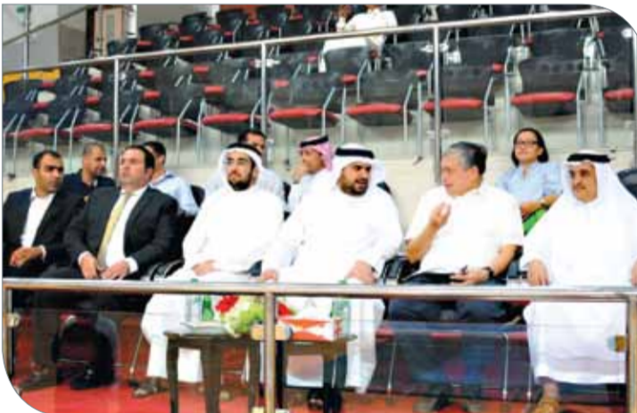
سموه يتوسط الحضور فيمنحة صالة اتحاد السلة