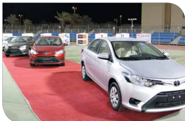
السحب على السيارة الرابعة اليوم