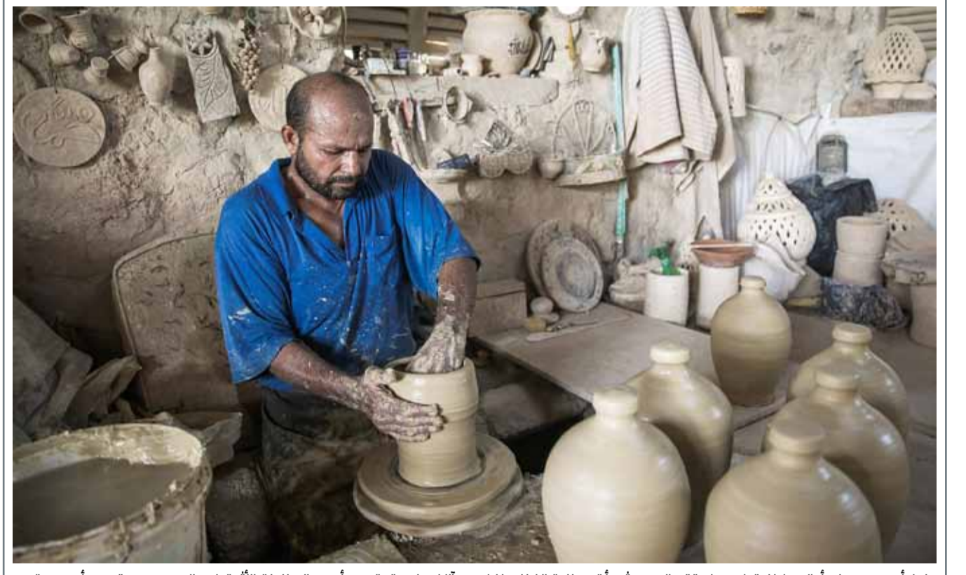
عامل أسويبي يصنع أواني فخارية في منطقة عاليه حيث بدأت صناعة الفخار منذ نحو ٥ آلاف عام وتعتبر من أدمى الصناعات الأثرية في البحرين.

أوضح موقع يوتيوب قواعده المتعلقة بخطاب الكراهية حتى يتسنى لمعدي لقطات الفيديو معرفة المحتوى الذي يعتبره يوتيوب ملائما لوضع إعلانات بجانبه. وقال موقع يوتيوب في مدونة خاصة به إنه لن يسمح بظهور إعلانات إلى جانب محتوى ينشر الكراهية أو يشجع على التمييز. وأضاف الموقع أنه بصدد إجراء تغييرات للتعامل مع قلق المعلنين بخصوص المحتوى الذي تظهر إلى جانبه إعلاناتهم. وقال بعض المدونين إن القوانين صارمة جدا وسوف تؤثر على دخولهم.