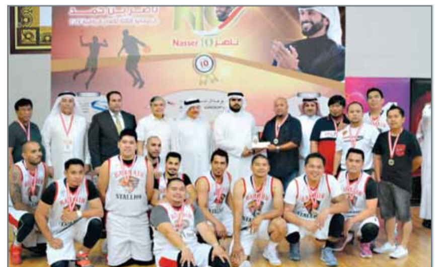
سمو الشيخ عيسى بن علي يتوج أبطال بطولة الجاليات للسلة

وأردفت: أن هذه الجزئية تنطبق أيضاً على ما قد يتحصل عليه المتسول من دعم اجتماعي من جهات رسمية (وفق ما هو مقرر قانوناً). واستطردت: وبالنتيجة فإن أي تعويض أو مساعدة لن تمنع المتسول من هذه الممارسة، وسيتمثل لأجلها صعوبات التواجد في الشوارع، مما يجعل التسول تحدياً اجتماعياً.