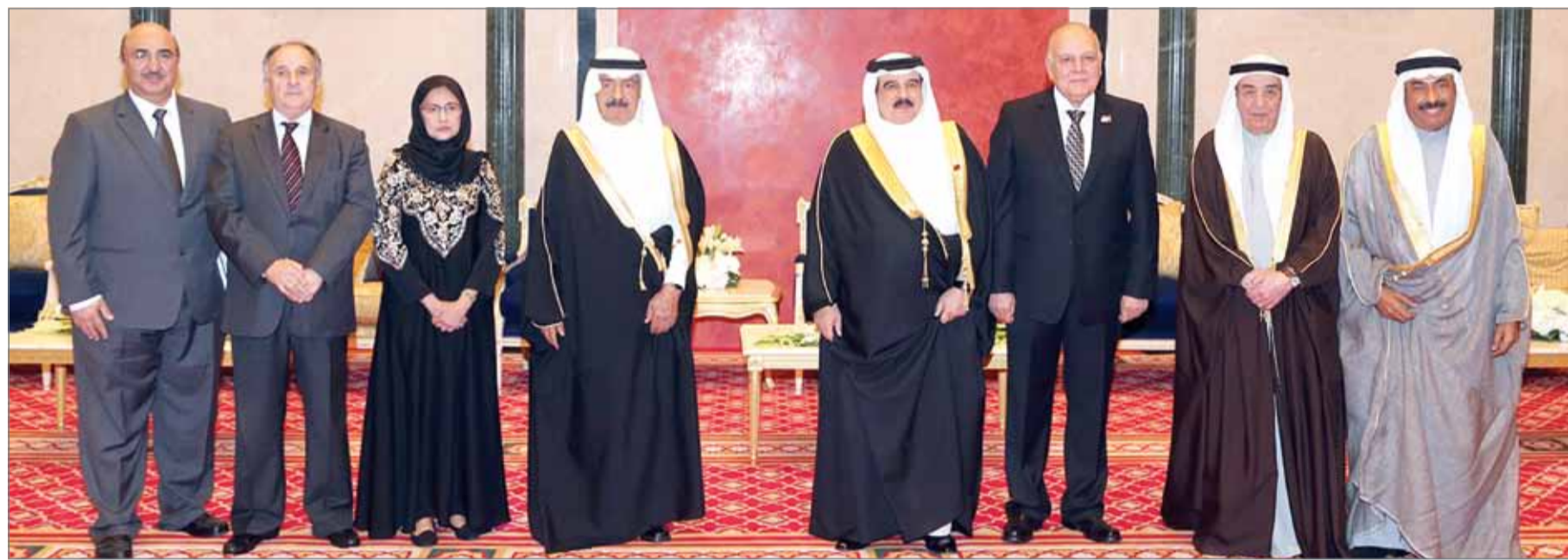
جلالة الملك يشمل برعايته الكريمة بحضور سمو رئيس الوزراء حفل تسليم جائزة عيسى لخدمة الإنسانية

عزه ومجده، وقائد مسيرته لثلاثة عقود شكلت نقلة حضارية في تطور مملكة البحرين السياسي والاقتصادي والاجتماعي.