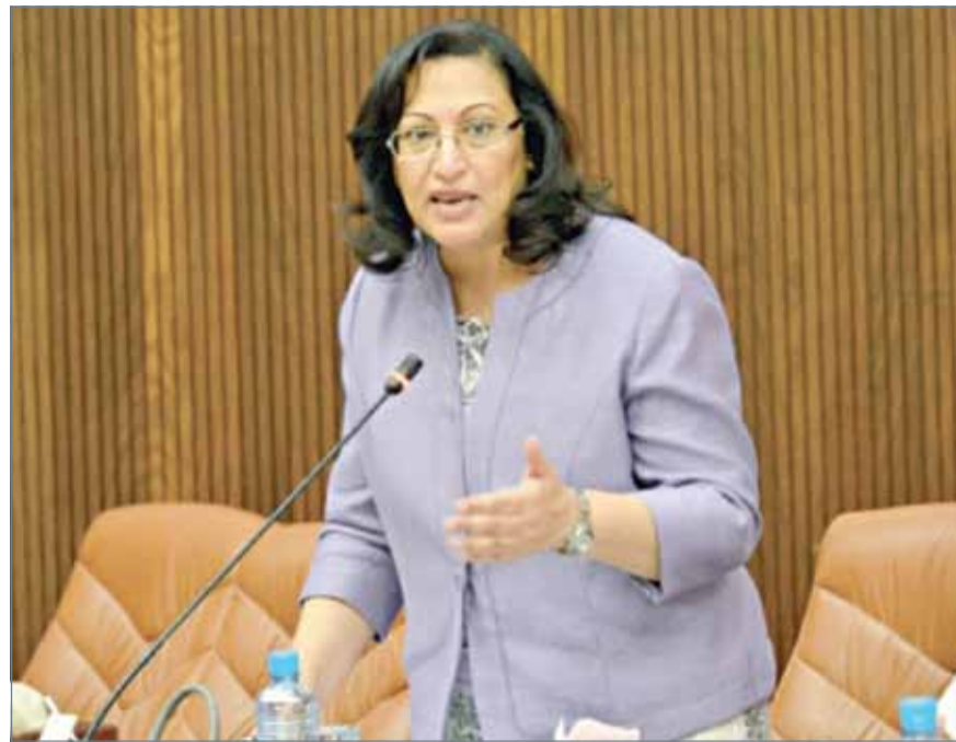
• وزيرة الصحة

كشفت وزيرة الصحة فائقة الصالح عن حزمة استقالات إدارية بوزارة الصحة بلغ عددها 37 حالة بوزارة الصحة، إلى جانب 40 طبيباً تقدموا للتقاعد كان نصيب 26 منها حالة لتقاعد اعتيادي، و14 حالة تقاعد مبكر.