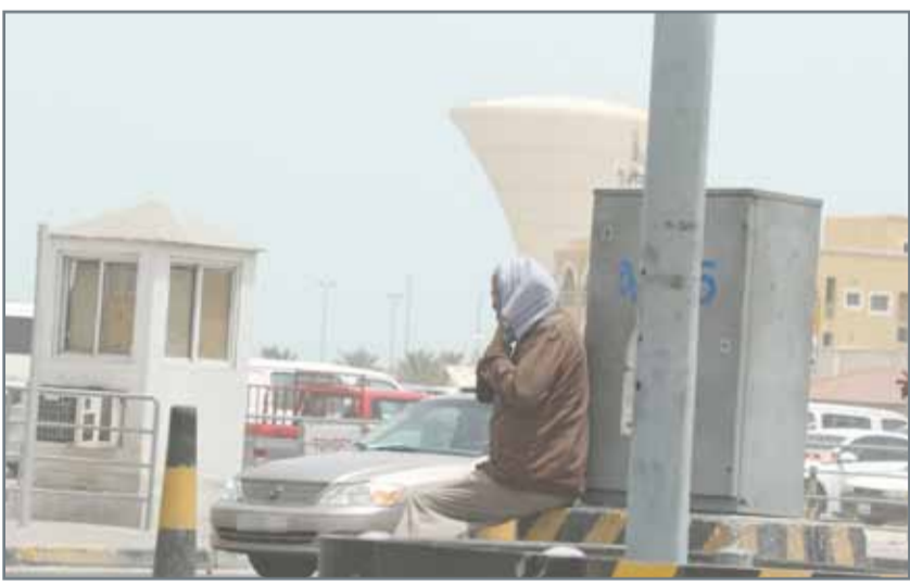
مزاي التسول تفوق الراتب والدعم