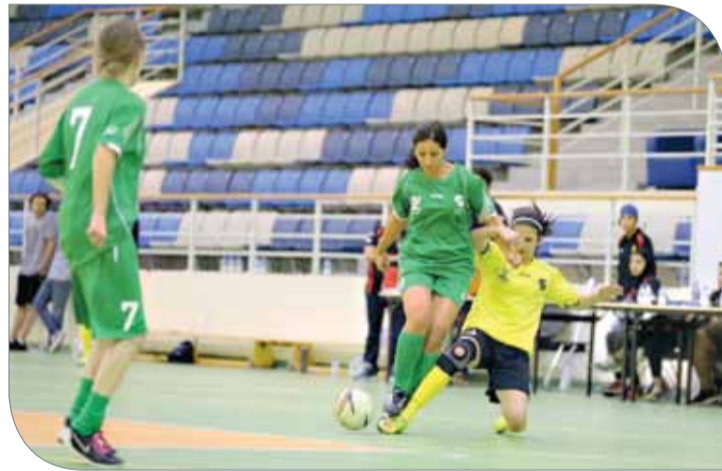
من منافسات السيدات في مونديال العام الجاري