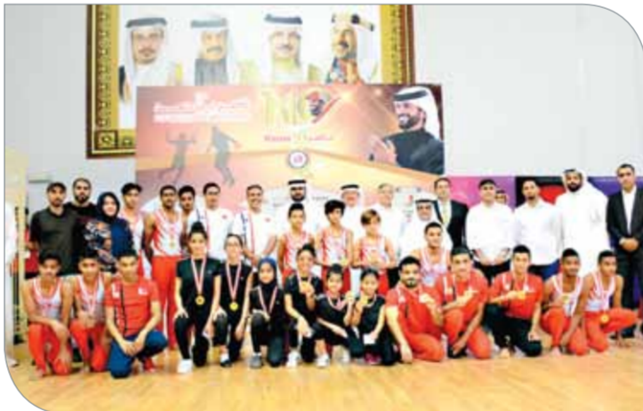
سموه يتوسط لاعبي الجبابر بعد تكريمهم إثر تقديمهم عرضاً رائعاً

دفاعاً وهجوماً من دون أن يترك أي مجال للتأفف ولعب بأسلوب دفاعي قوي أوقف من خلاله جميع مفاتيح اللعب في صفوف الفريق الفلبيني ولم يترك المجال لمنافسه للعب بحرية. أما فريق وزارة الداخلية فجاء بتحقيقه المركز الأول في بطولة 3 أون 3 بعد أن قدم مباراة قوية منذ البداية وأظهر تنافساً مثيراً؛ بسبب الأداء القوي في الهجوم وتوقع التسجيل، إضافة إلى الأسلوب الجماعي في الدفاع والهجوم من دون الاعتماد على لاعب معين؛ حتى تمكن من تخطي منافسه وفرض أسلوبه طيلة المباراة.