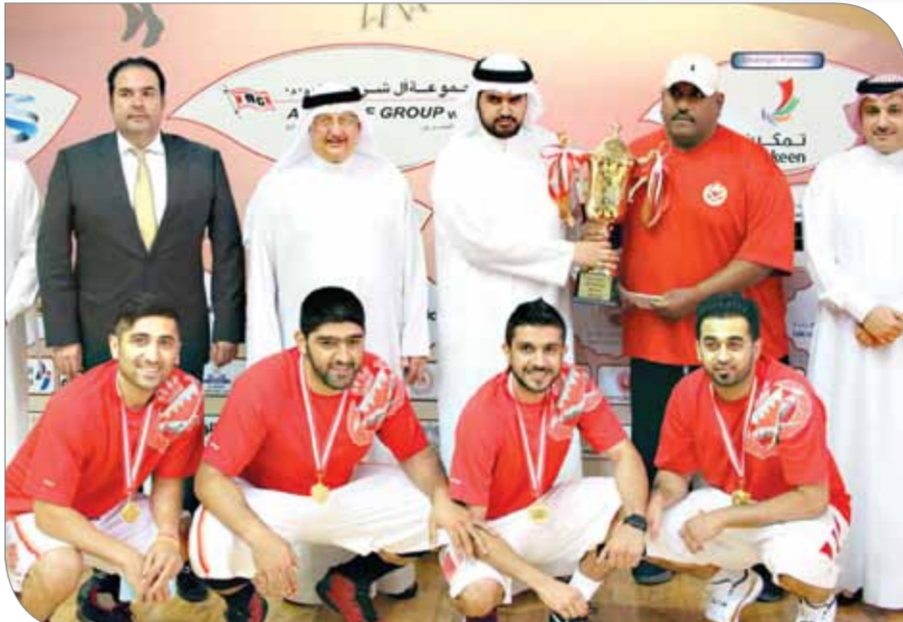
سموه يتوج أبطال بطولة 3 أون 3 لكرة السلة