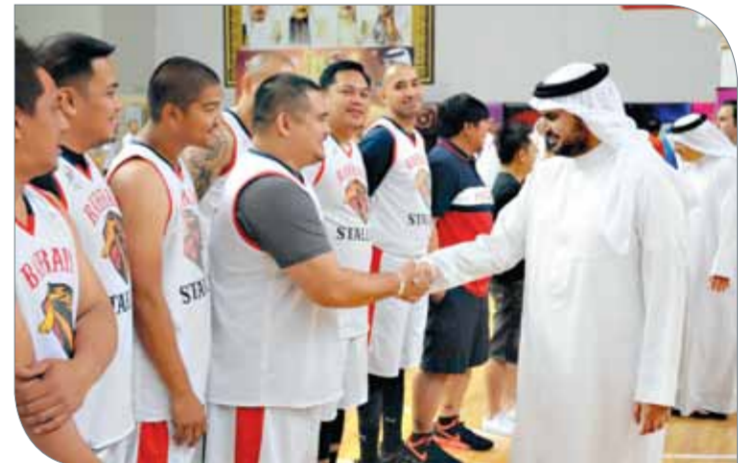
سموه يصافح لاعبي فريقه نهائي الجاليات