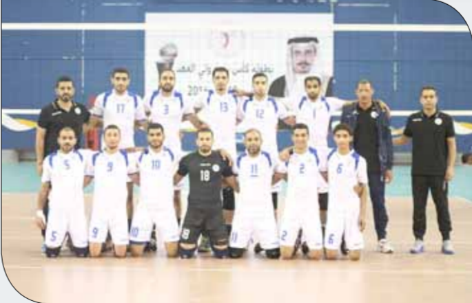
فريق النصر لكرة الطائرة

يمر بها النصر والنتيجة عن تزايد المصروفات وانخفاض الميزانية تتساءل الجماهير عما إذا انتهى الموسم المقبل؟