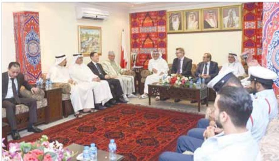
• علي العصفور مستقبلاً ضيوف المجلس الرضائي بمقر المحافظة الشمالية بالجنينة

الجنينة - المحافظة الشمالية: اطلع حضور مجلس المحافظة الشمالية الرضائي مساء الجمعة على البرامج والخطط التي تم تنفيذها أو هي في طور التنفيذ إضافة إلى الخطة الاستراتيجية المقترحة لعمل اللجنة الأمنية، إذ أكد فيها محافظ الشمالية علي العصفور أنها اعتمدت على الربط بين الأمن الاجتماعي والتنمية المستدامة. وأشار إلى أن المحافظة الشمالية انتهت من إعداد خطتها الاستراتيجية المقترحة لعمل اللجنة الأمنية التي حظيت بمباركة ودعم وزير الداخلية الشيخ راشد بن عبدالله آل خليفة، والتي أعدها قسم التخطيط الاستراتيجي وإدارة المشاريع بالتعاون مع شعبة الأمن بالمحافظة، وهي تشمل محاور ومنطقتين ترتكز على علاقة الأمن بالتنمية وتعزيز المواطنة الصالحة وتعميق الحس الوطني من خلال برامج التوعية المجتمعية. وأشاد الحضور بهذا التوجه التنموي، كما عبروا عن إعجابهم بمشروع "بيوت" لتغيير الواقع المعيشي لبعض الأسر ذوي الدخل المحدود والأثر المتوقعة، إضافة إلى مشروع تطوير ساحل جد الحاج وحملة إزالة السيارات المهجورة في سلماباد الصناعية وحملة برك السباحة باعتبارها أنشطة تستهدف تطوير