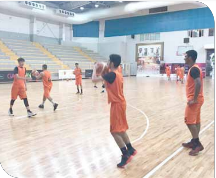
جانب من تدريبات منتخب شباب السلة