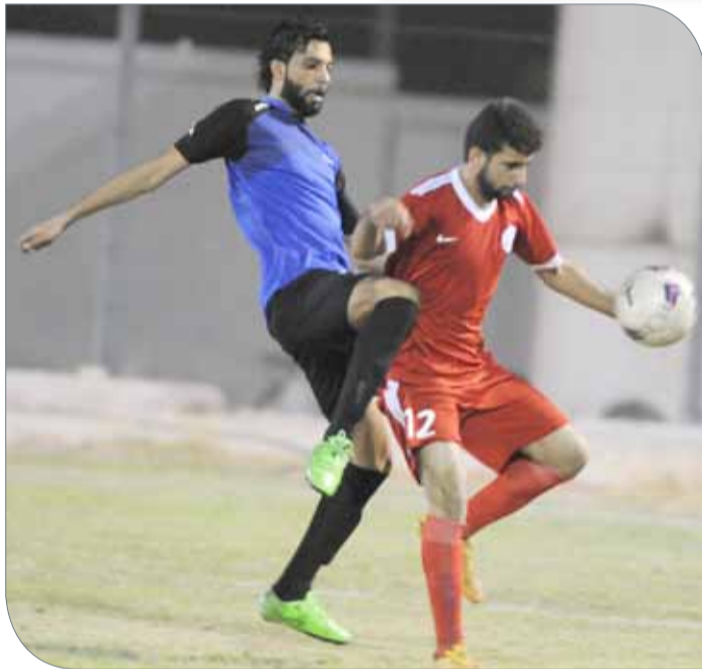
جانب من مباريات البطولة