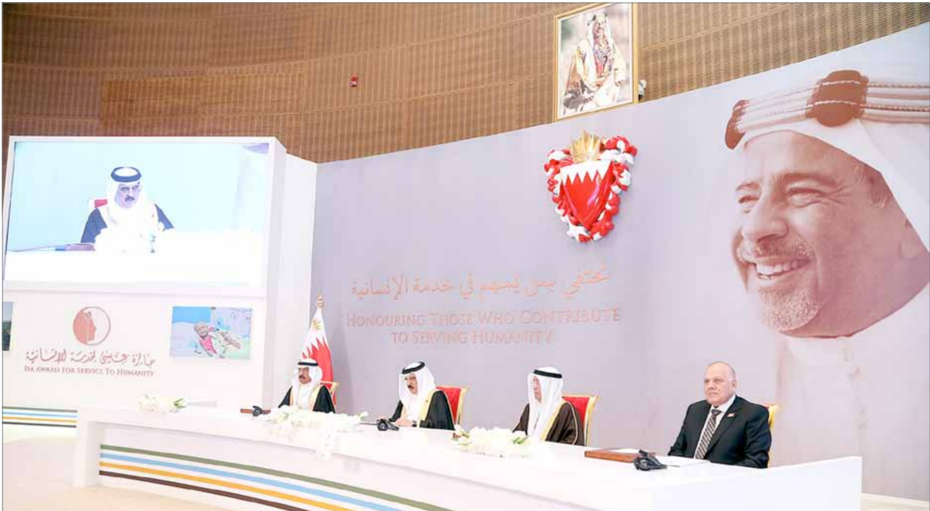
• جلالة الملك يشمل برعايته الكريمة بحضور سمو رئيس الوزراء حفل تسليم جائزة عيسى لخدمة الإنسانية

النامية-بنا: تفصل عامل البلاد صاحب الجلالة الملك حمد بن عيسى آل خليفة، وبحضور رئيس الوزراء صاحب السمو الملكي الأمير خليفة بن سلمان آل خليفة، فشمّل برعايته الكريمة مساء أمس الاحتفال، الذي أقيم بمركز عيسى الثقافي، بتسليم جائزة عيسى لخدمة الإنسانية في دورتها الثالثة- 2017-2015م، والتي فازت بها مؤسسة مستشفى سرطان الأطفال بجمهورية مصر العربية الشقيقة.