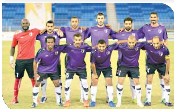
الزلزال يلاقي الصقر الأبيض في أقدم مباريات البطولة