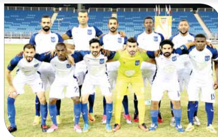
النوايف في نهائي مبكر أمام الزلزال اليوم

بقوة على تحقيق لقبه الرابع في سجل مشاركته في هذا التجمع الكروي. الفريق بقيادة المدرب السوري رضوان نجم لديه نخبة من اللاعبين