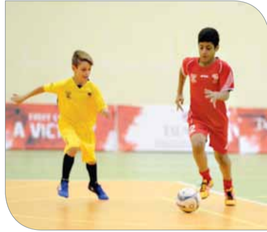
من منافسات الصغار في مونديال العام الجاري