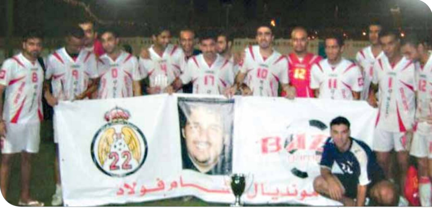
بطل النسخة الأولى من المونديال