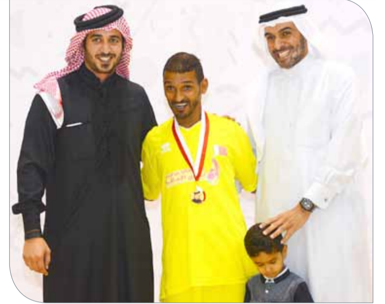
سمو الشيخ خالد بن حمد مع الشيخ محمد بن دعيج في ترويج أبطال ذوي الإعاقة

◆ ثمن رئيس مجلس إدارة الاتحاد البحريني لرياضة ذوي الإعاقة الشيخ محمد بن دعيج آل خليفة، الجهود الكبيرة التي يبذلها النائب الأول لرئيس المجلس الأعلى للشباب والرياضة الرئيس الفخري للاتحاد البحريني لرياضة ذوي الإعاقة سمو الشيخ خالد بن حمد آل خليفة، في دعم الأنشطة الرياضية بالمملكة عموماً وأنشطة وبرامج وفعاليات رياضة ذوي الإعاقة، وذلك من خلال دمج فئة ذوي الإعاقة في دوري خالد بن حمد للمراكز الشبابية للعام الثاني