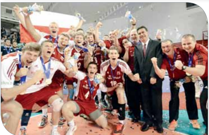
منتخب بولندا حامل لقب لنسخة الأرنجنتين ٢٠١٥

الخامسة في إيران 1997، وفازت إيران بالنسخة الرابعة في المكسيك 2007، وأخيراً فازت بولندا بلقب النسخة الرابعة عشرة والأخيرة التي استضافتها الأرجنتين العام 2015. وكانت مراسم قرعة البطولة قد أوقعت منتخبنا الوطني في المجموعة الأولى التي تضم مصر وتونس وأمريكا وبورتوريكو، بينما تضم المجموعة الثانية بولندا والبرازيل وكوبا واليابان وفرنسا، والمجموعة الثالثة تضم الأرجنتين وروسيا وتشيلي وكوريا وتركيا، وأخيراً المجموعة الرابعة إيران وإيطاليا والمكسيك والصين والتشيك.