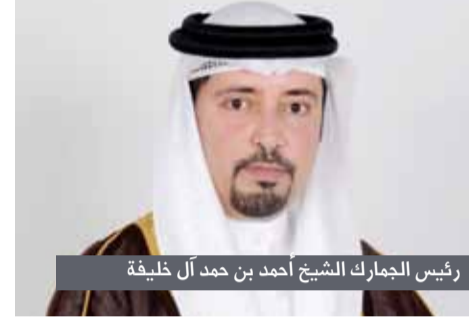
رئيس الجمارك الشيخ أحمد بن حمد آل خليفة