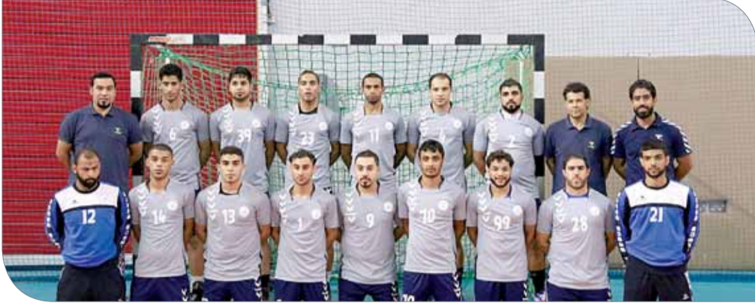
فريق التضامن لكرة اليد

المالية التي تعاني منها؛ بسبب ضعف الميزانية وتقليصها بين فترة وأخرى، مطالباً إياها بتكوين قاعدة تدريبية للمستقبل، وذلك بإعطاء الفرصة للمدربين الصاعدين مع دعمهم معنوياً، والبحث عن آخرين وإقحامهم في هذا المجال إلى أن يكتسبوا الخبرة والثقة التي تؤهله لأن يكونوا مصدر ثقة لتولي القيادة التدريبية، وهذا من شأنه أن يعود بالمنفعة على مستقبل كرة اليد عموماً والأندية ذاتها خصوصاً.