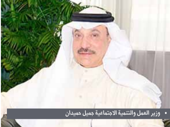
وزير العمل والتنمية الاجتماعية جميل حميدان