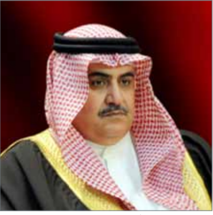
• الشيخ خالد بن أحمد

المشترك في مختلف المجالات، منوهاً أن مواجهة الإرهاب تشكل أولوية قصوى وتستدعي تكاتف الجهود كافة وعدم ادخار أي جهد في سبيل القضاء على هذه الآفة التي تهدد جميع دول العالم والتصدي لكافة التنظيمات الإرهابية وكل من يدعمها أو يمولها. من جانبها، أعربت سوشما سواراج عن اعتزاز جمهورية الهند بالعلاقات الوثيقة مع مملكة البحرين، مؤكدة دعم بلادها لأمن واستقرار المملكة وحرصها على توفير الأمن وإرساء السلام في المنطقة، متمنية لمملكة البحرين دوام التقدم والرخاء.