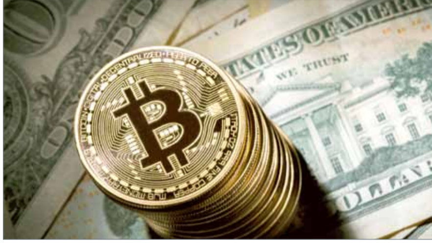
• العملة الإلكترونية “بيتكوين”

وتعود مكاسب العملة إلى زيادة حيازة المستثمرين المحترفين لها وتنامي المخاوف جراء عدم الاستقرار الذي يخيم حول الاقتصادات الكبرى، إضافة إلى أنها تستخدم في المعاملات عبر شبكة الإنترنت، عبر آلاف من أجهزة الكمبيوتر حول العالم، والتي تتحقق من صحة المعاملات وتضيف المزيد من رصيد “بيتكوين” إلى النظام.