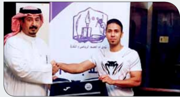
جانب من توقيع العقد

هذه الصفقة والفضل في ذلك يعود لدعم مجلس الإدارة، كما كشف عن وجود صفقة أخرى وصفها بالقوية في سوق الانتقالات سيعلن عنها فور الانتهاء منها. مبيناً أن أم الحصم ينظر لمنافسات الموسم الجديد بنظرة تنافسية للغاية وذلك بدافع المستويات والنتائج التي حققها بالموسم الماضي وخصوصاً الأخير.