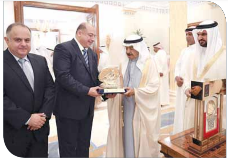
إدارة نادي المنامة أثناء اللقاء مع سمو رئيس الوزراء

كارزوني عن بالغ شكره وتقديره إلى رئيس الاتحاد البحريني لكرة السلة سمو الشيخ عيسى بن علي آل خليفة وجميع أعضاء مجلس الإدارة على الجهود الكبيرة التي يقومون بها من أجل تطوير لعبة كرة السلة، مؤكداً أن لعبة كرة السلة البحرينية شهدت في فترة ترؤس سمو الشيخ عيسى بن علي آل خليفة الاتحاد نقلة نوعية وتطوراً لافتاً في جميع