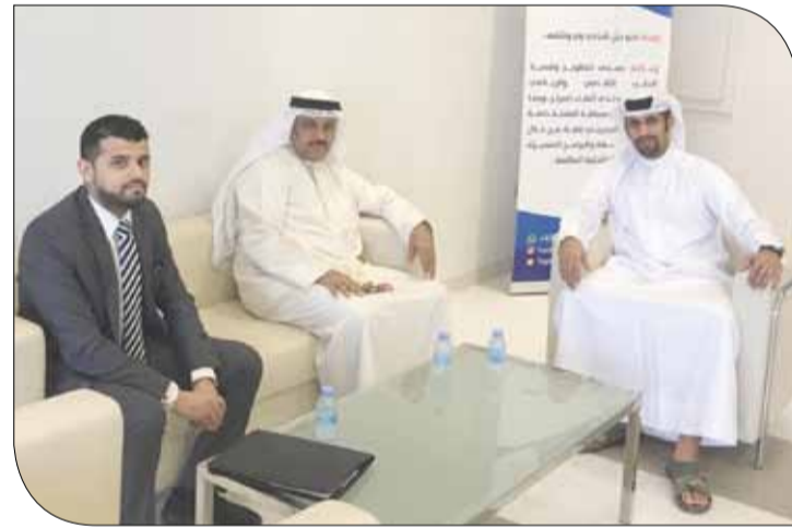
من زيارة رئيس المراكز الشبابية مركز شباب الهمة

وقال رئيس المركز إننا طرحنا تصوراتنا لاحتياجات المركز لرئيس المراكز الشبابية؛ من أجل تمكين المركز من مواصلة خدمة أعضائه بشكل مستمر