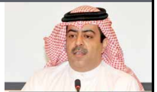
الرئيس التنفيذي لهيئة تنظيم سوق العمل أسامة العسبي