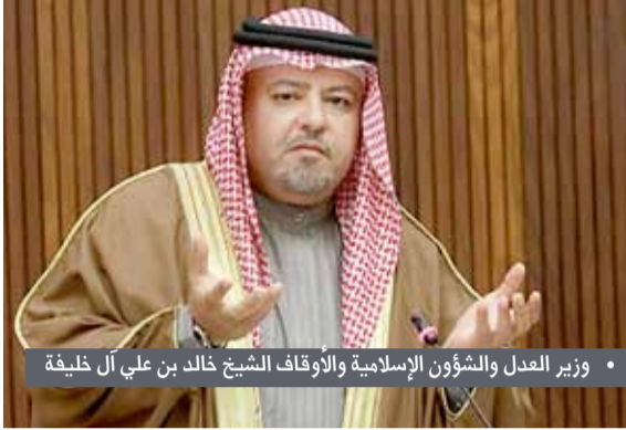
وزير العدل والشؤون الإسلامية والأوقاف الشيخ خالد بن علي آل خليفة