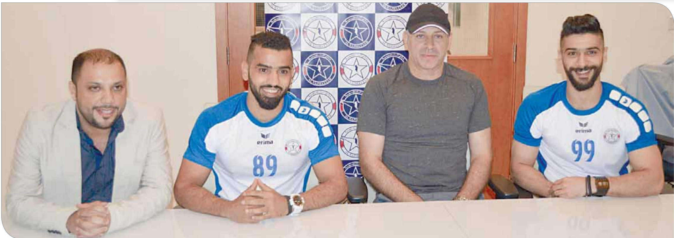
لقطات من توقيع العقد

إلى تحقيق البطولات على المستوى المحلي وكذلك الخارجي. وقال القطان بأن باب التعاقدات قد أقفل، مضيئاً في الوقت ذاته إلى أن إدارته تبحث سبل تقوية مركز الحراسة في الفريق.