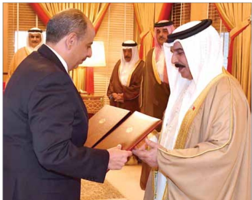
• ... وجلالته يتسلم أوراق السفير الأردني