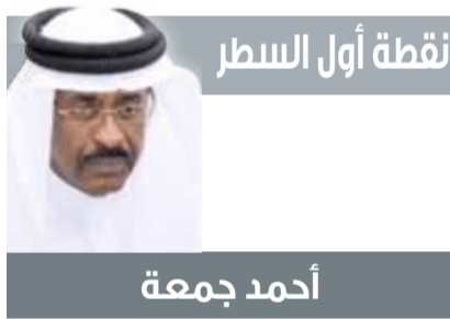
نقطة أول السطر