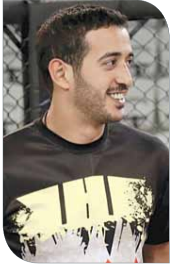
سمو الشيخ خالد بن حمد