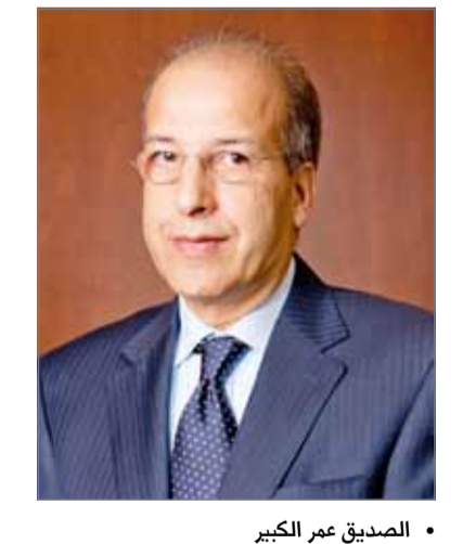
• الصديق عمر الكبير

المجموعة 29.2 مليار دولار في نهاية النصف الأول من هذا العام، مقارنة مع 30.1 مليار دولار نهاية 2016. كما بلغت الودائع في نهاية النصف الأول من العام 21.3 مليار دولار، أي أعلى من مستواها في نهاية 2016 حين بلغت 20.2 مليار دولار. وتم الحفاظ على مستوى مريح من السيولة، حيث بلغت نسبة الموجودات السائلة إلى الودائع 63%، وهي أقل من مستواها في نهاية العام الماضي حين بلغت النسبة 68%، الأمر الذي يعكس ارتفاع الودائع لدى البنك“.