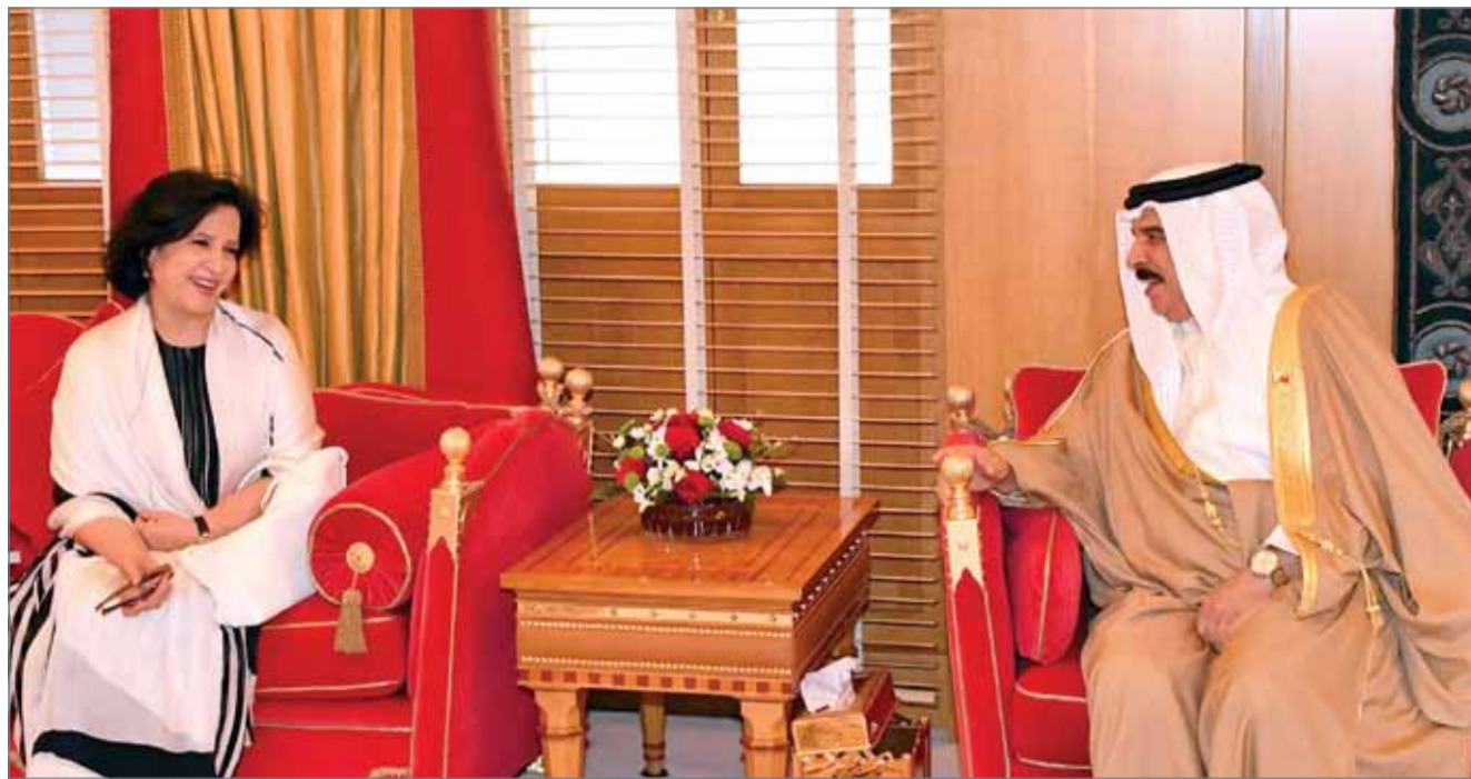
• جلالة الملك مستقبلاً رئيسة هيئة البحرين للثقافة والآثار

• مي بنت محمد: نثمن دعم جلالته مشروعات "المحرق عاصمة الثقافة الإسلامية"