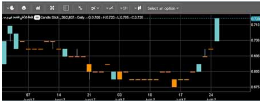
• حركة سهم البنك الأهلي المتحد في بورصة البحرين منذ مطلع العام الجاري.

وكان الرئيس التنفيذي لبيتك، مازن الناهض، قال في تصريحات سابقة حول عملية الاندماج ”إننا ندرس الموضوع فقط، ولم يتم أي نوع من أنواع الاتفاق حتى الآن، ولكننا نرى أن هذه الخطوة إيجابية جداً إذا تمت بالسعر المناسب، وإذا حققت التكامل بين المصرفين المندمجين، ولكن حتى الآن ليس هناك أي جديد بهذا الموضوع“.