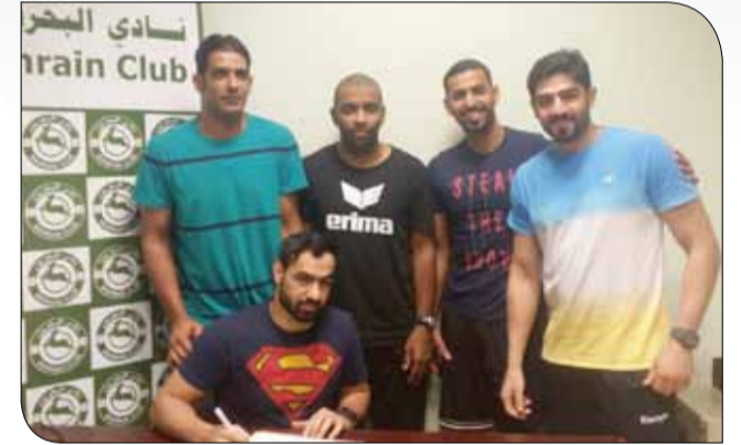
جانب من توقيع العقد