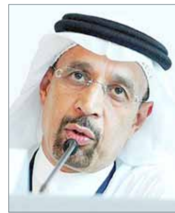
• وزير الطاقة السعودي

وقال وزير الطاقة الروسي ألكسندر نوفاك إن 200 ألف برميل يوميا إضافية قد تخرج من السوق إذا بلغ مستوى الالتزام بالاتفاق الذي تقوده أوبك مئة بالمئة.