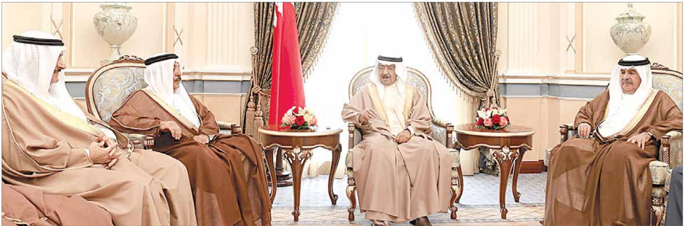
• سمو رئيس الوزراء مستقبلاً كبار أفراد العائلة المالكة والمسؤولين

عملية البناء متواصلة من أجل تلبية الاحتياجات... رئيس الوزراء: