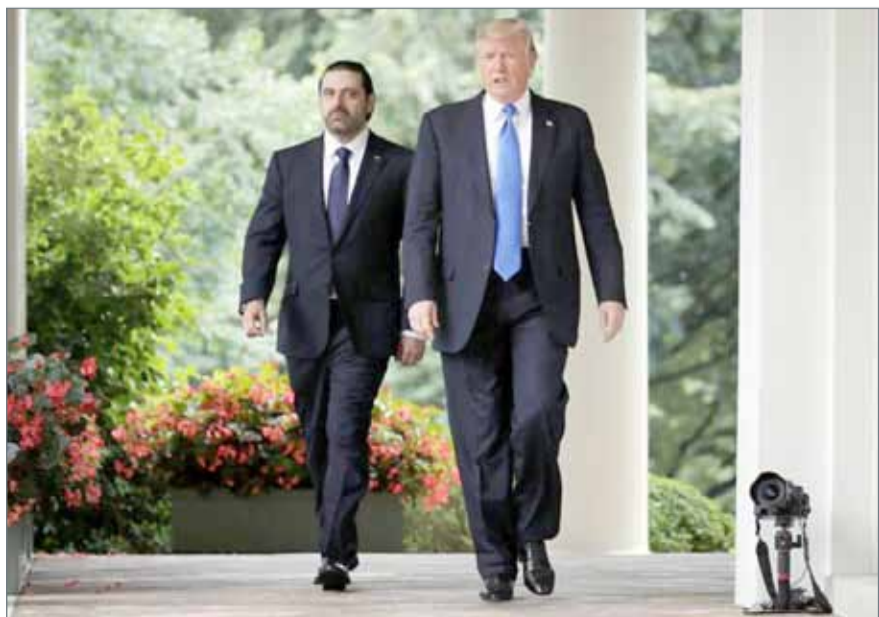
• الرئيس الأميركي مستقبلاً رئيس الوزراء اللبناني

دبي - العربية.نت: اعتبر الرئيس الأميركي دونالد ترامب، إثر لقائه رئيس الوزراء اللبناني سعد الحريري، الثلاثاء، أن "تنظيم (حزب الله) يشكل تهديداً للشرق الأوسط برمته". وقال الرئيس الأميركي في مؤتمر صحفي مع الحريري في حديقة البيت الأبيض إن "حزب الله" هو تهديد للدولة اللبنانية، للشعب اللبناني وللمنطقة برمته، ويفاقم المأساة الإنسانية في سوريا بدعم من إيران. كما أشاد بجمود لبنان لحماية حدوده لمنع تنظيم "داعش" وغيره من الجماعات الإرهابية من كسب موطئ قدم لها داخل البلد، ووعده باستمرار المساعدة الأميركية، مشيراً إلى أن "مساعدة أميركا يمكن أن تساهم في ضمان أن يكون الجيش اللبناني هو المدافع الوحيد الذي يحتاجه لبنان". واتهم ترامب رئيس النظام السوري بشار الأسد، بارتكاب جرائم "فظيعة" ضد الإنسانية.