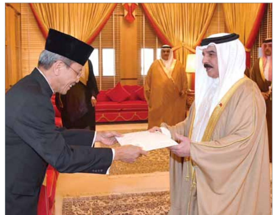
• جلالة الملك يتسلم أوراق اعتماد السفير الاندونيسي