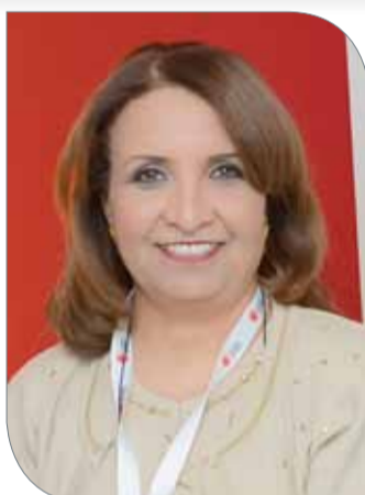
الشيخة حياة بنت عبدالعزيز

أسمى آيات التهاني والتبريكات إلى القيادة الرشيدة وإلى قرينة عاهل البلاد المفدى، رئيس المجلس الأعلى للمرأة صاحبة السمو الملكي الأميرة سبيكة بنت إبراهيم آل خليفة، وإلى ممثل جلالة الملك المفدى للأعمال الخيرية وشؤون الشباب رئيس المجلس الأعلى للشباب والرياضة رئيس اللجنة الأولمبية البحرينية سمو الشيخ ناصر بن حمد آل خليفة، وإلى النائب الأول لرئيس المجلس الأعلى للشباب والرياضة،