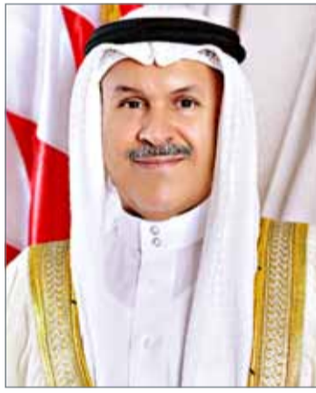
• محافظ العاصمة