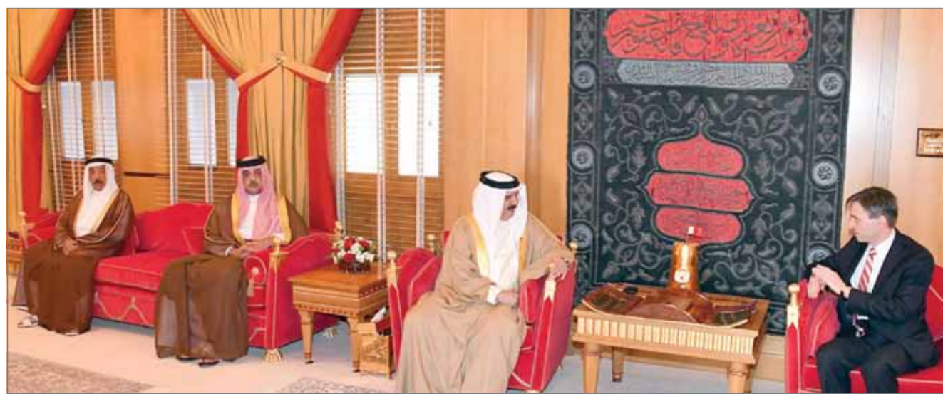
• ... وجلالته مستقبلاً السفير النمساوي

المنامة - بنا: تسلم عاهل البلاد صاحب الجلالة الملك حمد بن عيسى آل خليفة في احتفال جرى في قصر الصخير أمس أوراق اعتماد 3 سفراء جدد لدى مملكة البحرين. وتسلم جلالة الملك أوراق اعتماد كل من سفير الجمهورية الاندونيسية نور شهير راجو، وسفير المملكة الأردنية الهاشمية رامي العدوان، وسفير جمهورية النمسا سيغور باخر.