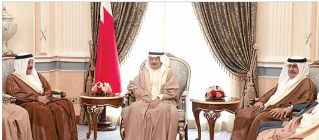
• سمو رئيس الوزراء مستقبلاً كبار أفراد العائلة المالكة والمسؤولين

وقال سموه "إن العمل في إنجاز هذه المشروعات يسير بوتيرة متسارعة، ونحرص شخصياً على متابعة مدى التقدم في عمليات التنفيذ، بالشكل الذي يضمن أن تكون في المستوى الذي يليق بأبناء البحرين".