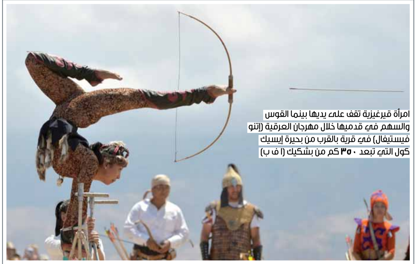
امرأة قير غيزية تقف على يديها بينما القوس والسهم في قدميها خلال مهرجان العرقية (إتو) فيستيفال) في قرية بالقرب من بحيرة إيسيك كول التي تبعد 350 كم من بشكيك (ا ف ب)

يتبع الناس أنواعا مختلفة من الحميات الغذائية؛ سعيا للحفاظ على جسم رشيق، أو رغبة في التخلص من الوزن الزائد. وفي وقت سابق كشف علماء من جامعة لوما ليندا الأميركية بولاية كاليفورنيا عن أن تناول وجبة فطور مشبعة يحد من الشعور بالجوع طوال النهار، الأمر الذي يساعد على فقدان الوزن. إلا أن المختصين في جامعة العلوم والتقنيات في كوانغ تونغ في الصين، أكدوا أن شرب القهوة يوميا سيساعد على تخفيض الوزن. وقام العلماء بإجراء مجموعة تجارب على الفئران، إذ تلقت هذه القوارض جرعات مختلفة من الكافيين، مما سبب لها فقدان الشهية وانخفاض وزنها. يعود هذا المفعول للكافيين إلى أنه يعمل على تعجيل عمليات الاستقلاب بمقدار 10%. وإضافة إلى ذلك تدفع الطاقة التي تنطلق من جراء عمليات الاستقلاب الإنسان إلى أن يؤدي نمطا نشيطا لحياته، ما يؤدي إلى فقدان قدر أكبر من السعرات الحرارية. كما اتضح للمختصين أن عدد فناجين القهوة المطلوب للحد من الشهية يجب ألا يقل عن 4 فناجين قهوة يوميا.