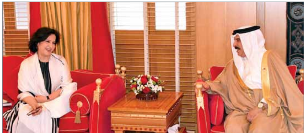
• جلالة الملك مستقبلاً رئيسة هيئة البحرين للثقافة والآثار

وأشارت إلى أن افتتاح طريق اللؤلؤ سيكون يوم 28 نوفمبر من العام نفسه، كما تحدثت عن تقديم مقترح لتسجيل المنامة التاريخية على قائمة التراث الإنساني العالمي لمنظمة اليونسكو، مدينة للتعایش بين الأديان.