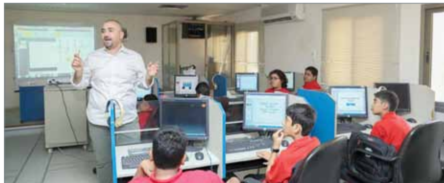
• من فعاليات المعسكر الصيفي للأكاديمية الملكية للشرطة

من الزيارات الميدانية، إضافة إلى مشاركتهم في ورش عمل متنوعة، حيث اطلعوا خلال زيارة إلى وزارة شؤون الإعلام على الأقسام المختلفة والمهام التي تقوم بها الوزارة للارتقاء بالإعلام البحريني، كما تحولوا بين أقسام الإذاعة والتلفزيون واستوديوهات الإنتاج ومركز الأخبار وغيرها من المرافق الإعلامية. كما قام الطلبة بزيارة قيادة طيران الشرطة واطلعوا على نبذة تاريخية حول تأسيسها ومراميل تطورها، بالإضافة إلى تقنيات وأنواع الطائرات وغرفة العمليات الجوية. وفي الناحية الاجتماعية، زار