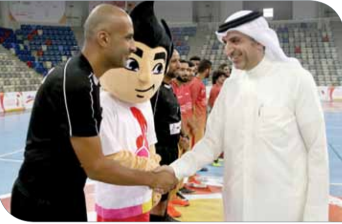
وزير شؤون الشباب والرياضة يصادف لاعبي فريقه الافتتاحي والحكام

مثالية لشغل أوقات الشباب والفتيات المشاركين فيه، مما يخدم تنمية قدراتهم وإبراز مواهبهم، والتي يمكن توظيفها بالصورة السليمة خلال الفترة ما بعد هذا الحدث. فهذا الملحق يساعد على تنمية الجوانب الاجتماعية والرياضية ويعزز لدى الشباب عناصر مهمة، وهي التحدي والإصرار والمثابرة والمنافسة، فهذه العناصر تنمي بشكل كبير شخصية هؤلاء الشباب ونحنهم القدرة على تطوير ذاتهم ورفع مستوياتهم، ليكونوا قادرين على الانضمام للمؤسسات الرياضية وجاهزين للظهور المشرف ورفع اسم مملكة البحرين عالياً بمختلف المحافل والمشاركات.