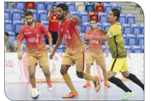
سافرة تنطه المحرق بخماسية