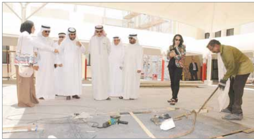
• وزير التربية والتعليم لدى زيارته المنشآت التعليمية