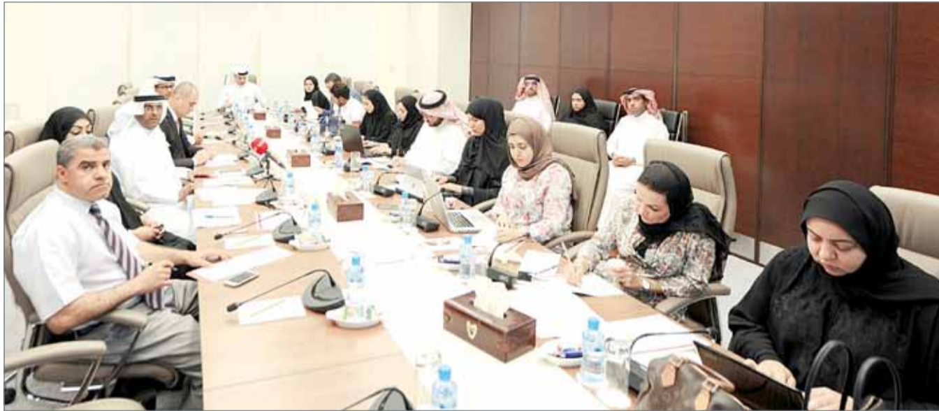
• جانب من المؤتمر الصحافي