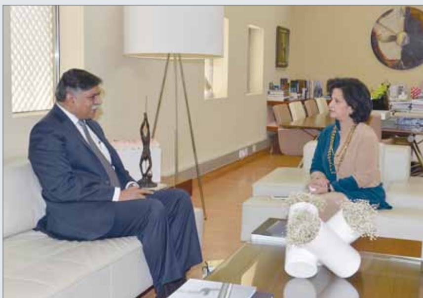
• رئيسة هيئة البحرين للثقافة والآثار مستقبلة السفير الهندي

الدبلوماسية كسفير جديد لبلادها في المملكة. وأكدت الشيخة مي أهمية تقوية روابط الصداقة ما بين شعبي البحرين وماليزيا، مشيدة بمستوى التعاون القائم بين الهيئة والسفارة الماليزية لدى المملكة والذي أثمر مجموعة من الفعاليات الثقافية كالأسبوع الثقافي الماليزي وغيره من الفعاليات، متمنيةً للسفير الماليزي النجاح والتوفيق في مهمات عمله المقبلة. من جانبه، توجه السفير أجوس سليم بن حاجي عبدالصمد بالشكر للشيخة مي، مثنياً جهود الهيئة البارزة في التعريف بحضارة البحرين وتاريخها. وتطلع إلى تعاون مستقبلي لإنجاز العديد من المشاريع والبرامج الثقافية المشتركة ما بين البلدين الصديقين.