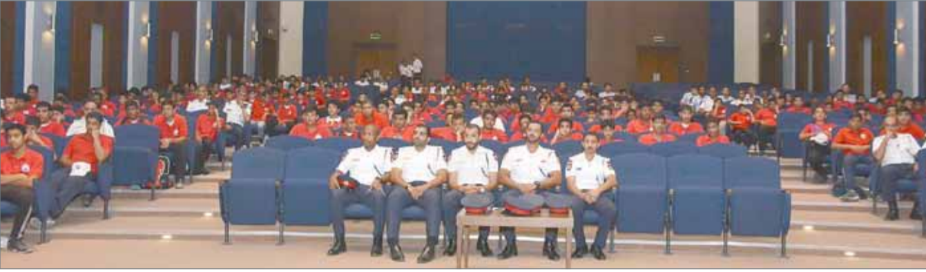
• من فعاليات المعسكر الصيفي التاسع