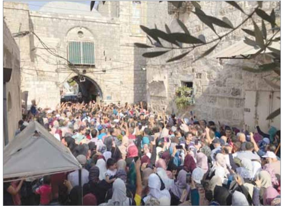
لحظة دخول الفلسطينيين من باب حطة إلى المسجد

القدس المحتلة. وكالات: أصيب العشرات من المصلين الفلسطينيين في اشتباكات مع القوات الإسرائيلية اندلعت خارج المسجد الأقصى وداخل ياحاته بعد أداء صلاة العصر فيه لأول مرة منذ أسبوعين. وتمكن المصلون من الدخول بعد مواجهة مع السلطات الإسرائيلية التي رفضت في البداية فتح باب حطة، لكنها رضخت للضغوط في نهاية المطاف. وأزالت السلطات الإسرائيلية أعلام فلسطين التي وضعها المصلون فوق المسجد الأقصى، كما أنها اقتحمت مصلى قبة الصخرة بالمسجد الأقصى وهاجمت المصلين. من جهته، قال وزير الخارجية الشيخ خالد بن أحمد بن محمد آل خليفة إنه لا يمكن القبول باستهداف الحرم القدسي الشريف بإغلاق أبوابه ومحاولة السيطرة عليه بذريعة المواجهات التي تحدث كل يوم.