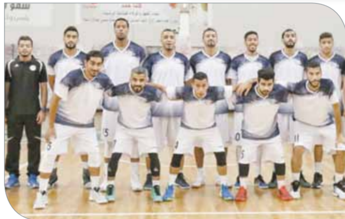
فريق النجمة لكرة السلة