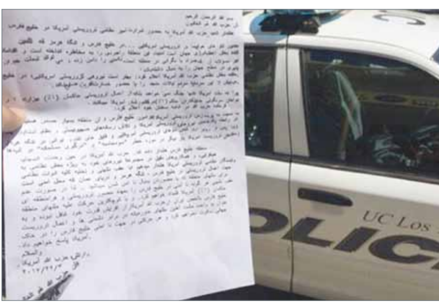
• البيان الذي وزعته مجموعة تطلق على نفسها "جيش حزب الله أميركا"

دبي - العربية نت: وزعت مجموعة تطلق على نفسها "جيش حزب الله أميركا" بياناً مطبوعاً باللغة الفارسية في الولايات المتحدة الأميركية، بحسب وسائل إعلام إيرانية في لوس أنجلوس، هددت بضرب المصالح الأميركية داخل أراضيها في حال عدم انسحاب القوة البحرية الأميركية من الخليج العربي. ويحمل البيان، بحسب ما نشرته الوكالة بتاريخ 22 مارس 2017، إلا أنه تم توزيعه في الساعات الأولى لصباح الأربعاء 26 يوليو في نطاق واسع في حارة الإيرانيين بمدينة لوس أنجلوس. وجاء توزيع هذا البيان التزاماً مع مصادقة الكونغرس الأميركي على عقوبات جديدة تطول الحرس الثوري الإيراني.