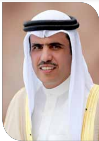
وزير شؤون الإعلام

من لدن سمو الشيخ خالد بن حمد آل خليفة لهذه الفئة الغالية من أبناء البحرين وتحفيزها على تقديم نماذج وطنية شبابية مشرفة في الإرادة والتحصي