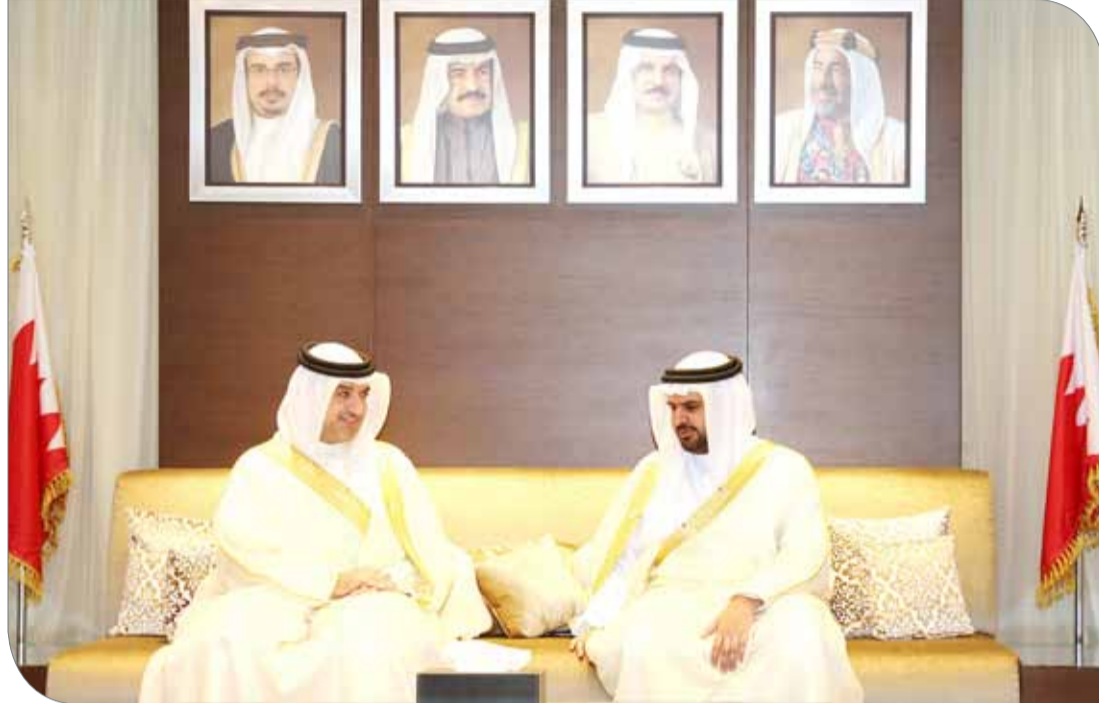
رئيس الاتحاد البحريني لكرة السلة يلتقي بوزير شؤون الشباب والرياضة