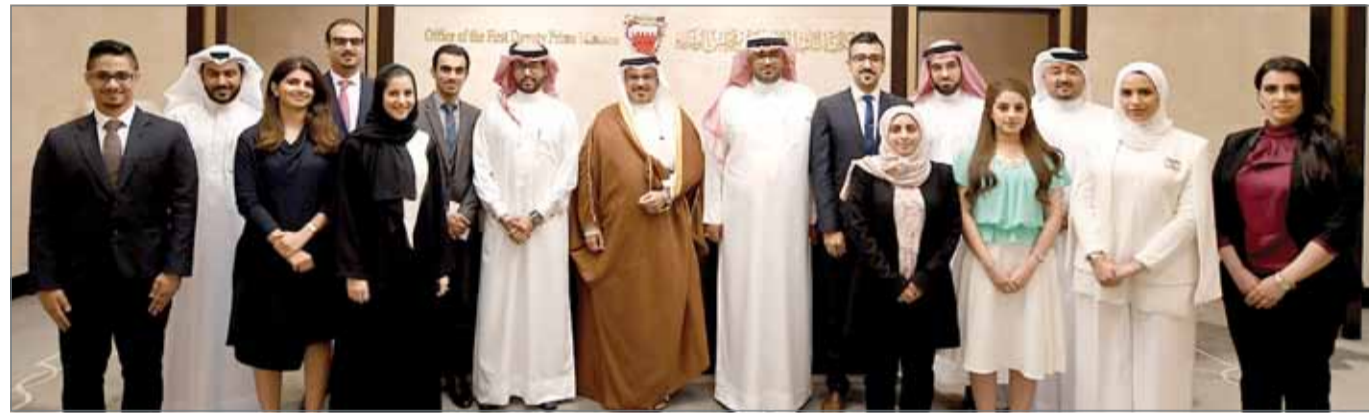
• سمو ولي العهد مستقبلاً الثالثة من الملتحقين ببرنامج النائب الأول لتنمية الكوادر الوطنية

الماضية، مؤكداً سموه الحرص على الاستمرار في دعم البرنامج الذي ألقى الضوء على إمكانات وكفاءات الكوادر الشابة في مختلف مواقع العمل الحكومي وحسن المسؤولية والمبادرة لديهم والمشاركة والعمل جاد.