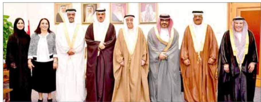
• سمو الشيخ محمد بن مبارك مستقبلاً وزير التربية والتعليم والمسؤولين المعينين

وإعداده، ومنحه من الحوافز والتقدير ما يمكنه من أداء رسالته على أكمل وجه.