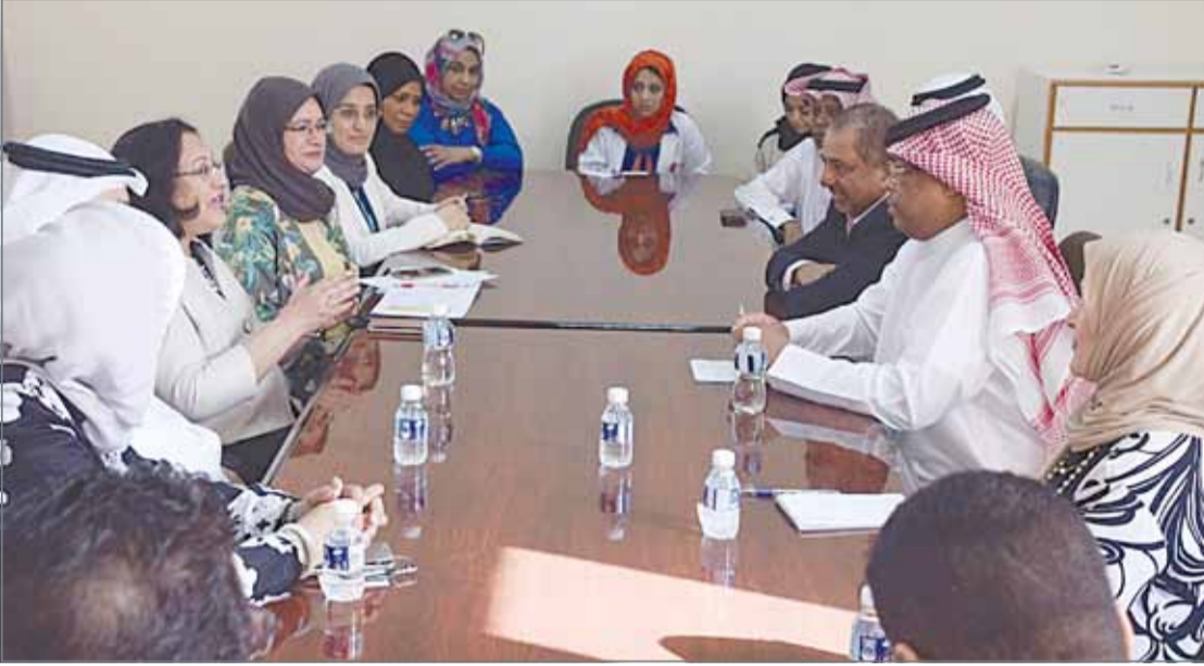
• وزيرة الصحة في زيارة لمركز الشيخ صباح السالم الصحي بمنطقة أم الحصم