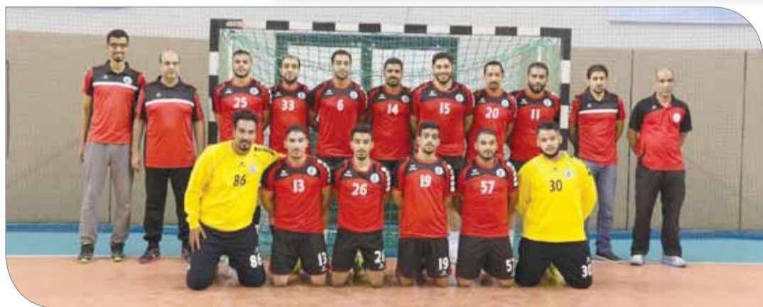
فريق الاتفاق لكرة اليد