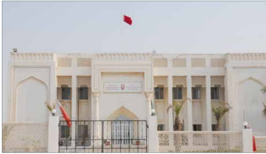
واجهة بلدية الشمالية