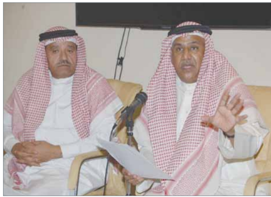
النائب أحمد قرابة يتحدث في اللقاء المفتوح لجمعية "جود"

النماطة - جمعية التجمع الوطني الدستوري: اعترف النائب أحمد قرابة بـ "الظلم البين الحاصل في نظام تقاعد المواطنين مقارنة بتقاعد النواب، حيث يحصل النائب على راتب تقاعدي بنسبة 80% نظير مدة عمل لا تزيد عن 8 سنوات، في حين أن المواطن يعمل 40 سنة ليحصل على النسبة نفسها، وهو ما يعد ظلماً للمواطن البحريني".