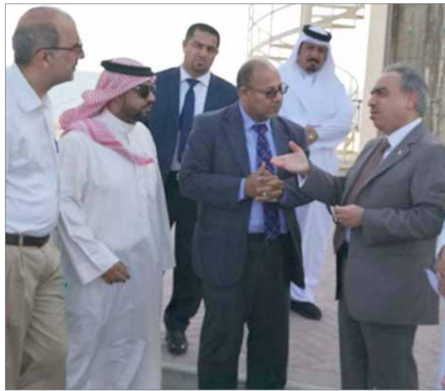
جانب من زيارة وزير الأشغال لمرافأ البديع

قام وزير الأشغال وشؤون البلديات عصام خلف بزيارة ميدانية لمرافأ البديع؛ للوقوف على احتياجات الأهالي وتفقدتها واستكمال النواقص فيها، استجابة لطلب العضو البلدي عبد الله الدوسري.