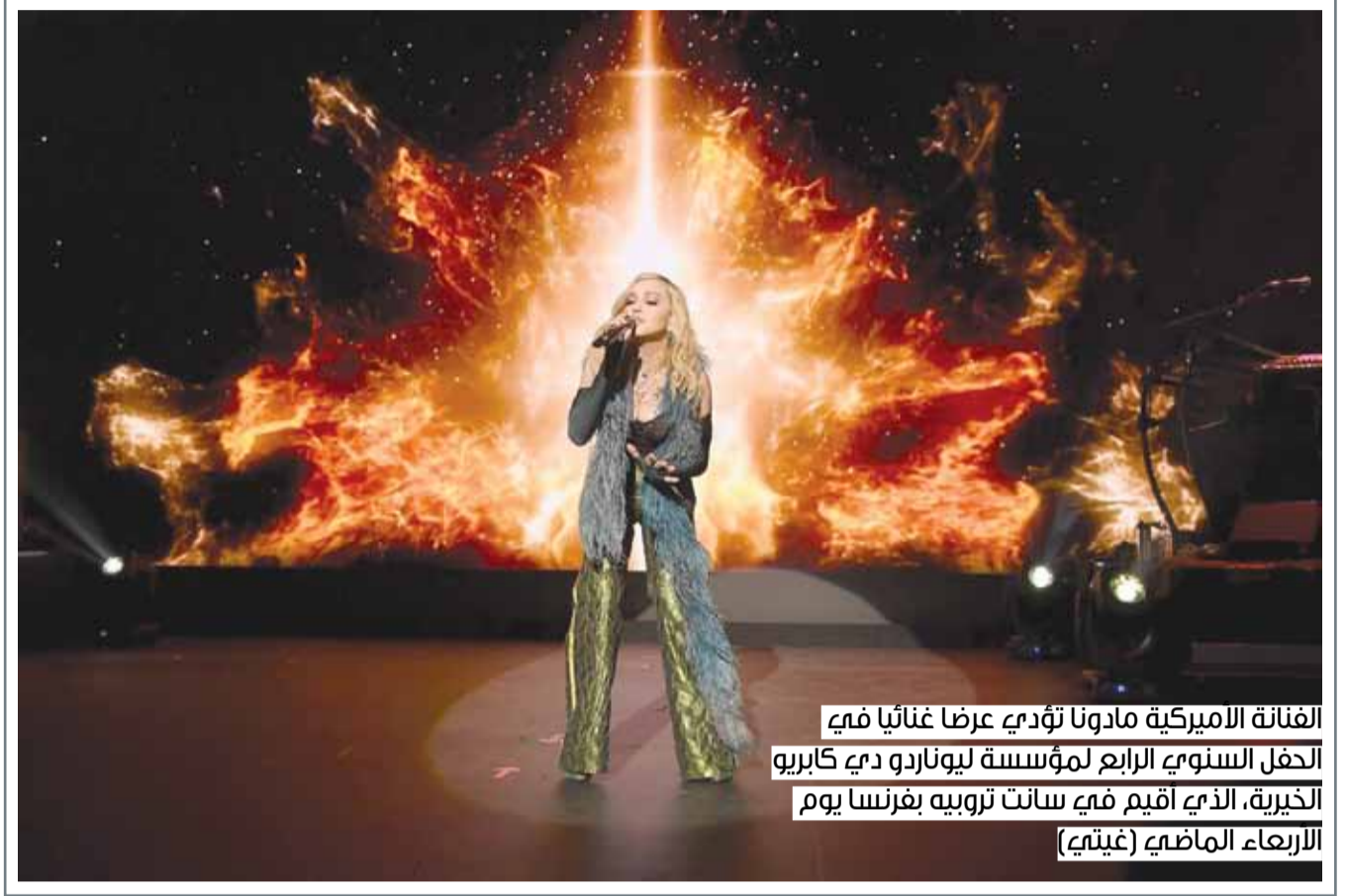
الفنانة الأميركية مادونا تؤدي عرضا غنائيا في حفل السنوي الرابع لمؤسسة ليوناردو دي كاريو الخيرية، الذي أقيم في سانت تروبيه بفرنسا يوم الأربعاء الماضي

كشفت عالمة أسترالي عن لغز مثلث برمودا، وهي منطقة مائية واقعة في شمال المحيط الأطلسي، كان يعتقد أن سفن وطائرات اختفت فيها من دون أثر، في بدايات القرن الماضي. ووفقا لصحيفة "إندبندنت"، توصل العالم الأسترالي كارل كروزلنكي، إلى أن اختفاء الطائرات والسفن في السابق، يعود ببساطة لأخطاء بشرية في القيادة، بسبب المناخ المتقلب في تلك المنطقة. كما أصر كروزلنكي على أنه لا يوجد أي شيء مريب في تلك المنطقة، بل إن العدد الكبير من حوادث الاختفاء يعود لارتفاع عد السفن والطائرات التي تمر بتلك المنطقة، ما يرفع معدل الحوادث التي تبدأ رصدها منذ ديسمبر العام 1945. وقال كروزلنكي إن معدل الطائرات والسفن المختلفة لا يختلف كثيرا عن معدل الاختفاء في مناطق أخرى، إذا ما تم مقارنتها نسبيا. ويرمز مثلث برمودا إلى المنطقة ما بين جزيرة برمودا وولاية فلوريدا الأميركية وبورتوريكو في المحيط الأطلسي.