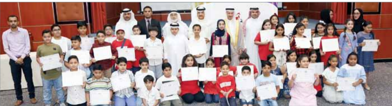
• لحظة من التكريم

في نهاية المطاف في عملية التنمية المجتمعية الشاملة".