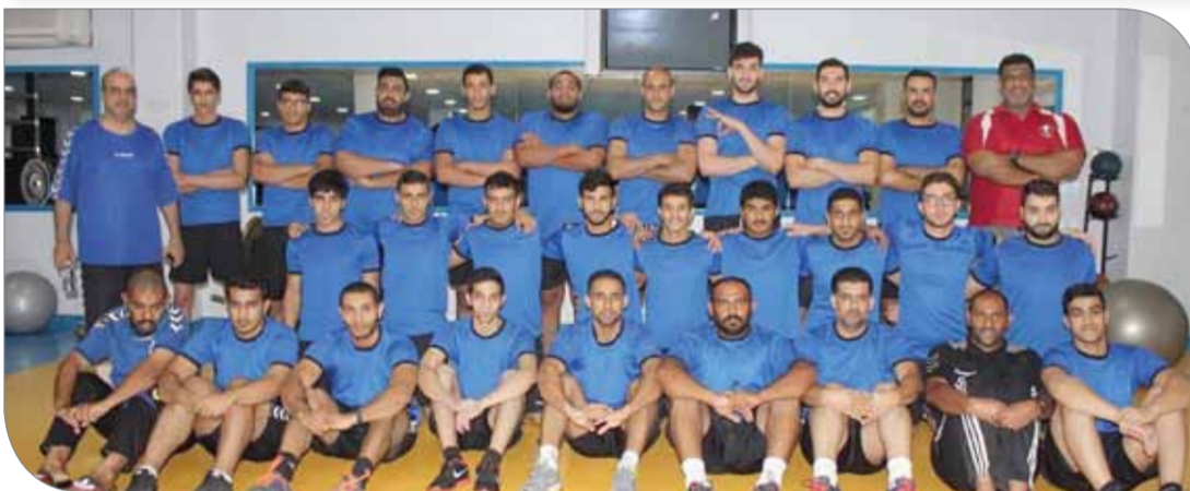
لقطة جماعية لفريق الدير خلال التدريبات

الدخول في خوض التجارب الودية. وعن طموحه مع الدير في الموسم الجديد، كشف المراغبي عن أنه يأمل ويسعى لتحقيق مركز متقدم مغاير عن المراكز السابقة التي خرج بها ”البرنقالي“، وأنه أوصل هذه النقطة والاعداد بدأت مطلع شهر يوليو