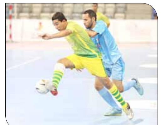
كرانة حقق فوزاً ممتعاً على صدد