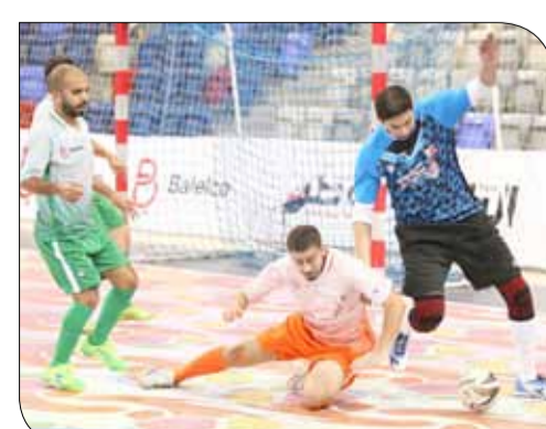
الدير وجرداب تعادلا بهدفين لكليهما