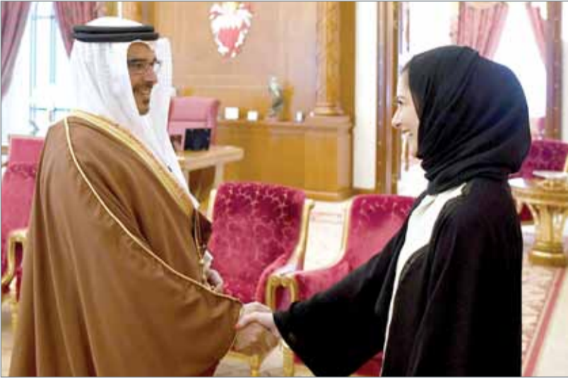
• سمو ولي العهد مستقبلاً الدفعة الثالثة من الملتحقين ببرنامج النائب الأول لتنمية الكوادر الوطنية

المنامة - بنا: أشاد ولي العهد نائب القائد الأعلى النائب الأول لرئيس مجلس الوزراء صاحب السمو الملكي الأمير سلمان بن حمد آل خليفة بحرص الشباب البحريني علي خدمة وطنه بما يمكنه من الإسهام بفاعلية أكبر في مسيرة التنمية الشاملة التي يقودها عاجل البلاد