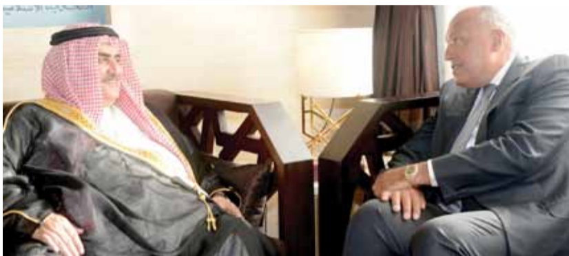
• وزير الخارجية مجتمعاً مع نظيره المصري بمقر الجامعة العربية في القاهرة

وخلال الاجتماع، تم تأكيد قوة ومتانة العلاقات التاريخية والمتميزة بين البلدين ولكل ما فيه صالح البلدين ويسهم إيجابياً في والشعبين الشقيقين، وأهمية استمرار التعاون