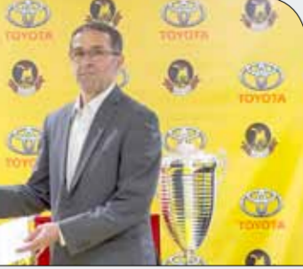
جانب من تسلّم الدعم

صاحب الجلالة الملك حمد بن عيسى بن سلمان آل خليفة بالتهنؤوس بالوطن والارتقاء به، في هذه الرعاية التي حتماً ستسهم فيدعم المواهب الرياضية منذ الصغر من خلال توفيرها البنية الأساسية لهم والتي ستدفعهم لإثبات ذاتهم في هذا المجال بالإضافة إلى وضع مملكتنا الغالية على خريطة الرياضة العالمية.”