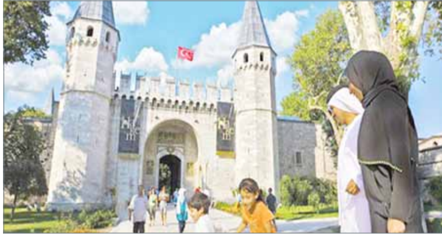
• بات الخليجيون يفضلون تركيا للاستثمارات والسياحة عن أوروبا وأميركا

هذا العام بنسبة 66.3%، مقارنة بالفترة نفسها من العام الماضي.