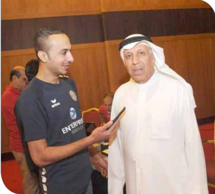
صورة أرشيفية لـ ”أبوالليل“ خلال البطولة الآسيوية للأندية فيه نسختها قبل الماضية

حول العدد المتوقع للفرق المشاركة، بين المدير التنفيذي للاتحاد الآسيوي أنهم على اطلاع بالفرق التي ستشارك بينه وبين ”الآسيوي“ بسبب مطالبة الأول بإقامة البطولة في شهر ديسمبر الجاري، وهذا ما يتعارض مع إعداد المنتخبات في الشهر ذاته لتنصفيات الآسيوية المؤهلة لكأس العالم والمقرر إقامتها في يناير العام المقبل. ومن المؤمل أن يشارك فريق النجمة البحرين وعمان والإمارات، موضحاً أن هذه الأرقام تعتبر أولية وتقديرية وقد تتغير مع الفترة المقبلة بحسب ظروف النجمة إنجازاً فريداً في سجل هذه البطولة بتحقيقه المركز الثاني بنسختها من إيران وفريق من الهند ومثله من البحرين وعمان والإمارات، موضحاً أن هذه الأرقام تعتبر أولية وتقديرية وقد تتغير مع الفترة المقبلة بحسب ظروف النجمة إنجازاً فريداً في سجل هذه البطولة بتحقيقه المركز الثاني بنسختها المقامة في قطر قبل عامين، ويعتبر هو الإنجاز الأبرز للفرق البحرينية على مستوى آسيا.