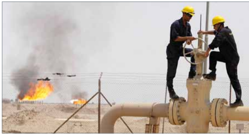
• اتفاق دول "أوبك" على خفض الإنتاج من شأنه دعم أسعار النفط عالمياً

الروسية خلال الفترة من 23 إلى 25 الجاري. وأضاف أنه تم خلال الاجتماع الذي حضره أعضاء اللجنة الذين يمثلون دول روسيا وفنزويلا والجزائر وعمان إضافة إلى السعودية بصفتها رئيس المؤتمر الحالي لـ(أوبك) مراجعة بيانات إنتاج يونيو الماضي ونسب التزام الدول المشاركة في الاتفاق.