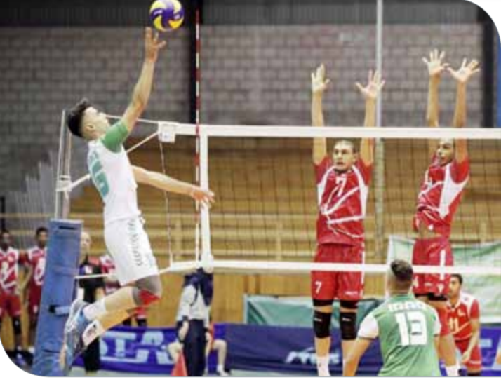
جانب من لقاء منتخبنا والعراق