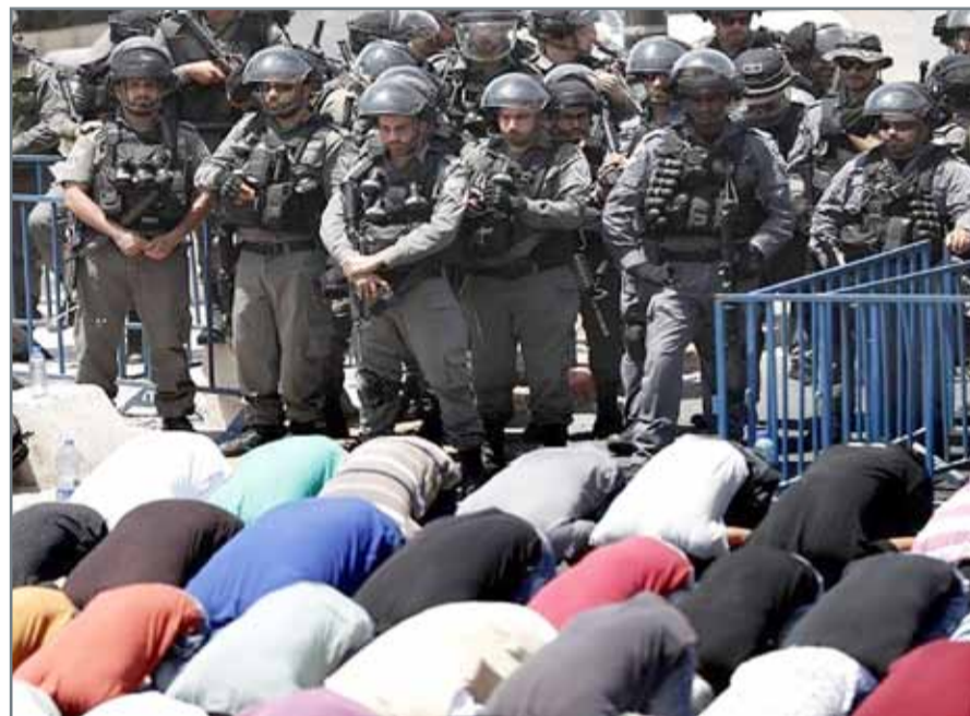
• الفلسطينيون يؤدون الصلاة في المسجد الأقصى بعد رفع السلطات الاسرائيلية القيود

القدس المحتلة . وكالات: أعلنت دائرة الأوقاف الإسلامية في القدس، أمس الجمعة، إنها تلغى رسمياً من سلطات الاحتلال الإسرائيلي فتح كل أبواب المسجد الأقصى ورفع القيود العمرية. وأقيمت أول صلاة جمعة في المسجد الأقصى، بعدما أزال الاحتلال الإسرائيلي البوابات الإلكترونية التي أثار موجة غضب عربية وإسلامية. وذكرت الأوقاف الإسلامية أن أكثر من 10 آلاف فلسطيني تمكنوا من الوصول إلى المسجد الأقصى. وكانت قوات الاحتلال قد منعت من هم دون الخمسين عاماً من الرجال فيها سمحت للنساء والشيوخ بالدخول للصلاة في الأقصى. واستشهد فلسطيني، برصاص الاحتلال بزعم محاولته تنفيذ عملية طعن عند مستوطنة جنوبي بيت لحم. وفي قطاع غزة، استشهد فلسطيني يبلغ من العمر 16 عاماً برصاص الجيش الإسرائيلي، أثناء احتجاجات تضامنية مع الأقصى شرق مخيم البريج، وسط القطاع أمس.