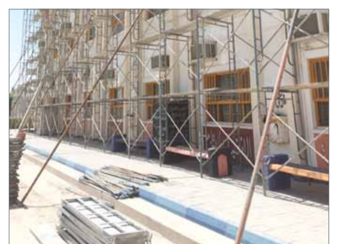
• جانب من أعمال الصيانة في المدارس الحكومية

الشبكات وخزانات المياه، إضافة الى ذلك الأعمال الكهربائية التي تشتمل على لوحات التوزيع الكهربائية والمصابيح للمباني الحكومية المسجلة في قاعدة بيانات إدارة شؤون الأملاك الحكومية بوزارة المالية.