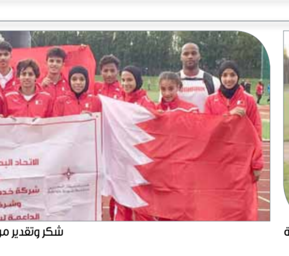
الرفاع اتحاد ألعاب القوى