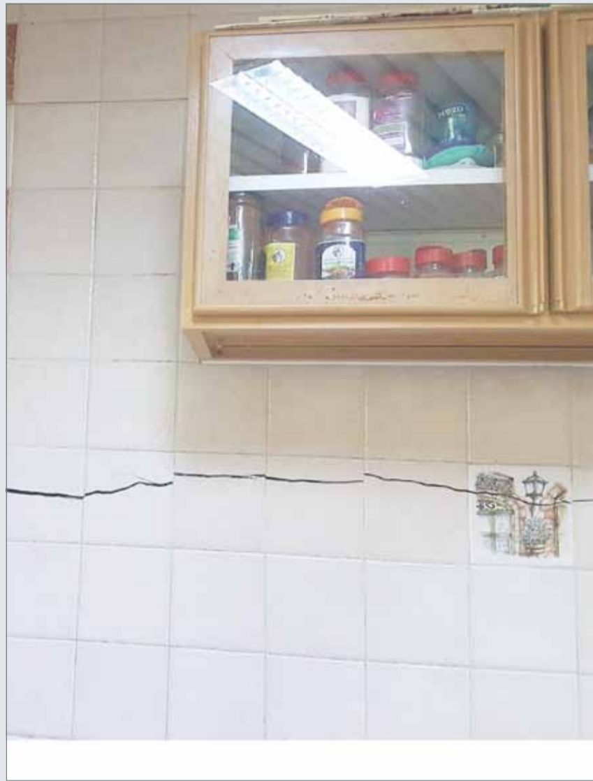
• جانب من الأضرار التي سببها ترسب المياه في المنزل

ناشد مواطن عبر "البلاد" وزير شؤون الكهرباء والماء عبدالحسين ميرزا معالجة ما تعرض له منزله من أضرار بالغة بسبب تمديدات خاطئة للكهرباء والماء أدت إلى تفكك الجدران في المنزل لترسب أنابيب المياه بداخل البناء.