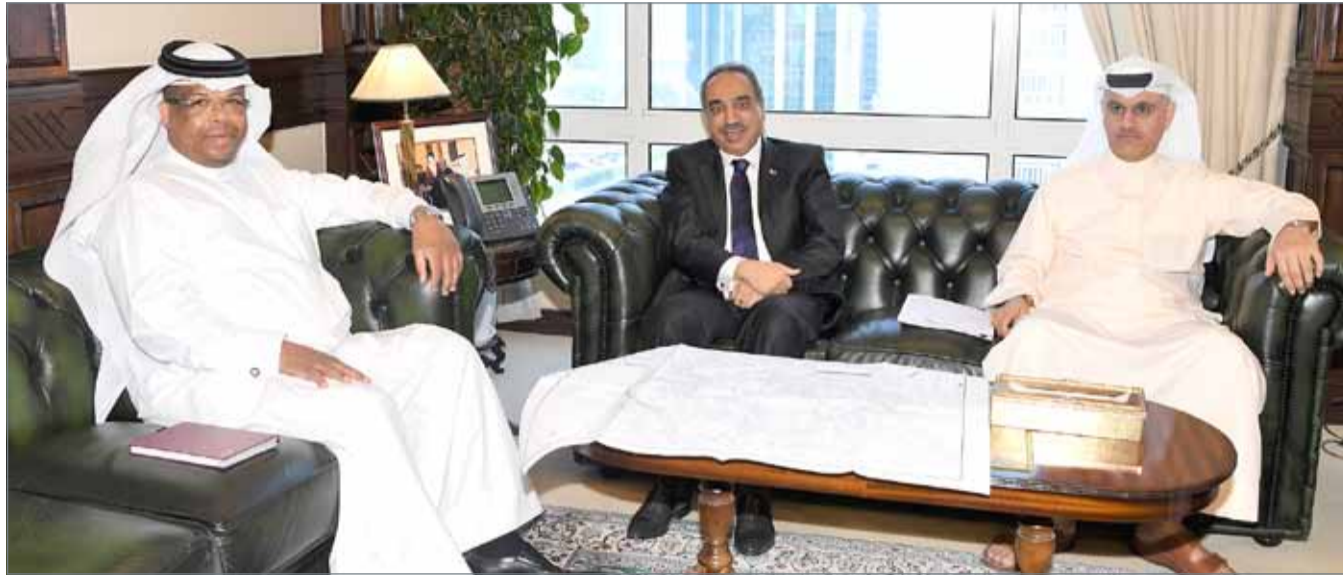
• وزير الأشغال في لقاء مع النائب عبدالرحمن بومجيد بحضور مدير أمانة العاصمة

وتمت مناقشة الموضوعات الخدمية التي سيتم التطرق اليها في زيارة منطقة ام الحصم غداً استناداً الى توجيهات رئيس الوزراء وذلك بمعية وزراء القطاعات الخدمية وهم كل من وزير الاشغال وشؤون البلديات والتخطيط العمراني ووزير الاسكان ووزير شؤون الرياضة والشباب وذلك للوقوف على الاحتياجات الفعلية لأهالي المنطقة.