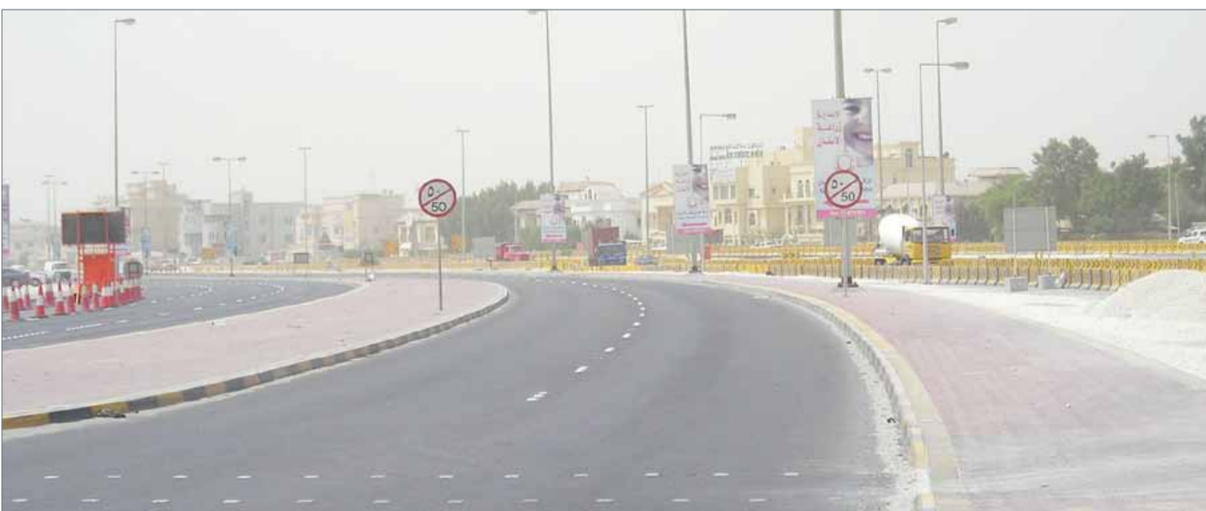
• التوسعة السابقة لشارع الخدمات لم تحل المشكلة (أرشيفية)

أعلنت وزارة الأشغال وشؤون البلديات والتخطيط العمراني لـ "البلاد" أنه لا توجد ميزانية لدى الوزارة من أجل تطوير شارع الخدمات، مشيرة إلى أن الوزارة وضعت التصاميم اللازمة لتطوير الشارع، وستبدأ بالتنفيذ فور اعتماد ميزانية للمشروع.