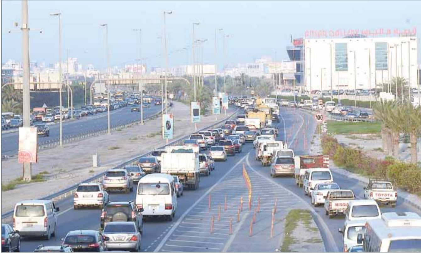
• شارع الخدمات يتسبب في ازدحامات بالشارع المحيطة به

يشار إلى أن المشروع الإسكاني المتكون من 270 منزلاً وعدداً من العمارات حتى الآن لم يقطنه مستحقوه، وعلى المرء أن يتصور حجم المشكلة عند افتتاح هذا المشروع الحيوي الذي تم توزيع وحداته، وهو في صدد التسليم في الوقت القريب.