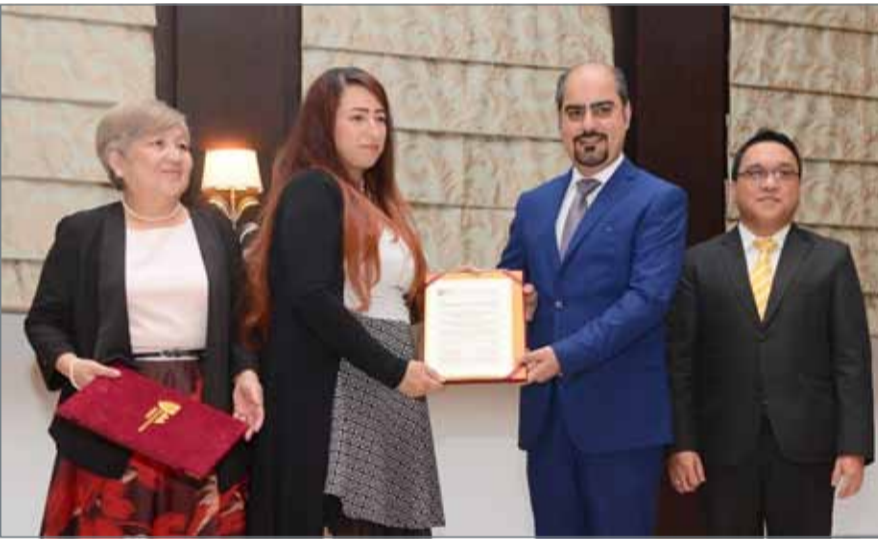
• من فعاليات يوم المهن بجامعة "AMA" الدولية