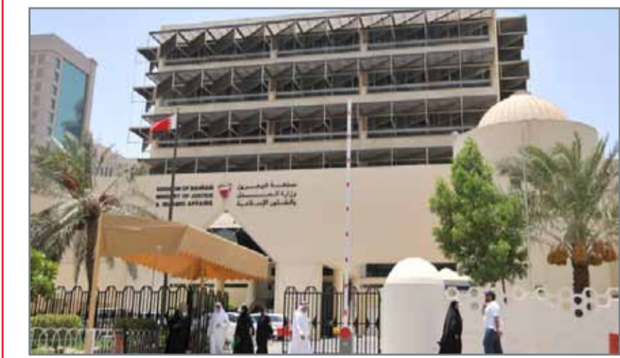
• يجب أن يكون مقدم الطلب بحريني الجنسية يقرأ ويكتب