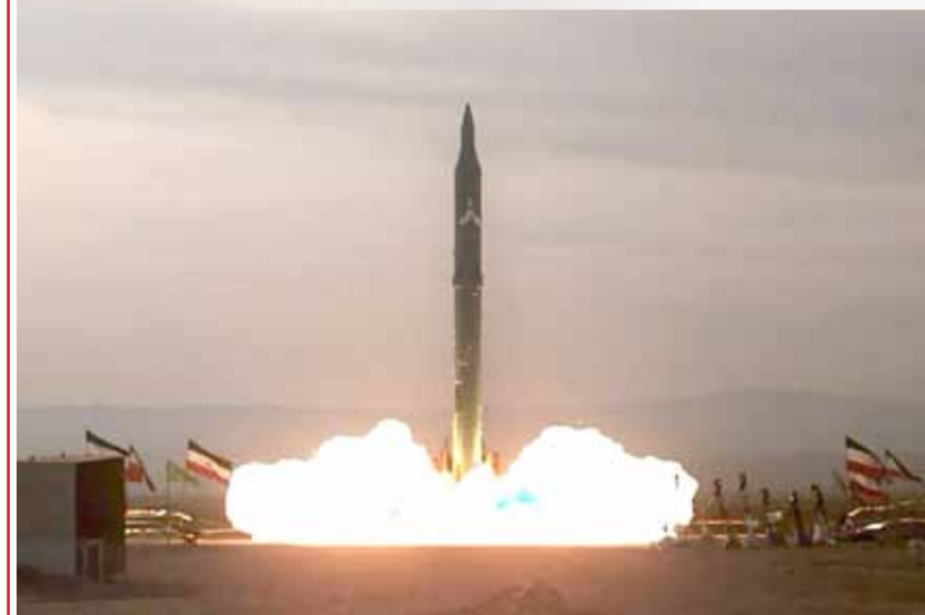
• التجارب الصاروخية الإيرانية تثير قلقاً أميركياً