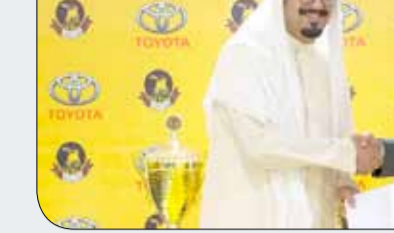
جانب من تسلّم الدعم

يعتبر المنتخب الصيني زعيم قارة آسيا على صعيد لعبة كرة السلة، إذ نجح في الفوز بهذه البطولة 19 مرات، أعوام 1975، 1977، 1979، 1981، 1983، 1987، 1989، 1991، 1993، 1995، 2001، 2003، 2005، 2011، 2015، 2017، فيما حل وصيفاً لمرة واحدة فقط عام 2009. كما استضافت الصين بطولة آسيا لـ 6 مرات عبر التاريخ أعوام: 1989-2001-2003-2009-2011-2015. يحتل المنتخب الصيني الذي انضم إلى الاتحاد