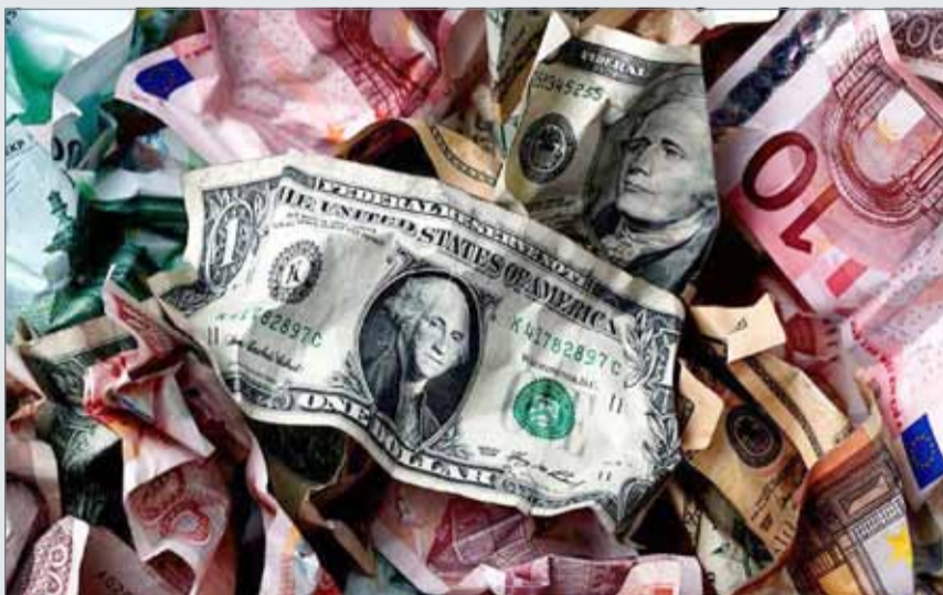
• يتراجع الدولار وسط حالة من عدم اليقين السياسي داخل الولايات المتحدة

خلال الفترة المقبلة بين تكهنات استعادة مستوياته المرتفعة، وأخرى تشير إلى اتجاهه نحو مزيد من التراجع. وتوقع محللون أن يتراجع الدولار أمام اليورو إلى مستوى 1.20 دولار بنهاية العام الحالي، نتيجة تراجع قناعات المستثمرين نحو اقتصاد الولايات المتحدة.