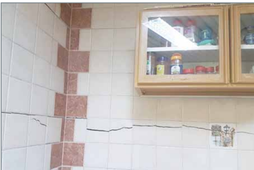
• جانب من الأضرار التي سببها ترسب المياه في المنزل