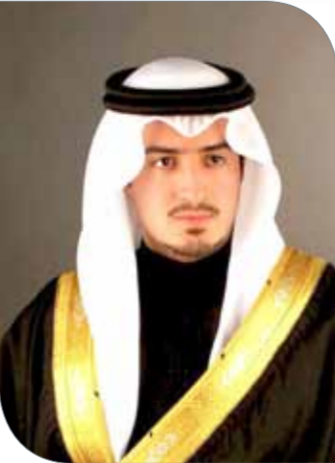
كلال بن حمود

21 هدفا. تأهل الفريق للنهائي بعد تصدرة منافسات الدور الأول برصيد 16 نقطة من خمسة انتصارات وتعادلا، قبل أن يتفوق على فريق فندق الخليج في مباراة الدور النهائي بنتيجة 4-2. وستيفضل بعدها راعي المباراة النهائية الشيخ خالد بن حمود آل خليفة بتكريم الفئزته الفائز بالبطولة، وكذلك تكريم أبرز اللاعبين بالجوائز الفردية، وهي جائزة أفضل لاعب، وأفضل حارس، والهداف.