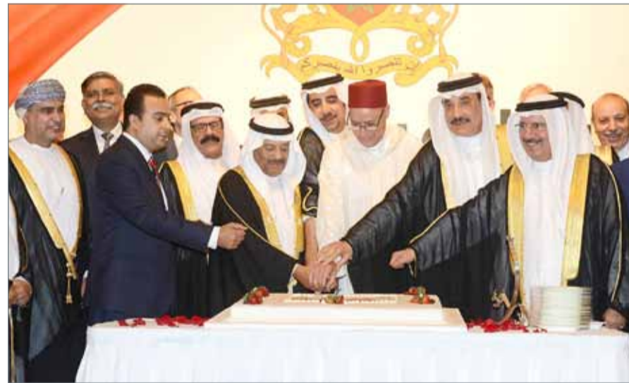
• سفير المملكة المغربية بالعمارة يقيم حفل استقبال بمناسبة عيد العرش

تشاركياً خلافا للنموذج الإفريقي، وتحسين أوضاعه المعيشية، وفق المقاربة الملكية الطموحة، لبناء مستقبل جماعي أفضل لإفريقيا، مستقبل يظل رهينا بتحقيق إقلاع تنموي حقيقي قادر على تاهيل قارتنا الواعدة في تماثل مع تطلعات الأجيال الإفريقية الصاعدة بروج من الثقة والالتزام القوي لاحتواء مخلفات الماضي وتجاوز ترسبات الصراعات الإيديولوجية. كما أكد عمق وتميز وحيوية العلاقات المغربية-البحرينية بفضل التوجهات السامية لعاهلي البلدين الشقيقين صاحب الجلالة الملك محمد السادس وأخيه صاحب الجلالة حمد بن عيسى آل خليفة، في إطار من التضامن الكامل حيال القضايا الوطنية.