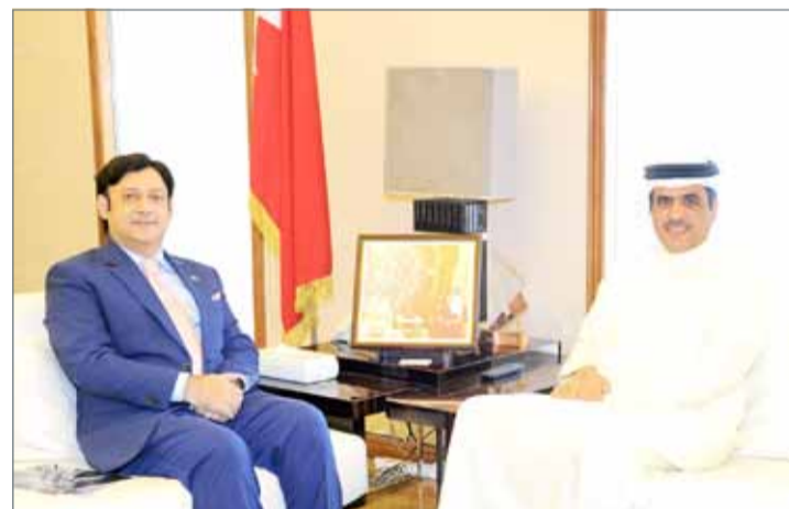
• وزير شؤون الإعلام مستقبلاً السفير الباكستاني

بالإسهامات المتميزة للجالية الباكستانية في مختلف مجالات التنمية الاقتصادية والاجتماعية. ومن جانبه، أعرب السفير الباكستاني عن شكره وتقديره إلى وزير شؤون الإعلام على حسن استقباله، مؤكداً الحرص المشترك على تعزيز العلاقات الثنائية الوطيدة القائمة بين البلدين الصديقين، لاسيما في المجال الإعلامي، بما يحقق المصالح المشتركة.