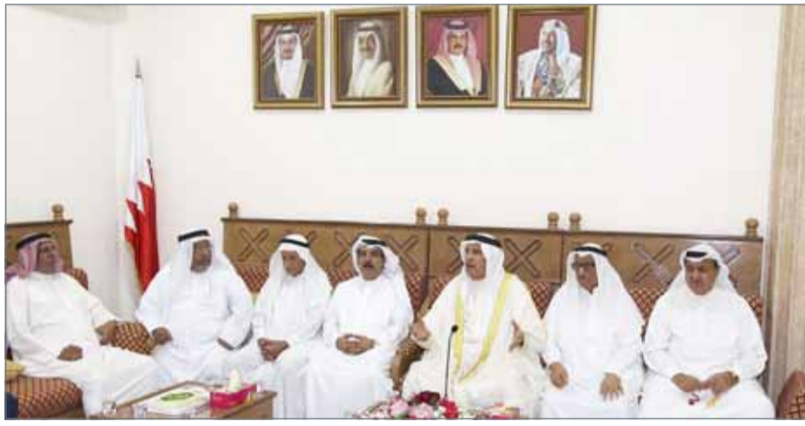
مجلس محافظة المحرق