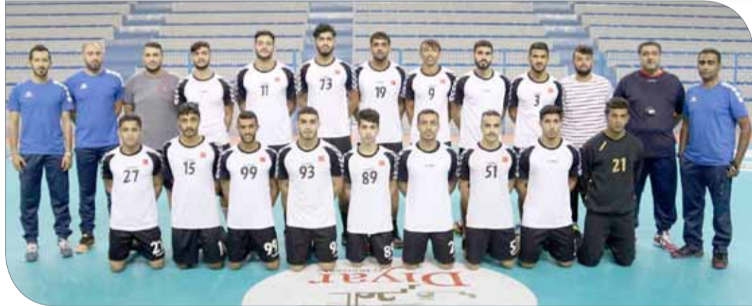
منتخبنا الوطني للناشئين لكرة اليد

وسيكون منتخبنا ضمن المجموعة الأولى بحسب ما أسفرت عنه القرعة، التي تضم كل من «فرنسا، الدنمارك، السويد، مصر والنرويج». وسيلعب 24 منتخباً موزعون على 4 مجموعات، بنظام الدوري من دور واحد في كل مجموعة لتحديد المنتخبات المتأهلة إلى الدور الثاني بواقع أربع منتخبات في المرحلة الأولى ومن ثم تطبيق لائحة البطولة وفقاً لنظام الإقصاء الدولي لكرة اليد في مسابقات كأس العالم.