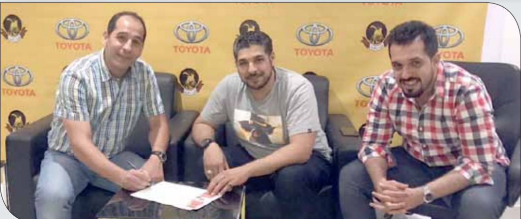
جانب من توقيع العقد