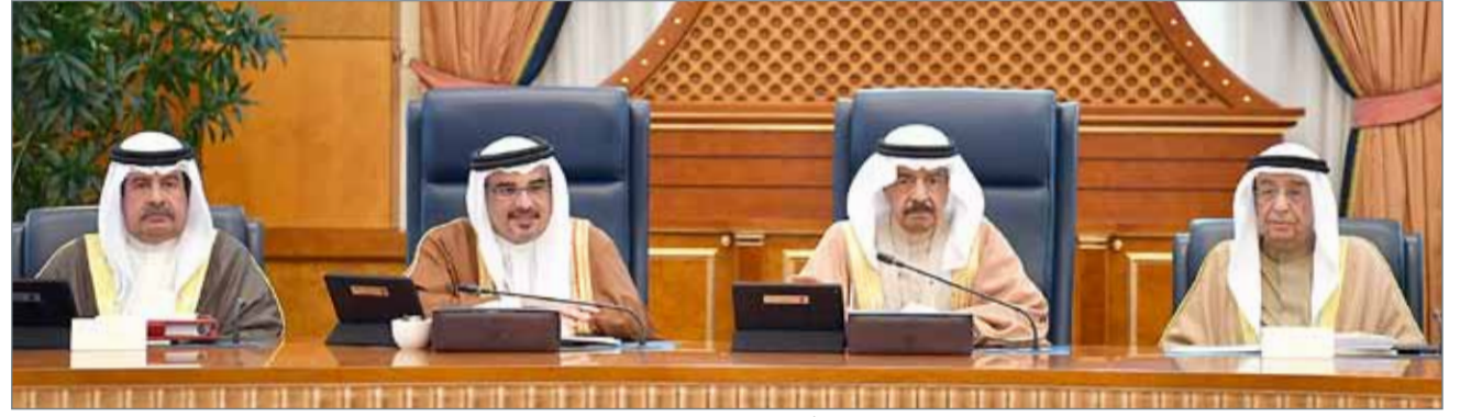
• سمو رئيس الوزراء مترشقا، بحضور سمو ولي العهد، جلسة مجلس الوزراء أمس