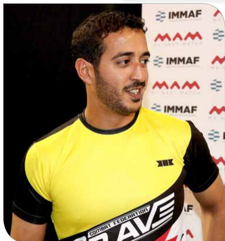
سمو الشيخ خالد بن حمد آل خليفة

كرامة واهتمام خاص من قبل سموه. وأكد أن الرعاية تأتي في إطار اهتمام الشركة بتفعيل مبدأ المسؤولية الاجتماعية من خلال القيام بواجبها تجاه الشباب البحريني وتطبيقا للإستراتيجية التي وضعتها لتكون جزء في دعم الفعاليات المعنية بالقطاع الشبابي. ولفت طارق إلى أن الشركة تشع بالفخر والاعتزاز في التعاون مع برامج ونشاطات سمو الشيخ خالد بن حمد آل خليفة، إذ تحرص الشركة على تقديم كل الدعم والرعاية للدوري، والتي تهدف إلى جمع شمل الشباب البحريني في مكان واحد.