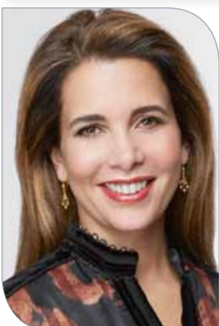
الأميرة هيا بنت الحسين

العواجز للفروسية. وفي عام 1992، كانت الأميرة هيا أول سيدة تفوز بالميدالية العربية الفروسية عندما فازت بالميدالية البرونزية الفردية في دورة الألعاب العربية الفروسية. وفي عام 2000، مثلت الأردن في قفز العواجز في دورة الألعاب الأولمبية في سيدني، وحصلت علم بلاها في الأولمبياد. وإدراكاً منها لأثر الإيجابي والفاعل الذي أحدثته الرياضة على حياتها الشخصية، عملت الأميرة هيا جاهدة من أجل تمكين الشابات في كل مكان من خلال الرياضة، وهو طموح انعكس على مر السنين في جهودها الدؤوبة كعضو في اللجنة الأولمبية الدولية ورئيسة الاتحاد الدولي للفروسية، وهي الهيئة الإدارية الدولية لرياضة الفروسية. وفي عام 2015، حصلت الأميرة على جائزة سيدات لوجين المرموقة تقديراً لتفانيها في تطوير رياضة الفروسية. وفي معرض حديثها عن مشاركتها في