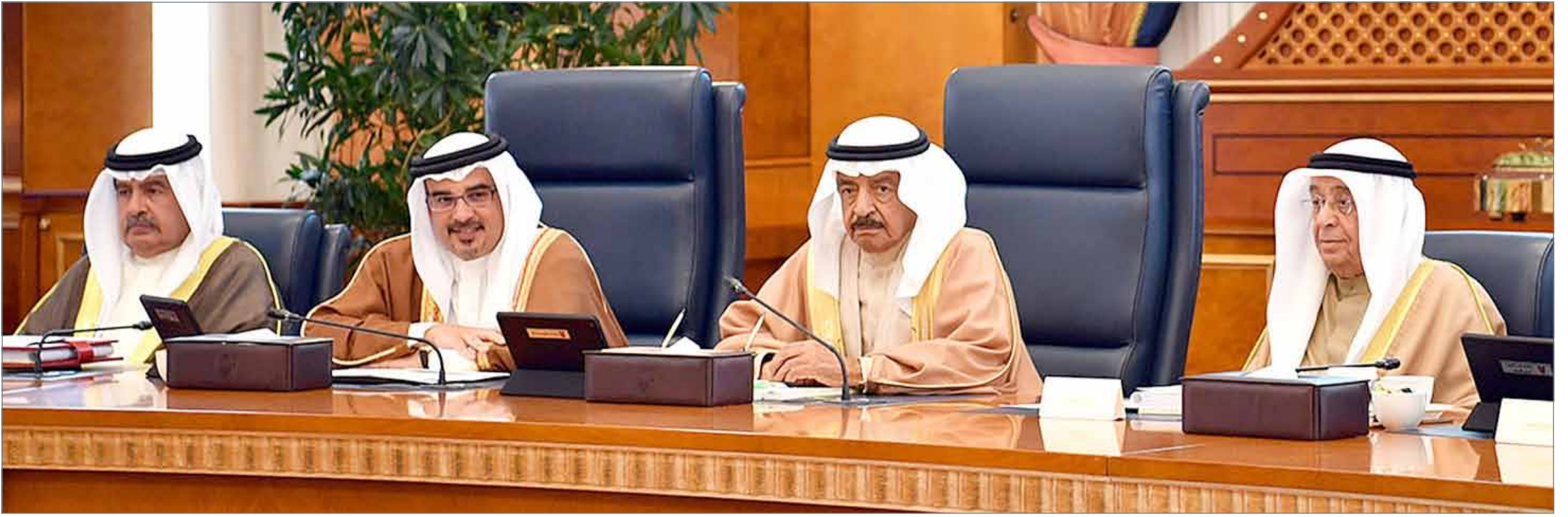
• سمو رئيس الوزراء متر فسا، بحضور سمو ولي العهد، جلسة مجلس الوزراء أمس

استهداف الحوثيين لمكة بالصواريخ عمل إجرامي دنيء... رئيس الوزراء يوجه: