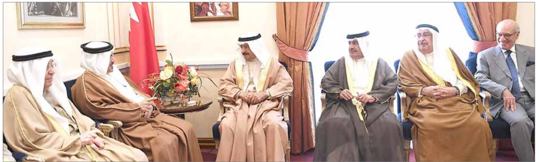
• سمو رئيس الوزراء مستقبلاً سمو ولي العهد

المنامة - وزارة الخارجية : أدانت وزارة خارجية بشدة الاعتداء الإرهابي الذي وقع بمحافظة القطيف بالمملكة العربية السعودية الشقيقة، وأسفر عن استشهاد رجل أمن وإصابة آخرين، معربة عن خالص التعازي وصادق المواساة لأهالي الشهيد، وتمنياتهما بالشفاء العاجل لجميع المصابين جراء هذا العمل الإرهابي الأثم. وشددت الوزارة على وقوف مملكة البحرين إلى جانب المملكة العربية السعودية في حربها ضد كل أشكال الإرهاب ومن يدعمه ويؤمله، وتأييدها التام لكل ما تتخذه من إجراءات وتدابير لاستتباب الأمن وللمساعيها الدعوية والمقدرة لتعزيز السلم والاستقرار على الصعيدين الإقليمي والدولي، مجددة موقف مملكة البحرين الثابت المناهض للعنف والتطرف والإرهاب والداعي لضرورة توثيق التعاون الدولي وتضافر الجهود المبذولة كافة للقضاء على الإرهاب.