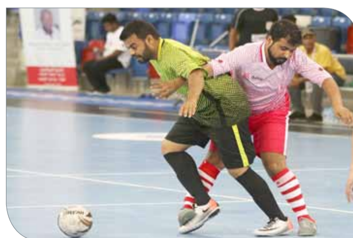
من لقاء القرية مع فريق الحورة والقضيبيية