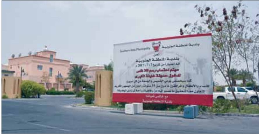
صور للإعلان بحديقة خليفة الكبرى

الرفاع - بلدية المنطقة الجنوبية : أعرب زوار حديقة خليفة الكبرى من النساء والأطفال عن ارتياحهم لقيام بلدية المنطقة الجنوبية بتخصيص يومين في الأسبوع (الخميس والجمعة) لمن ممارسة رياضة المشي واستخدام مرافق الحديقة، وذلك بعد أن تم تفعيل القرار الوزاري بهذا الشأن منذ نحو أسبوعين.