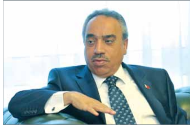
• وزير الأشغال

● مساحة الأرض 100 ألف فدان بما يعادل 42 ألف هكتار