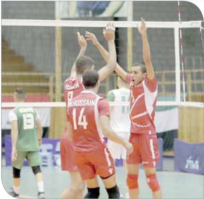
فوز رابع لمنتخب الناشئين علم عمان