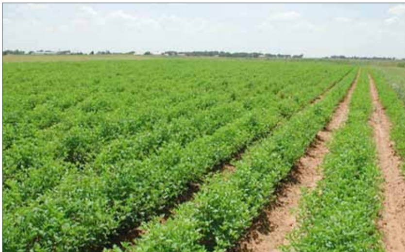
• تنفيذ المشروع على 4 مراحل ويوفر السلع الاستراتيجية (أرشيفية)