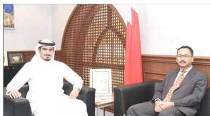
• الرئيس التنفيذي لهيئة السياحة والمعارض مستقبلاً السفير الماليزي

من جانبه، أعرب السفير الماليزي لدى مملكة البحرين أجوس سليم بن حاجي عن سعادته بما حظي به من حفاوة ترحيب بهذه المناسبة، كما أكد حرص بلاده على المزيد من التعاون والتنسيق مع مملكة البحرين على مختلف الأصعدة بما يلي طموحات البلدين والشعبين الصديقين، معرباً عن ارتياحه للمستوى المتقدم الذي وصلت إليه علاقة متميزة في كافة المجالات.