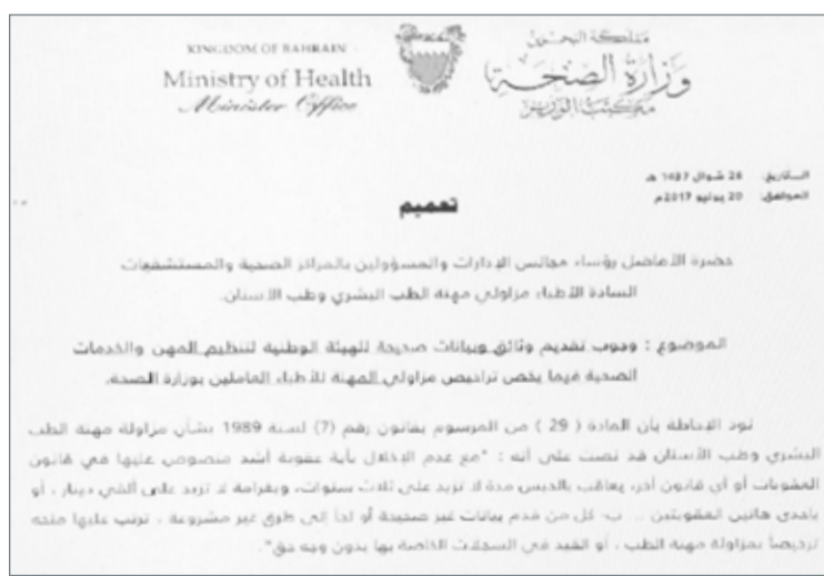
• صورة صوتية من خطاب التعميم الصادر من مكتب وزيرة الصحة

أصدر مكتب وزيرة الصحة فائقة الصالح تعميماً تحذيرياً يلزم رؤساء مجالس الإدارات والمسؤولين بالمراكز الصحية والمستشفيات والأطباء من مزاولي مهنة الطب البشري وطب الأسنان بوجوب تقديم وثائق وبيانات صحيحة لهيئة تنظيم المهن والخدمات الصحية (نهر) فيما يخص تراخيص مزاولي المهنة للأطباء العاملين بوزارة الصحة. وتوعد التعميم، الذي حصلت "البلاد" على نسخة منه، المخالفين من الأطباء والمسؤولين بالمساءلة القانونية في حال تم تقديم بيانات غير صحيحة يترتب عليها الحصول على الترخيص، سواء كانت المساءلة جنائية أم تأديبية، وذلك طبقاً لأحكام قانون مزاوله مهنة الطب البشري وطب الأسنان.