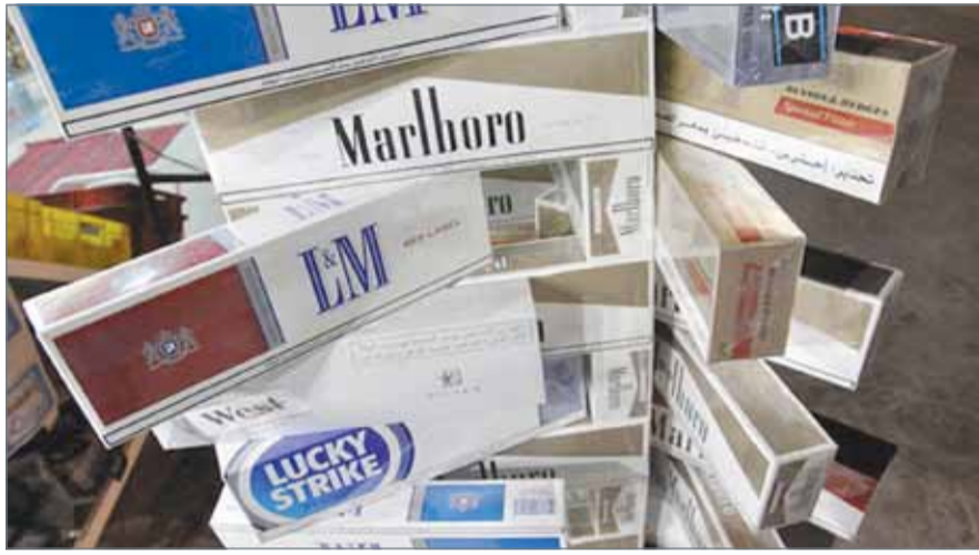
• اختفاء بعض أنواع السجائر من السوق انتظارا لتطبيق الضريبة الانتقائية (تعبيرية)

وكشف تقرير رسمي صادر عن شؤون الجمارك مؤخراً، أن وزن كميات سلعة اللغائف العادية (سجائر) المحتوية على التبغ وصل إلى 6.3 ملايين كيلوغرام حتى يونيو الماضي. وأوضحت الإحصائيات أن السلعة احتلت المرتبة الثامنة من بين أهم 50 سلعة غير نפטية تم استيرادها لشهر يناير 2017.