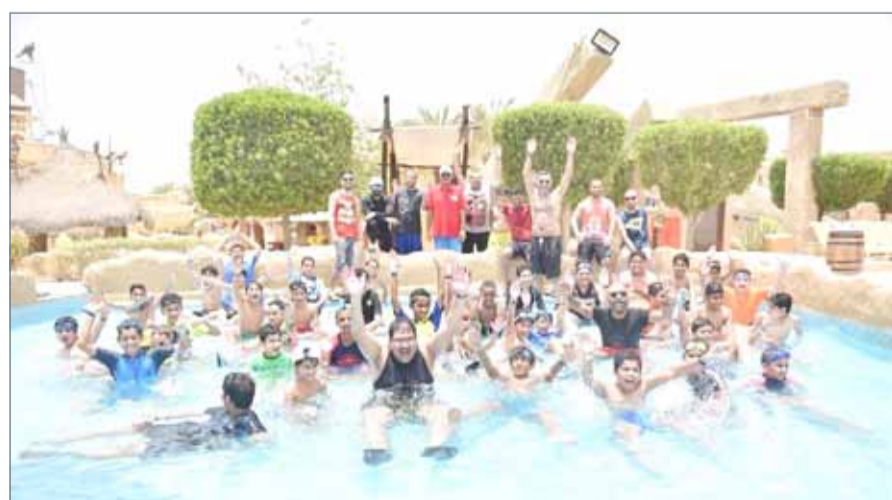
• أبناء موظفي شركة "جيبك" في رحلة لجنة دلمون المفقودة