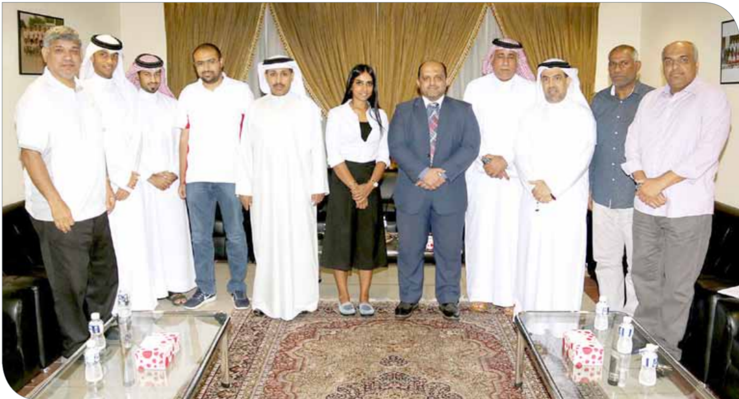
اتحاد اليد المركز الإعلامي