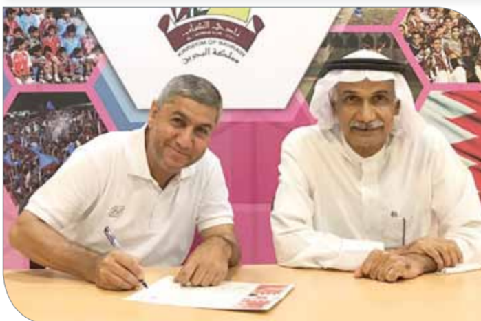
جانب من توقيع العقد

عملية البناء والتطوير بالاعتماد على اللاعبين الشباب وإعطاء الفرصة أكبر للاعبين الصاعدين الذين اكتسبوا الكثير من الخبرة في الموسم الماضي“. وأشار مدرب الماروني إلى أنّ الفريق نجح في سياسة الاعتماد على أبناء النادي وإعطاء الفرصة للاعبين الشباب، وتابع ”خططنا المستقبلية محددة سلفاً، وهي الاستمرار في بناء فريق شباب وثابت لسنوات عدة، وتنمى التوفيق في ذلك“.