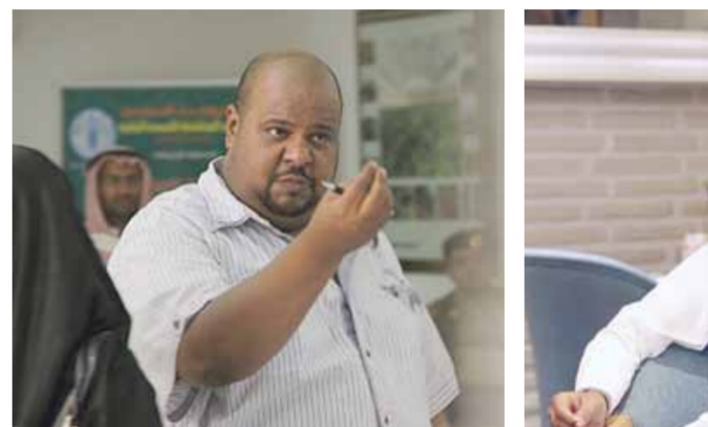
• تركي اليوسف

السعودي المنتظر. وقال "تركي" في تغريدة نشرها عبر حسابه الرسمي على موقع تويتر: "غدا أول يوم تصوير مسلسل ظل الحلم في مدينة الدمام دعواتكم بالنتوفيق".