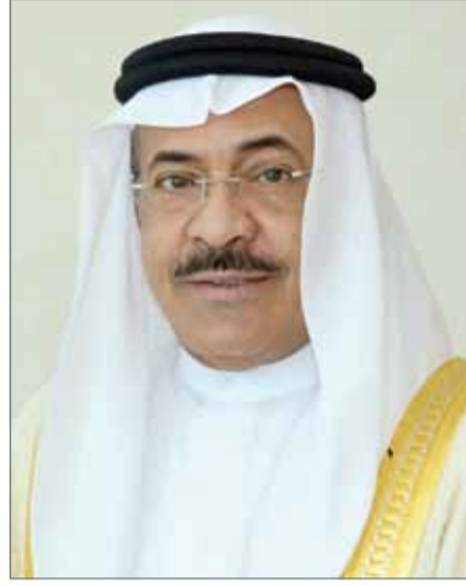
● نائب رئيس مجلس أمناء مركز عيسى الثقافي

● على الأمير تميم أن يتخلص من التركة الثقيلة لوالده وحمد بن جاسم ● المال القطري ينفق على مجموعات إرهابية تستهدف أمن دول شقيقة