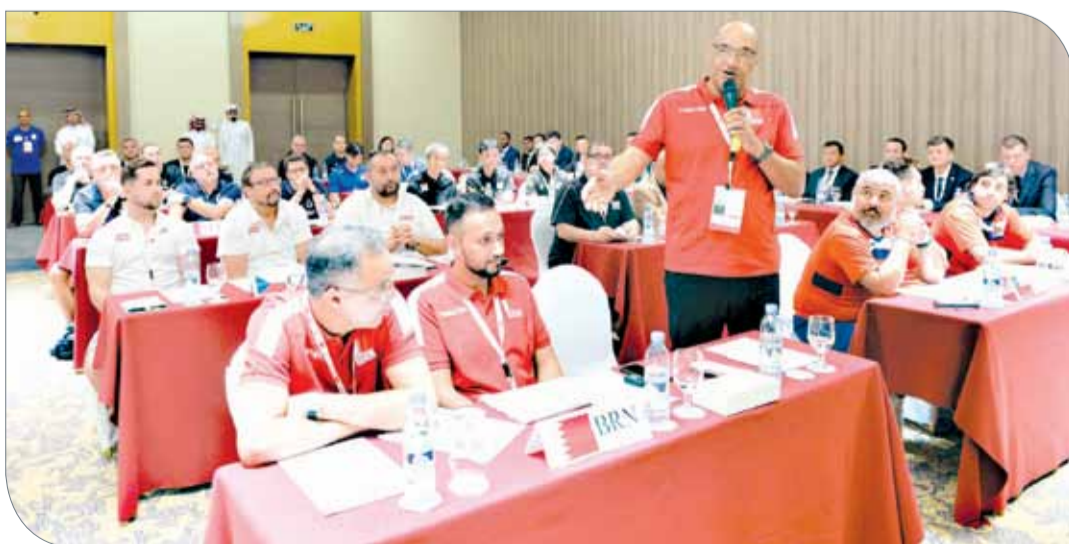
جانب من الاجتماع الفني

والإدارية وبحضور أعضاء لجنة الاحكام واللجنة التنفيذية المحلية للبطولة والحكام العشرون المشاركون في إدارة مباريات البطولة.