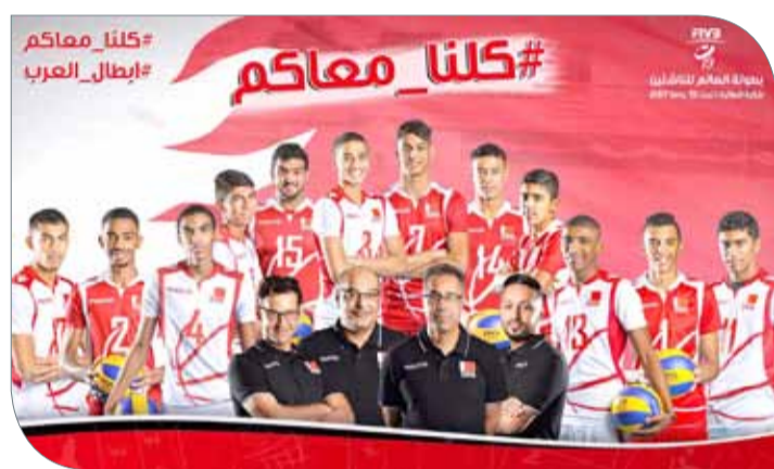
جانب من الحملة الوطنية #كلنا معاكم لدعم المنتخب

ستقوم قناة البحرين الرياضية بنقل وقائع البطولة وذلك من خلال البث المباشر لجميع المباريات التي ستقام على صالة الاتحاد البحريني لكرة الطائرة من خلال وضع ما يقارب من 10-7 كاميرات مع تخصيص استوديو تحليلي لمباراة منتخبنا ونظيره المصري، فيما سيكون الدخول بالنسبة للجماهير عن طريق شراء التذاكر بمبالغ رمزية، وسيتم توزيع عدد من التذاكر المجانية على الأندية، حيث إن عملية دخول الجماهير من خلال التذاكر يأتي بناء على نظام الاتحاد الدولي، وليس بهدف الربح المادي.