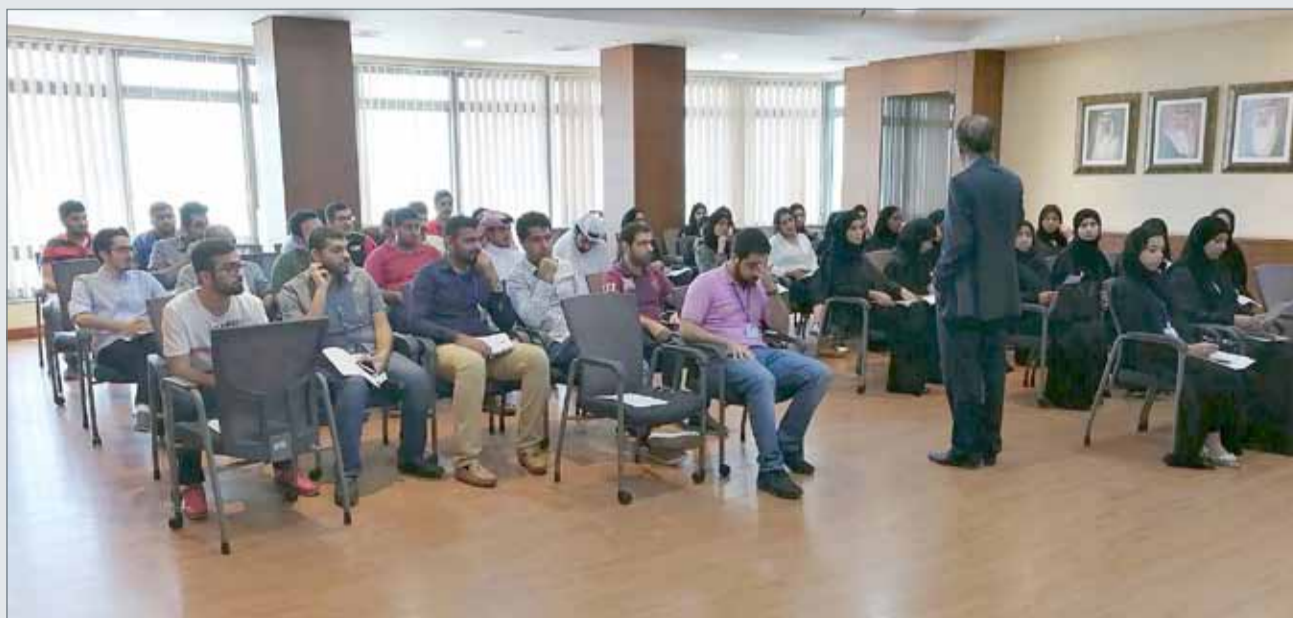
• "الأشغال" تلتقي 91 طالباً ضمن مشروع التدريب الصيفي

التجارب العملية، مؤكداً توافق البرامج التدريبية مع المتدربين وملاءمتها مع متطلبات دراساتهم في مجالات هندسة العمارة والتصميم الداخلي والهندسة المدنية، وغيرها من التخصصات الهندسية، بحيث تساهم في إكسابهم مهارات جديدة وتثري المعرفة لديهم. كما تحرص الوزارة على الاستثمار في تأهيل وتدريب الطلبة في مختلف المهارات والجدارات المطلوبة لسوق العمل، وغرس مفاهيم حب العمل والولاء للوطن، وذلك إيماناً منها بأهمية المساهمة في إعداد جيل واعد من الكوادر البحرينية، قادر على تحمل مسؤولياته تجاه وطنه، وذلك وصولاً إلى جعل المواطن الخيار الأول للتوظيف؛ من أجل تحقيق التنمية البشرية المنشودة، حيث يعد مشروع تدريب طلبة جامعة البحرين والجامعات الأخرى أحد الركائز التي تقوم على مبدأ الشراكة والتكامل بين مؤسسات والهيئات الحكومية والخاصة، والذي تتطلع الوزارة من خلاله إلى تطوير العصر البشري البحريني.