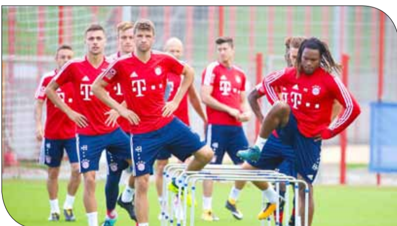
بايرن يستهل حملته أمام ليفركوزن اليوم

حقق مفاجأة باحتلال المركز الثاني في موسمه الأول في دوري الأضواء، الاحتفاظ بأهم لاعبيه البارزين لموسم إضافي ونجح في ذلك لكن باقي الفرق زادت قوتها أيضا. وفي ظل المشاركة في دوري أبطال أوروبا فإن لايبزيغ، الذي عزز صفوفه بالمحسوب جان كيفن أوجوستين، ستعرض لاختبار حقيقي لمدى قدرته على الصمود والاستمرار في ظل زيادة الأعباء وضغط المباريات.