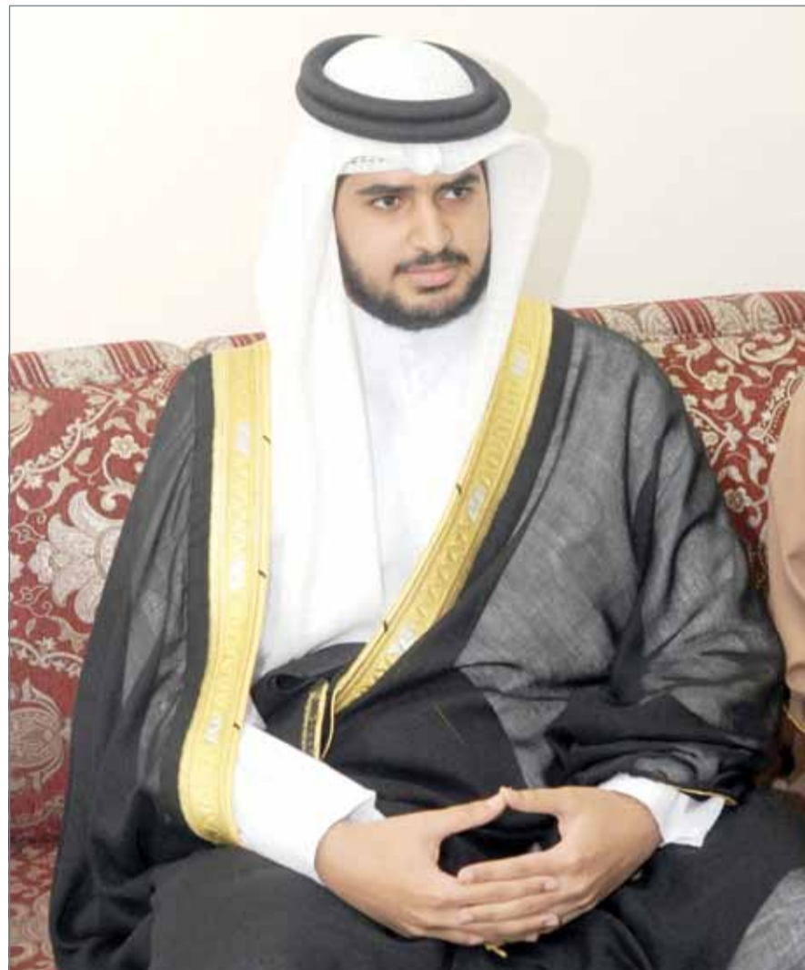
سمو الشيخ عيسى بن علي بن خليفة

المشاركات تزيد 3 أضعاف عن النسخة الأولى والتحكيم يبدأ غدا