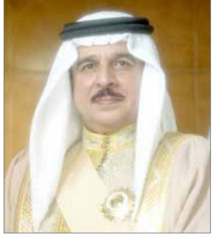
• جلالة الملك

الأمير بندر بن فهد بن سعد بن عبد الرحمن آل سعود، داعياً سموه المولى عز وجل أن يتغمّد الفقيد بواسع رحمته ورضوانه ويسكنه فسيح جناته.