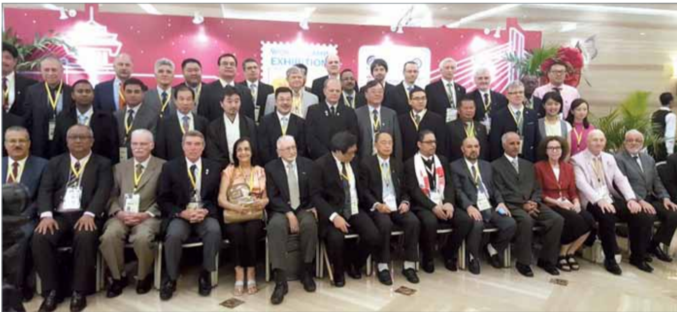
• لقطة جماعية للمشاركين بالمعرض العالمي للطوابع

ودأبت الجمعية منذ تأسيسها على المشاركة في الكثير من المعارض والفعاليات المتخصصة خليجياً وعربياً وعالمياً، إذ شارك أعضاء الجمعية في معارض مختلفة بالدول الخليجية والعربية ومعارض بالبرازيل والصين وكوريا وأستراليا وتايوان وماليزيا وهونغ كونغ.