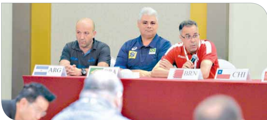
جانب من المؤتمر الصحفي للمدربين