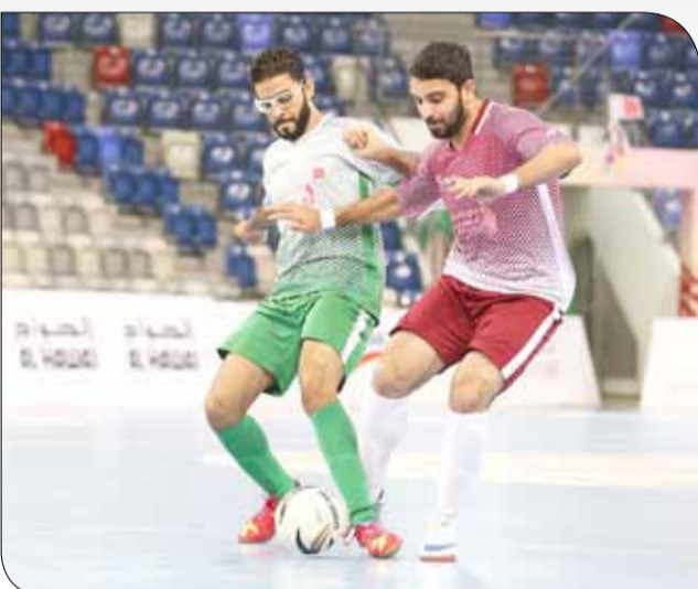
جانب من مباراة جدحفص وجرداب

خرج فريق مركز شباب جدحفص بتعادل قاتل أمام خصمه فريق مركز شباب جرداب بثلاثة أهداف لمثلها في ختام مشوارهما في الدور الأول ولحساب المجموعة الرابعة، وحافظ هذا التعادل لجدحفص على صدارته للمجموعة بعدما رفع رصيده إلى 11 نقطة متجنباً خسارته الأولى، فيما ودع جرداب منافسات الدوري بعدما حصد 6 نقاط في المركز الرابع.