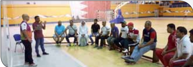
جانب من ورشة العمل

عقدت اللجنة المنظمة لدوري خالد بن حمد لذوي الإعاقة ورشة عمل لجميع الفرق في الدوري والبالغ عددها 8 فرق بمشاركة 16 من الأجهزة الفنية والإدارية، وتأتي ورشة العمل بهدف تثقيف المدربين والإداريين بكل ما يتعلق بالجوانب التنظيمية والفنية وقوانين اللعب ولوائح الدوري. وقال رئيس لجنة دوري ذوي الإعاقة علي النبهان إن الورشة حضرها جميع الفرق وممثلها وخلالها تم شرح مبسط لقوانين اللعبة مثل إدخال الكرة والدفاع وطريقة استلام الكرة والتغييرات واحتساب الأخطاء وغيرها من قوانين اللعبة التي يجب على المدربين والإداريين إيصالها للاعبينهم من أجل الاستفادة من خبراتهم وإمكاناتهم على أرضية الملعب.