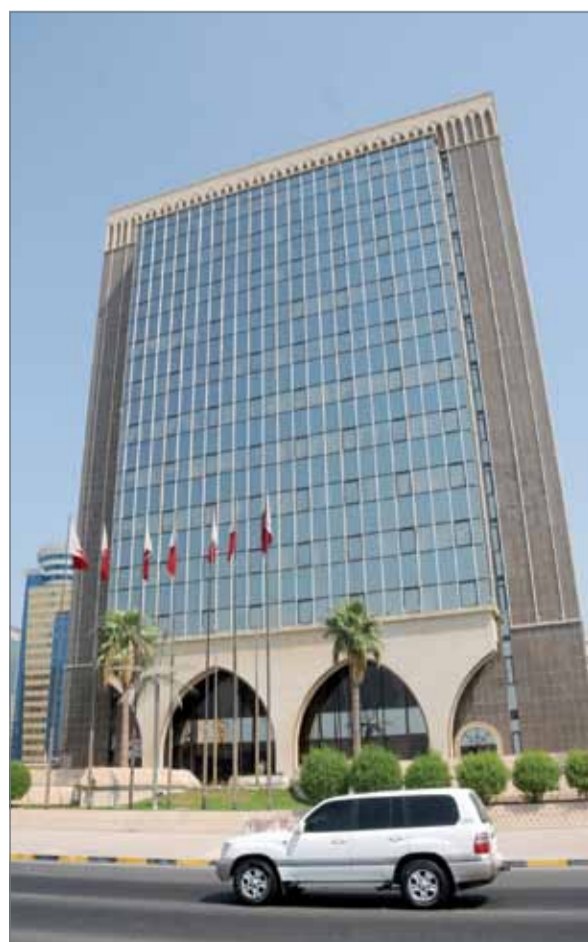
وزارة الكهرباء والماء

جانبى الطريق للتنمية الحضرية؛ وذلك لتفادي قطع الإسفلت مجدداً وإعادة حفر الطرق وأيضاً لتسهيل مد الخدمات الأرضية وهو ناجم من التخطيط السليم والمتبع في كثير من الدول العالم. كما قامت الوزارة باستحداث قنوات أرضية أسفل الطريق رقم 210 بمدينة عيسى، تستخدم لتمديد خطوط الكهرباء الماء المستقبلية دون الحاجة إلى قطع طبقة الأسفلت. وهذا الإجراء تنفذه الوزارة عند القيام بتطوير الطرق حفاظاً عليها من أعمال الحفریات.