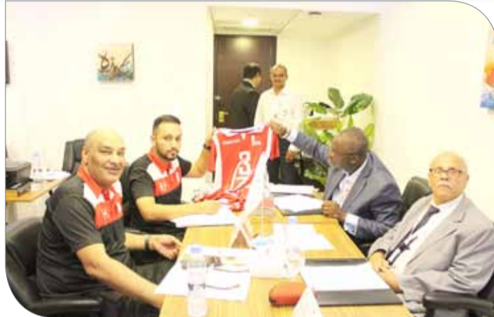
جانب من اجتماع الاستعلام المبدئي