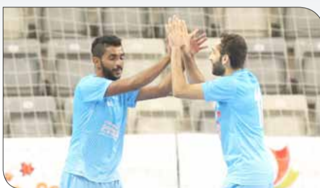
فرحة لاعبي كرانة بالتسجيل في شباك الوسطى