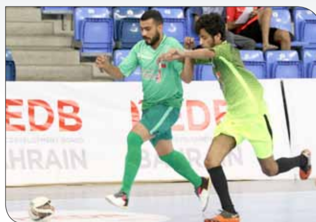
جانب من لقاء رأس رمان ضد النعيم والسلطة