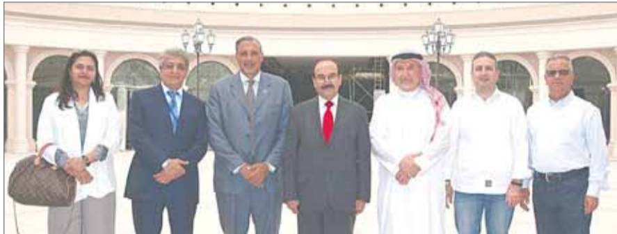
ميرزا متفقدًا مشروع دمج حلول الطاقة الشمسية بمجمع الأفنيوز

الكبرى في المملكة في كل ما يخص توليد الطاقة الشمسية سعياً من اهتمامات القيادة بتحقيق أهداف التنمية المستدامة وبشكل دفعه إيجابية نحو تحقيق الالتزامات الدولية خصوصاً فيما يتعلق بكفاءة الطاقة والطاقة المتجددة، وصولاً إلى النسب الوطنية التي اعتمدها مجلس الوزراء للمساهمة في الطاقة المتجددة بنسبة 5% ورفع كفاءة الطاقة بنسبة 6% بحلول العام 2025.