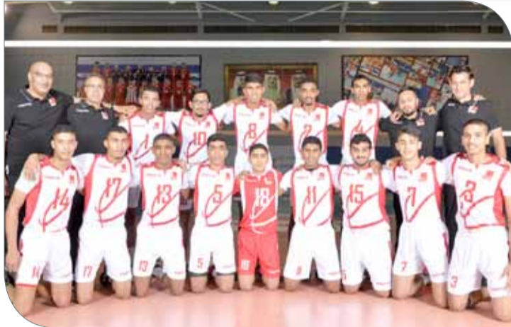
منتخبنا الوطني لكرة الطائرة