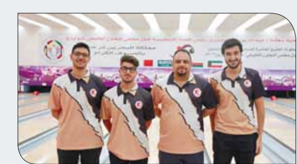
فريق الرفاع الشرقي

الجمعة 18 أغسطس 2017 26 ذو القعدة 1438 العدد 3230