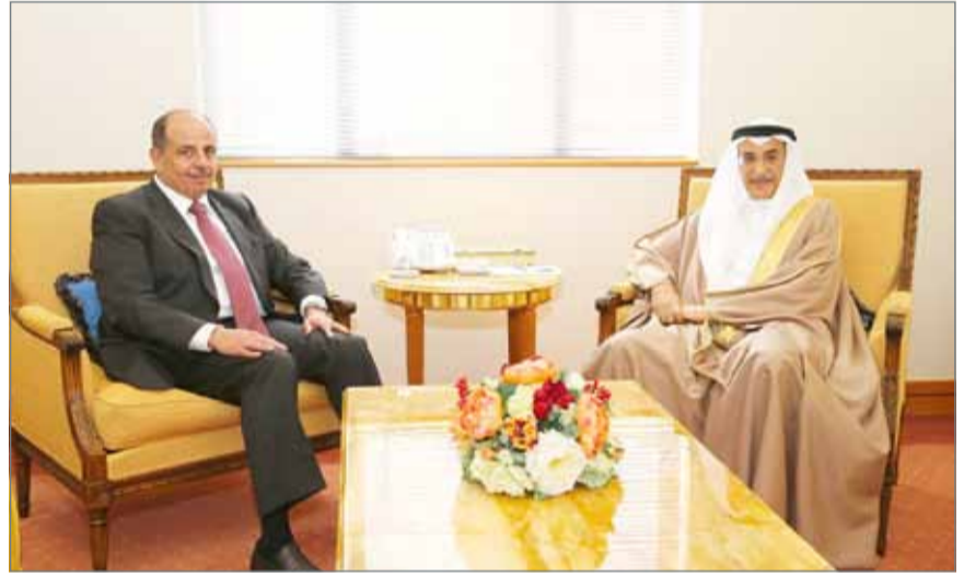
• الشيخ خالد بن عبدالله لدى استقباله السفير الأردني

الموكلة له بكل نجاح واقتدار، تحقيقاً للرؤية الحكيمة لعاهل البلاد صاحب جلالة الملك حمد بن عيسى آل خليفة، وأخيه عاهل المملكة الأردنية الهاشمية الشقيقة صاحب جلالة الملك عبد الله الثاني بن الحسين، والتمثلة في تطوعهما الدائم نحو تعزيز آفاق التعاون ضمن منظومة العمل العربي المشترك لما فيه خير وصالح شعبي البلدين الشقيقين.