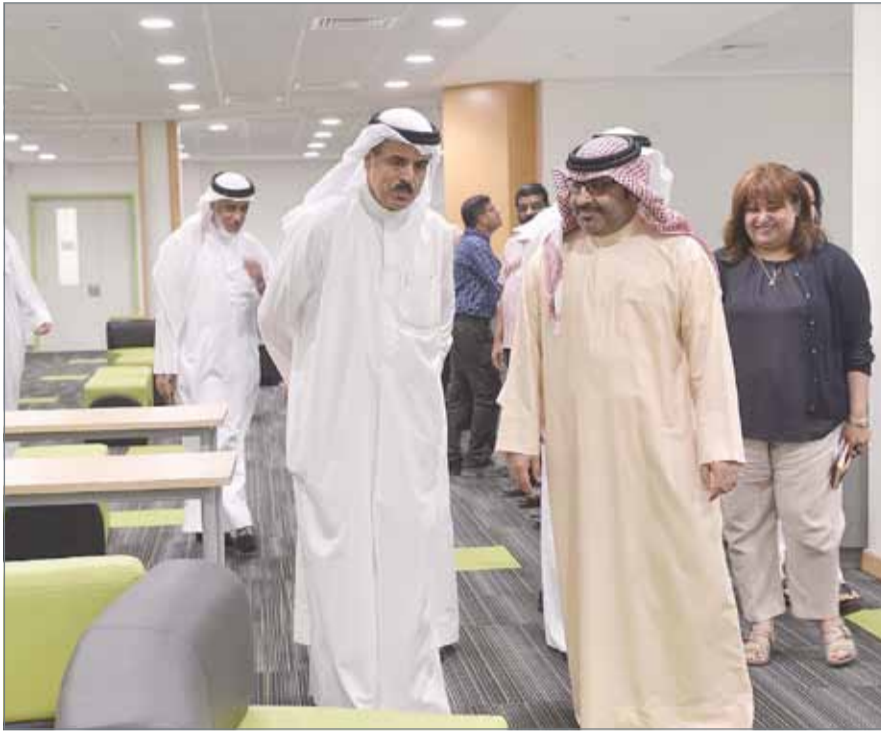
• وزير التربية والتعليم خلال جولته في المدارس الجديدة

لتوفير الطاقة والحفاظ على البيئة، والمرونة في استخدام المرافق بناءً على الحاجة، والقدرة على التوسع المستقبل، وتوفير العزل الصوتي لجميع الصفوف والمرات والقاعات عبر استخدام أرضيات الفينيل المانعة للانزلاق، وتوفير المصاعد لضمان سهولة التنقل بين الطوابق، واستخدام المنظومات الالكترونية والمتطورة في العملية التعليمية، بالإضافة إلى إمكانية استخدام ملاعبها لإقامة المنافسات الرياضية. وتعمل وزارة التربية والتعليم ضمن خطتها لإنشاء العديد من المدارس في مختلف مناطق المملكة وفق النظم الأكاديمية الحديثة والاشتراطات والمواصفات العالمية، من أجل مواكبة التطور التعليمي المستمر في المملكة، وتوفير المزيد من الخدمات التعليمية في مختلف المحافظات، وتقريب تلك الخدمات من مناطق سكن الطلبة والطالبات.