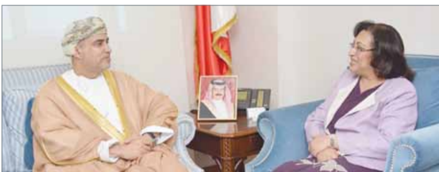
وزيرة الصحة مستقبلة السفير العماني

دعوة من وزير الصحة العماني لحضور حفل تداشين مؤتمر "الاستخدام الآمن للأدوية" الذي سيعقد في سلطنة عمان لتبادل الآراء والوقوف على الواقع ورؤية التجربة العمانية في مجال الأدوية.