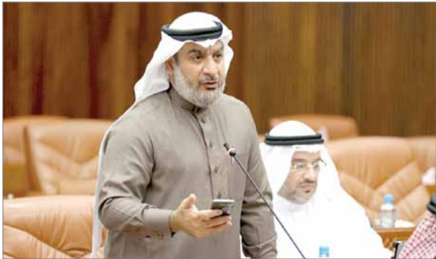
• أسامة الخاجة

المنامة - المكتب الإعلامي للنائب أسامة الخاجة: أكد النائب أسامة الخاجة أن الرسوم خصوصاً تلك التي أعلنت وزارة الصناعة والتجارة أنها ستعمل على جبايتها بدءاً من 22 سبتمبر المقبل ستفاقم الخناق على المؤسسات الصغيرة والمتوسطة المملوكة من جانب المواطنين. ونوه إلى أن الوزارة بقرارها المفاجئ تعرقل مسيرة رؤية البحرين الاقتصادية 2030 التي تهدف إلى إشراك القطاع الخاص في عملية التنمية، مؤكداً أن الضغوط التي تخلقها الوزارة على التجار تشكل عبئاً كبيراً على كاهلهم مما حدا بالبعض منهم إلى غلق نشاطهم، والبعض الآخر على مشارف الإغلاق، وبالتالي من الممكن أن ينعكس ذلك بالسلب على اقتصاد المملكة وتؤدي إلى عوامل الاستثمار وتشجيع رؤوس الأموال. وتسأل الخاجة عن الأسباب الحقيقية التي دفعت الوزارة إلى فرض مبالغ خيالية على التجار في ظل عدم دراستها السوق المحلية ومدى قدرتها على استيعاب رسوم جديدة، موجهاً سؤاله إلى وزير الصناعة