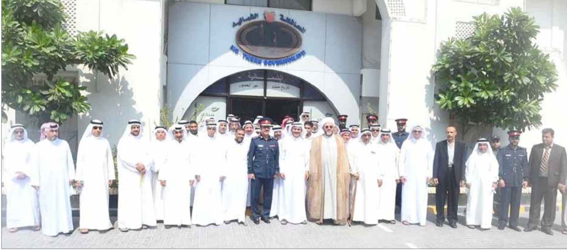
لقطة جماعية من اللقاء السنوي مع رؤساء المآتم الحسينية بالشمالية

الجبينة - المحافظة الشمالية: نقل محافظ الشمالية علي العصفور توجيهات القيادة من أجل العمل على وضع خطة متقدمة تغطي الجوانب الخدمية والأمنية إلى رؤساء المآتم والمواكب الحسينية في اجتماعهم السنوي الذي عقد صباح أمس بمبنى المحافظة بالجبينة، كما نقل للحضور تحيات وزير الداخلية الفريق الركن الشيخ راشد بن عبدالله آل خليفة وتمنياته بالتوفيق لجهود الجميع نحو إنجاح موسم عاشوراء لهذا العام في أفضل مستوى.