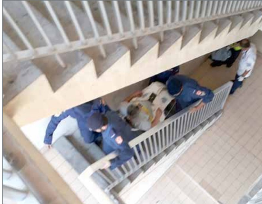
معاينة إجلاء الفنان الذوادي من الشقة