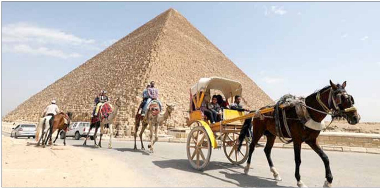
تراجعت إيرادات السياحة المصرية إلى 3.4 مليار دولار في 2016

وتراجعت إيرادات مصر من السياحة، وحتى ثورة 25 يناير 2011، كانت مصر تحقق إيرادات من السياحة، بقيمة 11 مليار دولار سنوياً. وتراجعت إيرادات مصر من السياحة، وحتى ثورة 25 يناير 2011، كانت مصر تحقق إيرادات من السياحة، بقيمة 11 مليار دولار سنوياً.