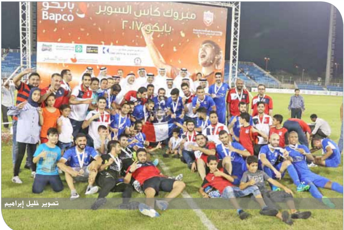
لقطات متنوعة من تنوير المنامة