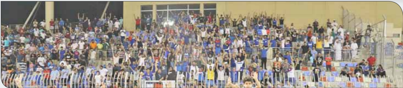
من الحضور الجماهيري

◆ شهدت مباراة السوبر يوم أمس حضوراً جماهيرياً مميزاً في استاد مدينة خليفة الرياضية. وحلست جماهير المنامة ميمناً المنصة الرسمية للملعب، فيما جلست جماهير المالكية يسار المنصة، وتفاعلت وربطتا الفريقين مع مدريات المباراة. وعاشت جماهير المنامة أجواء