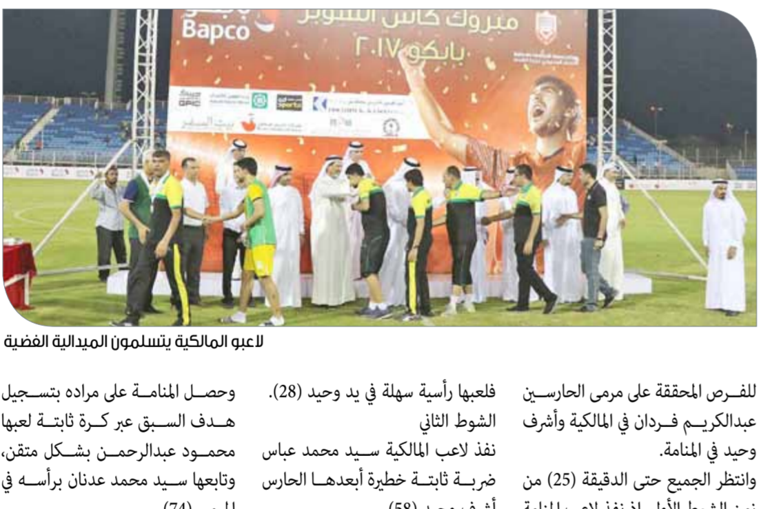
لاعبو المالكية يتسلمون الميدالية الفضية