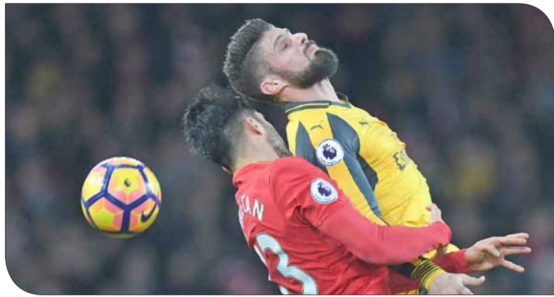
قمة أوله توجه الأنظار نحو أنفيلد

أمام تشيلسي الأسبوع الماضي. وسيسعى هيديرسفيلد تاوان الصاعد هذا الموسم لمواصلة بدايته المثالية عندما يستضيف ساوثهامبتون.