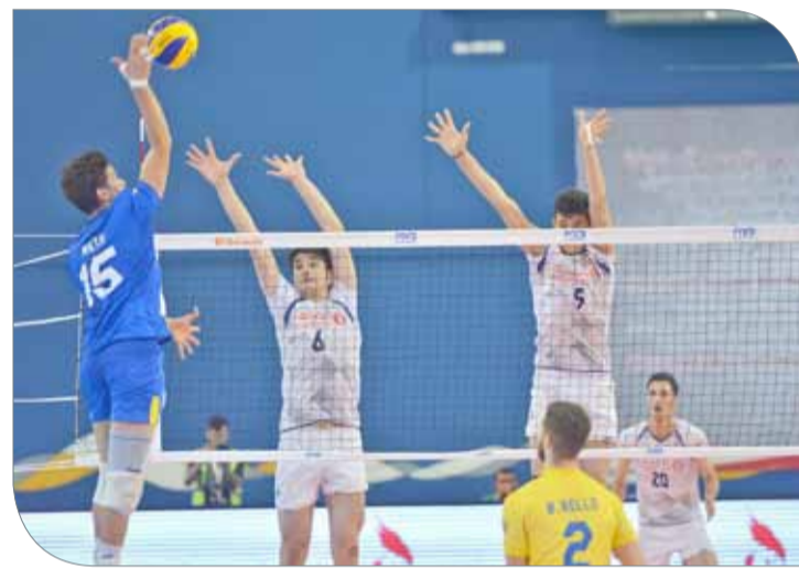
جاناب من لقاء البرازيل وإيران

أطاح الدب الروسي بمنافسه الفرنسي بثلاثة أشواط مقابل شوطين (25/27، 26/24، 23/25، 25/19، 16/14) ليخطف بطاقة التأهل إلى الدور قبل النهائي من المسابقة بعدما حقق فوزاً صعباً على حساب فرنسا ليعلن نفسه