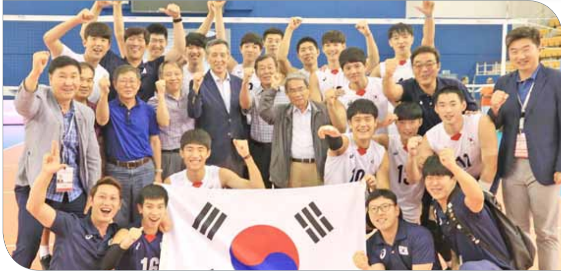
فرحة المنتخب الكوري بالتأهل