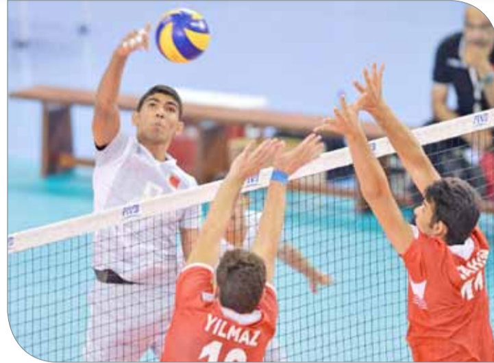
منتخبنا خسر من تركيا بثلاثية نظيفة

◆ اتضحت معالم الدور نصف النهائي لبطولة العالم للكرة الطائرة للناشئين والتي تستضيفها المملكة حتى 27 الشهر الجاري عندما يلتقي منتخب روسيا واليابان الساعة الخامسة عصراً، ويتواجه المنتخب الإيراني مع الكوري الساعة السابعة مساءً على صالة الاتحاد البحريني للكرة الطائرة (c)، حيث إن الفائزين من المواجهتين سيأهلان إلى المباراة النهائية للتنافس على لقب النسخة الخامسة عشرة من بطولة العالم والتي سيسدل عليها الستار غدا الأحد.