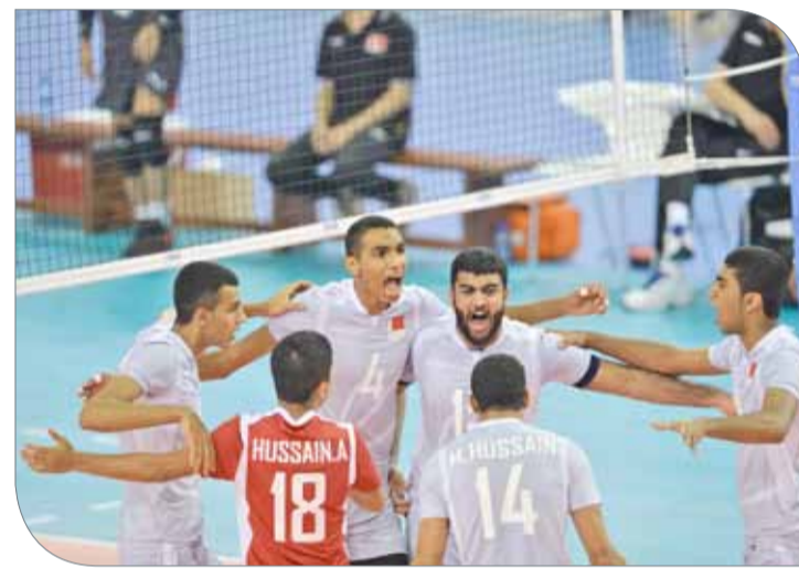
الروح القتالية غابت عن المنتخب في المباراة

وبولندا الساعة 11:00 صباحاً، وتشيلي مع تونس بنفس التوقيت، ويلتقي منتخب التشيك وفرنسا الساعة 1:00 ظهراً، ومنتخب أمريكا وبورتوريكو بنفس التوقيت، ومباراة البرازيل ومصر الساعة 3:00 عصراً، ومباراة البحرين وكوبا بنفس التوقيت، والأرجنتين مع الصين الساعة 5:00 مساءً، وأخيراً إيطاليا وتركيا الساعة 7:00 مساءً.