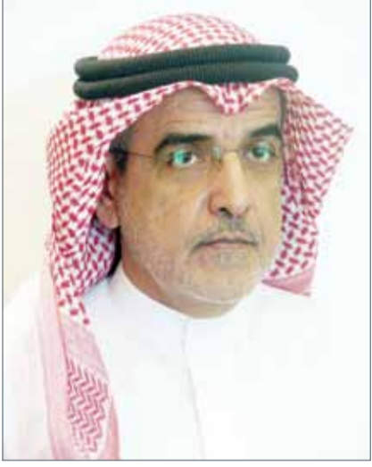
• الشيخ خليفة بن عيسى

طرحها في الاسواق. وقال إن الشيخ خليفة بن عيسى ان الزراعة والثروة البحرية اتخذت مجموعة من الإجراءات الاحترازية الكفيلة بضمان سلامة المواشي الحية واللحوم المستوردة والسماح بدخولها وتداولها في السوق المحلي، من خلال متابعة مستجدات وتطورات الوضع الوبائي في دول العالم، ومراقبة الخدمات البيطرية المقدمة في الدول التي يتم الاستيراد منها، كذلك عمل زيارات من خلال فرق فنية بيطرية لتلك الدول خصوصاً الدول التي يتم فتح الاستيراد منها للمرة الأولى، مشيراً إلى أنه يتم عمل زيارات دورية لتلك الدول للتأكد من جودة الخدمات المقدمة.