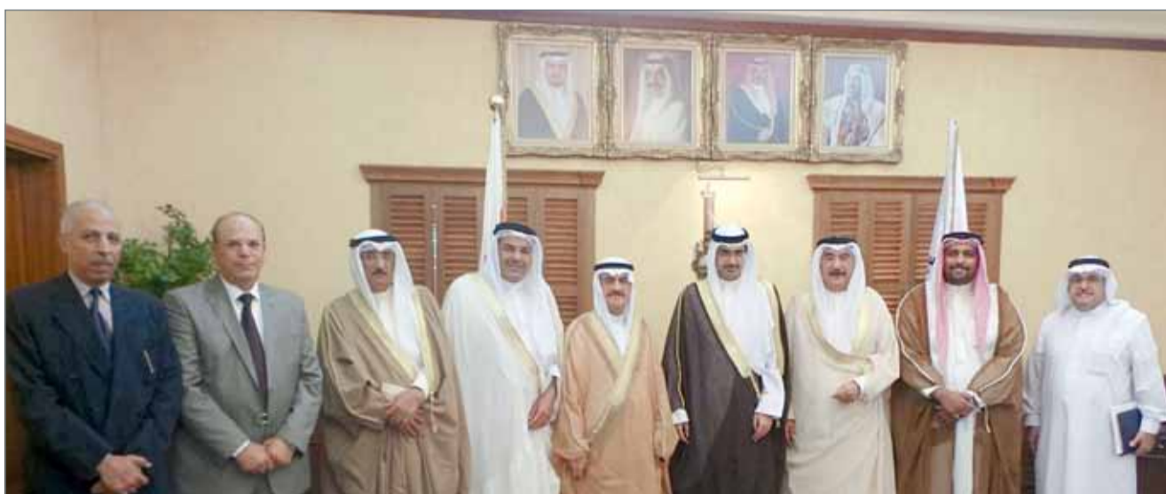
• سمو الشيخ خليفة بن علي بن خليفة يتطلع على الاستعدادات لجائزة سموه للعمل الخيري "وفاء لأهل العطاء"