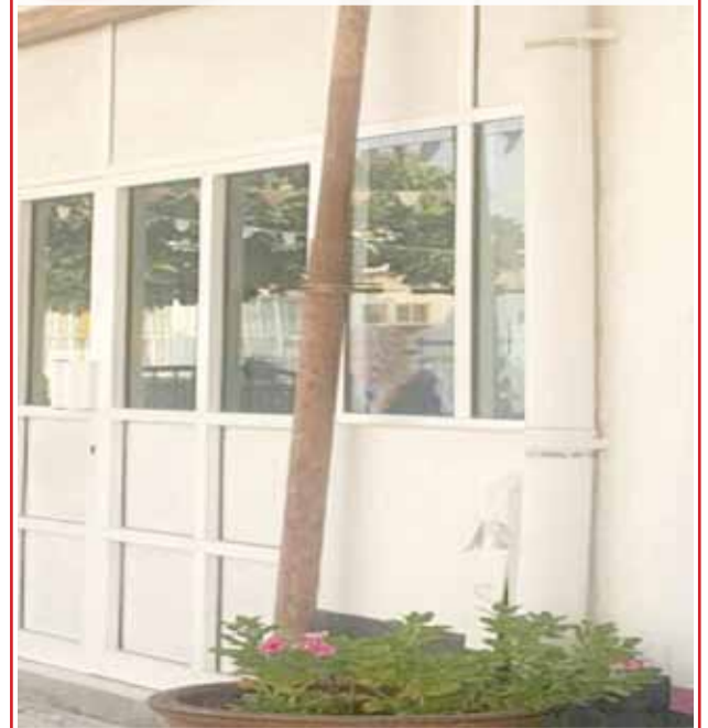
• إجلاء طالبات من مدرسة أميمة بنت النعمان الثانوية للبنات من مبنى أيل للسقوط... وتثبيت دعائم حديد مؤقتة