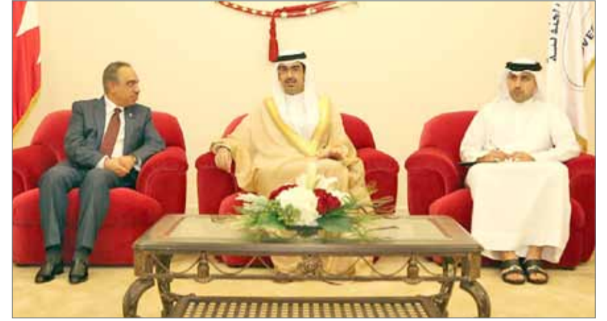
• سمو الشيخ خليفة بن علي آل خليفة يلتقي وزير الأشغال وشؤون البلديات والتخطيط العمراني

عن استعداد الوزارة لتتسيق والتعاون الكامل مع المحافظة الجنوبية بقيادة سمو الشيخ خليفة بن علي آل خليفة لترجمة الاحتياجات والتطلعات التي ينشدها أهالي المحافظة ضمن أولويات عمل الوزارة وترجمتها إلى مشاريع تنفذ على أرض الواقع بأقصى سرعة وبجودة عالية.