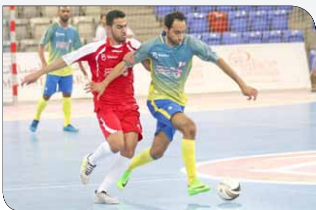
من مباراة سند وابوقوة في نصف النهائي