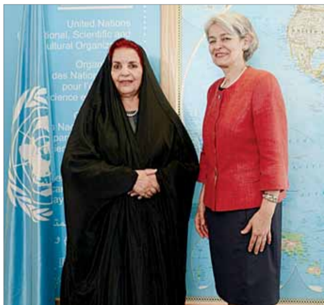
• قرينة جلالة الملك تتلقى المديرية العامة لـ "اليونسكو"

الرفاع - المجلس الأعلى للمرأة: التقت رئيسة المجلس الأعلى للمرأة صاحبة السمو الملكي الأميرة سبيكة بنت إبراهيم آل خليفة المديرية العامة لمنظمة "اليونسكو" إيرينا بوكوفا؛ بمناسبة رعاية سموها لافتتاح معرض "نساء بعين فنانات بحرينيات" في مقر "اليونسكو" بباريس. واستعرضت قرينة عاهل البلاد بإيجاز المنجزات التي تحققت للمرأة البحرينية في ظل المشروع الإصلاحي لصاحب الجلالة الملك، وجهود المملكة في دعم وتقديم المرأة البحرينية على الأصعدة كافة، ولاسيما في مستويات التعليم المختلفة والمجال الثقافي من خلال دعم ورعاية المواهب والكفاءات الفنية وتشجيعهم على إبراز وترويج الإنتاج الفني التشكيلي من خلال تنظيم المعارض الفنية المتخصصة سواء داخل أو خارج البلاد؛ وذلك لإثراء الحركة الفنية والإسهام في خلق موقع متقدم وتميز للفنان البحريني على الساحة الفنية الوطنية والعالمية. من جانبها، أشادت بوكوفا بمنجزات البحرين في مجال دعم وتمكين المرأة خصوصاً ما يقوم به المجلس الأعلى للمرأة برئاسة صاحبة السمو الملكي الأميرة سبيكة من جهودها مساهمة في إحداث نقلة نوعية للمرأة البحرينية انعكس على تحقيقها العديد من الإنجازات في الأصعدة والمجالات كافة، مبدية استعداد "اليونسكو" الدائم لتبادل الخبرات في جميع المجالات ذات الاهتمام المشترك.