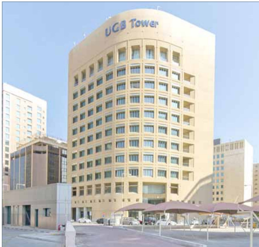
مبادلة كل سهم جديد لشركة الخليج المتحد القابضة بسمين من أسهم البنك.

وكانت أرباح البنك في النصف الأول من العام الجاري بلغت 7.84 مليون دولار، مقابل أرباح بلغت 775 ألف دولار في الفترة المماثلة من العام الماضي، بزيادة قدرها 911.6 %.