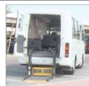
• حافلات ذوي الاحتياجات الخاصة

الكتب المستخدمة، مما يدل على تعاون الطلبة وأولياء أمورهم في المحافظة على الكتاب المدرسي. وتحدث عن التحول التدريجي نحو التعلم الإلكتروني، إذ تم توفير شبكة الإنترنت في جميع المدارس (...). وإمكان التصفح الإلكتروني للكتب المدرسية. ونبه إلى أن توافر الكتب الرقمية وبرمجيات وإثراءات وأفلام تعليمية واختبارات إلكترونية وجميعها تشكل المحتوى الإلكتروني للتعلم توفر للمعلم والمتعلم مواد غنية للإثراء العملية التعليمية التعليمية، ولذلك لا يجب التركيز على الكتاب الورقي فقط.