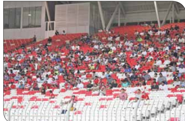
جمهوا المحرق في لقاء الحد

◆ شهدت مباراة المحرق والحد في الجولة الأولى حضوراً جماهيرياً بارزاً. وحضرت رابطتا الناشرين إلى استاد الوطني، وجلست جماهير الحد بين المنصة، والمحرق يسار المنصة. وكان حضور جماهير المحرق أكبر ولافتاً في هذه الجولة على وجه التحديد أيضاً، والتي احتفلت مع لاعبيها بعد نهاية المباراة بالفوز الأول. وعلى صعيد متصل، فإن جمهور بطل دوري الموسم الماضي فريق المالكية كان بارزاً أيضاً، خصوصاً مع تعليق الياقات في لقاء الرفاع الشرقي على استاد مدينة خليفة.