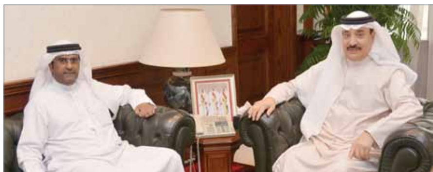
• وزير العمل في لقاء مع النائب خليفة الغانم

لتلبية احتياجات المواطنين من الخدمات التنموية المختلفة. كما تم بحث مقترح إنشاء مركز اجتماعي شامل للمحافظة الجنوبية يوفر احتياجات جميع شرائح المجتمع من خدمات الرعاية الاجتماعية.