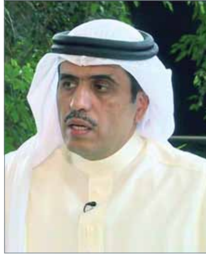
• وزير الإعلام