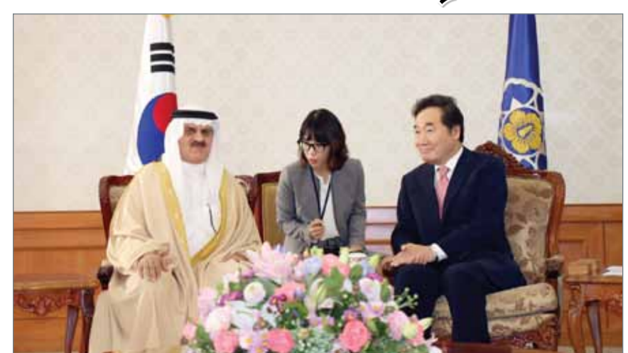
● رئيس وزراء كوريا الجنوبية في لقاء رئيس مجلس النواب

القضيبية - مجلس النواب: أكد رئيس وزراء كوريا الجنوبية لي ناك يون أن البحرين وبقيادة عاهل البلاد صاحب الجلالة الملك حمد بن عيسى آل خليفة تسير بخطى ثابتة وقوية نحو الإصلاح والديمقراطية، وهي قادرة أن تكون بصدارة الدول بمنطقة الخليج في المجال الاقتصادي والتجاري، كما أنها شريك مع كوريا في التركيز على تنمية الاقتصاد ومكافحة الإرهاب، مشيراً إلى أن كوريا الجنوبية لن تنسى مواقف البحرين الداعمة لها اقتصادياً منذ مطلع السبعينات وحتى اليوم باستقطاب شركاتها إلى المنامة. وأضاف رئيس الوزراء الكوري أن البحرين بقيادتها الحكيمة تسير على الخطى ذاتها مع كوريا الجنوبية في مواجهة خطر الممارسات