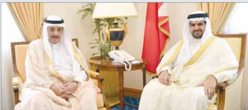
● سمو الشيخ عيسى بن علي بن خليفة مستقبلاً الأديب والمفكر محمد حسن كمال الدين

المنامة - بنا: استقبل سمو الشيخ عيسى بن علي بن خليفة آل خليفة بمكتبه الأديب والمفكر محمد حسن كمال الدين، حيث نوه سموه بجهوده في إثراء الساحتين الأدبية والفكرية. وأشاد سمو الشيخ عيسى بن علي