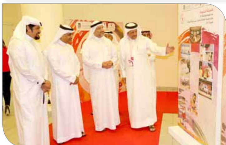
النجار والخياط لدى زيارتهما معرض الصور الخاص بالدوري

جهد في تحقيق الديمومة التنموية بقطاع الشباب والرياضة، والذي يجسد رؤية القيادة الرشيدة في رعاية ودعم هذا القطاع الحيوي. وقال الخياط: "إن المتابع لدوري خالد بن حمد يجد أن هناك أرقام وإحصائيات تؤكد على نجاح هذا الملحق الشبابي الرياضي"، مشيداً بجهود وزارة شؤون الشباب والرياضة برئاسة هشام الجودر، التي وضعت نصب عينيها إبراز المنافسات، مثنياً في الوقت ذاته جهود أعضاء اللجان العاملة باللجنة المنظمة لإخراج الحدث في أبهى حلة بما يليق بالرعاية الكريمة للدوري من قبل سمو الشيخ خالد بن حمد آل خليفة.