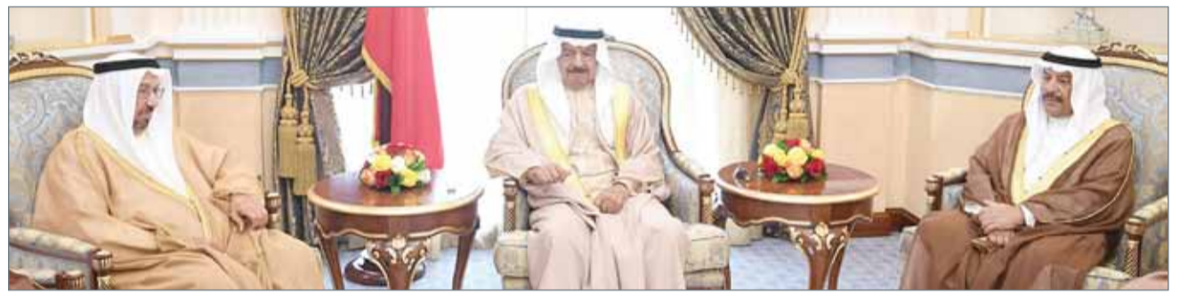
• سمو رئيس الوزراء مستقبلاً عدداً من أفراد العائلة المالكة والفعاليات الاقتصادية وكبار المسؤولين

وأكد سموه أن شعب البحرين وما يتسم به من رقي وتحضر استطاع تأسيس نموذج حضاري في التنمية والتطوير، ونال احترام وتقدير العالم.