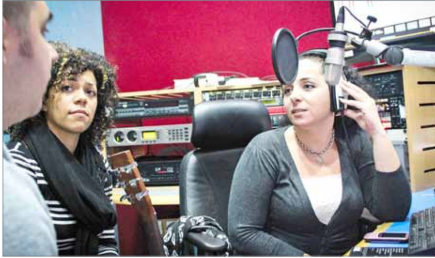
• المذبة ماري غادرت راديو بحرين إلى إذاعة أرامكو