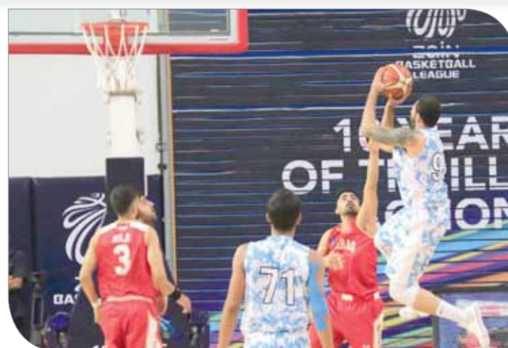
جانب من لقاء الرفاع والمحرق

تستكمل اليوم (الأربعاء) مباريات الجولة الثانية بإقامة لقائين، يجمع أولهما مدينة عيسى والتويدرات عند الساعة السادسة مساءً، ومن ثم الحالة وسماهيح عند الساعة 7:45 مساءً،