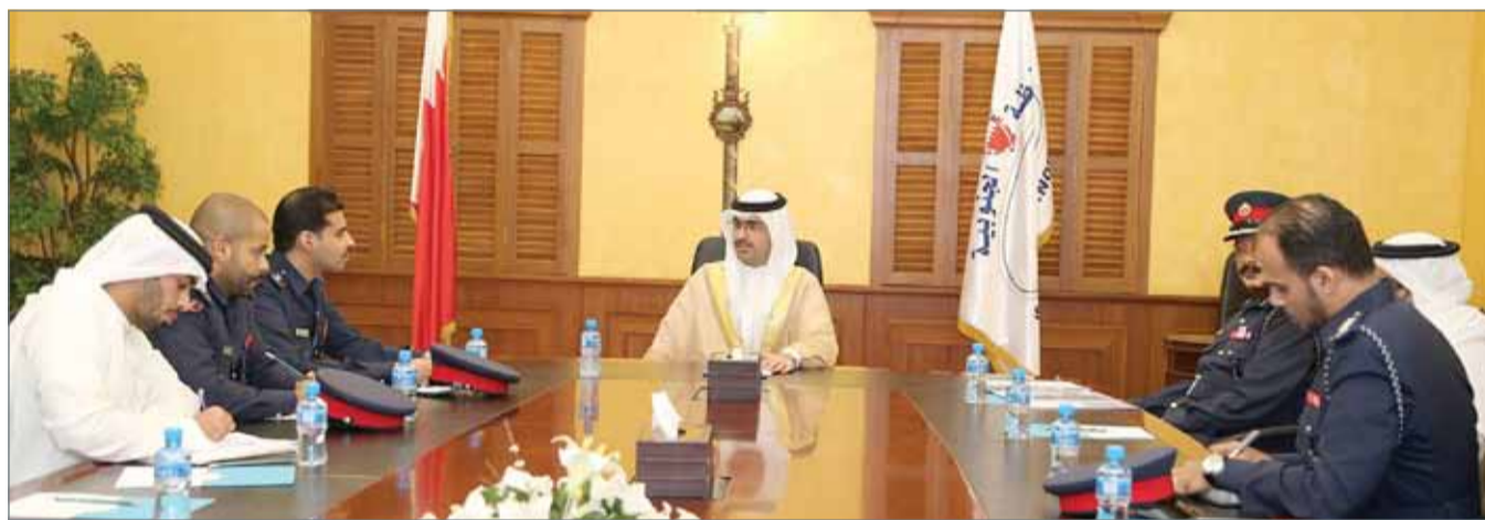
• سمو الشيخ خليفة بن علي آل خليفة ترأس الاجتماع الأمني الأول بالمحافظة الجنوبية

وأشار سموه في هذا السياق، إلى أن المحافظة الجنوبية ستعمل في إطار مسؤوليتها الاجتماعية على ترسيخ دعائم أمن الوطن والمواطن في كافة أرجاء المحافظة وتعزيز الإحساس بالمسؤولية وغرز روح التعاون وتعميق الحس الوطني ومشاعر الانتماء والولاء ومفاهيم الوحدة الوطنية والأسرة الواحدة عبر برامج وأنشطة يلمسها المواطن على أرض الواقع، مؤكداً سموه أن ما يميز مملكة البحرين هو نموذجها الفريد في اللحمة الوطنية والنسيج الاجتماعي المترابط الذي يجمع القيادة والشعب في قالب متكامل قائم على الولاء والإخلاص والجهد في العمل والعطاء.