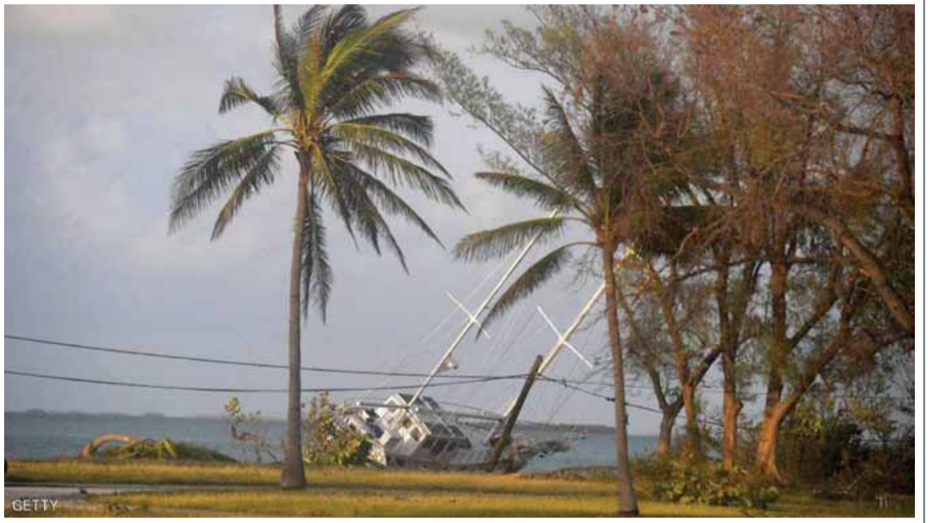
واجهت ولاية فلوريدا الأميركية إعصاراً مدمراً خلف خسائر بشرية ومادية كبيرة، في وقت يتوقع فيه أن تبلغ خسائر الولايات المتحدة جراء الإعصارين هارفي وإرما نحو 290 مليار دولار.

وقال كروز حينها لصحيفة ”واشنطن بوست“ الأميركية في العام 2015: ”كنا أمام شاشة كمبيوتر كبيرة لفحص المواد الإباحية التي كانت تشكل الأداة الأساسية التي سيتم بناء عليها توجيه الاتهام للخلية“.