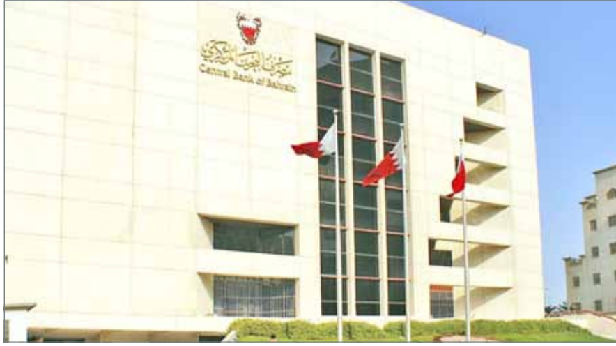
يعتبر التصنيف مرجعا معترفاً به عالمياً.

وتعتبر هذه القائمة مرجعاً معترفاً به وموثوق عالمياً من حيث المعايير الموحدة والدقيقة التي تعتمد عليها “غلوبل فاينانس” في تقييمها الذي يقوم على التصنيفات الائتمانية الطويلة الأجل للبنوك من قبل أكبر وكالات التصنيف العالمية مثل موديز، فيتش وستاندرد أند بورز بالإضافة إلى إجمالي أصول أكبر 500 بنك في العالم. ويؤكد التصنيف نجاح سياسات البنوك المصرفية المتحفظة واستراتيجيتها التحوطية في إدارة المخاطر وحرصها المتواصل على تقديم أرقى وأفضل الخدمات المصرفية لعملاء. وقال الناشر ومدير التحرير في مجلة غلوبل فاينانس جوزيف دي جيارابوتو “يعكس