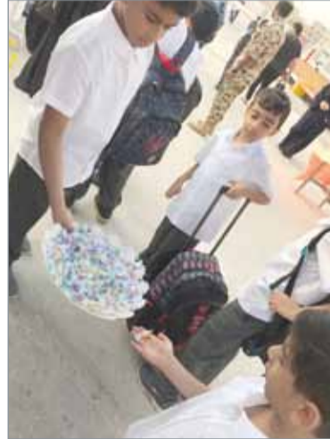
• طوى بمناسبة العودة للمدرسة (أرشيفية)

شديد الحرارة ويحتاج لصيانة شاملة وترميم فوري؟