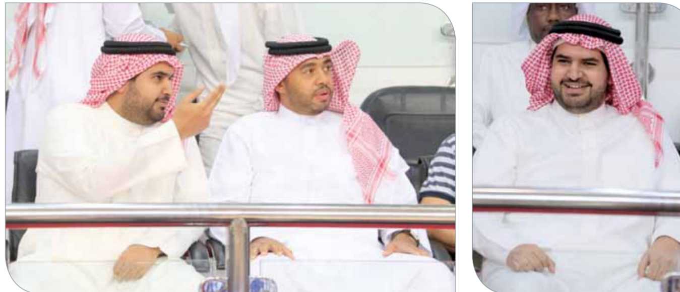
سمو الشيخ عيسى بن علي يشهد لقاء المحرق والرفاع

قال اللاعب عيسى سلمان إنه لم يجدد التعاقد مع نادي البسيتين لتمثيل الفريق الأول لكرة الطائرة خلال الموسم الرياضي المقبل 2017/2018 بعدما مثله في الموسم الماضي. وأضاف سلمان لـ "البلاد سبورت" أنه ما زال يصدد انتظار العروض المقدمة له من بعض الأندية المحلية لدراستها بصورة مستفيضة قبل خوض تجربة جديدة، مشيراً إلى أنه سيدرس أفضل العروض المقدمة له لاختيار الأنسب منها متى ما تمت مفاوضاته بصورة مباشرة، حيث إنه يملك استغناؤه بيده ويملكه الانتقال لأي ناد يشاء. وأضاف سلمان بأن تجربته مع نادي البسيتين في الموسم الماضي كانت جيدة متطلعاً لخوض تجربة جديدة مواصلة المشوار مع الكرة الطائرة. يذكر أن اللاعب عيسى سلمان كان قد مثل المنتخب الوطنية بفرق الفئات العمرية، كما أنه مثل داركليب من الفئات حتى الفريق الأول قبل أن يتوقف عن اللعب، ثم يحصل على استغناؤه وينتقل لنادي البسيتين في الموسم الماضي.