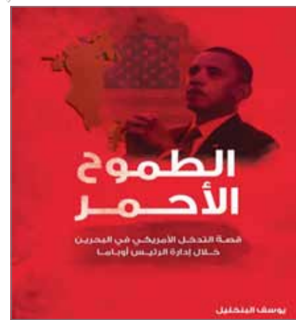
• غلاف الكتاب