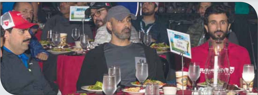
ناصر بن حمد لدى حضوره حفل الختام

خلال السباق، معرباً عن تقديره لجهودهم المبدولة في الإعداد والتضير للبطولة لرفع راية البحرين وتعزيز موقعا في هذه الرياضة، مؤكداً سموه مواصلة تقديم الدعم والرعاية للرياضيين البحرينيين كافة بما يمكنهم من إبراز قدراتهم وإمكاناتهم. وتكون أعضاء الوفد البحريني الذين شاركوا في البطولة بראية ودعم من سموه من المتسابقين: فته الرجال: