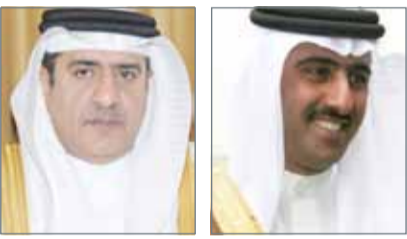
• الشيخ طلال بن محمد • عادل الفاضل

المنامة - بنا: صدر عن عاهل البلاد صاحب الجلالة الملك حمد بن عيسى آل خليفة أمر ملكي رقم (51) لسنة 2017 بإعادة تنظيم جهاز الأمن الوطني وتعيين رئيس للجهاز. وجاء في المادة الأولى من الأمر الملكي أنه يعاد تنظيم جهاز الأمن الوطني وطريقة عمله، فيما نصت المادة الثانية على تعيين الفريق عادل بن خليفة الفاضل رئيساً لجهاز الأمن الوطني. وجاء في المادة الثالثة أنه يعمل بهذا الأمر من تاريخ صدوره، وينشر في الجريدة الرسمية. كما صدر عن جلالة الملك مرسوم ملكي رقم (54) لسنة 2017 بتعيين نائب لوزير الداخلية. وجاء في المادة الأولى من المرسوم، أنه يعين الشيخ طلال بن محمد بن خليفة آل