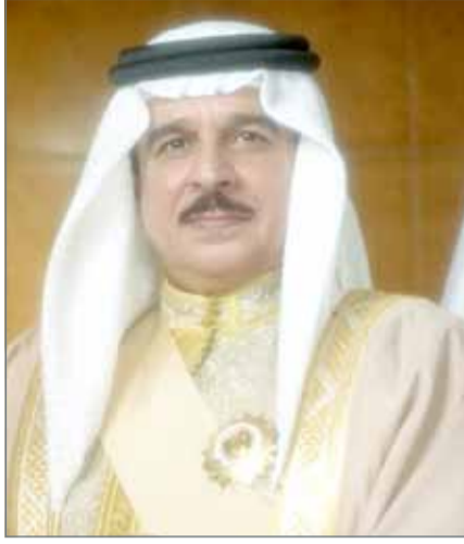
• جلالة الملك

من تحديد مصدر المستند الإلكتروني ووجهة وصوله وتاريخ وقت إرساله واستلامه. 2. لا يمتد الالتزام بحفظ المعلومات وفقاً للفقرة (ج) من البند (1) من هذه المادة إلى أية معلومات تنشأ بصورة معتادة أو تلقائية عند إنشاء أو إرسال أو استلام السجل. 3. يجوز لأي شخص استيفاء الاشتراطات المنصوص عليها في البند (1) من هذه المادة بالاستعانة بخدمات أي شخص آخر. 4. ليس في هذه المادة ما يحول دون الآتي: أ. وجود نص في قانون آخر يقضي بالاحتفاظ بالمستندات أو السجلات أو المعلومات في شكل سجلات إلكترونية وفق نظام إلكتروني خاص أو اتباع إجراءات محددة، أو الحفظ أو الإرسال أو الاستلام عبر وسيط إلكتروني محدد. ب. مراعاة ما ورد في البند (2) من المادة (4) من هذا القانون، يجوز للجهات العامة أن تحدد اشتراطات إضافية للاحتفاظ بسجلات إلكترونية تخضع لاختصاصها.