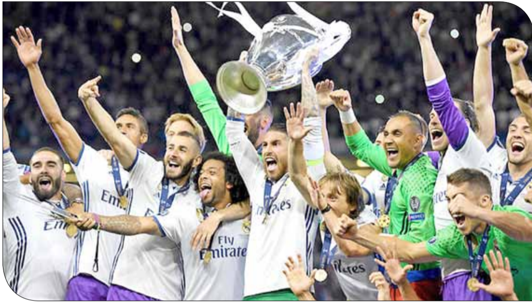
ريال يواجه ابويل فيه مهمة بالمتناول

- وفي المجموعة السابعة، يحل موناكو الفرنسي ضيفا على لايبزيغ الألماني، ويستقبل بورتو البرتغالي على ارضه بشيكتاش التركي.