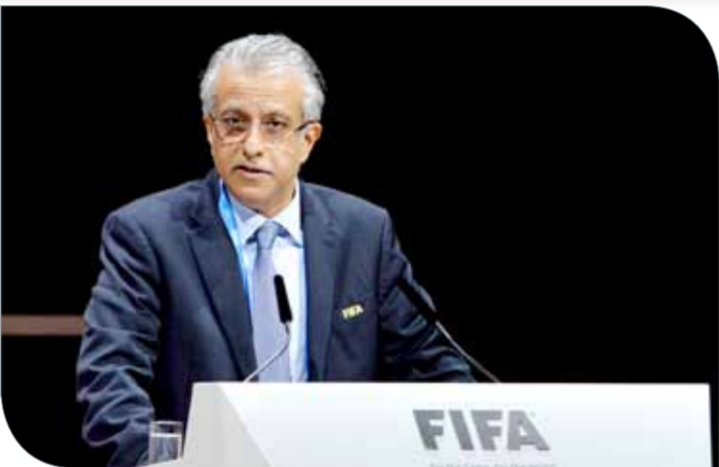
الشيخ سلمان بن إبراهيم آل خليفة

"محمد ذيابات": قد تكون شهادتي في الشيخ سلمان بن إبراهيم آل خليفة مجرّحة؛ لأنني عربي، فمنذ تسلم الشيخ سلمان بن إبراهيم رئاسة الاتحاد الآسيوي استطاع النهوض بالكرة