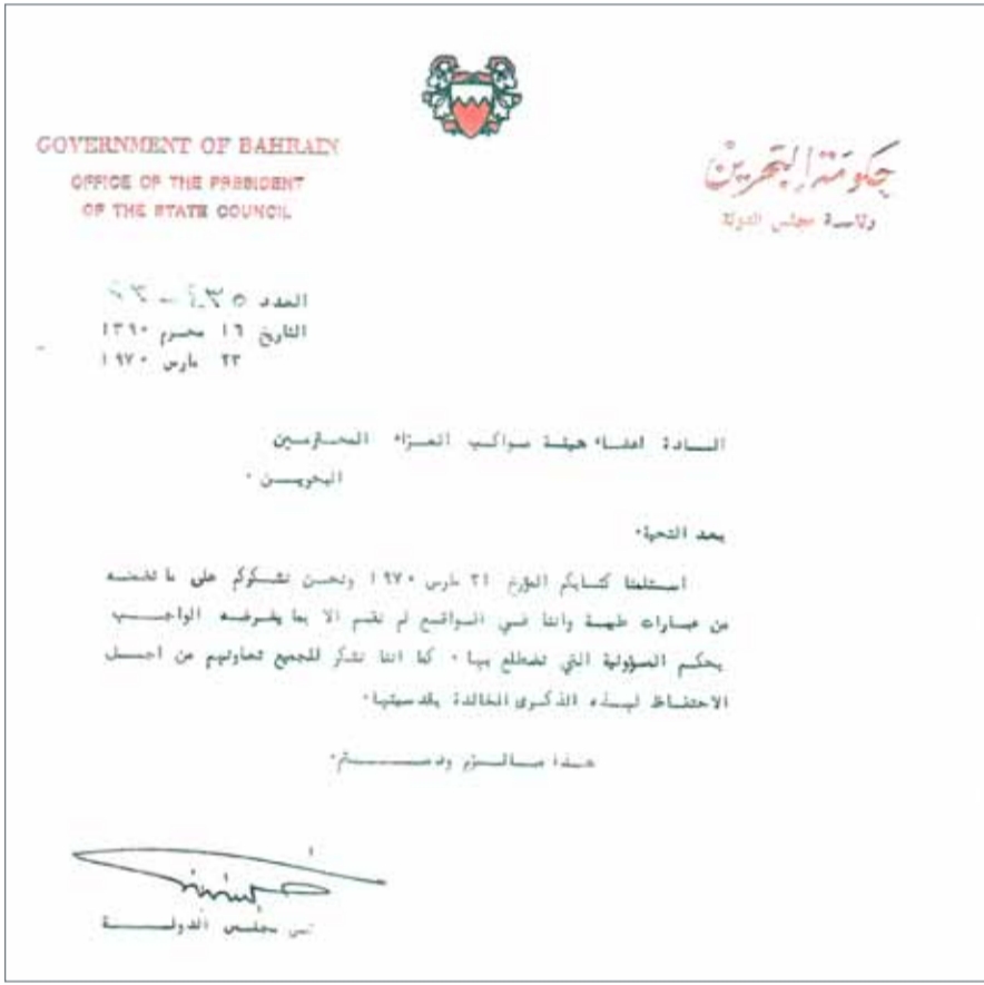
رسالة صادر من سمو رئيس الوزراء في 23 مارس 1970

المزيد من المبادرات الاجتماعية بالتعاون مع العائلات البحرينية في مختلف مناطق المملكة، والتي تدعم مسيرة التقدم والحفاظ على الموروث الثقافي والاجتماعي ما يميز مملكة البحرين فيما بين الدول في الإقليم، إذ يحرص سموه الكريم دائماً أن يكون رأي أبناء هذه العائلات حاضرًا في جميع المناسبات ذات العلاقة على مر السنين.