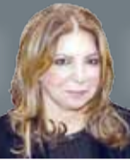
Budoor al malki @albiladpress.com