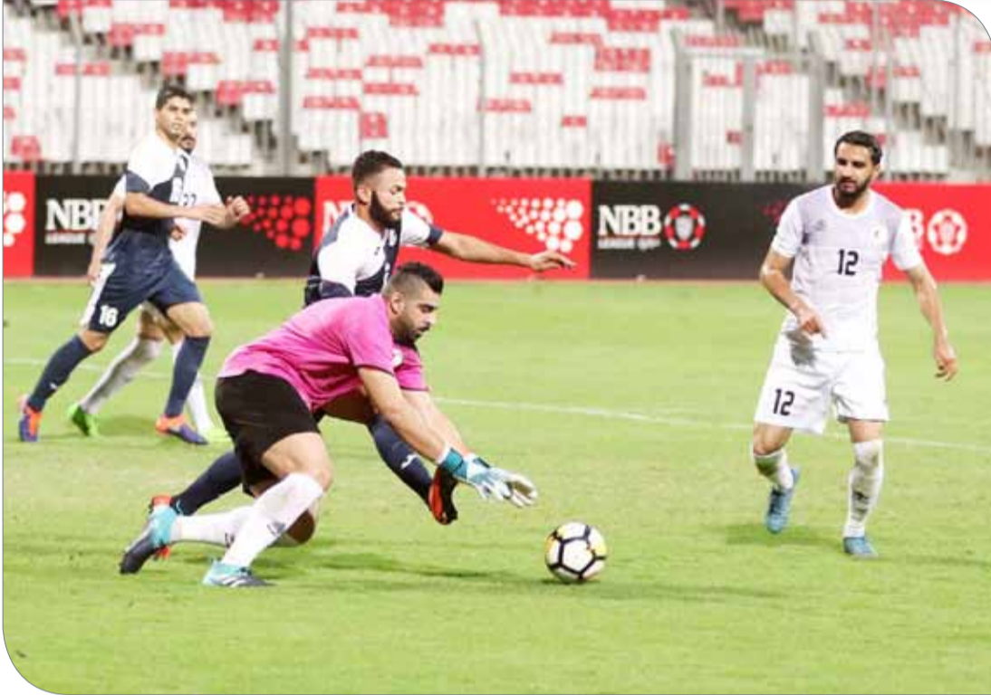
من لقاءات الجولة الثانية