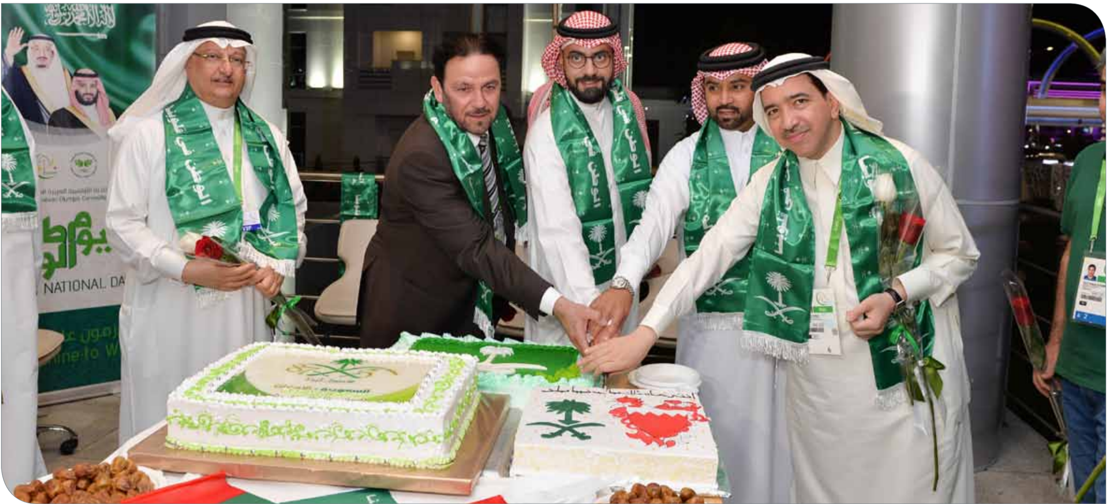
لقطات من حفل الاستقبال السعودي بمناسبة اليوم الوطني المجيد

◆ في دورة الألعاب الآسيوية للصالات بتركمانستان