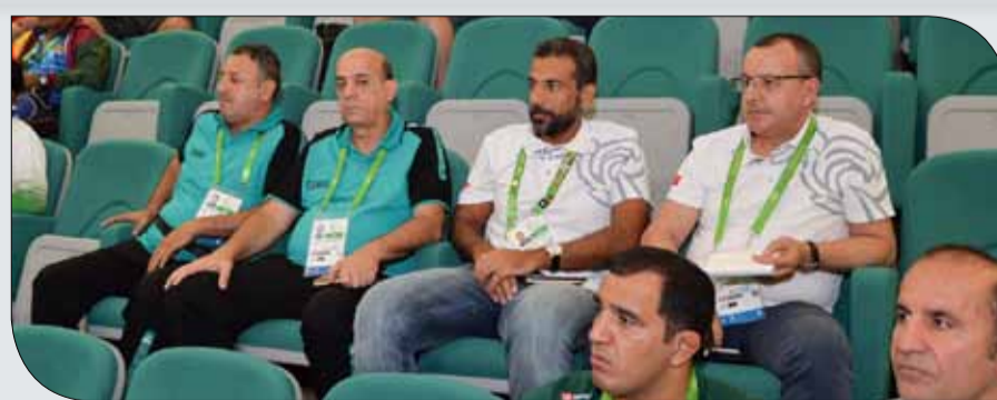
شمسان والناس خلال حضورهما الاجتماع الفني أمس

منافسات وزن 70 كلغ، بحيث تقام الأدوار التمهيدية فيما بين الساعة الحادية عشرة والثانية والنصف ظهراً بتوقيت تركمنستان، على