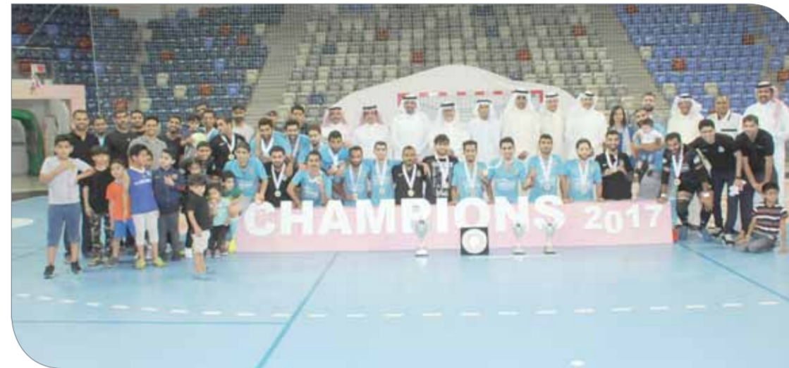
فريق الشباب لكرة الصالات