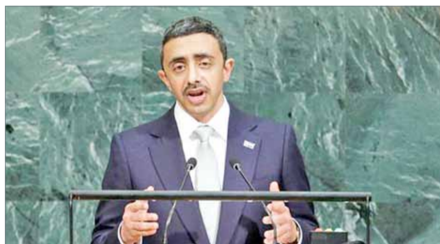
• الشيخ عبدالله بن زايد آل نهيان يتحدث أمام الجمعية العامة للأمم المتحدة في نيويورك يوم الجمعة

المنطقة باهظة في الأرواح والممتلكات. وأشار إلى أن مخرجات قمة الرياض أكدت الوحدة العربية والإسلامية لمحاربة الإرهاب.