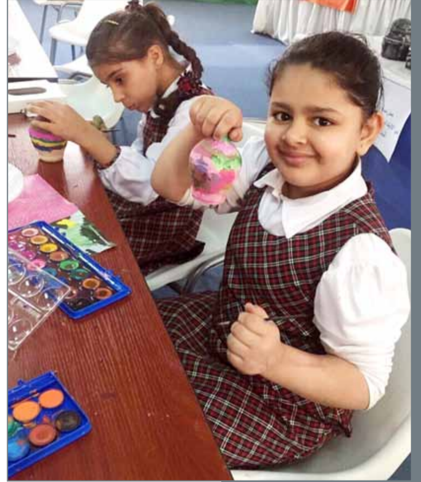
مركز الإنتاج المدرسي يستقبل طالبات المدارس ببرامج تعليمية وفنية وترفيهية لطالبات الحلقة الأولى

وأطلعوا الوزير على الاستعدادات الجارية لتنظيم الملتقى التشاوري الرابع للمستشارين والملحقين الثقافيين العرب، والذي سيكون محوره لهذا العام متعلقاً بالتعليم العالي. وبهذه المناسبة أشاد الوزير بهذا الملتقى