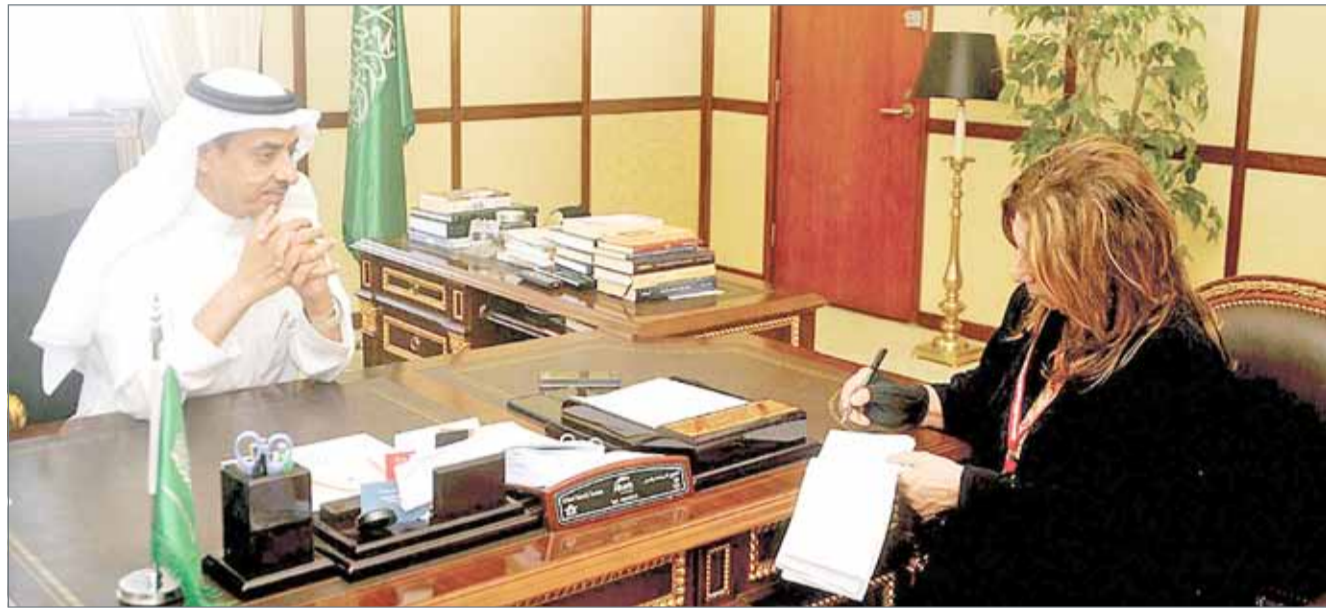
• السفير السعودي متحدتاً لـ "البلاد"

وأوضح آل الشيخ، أن مستقبل التنمية في السعودية يحمل الكثير من المتغيرات الفعالة والإيجابية، والتي يقودها ويعمل عليها ولي العهد السعودي ورئيس مجلس الشؤون الاقتصادية والتنمية صاحب السمو الملكي الأمير محمد بن سلمان، لإيصال المملكة إلى رؤيتها الاقتصادية، مشيراً إلى أن المملكة العربية السعودية بدأت تقطف ثمار الخطط الإصلاحية المالية والاقتصادية التي أشرف على وضعها سمو ولي العهد والتي انعكست إيجاباً على الاقتصاد السعودي خلال المرحلة الماضية وفي مختلف المجالات وتحققت الكثير من المبادرات الناجحة في التنمية الاقتصادية وتواصل العمل على تطبيق مبادرات برنامج التحول الوطني ضمن رؤية المملكة 2030 الهادفة إلى تنويع موارد الاقتصاد والاعتماد بشكل أكبر على تشجيع الاستثمارات الأجنبية. وشدد السفير على أن المرأة السعودية حاضرة وبقوة في كافة المجالات بالمملكة، مؤكداً دورها المهم بالعمل كتركيب في التنمية الشاملة التي تعيشها السعودية، وأن دور المرأة السعودية مهم جداً وفعال جداً، ومقدر