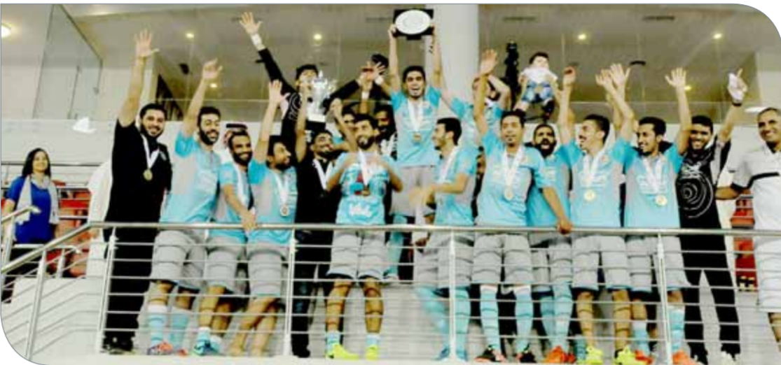
من تتويج الشباب