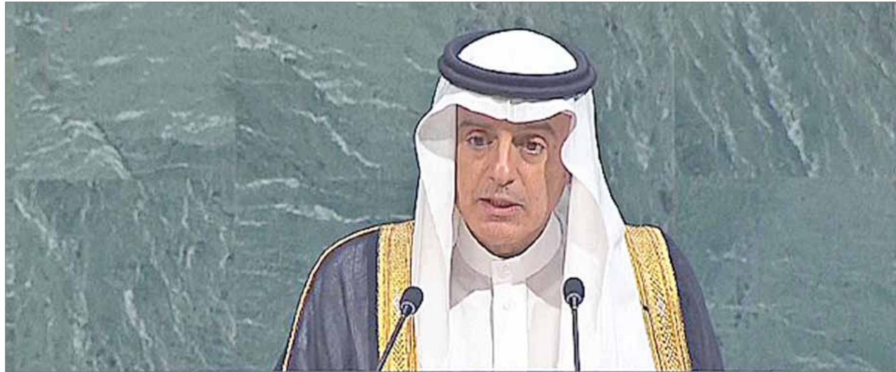
• وزير الخارجية السعودي عادل الجبير يتحدث أمام الجمعية العامة للأمم المتحدة في نيويورك يوم الجمعة

وقال العويشق إن تعهدات الجهات المانحة للمساعدات الإنسانية في دول مجلس التعاون للعام الحالي ”2017“ داخل خطة الاستجابة الدولية تجاوزت 450 مليون دولار وتجاوزت 2.7 مليار دولار خارج خطة الاستجابة. وأكد الأمين العام المساعد – خلال الاجتماع الذي حضره نيابة عن معالي الأمين العام لمجلس التعاون الدكتور عبداللطيف بن راشد الزياني – على الدور الريادي لمجلس التعاون في تقديم الدعم للجمهورية اليمنية لمساعدة الشعب اليمني على تجاوز الأزمة التي يمر بها.