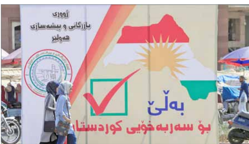
• يؤكد الأكراد أن فوز معسكر ”نعم“ في الاستفتاء، لا يعني إعلان الاستقلال

وجاءت التطورات بعد تأجيل مؤتمر صحفي لرئيس إقليم كردستان العراقي مسعود بارزاني وسط تلميحات أن سبب التأجيل هو مناقشات لاستبعاد المناطق المتنازع عليها من الاستفتاء. ولا تزال المساعي بين أربيل وبغداد جارية بغية مناقشة إمكانية التوصل إلى حل يرضي الطرفين، على الرغم من أن مسؤولاً كردياً أكد أمس أن الاستفتاء جارٍ في موعده. كما بحث قائد الجيش التركي ونظيره العراقي تداعيات الاستفتاء في كردستان العراق. وقال قائد الجيش التركي: ”متفقون مع بغداد على وحدة أراضي العراق“ مضيفاً أن ”الاستفتاء قد يتسبب في حريق بالمنطقة لا