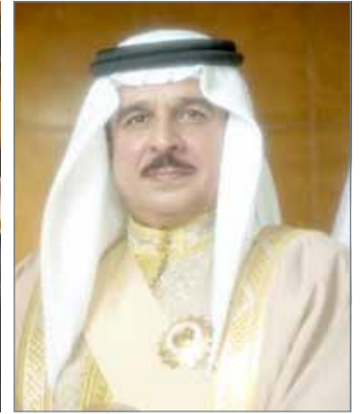
• جلالة الملك

النامية - بنا: بعث عاهل البلاد صاحب الجلالة الملك حمد بن عيسى آل خليفة برقية تهنئة إلى أخيه خادم الحرمين الشريفين عاهل المملكة العربية السعودية الملك سلمان بن عبدالعزيز آل سعود؛ بمناسبة ذكرى اليوم الوطني للمملكة الشقيقة، أعرب جلالتيه فيها عن أطيب تمانيه وتمنياته له موفور الصحة والسعادة والعمر المديد ولشعب المملكة العربية السعودية الشقيق مزيد من التقدم والازدهار في ظل قيادته الحكيمة.