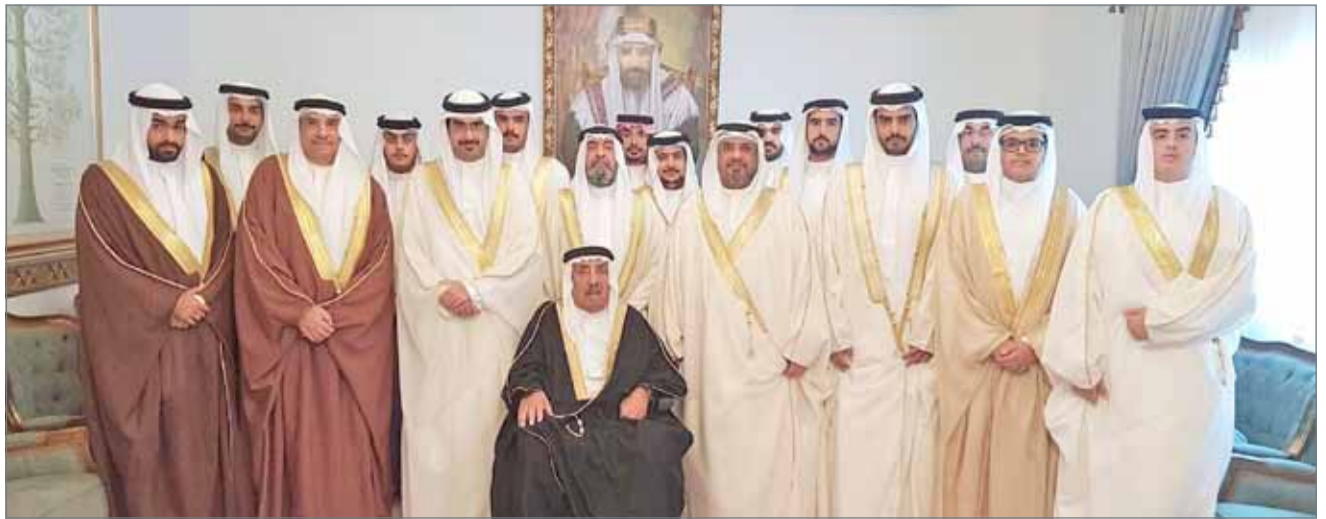
• سمو الشيخ خليفة بن علي في زيارة لمجلسي سمو الشيخ إبراهيم بن حمد والشيخ خالد بن محمد