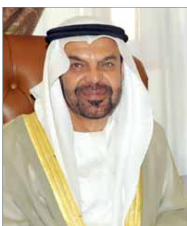
• عبدالرضا الخوري

رئيس مجلس الوزراء وزير الدفاع السعودي صاحب السمو الملكي الأمير محمد بن سلمان بن عبدالعزيز، والتضحيات الكبيرة التي تبذلها نصره الأخوة والحق ومحاربة الباطل ومكافحة الإرهاب واستعادة الشرعية للحكومات المفتتحة، ووضع حد للنشاز والخروج عن الصف الخليجي والعربي الموحد، حتى تنعم شعوب المنطقة بالأمن والاستقرار وتتجح في تحقيق التقدم والتطور والازدهار والتنمية المستدامة، وأضاف أن احتفال السعودية باليوم الوطني مناسبة يتفاعل معها الجميع، وهو يوم فرح تشاركها فيه دولة الإمارات حكومة وشعباً لأننا نسرى معاً على درب الخير والتقدم والسلام، وتنتهى أن يرحم الله بلاد الحرمين الشريفين من كل شر ويحفظ ملكها وأمرأها وشعبها الكريم.