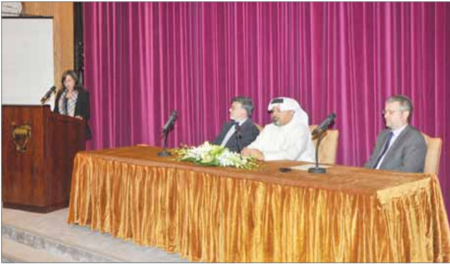
• جانب من ورشة العمل

النما - وزارة المالية: أكد وزير المالية الشيخ أحمد بن محمد آل خليفة أهمية استكشاف وسائل وآليات جديدة لتمويل المشاريع الحكومية في ظل التطورات الاقتصادية المتسارعة على الصعيدين الإقليمي والدولي، منوهاً في هذا الإطار بالشراكة بين القطاعين العام والخاص (PPP) كأحد هذه الوسائل التي تحمل معها آفاقاً واسعة للنجاح والتطوير، ومشيراً إلى أن اللجوء إلى هذا البديل لا يهدف فقط إلى توفير مصادر تمويلية جديدة، وإنما يعني أيضاً الاستفادة من خبرات وأفكار القطاع الخاص في مجالات مختلفة وما يتوافر لديه من مرونة وقدرة على التحرك السريع. جاء ذلك خلال الجلسة الافتتاحية لورشة