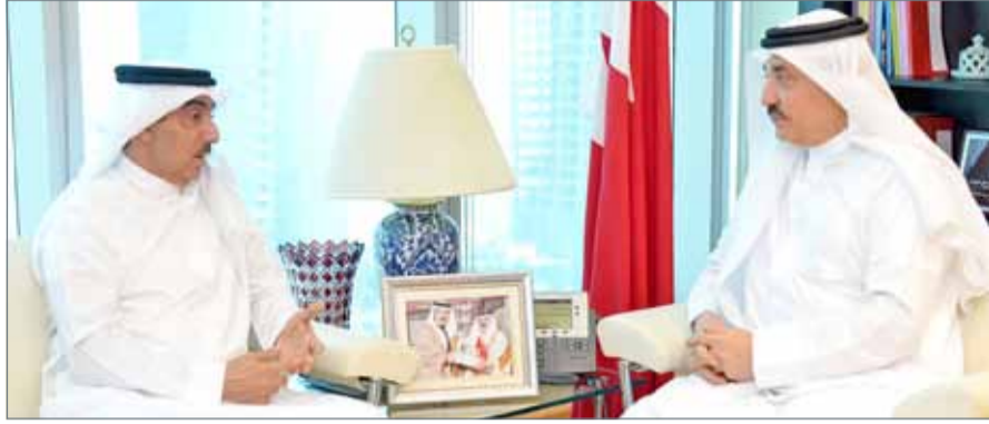
وزير العمل يلتقي الرئيس التنفيذي بشركة خدمات مطار البحرين (باس)

وتعزيرها لما لها من أثر إيجابي على إنتاجية وربحية المنشآت العاملة في القطاع الخاص. من جهته، أثنى الحميد على مشاريع التوظيف والتأهيل التي تنفذها وزارة العمل والتنمية الاجتماعية ورفدها القطاع الخاص بالكوادر