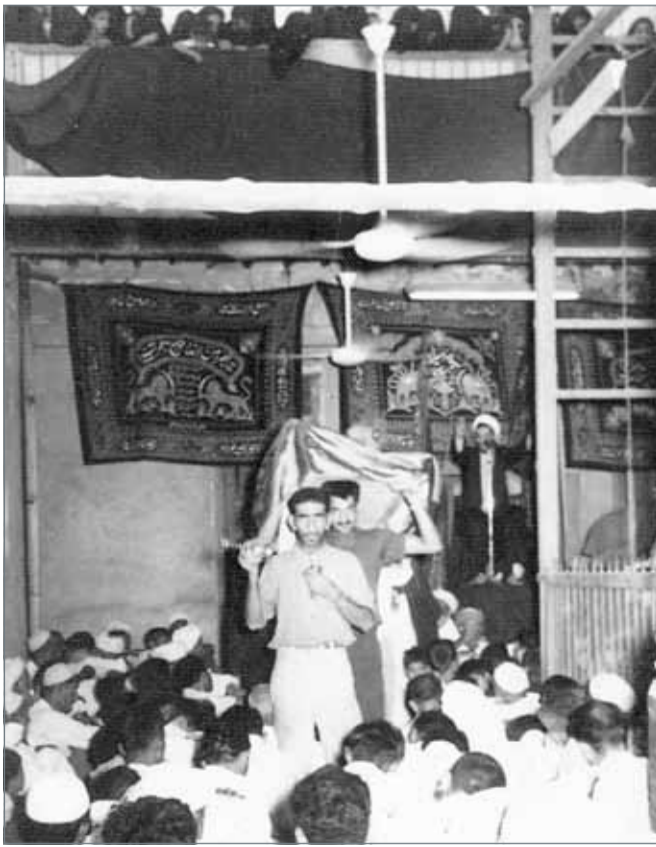
مأتم العزاء في البحرين قديماً

وتأكيداً على ذلك الدور، فقد كان أولى سموه اهتماماً بالشؤون الدينية على مر السنين ولفترات تعبر عقوداً من الزمن، وخاصة في عهد المغفور له بإذن الله صاحب السمو الشيخ سلمان بن حمد آل خليفة طيب الله ثراه حاكم البحرين، حيث دعم المؤسسات الدينية والحسينية وأصدر في عهده القانون الأول لتنظيم إدارتي الأوقاف السنة والجعفرية لتنظيم شؤون الأوقاف ودور العبادة، والإشراف والحفاظ عليها وإعمار المساجد والمآتم ودور العبادة، فيما عرف بقانون تنظيمي بشأن اللائحة الداخلية الصادر في الأول من يناير من العام 1961 الموافق للسابع عشر من ذي الحجة من العام 1381 للهجرة، وقد تفضل المغفور له صاحب السمو الشيخ عيسى بن سلمان آل خليفة (طيب الله ثراه) عندما كان ولياً للعهد نيابة عن والده وبمرافقة صاحب السمو الملكي الأمير خليفة بن سلمان آل خليفة بافتتاح ما تني مدن والقصبات بالعاصمة المنامة، وكان لحضور أصحاب السمو لتنشيد روح الأسرة الواحدة المتلاحمة، والتي تمثلت في توجيه صاحب السمو الشيخ عيسى بن سلمان آل خليفة (طيب الله ثراه) ببناء مأتم مدينة عيسى الكبير على نفقة سموه الخاصة؛ تخليداً لذكرى أهل البيت عليهم السلام. (تابع 2-2).