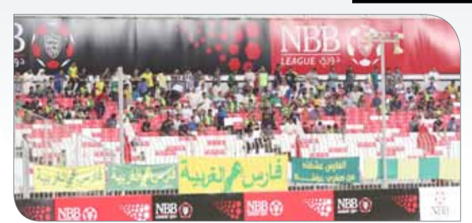
جماهير المالكية خلال لقاء الحد

◆ جماهير المالكية شكلت حضورا بارزا خلال الجولات الثلاث الماضية، سواء بمساندتها وحضورها الدائم في المدرجات، أو عبر تعليقاتها لليافتات التشجيعية المتنوعة في أرجاء الملعب. وتعتبر جماهير المالكية من الجماهير التي تحضر على الدوام لحضور مباريات فريقها ومؤازرته، ويشكل وجودها لمسة فنية رائعة من على المدرجات سواء بالحضور أو باليافات الخضراء والصفراء التي تميزها عن غيرها.