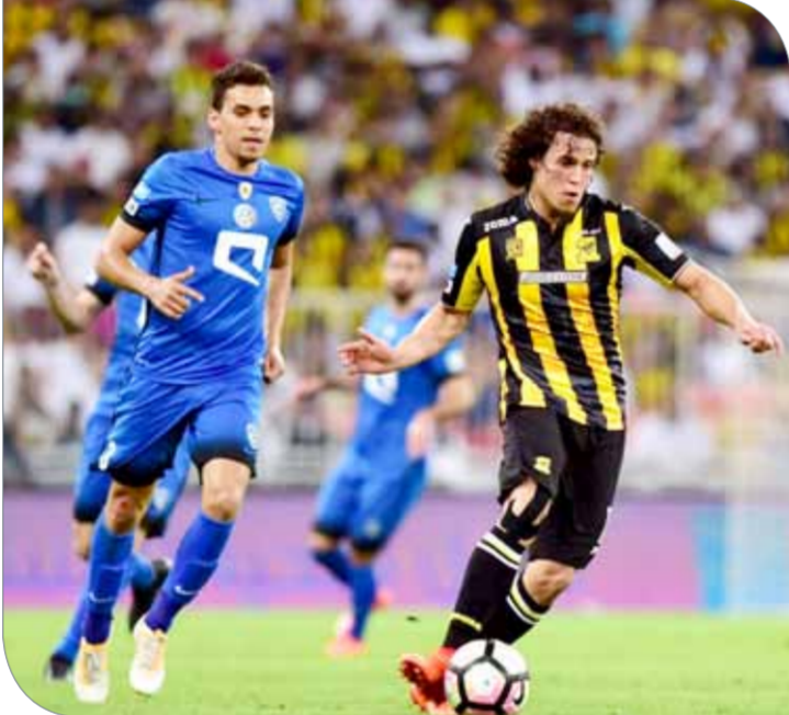
الكرة السعودية... من أنجح التجارب الاحترازية

♦ نجاح الاحتراف الرياضي يتطلب قراراً سياسياً