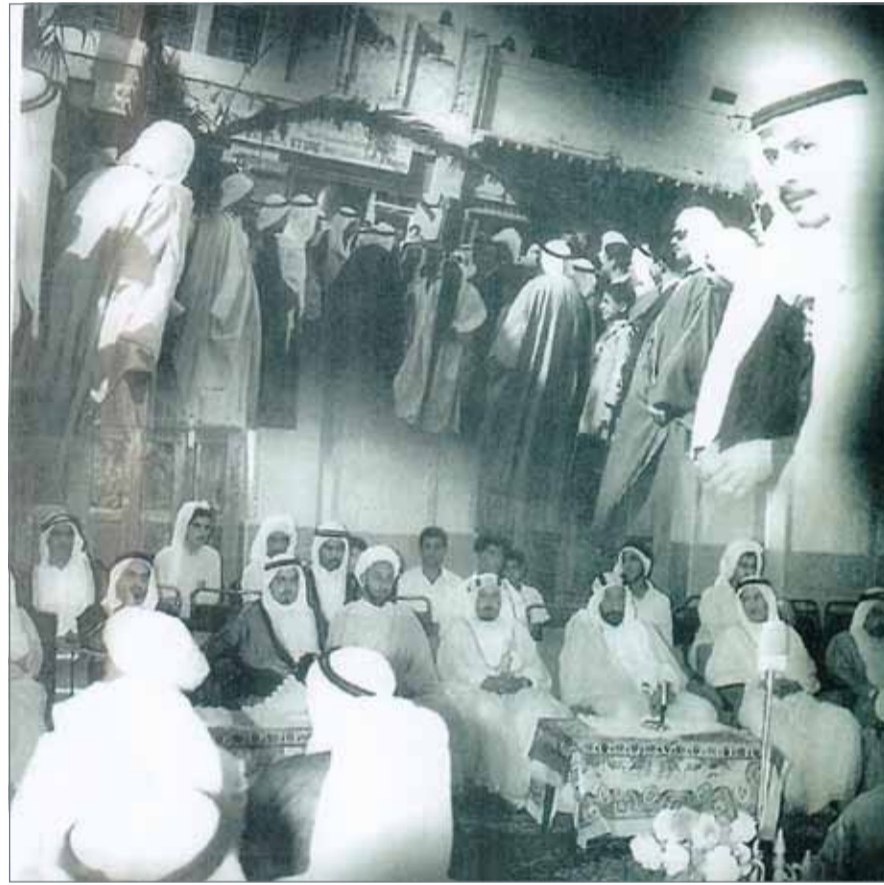
المغفور له سمو الشيخ عيسى بن سلمان آل خليفة وسمو الأمير خليفة بن سلمان في افتتاح مأتم النمامة

إن سمو رئيس الوزراء حين يوجه الجهات المعنية كافة لبذل قصارى جهدها واتخاذ ما يلزم لتسهيل جميع الإجراءات المتصلة بالمناسبات الدينية بالشكل الذي يسهم في تدعيم دورها في نشر قيم المحبة والتعاون، ففي هذا استمرار لهذه المسيرة الطيبة في تقديم التسهيلات والخدمات طوال موسم عاشوراء، ونشاء سموه على جهود رئيس وأعضاء الهيئة العامة للمواكب الحسينية في إحياء المواسم الدينية والعمل على ترسيخ الموروث الثقافي والاجتماعي الذي تميزت به مملكة البحرين، هو المعنى الأشمل لمنهج سموه في التعبير عن المساندة والدعم، ولصدى هذه الحفاوة تقدير أيضاً عن أعضاء الهيئة الذين أشادوا بتوجيهات سموه الكريمة؛ لتوفير التسهيلات اللازمة بموسم