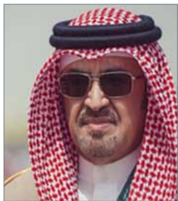
• الشيخ حمود بن عبدالله

والازدهار. وأضاف أن هذا اليوم التاريخي هو حصيلة جهود عظيمة وتضحيات كبيرة قدمها المؤسس المغفور له بإذن الله الملك عبدالعزيز بن عبدالرحمن آل سعود، وأسفرت عن تأسيس هذا الصرح الشامخ وتوحيد البلاد في دولة واحدة قوية عزيزة راسخة الأركان تحت راية التوحيد المباركة. وأشاد السفير البحريني بما حققته المملكة العربية السعودية بقيادة خادم الحرمين الشريفين ن تطور وتقدم في مختلف المجالات في العهد الزاهر لخادم الحرمين الشريفين بما يحقق المزيد من الأمن والاستقرار للشعب السعودي الكريم، ونوه بدور صاحب السمو الملكي الأمير محمد بن سلمان آل سعود ولي العهد نائب رئيس مجلس الوزراء وزير الدفاع في مؤازرة جهود خادم الحرمين الشريفين لتعزيز التنمية الاقتصادية والاجتماعية من خلال رؤية 2030، وغير ذلك من المبادرات والمكتسبات للوطن والمواطن السعودي.