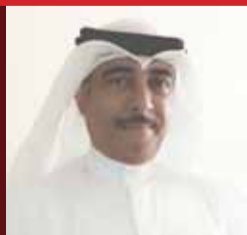
الفنان محمود غريب