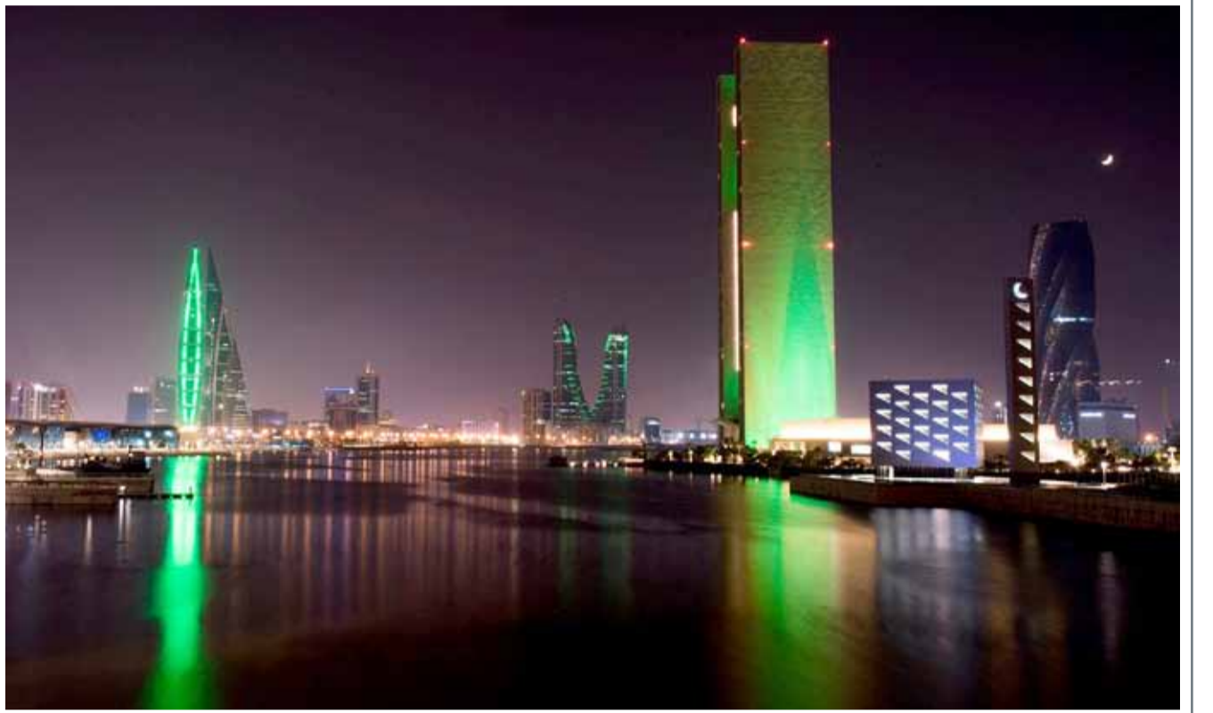
الأبراج قرب المرفأ المالي في النامة تزينت بألوان العلم السعودي، بمناسبة اليوم الوطني الـ 87 للمملكة العربية السعودية