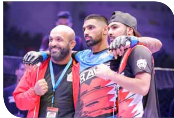
جانب من البطولة