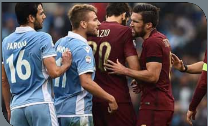
دربي منظر بين قطبي العاصمة

وستنطلق المرحلة بقاء قمة روما بعد اليوم السبت، حيث يخوض روما وغريمه المحلي لاتسيو المباراة لأول مرة منذ عدة سنوات وكلاهما يستمتع بمشوار جيد هذا الموسم. ويبدو أن مقدور الفريقين مواصلة المنافسة على اللقب عقب الفوز بتسع مباريات