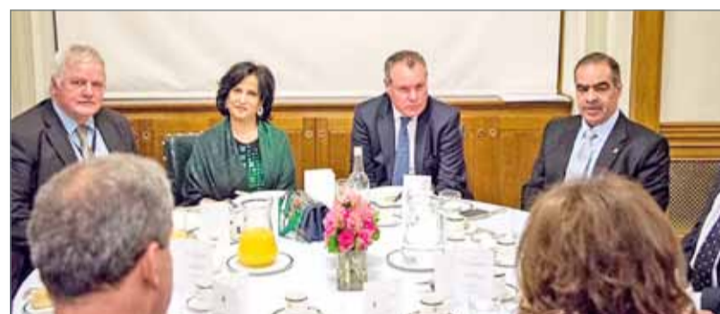
• الشيخة مي أثناء مشاركتها احتفالية بمناسبة اليوم العالمي للتسامح

وتوجه سفير مملكة البحرين لدى المملكة المتحدة الشيخ فواز بن محمد آل خليفة بالشكر للحضور متوقفاً عند رؤية جلالة الملك الداعمة لقيم التعايش والتسامح التي تميز مملكة البحرين، والتي تجعل منها أرضاً خصبة للسلام بين جميع قاطنيها.