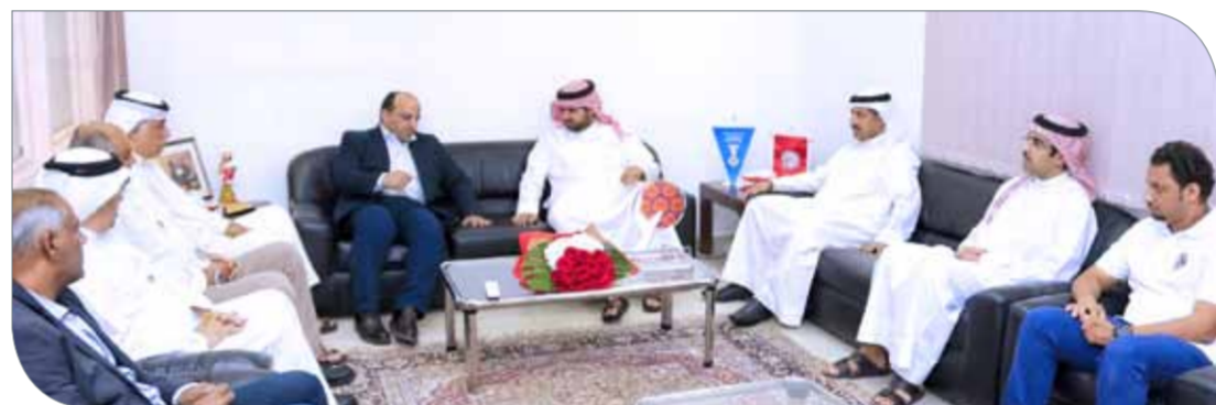
لقطات من زيارة سمو الشيخ عيسى بن علي للاتحاد اليد

الإدارة علي عيسى، حيث هنا سموه لهذا الإنجاز اللافت الذي يؤكد على ما يتمتع به اتحاد اليد من سمعة طيبة بفضل المكاسب العديدة له سواء على مستوى تطوير اللعبة أو على مستوى إنجازات المنتخبات الوطنية. كما هنا سمو الشيخ عيسى بن علي آل خليفة على عيسى بمناسبة حصوله على منصب نائب رئيس الاتحاد