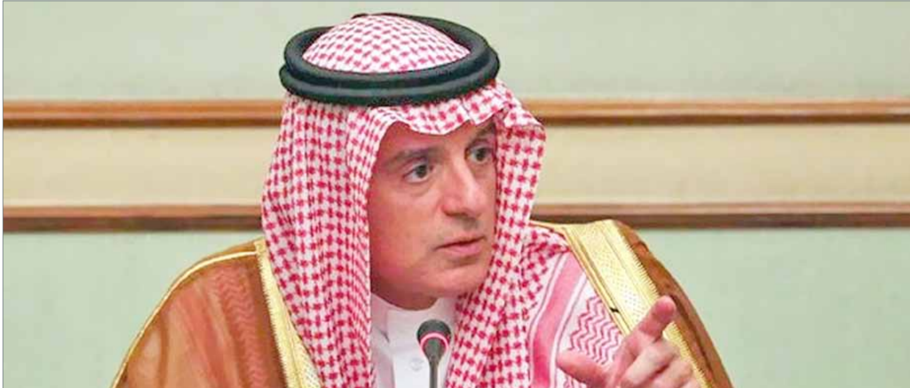
• وزير الخارجية السعودي عادل الجبير.

وفي بداية اجتماع مع وزير الخارجية السوداني إبراهيم غندور، قال ساليغان إنه يأمل "تطور" العلاقات بين البلدين. وأضاف لاحقاً "لقد تناولنا عدداً من القضايا التي يتعين علينا العمل معا حولها، بغية مواصلة الزخم الايجابي الذي بدأناه".