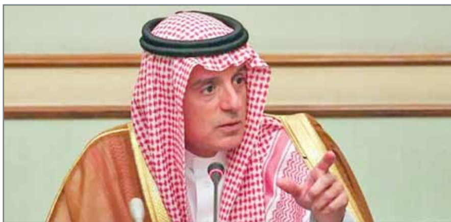
وزير الخارجية السعودي عادل الجبير.

ماكرون إنه يستقبل الحريري في باريس كرئيس لوزراء لبنان، مشيراً إلى أن الأخير سيعود بعد ذلك إلى بيروت خلال أيام أو أسابيع.