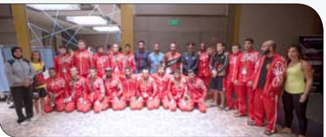
مقاتلو البحرين في لقطة جماعية مع سمو الشيخ خالد بن حمد

◆ في مشهد رائع جدا وينم عن الحس الوطني والحرص على تشجيع المقاتلين للفوز بالنزالات، وقف مقاتلو منتخب البحرين إلى جانب زملائهم في مسيرتهم بنزالات بطولة العالم لفنون القتال المختلطة للهاواة في نسختها الرابعة من خلال التواجد في منصة الجماهير وتشجيع المقاتلين، إضافة إلى رفع علم البحرين عالياً. ويعتبر حضور مقاتلي المنتخب للنزالات لفئة متميزة جداً، وكان لها الأثر الكبير في نفوس المقاتلين ودفعهم إلى تقديم مستويات كبيرة و متميزة طوال النزالات، وقاتلوا خصومهم بكل بسالة وشجاعة؛ الأمر الذي أكد الإمكانيات الباهرة والمتميزة التي يتمتع بها مقاتلو البحرين وحرصهم الموصول على رفع اسم وعلم بلدهم عالياً في هذا المحفل العالمي الكبير. وقام أعضاء منتخب البحرين لفنون القتال المختلطة بتشجيع مقاتلي المنتخب من خلال التواجد المستمر في منصة الجماهير وإطلاق الكلمات المشجعة التي كان لها دور كبير في نفوس المقاتلين، وحثهم على الذل والعطاء في سبيل الفوز بالنزالات، وتخطي خصومهم بكل احترافية، إضافة إلى توجيه المقاتلين في الحلبة التي تعتبر من أفضل الحلبات من حيث التصميم والمواصفات الفنية التي اشتراطها الاتحاد الدولي لفنون القتال المختلطة، والتي عبر عنها بأنها من أفضل الحلبات التي أقيمت عليها مباريات البطولة.