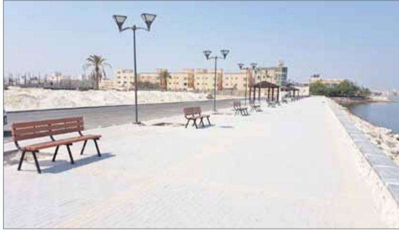
• ممشى خليج توبلي (المرحلة الأولى)

على طراز تقليدي من الخشب المقاوم لرطوبة، إضافة إلى توفير عدد من الأشجار والنخيل في أماكن متفرقة من الممشى إلى جانب محل لتوفير الوجبات الخفيفة لمرتادي الممشى مع وجود مبنى للمرافق الصحية وللرجال والنساء ومواقف للسيارات تستوعب أكثر من 65 سيارة. وأضاف مدير إدارة الخدمات البلدية المشتركة بأن شؤون البلديات مستمرة في تنفيذ خططها بشأن توفير السواحل العامة للمواطنين والمقيمين وتحسين الواجهات البحرية، وأنها تقوم بالعمل على تهيئة وتطوير السواحل العامة بما يسهم في تحسين البيئة، وتوفير المزيد من السواحل العامة في المحافظات كافة لتكون متنفساً للمواطنين والمقيمين وبما يسهم في تعزيز البيئة الساحلية، وتشجيع السياحة وخدمة الاقتصاد الوطني.