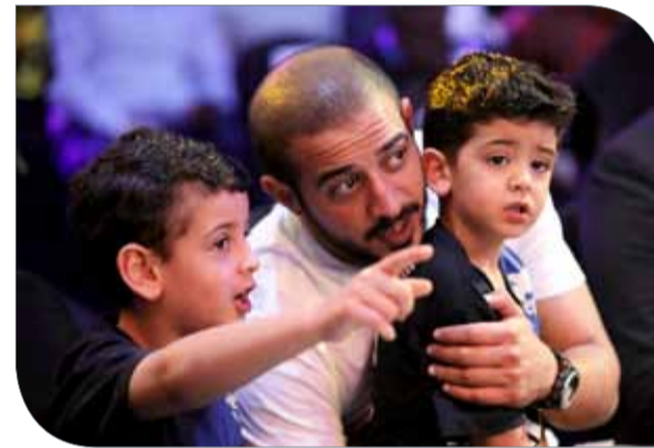
فيصل وعبدالله نجل سمو الشيخ خالد بن حمد

◆ أكد النائب الأول رئيس المجلس الأعلى للشباب والرياضة سمو الشيخ خالد بن حمد آل خليفة الرئيس الفخري للاتحاد البحريني لفنون القتال المختلطة BM-MAF رئيس اللجنة العليا المنظمة لأسبوع بريف الدولي للقتال والنسخة الرابعة لبطولة العالم لفنون القتال المختلطة للهواة أن اليوم "السبت" هو يوم تاريخي في مسيرة بطولة العالم للهواة خاصة مع إقامة النزالات النهائية لكافة الأوزان لتحديد هوية الفائز بالبطولة والمترشح على عرش رياضة فنون القتال المختلطة للهواة. وقال "اليوم هو يوم الحصاد للهواة، بالنسبة إلى كل مجتهد ومن بذل جهوداً كبيرة في سبيل الأعداد والتحضير القوي فنياً وبدنياً لهذه البطولة القوية من كافة النواحي ونأمل أن نشاهد نزالات قوية ومثيرة ترتقي إلى مستوى الطموح الذي يرضي جميع منتسبي رياضة فنون القتال المختلطة". وعن مقاتلاً منتخب البحرين قال سموه "متملك مقاتلين في النهائيات هم حمزة محمدي ومرضى طلحة علي ونأمل أن يوفقا في تحقيق اللقب فهم يمتلكون القوة والشجاعة الكافية والمهارات الفنية والبدنية وتاريخ طويل من الانجازات وثقتنا كبيرة فيهم بتحقيق نتيجة إيجابية في النزالات".