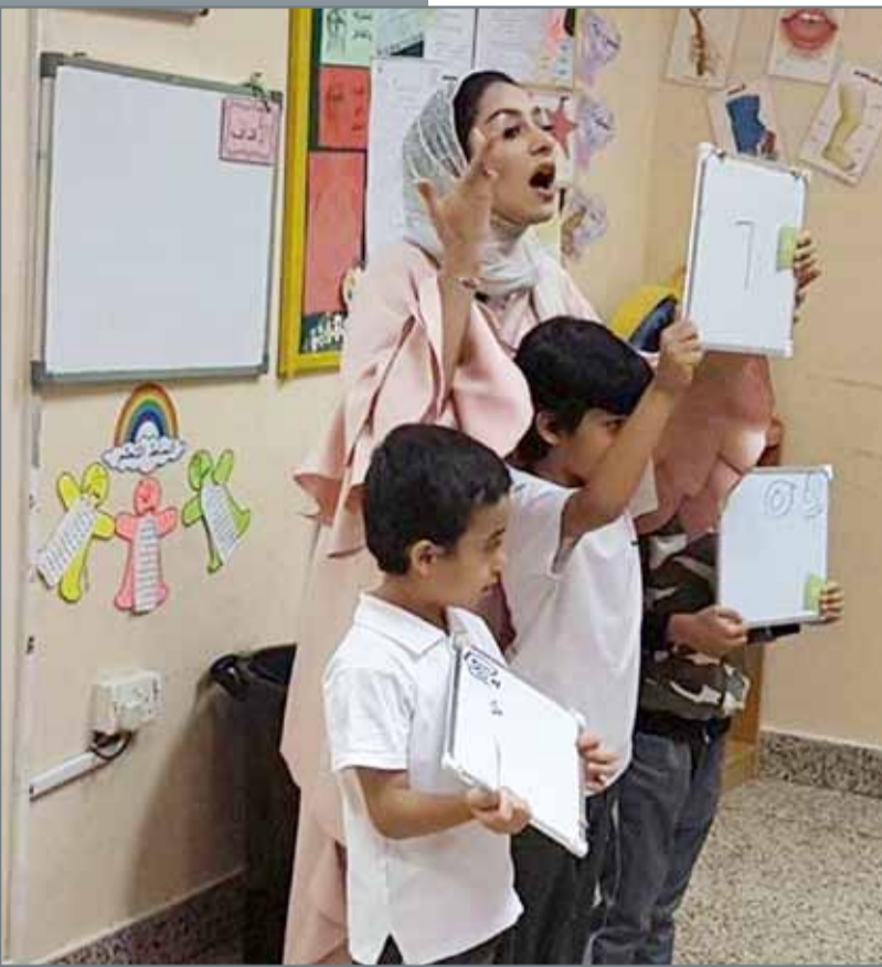
• جانب من تدريس طالبة من كلية المعلمين بجامعة البحرين بأحد صفوف مدرسة حكومية، وذلك ضمن فترة التدريب العملي لمعلمي المستقبل