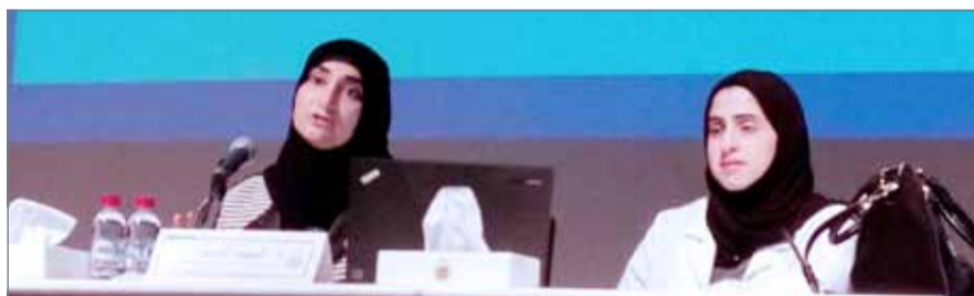
• رئيسة فريق المضادات الحيوية بحاضرة في جامعة البحرين

وحذرت السلطان من كثرة تعاطي المضادات الحيوية لما تشكله من خطورة على الصحة، ونهت إلى أن بعض المرضى يعمل على تفتيت الكبسولة وتناولها قطعاً وهذا يؤدي إلى التقليل من فاعلية الدواء، بينما ينبغي للمريض أن يتناول الكبسولة كاملة.