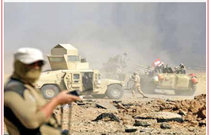
الجيش العراقي يحرر قضاء راوة بالكامل وانتهاء تنظيم داعش عسكرياً