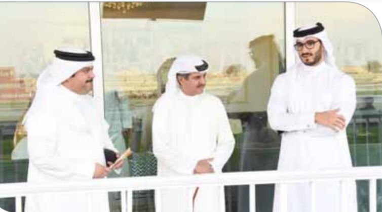
سمو الشيخ عيسى بن سلمان يتابع المنافسات