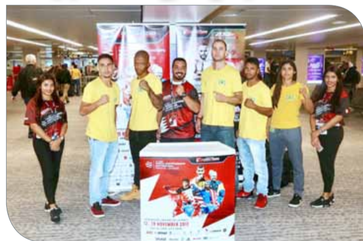
الفريق البرازيلي المشارك في البطولة

القوية من قبل مختلف المقاتلين الشجعان، وأنا مؤمن بأن النزال لن يكون بالسهل لما يتمتع به المقاتلون من إمكانات قتالية وخبرة واسعة في هذه الرياضة، ولكنني قادر على إنهاء النزال لصالح". وتابع "عندما أشاهد الحلبة