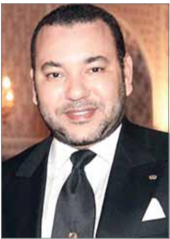
• الملك محمد السادس

نائب القائد الأعلى النائب الأول لرئيس مجلس الوزراء حفظه الله ورعاه برقيتي تهنئة مماثلتين إلى ولي العهد بالمملكة المغربية كل من صاحب السمو الملكي الأمير مولاي الحسن وإلى الوزير الأول بالمملكة المغربية.