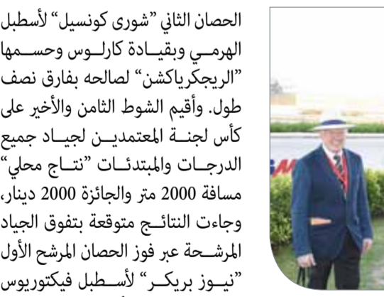
لقطات من التتوير