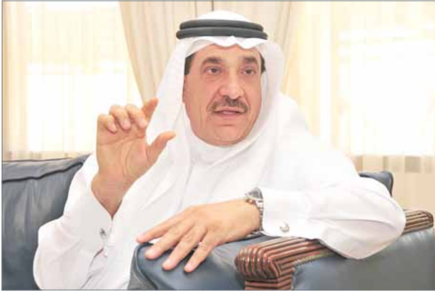
• حميدان: وضع تصنيف للمجتمع المدني ومنها الجمعيات الحقوقية

هل ستطلق الوزارة مشاورات مع مؤسسات المجتمع المدني للتشاور بشأن التعديلات المقترحة على القانون، أم إن هذه المهمة مؤجلة لحين إحالة التشريع للبرلمان؟ بالتأكيد ستقوم الوزارة بعقد العديد