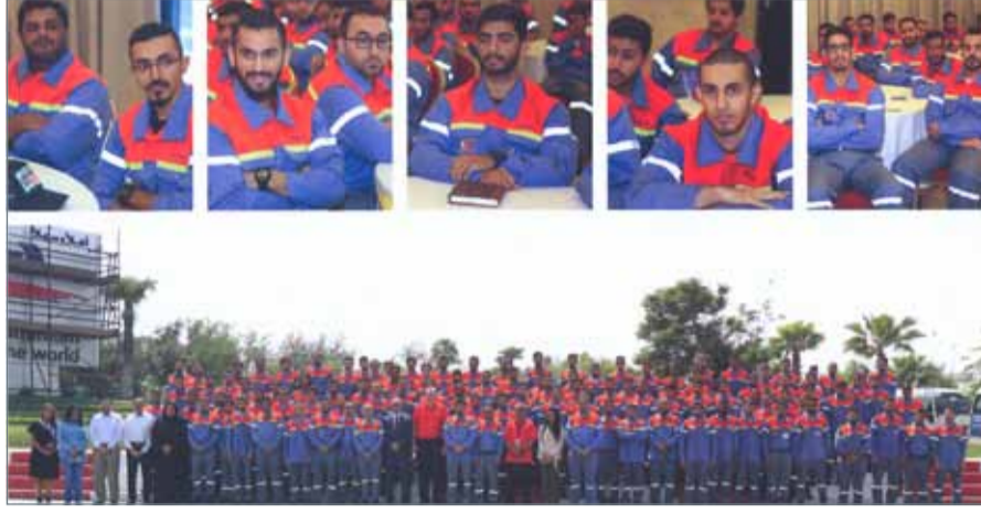
الموظفون الجدد خلال لقاء التهيئة

استكملت شركة ألبا للبتروكيماويات إجراءات توظيف الدفعة الأولى من البحرينيين الذين سينضمون إلى فريق العمل التابع لمشروع الخط السادس للتوسعة، وذلك كجزء من خطط الاستعداد لتكون ألبا أكبر مصهر للألمنيوم ذي موقع واحد في العالم عند الانتهاء من المشروع والمحدد بالأول من يناير 2019.