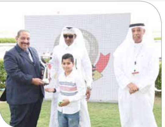
لقطات من التتوير