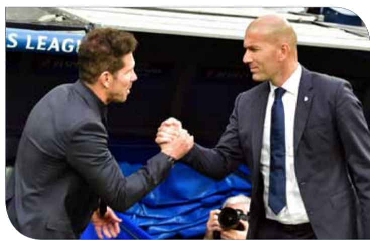
زين الدين زيدان ودييغو سيميوني تحت الضغط

ولم يشارك أيضاً في التشكيلة الأساسية في الهزيمة المذلة (0-4) أمام ليفربول