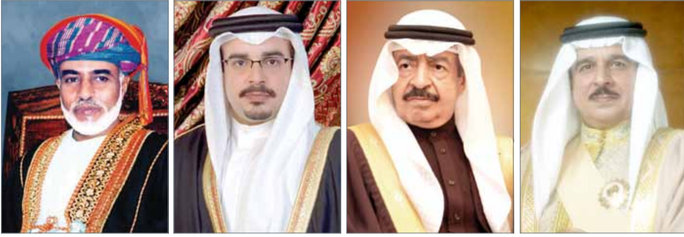
• جلالة الملك • سمو رئيس الوزراء • سمو ولي العهد • السلطان قابوس بن سعيد