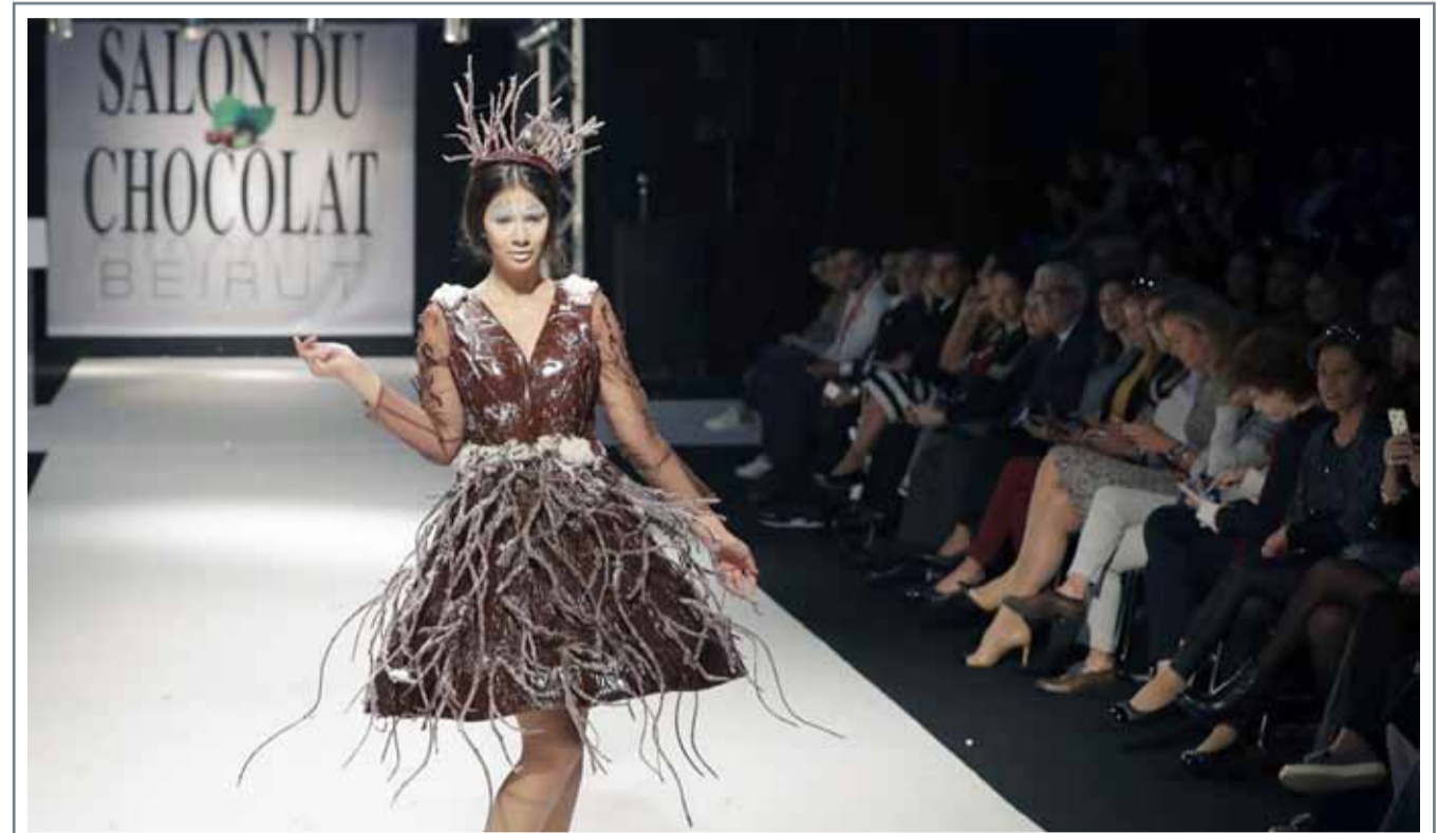
عرض مبتكر لأزياء راقية تم صنعها من الشوكولاتة في افتتاح مهرجان الطبخ السابع ببيروت.