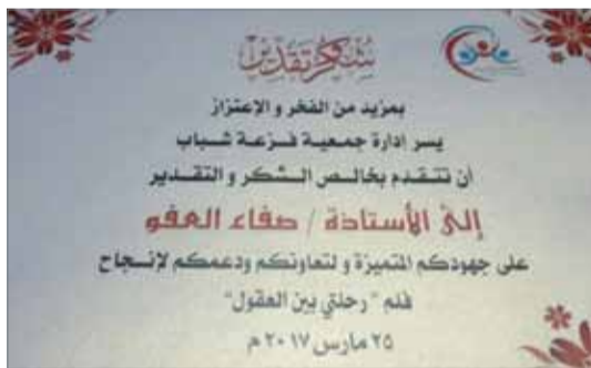
• تقدير لمشاركتهما في كتابة سيناريو فيلم قصير