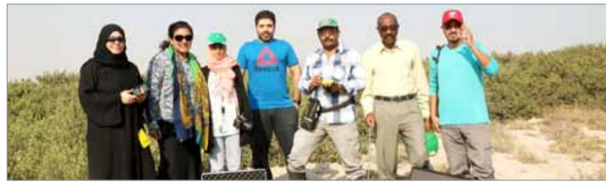
الفريق البحثي يحدد المنطقة المثل للدراسة في محمية رأس سند

المنامة. جامعة الخليج العربي: يعكف فريق من المتخصصين بقسم الجيومعلوماتية بكلية الدراسات العليا بجامعة الخليج العربي على تنفيذ مشروع بحثي لتقدير كمية الكربون في بيئة "المانغروف" في مملكة البحرين.