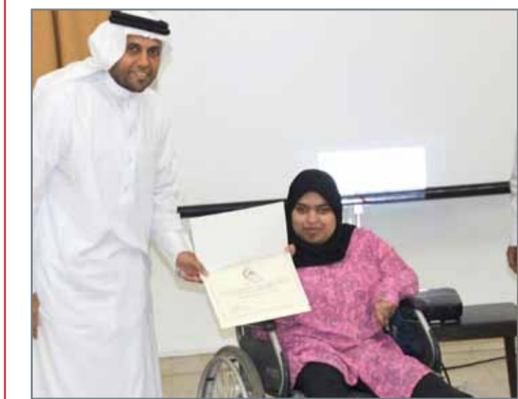
تكريم العفو في إحدى الفعاليات