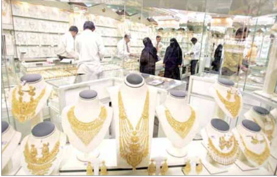
الإمارات وسويسرا في مقدمة الدول الموردة للذهب للبحرين

يوم الأحد، ووصل سعر الفقرام عند 15.51 دينار يوم الاثنين، وارتفع نسبياً يوم الثلاثاء حيث سجل 15.56 دينار، إلا أنه بدأ بالتراجع الأربعاء الماضي، إذ سجل 15.54 دينار، ثم سجل أمس الخميس 15.48 دينار. وارتفع سعر كيلو الذهب محلياً إلى 15484 دينار مقابل 15390 دينار أكتوبر الماضي، بزيادة مقدارها 0.61%، فيما زاد سعر كيلو الذهب عالمياً بنسبة 0.58% وسجل 41,061 دولار أمس الخميس مقابل 40,823 دولار في أكتوبر الماضي. كما ارتفع سعر أوقية الذهب ووصل عند 481.56 دينار مقابل 478.64 دينار أكتوبر الماضي، فيما وصل سعرها العالمي إلى 1,277 دولار مقارنة بـ1,270 دولار أكتوبر الماضي، علماً أن جنيه الذهب وصل سعره محلياً إلى 108.39 دينار مقابل 107.73 دينار في أكتوبر 2017 وأحرز عالمياً 287.43 دولار مقابل 285.77 دولار في أكتوبر الماضي. إلى ذلك، استوردت البحرين نحو 645.2 ألف قطعة من سبائك الذهب والمجوهرات من 17 دولة بقيمة إجمالية تبلغ نحو 10.6 مليون دينار، خلال أكتوبر الماضي، بحسب آخر إحصائيات الجهاز المركزي للمعلومات. وبحسب البيانات الأولية التي أصدرتها