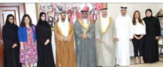
• تمديد فترة استقبال المشاركات جاءت استجابة للطلب المتزايد

أفضل 30 معلماً على دورات تدريبية في أعرق بيوت الخبرة العالمية. وتشمل الجائزة المعلمين في المدارس الحكومية والخاصة المعتمدة في دول مجلس التعاون، ممن يمتلكون خبرة في التعليم لا تقل عن ثلاث سنوات.