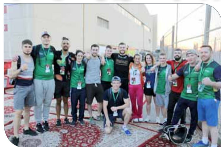
جانب من التواجد في منطقة الإكسبو بجوار الصالة