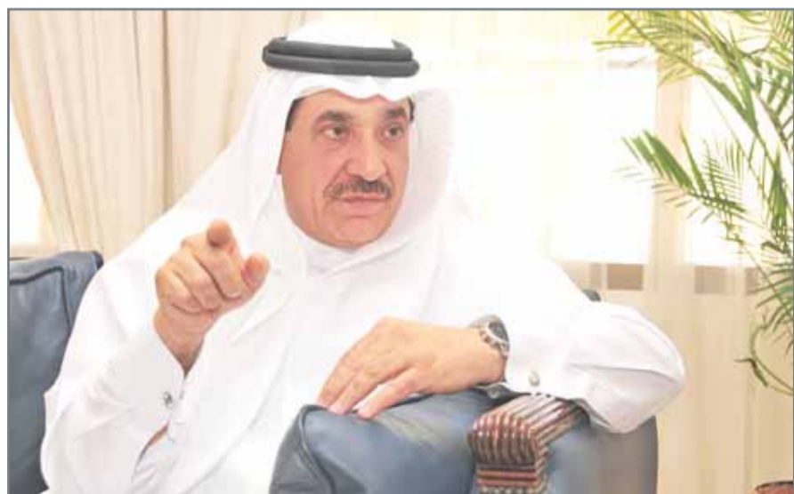
القانون يتضمن حقوقاً ومكتسبات تتماشى مع الاتجاهات الحديثة