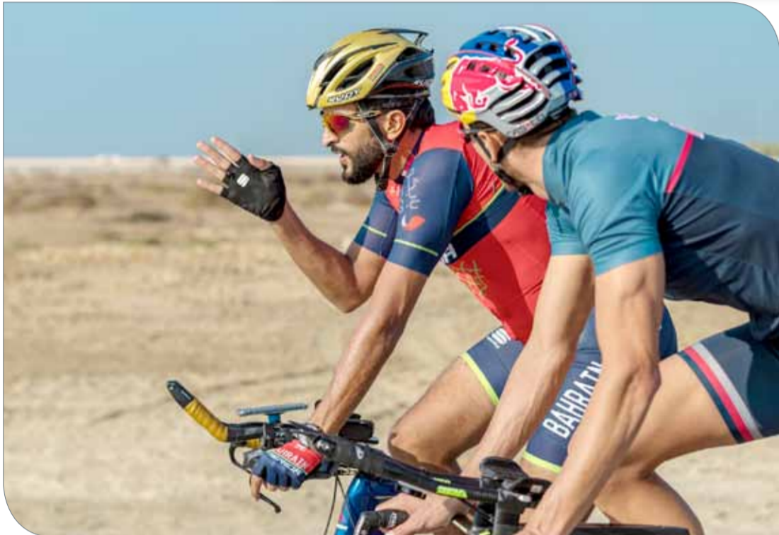
سمو الشيخ ناصر بن حمد يقود التدرينات

تحقيق نتيجة إيجابية تشكل له دافعا قويا في المشاركات القادمة، معتبرا أن تواجد الفريق البحريني في السباق ستكون له آثار إيجابية من خلال اكتساب المزيد من الخبرات والمهارات التي تعين الفريق في مشاركاته القادمة والترويج لمملكة البحرين وما حققته من إنجازات كبيرة في مختلف المجالات التنموية.