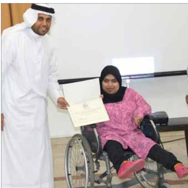
• تكريم العفو في إحدى الفعاليات

– أجل، نظرة المجتمع لذوي الإعاقة لم تتغير رغم ما بلغناه من تقدم تكنولوجي وتقني، فالمعاوق قادرون على العمل وتنمية بلدهم، وعدم الاكتفاء بالعمل التطوعي.