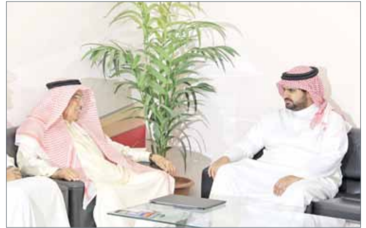
• سمو الشيخ عيسى بن علي بن خليفة مستقبلاً رئيس مجلس إدارة جمعية ذخر البحرين عيسى القاضي وأعضاء مجلس الإدارة