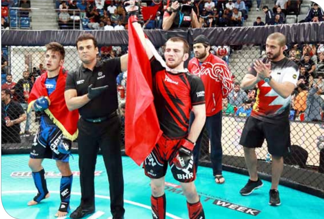
نجوم منتخبنا على موعد مع الذهب اليوم

ويقف سمو الشيخ خالد بن حمد آل خليفة خلف نجوم منتخبنا الوطني، ويحرص على حضور مواجهات المقاتلين البحرينيين كافة، ويساندتهم معنوياً ويشجعهم قبل المباريات وفي فترات الراحة بين الجولات، إضافة إلى حرص سموه على الدخول للحلبة أولاً؛ من أجل تهنئة الفائزين ومواساة الخاسرين.