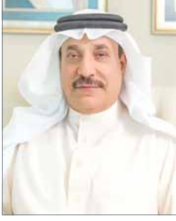
• وزير العمل

الإعاقه، والمسنين، وحماية الطفولة والأسرة (82%). أما بالنسبة لخدمات تنمية المجتمع والتي تشمل خدمات دعم المنظمات الأهلية، وتنمية الأسرة والطفولة، والمراكز الاجتماعية، فقد بلغ متوسط الرضا العام (72%). وفيما يتعلق بخدمة المساعدات الاجتماعية، والتي تشمل الضمان الاجتماعي وتعويض حريق المساكن والتعويض النقدي مقابل رفع الدعم عن اللحوم وعلاوة الغلاء ومكافأة الأشخاص ذوي الإعاقه، فقد بلغ متوسط الرضا العام للمستفيدين (81%).