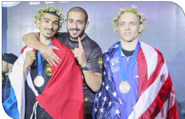
روح رياضية عالية بين لاعبي البطولة

وأوضح حمزة أنه كان يتفادى السقوط على الأرض، إذ عندما يسقط ستكون الغلبة لمنافسه، وقال: عملت بكل