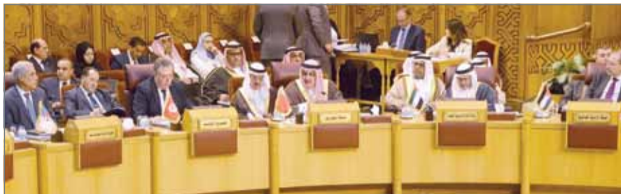
وزير الخارجية مشاركة في اجتماع الدورة غير العادية لمجلس جامعة الدول العربية

وأوضح الشيخ خالد بن أحمد بن محمد آل خليفة أن إيران لا تحاربنا فقط مباشرة من قبل سواحلها، حيث تقوم بعمليات تهريب وأمر عديدة أخرى، ولكن لها أذرع كثيرة في المنطقة، وأكبر ذراع لإيران في المنطقة هو ذراع حزب الله الإرهابي، الموجود في الجمهورية اللبنانية والجمهورية العراقية والجمهورية العربية السورية وفي أماكن كثيرة، مؤكداً أن هذا هو التحدي الكبير للأمن القومي العربي والذي نتعرض له من دولة تتحول إسقاط دولنا والسيطرة والمهيمنة بكل وضوح ولا تتورع من القيام بأي عمل للوصول إلى هذا الهدف. وأشار وزير الخارجية إلى أن الجميع يتحمل المسؤولية، وأن الجمهورية اللبنانية وهي بلد عربي شقيق ومحل محبة وتقدير، إلا أنه يتعرض