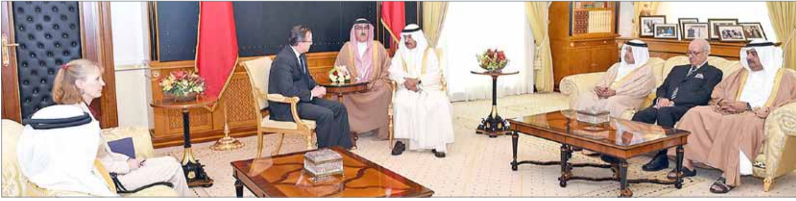
• سمو رئيس الوزراء مستقبلاً السفير الأميركي الجديد

مملكة البحرين على تنمية تعاونها مع المجتمع الدولي لمواجهة مختلف التحديات وفي مقدمتها الإرهاب.