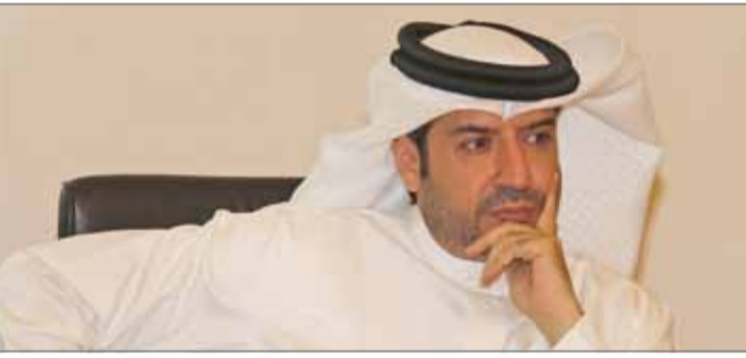
• القائم بأعمال مدير عام بلدية المحرق (صورة أرشيفية)

قدرتهم لارتياح الحدائق العامة وهناك توجه عام في جميع المحافظات بفرض رسوم عامة، وهذا ما تم في العديد من المحافظات، حيث تم تطبيقه في المحافظة الجنوبية وعلى عين عذاري وعين أم شعوم. وأوضح أنه في السابق كنا نوزع 22 عامل نظافة في منتزه الأمير خليفة في "الجنوبية"، واليوم نوزع 6 عمال فقط، وكان الأمر يكلفنا ما يزيد عن 100 ألف دينار.