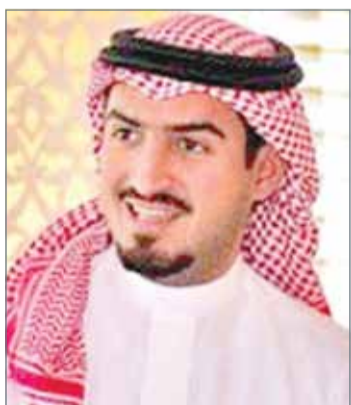
● الشيخ خالد بن جمود

كشفت الرئيس التنفيذي لهيئة البحرين للسياحة الشيخ خالد بن جمود آل خليفة أن البحرين تستهدف نحو 2600 سائح أجنبي من خلال تنظيم باقات سياحية كاملة منتظمة. وقال الشيخ خالد على هامش منتدى المصرف الخليجي التجاري للتنوع الاقتصادي، إن أول دفعة من السياح الذين يتم استقبالهم من خلال نحو سبعة مكاتب خارجية، ستصل بعد نحو أسبوع من الآن.