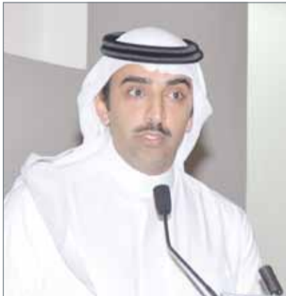
● وزير النفط

حوالي 107 كيلومتراً، منها 43 في البحر و22 كيلو على اليابسة من جهة البحرين، وحوالي 42 كيلو على اليابسة في الأراضي السعودية. وتبلغ كلفته نحو 300 مليون دولار، حيث تتحملها شركة "أرامكو" السعودية. وسيحل الأنبوب الجديد مكان 3 أنابيب، أنشئ اثنان منها في أربعينيات القرن الماضي، وأضيف ثالث مطلع السبعينيات، وسيتم تزويد الخط الجديد بالياف بصرية تسمح بالرصد والمتابعة عن بعد، فضلاً عن الإشراف الدقيق على الأداء التشغيلي للخط وفق أحدث التقنيات. وبسؤال الوزير عن تطبيق ضريبة القيمة المضافة على البنزين على غرار السعودية، أجاب الوزير أن وزارة المالية على دراية أكثر بالموضوع، (...) وسيكون لدينا تفاصيل أكثر