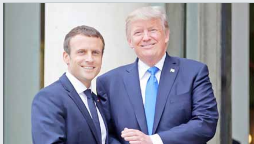
• لقاء سابق بين الرئيسين ترامب وماكرون في باريس.

بيروت. رويترز: قال قيادي في تيار المستقبل لروبيرتز، إن سعد الحريري رئيس الوزراء اللبناني المستقيل سيزور مصر اليوم الاثنين. والحريري موجود منذ يوم السبت في باريس، حيث اجتمع مع الرئيس الفرنسي إيمانويل ماكرون، وقال إنه سيعود إلى لبنان يوم الأربعاء. وعقب انتهاء محادثاته مع الرئيس الفرنسي إيمانويل ماكرون، قال الحريري في تصريحات صحافية موجزة، إنه سيلعب موقفه النهائي من الأزمة "في بيروت بعد مشاورات مع الرئيس اللبناني ميشال عون". ووجه الحريري الشكر إلى الرئيس ماكرون على دعمه، وقال إن فرنسا "أظهرت مرة أخرى دورها الكبير"، مشدداً على الصداقة الدائمة بين فرنسا ولبنان، و"التزام باريس باستقلال لبنان".