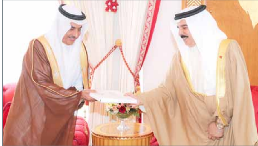
• ... وجلالته مستقبلاً السفير السعودي

• خادم الحرمين يدعو البحرين لوزاري دفاع التحالف الإسلامي