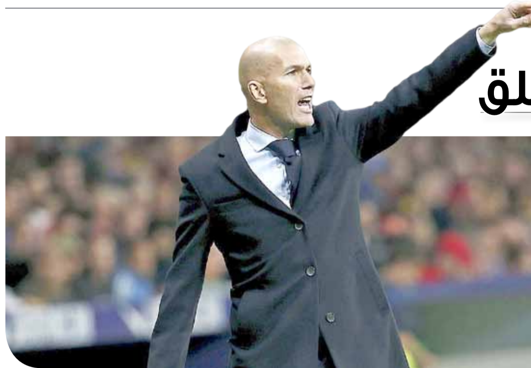
زين الدين زيدان