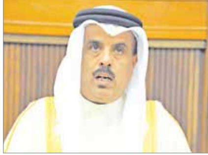
• وزير التربية

لمعهد البناء العالمي. وأشار عواد إلى أن أي مؤتمر بحثي علمي عالمي يأتي باحثين من 15 بلداً، يعكس أن البحرين بلد علم، وواحة معرفة.