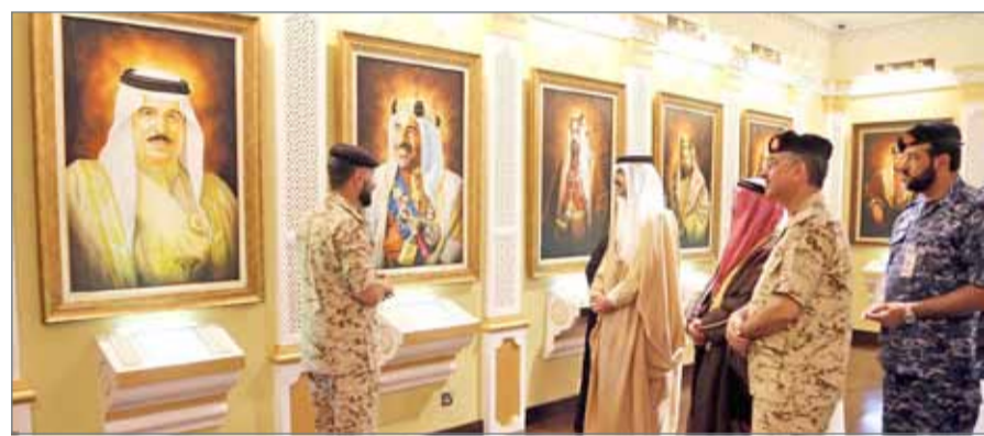
• سمو محافظ الجنوبية في زيارة للمتحف العسكري