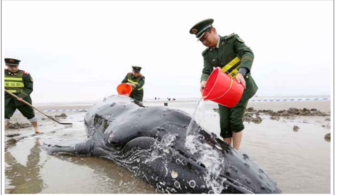
الشرطة الصينية تصب الماء على حوت قذفت به أمواج البحر إلى شواطئ كيدونغ

حالة الطقس الطقس المتوقع لهذا اليوم سيكون غائماً ثم يتحول إلى غائم جزئياً.