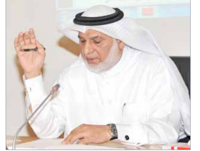
• الرسوم للحد من سلوكيات مرتادي الحدائق