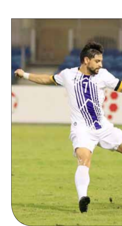
من لقاء المالكية والاتحاد