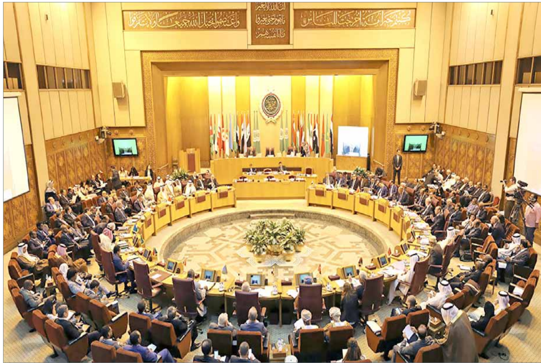
• اجتماع وزراء خارجية العرب في القاهرة

أبو ظبي. سكاى نيوز عربية: أكد فاروق قسنطيني، الرئيس السابق للجنة الاستشارية لحقوق الإنسان في الجزائر أن لدى رئيس البلاد، عبد العزيز بوتفليقة، رغبة في الترشح لعهدة خامسة عام 2019. وذكر قسنطيني، أنه لمس رغبة الترشح لدى بوتفليقة خلال لقائه به، وفق ما نقل موقع "كل شيء عن الجزائر". وأضاف "حالة بوتفليقة جيدة وتحليله دقيق جداً، الأمر الوحيد الذي يعطله أن صوته تراجع، وأنه يتحرك بصعوبة لا سيما رجليه وهو مقعد فوق كرسيه المتحرك". وأورد قسنطيني "الرئيس بوتفليقة أعرفه جيداً ويريد أن يبقى في خدمة بلده إلى أن يتوفاه المولى عز وجل، فهذا طبعه خدوم، ويبقى تحت تصرف وطنه". بالمقابل، فنّدت رئاسة الجمهورية، الأحد، لقاء بوتفليقة، المحامي فاروق قسنطيني، وفقاً لما ذكرت صحيفة "الشروق".