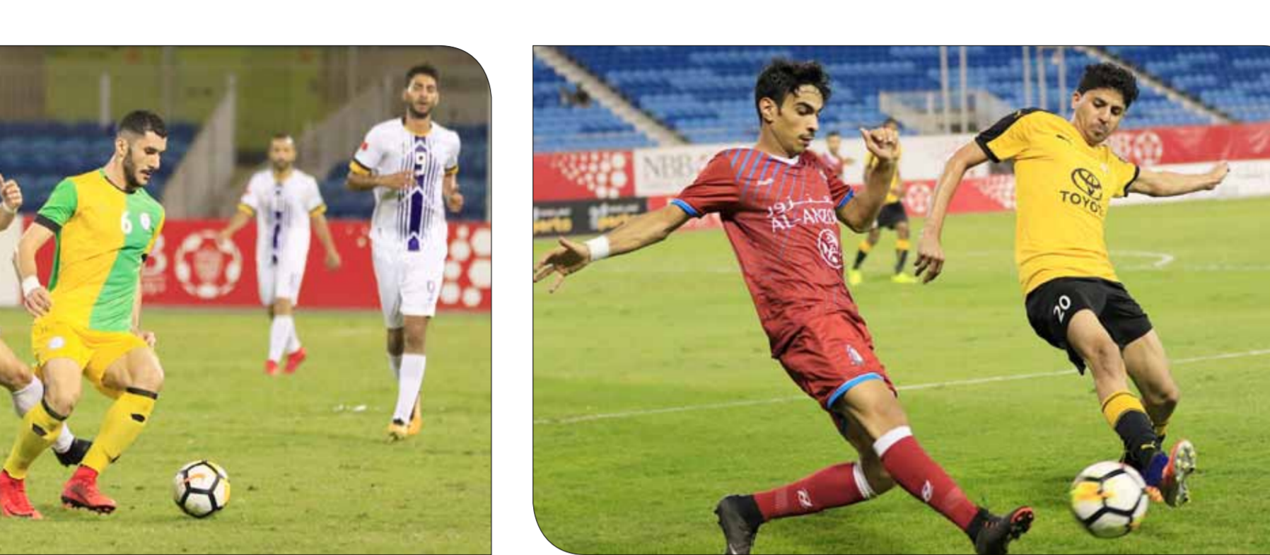
من لقاء الشباب والأهلي