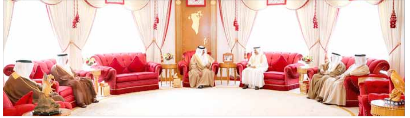
• جلالة الملك مستقبلاً سمو رئيس الوزراء

فيه كل التوفيق في جهودهم لترسيخ أواصر التعاون والتكامل في منظومة التحالف الإسلامي العسكري، وتوحيد وتنسيق الجهود لمحاربة التطرف والإرهاب. وأشاد جلالته بعمق العلاقات القوية والراسخة بين الملكتين الشقيقتين، وبما يشهده التعاون والتنسيق الأخوي المشترك بينهما من تطور مستمر على كافة المستويات. كما أعرب جلالته عن تقديره واعتزازه بالمواقف