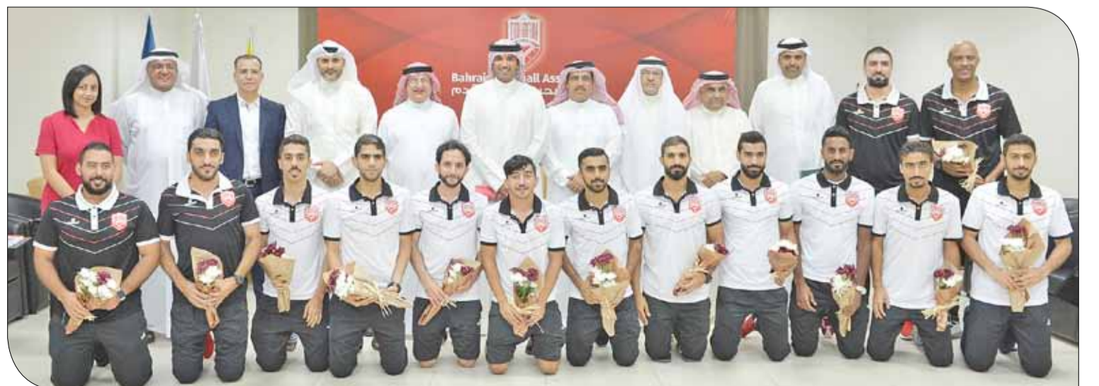
منتخبنا الوطني لكرة القدم داخل الصالات