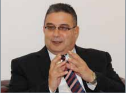
• رئيس جامعة العلوم التطبيقية