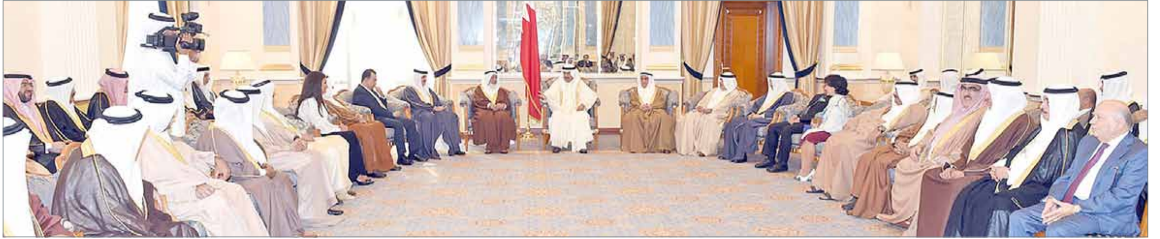
• سمو رئيس الوزراء مستقبلاً عدداً من أفراد العائلة المالكة الكريمة وكبار المسؤولين وعدداً من المواطنين