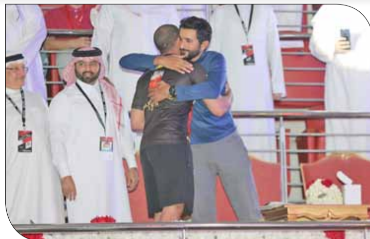
حضور ناصر بن حمد ودعمه للبطولة أحد أهم أسباب نجاحها

من بين 51 دولة مشاركة." وقال سمو الشيخ خالد بن حمد آل خليفة "أشعر بالفخر الاعتراف وبسعادة غامرة بهذه النتيجة غير المسبوقة التي حققتها رياضة فنون القتال المختلطة والتي تحققت عن طريق المقاتلان حمزة محمود ومرضى طلحة علي والتي ضمننت للبحرين تسجيل اسمها بأحرف من ذهب في السجل التاريخي في رياضة فنون القتال المختلطة وهذا ما يدعنا نحو بذل المزيد من الجهد لتحقيق مثل هذه النتائج المشرفة التي تعزز من موقع البحرين على خارطة الرياضة العالمية".