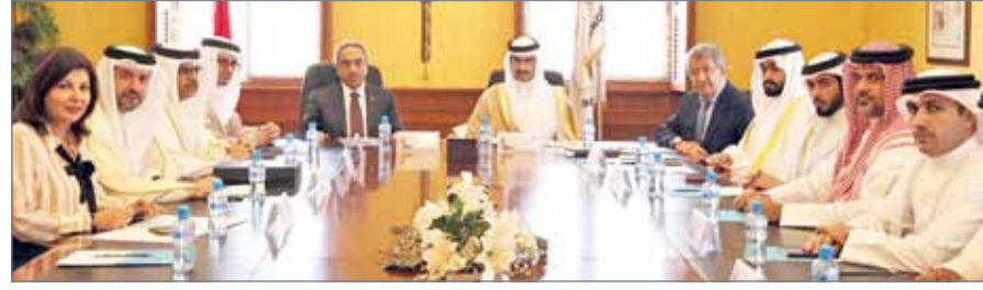
• سمو محافظ الجنوبية مستقبلاً وزير الأشغال

البلديات والتخطيط العمراني آلية توحيد الجهود لتنفيذ أولوية احتياجات الأهالي وفق الميزانيات المعتمدة لذلك مع وضع التصورات والخطط البديلة مصحوبة بالفترة الزمنية المتوقعة لإنجاز تلك الاحتياجات. من جانبه أعرب وزير الأشغال والبلديات والتخطيط العمراني عن شكره وتقديره للتعاون والجهود التي يقوم بها سمو محافظ المحافظة الجنوبية في رصد ومتابعة احتياجات المواطنين وسعي سموه لارتقاء بالخدمات والمشاريع المقامة بالمحافظة مشمناً المبادرات الرائدة التي تضمنتها رؤية المحافظة الجنوبية لتطوير البنية التحتية والمرافق العامة.