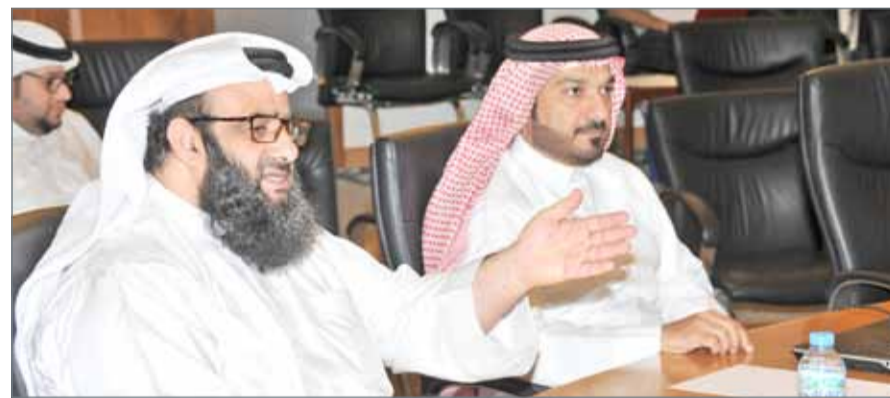
• المحرق بحجمها لا يوجد بها مسلخ

أرض لإقامة مسلخ وحظائر لبيع المواشي بمنطقة شمال الحد الصناعية بمحافظة المحرق. وذكر فيما يتعلق بموقع الحظائر، أن الوزارة وبالتنسيق مع الجهات المعنية تعمل على تخصيص موقع مناسب بعيد عن المناطق السكنية.