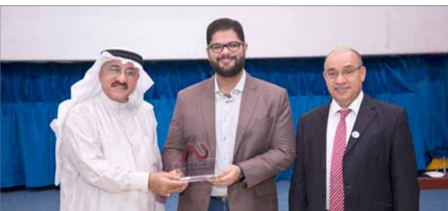
• أكد الحواج أهمية افتتاح الشباب الجامعي على مجال ريادة الأعمال

ناجحة في ريادة الأعمال، بالإضافة إلى مشاريع طلابية مميزة لمؤسسات صغيرة أو متوسطة بأفكار مبتكرة وخلاقة.