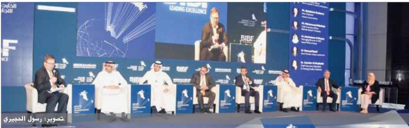
● جانب من الجلسة الافتتاحية للمنتدى

وتقام ضمن فعاليات المنتدى جلسات نقاشية تركز على المواضيع المهمة التي تناول