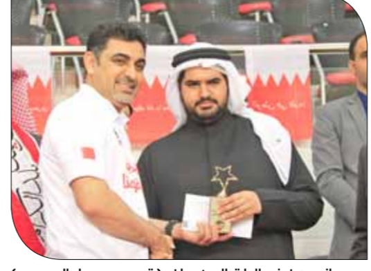
جانب من فعاليات المهرجان