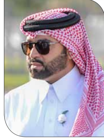
سمو الشيخ فيصل بن راشد

الفرسان لمعرفة ما وصلت إليه قدراتهم وقدرات جيادهم إضافة إلى تأكيد قوتهم وجدارتهم بتعزيز الانجازات التي تحققت في المشاركات الماضية.