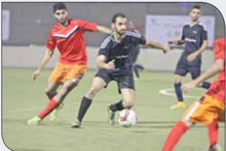
من لقاء أبوصبيح وسلما باد