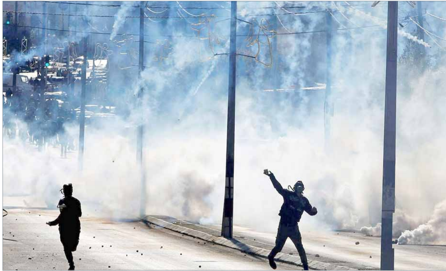
اندلاع مواجهات عنيفة بين المتظاهرين الفلسطينيين وقوات الاحتلال في جمعة الغضب (رويترز)

وافق قادة الاتحاد الأوروبي، الخميس، على تمديد العقوبات الاقتصادية المفروضة من التكتل على روسيا بسبب ضمها شبه جزيرة القرم ودعم موسكو للانفصاليين في شرق أوكرانيا 6 أشهر إضافية. وكان من المقرر قبل الموافقة على التمديد أن تنتهي العقوبات بنهاية يناير 2018. وتستهدف تلك العقوبات القطاع المالي وكذلك قطاعا الطاقة والدفاع. وقال رئيس المجلس الأوروبي دونالد توسك، الذي يرأس قمة قادة الاتحاد الأوروبي التي تعقد في بروكسل، الخميس والجمعة، إن الدول الأعضاء "تبنيت موقفا موحدا بشأن تمديد العقوبات الاقتصادية على روسيا".