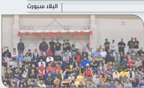
جانب من الجماهير

وأكد اتحاد السلة أن حضور أعداد كبيرة من جماهير كرة السلة البحرينية لهو محل اعتزاز وتقدير ويؤكد مدى الولاء للوطن والقيادة الذي يتحلى به الجمهور السلاي، وامتثال جنباة بأعداد كبيرة من الجماهير، كما المنصة الرئيسية، وحرصت اللجنة المنظمة على إشراك الجماهير في الجوائز المقدمة. وكانت الجماهير تشجع اللعبة الجميلة خلال الاحتفالية وسط حضور كبير من الجاليات التي حرصت على المشاركة في هذه الاحتفالية الوطنية.