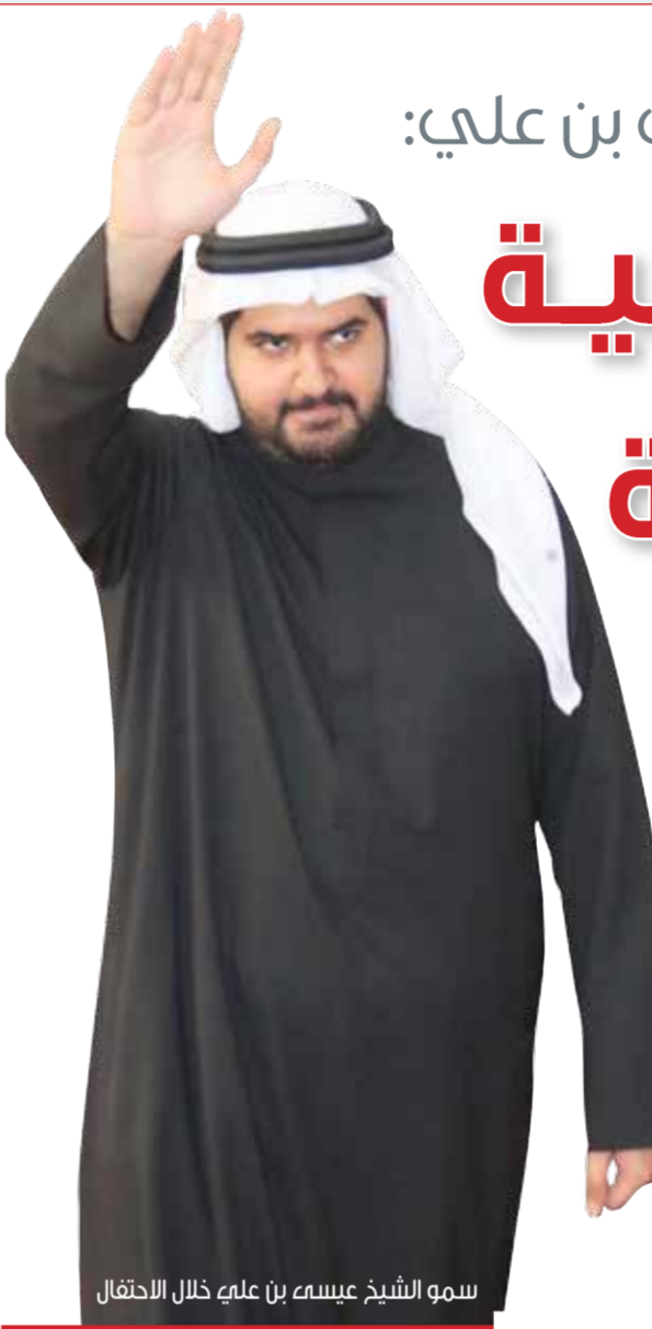
سمو الشيخ عيسى بن علي خلال الاحتفال

ولفت سموه إلى أن مملكة البحرين تعيش الفرحة الوطنية وسط العديد من الإنجازات والنجاحات على جميع الأصعدة، ولاسيما الرياضية منها والتي نالت جزءاً كبيراً من التميز في هذا العهد الزاهر للمملكة. وأكد سمو الشيخ عيسى بن سعود الوالد للقيادة الرشيدة، واهله وأن يديم نعمة الأمن والأمان وأن نعم المملكة بالمرزيد من الفرحة والتطور والرفق والأزدهار.