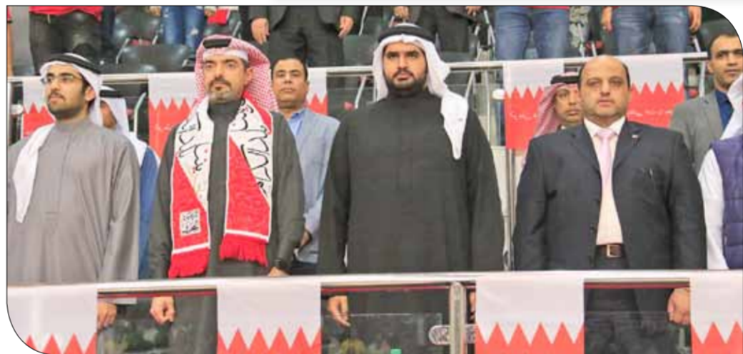
سمو الشيخ عيسى بن علي خلال عيادته الكريمة للمهرجان

وضمن فعاليات مهرجان كل النجوم، أقيمت مسابقة الرميات الثلاثية والكبس على الحلق "الدانك" للاعبين المحليين وأعضاء مواقع التواصل الاجتماعي المهمة بتغطية أحداث كرة السلة. النجوم التي شارك بها نخبة من لاعبي الفرق المحليين والمحترفين إذ تقيم اللجنة الأولمبية البحرينية بالتعاون مع الاتحاد البحريني لكرة السلة بطولة "3 أو 3" للمجل 22 ديسمبر الجاري.