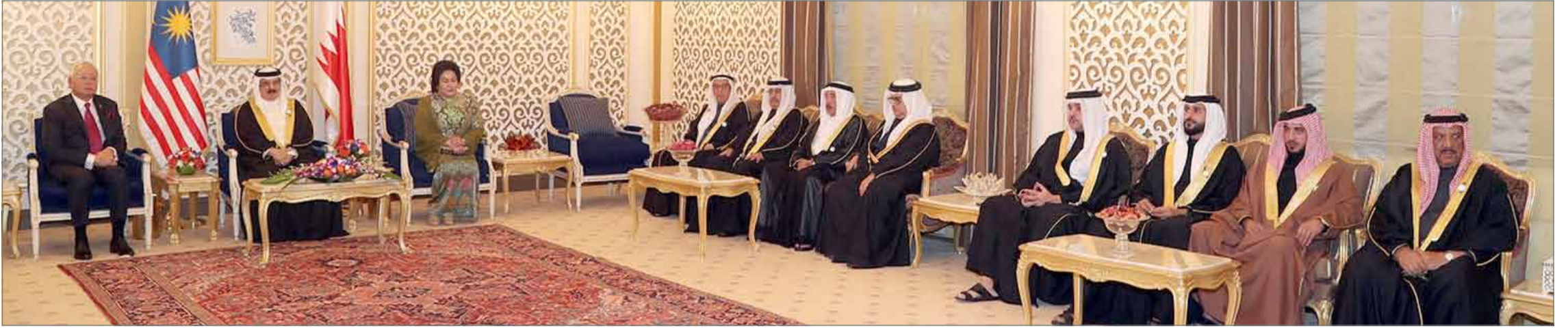
• جلالة الملك يعقد اجتماعاً مع رئيس الوزراء الماليزي