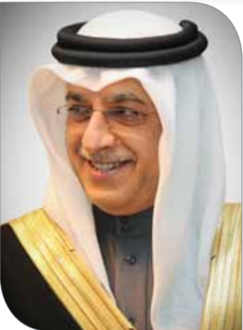
سلمان بن إبراهيم

الوطن الغالي وقيادته الرشيدة، منها بالمنجزات الحضارية التي تحققت للمملكة في ظل العهد الزاهر لعاهل البلاد صاحب الجلالة الملك حمد بن عيسى آل خليفة، والتي جاءت انسجاماً مع الرؤى الثاقبة لجلالته والداعية إلى الارتقاء بمختلف إركان مسيرة التنمية في المملكة وتعزيز مكانة البحرين على الساحة الدولية. وأضاف: أننا نفخر اليوم بما وصلت إليه المملكة من تقدم وإزدهار، بفضل رعاية جلالته الملك المفدى لكافة أركان منظومة التنمية، والدعم اللامحدود من القيادة الرشيدة والتفاف الشعب البحريني حولها على مر السنين. وقال الأمين العام للمجلس الأعلى للشباب والرياضة أن الأعياد الوطنية تمثل على الدوام رمزا لتجديد الولاء لهذا