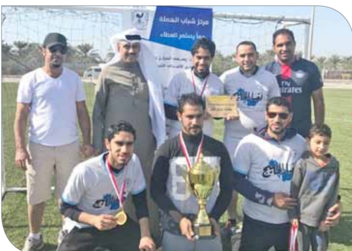
تتويج بطل السداسيات