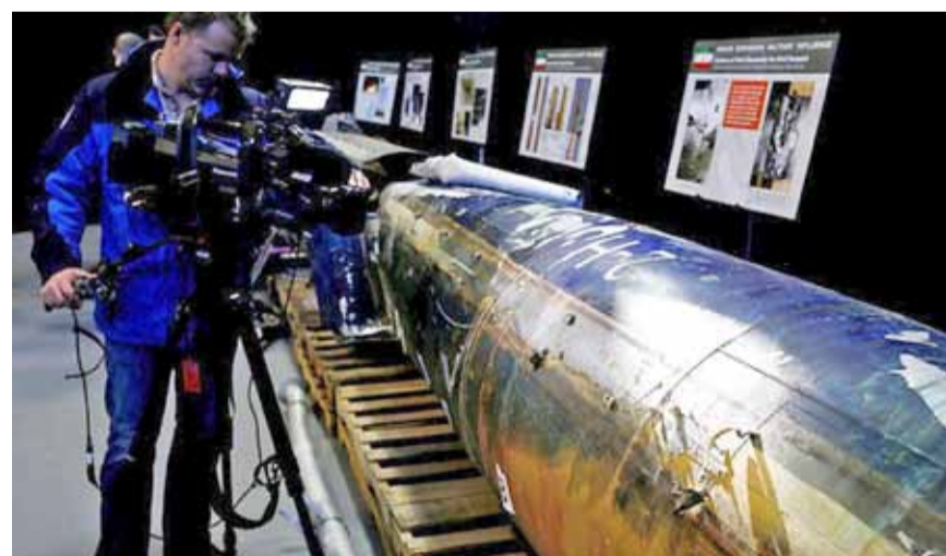
صور قدمتها أميركا في الأمم المتحدة تدين إيران

إجراءات فورية لتنفيذ قرارات مجلس الأمن ومحاسبة النظام الإيراني على أعماله العدوانية. أما مملكة البحرين فقد جددت إدانتها للتدخلات الإيرانية المستمرة في شؤونها الداخلية كتدريب الإرهابيين وتهريب الأسلحة والمتفجرات وتأسيس جماعات إرهابية. بدورها دعت دولة الإمارات المجتمع الدولي إلى التصدي بقوة أكبر للتهديد الذي تشكله إيران، مؤكدة استعدادها للعمل مع حلفائها لاتخاذ إجراءات تكفل الامتثال لقرارات الأمم المتحدة. كذلك، رحبت الحكومة اليمنية من جانبها بتقرير الأمين العام للأمم المتحدة والذي يتهم إيران بدعم الميليشيات الحوثية، التي قامت بتدمير مؤسسات الدولة ونهب مقدرات الشعب اليمني. توالت مساء الخميس ردود الفعل المؤيدة لتقرير الأمين العام للأمم المتحدة، الذي يدين تسليح إيران للميليشيات الحوثية، كما رحبت عدة دول عربية بتصريحات المندوبة الأميركية لدى الأمم المتحدة، نيكي هيلي، الخميس، والتي اتهمت إيران بتزويد وكلائها في المنطقة بالأسلحة الخطيرة، مقدمة الإثباتات والصور. ورحبت كل من السعودية والإمارات والبحرين واليمن بتقرير الأمين العام للأمم المتحدة أنطونيو غوتيريس وتصريحات هيلي حول التدخلات الإيرانية في المنطقة. فأكدت السعودية أن تدخلات إيران ودعمها لميليشيات الحوثي تهدد أمن واستقرار المملكة والمنطقة، مطالبة المجتمع الدولي بضرورة اتخاذ