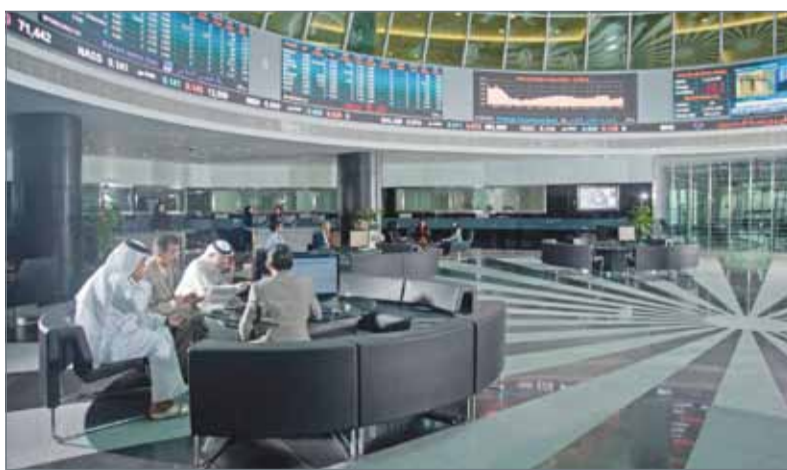
متداولون في بورصة البحرين (أرشيفية)

وبالعودة إلى معدلات التداول خلال 5 أيام عمل، نجد أن المتوسط اليومي لقيمة الأسهم والسندات المتداولة بلغ 578 ألفاً و438 ديناراً، في حين كان المتوسط اليومي لكمية الأسهم ووحدات الصناديق الاستثمارية العقارية المتداولة مليونين و808 آلاف و160 سهماً ووحدة أما متوسط عدد الصفقات خلال الأسبوع فبلغ 66 صفقة.