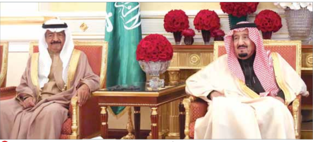
• خادم الحرمين الشريفين في لقاء مع سمو رئيس الوزراء (أرشيفية)

بحرين المستقبل أكثر أمنا وعطاء... سمورئيس الوزراء لـ "اليوم" السعودية: شعارنا التضامن لإبعاد أي تدخل مواقف السعودية علامات مضيئة في تاريخ المنطقة والعالم