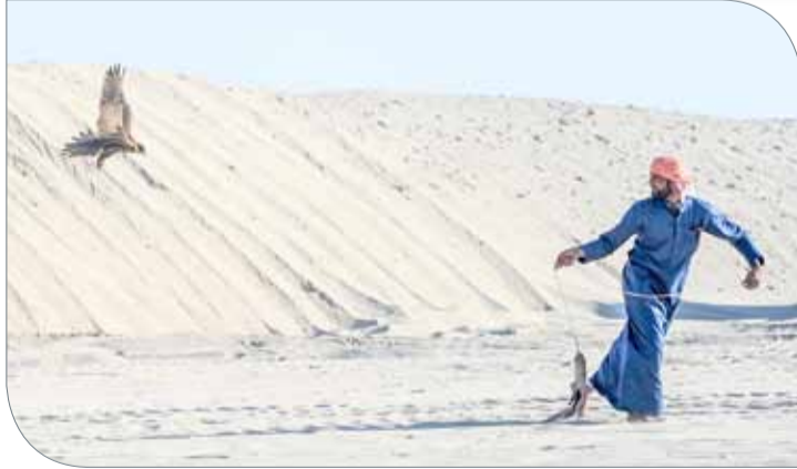
من منافسات الصقور والصيد