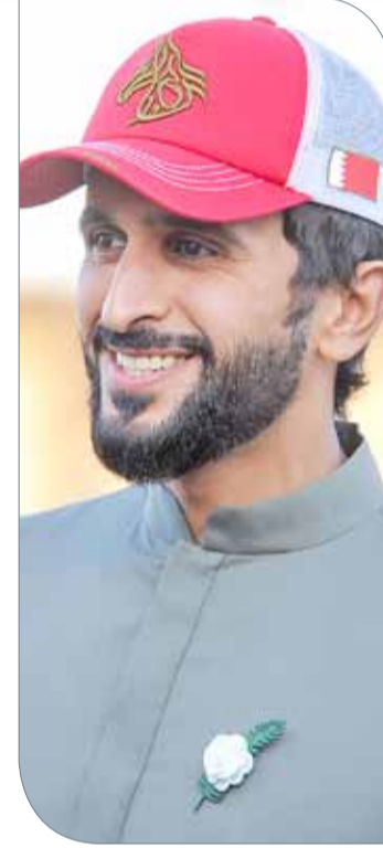
سمو الشيخ ناصر بن حمد

وبحضور رئيس الاتحاد الملكي للفروسية وسباقات القدرة نائب رئيس المجلس الأعلى