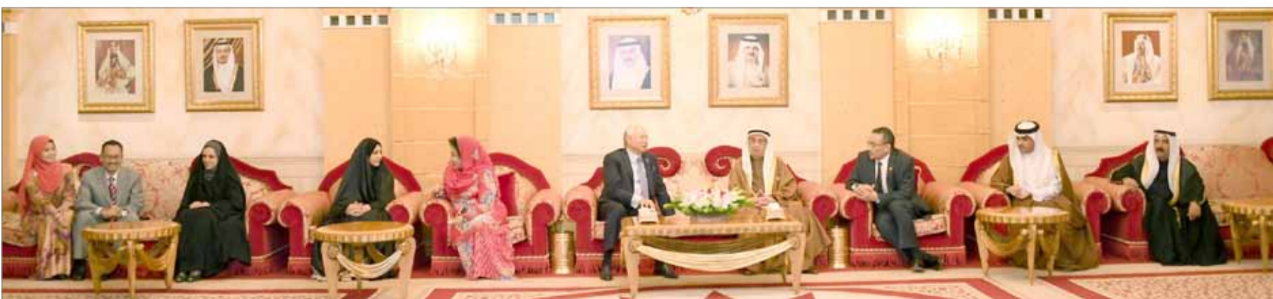
• أثناء الاستقبال

المنامة - بنا: كان نائب رئيس مجلس الوزراء سمو الشيخ محمد بن مبارك آل خليفة في مقدمة مستقبلي رئيس وزراء مملكة ماليزيا الصديقة داتو سري محمد نجيب تون عبدالرزاق لدي وصوله أمس إلى مطار البحرين الدولي، حيث يبدأ زيارة رسمية لمملكة البحرين يجري فيها مباحثات مع كبار المسؤولين تتناول سبل تعزيز علاقات التعاون المتميزة بين البلدين الصديقين في كل المجالات. كما كان في الاستقبال سمو الشيخة زين بنت خالد آل خليفة ووزير المواصلات والاتصالات رئيس بعثة الشرف كمال أحمد، ونائب محافظ المحرق زهير العسبي وعدد من كبار الضباط والمسؤولين.