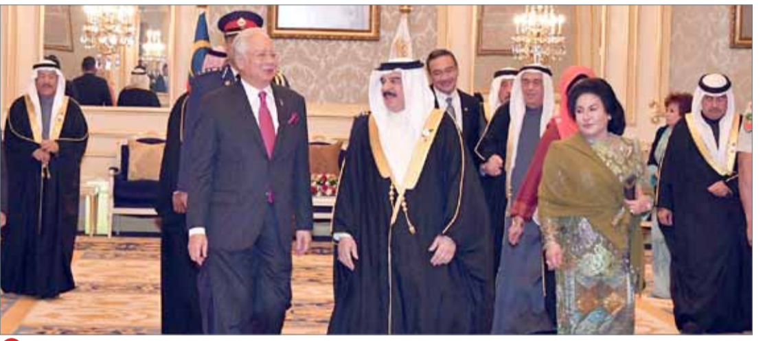
• جلالة الملك يعقد اجتماعا مع رئيس الوزراء الماليزي

في جلسة مباحثات ثنائية... جلالة الملك ورئيس الوزراء الماليزي: تعزيز التعاون الاقتصادي والسياحي الاستفادة من خبرات البلدين في دعم المشاريع المشتركة