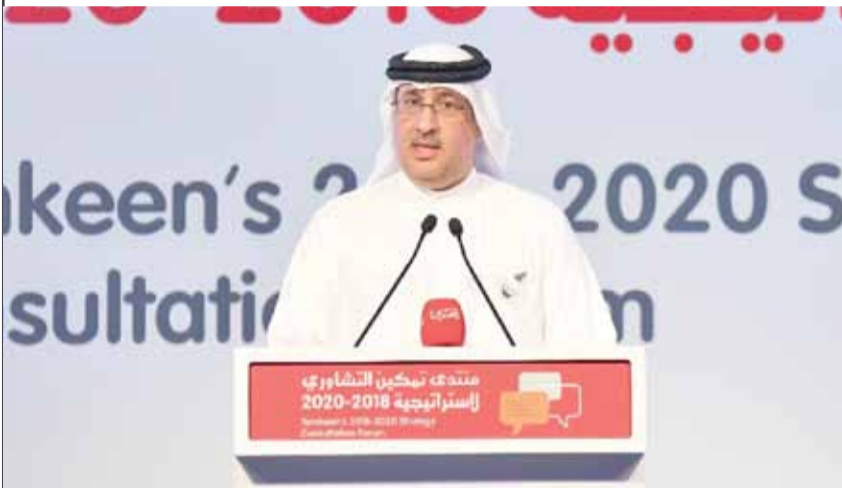
الشيخ محمد بن عيسى متحدثاً في المنتدى

التي بحوزتنا بطريقة مثالية، بالتعاون مع الأفراد والمؤسسات المستفيدة، نحن ندعم ونخدم الخدمات وعلى المواطن وصاحب العمل بذل الجهد لتحقيق النجاح، فنحن بالنهية لسنا جمعية خيرية.