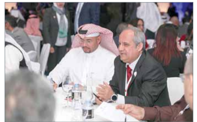
من فعاليات منتدى "تمكين" التشاوري