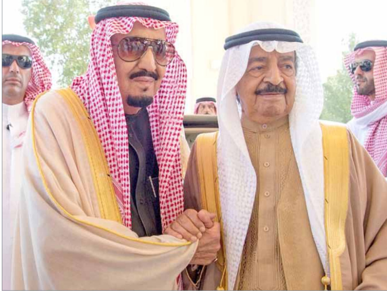
● خادم الحرمين الشريفين في لقاء مع سمو رئيس الوزراء (أرشيفية)

أكد رئيس الوزراء صاحب السمو الملكي الأمير خليفة بن سلمان آل خليفة أن مملكة البحرين وهي تحتفل هذه الأيام بذكرى العيد الوطني المجيد وعيد جلوس عاهل البلاد صاحب الجلالة الملك حمد بن عيسى آل خليفة تعمل من أجل مستقبل أكثر ازدهاراً وتحقيق منجزات جديدة تضاف إلى المكتسبات العديدة التي تحققت في مختلف المجالات.