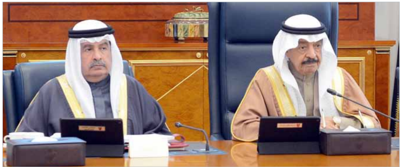
• سمو رئيس الوزراء مترئسا جلسة مجلس الوزراء

البلاد محرر الشؤون المحلية تفاعلاً مع ما نشرته صحيفة "البلاد"، كلف رئيس الوزراء صاحب السمو الملكي الأمير خليفة بن سلمان آل خليفة وزارة الأشغال وشؤون البلديات والتخطيط العمراني بمتابعة احتياجات الصيادين في أم الحصم بشأن تأمين الحراسة على المرفأ وتوفيرها. كما كلف سموه ذات الوزارة بالتحقق واتخاذ ما يلزم من إجراءات بشأن شكوى أهالي الصالحية حول إقامة بعض الأنشطة التي تخالف ما خصصت له الأراضي فيها وما يترتب عليها من أضرار بيئية وصحية. وترأس صاحب السمو الملكي رئيس الوزراء الجلسة الاعتيادية الأسبوعية لمجلس الوزراء بقصر القضيبيّة أمس، إلى ذلك، أشاد مجلس الوزراء بالأمر