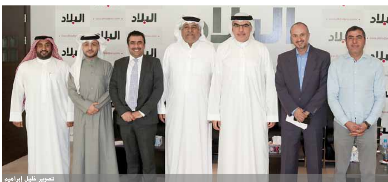
تصوير خليل إبراهيم