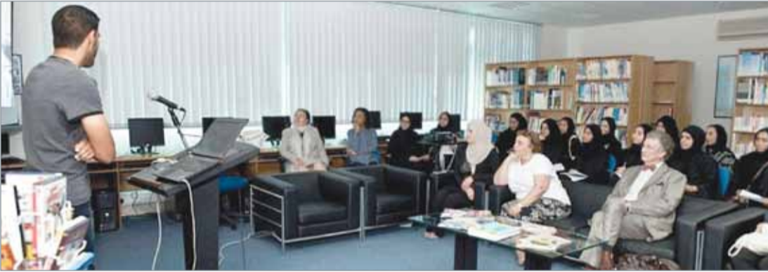
• نشاط طلابي لتلاميذ اللغة الفرنسية