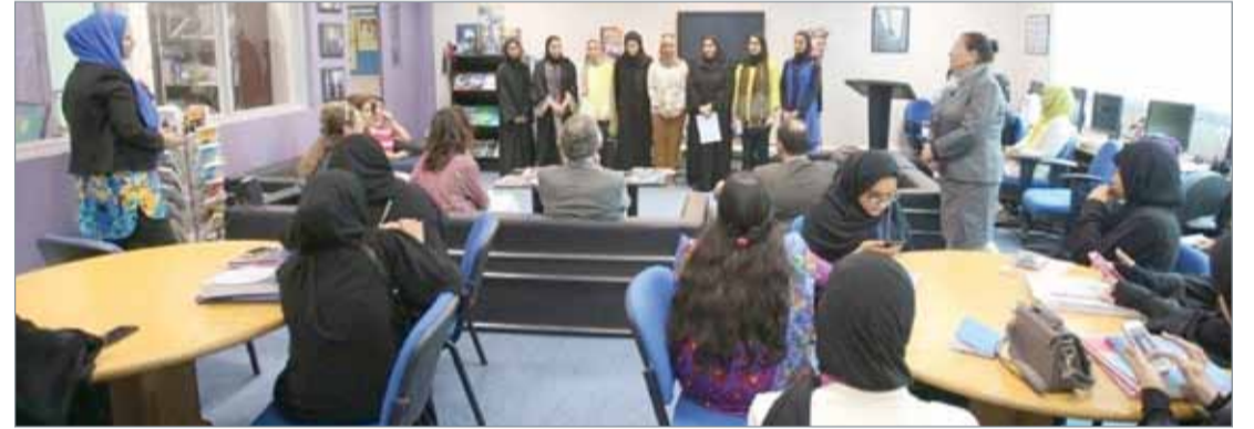
• حصة دراسية لطلبة مركز الدراسات اللغة الفرنسية

فرنسا في الصيف الماضي. وقدمت إحدى الطالبات نيابة عن طالبات المجموعة كلمة باللغة الفرنسية شكرت فيها الجامعة والسفارة الفرنسية على إتاحة الفرصة لمنهج للدراسة لمدة شهر واحد في فرنسا، وذكرت النتائج ومدى الاستفادة التي تحققت من المشاركة، ويشترك المركز كذلك بفعالية في الاحتفال بالمناسبات الوطنية التي تقيمها الجامعة.