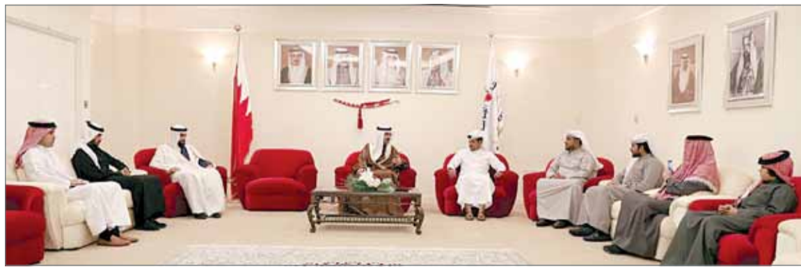
• سمو الشيخ خليفة بن علي مستقبلاً الفائزين في المسابقة الشعرية

مشاركة أفضل طفل، فكانت من نصيب الطفل عبدالرحمن السبيعي. من جانبهم، تقدم الشعراء الفائزين بالمسابقة بالشكر لمحافظ المحافظة الجنوبية سمو الشيخ خليفة بن علي آل خليفة على رعايته للمسابقة، متمنين اهتمام سموه بالموروث الأدبي وشعراء المحافظة.