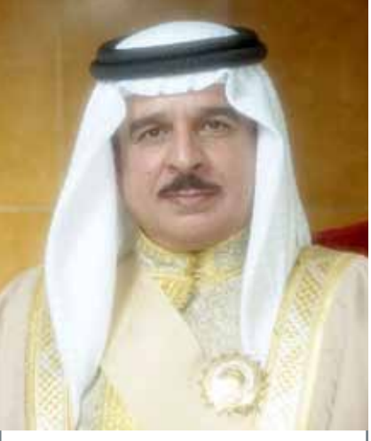
• جلالة الملك