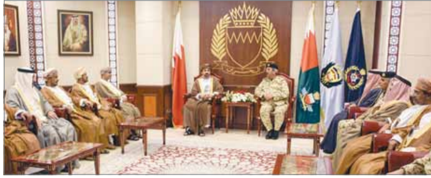
القائد العام مستقبلاً الوفد العماني