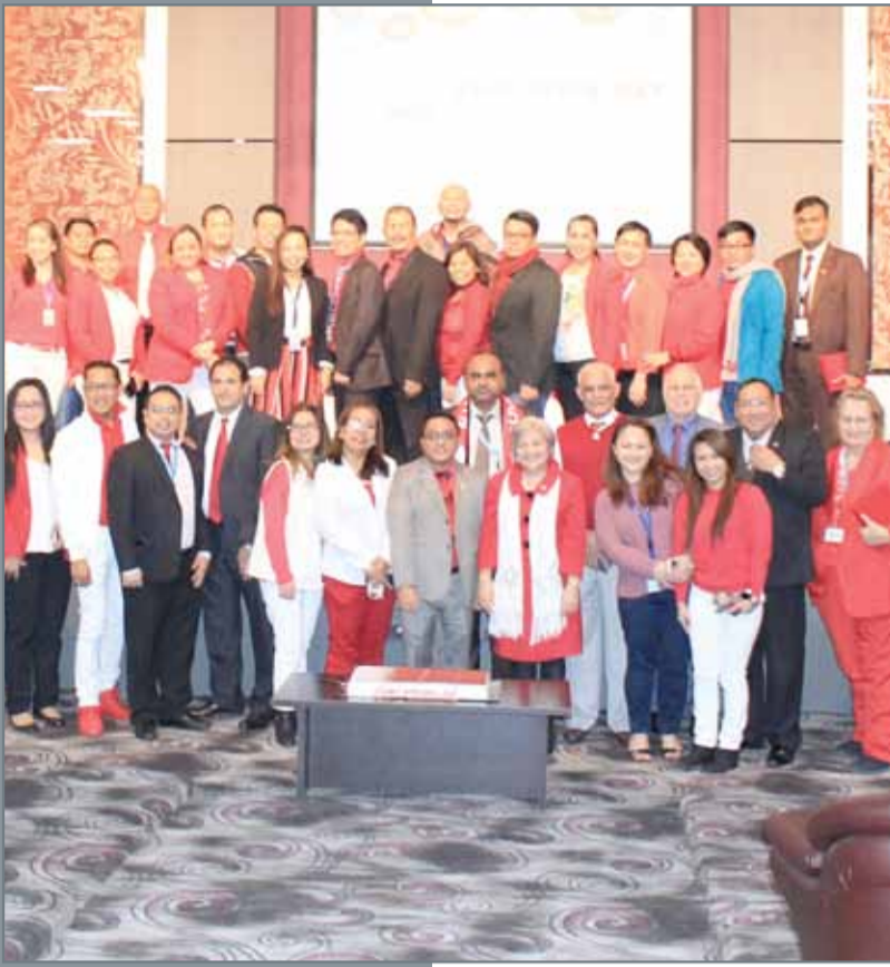
• احتفلت جامعة ”أما“ الدولية بمملكة البحرين بالعيد الوطني إيماناً من الجامعة بدور مؤسسات التعليم العالي في تعميق الحس الوطني وترسيخ مبادئ التسامح والتعايش والوحدة

كارديف متر وبوليتان في تخصصات دراسات الأعمال والإدارة، والمحاسبة والتمويل، داعياً الطلبة إلى الإسراع بالتسجيل لاختيار التخصص الذي يناسبهم ويناسب ميولهم ورغباتهم ويرغبون في دراسته. ودعا رئيس الجامعة كافة الطلبة إلى زيارة موقع الجامعة الإلكتروني عبر شبكة الإنترنت WWW.ASU.EDU.BH للإطلاع على المزيد من المعلومات. وأوضح عواد أن الجامعة حريصة على طرح برامج أكاديمية متميزة تساعد الطلبة للحصول على الفرص المناسبة لمواجهة التحديات الجديدة في ظل التطور التكنولوجي.