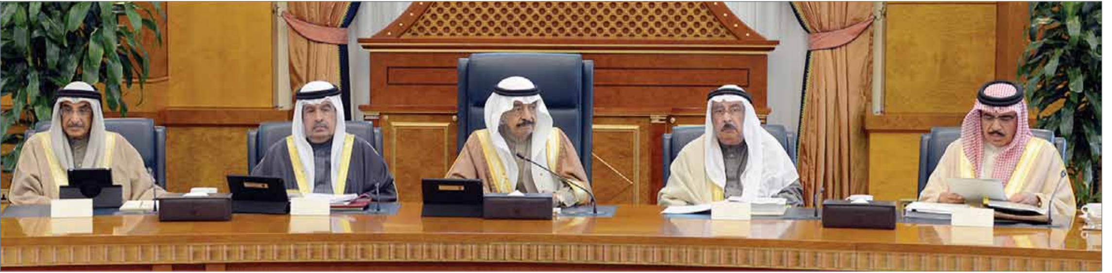
• سمو رئيس الوزراء مترأساً جلسة مجلس الوزراء

استبدال الأكياس البلاستيكية لتكون صديقة للبيئة... سمو رئيس الوزراء يواجه: