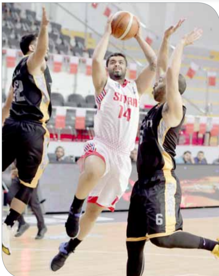
من لقاء الأهلي وسترة

استعاد الأهلي موقعه في صدارة ترتيب دوري زين لكرة السلة، بفوزه على سترة، بنتيجة 76 مقابل 55، في اللقاء الذي جمعهما مساء أمس، في ختام مواجهات الجولة 16 من الدور التمهيدي للدوري. ورفع الأهلي رصيده إلى 28 نقطة في صدارة الترتيب العام، فيما واصل سترة نتائجه المتهترة وأصبح رصيده إلى 18 نقطة في المركز العاشر.