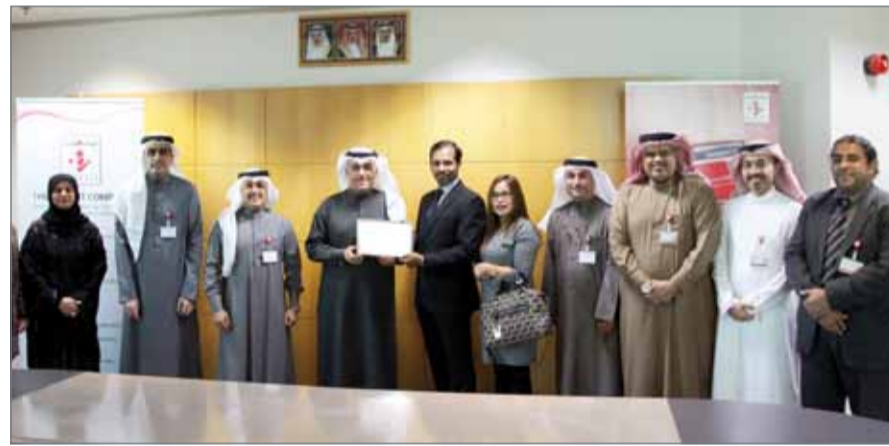
• الرئيس التنفيذي لشركة "بنفت" متسلماً الشهادة

الأقسام المعنية التي لم تدخر جهداً للحفاظ على بيانات بطاقات الدفع الخاصة بالمستهلكين مما توج بالاعتراف بإمتثال الشركة بأعلى المعايير الدولية المختصة. كانت شركة بنفت قد أطلقت مؤخرًا خدمة - Benefi Pay المعنية بالدفع عن طريق محفظة إلكترونية عبر تطبيق للمواثف النقالة وتعزز إضافة أدوات دفع جديدة لها قريباً بالإضافة لكون شركة بنفت تضطلع بإدارة شبكة أجهزة الصراف الآلي وشبكة نقاط البيع في البحرين وتقدم خدمات بوابة الدفع الإلكتروني وتوصيل المدفوعات وتدير الشبكة الخليجية لأجهزة الصراف الآلي ونقاط البيع بالإضافة لإدارة المطالبات للشبكة الخليجية والمطالبات لشبكة البحرين (بنفت) وغيرها من الخدمات المالية الإلكترونية.