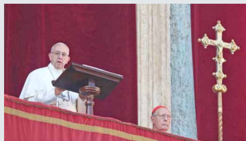
• البابا فرنسيس يتحدث من الشرفة المطلة على ساحة القديس بيتر بالفاتيكان

وهذه هي المرة الثانية التي يتحدث فيها البابا علانية عن القدس منذ قرار ترامب في السادس من ديسمبر. وفي ذلك اليوم دعا فرنسيس إلى احترام "الوضع القائم" للمدينة خشية أن تؤدي التوترات في الشرق الأوسط إلى إشعال مزيد من الصراعات في العالم.