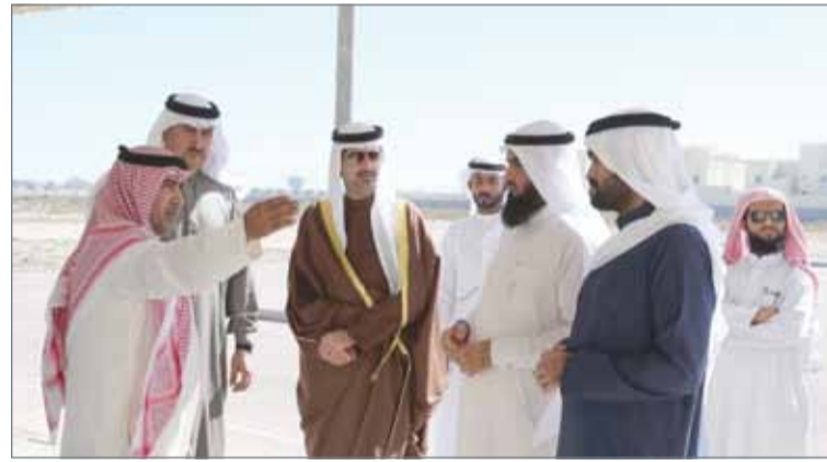
• سمو الشيخ خليفة بن علي في زيارة تفقدية للزلاق

من أهالي الزلاق طلباً لسموه للتطوير والارتقاء بالمنطقة، حيث بين سموه خلال الزيارة حرصه الشديد في متابعته لتنفيذ احتياجات وطلبات الأهالي بالشكل الذي يحقق التطوير والاستدامة الهادفة بالتعاون والتنسيق مع الجهات المعنية، مؤكداً سموه في هذا السياق اهتمامه البالغ لكافة احتياجات أهالي مناطق المحافظة الجنوبية، والتأكد على مراحل تنفيذها وفق الخطة الزمنية المعتمدة والميزانية المرصودة لدى الوزارات والمؤسسات.