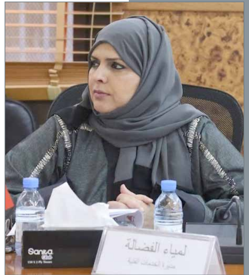
• كرم المجلس البلدي مدير إدارة الشؤون البلدية بالمنطقة الشمالية لمياه الفضالة بمناسبة تيلها وسام الكفاءة من لدن جلالة الملك

كشفت إحصائية مجلس بلدي المنطقة الشمالية أن وزارة الأشغال وشؤون البلديات والتخطيط العمراني أنهت طلبين فقط من طلبات الترميم المعتمدة للعام 2017 في المحافظة الشمالية، وهو الأمر الذي يخالف الدليل الاسترشادي للوزارة بتفويض الطلبات من 70 إلى 90 طلبا سنويا. وأوصت لجنة الخدمات بمخاطبة وزير الأشغال وشؤون البلديات والتخطيط العمراني عصام خلف للاستفسار عن أسباب عدم الالتزام بتفويض أي طلب في المناقصات الرمنية منذ شهر يوليو 2017 لحد الآن، إلى