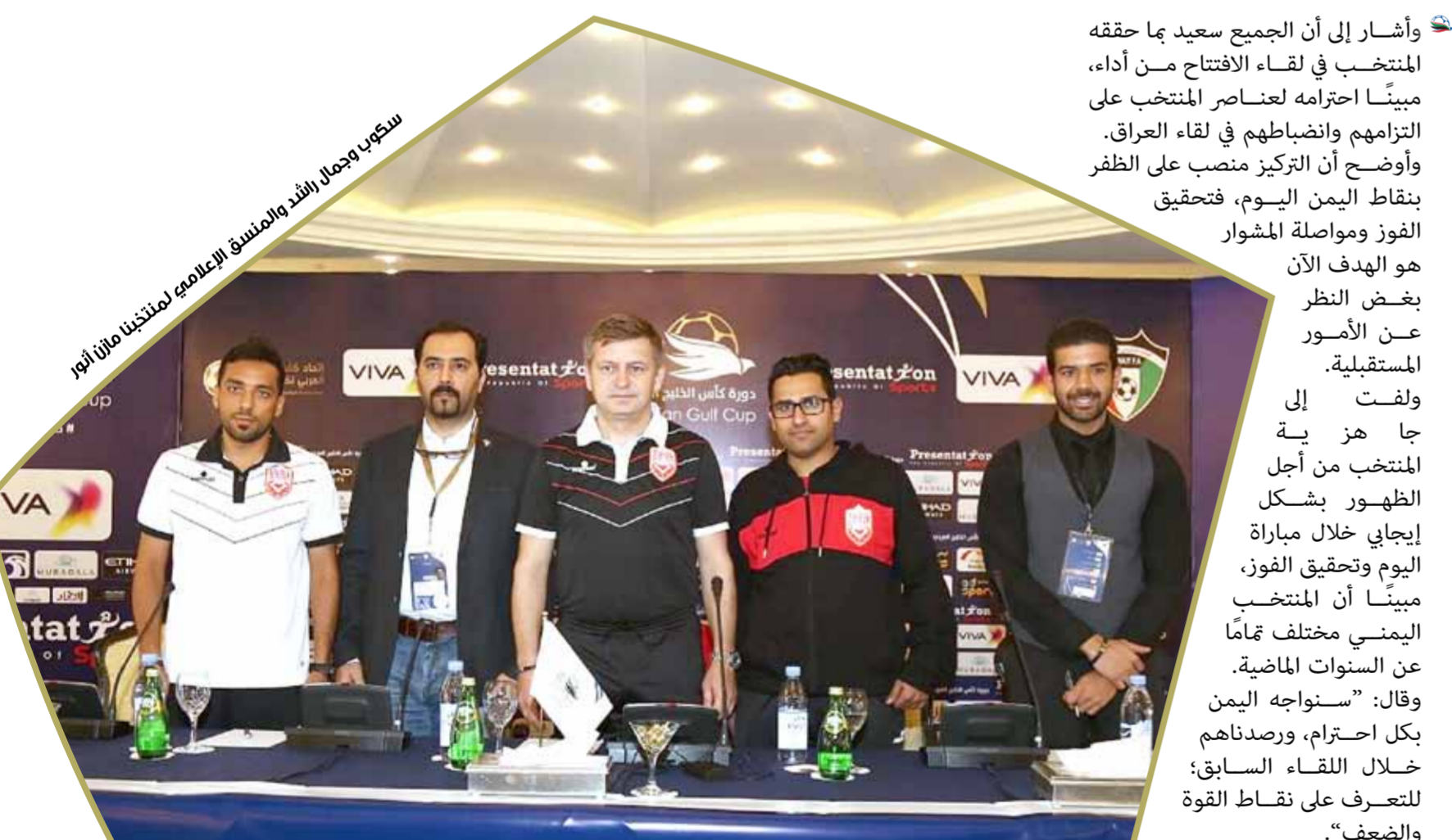
سكوب يجلس بجانب اللاعبين المنتخبين أثناء المؤتمر الصحفي

أكد المدرب التشيكي لمنتخبنا ميروسلاف سكوب أن "الأحمر" سيدخل لقاء اليوم بتركيز كبير وكامل على المباراة فقط لا غير. ولفت خلال المؤتمر للمباراة إلى أن المنتخب لا يفكر بعيداً في الدورة خلال هذه الأثناء، بل يسير خطوة بخطوة، مع النظر إلى كل مباراة على حدة والتركيز بشكل كبير على لقاء اليمن.