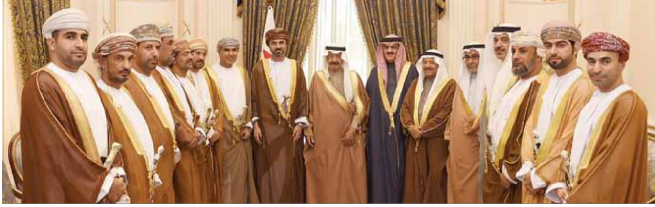
• سمو رئيس الوزراء مستقبلاً رئيس مجلس الشورى العماني

وأكد أن العلاقات بين مملكة البحرين وسلطنة عمان تشهد تطوراً مستمراً في مختلف المجالات ارتكازاً على علاقات المحبة والمودة التي تربط بين قيادتي وشعبي البلدين، مشيداً بعمق علاقات التعاون بين البلدين في مختلف المجالات، والتي تعكس خصوصية العلاقات بين البلدين الشقيقين وتميزها، متمنياً لمملكة البحرين وشعبها دوام الرفعة والتقدم والازدهار.