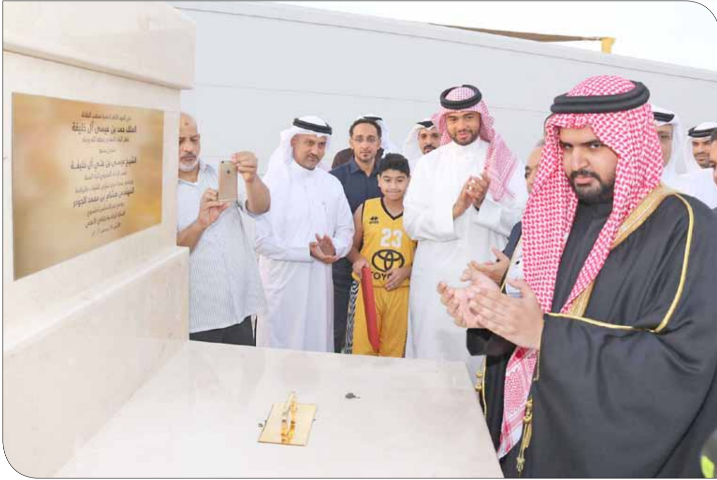
سمو الشيخ عيسى بن علي يضع حجر الأساس لصالة الأهلي

وأشاد وزير شؤون الشباب والرياضة بمبادرة مجموعة دادباي وحرصها على تشييد الصالة الرياضية للنادي الأهلي، مشيراً أن هذه الصالة تؤكد الارتباط الوثيق الذي يجمع بين الأندية الوطنية والقطاع الخاص الذي يحرص على تقديم الدعم اللازمة للحركة الشبابية والرياضية البحرينية.