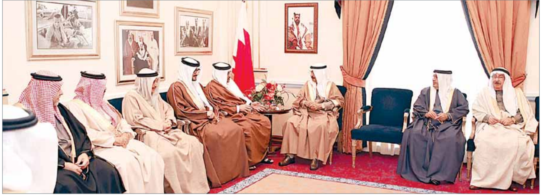
• سمو رئيس الوزراء في لقاء مع سمو نائب جلالة الملك

• تبني مبادرات تكفل الاستغلال الأمثل للطاقة الجديدة والمتجددة