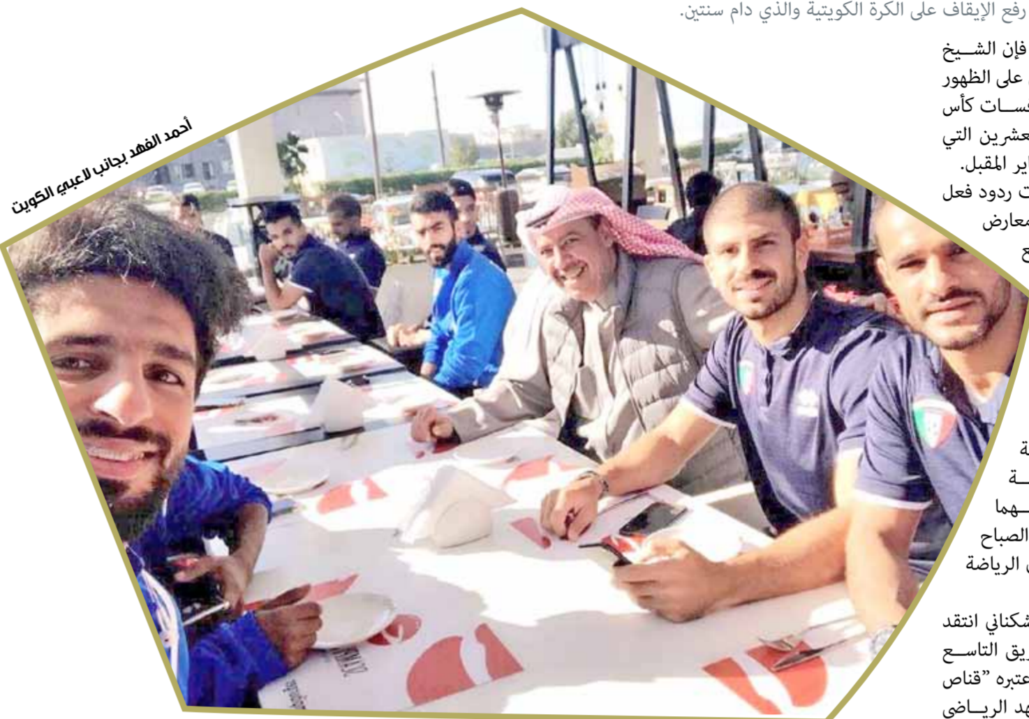
أحمد الفهد يجانب اللاعبين الكويتيين

زار الرئيس السابق للاتحاد الكويتي لكرة القدم، رئيس المجلس الأولمبي الآسيوي الشيخ أحمد الفهد الصباح بعثة منتخب بلاده الكويت بمقر إقامته بالكويت يوم أمس الأول الأحد، واجتمع باللاعبين بحضور نائب رئيس الاتحاد الكويتي الشيخ فواز الصباح، وذلك في أول لقاء للفهد مع المنتخب الكويتي بعد رفع الإيقاف على الكرة الكويتية والذي دام سنتين.