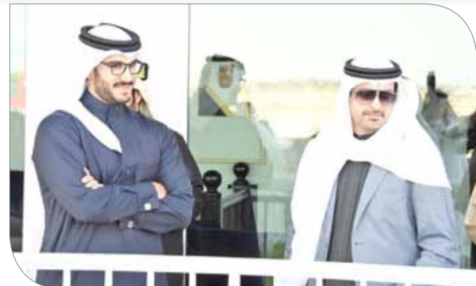
سمو الشيخ خليفة بن علي بجانب سمو الشيخ عيسى بن سلمان

التنفيذي للعمليات بالإناثة بشركة أبا حسن أحمد نور، كما تسلم سموه كأس مصرف السلام للشوط السابع من رئيس الخدمات المصرفية الخاصة بمصرف السلام البحرين علي حبيب قاسم، وذلك بعد فوز الحصانين "شوغن" و"ليد باك روميو" لإسبيل العاديات ريسنج الذي تعود ملكيته لسمو الشيخ عيسى بن سلمان بن حمد آل خليفة بالمركز الأول في الشوطين السادس والسابع، فيما قدم سمو الشيخ خليفة بن علي بن خليفة آل خليفة كأس المحافظة الجنوبية إلى المضمهر الفائز يوسف طاهر، كما قام حسن أحمد أنور بتقديم كأس أبا للشوطين الثاني والخامس إلى سمو الشيخ عيسى بن عبدالله بن عيسى آل خليفة، كما قدم كأس أبا للشوطين الرابع إلى سمو الشيخ سلمان بن محمد بن عيسى آل خليفة.