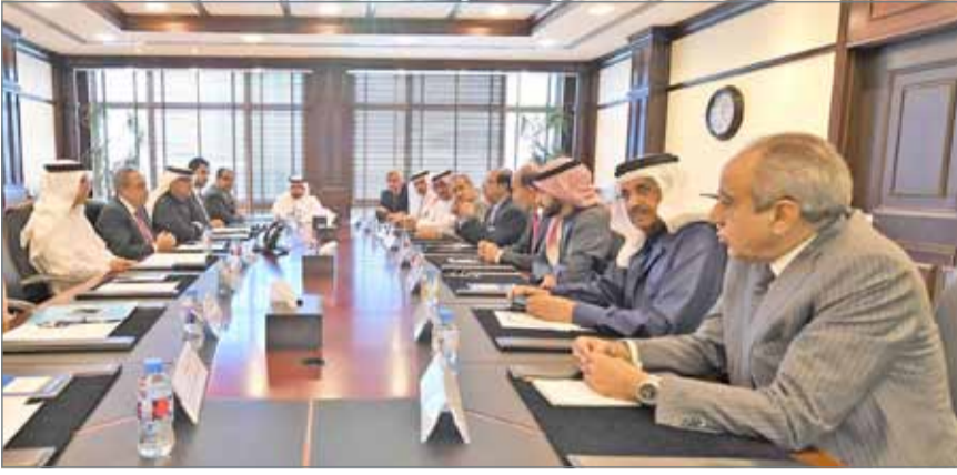
• وزير الأشغال مجتمعاً برئيس وأعضاء لجنة الشؤون المالية والاقتصادية بمجلس الشورى

الوزارة نظام (تواصل) كأداة لتطوير الأداء والخدمات، ونوقشت العديد من إيجابيات تطبيق هذا النظام مما يعكس التواصل القائم بين الوزارة من جهة وبين المواطنين والمقيمين من جهة أخرى.