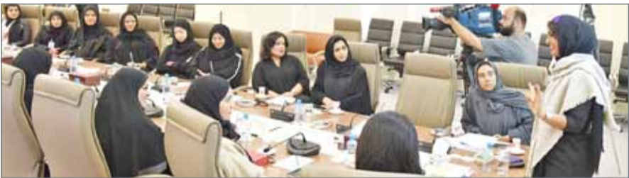
• ورشة تدريبية موجهة بشكل خاص للموظفة البرلمانية

والاختصاصات ذات الطابع التشريعي والرقابي والدبلوماسي تتطلب مهارات وخبرات متخصصة جاء تنظيم هذه الدورة. وتمثلت محاور الورشة في بناء المهارات الشخصية من العمل بروح الفريق الواحد والأداء المميز والتواصل المؤسسي المحلي والدولي.