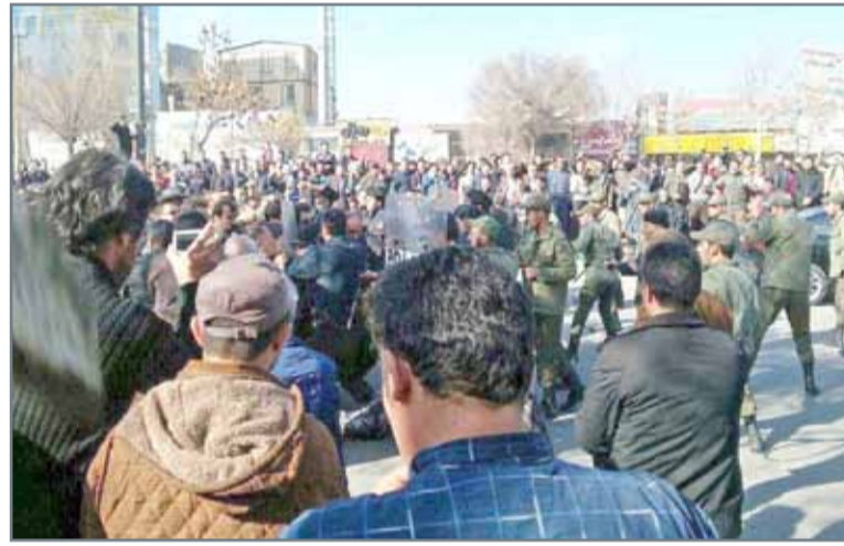
الحرس الثوري ينتشر في أقاليم إيران لقمع الاحتجاجات

عواصم - وكالات: قال مساعد الأمين العام للأمم المتحدة، إن التظاهرات في إيران خرجت للتعبير عن الغضب من التكلفة المرتفعة لتدخلات طهران في شؤون الداخلية لدول المنطقة. وبدأ مجلس الأمن الدولي الجمعة اجتماعاً عن الاحتجاجات الدائمة في إيران، بناء على طلب الولايات المتحدة، بينما شهدت إيران تظاهرات غاضبة أمس في حين ذكرت المعارضة أن ضحايا الاحتجاجات بلغ 50 قتيلًا. وقالت المندوبة الأميركية في مجلس الأمن نيكى هايلي في بيانها أمام المجلس إن الشعب الإيراني انتفض في عشرات المناطق ضد قمع السلطات وإن التظاهرات في إيران تلقائية من دون تدخل خارجي، وذكرت هايلي أن أصوات الشعب الإيراني تسمع الذي يطالب حكومته بوقف دعم الإرهاب بالمليارات ويمول الميليشيات في العراق واليمن النظام، كما يتفق 6 مليارات سنويا على الأقل لدعم الأسد.