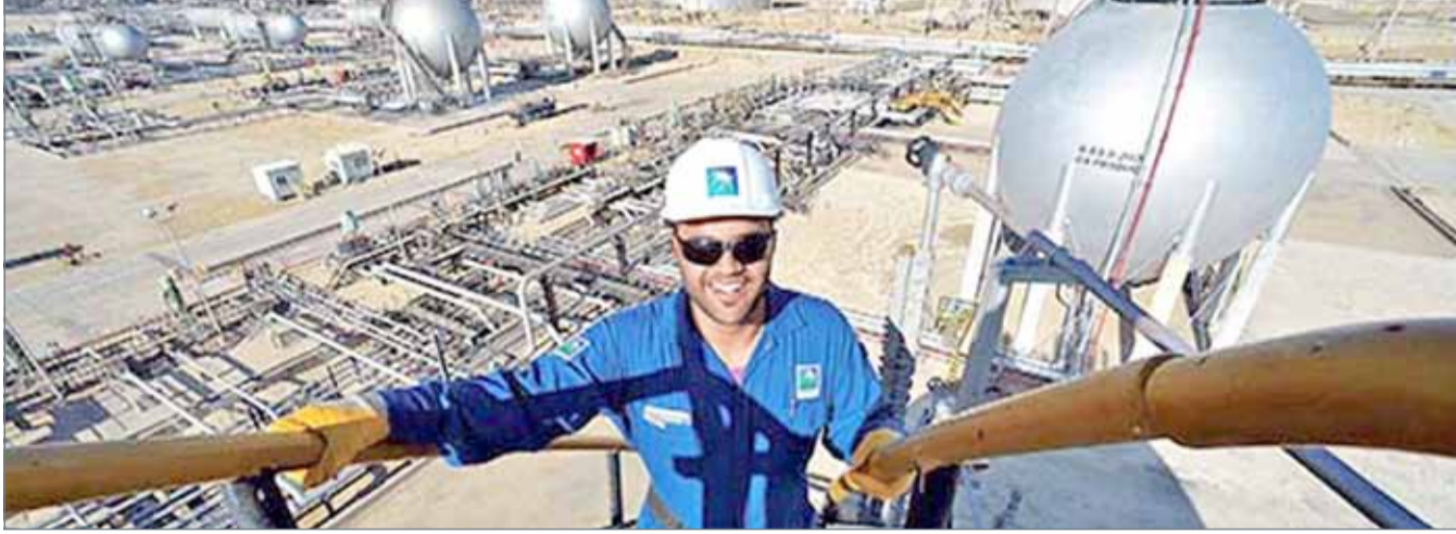
• يتوقع أن يجمع اكتتاب أرامكو نحو 100 مليار دولار

وانفقت أوبك مع منتجي آخرين على تمديد خفض الإنتاج حتى نهاية عام 2018 مع سعيهم لاستكمال التخلص من تخمة المعروض من الخام في الوقت الذي لمحو فيه إلى احتمال الخروج المبكر من الاتفاق إذا احتدمت السوق.