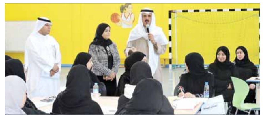
• وزير التربية لدى مشاركته بمداخلة في الورشة التدريبية

حضر وزير التربية والتعليم ماجد النعيمي جانباً من ورشة (التقييم من أجل التعلم) التي نفذتها إدارة الإشراف التربوي بالوزارة في مدرسة الحد الإعدادية للبنات لفائدة عدد من معلمات المدرسة، حيث شارك بمداخلة أكد فيها أن الوزارة تضع تمهين المعلمين ورفع كفاءتهم في مقدمة أولوياتها، ضمن جهودها في تنفيذ برنامج تحسين أداء المدارس. ثم قام الوزير بزيارة مركز التدريب