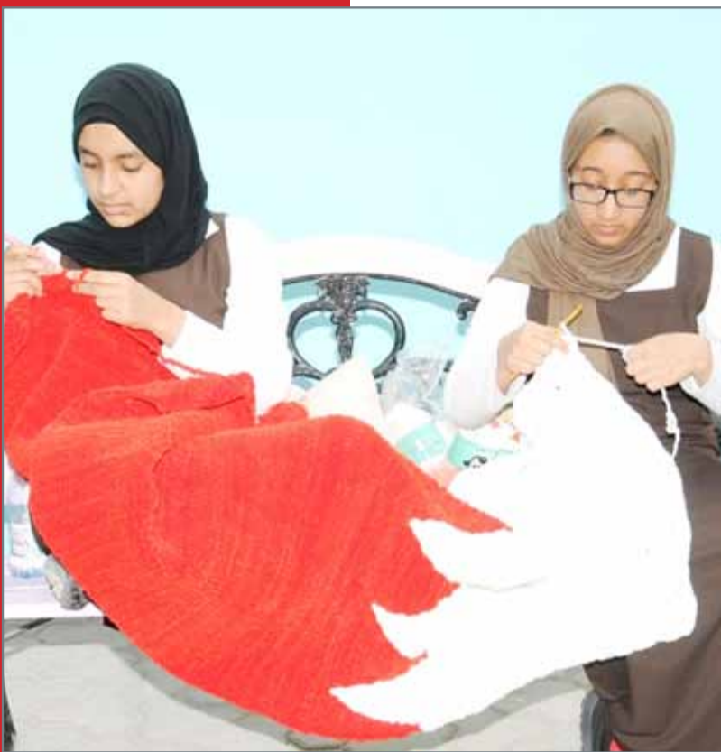
• من أنشطة مدرسة معزة للمواطنة وحقوق الإنسان