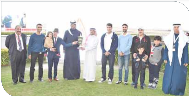
جانب من التتويج