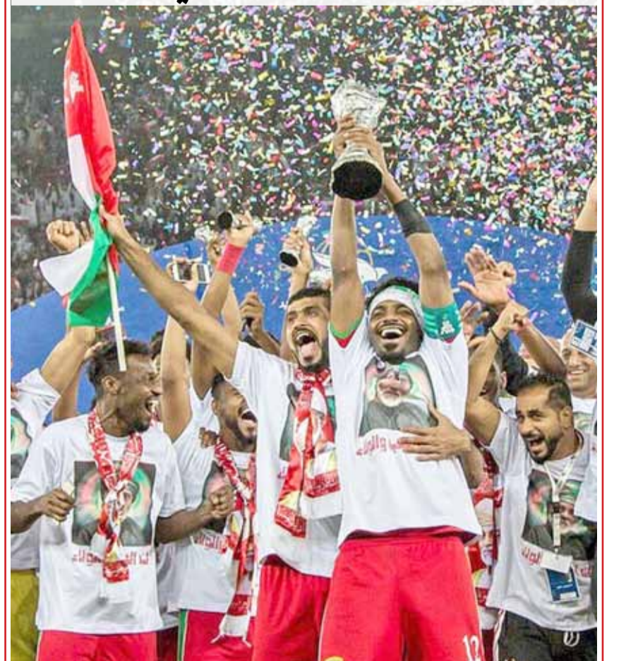
المنتخب العماني متوجًا بالكأس