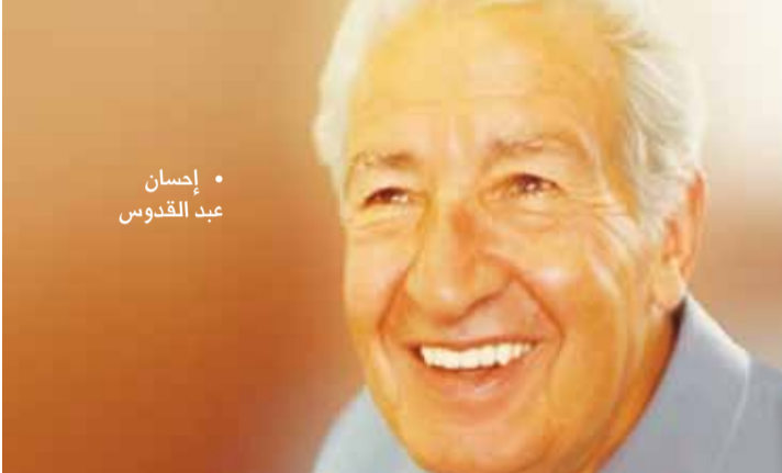
• إحسان عبد القدوس

تحت عنوان "إحسان عبد القدوس.. بين الرواية والسينما" تحدث الأكاديمي حسام عقل والناقد أحمد مجاهد، في "مكتبة المستقبل" في القاهرة، بمناسبة ذكرى ولادة الروائي المصري التي تصادف (1919-1-1)، ورحيله في الشهر نفسه العام 1990. يعتبر عبد القدوس ثاني أكثر كاتب أخذ من أعماله الروائية للسينما المصرية، بعد نجيب محفوظ، حيث بلغ عدد الأفلام التي اقتبست عن رواياته وقصصه 42 فيلماً، معظمها من روايات، باستثناء "البنات والصف" و"ثلاثة لصوص" و"ثلاث نساء"، و"إمبراطورية ميم"، فهي أفلام أخذت عن قصص قصيرة له.