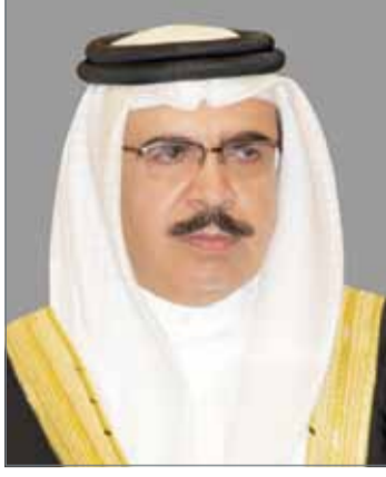
• وزير الداخلية

وما يتطلبه ذلك من تنظيم داخلي محدد يتناسب مع مقتضيات العمل ويؤدي إلى النتيجة المرجوة للمحافظة على النظام والأمن العام. وأوضح أن إجراء تعديل على بعض المواد دون البعض الآخر يمكن أن يؤدي إلى اختلال التوازن التشريعي، لاسيما وأن قانون قوات الأمن العام قانون خاص ينظم عمل الوزارة، وهو الأمر الذي يتطلب النظر إلى أحكام القانون كافة كوحدة واحدة.