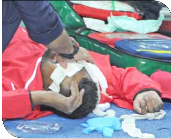
لقطات من الحادث