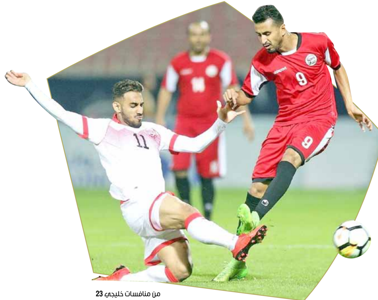
من منافسات خليجي 23

تمة إجماع في الشارع الكروي الخليجي على ان النسخة الثالثة والعشرين من كأس الخليج عرفت مستوى فنياً متواضعا لا يتوافق مع النجاحات الكبيرة على المستوى التنظيمي رغم قصر الفترة الزمنية التي سبقت إقرار إقامة البطولة، خلافاً إلى ان ما قدمته المنتخبات في خليجي 23 لم يواز حجم الحضور الجماهيري الكبير الذي فاق التوقعات وتوفق حتى على النسخة الماضية التي جرت في الرياض عام 2014.