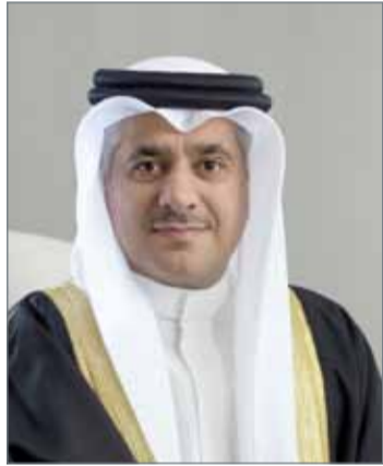
• وزير المواصلات

وبينت أنها تترجم المرخص لهم بحسب المادة 55 من قانون الاتصالات بوضع إجراءات للتعامل مع شكاوى المشتركين، وتقوم بمرجعة بنود هذه الإجراءات والتعديل عليها إذا اقتضت الحاجة؛ للتأكد من كونها عادلة ومنصفة. وأوضحت كما يجور عرض النزاعات بين المشتركين والمرخص لهم على الهيئة، كما أنها أصدرت الهيئة إرشادات لحماية المستهلك، وتقوم من خلال إدارة شؤون المستهلك والإعلام بتلقي الشكاوى ونشر الاستطلاعات وحملات التوعية.