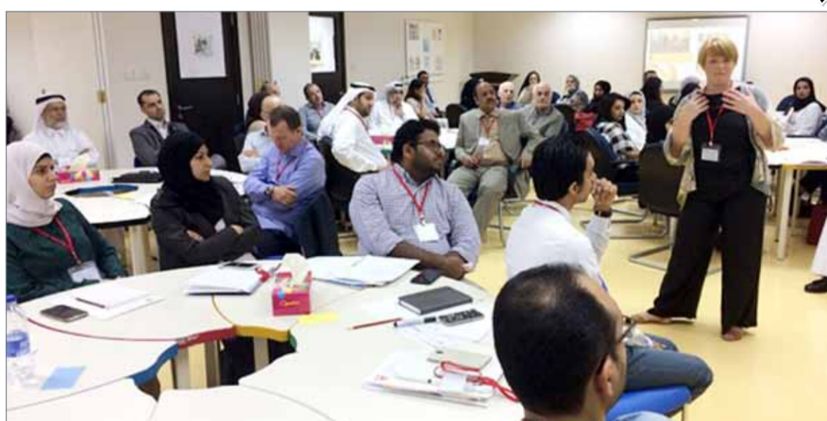
• جانب من برنامج تمهين المعلمين

شهد مستوى الكوادر التربوية العاملة في المدارس الحكومية تطوراً ملموساً في ظل التحاق العديد من خريجي كلية