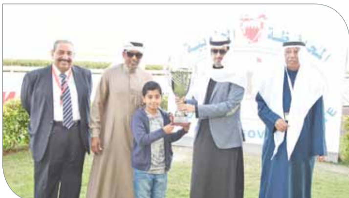
سمو الشيخ خليفة بن علي خلال التتويج

السادس الذي أقيم على كأس شركة المنيوم البحرين "ألبا" لحياد جميع الدرجات والمبتدئات "مستورد" مسافة 2400 متر، والجائزة 3000 دينار واستطاع الحصان "شوغن" أن يؤكد جدارته كحصان بطل بتسجيل فوزه الثاني هذا الموسم. وواصلت جواد إسبيل العاديات ريسنجتلقها وتفوقها في الشوط السابع والأخير الذي أقيم على كأس مصرف السلام لحياد الدرجة الأولى "مستورد" مسافة 1600 متر، والجائزة 3000 دينار، عندما تمكن الحصان "ليد باك روميو" من تسجيل انتصاره الأول في المضمار البحريني في مشاركته الثانية. وتم تتويج الفائزين بكؤوس السباق، حيث تسلم سمو الشيخ عيسى بن سلمان بن حمد آل خليفة كأس شركة ألبا للشوطين السادس من الرئيس