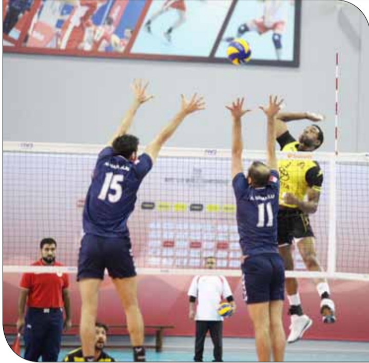
من لقاء الأهلي والنجمة

وفي المواجهة الأخرى يسعى البستين الخامس (6 نقاط) لاستغلال الحالة الفنية السيئة لمنافسه وتحقيق النقاط الثلاث التي ربما تقوده لتحقيق المركز الخامس وربما الرابع في القسم الثاني، أما النصر السابع (3 نقاط) فإنه يتطلع لعدم تكبد خسارة أخرى للإبتعاد عن المركز قبل الأخير الذي لا يليق بتاريخه ومكانته.