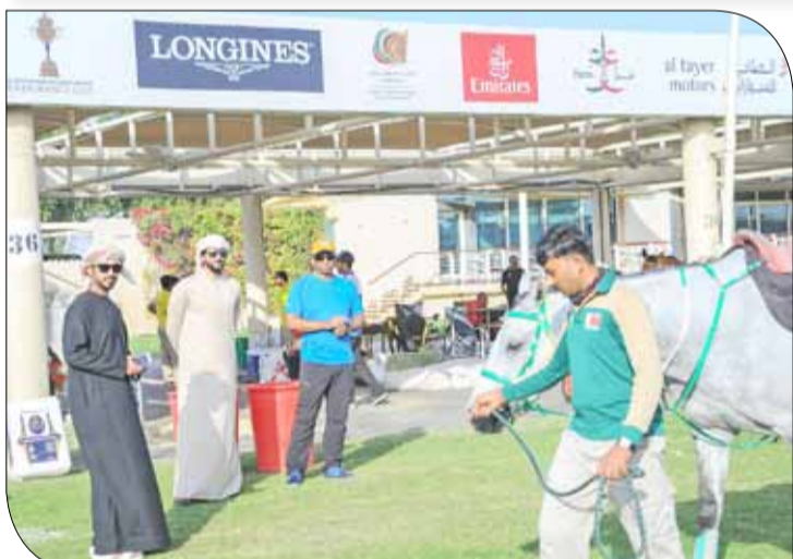
سمو الشيخ ناصر بن حمد متابعاً الفحص البيطري

بتنسيق مشترك بين المكتب الاعلامي لسمو الشيخ ناصر بن حمد آل خليفة والقناة الرياضية بتلفزيون البحرين وقناة دبي ريسينغ وقناة ياس ستقوم القناة الرياضية بنقل السباق على الهواء مباشرة منذ انطلاقته وصولاً إلى التتويج.