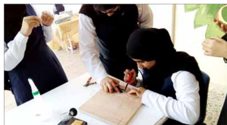
• طالبات بالنظام المطور للتعليم الفني والمهني

كما نفذت الوزارة العديد من المبادرات لتطوير هذا القطاع التعليمي، من أبرزها تدشين منهج الخبرات التعليمية لطلبة رياض الأطفال؛ لتمهينهم لتحقيق التميز في المرحلة التعليمية التالية، والنجاح في الحياة الاجتماعية أيضاً، مع توفير أدلة الخبرات للمعلمين وأولياء الأمور، والتي تعتبر مرجعاً شاملاً لعملية تطبيق المنهج بشكل مثالي، كما خصصت الوزارة برنامجاً تدريبياً مجانياً لتزويد الكوادر التعليمية برياض الأطفال بمهارات استخدام إستراتيجيات المنهج وأنشطته التعليمية. وتعمل الوزارة حالياً بالتعاون مع برنامج الأمم المتحدة الإنمائي وعدد من الخبراء العالميين على إطلاق إستراتيجية جديدة للتعليم ما قبل المدرسي لتكون موجهة للعمل في المرحلة القادمة.