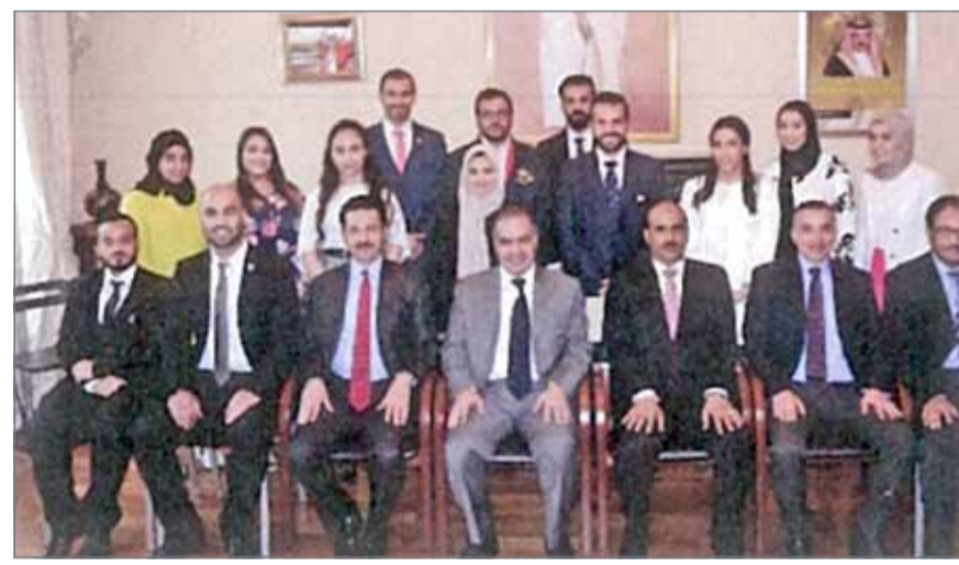
• نجحت سفارة البحرين لدى بريطانيا في تنفيذ مبادرات كفلت للبحرين حضوراً قوياً في بريطانيا وأوروبا (أرشيفية)

وقامت السفارة - بحسب التقرير - بوضع خطة إعلامية شاملة تتمركز حول سرعة الاستجابة، وتوفير المعلومات الصحيحة؛ للحد من المغالطات المتبناة من الأطراف الأخرى، حيث أجابت السفارة على 42 استفساراً من أصل 61 استفساراً العام 2017، وذلك خلال ساعات معدودة، وبقيّة الاستفسارات التي كانت خارج اختصاص السفارة تم إحالتها للجهات المعنية، الأمر الذي مكن البحرين من التواجد والحضور الفعلي في الأوساط الإعلامية البريطانية، حيث حرص كثير من كتاب الأعمدة ومقالات الرأي إلى التواصل مع السفارة مسبقاً وتضمين وجهات نظر البحرين في كتاباتهم قبل طرحها للنشر. واختتمت سفارة مملكة البحرين لدى المملكة المتحدة تقريرها بالتاكيد على أن جهودها المبذولة والنشاط الإستراتيجي المستمر والفاعل بين أعضاء السفارة والجهات والشخصيات البريطانية المختلفة خلال العام 2017 أدى إلى تطوير العلاقات المتبادلة الصديقة بين البلدين إلى أعلى مستوياتها، وساهم في تعزيز أطر التعاون والتنسيق المشترك، وترسيخ العلاقة الخاصة بين المملكتين التي تمتد لقرون مضت.