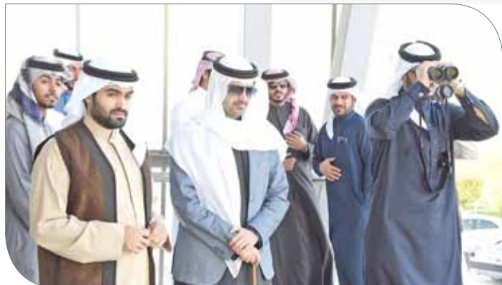
سمو الشيخ خليفة بن علي في مقدمة الحضور