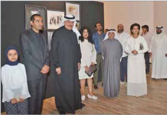
• الشيخ راشد بن خليفة خلال افتتاحه المعرض

المنامة - بنا: افتتح وكيل وزارة الداخلية لشؤون الهجرة والجوازات والإقامة الرئيس الفخري لجمعية البحرين للفنون التشكيلية الشيخ راشد بن خليفة آل خليفة المعرض الفردي "على الطريق 2" للفنان زهير السعيد، مساء أمس بمركز الفنون، وذلك بحضور المدير العام للثقافة والفنون بهيئة البحرين للثقافة والآثار الشيخة هلا بنت محمد آل خليفة، وعدد من الفنانين والمهتمين بالشأن الثقافي. ويأتي هذا المعرض، والذي يستمر لغاية 31 يناير الحالي، ضمن فعاليات هيئة البحرين للثقافة والآثار بشعار "المحرق عاصمة الثقافة الإسلامية 2018". ويعد "على الطريق 2" استكمالاً للمعرض الذي أقامه الفنان لأول مرة العام 2015. ويواصل هذا المعرض توثيق الذكريات والتجارب الإنسانية للأفراد في البحرين، وإضافة