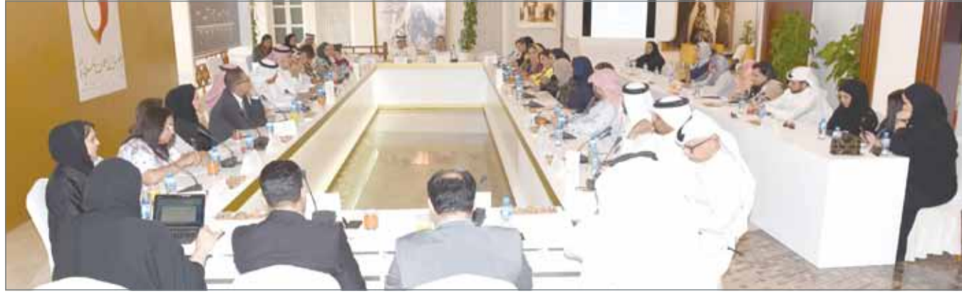
• يتضمن برنامج عمل المجلس الأعلى للمرأة العديد من الأنشطة والفعاليات في العام 2018