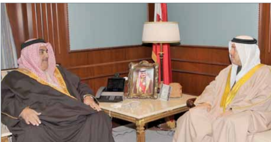
• وزير الخارجية مستقبلاً التنفيذي لمجلس التنمية الاقتصادية

مجلس التنمية الاقتصادية في تعزيز علاقات المملكة الاقتصادية والتجارية مع مختلف دول العالم.