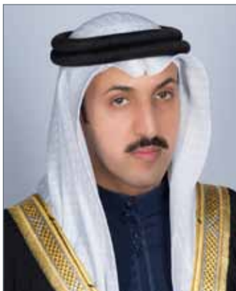
• الشيخ عبدالله بن أحمد

وبهذه المناسبة، قال رئيس مجلس أمناء المركز الشيخ عبدالله بن أحمد آل خليفة إن دخول ”دراسات“ قائمة التصنيفات العربية والدولية لأفضل المراكز البحثية والإستراتيجية يعد أمراً إيجابياً ومبشراً بأن المركز يسير بخطى ثابتة وواثقة في تنفيذ أهدافه وتطلعاته، متوقعاً أن يحتل ”دراسات“ مكانة أكثر تقدماً في قائمة التصنيفات الدولية لمراكز الدراسات والبحوث مع استكمال خطط التطوير، واعتماد كامل المعايير العالمية في مختلف مجالات عمله.