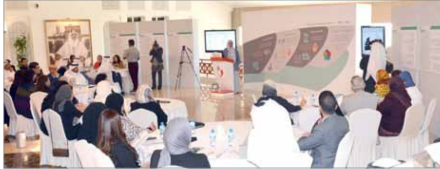
• لقاء تشاوري لبرنامج التمكين الانتخابي