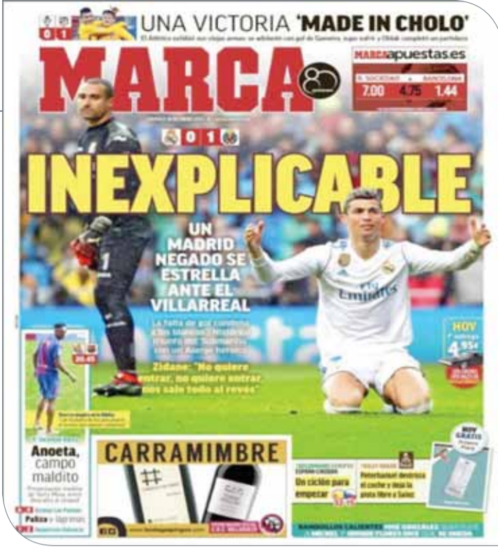
غلاف صحيفة ماركا

زيدان في المؤتمر الصحفي: "الكرة لا تردى الدخول.. لا تردى الدخول، والوضع أصبح أكثر تعقيدا". وعلى الصفحة الأولى لصحيفة أس جاء العنوان: "بدون هدف.. بدون حظ.. بدون تفسير". وأضافت: "فورنالس منح الفوز الأول لفياريال على ملعب سانتياجو برنابيو". كما نشرت جزءاً من حديث زيدان عقب انتهاء اللقاء: "خيبة أمل وهزيمة غير مستحقة، الكرة رفضت أن تدخل الشباك". وانتقل الحديث عن مباراة ريال مدريد للصحف الكاتالونية، فجاءت صحيفة مونودو ديورتيغو، بعنوان: