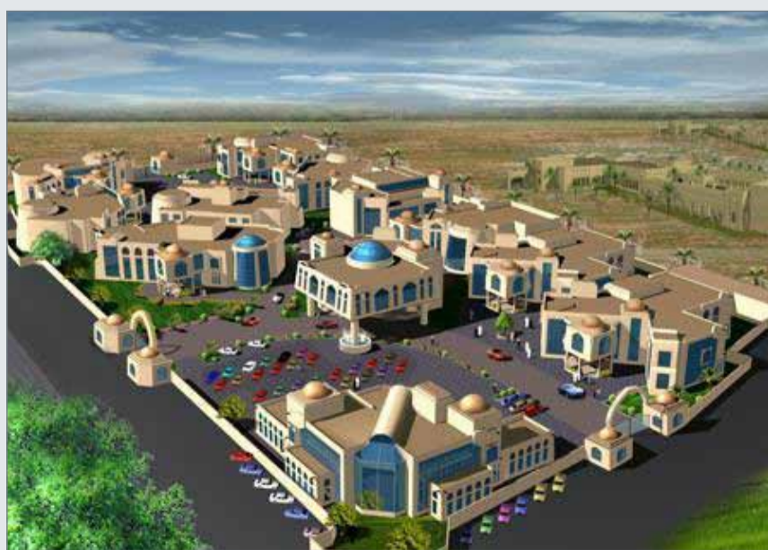
مخطط مجمع الإعاقة الشامل (أرشيفية)

مساحتها نحو 29,106 أمتار مربعة، وسيتم البناء فيها على مساحة إجمالية تبلغ 18,765 مترا مربعا، وتقدر الطاقة الاستيعابية للمجمع بنحو 1450 شخصا، إضافة إلى 160 إداريا بمبنى الإدارة الرئيس.