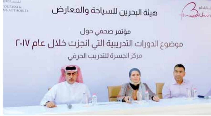
المؤتمر الصحافي لهيئة البحرين للسياحة والمعارض أمس