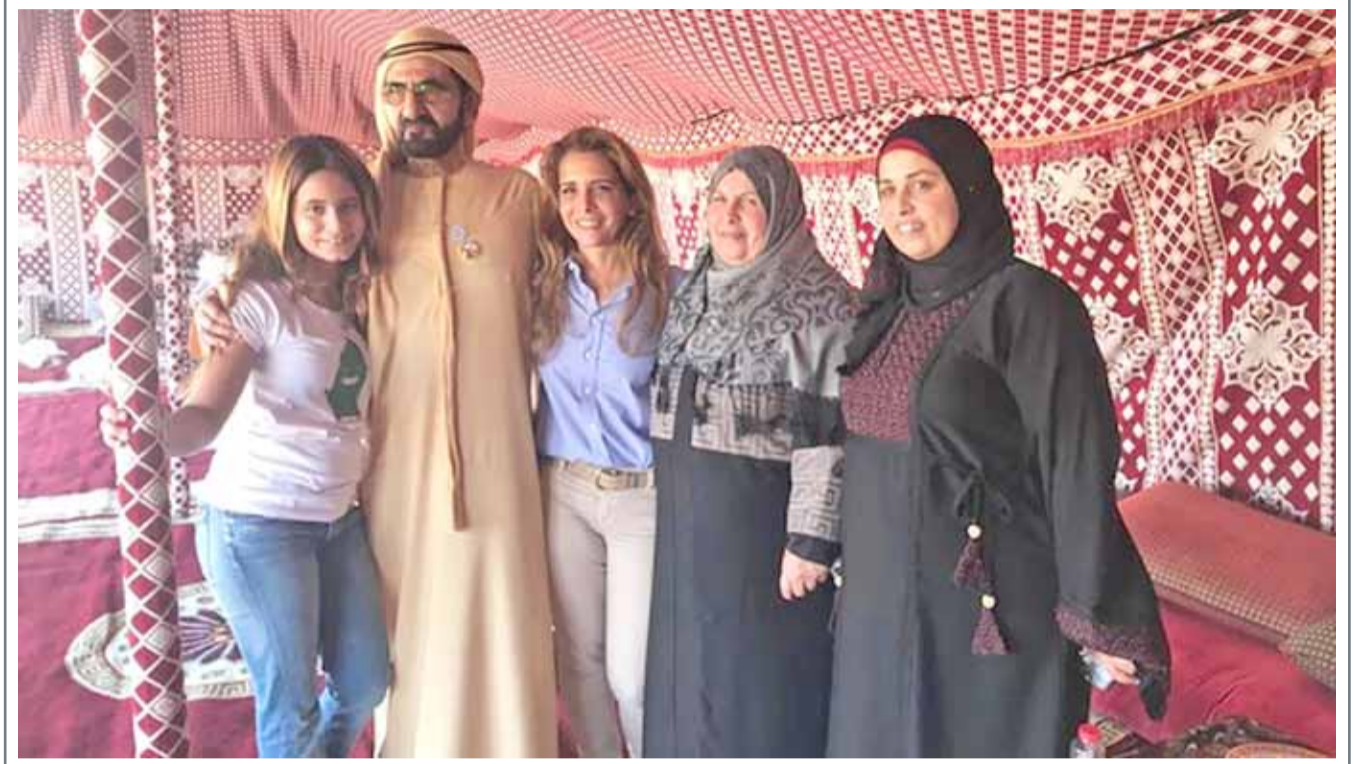
نائب رئيس دولة الإمارات رئيس مجلس الوزراء حاكم دبي الشيخ محمد بن راشد آل مكتوم وقرينته الأميرة هيا بنت الحسين، يستقبلان عائلة معاذ الكساسبة، الطيار الأردني الذي أعدمه "داعش" في 2014

حالة الطقس: الطقس بارد نسبياً ولكنه دافئ خلال النهار. الرياح جنوبية بوجه عام من 5 إلى 10 عقد ثم تتحول إلى شمالية غربية وتصل من 12 إلى 17 عقدة أحياناً غداً. ارتفاع الموج من قدم إلى قدمين قرب السواحل، ومن 2 إلى 4 أقدام في عرض البحر. درجة الحرارة العظمى 25 والصغرى 12. الرطوبة النسبية العظمى 85% والصغرى 30%.