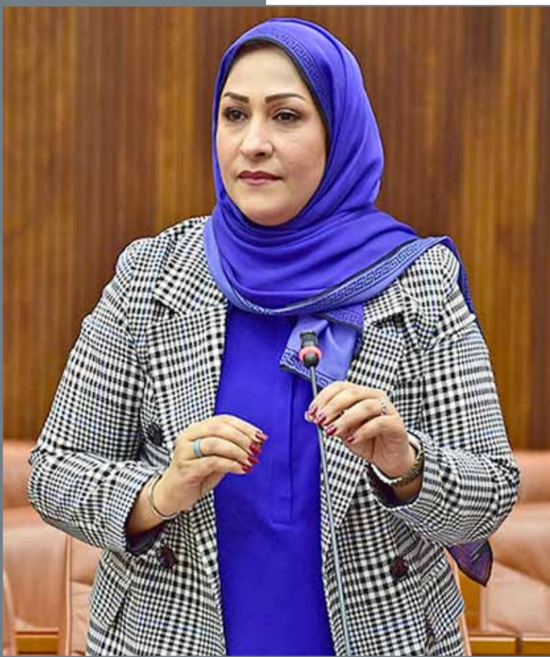
• عضو مجلس الشورى سوسن تقوي

بين حكومة مملكة البحرين وحكومة الجمهورية التونسية حول المساعدة الإدارية المتبادلة