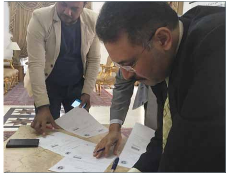
مصريون يقدمون توكيلات لترشيح الرئيس عبدالفتاح السيسي

وتابع مسعود "كجالية مصرية بالبحرين، نتطلع بأن يمنح جلالته الملك أخيه عبدالفتاح السيسي بالاستحقاق الثاني بإذن الله".