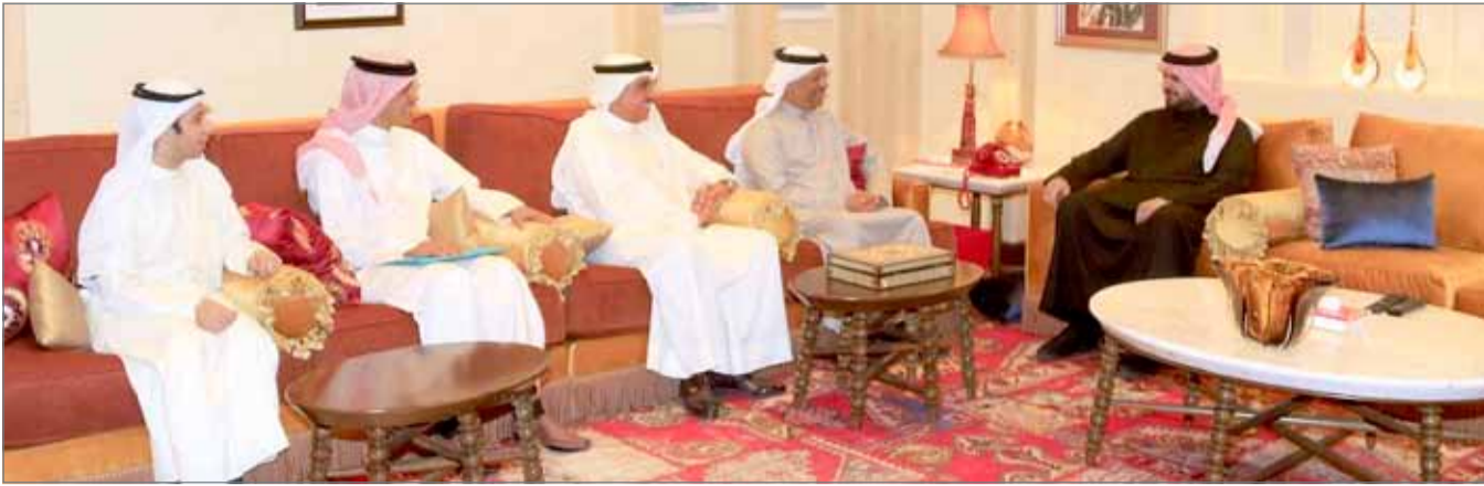
• سمو الشيخ عيسى بن علي مستقبلاً رئيس جمعية الكلمة الطبية

استقبل "الكلمة الطبية" ... سمو الشيخ عيسى بن علي: