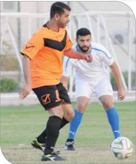
من لقاء الأشغال والبلديات والكهراء الموسم الماضي