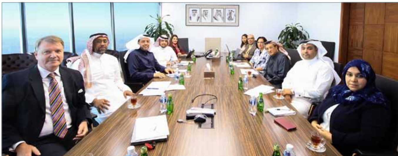
• رئيس المجلس الأعلى للصحة ووزيرة الصحة يجتمعان مع الوفد السعودي

والاستدامة في تقديم الخدمات الصحية. من جانبه، قدم الشيباني عرضاً مفصلاً عن برنامج التحول الوطني للمساهمة في تحقيق أهداف رؤية السعودية 2030، موضحاً أن وزارة الصحة بدأت في إطلاق سلسلة من المبادرات الجديدة والتنوعية التي ستحدث نقلة نوعية في الخدمات، ضمن 40 مبادرة تطلق تباعاً تم إقرارها كجزء من مبادرات برنامج التحول الوطني 2020.