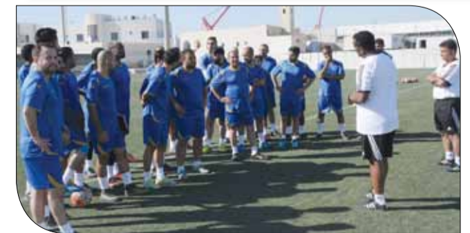
جانب من افتتاح الدورة

بشكل مستمر بما يضمن تطوير العمل الفني في المنتخبات والأندية الوطنية. ويشارك في الدورة 25