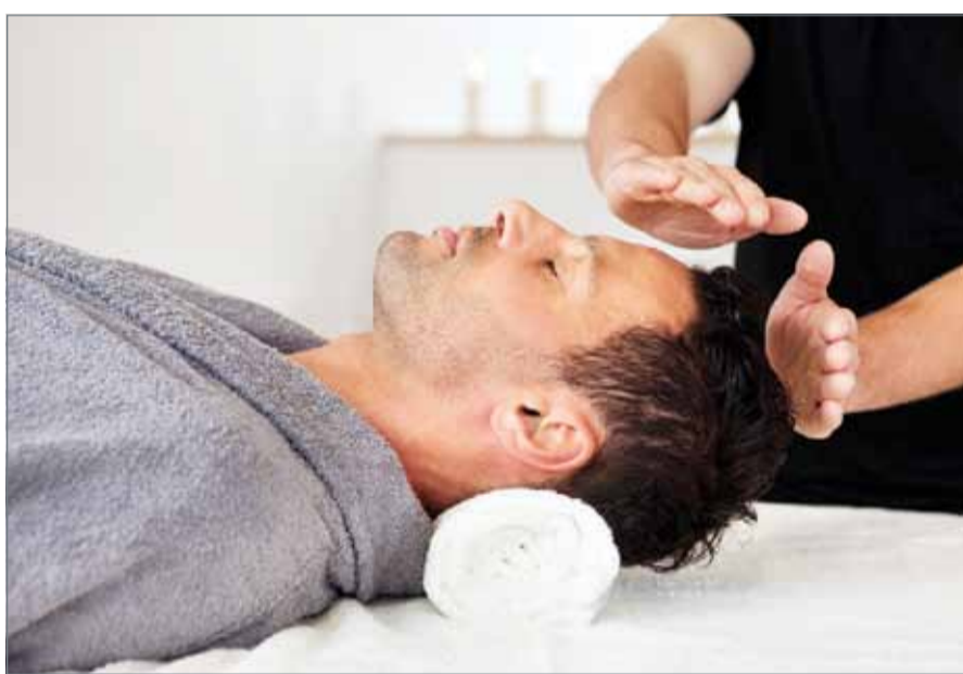
• العلاج بالطاقة أو "العلاج بالريكي"

كافة من مواطنين ومقيمين، وحمايتهم من بعض الإدعاءات الباطلة التي يروج لها بعض من يدعون العلاج والشفاء من خلال العلاج بالطاقة أو "الريكي"، ومن دون الاستناد إلى أي دلائل علمية موثقة، مشددة أن العلاج بالطاقة غير مرخص به في البحرين والمملكة العربية السعودية وباقي دول مجلس التعاون، مؤكدة أيضاً أن ممارسة العلاج بالطاقة على الرغم من المنع وعدم الاعتراف بوضع المؤسسات الممارسة لهذا العلاج أو الأفراد تحت طائلة عقوبة القانون.