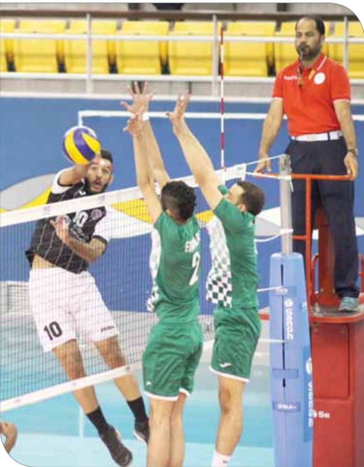
من لقاء اتحاد الريف وداركليب فيه القسم الأول