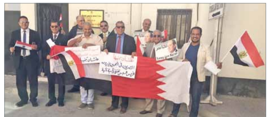
عدد من المصريين يحملون لافتات مؤيدة للسيسي