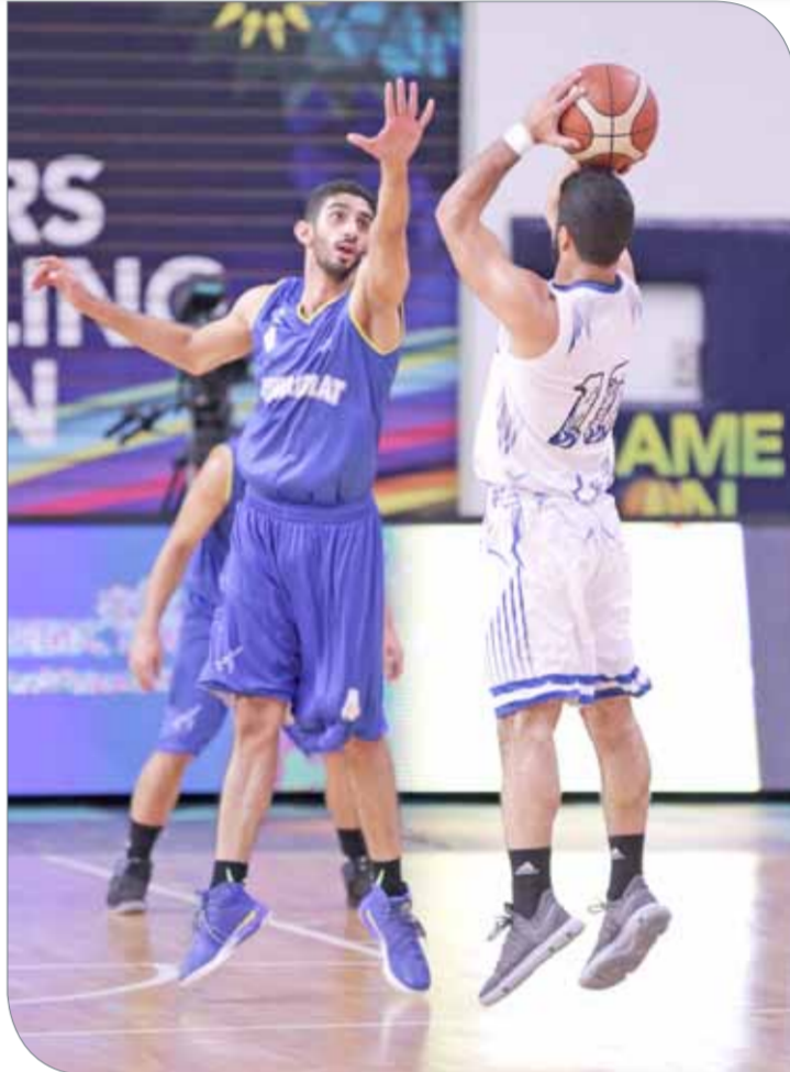
من لقاء النويدرات وسماهيج

لللمباراة وتقليص الفارق وسجل 4 نقاط متتالية 37/59، رد عليها المنامة بهـ المستقطع، غير أن المنامة واصل هجومه الضارب وحسم الشوط الأول بفارق 26 نقطة وبنتيجة 59/33.