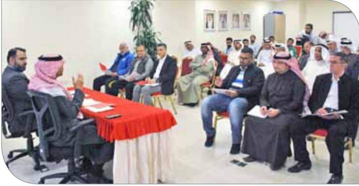
جانب من الحضور في المؤتمر