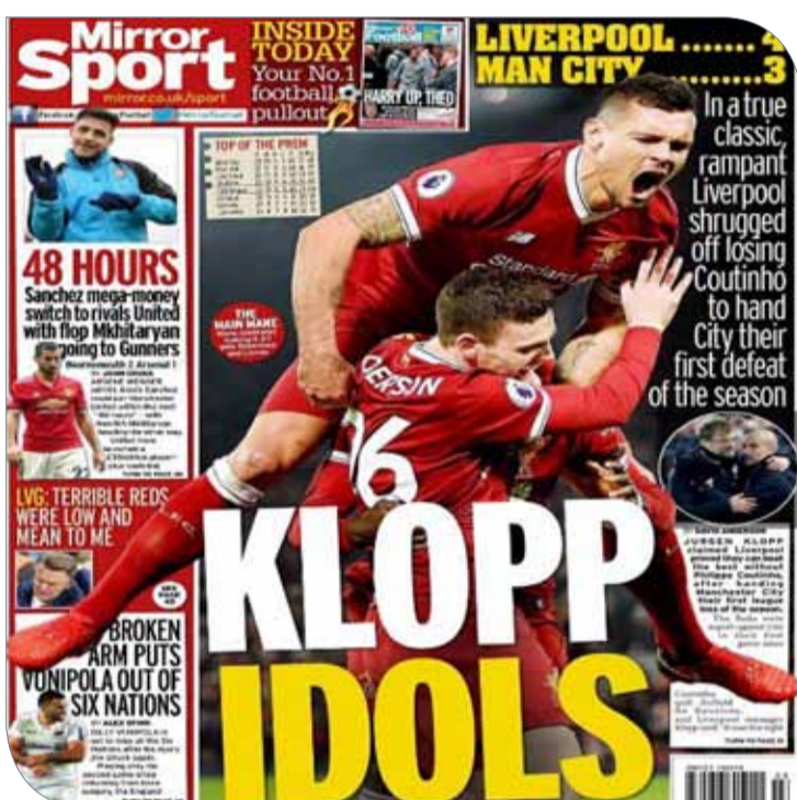
غلاف صحيفة ميرور

يسجل العديد من الأهداف أيضا. وأحرز اللاعب البرازيلي أول أهداف برشلونه الأربعة في سان سيباستيان، ليرفع رصيده إلى ثمانية أهداف في الدوري هذا الموسم، وسجل كريستيانو رونالدو مهاجم ريال مدريد أربعة أهداف. ويحتل ريال مدريد غريم