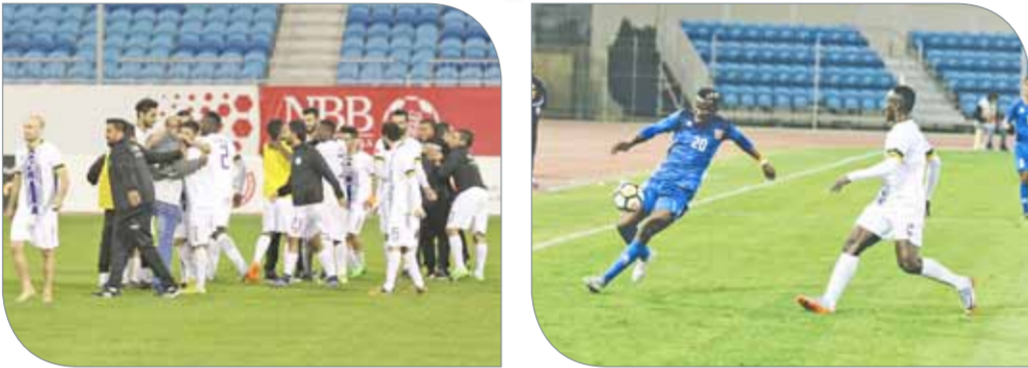
فريدة اتحادية بالتأهل