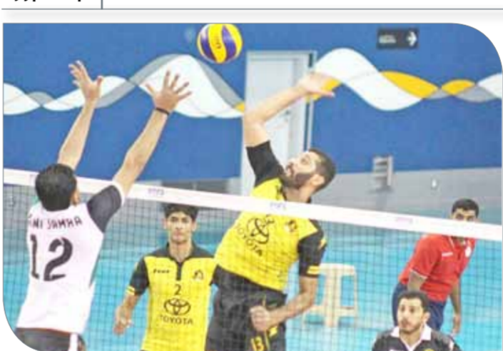
من لقاء الأهلي وبنية جمرة

السادة ليبقى في المركز السادس بـ 7 نقاط. ويعتبر هذا الفوز هو الثاني للأهلي على حساب بني جمرة الذي خسر بنفس النتيجة في القسم الأول من المسابقة