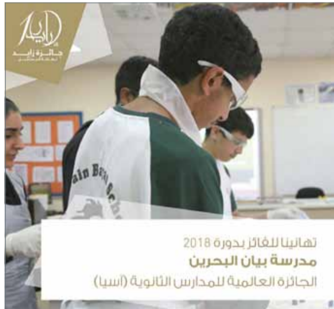
تهانينا للفائز بدورة 2018 مدرسة بيان البحرين الجائزة العالمية للمدارس الثانوية (آسيا)