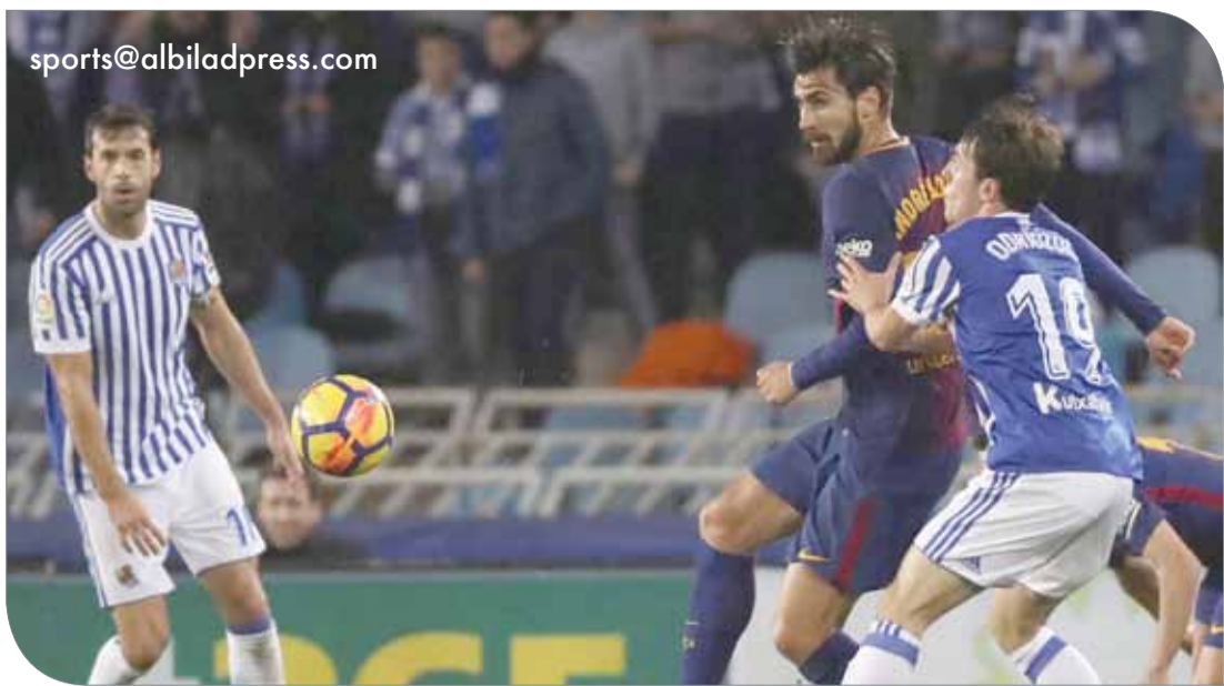
من مواجهة سوسيداد وبرشلونة

◆ (وكالات): استهل الإسباني نادال المصنف الأول عالميا أمس الإثنين، مشواره في بطولة أستراليا المفتوحة، بانتصار ساحق على فيكتور بورجوس. ولم يجد نادال، وصيف البطل العام الماضي، أي صعوبات في مباراته الأولى بالبطولة، التي يستهل بها مشواره رسميا هذا العام، لينجح في إقصاء منافسه، بعد لقاء استغرق ساعة و34 دقيقة. وبدأت الحالة البدنية للإسباني المتوج في 2017 برونلن جاروس وأمريكا المفتوحة، رائعة ليتعافى من المشكلات البدنية التي ألمت به منذ نهاية الموسم الماضي. ولم يمنح نادال، منافسه أي فرصة في المجموعة الأولى التي تفوق فيها 0-5، قبل أن يحصد بورجوس، المصنف الـ 79 عالميا، أول شوط له ليختتمها الإسباني 1-6. واستهل نادال المجموعة الثانية بالطريقة نفسها وتفوق 0-5، لكن بورجوس انتفض ونجح في كسر إرساله للمرة الأولى، قبل أن يعود الإسباني ويحسم المجموعة أيضا 1-6، وتكرر الأمر مجددا في المجموعة الثالثة. وسواجه نادال في الدور الثاني، منافسه الأرجنتيني ليوناردو ماير، الذي أقصى التشيلي نيكولاس جاري.