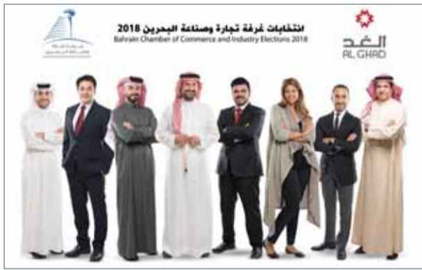
• أعضاء "ائتلاف الغد"