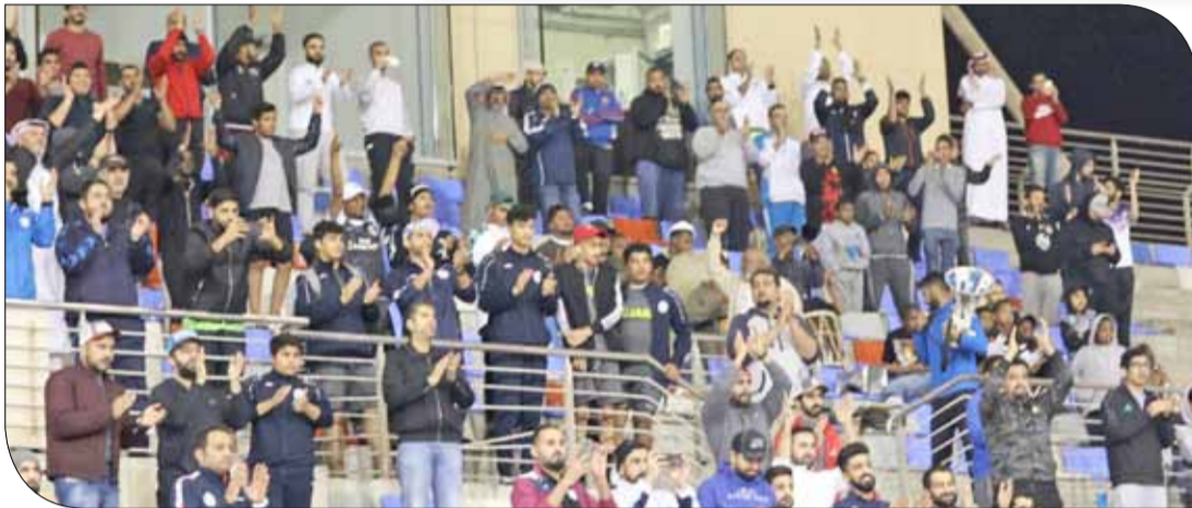
جماهير النجمة تحتفل بأبطال فريقها