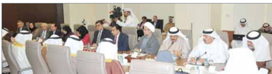
• ممثلو السلطة التشريعية في اللقاء التشاوري

عليها، وضرورة أن يوجه الدعم لمستحقه، والوصول لتعريف مشترك لمستحقّي الدعم ومعايير تحديد