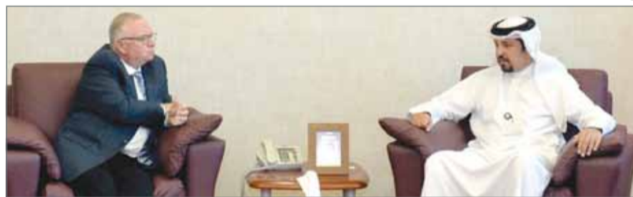
رئيس الجمارك مجتمعاً برئيس العمليات بشركة UPS

مؤكدًا حرص شركة UPS للنقل السريع على التعاون مع شؤون الجمارك وتقديم كافة الخدمات المساهمة في دعم العمل المشترك بين الطرفين.