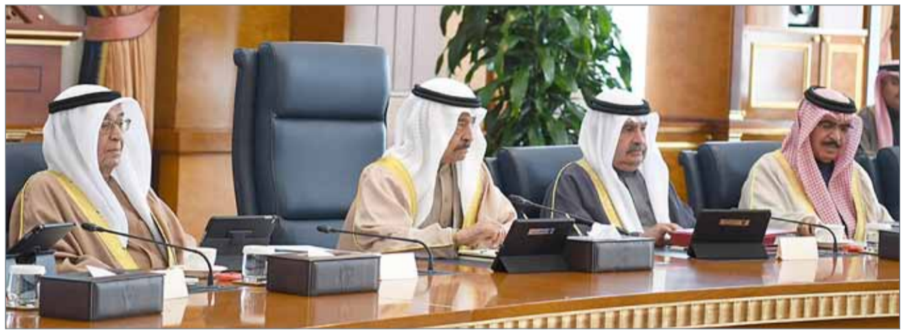
سمو رئيس الوزراء مترئسا جلسة مجلس الوزراء

الحكومي، فيما أخذ المجلس علماً بمضمون اللقاء التسبيقي مع السلطة التشريعية بشأن إعادة هيكلة الدعم من خلال نائب رئيس مجلس الوزراء رئيس اللجنة الوزارية للشؤون المالية وضبط الإنفاق إلى ذلك، وافق مجلس الوزراء على أن تكون الأولوية في توظيف العاملين في المؤسسات الصحية الخاصة للأطباء والفنيين والممرضين البحرينيين الحاصلين على المؤهلات والخبرة اللازمة.