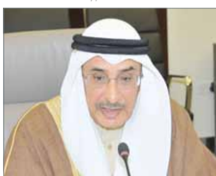
• خالد بن عبدالله

ولفت إلى أن ما ترم به المملكة من وضع مالي استثنائي شأنها في ذلك شأن دول المنطقة يستلزم أن يكون شعار المرحلة الحالية، مبنياً على حزم من المبادرات والإجراءات التي يمكن من خلالها تجاوز هذه التحديات بأقل كلفة ممكنة وبأسرع وقت ممكن، مع مراعاة استمرار استفادة المواطنين والأسر البحرينية المستحقة من أوجه المساعدات كافة.