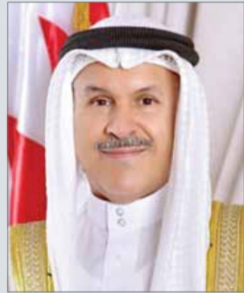
• محافظ العاصمة

النامية - محافظة العاصمة: تنظم شركة سولد فيجن - SolidV sion المتخصصة في تنظيم المعارض والفعاليات وبالتعاون مع شركة Eleven&Bridge مهرجان البحرين للسيارات 2018 بنسخته الأولى في البحرين، وذلك للفترة من 17 حتى 21 يناير 2018، بمرافق البحرين المالي، وذلك تحت رعاية محافظ محافظة العاصمة الشيخ هشام بن عبدالرحمن آل خليفة حيث سينطلق المهرجان من الساعة الثالثة عصراً وحتى الساعة 10 مساءً.