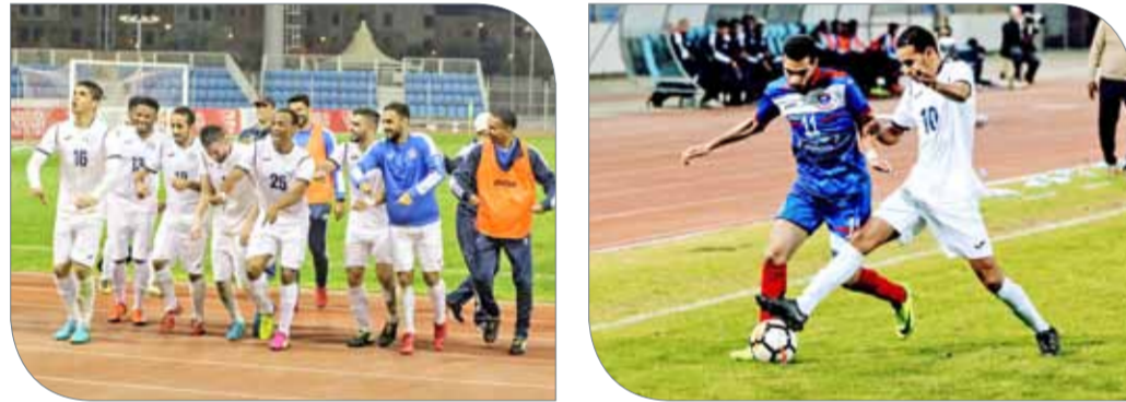
فريدة اتحادية كبيرة العبور لنصف النهائي