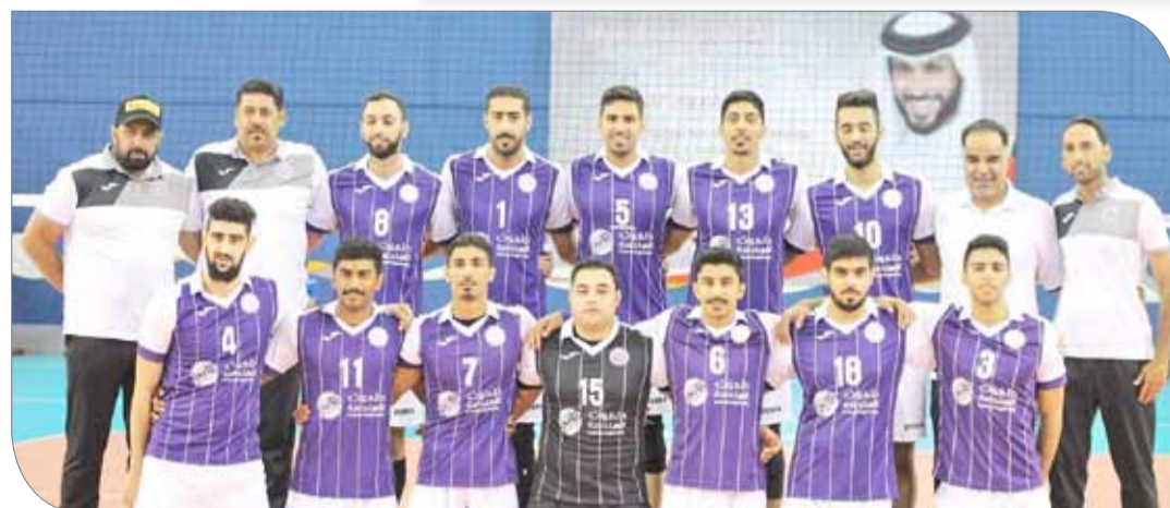
فريق داركليب لكرة الطائرة

والهلال (السعودية)، السلام والسيب (سلطنة عمان)، الشرطة والبشمركة (العراق)، السويجلي وأهلي بنغازي (ليبيا)، المجمع البترولي برج بوغريج (الجزائر)، الريان والعربي (قطر)، الجيش الملكي (المغرب)، سنجل (فلسطين)، الأمان (السودان). ويتوقع أن تتسم البطولة بمستوى فني رفيع في ظل مشاركة عدد من الأندية العربية القوية.