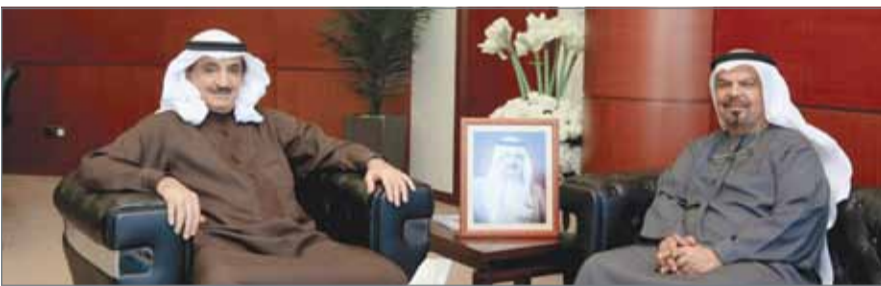
• رئيس جهاز المساحة والتسجيل العقاري مستقبلاً سفير الإمارات لدى مملكة البحرين

المفقور له في تأسيس وبناء دولة الإمارات بجانب إنجازاته المحلية والعالمية. في نهاية اللقاء، أعرب السفير عن شكره وتقديره لرئيس الجهاز على حسن استقباله وترحيبه، مؤكداً حرصه في تعزيز وتنمية العلاقات الأخوية التاريخية التي تجمع البلدين الشقيقين.