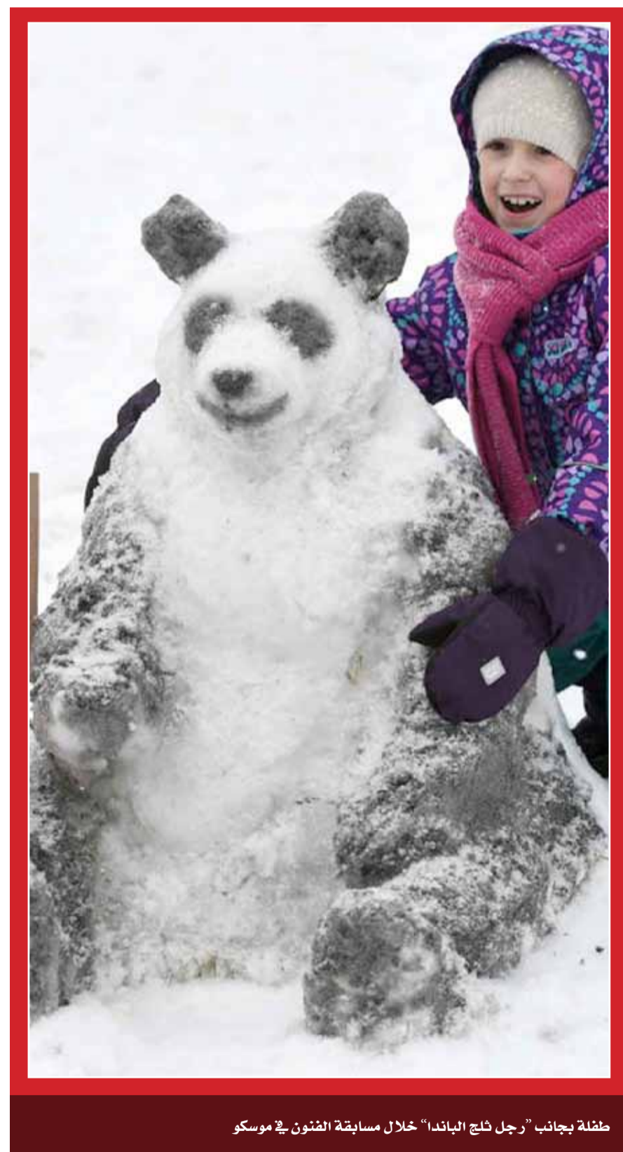
طفلة بجانب "رجل ثلج الباندا" خلال مسابقة الفنون في موسكو

قال موظف في بورصة إندونيسيا، وشهود، إن طابقاً أوسط بين طابقين يطل على البهو الرئيس للمبنى المؤلف من طوابق عدة انهار، مما أسفر عن إصابة 12 شخصاً على الأقل من جراء تطاير زجاج وحطام آخر. والمبنى جزء من مجمع مؤلف من برجين كان هدفاً لهجوم انتحاري نفذته متشددون في سبتمبر العام 2000، إلا أن الشرطة استبعدت أن يكون انهيار اليوم ناجم عن قنبلة، وفق "رويترز". وطوقت الشرطة المبنى، بينما كان الناس يفرون منه في حين تم نقل المصابين، وبينهم طلبة، يزورون المبنى على محفات. وقال أرغو يونو المتحدث باسم شرطة جاكرتا لقناة مترو التلفزيونية "نركز الآن على إلقاء الناس". وأوضحت صور عرضها التلفزيون ووسائل التواصل الاجتماعي هيكلاً معدنياً محطماً عند مقهى ستارباكس قرب مدخل المبنى.