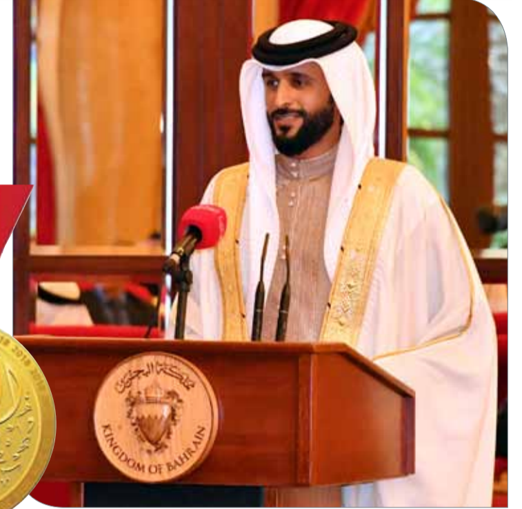
سمو الشيخ ناصر بن حمد آل خليفة

أكد رئيس الاتحاد البحريني لكرة الطائرة الشيخ علي بن محمد آل خليفة بأن شعار ممثل جلالة الملك للأعمال الخيرية وشؤون الشباب، رئيس المجلس الأعلى للشباب والرياضة، رئيس اللجنة الأولمبية البحرينية سمو الشيخ ناصر بن حمد آل خليفة للعام الجاري 2018 "الذهب فقط" هو نهج سيسير عليه الاتحاد؛ لمضاعفة الانجازات والتميز التي حققتها الكرة الطائرة على