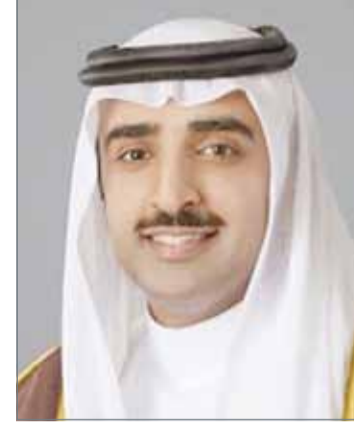
• وزير النفط

وتطرق الشيخ محمد بن خليفة عن أفكار بشأن تأسيس شبكة لتبادل الغاز على غرار الشبكة الخليجية الموحدة للكهرباء والتي أشار إلى أنها تجربة ناجحة. وقال الوزير إن العمل جار بالفعل على مشروع مصنع العطريات، وهو مشروع بتروكيماويات مشترك بين شركة نفط البحرين