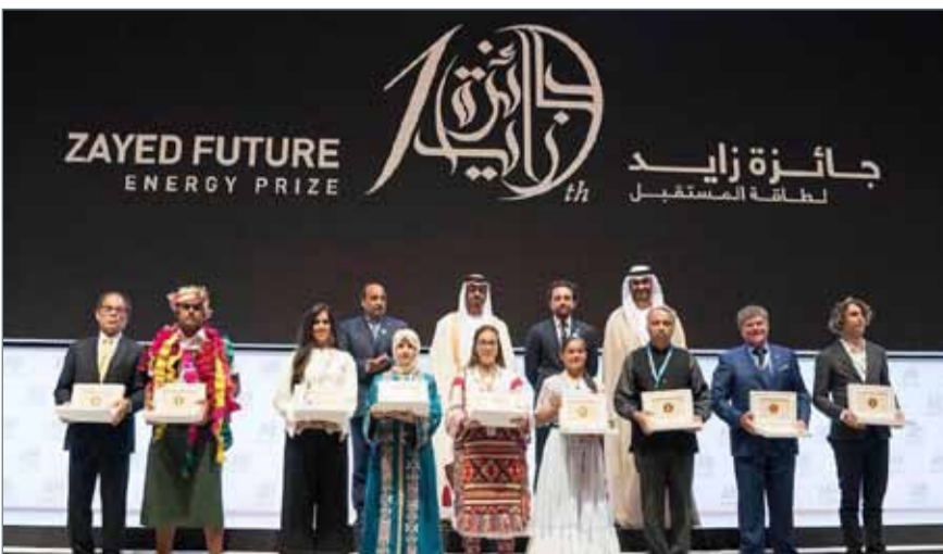
أكدت المدرسة أن الفوز يمثل تحقياً لرؤية القيادة لتأسيس مستقبل زاخر بالطاقة المستدامة

مدينة عيسى - مدرسة بيان البحرين: أهدت مدرسة بيان البحرين، ممثلة في مجلس إدارتها وهيئتها التنفيذية والتعليمية، فوزها بجائزة الشيخ زايد العالمية المرموقة بعد فوزه المدرسة بالمنافسة بين 1800 مشروع من أنحاء العالم، إلى مملكة البحرين الغالية قيادة وشعباً وعلى رأسها المقام السامي لعاهل البلاد صاحب الجلالة الملك حمد بن عيسى آل خليفة، ورئيس الوزراء صاحب السمو الملكي الأمير خليفة بن سلمان آل خليفة، وصاحب السمو الملكي ولي العهد نائب القائد الأعلى النائب الأول لرئيس مجلس الوزراء صاحب السمو الملكي الأمير سلمان بن حمد آل خليفة، وقريظة جلالة الملك صاحبة السمو الأميرة سبيكة بنت إبراهيم آل خليفة.