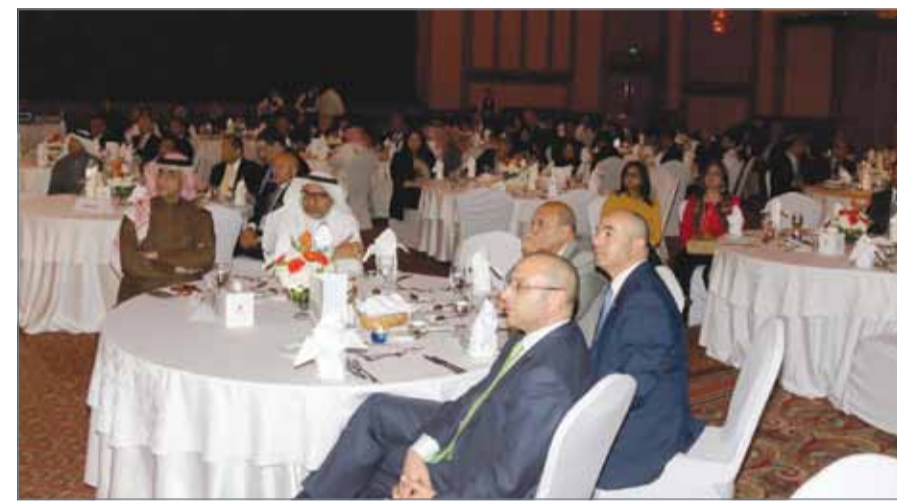
• جانب من حضور احتفالية البنك بالذكرى الـ 50 على تأسيسه