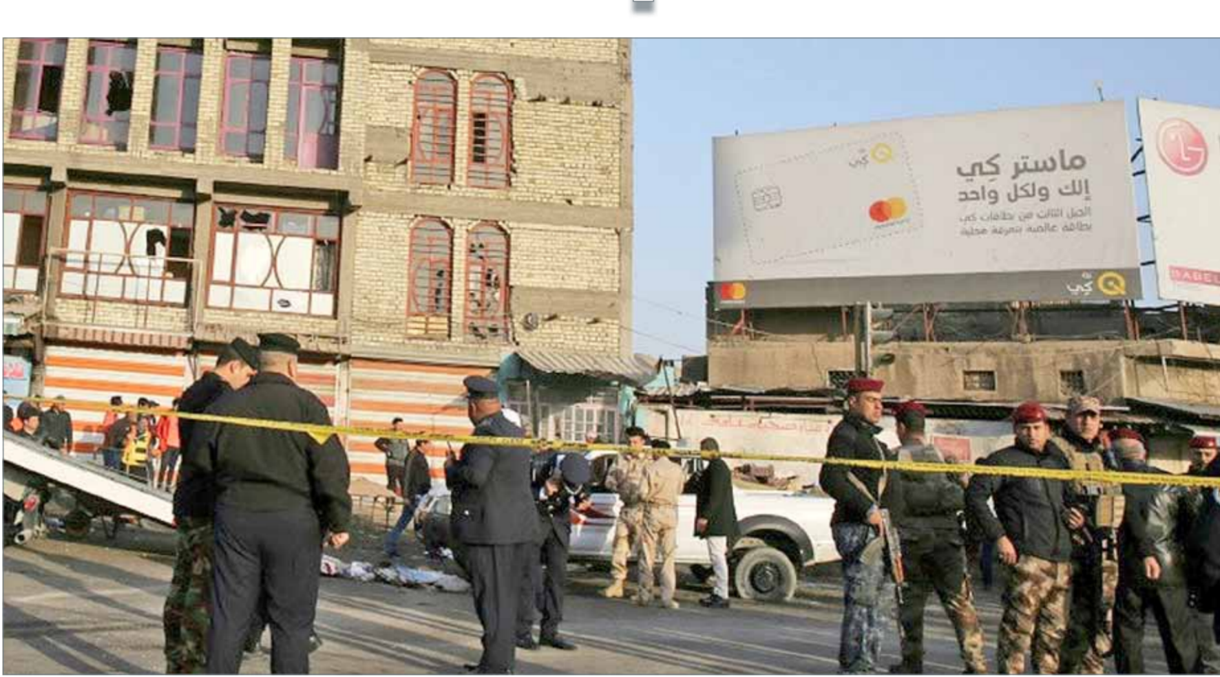
قوات الامن العراقية تطوق المنطقة التي وقع فيها الهجوم

وجاء ذلك أثناء لقائه سفيرة الاتحاد الأوروبي لدى اليمن، أنتونيا كالفو، حيث جرى مناقشة تداعيات الأحداث الأخيرة في صنعاء وممارسات الميليشيات الحوثية في مناطق سيطرتها، وفق وكالة الأنباء اليمنية الرسمية. ولفت الرئيس اليمني إلى أن "مخططات وأهداف ميليشيا الحوثي الدخيلة توضح ارتهاجها للخارج كأداة لإيران، لمعبث بأمن واستقرار اليمن والمنطقة". إلى ذلك، جدد قيادي في ميليشيات الحوثي بتنفيذ الإعدام الجماعي بحق 650 ضابطاً وجندياً من حراسة الرئيس السابق علي عبدالله صالح بعتقلم الانقلابيون بالسجن المركزي في صنعاء منذ مطلع ديسمبر الماضي.