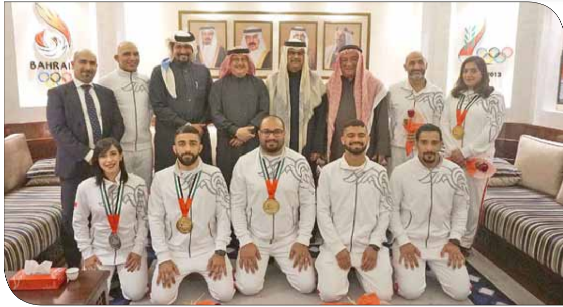
عسكر أثناء استقباله الأبطال

ويعكس بجلاء سلامة النهج الإداري المتبع لمجلس إدارة الاتحاد برئاسة المهندس أحمد الخياط، وما يبذله من جهد كبير في سبيل تهيئة المنتخبات وتوفير كافة أشكال الدعم لها من أجل التمثيل المشرف للمملكة بمختلف المحافل الخارجية.