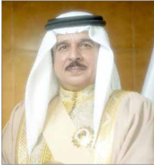
• جلالة الملك

وعلى قيادة خفر السواحل في حالة إبلاغها بالتغيير أو