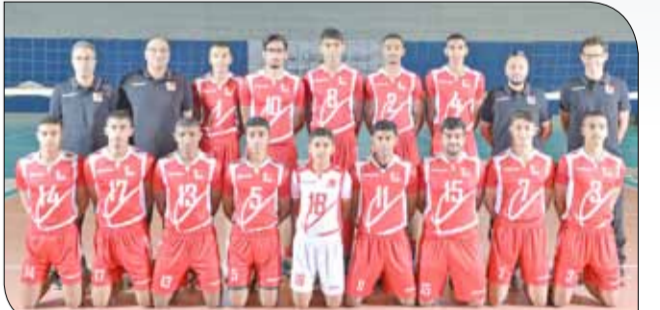
منتخب الناشئين لكرة الطائرة