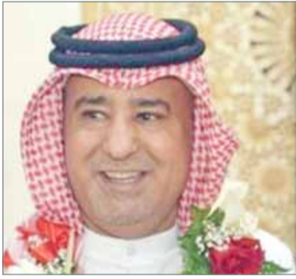
• المرحوم عبدالله الخال

الافتراض مما يؤثر على الوفاء بالتزامات تنفيذ اعتمادات الميزانية للدولة، بما فيها الوفاء بالمبالغ المقرر صرفها لدعم المواطنين والمتمثلة في علاوة الغلاء، علاوة إيجار السكن، علاوة تحسين المعيشة للمتقاعدين وغيرها من مبالغ الدعم الاجتماعي الموجهة للمواطنين والمصروفات التشغيلية الأخرى للوزارات والجهات الحكومية. وصوت الأعضاء برفض مشروع القانون وذلك نداء بالاسم.