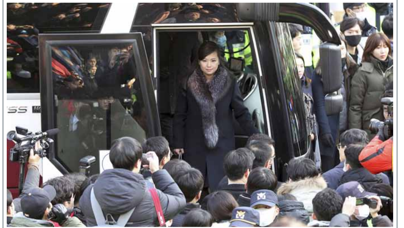
• وصلت الموسيقى هيون سونغ أول، التي كان يعتقد بأنها "عشيقة" الزعيم الكوري الشمالي كيم جونج أون، إلى كوريا الجنوبية، حيث تقود فريقا كوريا شماليا مكونا من 7 أشخاص للتحمير لمشاركة البلاد في دورة الألعاب الأولمبية الشتوية التي تقام في مدينة بيونغ تشان (أ ب)

يعتبر الممثل الأميركي نيكولاس كيدج من أبرز نجوم السينما في هوليوود، كما تصف بعض وسائل الإعلام بـ "أكثر المشاهير إفلاسا من الناحية المادية". وقالت صحيفة "ديلي ميل" البريطانية إن كيدج (54 عاما) استطاع أن يراكم ثروة تقدر بـ 150 مليون دولار، إلا أنه سرعان ما "سُتتهما". وأوضحت الصحيفة أن النجم الأميركي اشترى قلعة بـ 8 ملايين دولار، ومنزلا قدرت قيمتها بـ 25 مليون دولار، وجمام ديناصورات، مشيرة إلى أن العديد من عقاراته أغلقت كما واجه ضرائب تناهز 14 مليون دولار. وكشفت "ديلي ميل" أن كيدج يواجه أزمة مالية خانقة بسبب تبديد ثروته، مضيفة أنه "يشارك حاليا في عدة أعمال من أجل تسديد ديونه".