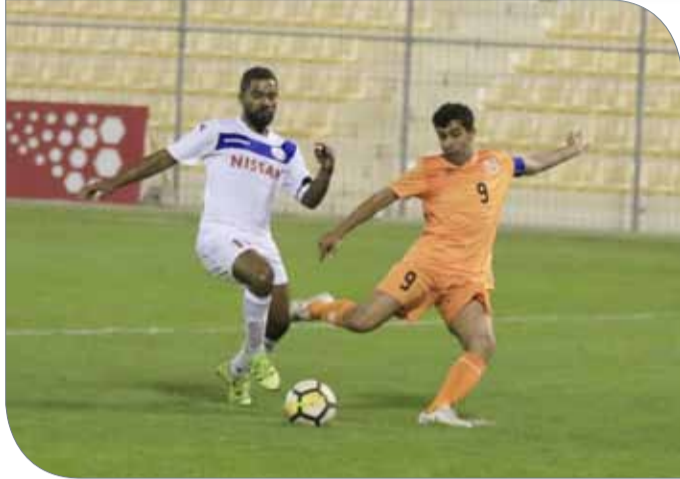
من لقاء الحالة ومدينة عيسى