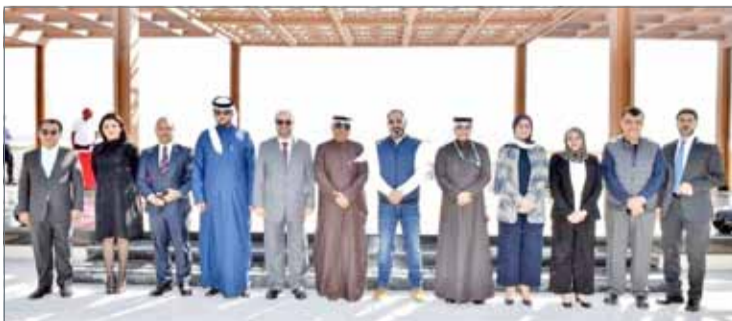
على هامش الاجتماع

سترة - جيبك: استضافت شركة الخليج لصناعة البتر وكيمياويات "جيبك" يوم 16 يناير الجاري الاجتماع المشترك لطاقيم العلاقات العامة والإعلام بالهيئة الوطنية للنفط والغاز، وشركة الأسمدة العربية السعودية (سافكو) التابعة إلى الشركة السعودية للصناعات الأساسية (سابك)، وشركة الخليج لصناعة البتر وكيمياويات.