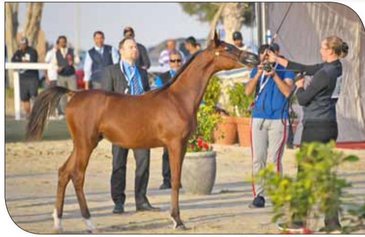
جانب من منافسات البطولة