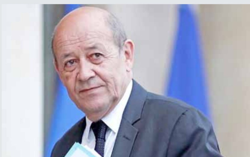
• وزير خارجية فرنسا جان إيف لودريان أمام قصر الإليزيه في باريس يوم 5 يناير

وأشار الوزير الفرنسي إلى أن "فرنسا دعت إلى وقف المعارك والسماح للمساعدات الإنسانية بالوصول إلى الجميع". وأوضح "علينا أن نعمل كل ما يجب من أجل تفعيل وقف إطلاق النار بشكل سريع ونبدأ الحل السياسي الذي طال انتظاره".