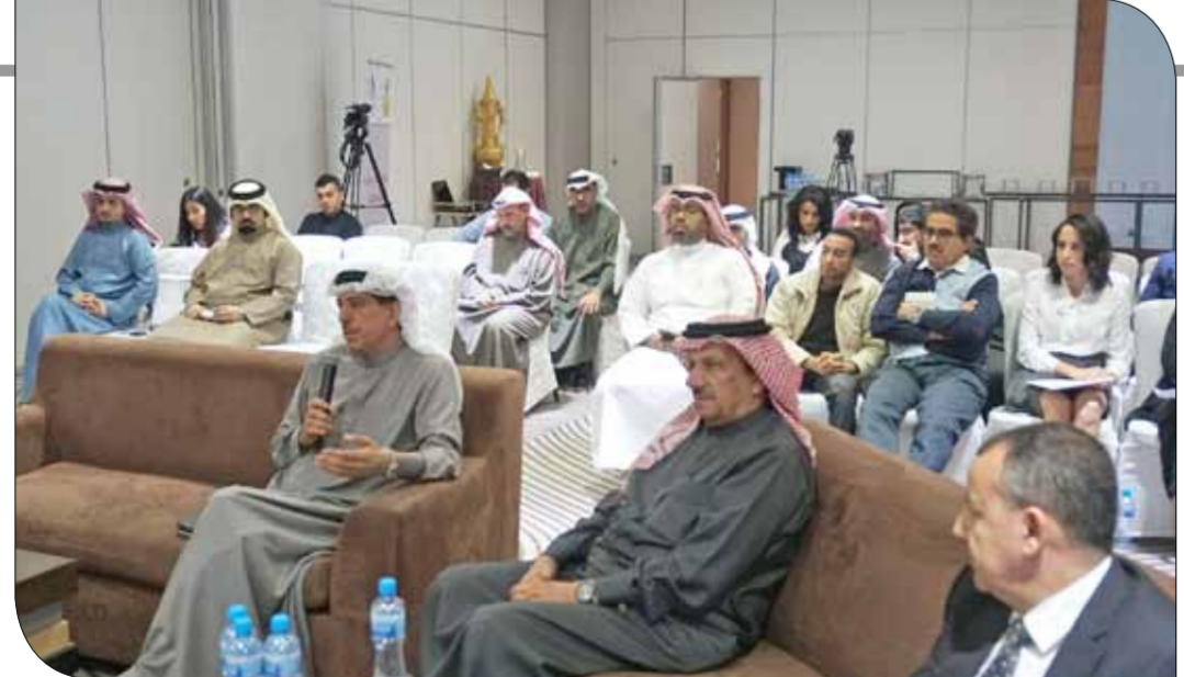
من الحضور في المؤتمر

وستخصص الدورة للأطفال من 3 إلى 5 سنوات، وستتضمن ألعاب كرة القدم، كرة السلة، الجيمبال وألعاب القوى.