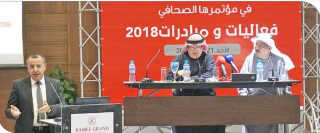
من المؤتمر الصحفي

وبين عسكر أن البحرين ستشارك في دورة الألعاب الأولمبية للناشئين التي ستقام في مدينة بيونس آيريس الأرجنتينية خلال الفترة 6 وحتى 18 أكتوبر المقبل. وذكر أن المشاركة ستكون بناء على تأهل المنتخب الوطنية في البطولات القارية والإقليمية، وإلا في غير ذلك، فإن اللجنة المنظمة وجهت دعوى بالطاقة البيضاء للبحرين للمشاركة بلاعب ولاعبة في ألعاب القوى، ولاعبة في رفع الأثقال، بالإضافة إلى لاعب في التنس الأوقي.