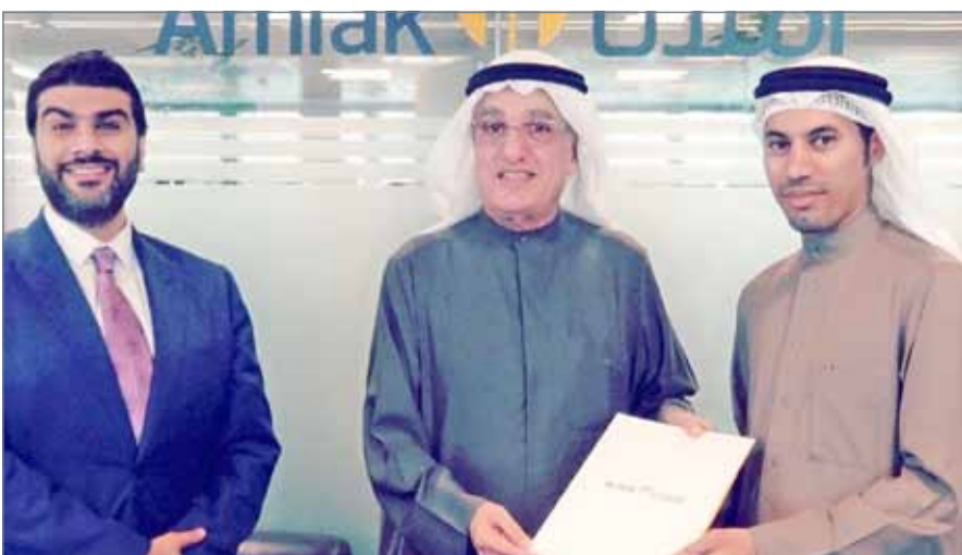
• "برج الساية" مشروع سكني بمنطقة البستين

المنامة - أملك: عينت شركة أملك الهيئة العامة للتأمين الاجتماعي للتطوير، الزراعة الاستثماري والعقاري المملوكة للهيئة العامة للتأمين الاجتماعي، مجموعة الغناة كمقاول رئيس لمشروع "برج الساية". وهو مشروع سكني سيتم تشييده في منطقة البستين شمال المحرق ويتكون من برجين يتميزان بتصميم استثنائي أنيق ومفهوم فريد من نوعه حيث يحتويان على 128 شقة وطابقين لمواقف