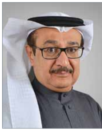
• راشد العليوي

بأمر بنك البركة الإسلامي بإنشاء فلتز خاص على برنامج التواصل الاجتماعي (SnapChat)، وذلك بهدف دعم الحملة الرياضية لممثل جلالة الملك للأعمال الخيرية وشؤون الشباب رئيس المجلس الأعلى للشباب والرياضة رئيس اللجنة الأولمبية البحرينية سمو الشيخ ناصر بن حمد آل خليفة، والتي ترفع شعار "الذهب فقط" للمنتخبات والأندية البحرينية في مشاركتها الخارجية في العام 2018.