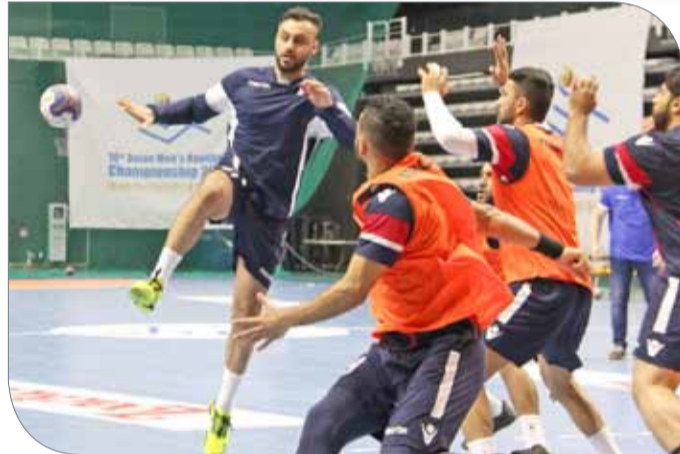
لقطات من التدريبات الأخيرة

الفنية تكاد تكون مشكوفة لدى المنتخبين ومعرفة إمكانات اللاعبين لكلاهما في ظل المواجهات المتكررة بينهما في أكثر من مناسبة في السنوات القليلة الماضية سواء على مستوى الأندية أو المنتخبات، إلا أن منتخبنا قادر وبفضل الإمكانيات الفنية للاعبين وإجادتهم في تنفيذ المهام والمتطلبات من قبل الجهاز الفني على حسم الأمور والخروج بنتيجة المباراة في الجولة الأولى من هذا الدور.