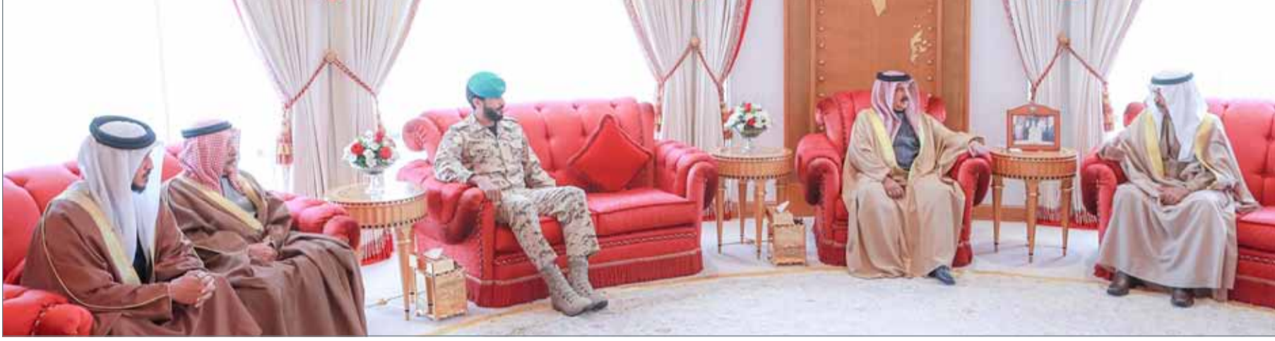
● جلالة الملك مستقبلا سمو رئيس الوزراء

● ماضون في تبني المبادرات التنموية وتوظيف الإمكانيات كافة لتلبية تطلعات المواطنين