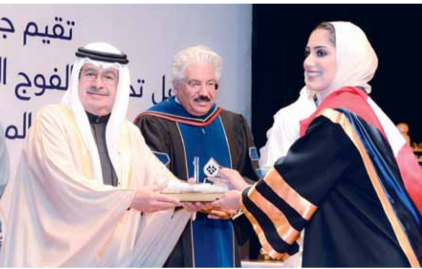
• نيابة عن سمو رئيس الوزراء، سمو نائب رئيس مجلس الوزراء يحضر حفل تخريج الفوج 23