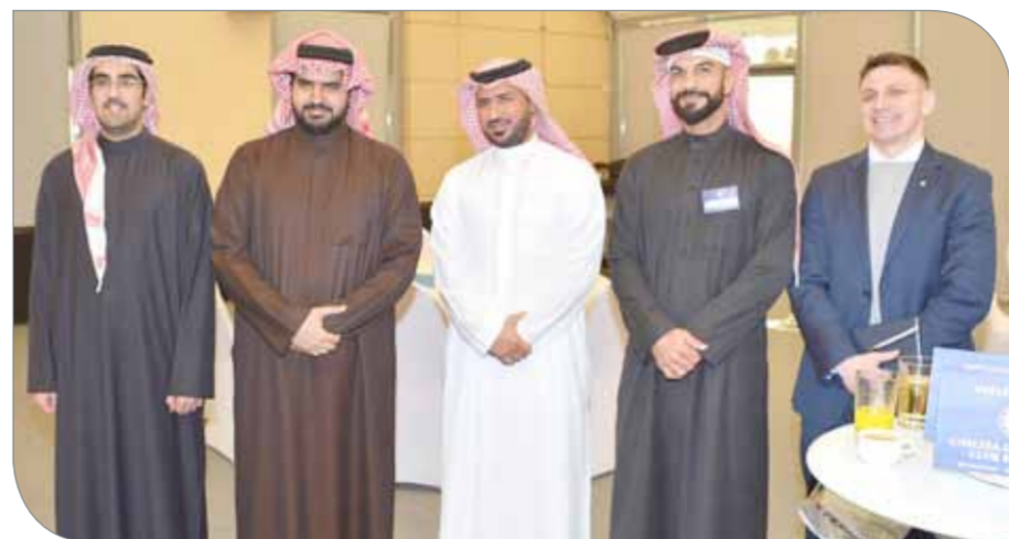
من لقاء سماهير ومدنية عيسى

ونوه بالدور الكبير والتعاون المثمر مع وزارة التربية والتعليم، بالإضافة إلى وزير التربية والتعليم ماجد