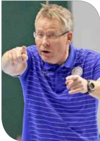
المدرّب الأيسلندي جودنسون

وقال جودنسون إنه من الصعب تقييم أداء المنتخب في أول مباراتين له أمام استراليا وعمان والحكم على المستوى الحقيقي له، فالمباراة الأولى كانت سهلة وفي متناول اليد باعتبار أن المنتخب الإسترالي لم يكن قوياً، وأمام عمان قدمنا أداءً جيداً في الشوط الأول من التاحيتين الدفاعية والهجومية ولكن في الشوط الثاني لم تكن جديدين بالصورة المطلوبة، ولكننا اليوم الآن سنقابل منتخباً أكثر صعوبة مثل الإمارات واليابان وقطر وهو ما سيرزى الوجه الحقيقي بالنسبة إلينا.