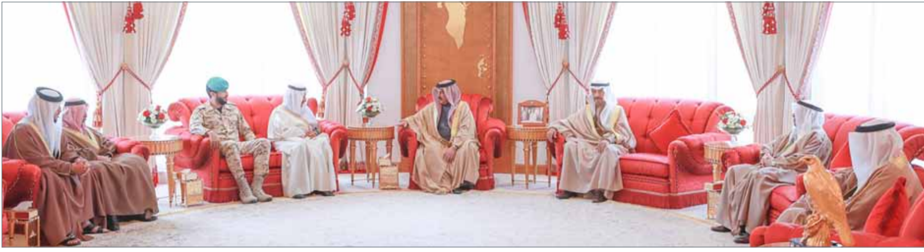
● جلالة الملك مستقبلا، بحضور سمو رئيس الوزراء، السفير السعودي

النامة - بنا: استقبل عاهل البلاد صاحب الجلالة الملك حمد بن عيسى آل خليفة في قصر الصخير أمس رئيس الوزراء صاحب السمو الملكي الأمير خليفة بن سلمان آل خليفة. وجرى خلال اللقاء استعراض عدد من القضايا ذات الشأن المحلي الهادفة لدفع عجلة التنمية والتطور في المملكة وتحقيق رضاء شعبيها. وأكد جلالته الملك أن المملكة ماضية في تبني المبادرات التنموية وتوظيف الإمكانيات كافة لتلبية تطلعات المواطنين وتحقيق المزيد من الإنجازات الوطنية، مشيراً إلى أهمية التوافق بين السلطتين التنفيذية والتشريعية لتحقيق كل ما يصبو إليه الوطن والمواطن على صعيد البناء والازدهار، والأولوية للتوافق على إعادة هيكلة الدعم لمستحقيه من المواطنين الذين يتأثرون بزيادة الرسوم، وألا تكون هناك زيادة في الرسوم إلى حين انتهاء اللجنة المشتركة بين السلطتين بشأن ذلك وبعد أن يتحقق ديوان الرقابة المالية من أن ما تم هو وفقاً للقوانين والمعايير المعمول بها في مملكة البحرين.