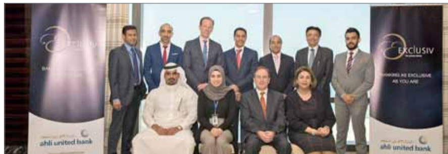
• مشاركون في الندوة

مثل جولدمان ساكس، وهي فعالية تعكس حرصنا على تعميق تواصلنا المستمر مع عملائنا الكرام وتقديم الخبرات والاستشارات الرصينة التي تمكنهم من تقييم مختلف الخيارات الاستثمارية وتسهم في حماية وتنمية أصولهم على المدى البعيد، كما نعزز بالتفاعل الكبير من قبل جمهور الحضور مع ما طرحه الضيف الزائر من عرض رفيع لأحدث مستجدات وتحديات المناخ الاستثمار العالمي ومن نصائح ثمرة عملياً لإستكشاف سبل وفرص النمو الواعدة حتى في ظل التحديات العالية للأسواق”.