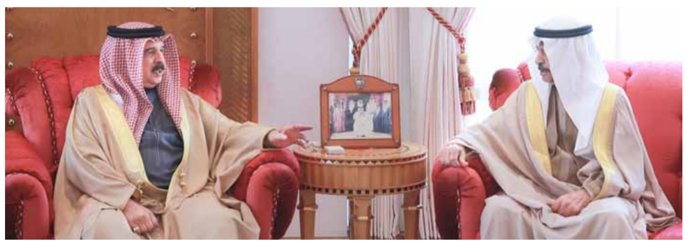
• جلالة الملك مستقبلا سمو رئيس الوزراء