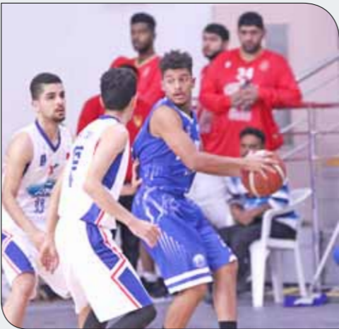
من لقاء سماهير ومدنية عيسى

تذوق فريق سماهير طعم الانتصار الأول له في دوري زين لكرة السلة للرجال بفوزه على مدينة عيسى، فيما واصل المحرق انتصاراته وأحق خسارة جديدة بفريق ستر، في المباراتين اللتين جمعتهما مساء أمس (الأحد)، على صالة اتحاد النجعة بأم