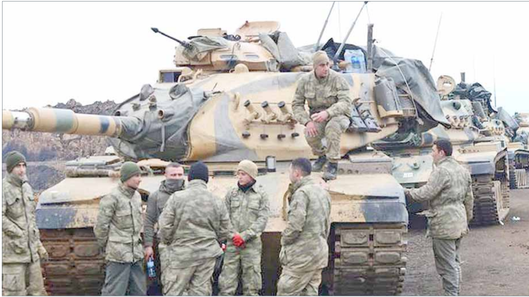
• قوات تركية على الحدود السورية التركية أمس