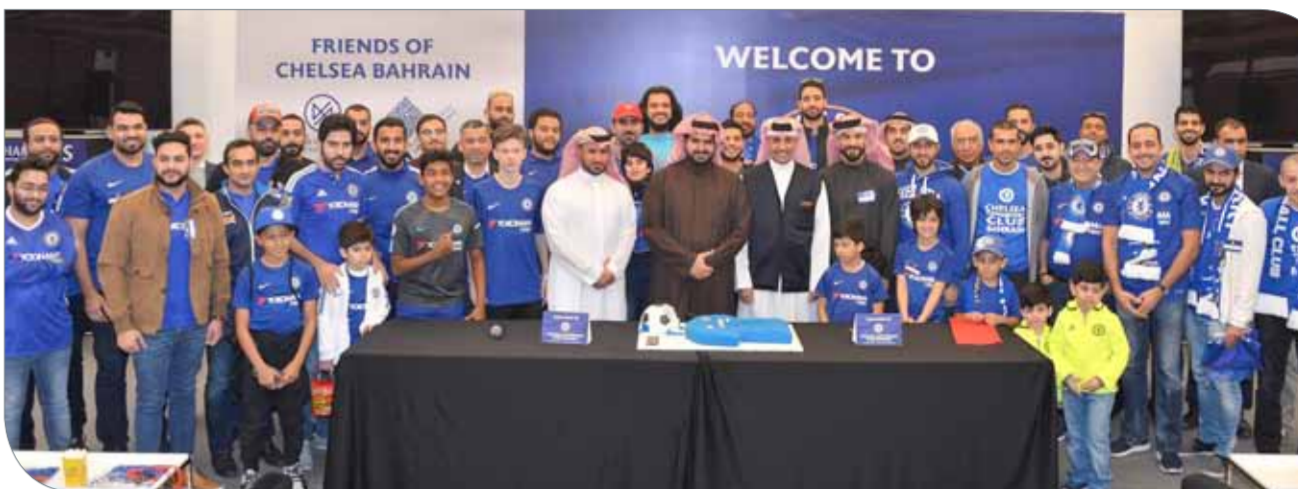
من لقاء سماهير ومدنية عيسى

وأشار عسكر إلى أن استمرار إقامة الأمسية يأتي تجسيدا لاهتمام مجلس إدارة اللجنة الأولمبية بالقادة الرياضيين الذين قدموا العطاء الكبير، وذلك من خلال منحهم جائزة الشيخ عيسى بن راشد للعمل التطوعي في المجال الرياضي.