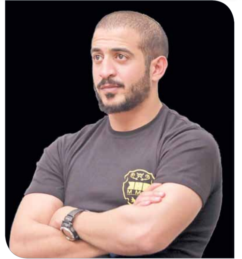
سمو الشيخ خالد بن حمد آل خليفة

وجه سمو الشيخ خالد بن حمد آل خليفة النائب الأول لرئيس المجلس الأعلى للشباب والرياضة رئيس الاتحاد البحريني لألعاب القوى، الرئيس الفخري للاتحاد البحريني لرياضة ذوي الاعاقة لتخصيص ربع بطولة #أقوى_رجل_بحريني لدعم مرضى السرطان، مع تزامن إقامة هذه البطولة تحت رعاية سموه وتنظيم من المكتب الإعلامي لسمو الشيخ خالد بن حمد بن عيسى آل خليفة تحت شعار #خلك_وحش_ب_ "خليج البحرين" في موعدها بالفترة 22-24 فبراير المقبل، مع اليوم العالمي لمكافحة مرض السرطان في شهر فبراير من كل عام. وقال سمو الشيخ خالد بن حمد آل خليفة: "اتخذنا قرارنا بتخصيص ربع البطولة لدعم مرضى السرطان، والذي يأتي من منطق