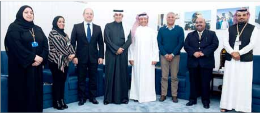
لقاء الإدارة التنفيذية لطيران الخليج وممثلي النقابات

إضافة تأثير سلبي على بيئة العمل. كما أكد ضرورة تفعيل دور النقابات بهذا الخصوص كشركاء داخليين للناقلة؛ بهدف الوصول لرؤية مشتركة لطيران الخليج في سبيل إنجاح أهداف الناقله الاستراتيجية في التطوير.