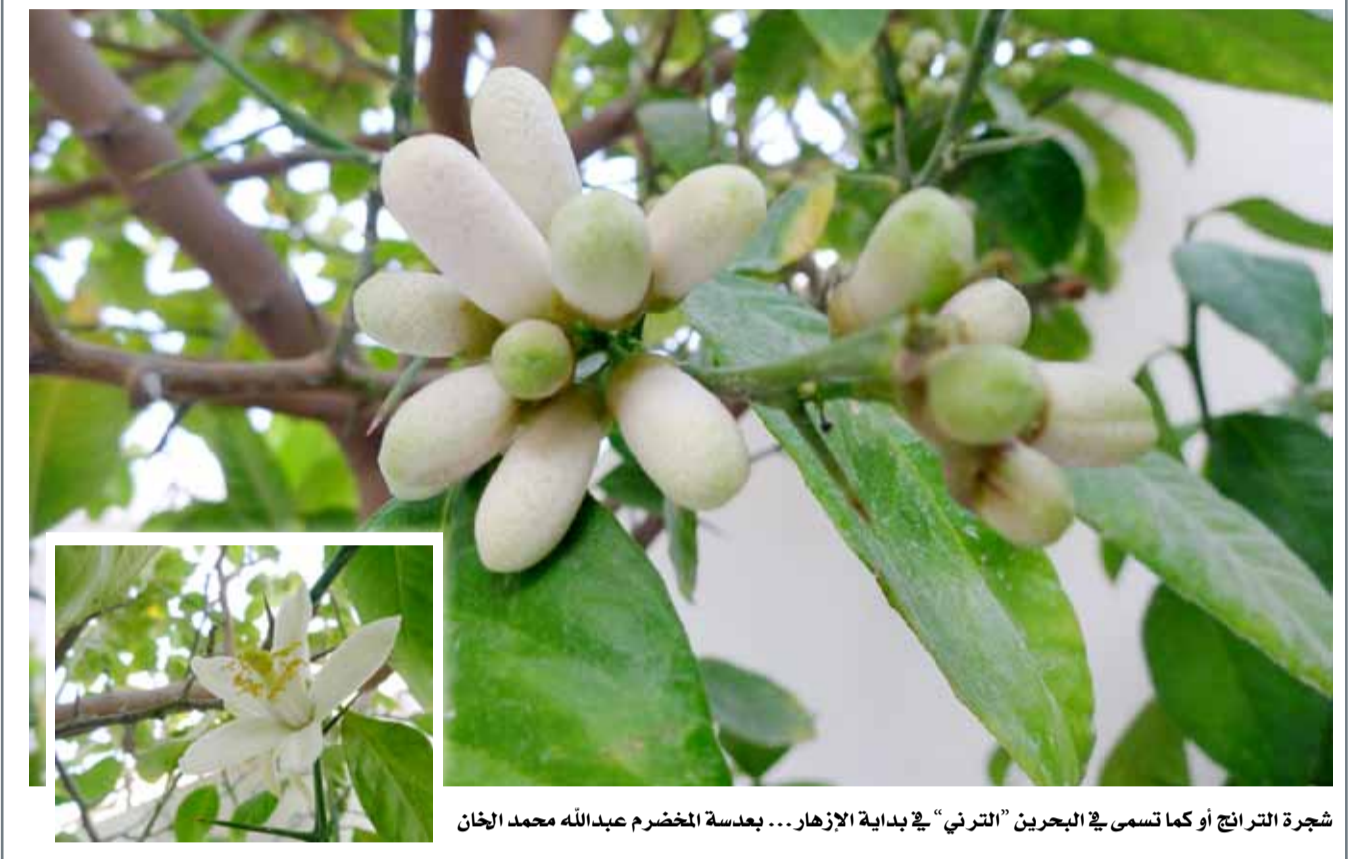
شجرة الترانج أو كما تسمى في البحرين "الترني" في بداية الأزهار... بعدسة المخضرم عبدالله محمد الخان