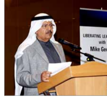
• جانب من الورشة التفاعلية "القيادة الفاعلة"

الماضية إذا تم الاستفادة من زيادة النشاط الإعلاني في الأسواق العالمية إذ من المفترض أن يكون لها مردود على أسواقنا المحلية. ونظمت ورشة العمل التفاعلية "القيادة الفاعلة"، جمعية المعلنين البحرينية فرع