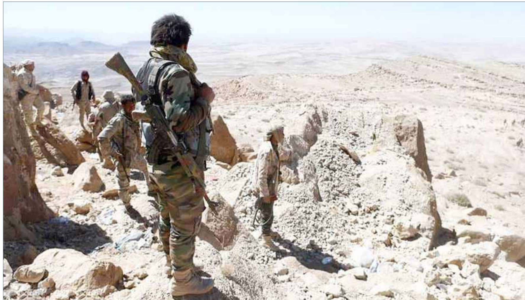
• قوات الشرعية أعلنت شرق تعز منطقة عسكرية

وأضافت الخارجية الأميركية أن "هنية تربطه صلات وثيقة مع الجناح العسكري لحماس وهو يؤيد العمل المسلح بما في ذلك ضد المدنيين".