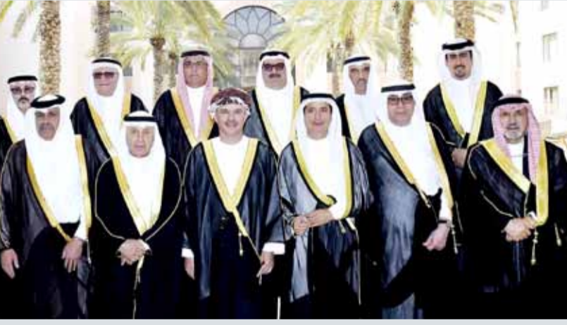
مسقط - إنفستكوروب : عقد

مجلس إدارة شركة "إنفستكوروب" اجتماع مجلس إدارتها في سلطنة عمان، وتعد هذه المرة الأولى التي يعقد فيها الاجتماع في عُمان. وبحسب بيان صادر عن الشركة أمس الأربعاء، قال رئيس مجلس الإدارة التنفيذي لـ "إنفستكوروب"، محمد محفوظ العارضي "لطالما كانت سلطنة عمان تحظى بأهمية كبيرة لدى إنفستكوروب باعتبارها سوقاً رئيسة بالمنطقة؛ لذا كان من الطبيعي أن ينعقد اجتماع