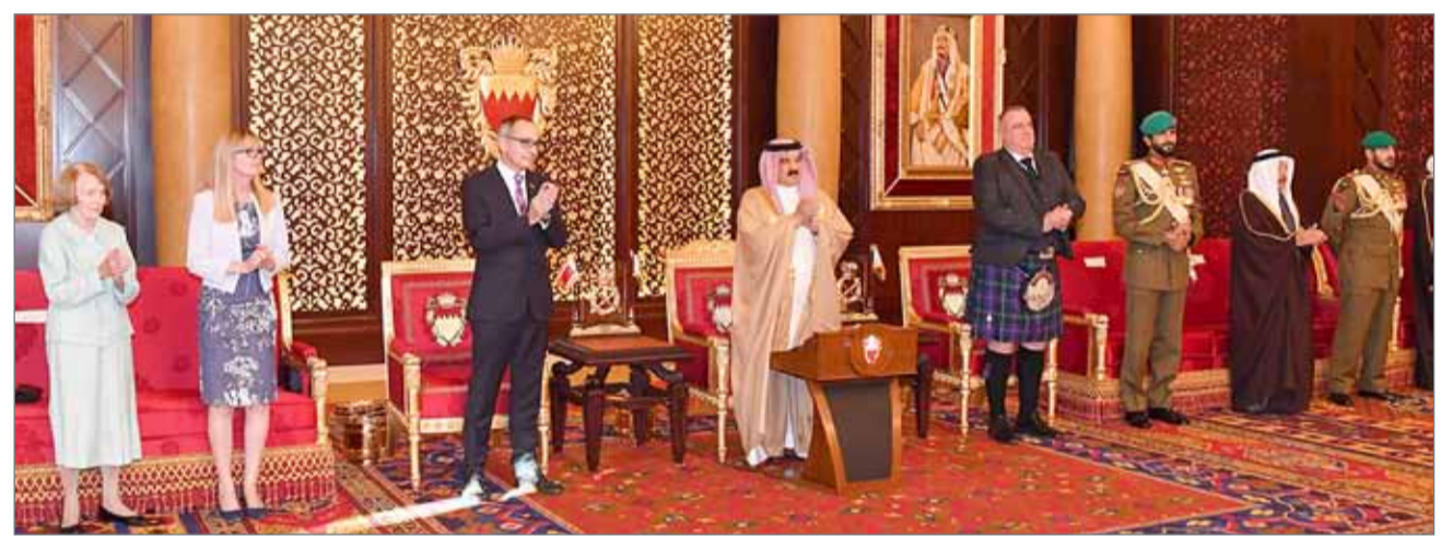
• جلالة الملك مستقبلاً سفير المملكة المتحدة وأعضاء الجالية الاسكتلندية

الجالية؛ ممتنون للحرية... ولا حدود لطبيعة البحرينيين الودية