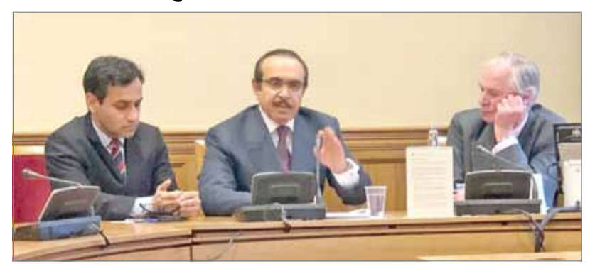
• وزير الداخلية يتحدث في اللقاء

المنامة - وزارة الداخلية: اتفق وزير الداخلية الفريقي الركن الشيخ راشد بن عبدالله آل خليفة مع وزيرة الداخلية بالمملكة المتحدة أمبر راد على مراجعة الاتفاقية الأمنية الموقعة بين البلدين الصديقين والعمل على تطويرها بما يسهم في دعم مجالات التعاون المتعلقة بالتدريب وتبادل المعلومات والجرائم المستحدثة.