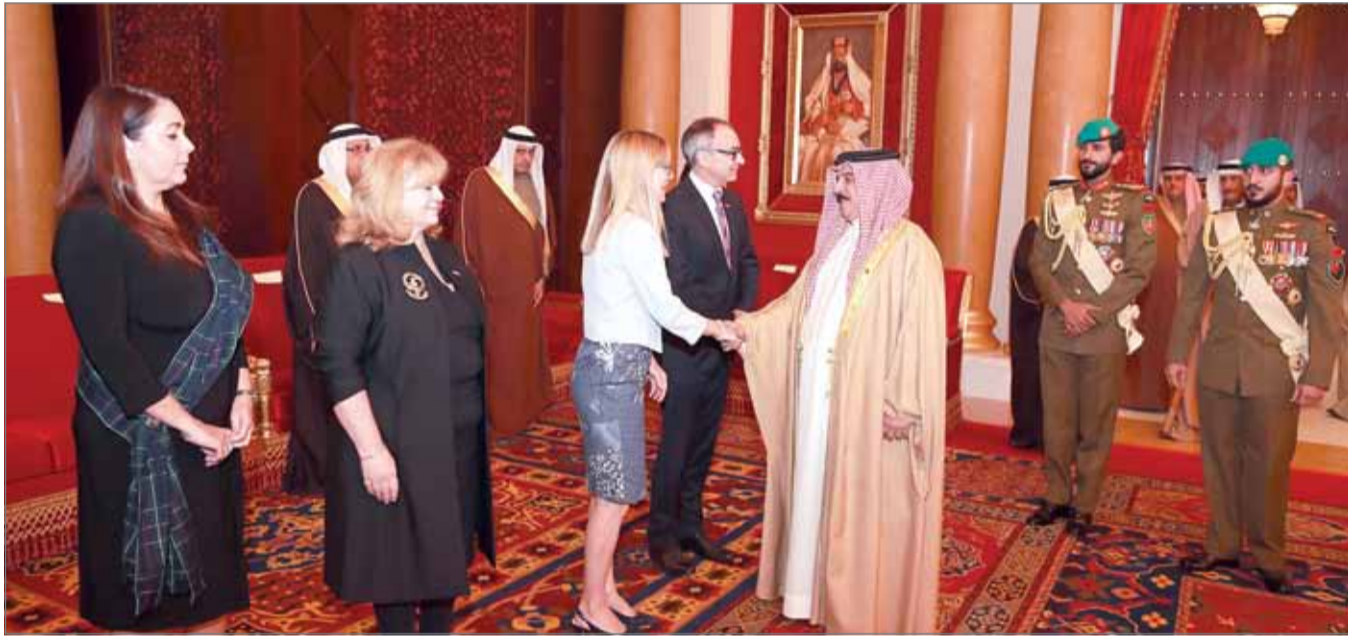
• جلالة الملك مستقبلا سفير المملكة المتحدة وأعضاء الجالية الأستكندية

صاحب الجلالة، مرة أخرى، نغير نحن الأستكنديين عن عميق امتناننا لكم ضيافتكم. هذا وقدمت هدية إلى جلالة الملك باسم الجالية الأستكندية بهذه المناسبة.