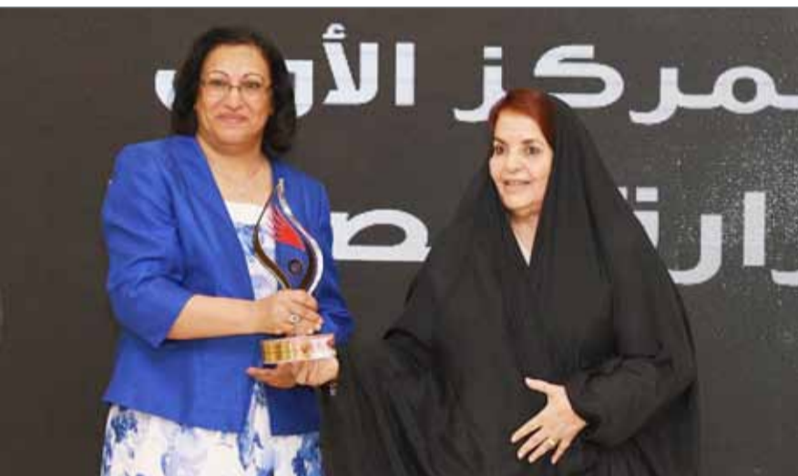
• صاحبة السمو تكرم وزارة الصحة بالمركز الأول عن القطاع العام