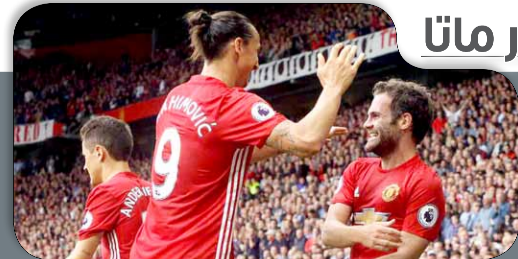
زلتان إبراهيموفيتش وخوان ماتا

وتضم المجموعة الثالثة كلا من، السويدي يوهان كريستوفرسون، والألماني ريني راست، والبريطاني لاندو نوريس، فيما تشمل المجموعة الرابعة، الأميركي جوزيف نيوجاردن، والسعودي