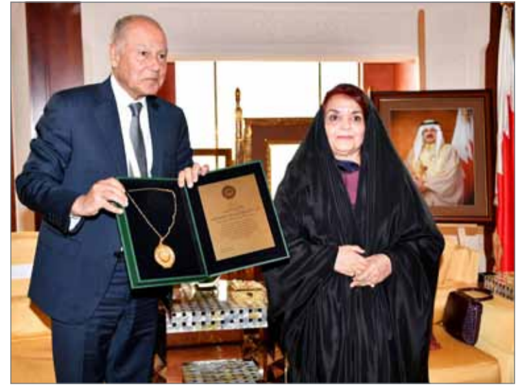
• تكريم صاحبة السمو الملكي قرينة العامل بقلادة المرأة العربية