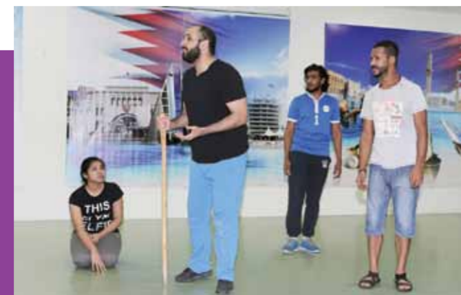
جانب من البروفات