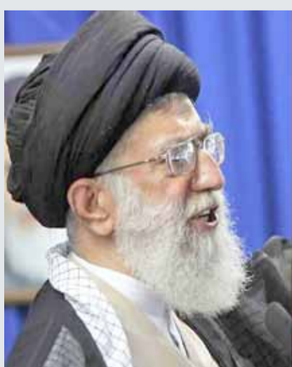
• الرئيس روحاني والمرشد علي خامنئي

ورغم البطش الذي تعرض له المتظاهرون، تشهد مدن إيرانية للآن مسيرات احتجاج متفرقة.