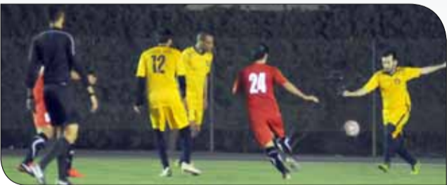
من لقاء بابكو وطيران الخليج في الدوري