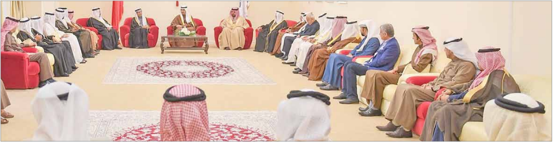
• سمو الشيخ خليفة بن علي مستقبلاً، بحضور سمو الشيخ عيسى بن علي، وجهاء وأعيان المحافظة الجنوبية وعدداً من الصحفيين وجمعاً من الأهالي

تنفيذا لتوجيهات القيادة للبقاء وبشكل مباشر على مقربة منهم... سمو محافظ الجنوبية: