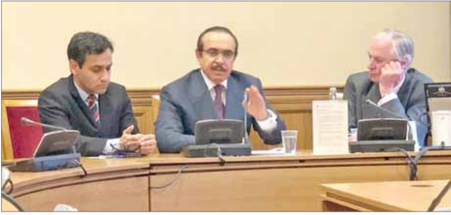
• وزير الداخلية يتحدث في اللقاء

كما أعرب أعضاء البرلمان البريطاني عن شكرهم وتقديرهم لمملكة البحرين على استضافة مقر التسهيلات البحرية البريطانية، انطلاقاً من العلاقات المتميزة والتي تمتد لأكثر من 200 عام. من جهته، أشاد الوزير بالعلاقات التاريخية والوثيقة بين مملكة البحرين والمملكة المتحدة، والتي تعد أرضية جيدة لتعزيز التعاون والتحرك بشكل متقدم في مجال مكافحة الإرهاب، منوهاً إلى ما وصل إليه التعاون الأمني والثقة المتبادلة، معبرا عن تقديره للبرلمان البريطاني، ومثمناً دوره في تصنيف مجموعات بحرينية خارجة عن القانون، كمنظمات إرهابية، بما من شأنه تحفيز الآخرين على اتخاذ خطوات مماثلة ضد المنظمات والمجموعات الإرهابية التي تعبت بأمن واستقرار البحرين، في إطار الجهود الدولية لمكافحة الإرهاب. كما أطلع الوزير أعضاء البرلمان البريطاني على الأوضاع الأمنية في البحرين والتحديات التي تواجهها والجهود التي تبذلها في مجال مكافحة الإرهاب. وعقد وزير الداخلية حواراً مفتوحاً مع أعضاء البرلمان البريطاني تناول عدداً من الموضوعات والقضايا ذات الاهتمام المشترك.