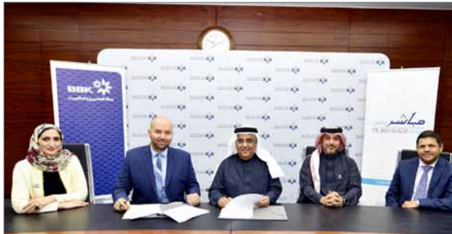
• أثناء توقيع الاتفاقية

مزودة بتكنولوجيا مباشر للخدمات المالية حيث إننا ملتزمون بشكل كامل بتوفير أفضل حلول التداول وتشجيع المستثمرين على الاستثمار من خلال هذه التكنولوجيا الجديدة".