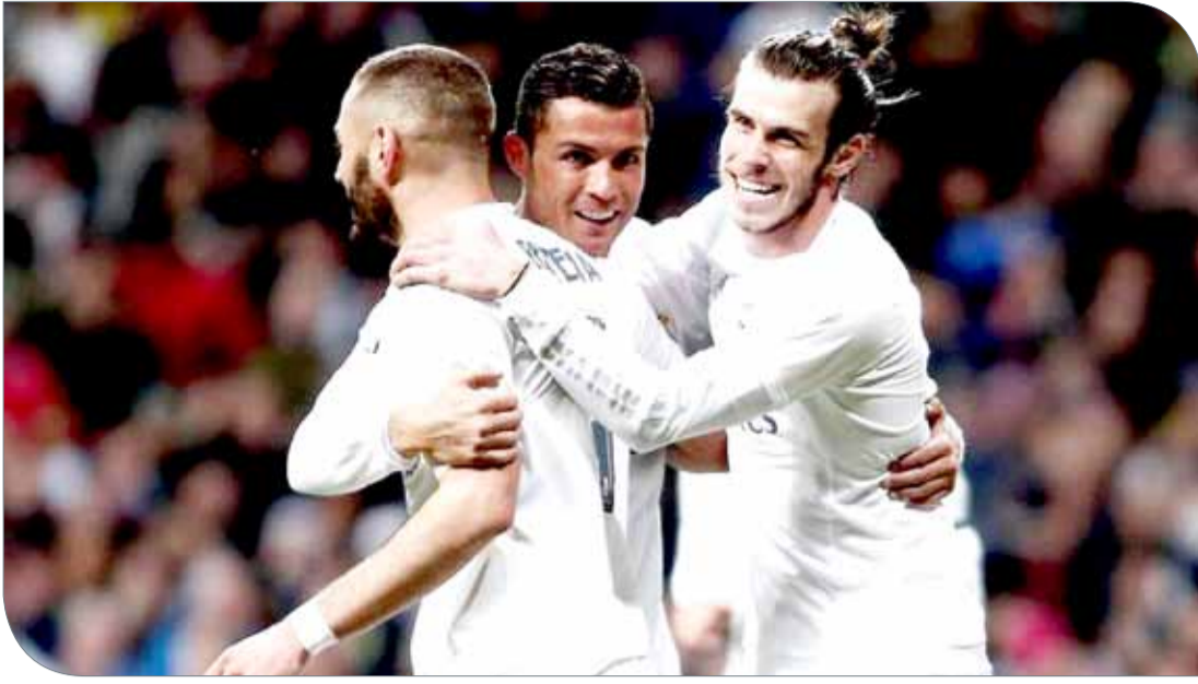
ثلاثية "بيبي بيه سيه"

الصحيفة إن مورينيو نفسه، يبدو غير متحمس للتعاقد مع اللاعب، بسبب سجله السيئ مع الإصابات المتكررة، إلى جانب تعاقد "الشياطين الحمر" مؤخرًا، مع المهاجم التشيلي، أليكسيس سانشينز.