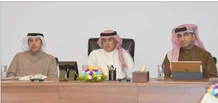
• وزير الصناعة والتجارة والسياحة يتراأس الاجتماع

2016 - 2017 ارتفاعاً ملحوظاً في السياحة الوافدة، إذ وصل عدد الزوار إلى 12.7 مليون زائر، وازدادت نسبة الرحلات الوافدة لمطار البحرين الدولي بمعدل 11.85%، و11.87% عن طريق جسر الملك فهد، بينما جاء ميناء خليفة بن سلمان في المرتبة الثالثة بنسبة 23.2%. وفي ختام الاجتماع، عبر المجلس عن خالص تقديره وشكره لإدارة التنفيذية وجميع موظفي الهيئة على جهودهم المخلصة لتحقيق أفضل الإنجازات وتبوء قطاع السياحة والمعارض مرتبة مرموقة لدعم الاقتصاد الوطني لمملكة البحرين.