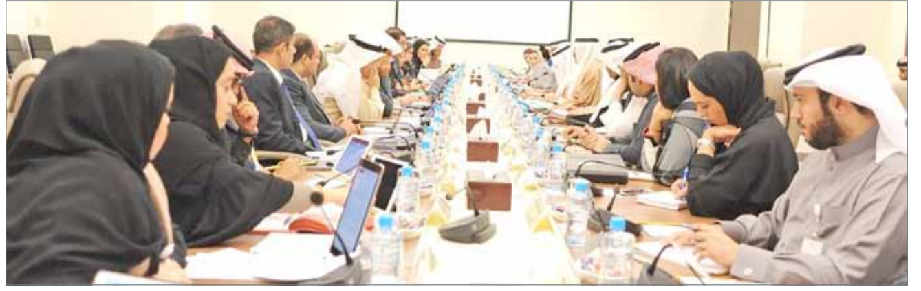
• جانب من اجتماع اللجنة المشتركة بحضور وزير العمل رئيس الوفد الحكومي للجنة الفرعية