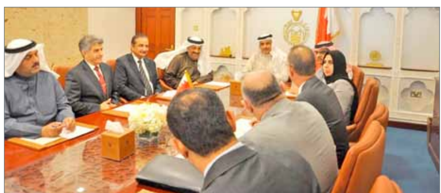
• وزارة الإسكان تعقد اجتماع عمل مع شركة "AESG"

على الأصعدة كافة، منوهاً بجهود اساكو المثمرة في تعزيز العلاقات الثنائية بين البلدين الصديقين، متمنياً له كل التوفيق والنجاح. من جانبه، أعرب اساكو عن شكره وتقديره لما لقيه من دعم لتسهيل أداء مهامه خلال فترة عمله سفيراً لليابان لدى مملكة البحرين، مشيداً بالعلاقات المتميزة التي تربط بين البلدين الصديقين، متمنياً للمملكة البحرين دوام التقدم والازدهار.