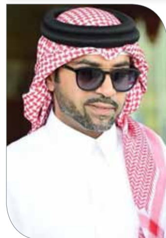
سمو الشيخ فيصل بن راشد

للفروسية وسباقات القدرة يحرس دائماً على تقييم جميع المسابقات بعد الانتهاء منها؛ وذلك رغبة منه في تحقيق عوامل التطوير للمسابقات، متمنياً لجميع الفرسان المشاركين في الموسم الجديد لمسابقات القفز التوفيق وتحقيق تطلعاتهم وأفضل النتائج التي يطمحون لها.