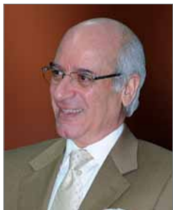
• وزير شؤون مجلس الوزراء

بعدها ناقشت اللجنة الموضوعات المطروحة على جدول الأعمال، إذ تم استعراض المهام الموكلة للجنة وتحديداً ما يتعلق بمتابعة أهداف التنمية المستدامة من قبل المكتب التنفيذي، وإنشاء قاعدة معلومات وطنية شاملة تتضمن بيانات محدثة بشأن ما يتعلق بالمؤشرات والمعلومات الخاصة بمملكة البحرين والمعاهدات والاتفاقيات الدولية والعلاقات الثنائية التي تربط المملكة بالدول الأخرى. كما تم استعراض آلية تطوير إعداد الإحصاءات الاقتصادية ومستجدات تحديث قانون الإحصاء، وفي الاجتماع، استعرضت وزارة الصحة مشروع المسح الصحي الوطني والذي سينفذ وفق آليات محددة من قبل منظمة الصحة العالمية.