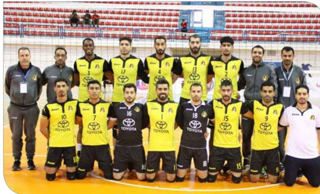
الأهلي، بلغ ربع النهائي بكل جدارة