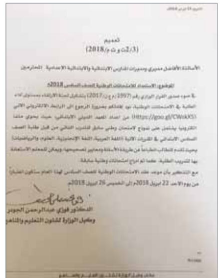
• صورة ضوئية من التعميم الصادر من مكتب وكيل الوزارة لشؤون التعليم والتدريب

والرياضيات. وأشار إلى أن محتوى نماذج الامتحانات تقدم لامتحانات انطباً عن طريقة الأسئلة ومعايير تصحيحها، ويمكن للمعلم الاستعانة بها لتدريب الطلبة، بالإضافة إلى أنه تم إدراج امتحانات وطنية سابقة. واستند الجودر في تعميمه على القرار الوزاري بتشكيل لجنة الارتقاء بمستوى أداء الطلبة في الامتحانات الوطنية. المدير بالذكر أن الامتحانات الوطنية للصف الثاني عشر حسب دليل الامتحانات والعمليات المدرسية للعام الدراسي الجاري، ستبدأ من يوم الأحد 4 مارس وستستمر حتى 7 مارس المقبل، ومن ثم ستليها الامتحانات الوطنية للصف السادس أبريل المقبل.