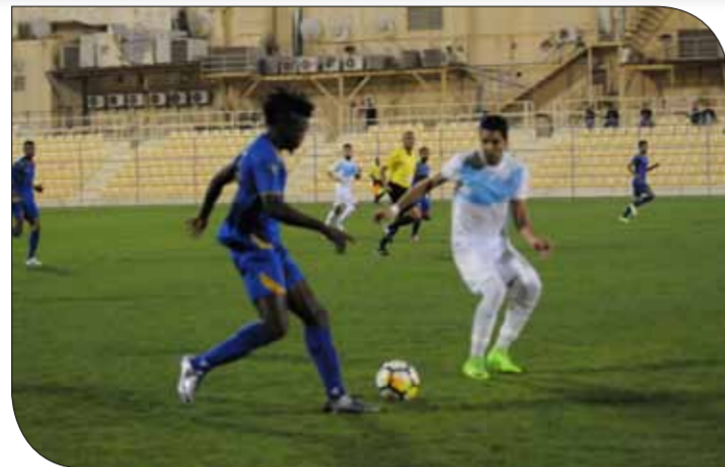
من لقاء الحد والرفاع

حافظ المحرق على فارق النقاط الثمان في صدارة دوري بنك البحرين الوطني لأندية الدرجة الأولى لكرة القدم، رغم تعادل السلب مع النجمة، يوم أمس، في اللقاء الذي جمعهما على استاد مدينة خليفة الرياضية، ضمن ختام الجولة 13 من المسابقة. وبقي المحرق في ريادة الترتيب متبوعاً عن أقرب المنافسين النجمة صاحب الوصافة، في حين عجز عن التفوق مرة أخرى على النجمة بعدما خسر في نهائي كأس الملك الأسبوع الماضي بركلات الترجيح. وشهدت مباراة المحرق والنجمة حضوراً جماهيرياً جيداً أمس، في حين لم تحظ المباراة بكثير من الإشارة أو الندبة، إذ نذرت الفرص المحققة للتهديف بشكل واضح.