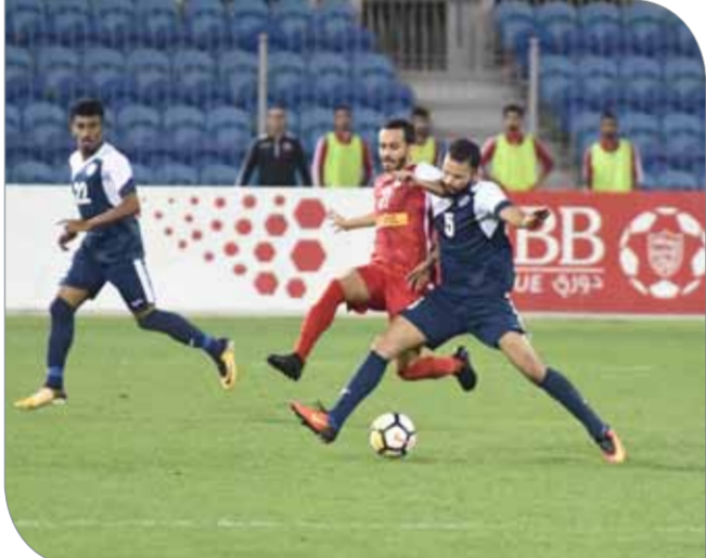
من لقاء المحرق والنجمة