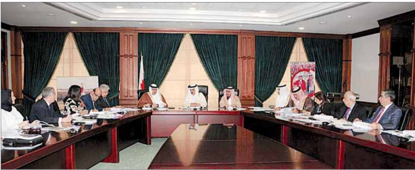
• الاجتماع الثالث والأربعون لمجلس التعليم العالي