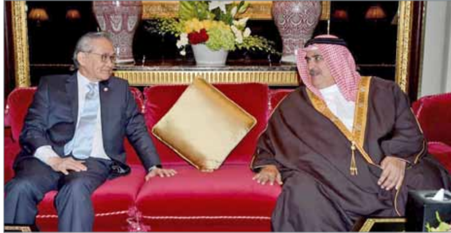
• جانب من اجتماع اللجنة المشتركة بين مملكة البحرين ومملكة تايلند

تطوير العلاقات بالمجال التجاري والصحي والأمن الإنساني