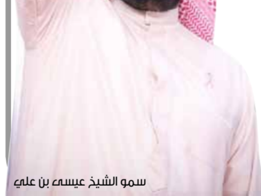
سمو الشيخ عيسى بن علي

العالية التي تمتاز بها السلة البحرينية وما تتمتع به من شعبية عالية بالمنطقة. وأوضح سمو الشيخ عيسى بن علي آل خليفة أن الاتحاد حرص على تقديم كامل الدعم للجماهير الوافدة؛ من أجل الحضور ومساندة منتخبنا الوطني في هذه المهمة،