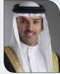
علي بن خليفة

يرأس رئيس الاتحاد البحريني لكرة القدم الشيخ علي بن خليفة بن أحمد آل خليفة وفد مملكة البحرين المشارك في القمة التنفيذية للإدارات التنفيذية للاتحاد الدولي لكرة القدم "الفيفا"، والتي تعقد للاتحادات الأعضاء والأمناء العامين في العاصمة التنازانية (دار السلام) بدءاً من الأربعاء 21 فبراير الجاري وحتى الجمعة 23 من الشهر ذاته. ويشارك رئيس الاتحاد في أعمال القمة بحضور الأمين العام للاتحاد الكرة إبراهيم البوعيين. وتأتي القمة التنفيذية كواحدة من المبادرات التي أطلقها الفيفا جزءاً من الإصلاحات لكرة القدم. وتناقش القمة مسائل إستراتيجية مختلفة، كما توفر منبرا للحوار والنقاش وتبادل المعرفة بين الاتحادات الأعضاء. كما تتمثل أهميتها في مستقبل قرارات "الفيفا"، وذلك عبر استخدام الملاحظات والمداخلات المختلفة من جانب ممثلي الاتحادات لعملية التطوير في "الفيفا".