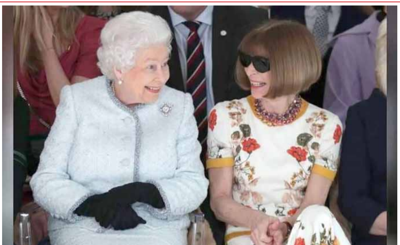
ملكة بريطانيا إليزابيث الثانية (إلى اليسار) تجلس بجوار أن وينتور رئيسة تحرير مجلة فوج الاميركية خلال عرض أزياء بلندن.

حالة الطقس الطقس غائم جزئياً ويتحول إلى غائم مع فرصة لتساقط امطار متفرقة.