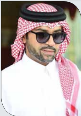
سمو الشيخ فيصل بن راشد

تمنيا لجميع الفرسان المشاركين في الموسم الجديد لمسابقات القفز التوفيق وتحقيق تطلعاتهم وأفضل النتائج التي يطمحون لها. وفي رسالة من سموه لجميع الفرسان، أكد فيها لهم أن إطلاق سمو الشيخ ناصر بن حمد آل خليفة على هذا العام شعار (الذهب فقط) يشكل اليوم حفازاً معنوياً كبيراً ومنعياً للتسلح بالعزيمة والإصرار للوصول للقمّة وصعود منصات التتويج، وتحقيق أفضل النتائج، وكسب أعلى المراكز والمراتب، وهو ما يساهم بشكل مباشر في رفع المستويات التي يسعى الاتحاد الملكي لها على جميع الأصعدة.