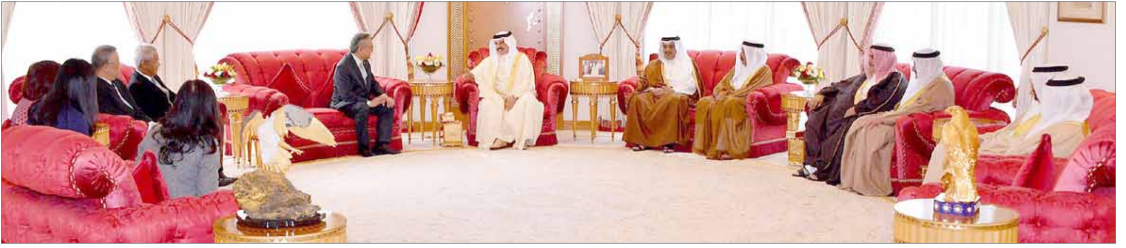
• جلالة الملك مستقبلاً وزير الخارجية التايلندي

نتطلع للاستفادة من خبرات البلدين في دعم المشاريع