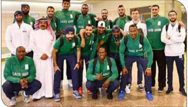
بعثة المنتخب السعودي لكرة السلة

♦ أم الحصم - اتحاد السلة: وصلت إلى المملكة في ساعة مبكرة من صباح يوم أمس الأربعاء بعثة المنتخب السعودي الأول لكرة السلة المشاركة في مرحلة الذهاب من تصفيات الاتحاد الدولي المؤهلة لكأس آسيا 2021، حيث تبدأ التصفيات غدا الجمعة المقبل الموافق 23 فبراير، وتستمر حتى الإثنين من الشهر ذاته.