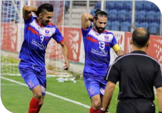
فردة منامية بالهدف الثاني