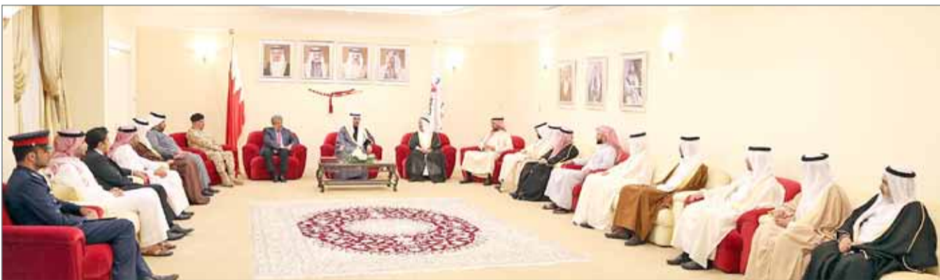
• سمو محافظ الجنوبية مستقبلاً عدداً من كبار المسؤولين والشخصيات البارزة في مجلسه الأسبوعي