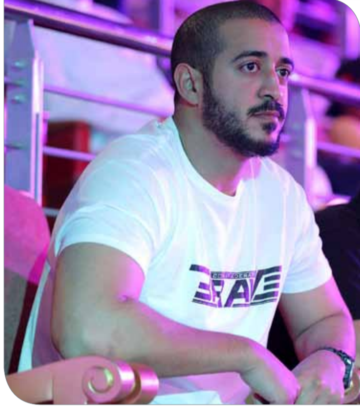
سمو الشيخ خالد بن حمد

اللجنة الإعلامية | بطولة أقوى رجل بحريني