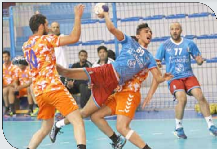
من لقاء الشباب والدير أمس

تختتم اليوم (الخميس) منافسات الدور التمهيدي لمواجهة من العيار الثقيل طرفاها الغربيين التقليديين لكرة اليد البحرينية فريق الأهلي (23 نقطة) والنجمة (27 نقطة) وذلك في تمام الساعة 6.30 مساءً. الأهلي يسعى لتحقيق الفوز السابع وإنزال الهزيمة الأولى بالمتصدر النجمي، فيما الأخير يستهدف إنهاء الدور التمهيدي بالعلامة الناجحة والانتصار العاشر.