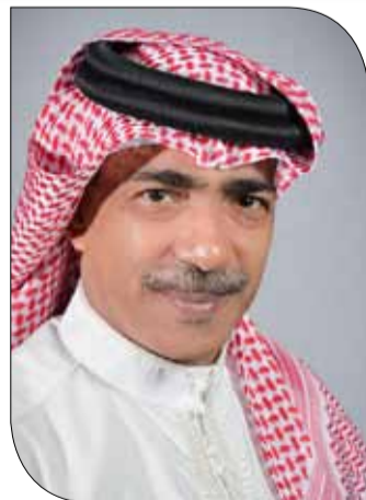
الشيخ علي بن محمد

في تونس، إضافة إلى حضور الحفل الختامي لطولة الأندية العربية لكرة الطائرة السادسة والثلاثين. وتضم اللجنة التنفيذية للاتحاد العربي كلا من اللبناني علي حيدر خليفة نائب الرئيس عن منطقة المشرق العربي، العماني الشيخ بدر الرواس نائبا للرئيس عن منطقة الخليج وشبه الجزيرة العربية، الليبي جمال الزروق نائبا للرئيس عن منطقة إفريقيا، إضافة إلى باقي الأعضاء وهم الفلسطيني حمزة راضي، اليمني محسن أحمد صالح، المغربية بشرى حجاج، الأردني بشير العلوان، القطري علي الكواري، التونسي فراس الفالح، المصري فؤاد عبدالسلام.