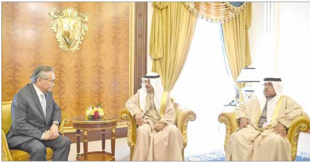
• سمو رئيس الوزراء مستقبلاً وزير الخارجية التايلندي

خارجية مملكة تايلند الصديقة دون برامادويني والوفد المرافق له، حيث رحب سموه بهذه الزيارة، مؤكداً سموه أهمية استمرار التواصل والتنسيق بين المسؤولين في البلدين؛ لبحث آفاق التعاون ووضع آليات لتنفيذ ما تم الاتفاق عليه من اتفاقات ثنائية ومذكرات تفاهم بين البلدين في جميع المجالات.