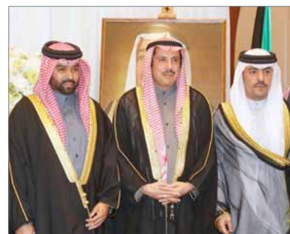
• جانب من احتفال السفارة الكويتية بالعيد الوطني وذكرى التحرير