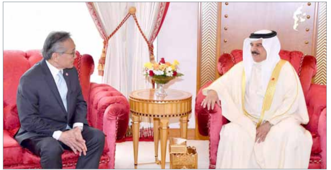
• جلالة الملك مستقبلاً وزير الخارجية التايلندي

المنامة - بنا: أكد رئيس الوزراء صاحب السمو الملكي الأمير خليفة بن سلمان آل خليفة حرص مملكة البحرين على تعميق وتعزيز التعاون الثنائي مع مملكة تايلند الصديقة، بما يسهم في تطوير التبادل الاقتصادي والتجاري بين البلدين. وكان صاحب السمو الملكي رئيس الوزراء قد استقبل بقصر سموه بالرفاع صباح أمس وزير