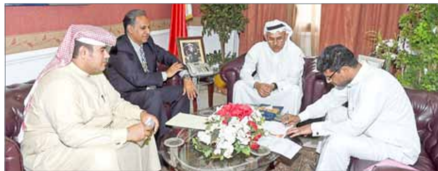
محافظ الشمالية لدى اجتماعه بالمواطن صاحب المنزل المنكوب

العمل حيث أبلغه أنه شرع في إصدار تراخيص الهدم وترتيب استلام الحصة الأولى من التعويض فيما سنتكفل الوزارة بكلفة الهدم وإجرائته.