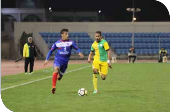
من لقاء المنامة والمالكية