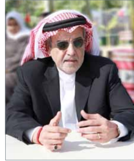
الشيخ خليفة بن عيسى

ومع تزايد الإقبال على سوق المزارعين وتحوله إلى منصة مركزية لتسويق المنتجات المحلية ودعم المزارعين المحليين، بدأت وكالة الزراعة في التوسع