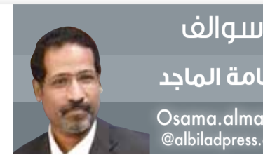
سوالف أسامة الماجد Osama.almajed @albiladpress.com

ربما لن نجد في بلدان العالم العربي والإسلامي ما تتميز به الأسرة الحاكمة في البحرين "آل خليفة الكرام" من جهد كبير في مجال العمل الاجتماعي والخيري بمختلف المستويات، فالمسارعة في عمل الخير سمة حكامنا حفظهم الله والتاريخ مليء بالقصص والمواقف الإنسانية الكثيرة ابتغاء وجه الله سبحانه وتعالى، وهذا من فضل الله على البحرين التي تتبوأ أرقى مراتب الفخر والتلاحم والتعاقد بين الحاكم والشعب. قبل أيام أمر سيدي صاحب الجلالة