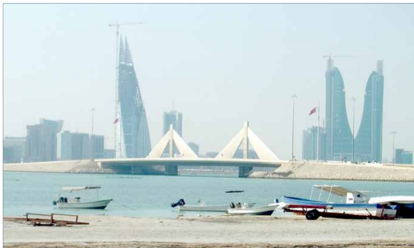
• إنشاء ممشي مفتوح بطول الموقع