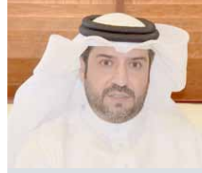
• عاصم عبدالله

الرفاع - بلدية المنطقة الجنوبية: صرح مدير عام بلدية المنطقة الجنوبية عاصم عبدالله بأن البلدية ممثلة في قسم تراخيص الخدمات أنجزت 31 ألفاً و526 معاملة خلال العام 2017، بمعدل 131 معاملة يومية، مشيراً إلى أن جميع المعاملات تنجز خلال الأوقات المحددة، ومعظمها تنجز في اليوم ذاته، وهي تشمل طلبات العناوين وطلبات السجلات وطلبات الإعلانات.