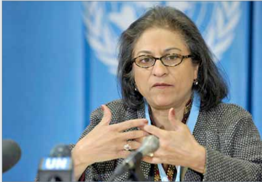
• الرحلة عاصمة جهانغير

وكان مجلس حقوق الإنسان بالأمم المتحدة قد استمع خلال دورته الـ 37 والتي انتهت، الجمعة، إلى آخر تقرير قدمته، عاصمة جهانغير، المحامية الباكستانية الشهيرة