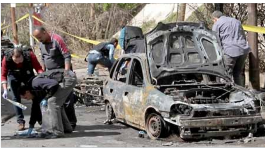
• محققون جنائيون يماينون موقع التفجير في الإسكندرية أمس

وضرب الانفجار بالقرب من فندق ”رويال تولىب“، وتسببت الموجة الانفجارية في إحداث أضرار بالعديد من السيارات قرب الانفجار. ويأتي الهجوم قبل 48 ساعة من انطلاق الانتخابات الرئاسية المصرية وسط تحذيرات سابقة من هجمات تسعى لإفساد الانتخابات. وإلى ذلك، قرر النائب العام المستشار، نبيل صادق، فتح تحقيق عاجل في الحادث.