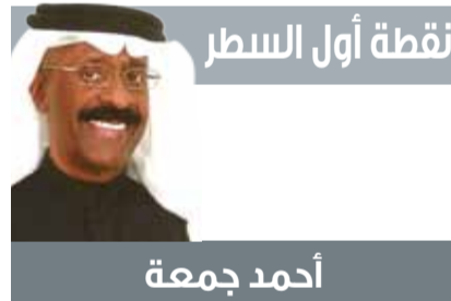
نقطة أول السطر