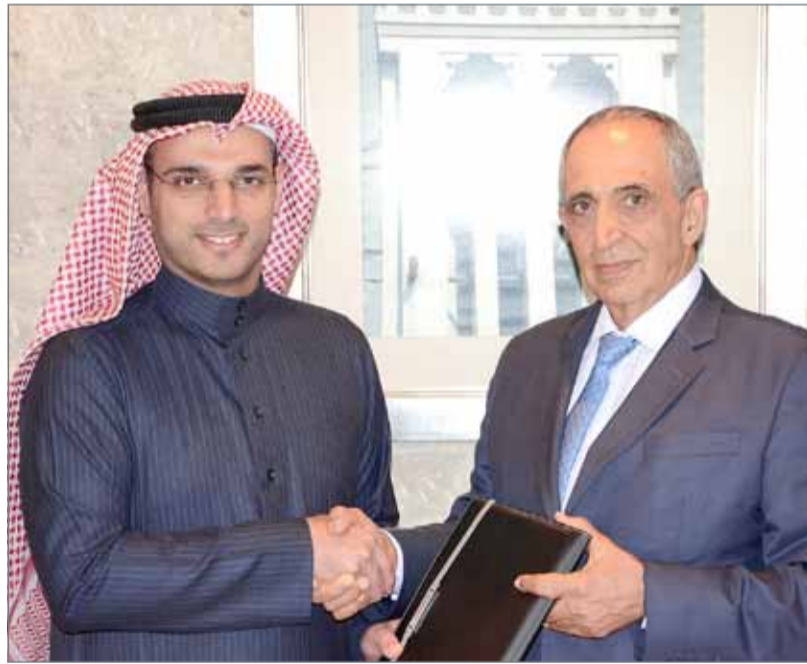
• الرئيس: نحن سعداء بالإعلان عن التخارج