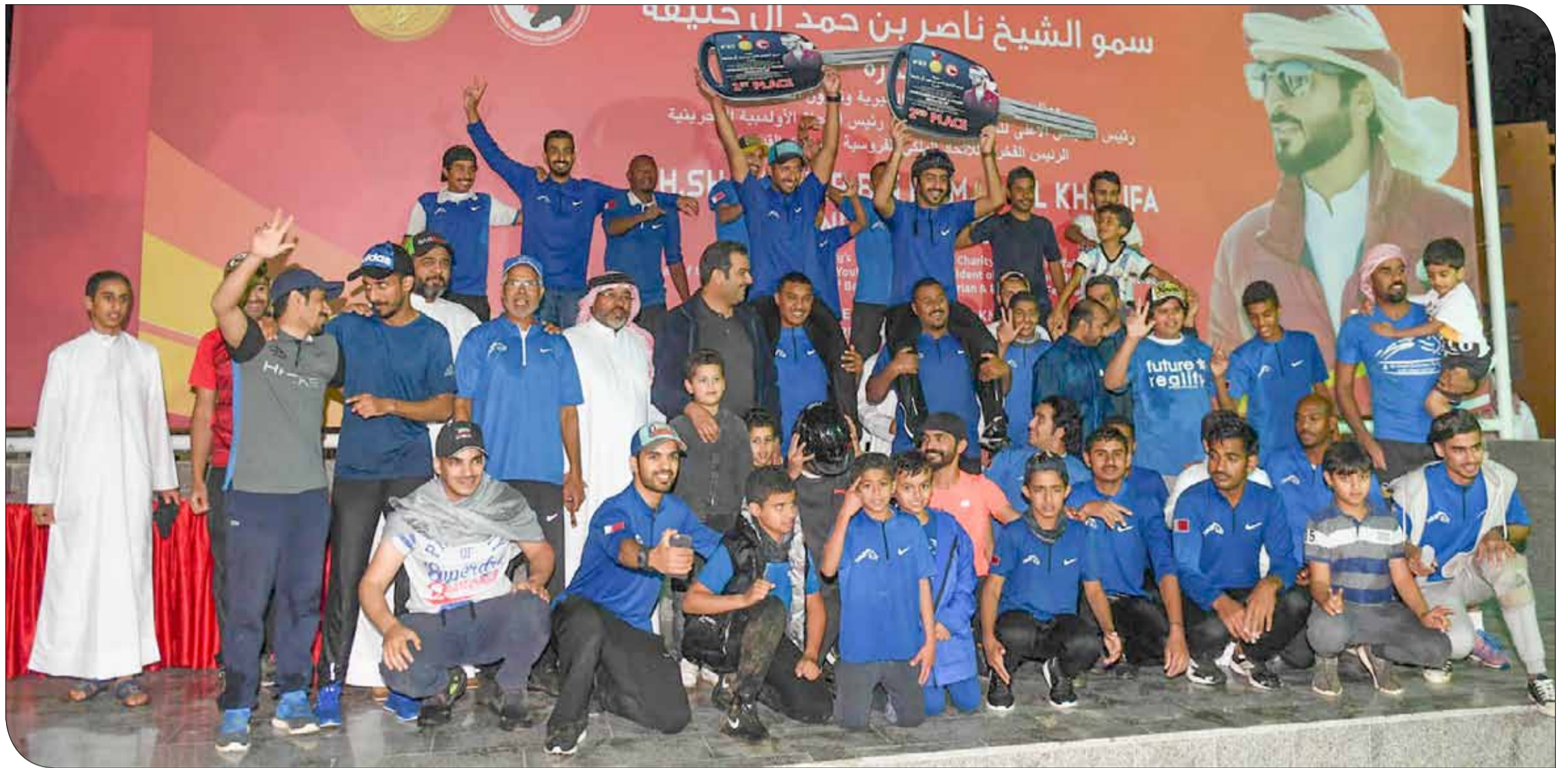
حائب من التتويج

◆ في ختام موسم القدرة بالسباق اليلبي لبطولة سموه