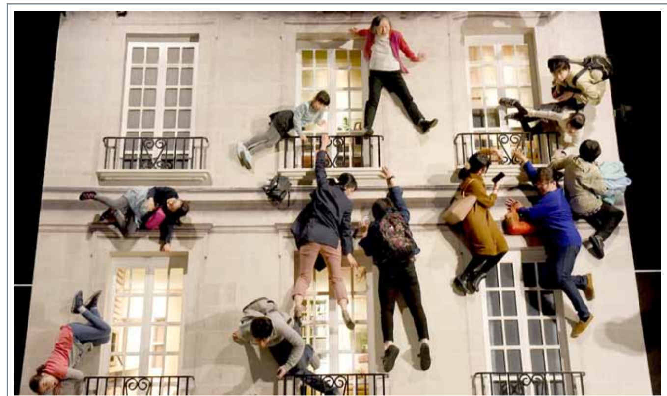
زوار متحف الفنون بالعاصمة اليابانية طوكيو يتفاعلون مع عمل فني أنجزه لياندرو أريتش. ويعمل الفنان الأرجنتيني عنوان "العمارة" ويستعمل المرايا لإحداث خدع بصرية

حالة الطقس الطقس رطب مع بعض السحب، وتشكل ضباب في بعض المناطق عند الصباح الباكر، ثم يتحول إلى حار نسبيا خلال النهار.