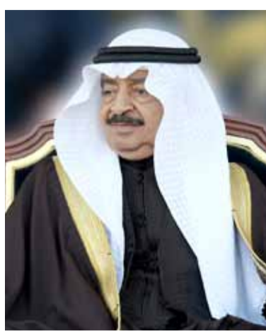
بقلم: الدكتور عبدالله الحواج