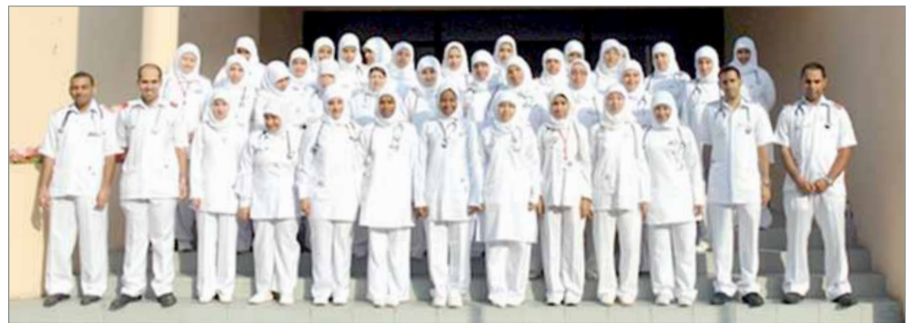
خريجي كلية العلوم الصحية (أرشيفية)

التمريض على المستوى الوطني الـ 70% في الفترة المقبلة، وذلك في ظل عمل الوزارة المستمر والجاد، والتطوير الذي شمل مهنة التمريض والعاملين فيها من الكفاءات البحرينية، وتوجيهات وزيرة الصحة فائقة الصالح، بدعم آليات التهيئة والتدريب والتعليم؛ لتطوير الكفاءات والكوادر التمريضية.