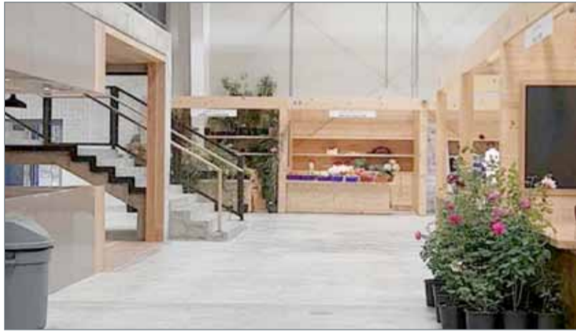
المشروع يعزز آليات دعم السياحة الزراعية بوصفها منتجاً ومصدراً للدخل

المبادرة الوطنية لتنمية القطاع الزراعي صاحبة السمو الملكي الأميرة سبيكة بنت إبراهيم آل خليفة لتطوير مشروع هورة عالي، وتتويج الخدمات الداعمة للمشروع لدعم المزارعين المحليين وتوفير المنافذ المثالية لتسويق المنتج الزراعي المحلي بما يحقق الاكتفاء الذاتي من منتجات عالية الجودة أثبتت قدرتها على المنافسة القوية على مدار فعاليات سوق المزارعين منذ تدشينه.