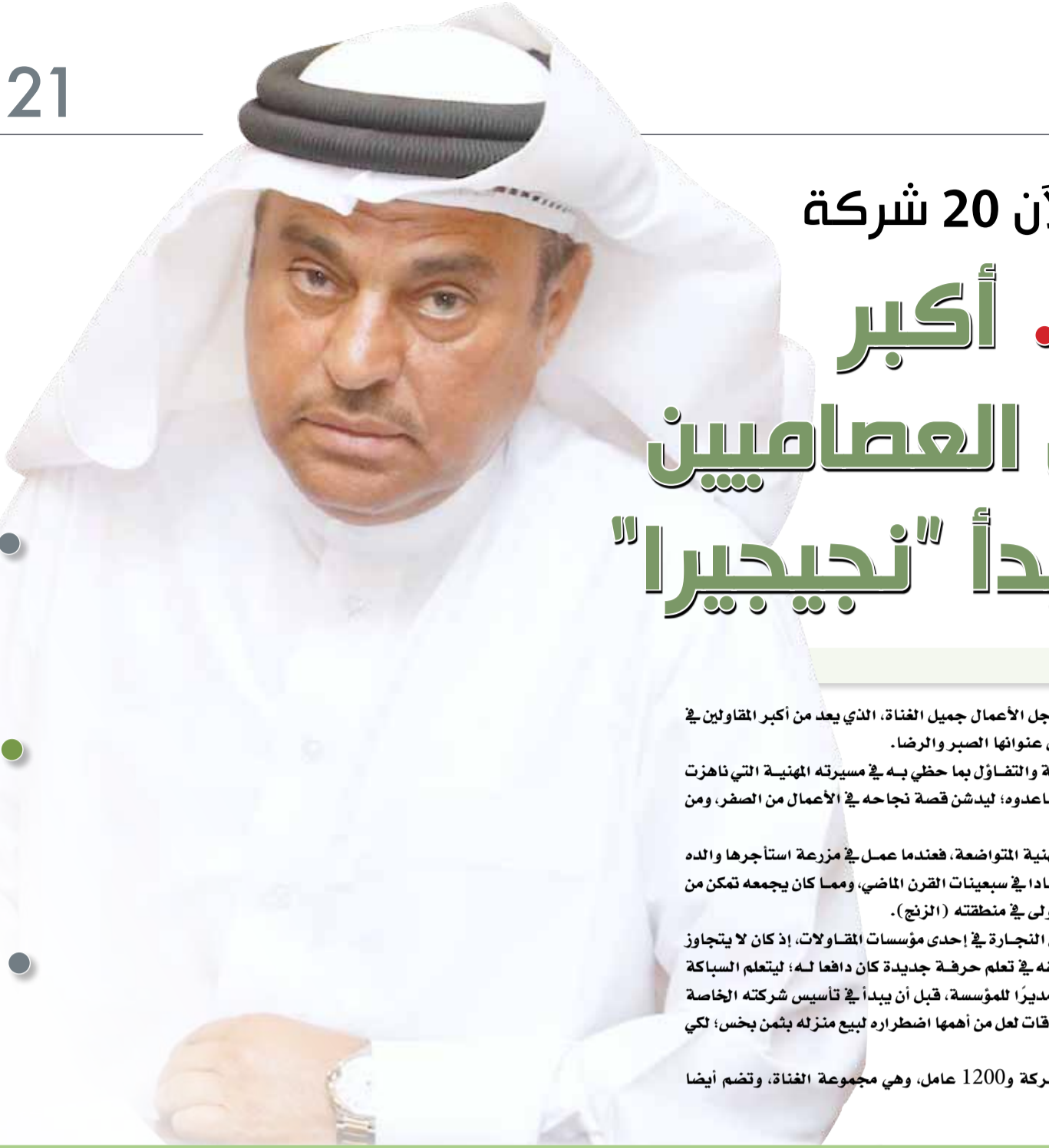
البلاد علي الفردان

● سألني صاحب شركة "كونفاب" هل أنت "نجار أم نجيجير"؟