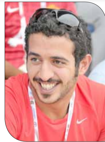
سمو الشيخ خالد بن حمد آل خليفة

◆ سطرت ألعاب القوى تاريخاً جديداً في سجل الرياضة البحرينية وأكدت حضورها العالمي من جديد لتضع التاريخ وتثبت بأنها الرياضة الأولى في المملكة بلا منازع بعدما حقق عداؤونا إنجازاً تاريخياً سيكتب بأحرف من ذهب في بطولة العالم لنصف الماراثون والذي أقيم يوم أمس (السبت) بمدينة فالنسيا الإسبانية ليرتفع علم المملكة عالياً من بين أكثر من 200 دولة مشاركة في إنجاز تاريخي هو الأول من نوعه لرياضة "أم الألعاب" البحرينية.