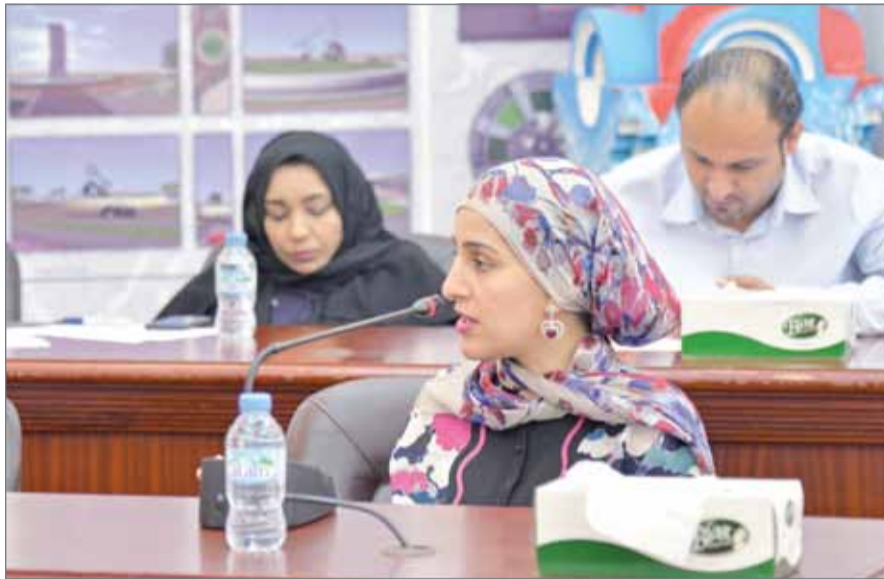
رئيسة قسم التراخيص والخدمات البلدية الشيخة مريم بنت محمد آل خليفة

في أقل من 3 أيام هي 98%، كما أن معدل سرعة الرد هي أقل من يوم، وعدد الموظفين المعنيين بنظام سجلات هو مهندسان 2 و4 مفتشين، وعدد الأيام المسموح بها للمعاملة الواحدة هو 3 أيام. وتضمنت عدد معاملات العناوين بلدية الجنوبية في العام 2017 نحو 13686، و898 عنواناً تم إصداره، فيما بلغ عدد اللوحات المعدنية الصادرة والتي بلغت 3887 لوحة.