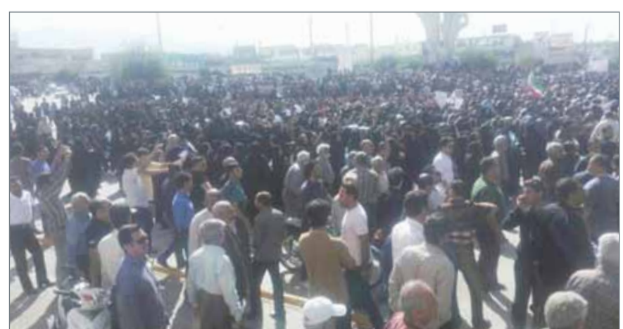
عودة وشيكة للاحتجاجات الشعبية في إيران

ديبي. العربية نت: بالتزامن مع الأنباء الواردة من طهران عن إغلاق تطبيق "تلفرام" واسع الانتشار في إيران، والذي لعب دوراً بارزاً خلال الاحتجاجات الشعبية المناهضة للنظام، أعلن مكتب المرشد الأعلى علي خامنئي، عن إغلاق قنواته عبر التطبيق. وأفادت وكالة "مهرا" الإيرانية أن موقع المرشد قام بإيقاف نشاطه الإعلامي على "تلفرام" وذكر أن الإجراء اتخذ في سياق قرارات الحكومة في إيقاف التطبيق في المستقبل القريب ولدعم التطبيقات المحلية. من جانبه، حذر رئيس منظمة الدفاع المدني الإيراني والقيادي بالحرس الشوري، غلام رضا جلالي، من عودة وشيكة للاحتجاجات الشعبية؛ لتتفاقم الأزمات في البلاد.