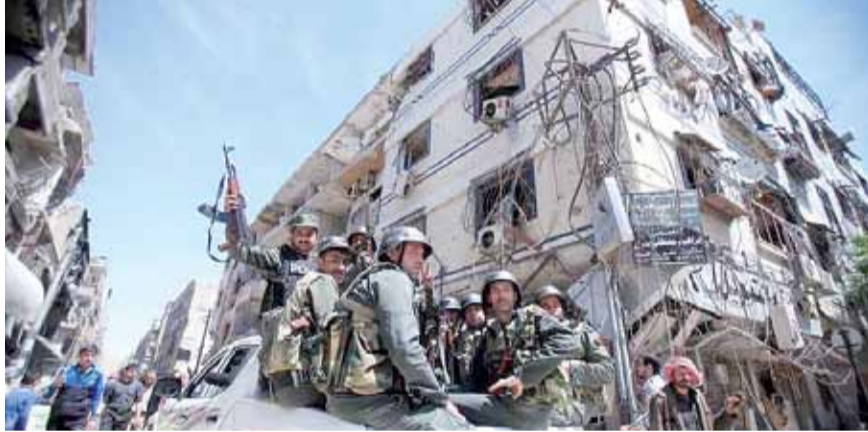
• أفراد من الشرطة السورية في دوما.

ووصل المفتشون إلى دمشق مطلع الأسبوع لتفقد موقع هجوم يعتقد أنه كيماوي في دوما، أسفر عن مقتل العشرات، وأدى إلى توجيه الولايات المتحدة وبريطانيا وفرنسا ضربات صاروخية على سوريا. وقال مبعوث سوريا لدى الأمم المتحدة