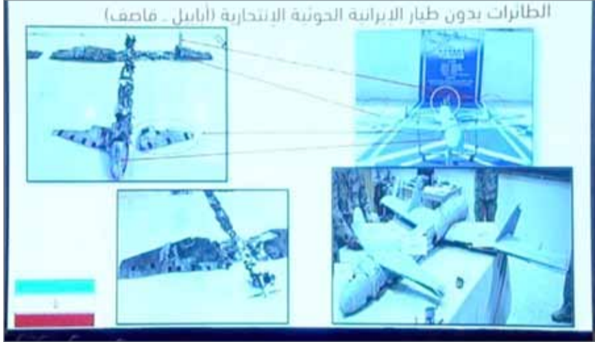
• الطائرة المسيرة الإيرانية "قاصف 1".

دعم الثريعة أكثر من 12 غارة خلال الساعات الماضية، دمرت خلالها مواقع للمتمردين في مديريتي مجز وباقم في محافظة صعدة، معقل الميليشيات الانقلابية شمالي اليمن.