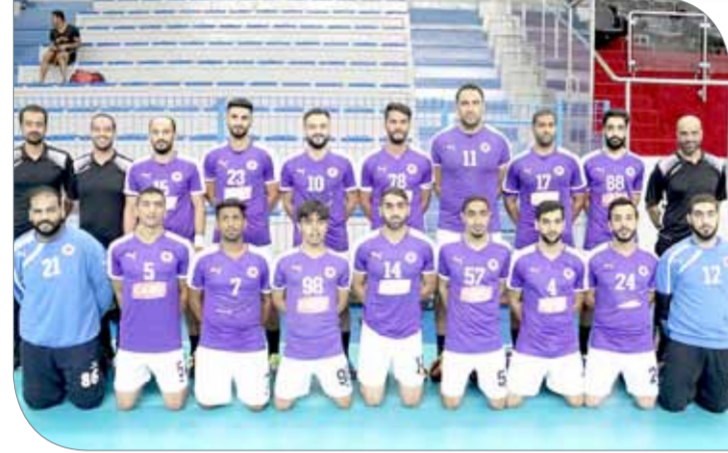
فريق باربار لكرة اليد