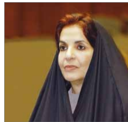
• سمو الأميرة سبيكة بنت ابراهيم