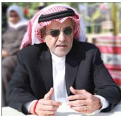
• الشيخ خليفة بن عيسى