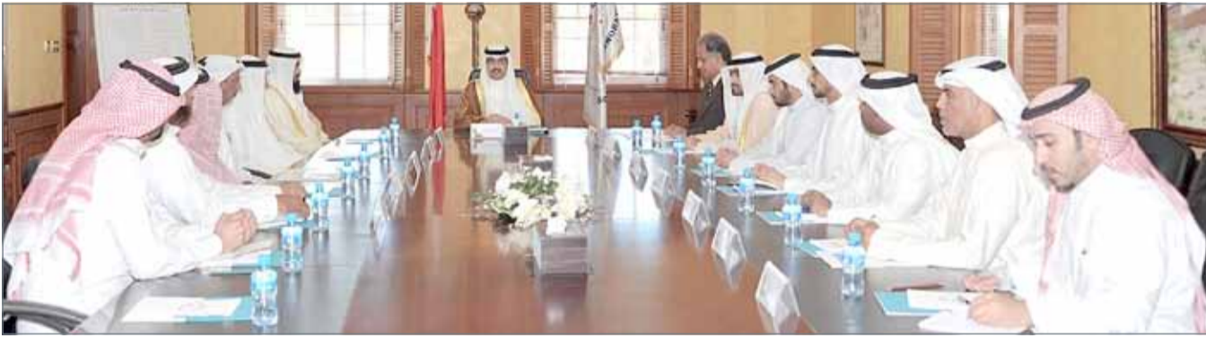
• سمو محافظ الجنوبية مستقبلاً رئيس مجلس إدارة الأوقاف السنوية