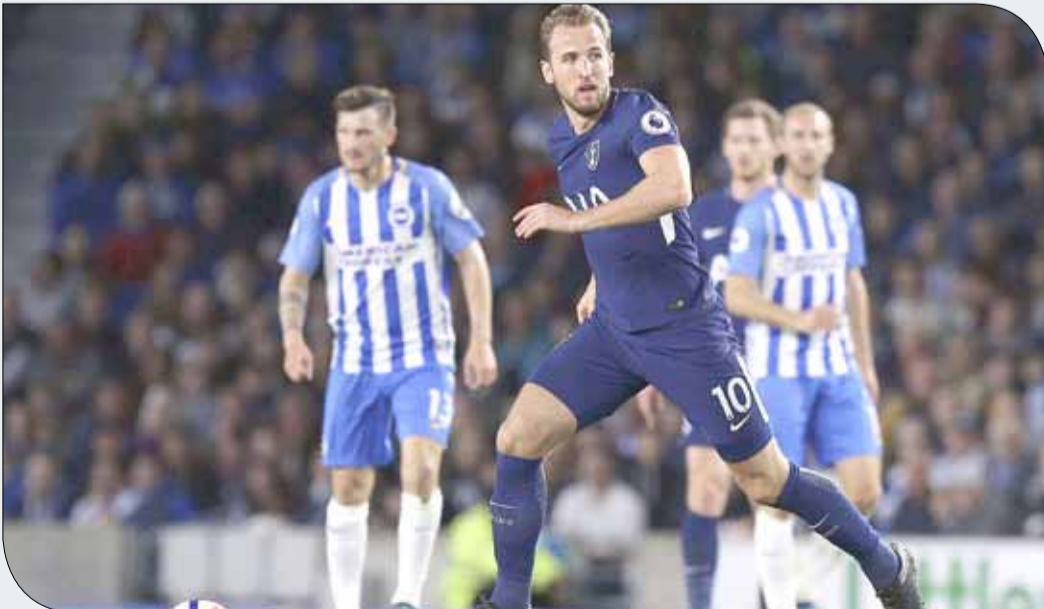
هاري كين بمواجهة برايتون

وأضاف "هذا مجرد جزء من اللعبة في هذا العصر، يمكن للناس أن يكون لهم رأيهم الخاص، لا يزعجني ذلك على الإطلاق، يمكن لبعض الناس أن يضحكوا، لكنني