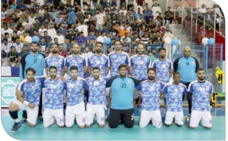
فريق النجمة لكرة اليد

سيكون عشاق لعبة كرة اليد اليوم على موعد مرتقب بقمة كبيرة تجمع النجمة وباربار في المباراة النهائية لدوري الدرجة الأولى لكرة اليد والتي ستعطي برعاية الأبن العام اللجنة الأولمبية البحرينية عبدالرحمن عسكر، وذلك في تمام الساعة 7 مساءً على صالة اتحاد اللعبة بأم الحصم.