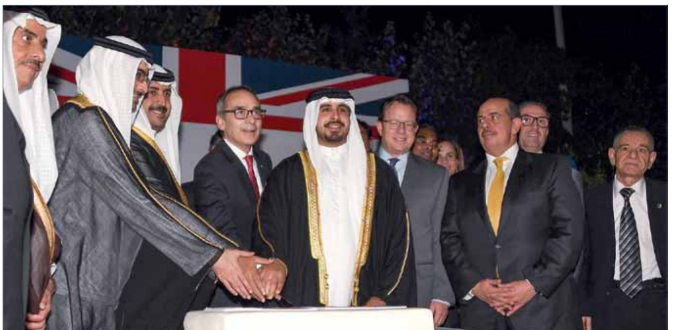
• سمو الشيخ محمد بن سلمان يحضر احتفال السفارة البريطانية

سلمان بن حمد آل خليفة، وبحضور صاحب السمو الملكي الأمير أندرو دوق يورك لمنشأة الإنسان البحري البريطاني فضلا جديدا في التعاون العسكري الثنائي بين مملكة البحرين والمملكة المتحدة، كما تعاون البلدان في مجال ريادة الأعمال على المستوى العالمي من خلال اطلاق النسخة البحرينية الأولى من برنامج رواد في القصر برعاية سموهما، وعلى صعيد التعاون في المجالات التعليمية، فقد دشنت سمو دوق يورك مشروع الشراكة بين الجامعة البريطانية في مملكة البحرين، وجامعة سالفورد مانشستر. وخلال الغفل الذي حضره عدد من أصحاب السمو والمعالي والسعادة، ألقى سفير المملكة المتحدة سايمون مارتين كلمة شكر فيها سموه على حضور الاحتفال بالنيابة عن جلالة الملك، ونوه فيها بالعلاقات التاريخية بين البلدين الصديقين التي تجاوزت مدى المئتي عام، وتتواصل فيهما محطات التعاون الوثيق.