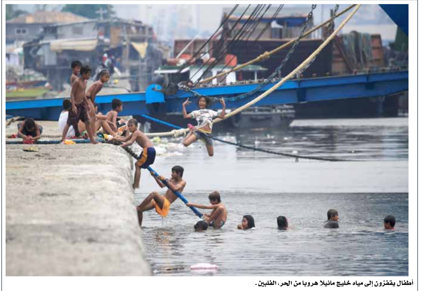
أطفال يقفزون إلى مياه خليج مانيفلا هرويا من البحر، الضليلين.

حالة الطقس: الطقس معتدل مع تصاعد الأتربة في بعض المناطق خلال النهار. الرياح شمالية غربية من 12 إلى 17 عقدة وتصل من 20 إلى 25 عقدة أحيانا خلال النهار. ارتفاع الموج من قدم إلى 3 اقدام قرب السواحل ومن 3 إلى 6 اقدام في عرض البحر. درجة الحرارة العظمى 31 والصغرى 20 درجة مئوية.