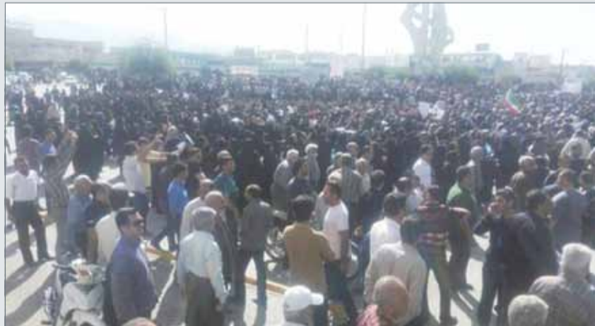
• عودة وشيكة للاحتجاجات الشعبية في إيران.

وأفادت وكالة "مهرا" الإيرانية أن موقع المرشد قام بإيقاف نشاطه الإعلامي على تطبيق تلغرام وذكر أن هذا الإجراء تم اتخاذاها في سياق قرارات الحكومة في إيقاف تطبيق تلغرام في المستقبل القريب ولدعم التطبيقات المحلية". هذا بينما ذكرت وسائل إعلام رسمية إيرانية، صباح الأربعاء، أن وزارة الاتصالات وتكنولوجيا المعلومات في البلاد أقدمت على