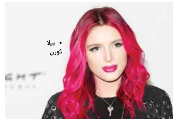
• بيلا ثورن

كشفت النجمة العالمية الشهيرة بيلا ثورن أنها تحصل على مبلغ 65 ألف دولار عن كل صورة جديدة تنشرها من خلال حسابها الشخصي في موقع التواصل إنستغرام. وأعلنت ثورن عبر تقارير إعلامية عن سعادتها لرود الفعل على فيلم (Midnight Sun) الذي طرح في دور العرض السينمائية في مارس الماضي، لاسيما أن ثورن نظمت العرض العالمي للفيلم بمدينة ميلانو الإيطالية، وتدور أحداثه حول معاناة فتاة تبلغ من العمر 17 عاماً، وتعاني مرضاً نادراً يمنعها من الخروج صباحاً والتعرض للشمس.