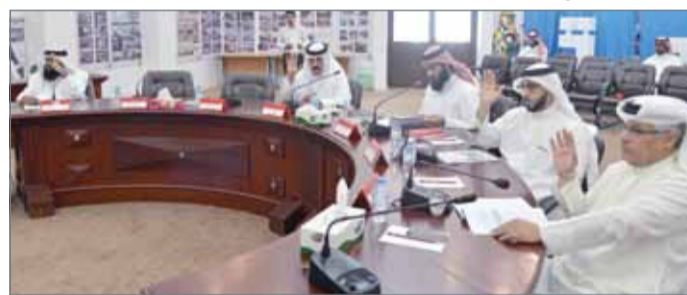
جلسة بلدي الجنوبية يوم أمس

بلغ مدخول الإعلانات في عام 2017 نحو 500 ألف دينار وتوقع زيادة بمقدار 20% في 2018، إذ تم إدخال 4 عقود جديدة بقيمة 762,396 ديناراً، تم طرح 3 مزادات وقيمتهم المتوقعة 1,700,000 ديناراً، إلى جانب بأنه تم تسوية مديونية إحدى الشركات والتنسيق لدفع مبلغ وقدره 571,504 دينار، تحويل الشركات غير المتعاونة إلى القضاء، وتم تعويض الشركات المتضررة من تطویر دوار البنا وشارع ولي العهد بمواقع بديلة، إلى جانب بأن عدد الإعلانات المخالفة المزالة هو 1200 إعلان عن طريق اختصاصي تراخيص الإعلانات.