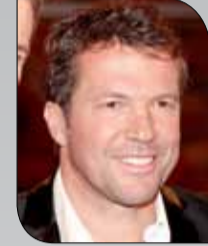
لوتر ماتيو س

◆ (وكالات): قال الدولي الألماني السابق، لوتر ماتيو س، إنه يأمل ألا يكون النجم البرتغالي لريال مدريد، كريستيانو رونالدو، في "يوم كبير" خلال مواجهة بايرن ميونخ، بنصف نهائي دوري أبطال أوروبا. وصرح ماتيو س، على هامش تقديم بطولة كأس الدولية الودية، في ميامي الأمريكية "بايرن لديه العديد من اللاعبين الكبار، إنه يمتلك روحاً كبيرة، لكن ريال مدريد ليس فقط كذلك، بل أنه يمتلك رونالدو، الذي يصنع الفارق كثيراً، رغم أنني أأمل ألا يكون في يومه أمام بايرن". وقال ماتيو س إن المواجهتين ستكونان متقاربتين، كما حدث العام الماضي في ربع النهائي، عندما امتد لقاء الأياب لشوطين إضافيين، بعد تقدم بايرن 2-1 في ملعب الريال، قبل أن يفوز الأخير 4-2.