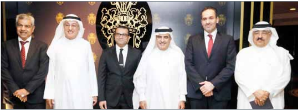
• جانب من حفل تدشين البطاقة

الماضية بالعمل على الدراسة المستمرة والحثيثة لمنتجاتنا وخدماتنا بالإضافة إلى الامتيازات لتؤكد أن بطاقة امتياز هي الأقرب إليكم والسند الأول والأخير لاحتياجاتكم.“