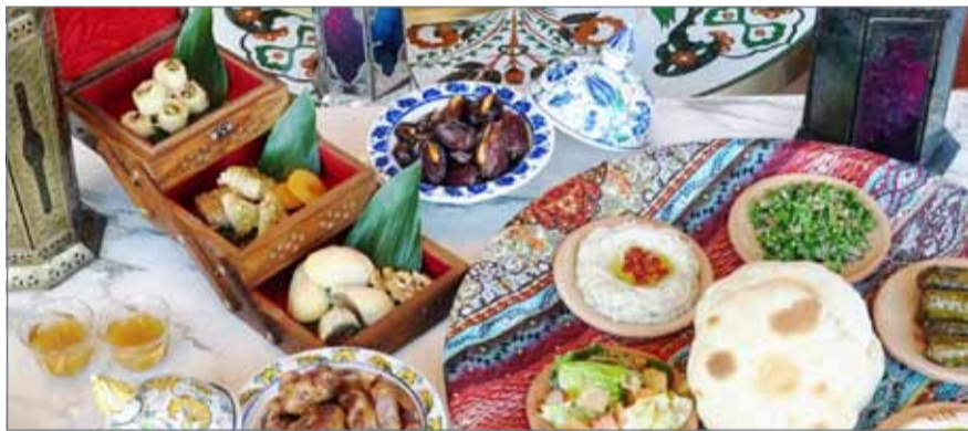
• المائدة الرمضانية البحرينية تعج بالمأكولات المتنوعة

الرمضانية البحرينية الشائعة مثل الهريس الذي يتكون من القمح واللحم المهروس، وكان يتم تجهيز الحطب لطبخ الهريس قديماً والتبريد الذي له طعم مميز في البحرين المكون من الخبز العادي أو خبز الرقاق المختلط مع المرق، بالإضافة إلى الحلويات المحلية التي تزين المائدة مثل المحلبية والبسوسة والزلاية والخبيص والساقو واللقيمت وخبز الطابي والحلويات الأخرى وتقوم النساء بالطبخ وعمل موائد الأكل التي يتم توزيع بعض منها على الجيران. وتشهد الأسواق والمراكز التجارية لبيع المواد الغذائية بالملكة حركة تجارية وتسويقية مكثفة نتيجة إقبال الأهالي والقاطنين على شراء مستلزمات رمضان الذي لم يتبق عليه سوى عدة أسابيع وتتناقص الأسواق والمراكز التجارية بالبحرين في عروضها