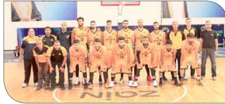
فريق الأهلي لكرة السلة

نظراً لأهمية هذا الحدث السلاوي الذي يفرض نفسه بقوة على الساحة الرياضية. ووجه رئيس الاتحاد البحريني لكرة السلة سمو الشيخ عيسى بن علي بن خليفة آل خليفة بإدخال الجماهير مجاناً لمتابعة نهائيات، تقديراً من سموه للجماهير البحرينية التي تواجدت بشكل كبير طوال مباريات الموسم وساهمت في إثراء المنافسات المحلية بالمزيد من الحماس والإثارة والمتعة. إلى ذلك، خصص اتحاد السلة المدرجات الواقعة على عين الصالة لجماهير نادي الأهلي، فيما ستخصص المدرجات الواقعة على يسار الصالة لجماهير نادي الهنامة.