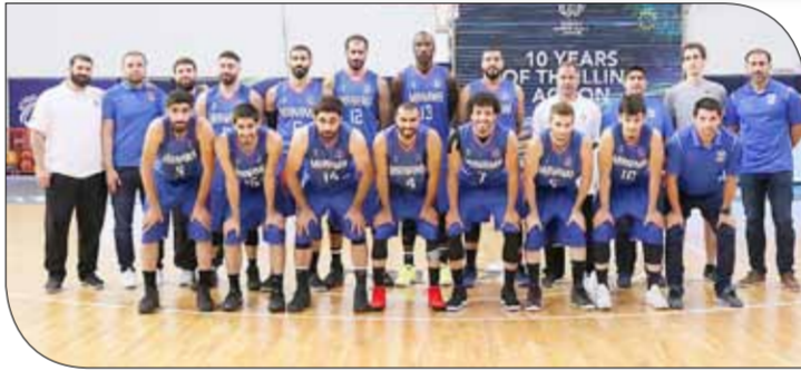
فريق الهنامة لكرة السلة