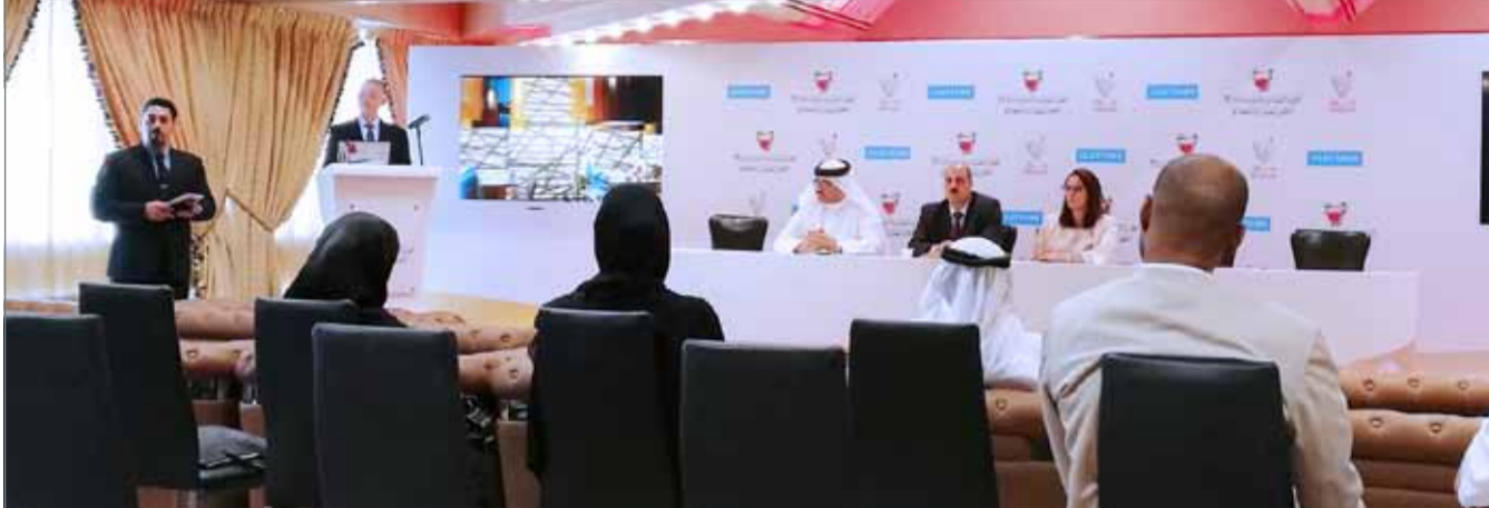
• مزاد أمس الأول على مشروع ”بوابة أمواج“ انتهى في دقائق بعد عدم تقديم مشتريين

يذكر أن اللجنة عينت ”كلاتونز“ شركة الاستشارات العقارية الدولية وشركة ”مزاد“ المتخصصة في إجراءات المزاد العلني في البحرين، لتنظيم وإدارة إجراءات بيع ”بوابة أمواج“ في المزاد العلني تحت إشراف مباشر منها.