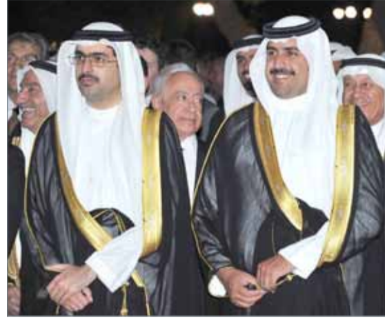
• الشيخ خليفة بن راشد وسمو الشيخ خليفة بن علي يحضران حفل الاستقبال