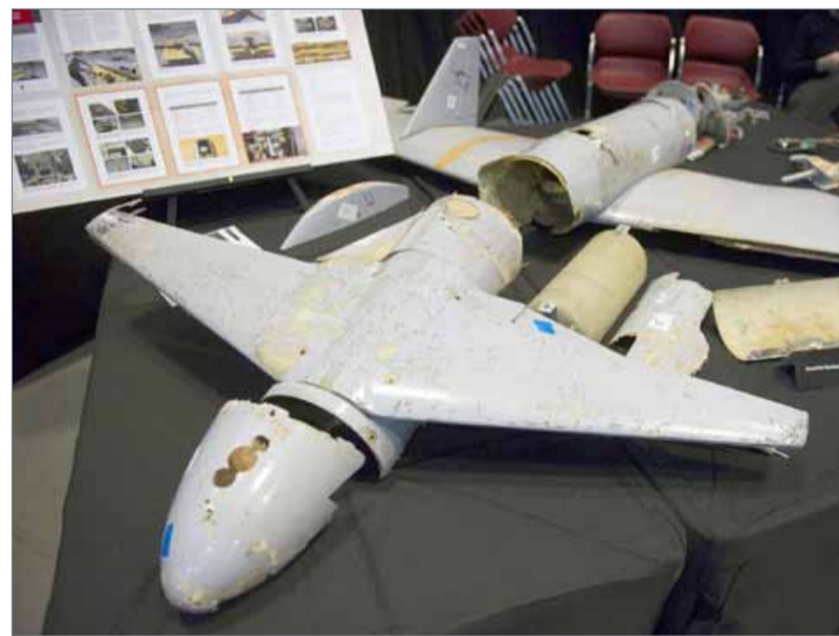
الطائرة المسيرة الإيرانية "قاصف 1"

عواصم وكالات: أعلنت وكالة أنباء الإمارات، أمس الأربعاء، أن الوحدة الخاصة بالدفاع ضد الطائرات المسيرة للقوات المسلحة الإماراتية في اليمن، تمكنت من اكتشاف والسيطرة على طائرة مسيرة من نوع "قاصف 1 الإيرانية" محملة بالمتفجرات، وكانت الطائرة الإيرانية تحاول التسلل إلى مواقع قريبة من القوات اليمنية الموالية للثورة المدعومة من قبل قوات تحالف دعم الشرعية في الساحل الغربي من اليمن. وقتل 30 من الميليشيات الحوثية الإيرانية، في سلسلة غارات لطائرات تحالف دعم الشرعية في اليمن، استهدفت مواقع للمتمردين في تعز جنوبي البلاد، أمس. ونفذت طائرات تحالف دعم الشرعية أكثر من 12 غارة في الساعات الماضية، دمرت فيها مواقع للمتمردين في مديريتي مجز وباقم في محافظة صعدة، معقل الميليشيات الانقلابية شمالي اليمن.