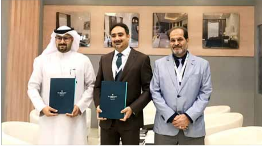
تم تعيين مكتب الفريبي الهندسي لتصميم المشروع

ويقع المشروع على طول الطريق 2819، بين مجموعة من الأبراج السكنية الجديدة، وسيوفر ما يصل إلى 26 وحدة تتراوح مساحتها من 320 إلى 15.6 ألف قدم مربع من المساحة القابلة للتأجير، وسيشتمل المجمع على مجموعة متنوعة من المطاعم والمقاهي وسوبرماركت رئيس، ومحلات ترفيه وخدمات. وستوفر وحدتان مسارا خاصا لطلبات السيارات، ويقوم فريق المبيعات في ”البحرين الأولى“ باستلام استفسارات التأجير الخاصة بالوحدات الرئيسية، ومن المتوقع أن يبدأ بناء المشروع هذا الصيف مع استكمالها بحلول نهاية العام 2019.