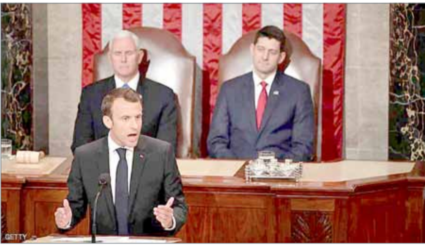
الرئيس الفرنسي إيمانويل ماكرون.

وفيما يتعلق بملف كوريا الشمالية، أكد الرئيس الفرنسي أن بلاده تقف إلى جانب الولايات المتحدة في موقفها من كوريا الشمالية.