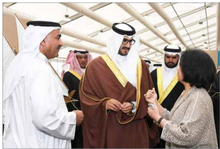
• سمو الشيخ عيسى بن سلمان يفتتح مهرجان التراث السنوي السادس والعشرين