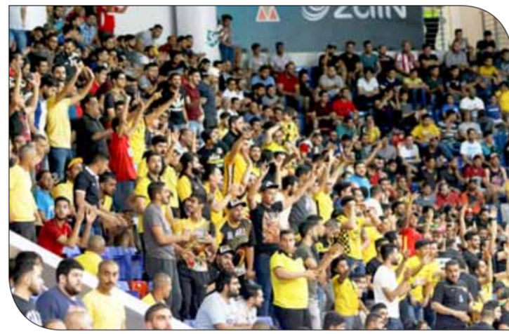
فرحة جماهير الأهلي بالانتصار