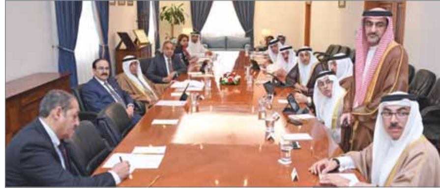
• سمو الشيخ محمد بن مبارك يتأسر اجتماع اللجنة بحضور الشيخ خالد بن عبدالله

الإلكترونية 2018 في أكتوبر القادم، حيث سناقش آخر التطورات الدولية في مجال تقنية المعلومات والاتصالات بحضور نخبة من المختصين والمهتمين في هذا المجال. واستعرضت اللجنة تقرير شركة صلة الخليج المتخصصة في مجال مراكز الاتصال حول أدائها ووضعها التشغيلي والمالي، كما اعتمدت عدداً من مؤشرات قياس الأداء التي تبين مدى تحقيق الشركة لأهدافها، حيث بلغ