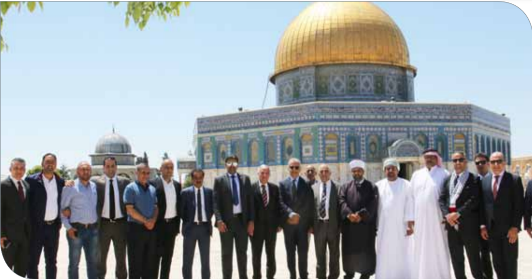
سلمان بن إبراهيم والوفد المرافق خلال زيارة القدس الشريف

رام الله | مكتب رئيس الاتحاد الآسيوي لكرة القدم