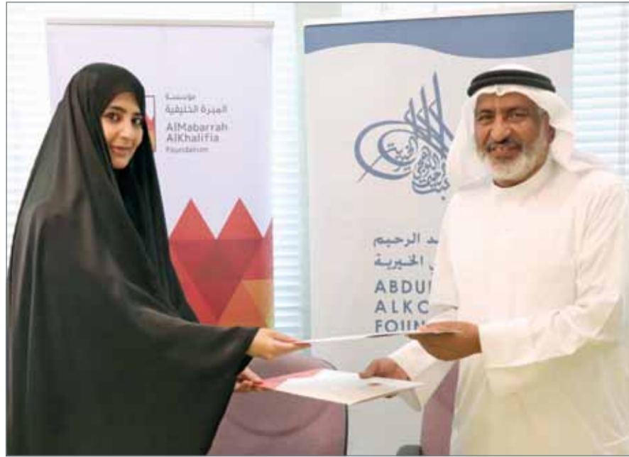
• مؤسسة المبرة الخليفة توقع مذكرة تفاهم مع مبرة عبد الرحيم الكوهجي الخيرية

بين مؤسسة المبرة الخليفة ومبرة عبد الرحيم الكوهجي في مجال التعليم وبناء القدرات. يشير إلى أن المبرة الخليفة هي مؤسسة غير ربحية، مسجلة ومرخصة من قبل وزارة العمل والتنمية الاجتماعية في مملكة البحرين، تأسست في عام 2011 بهدف إحداث أثر اجتماعي إيجابي في مجال التعليم، وتمكين الشباب البحريني للوصول بقدراتهم إلى أفضل المستويات، من خلال عقد العديد من ورش العمل والدورات لتزويدهم بالمعارف والمهارات والخبرات، مما سيعود عليهم وعلى الوطن بأفضل النتائج.