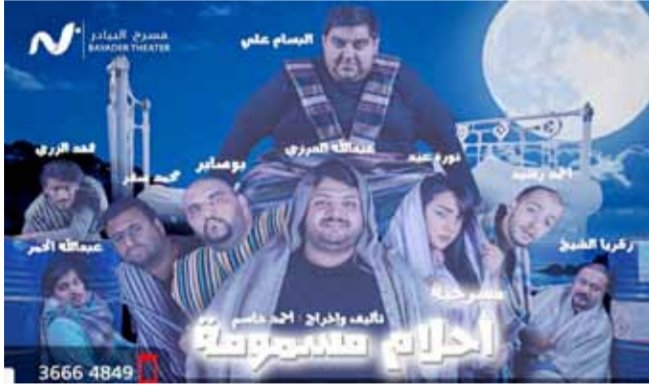
مسرحية أحلام مسمومة

وإدماج الفنون المختلفة والاستفادة من التجارب الخارجية الى جانب رعاية المواهب الفنية الصاعدة في هذه الملتقيات والظاهرا وتطوير ادراتها. علما ان البيادر يشارك حاليا في مهرجان الكويت