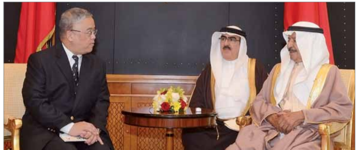
• سمو رئيس الوزراء مستقبلاً السفير التايلندي