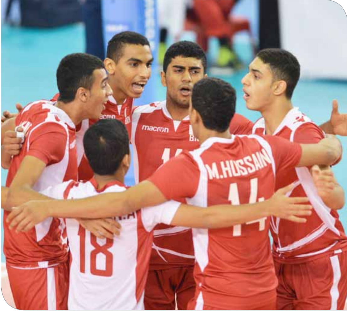
منتخبنا الوطني للشباب لكرة الطائرة