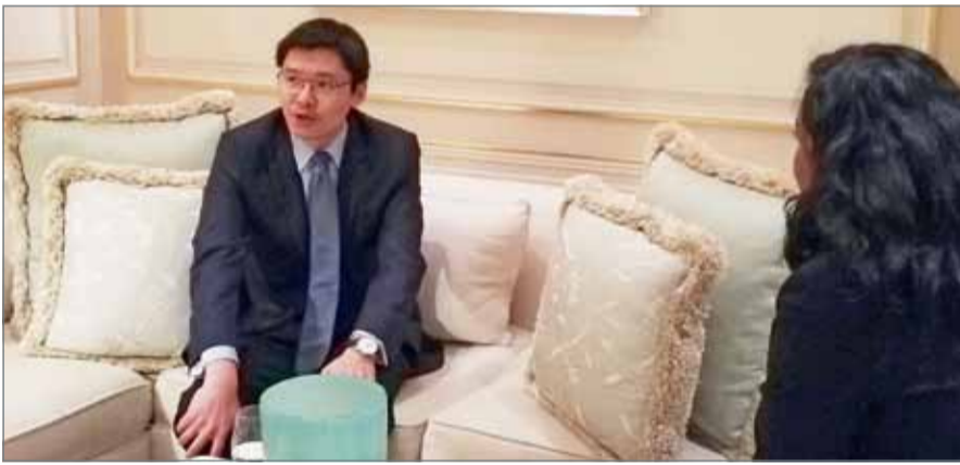
• لو يوندغ يتحدث في اللقاء الصحافي

النهائية. وبخصوص خدمات المستهلكين الأفراد والهواتف الذكية ومستوى المنافسة مع ”سامسونغ“ و”أبل“ وقدره ”هواوي“ على مواجهة هذه المنافسة عبر يوندغ عن ثقته بقدرته الشركة على إزاحة الشركة الأميركية ونظيرتها الكورية من الصدارة، وأنها ستزعم العرش من هنا لتكون ”الرقم واحد“ في سوق الهواتف النقالة في العالم. وبين المسؤول أنه وخلال أكثر من عقد من تشييد خدمات الهواتف المتقدمة، استطاعت هواوي أن تصل إلى المرتبة الثالثة عالمياً في السوق، وأنها في المستقبل ستكون في المرتبة الأولى.