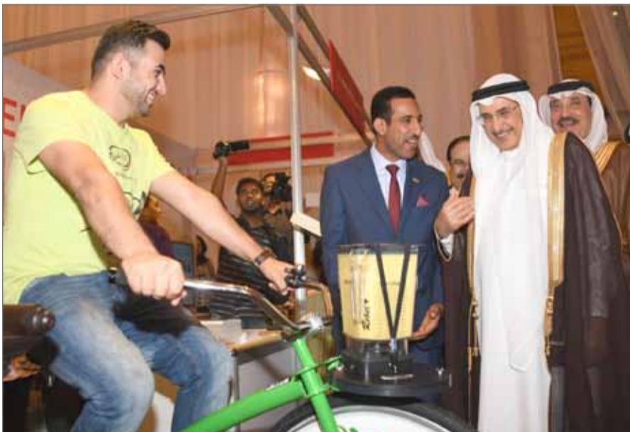
• نائب رئيس مجلس الوزراء في جولة بالمعرض الوطني الرابع للسلامة والصحة المهنية

الجوانب الخاصة بتطوير معايير منظومة الصحة والسلامة المهنية، وآخر المستجدات المتعلقة بالتشريعات الوطنية في هذا المجال، بالإضافة إلى تسليط الضوء على أبرز التقنيات العملية للسلامة في مجال إدارة المقاولين، فضلاً عن استعراض عوامل تعزيز الصحة المثالية للعمال في بيئة العمل. وفي كلمة خلال الافتتاح، أشاد وزير العمل والتنمية الاجتماعية، رئيس مجلس السلامة والصحة المهنية جميل حميدان، بالرعاية الكريمة للشيخ خالد بن عبد الله لهذا المؤتمر. وكشف الوزير أنه سيتم قريباً إصدار قرار وزاري ينظم ممارسة مهنة اختصاصيي ومسؤولي السلامة والصحة المهنية، مؤكداً أن ذلك يسهم في رفع مستوى الأداء لممارسي المهنة، وتحفيز العاملين للارتقاء بمستوياتهم الفنية والتخصصية.