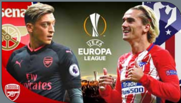
قيمة تحظف الأبطال نحو لندن

وهذا أول نصف نهائي أوروبي لمرسيليا منذ عام 2004، عندما قاده العاجي ديديه دروغبا إلى النهائي وخسر أمام فالنسيا الإسباني (0-2) في كأس الاتحاد الأوروبي، علما انه حل وصيفاً أيضاً عام 1999 أمام بارما الإيطالي (3-0). من جهته، قدم سالزبورغ مشوارا محترماً في البطولة، وبرز نتائجه قلب تأخره أمام لاتسيو الإيطالي 2-4 إلى فوز كبير إياباً 1-4 في ربح النهائي، وذلك بعد اقضائه بروسيا دورتموند الألماني من ثمن النهائي.