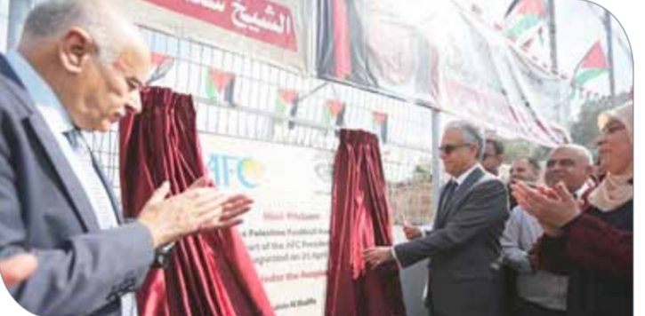
رئيس الاتحاد الآسيوي يدشن ملاعب الاتحاد الآسيوي في سنجل