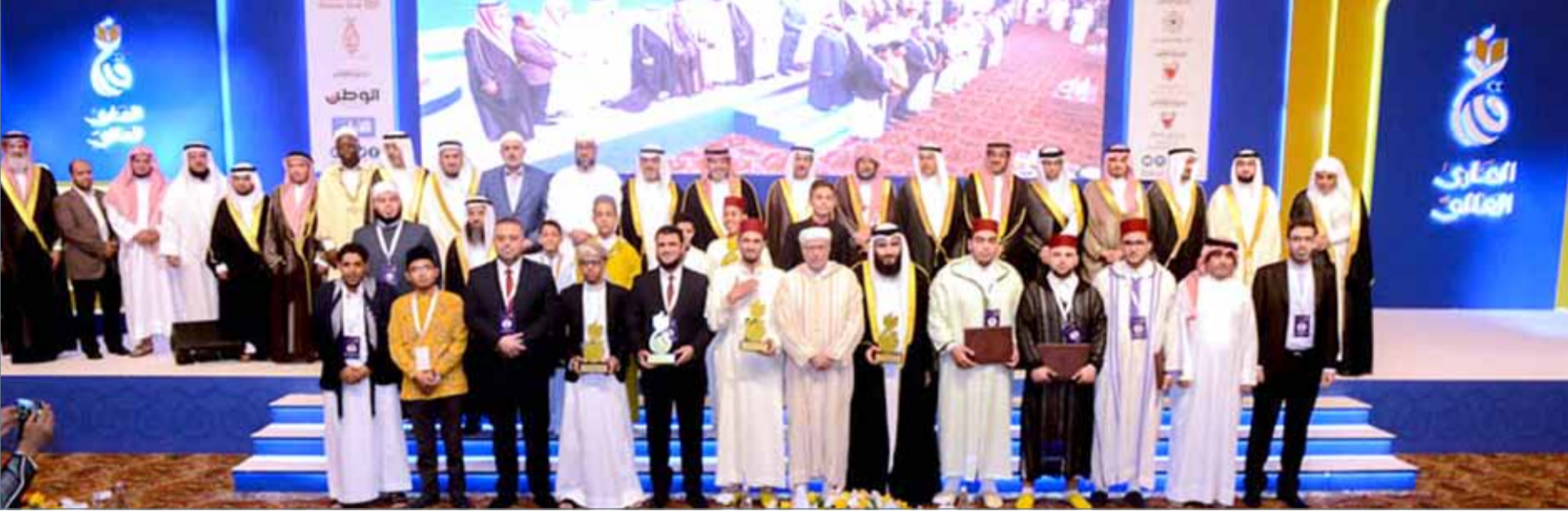
• وزير "العدل" يتوسط الفائزين في مسابقة البحرين العالمية لتلاوة القرآن الكريم (القارئ العالمي)

المنامة - بنا: كرم نائب رئيس المجلس الأعلى للشؤون الإسلامية الشيخ عبدالرحمن بن محمد بن راشد آل خليفة، ووزير العدل والشؤون الإسلامية والأوقاف الشيخ خالد بن علي بن عبدالله آل خليفة، الفائزين في مسابقة البحرين العالمية لتلاوة القرآن الكريم (القارئ العالمي) عبر الإنترنت، التي نظمتها وزارة العدل والشؤون الإسلامية والأوقاف بالتعاون مع المجلس الأعلى للشؤون الإسلامية وهيئة المعلومات والحكومة الإلكترونية ووزارة شؤون الإعلام، وذلك في حفل الختام الذي أقيم تحت رعاية كريمة من عاهل البلاد صاحب الجلالة الملك حمد بن عيسى آل خليفة بقاعة المؤتمرات بفندق الخليج، الليلة الماضية.