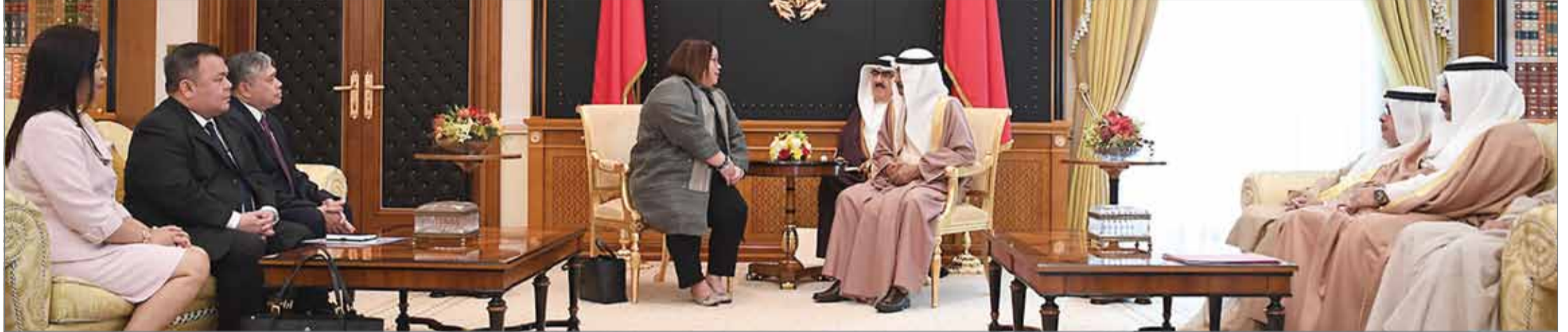
• سمو رئيس الوزراء مستقبلاً وكيلاً وزارة الشؤون الخارجية الفلبينية