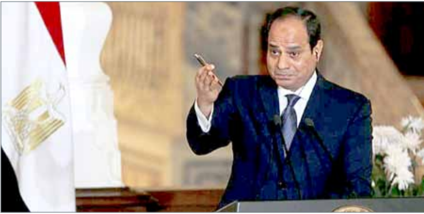
الرئيس المصري عبد الفتاح السيسي.

وفي وقت سابق من أمس الأربعاء، أعلنت القوات المسلحة المصرية القضاء على 30 إرهابياً وضبط 173 آخرين فضلاً عن تدمير مئات البؤر والأوكار الإرهابية بشمال ووسط سيناء. وأوضحت القوات المسلحة في بيان لها أن ذلك يأتي في إطار العملية العسكرية الشاملة