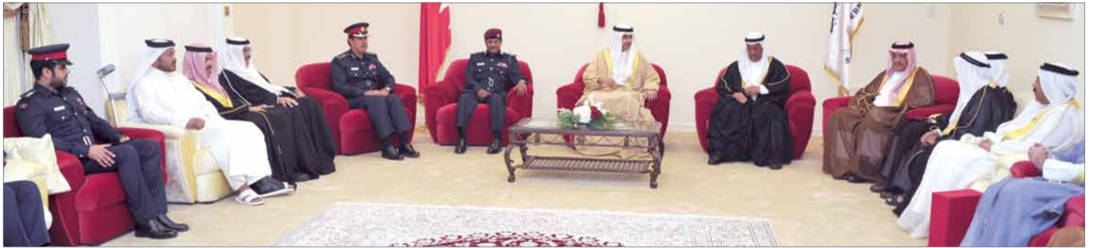
• سمو محافظ الجنوبية مستقبلاً وجهاء وأعيان المحافظة وعدداً من كبار الضباط والنخب الفكرية والأدبية والإعلامية