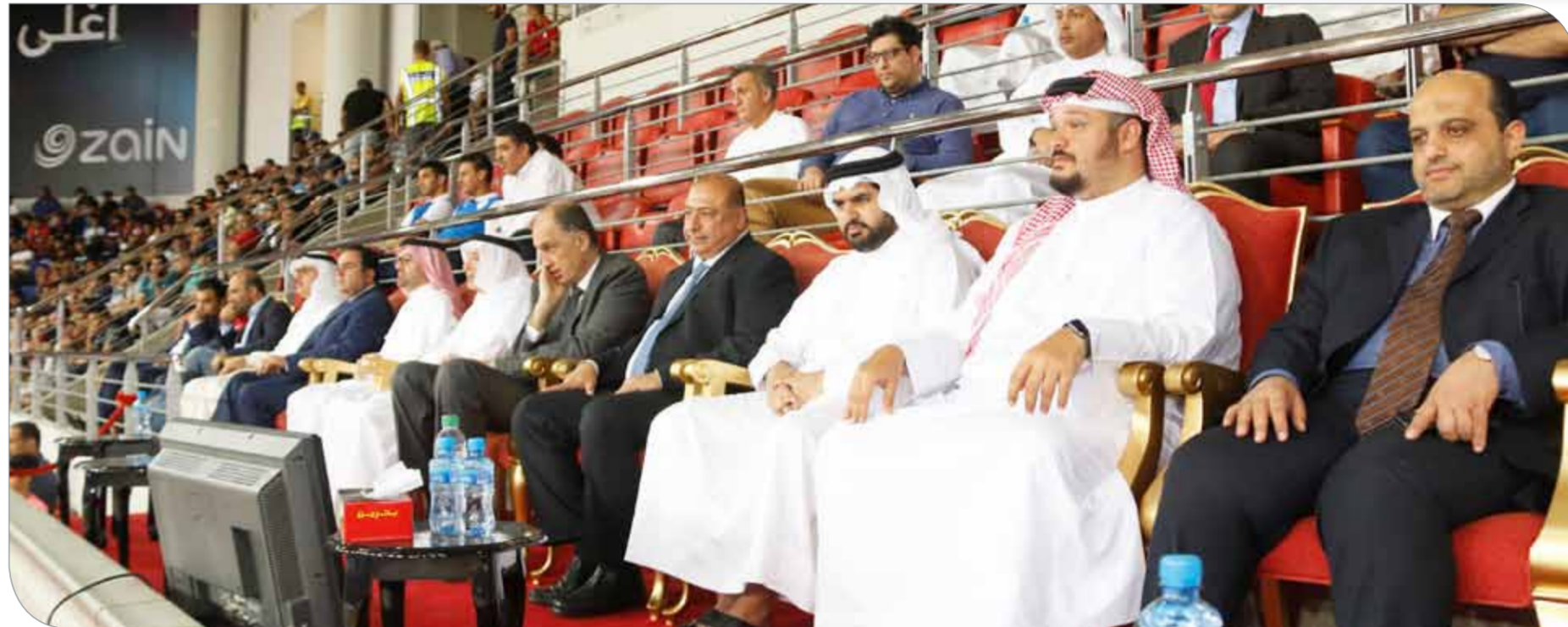
سمو الشيخ عيسى بن علي يشهد النهائي الثالث