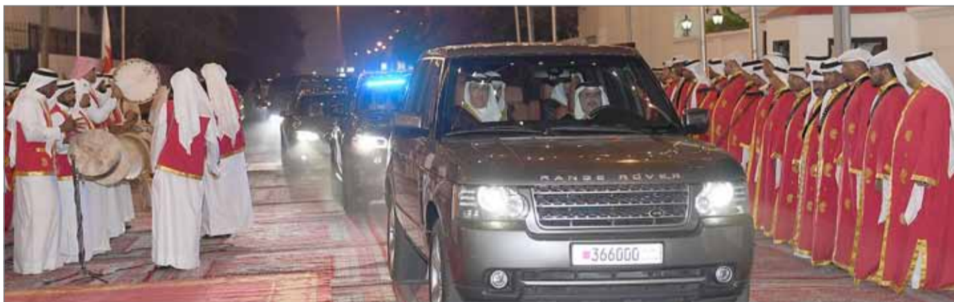
• سمو ولي العهد يحضر حفل زواج الشيخ محمد بن خليفة

من جانبه، رفع الشيخ سلمان آل خليفة آل خليفة إلى صاحب السمو الملكي ولي العهد نائب القائد الأعلى النائب الأول لرئيس مجلس الوزراء اسمى آيات الشكر والتقدير والامتنان على تشریف سموه لحفل زواج أخيه الشيخ محمد بن خليفة آل خليفة وعلى تهانئ سموه وما أبداه من مشاعر نبيلة بهذه المناسبة السعيدة، داعياً الله أن يديم على البحرين أمنها واستقرارها في ظل قائد مسيرتها المباركة ملك البلاد صاحب الجلالة الملك حمد بن عيسى آل خليفة.