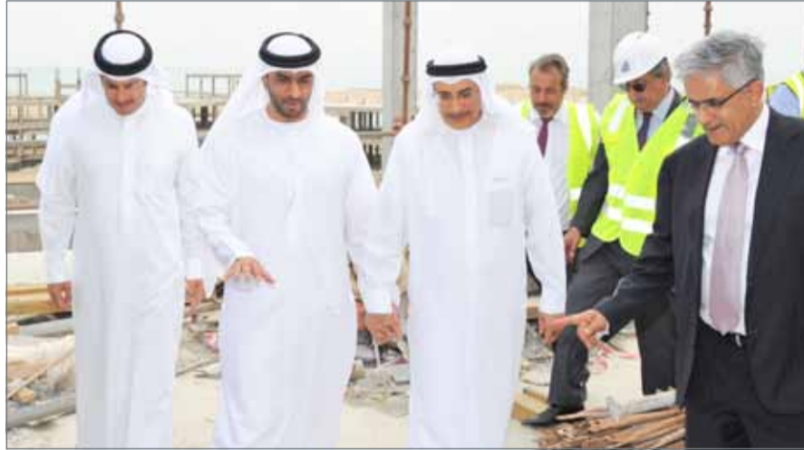
• الشيخ خالد بن عبدالله يتفقد مشروع منتجع الساحل في المحافظة الجنوبية

في النتائج المحلي الإجمالي بوصفهما أحد أهم القطاعات التي تركز عليها إيراداتنا غير النفطية؛ لتحقيق المزيد من الطفرات في أعداد السياح ورفع معدلات الإنفاق السياحي. وخلال الزيارة التفقدية، استمع الشيخ خالد بن عبدالله إلى شرح قدمه رئيس مجلس إدارة شركة منتجع الساحل الرميحي، إذ أكد أن الأعمال الإنشائية التي بدأت أواخر ديسمبر 2017 لمبنى الفندق الرئيس من المقرر أن تنتهي في النصف الثاني من هذا العام، في حين أن المرحلة الثانية من العمل التي تم طرح مناقستها مطلع العام الجاري ستنتهي في منتصف العام 2020، بالتزامن مع افتتاحه المقرر في نهاية العام نفسه. وفي ختام الزيارة، وجّه الشيخ خالد بن عبدالله القائمين على المشروع إلى الالتزام بمراحل التنفيذ وإنجازها في وقته المستهدف المعلن؛ لتحقيق الاستفادة القصوى المرجوة منه على الاقتصاد الوطني والقطاع السياحي في البحرين.