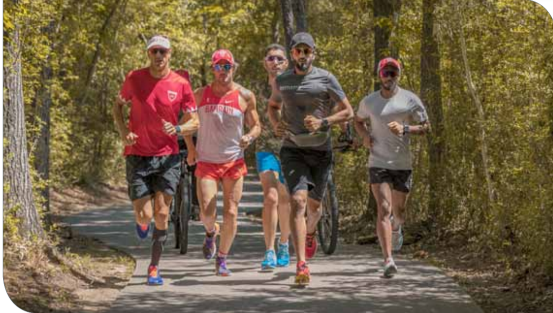
سمو الشيخ ناصر بن حمد يقود التدريب

وكانت اللجنة المنظمة قد حددت مسافات السباق على النحو التالي: السباحة لمسافة 2.4 ميل في بحيرة وودلاندز بداية من نورث شور بارك وتنتهي في تاون غرين بارك، ثم سباق الدراجة الهوائية لمسافة 112 ميلاً إلى الجنوب من خلال الأراضي الزراعية الخلابة في شرق تكساس والمواقع الحضرية والتراثية، وينتهي السباق بجولة الجري طولها 26.2 ميل تقام بالكامل داخل وودلاندز.