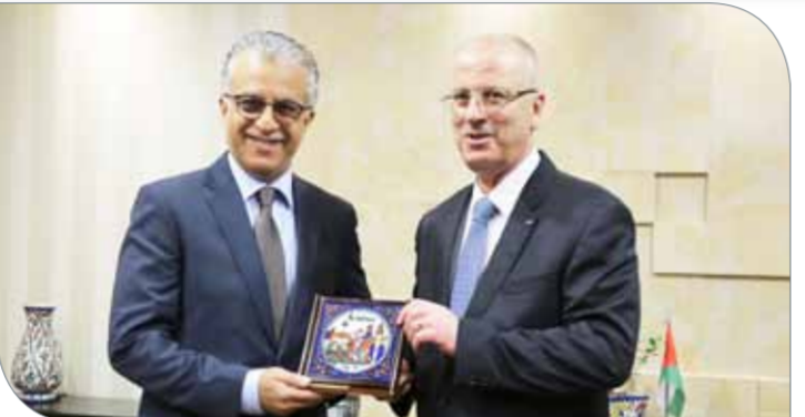
رئيس الاتحاد الآسيوي يتسلم هدية تذكارية من الرجوب

وخلال زيارته جامعة النجاح الوطنية في نابلس، التقى الشيخ سلمان بن إبراهيم آل خليفة، ورئيس الجامعة وأعضاء الهيئة التدريسية، واستمع إلى شرح عن تاريخ الجامعة وبرامجها القادرة على احتضان المباريات المحلية وتدريبات المنتخبات الوطنية، إضافة للعمل على توسيع انتشار اللعبة في المناطق الفلسطينية. وأزاح رئيس الاتحاد الآسيوي لكرة القدم الستار عن اللوحة التذكارية لمشروع الملاعب المصغرة بحضور رئيس الاتحاد الفلسطيني لكرة القدم جبريل الرجوب، ومحافظ رام الله واليبره ورئيس بلدية سنجل، وعدد من الشخصيات الرسمية وعبر عن شكره لزيارة مكييم بلاطة، منوها بما ساهمه من إرادة صلبة وعزيمة قوية