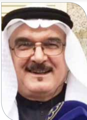
الراحل محمد حبيب

صاحب بذل وعطاء في خدمة اللعبة على المستوى الإقليمي والقاري والدولي، إذ شكّل نموذجاً يحتذى به ومثالاً رائعاً في التفاني والعطاء؛ من أجل إعلاء شأن الكرة الطائرة العربية عموماً، حيث قدم الفقيه الكثير والكثير وبذل الغالي والنفيس في سبيل رؤية الكرة الطائرة العربية تسير بخطى ثابتة