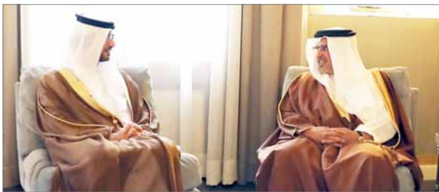
• سمو ولي العهد مستقبلاً السفير الإماراتي

المنامة - بنا: أكد ولي العهد نائب القائد الأعلى النائب الأول لرئيس مجلس الوزراء صاحب السمو الملكي الأمير سلمان بن حمد آل خليفة تكامل وتميز العلاقات الأخوية التي تجمع مملكة البحرين ودولة الإمارات العربية الشقيقة وتمثل نموذجاً طيباً لشكل العلاقات البينية المتطلعة نحو أفق واسع من التعاون الثنائي وتطابق الرؤى على أسس ثابتة رسخها الآباء والأجداد ولا تزال سمة التواصل المستمر والحرص على تدعيم أطر التعاون بين البلدين الشقيقين هو ما يحرص على تكريسه أهل البلاد صاحب الجلالة الملك الوالد حمد بن عيسى آل خليفة، ورئيس دولة الإمارات العربية المتحدة الشقيقة أخيه صاحب السمو الشيخ خليفة بن زايد آل نهيان. وقال سموه إن العلاقة الوطيدة بين البلدين قد تجسدت بشكل كبير في مستويات التعاون والتنسيق بينهما بما يعود بالخير على أبناء البلدين. جاء ذلك لدى لقاء سموه بقصر الرفاع مع سفير دولة الإمارات العربية