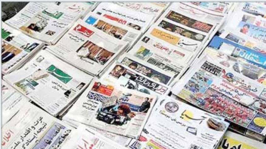
إيران تواصل اضطهاد وسجن الصحفيين.

وكانت منظمة "هيومن رايتس ووتش" قد كشفت في تقريرها العالمي 2018 أن سجل الحكومة الإيرانية الحقوقي في العام 2017 كان سيئاً وتخلله القمع والانتهاكات المتعلقة بكل من حرية التعبير، حيث استدعت قوات الأمن والاستخبارات عشرات الصحفيين والناشطين البارزين على مواقع التواصل الاجتماعي، وضايقتهم واعتقلت بعضاً منهم.