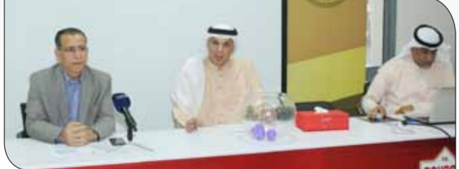
جانبا من سحب القرعة