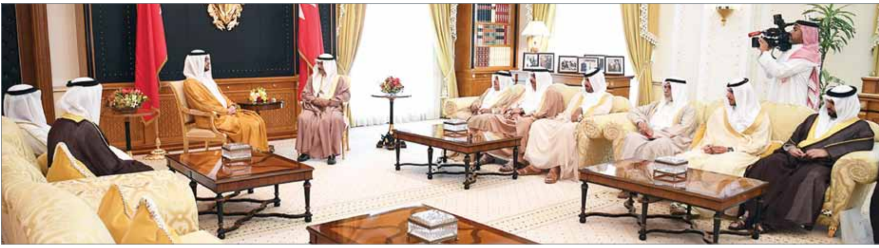
• سمو رئيس الوزراء مستقبلاً السفير الإماراتي

حرص متبادل على بناء نموذج للتعاون الثنائي... سمو رئيس الوزراء: