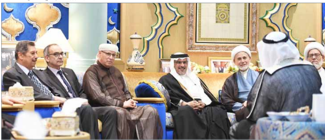
• ... وسموه في زيارة لمجلس الشيخ عبدالحسين العصفور

المنامة - بنا: أكد ولي العهد نائب القائد الأعلى النائب الأول لرئيس مجلس الوزراء صاحب السمو الملكي الأمير سلمان بن حمد آل خليفة أن صاحب الجلالة الملك الولد حمد بن عيسى آل خليفة أراد لميثاق العمل الوطني أن يؤكد البناء على المكتسبات التي تحققت للمواطن وتعزيز مردودها حاضراً واستدامة تقدمها مستقبلاً، فالمواطن سيظل دائماً هو الثروة الأعز وستظل المشاريع والبرامج المتصلة به في الطبيعة دائماً.