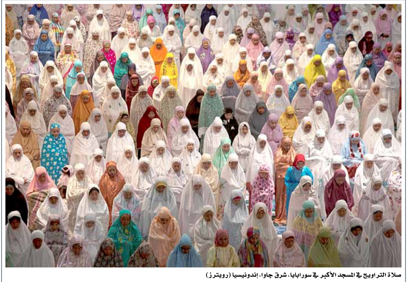
صلاة التراويح في المسجد الأكبر في سورابايا، شرق جاوا، إندونيسيا