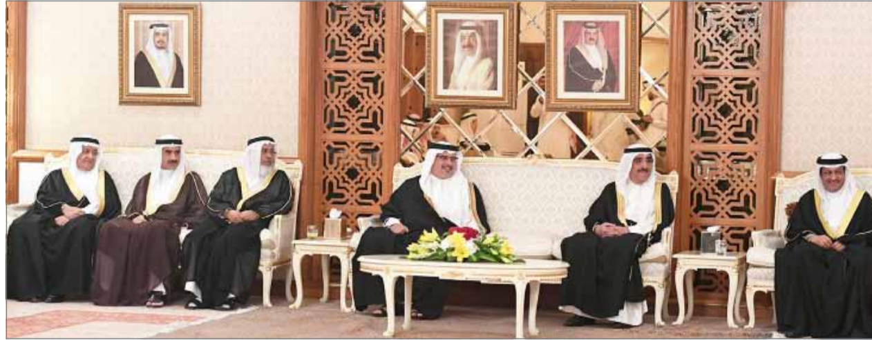
• سمو ولي العهد يزور مجلس سمو الشيخ محمد بن خليفة