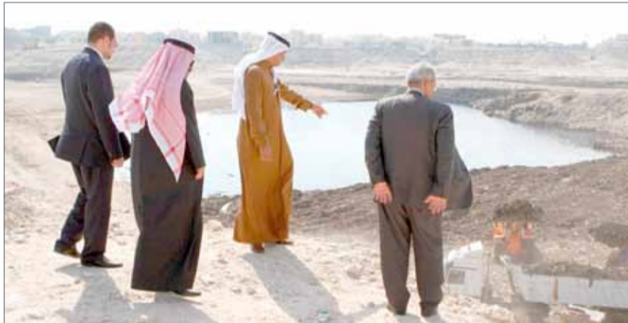
• وزير الإسكان في زيارة تفقدية للمشروع (ارشيفية)

الصحي والمداخل والمخارج للمشروع الإسكاني. من جهته، ذكر وزير الأشغال وشؤون البلديات والتخطيط العمراني عصام خلف أنه يتم الترتيب حالياً مع استشاري المشروع، لإيجاد حلول لمشكلة تدفقات المياه وتفاوت مستويات طبقات الأرض في موقع المشروع.