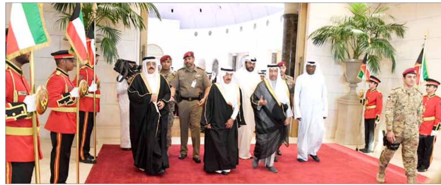
• سمو أمير دولة الكويت مستقبلاً سمو رئيس الوزراء