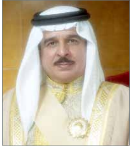
• جلالة الملك

الاجتماعي، ويقدر هذا المبلغ ويحسب بذات الطريقة المشار إليها في الفقرة الأولى من هذه المادة، ويشترط لضم الحد الأقصى لمدة الخدمة الافتراضية وفقاً لأحكام هذه المادة عدم انتفاع المؤمن عليه بضم مدة خدمة افتراضية وفقاً لاي من القوانين التأمينية أو التقاعدية المعمول بها، ولا تحسب المدد الافتراضية ضمن المدد المؤهلة للمعاش إلا بقضاء المؤمن عليه مدة الاشتراك المنصوص عليها في المادتين (34) و(37) من هذا القانون، ونصت المادة الثانية من القانون على أن يصدر وزير المالية القرارات اللازمة لتنفيذ أحكام هذا القانون، وجاء في المادة الثالثة أن على رئيس مجلس الوزراء والوزراء - كل فيما يخصه - تنفيذ أحكام هذا القانون، ويعمل به اعتباراً من اليوم التالي لتاريخ نشره في الجريدة الرسمية.