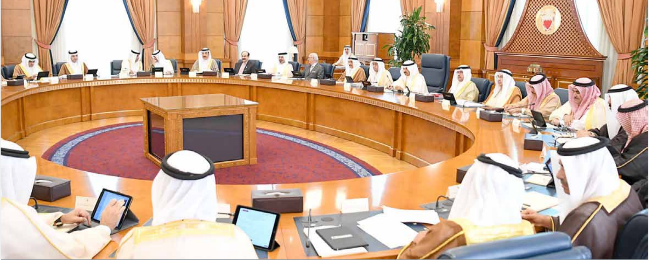
• سمو رئيس الوزراء مترئسا جلسة مجلس الوزراء أمس