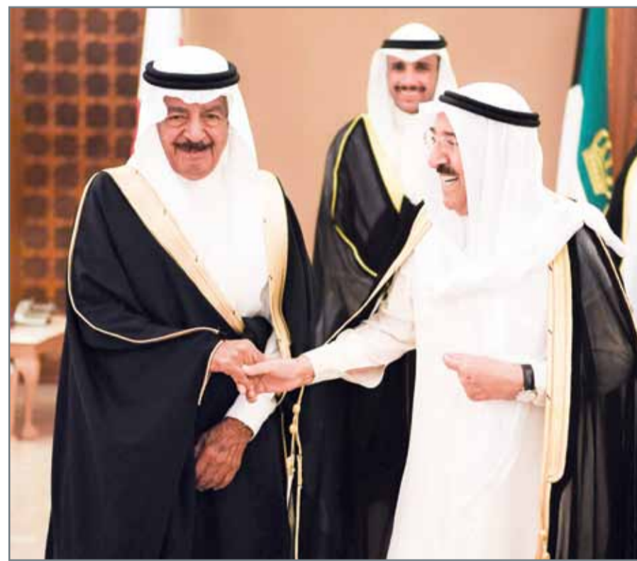
سمو أمير دولة الكويت مستقبلاً سمو رئيس الوزراء

المنامة - بنا: أكد أمير دولة الكويت الشقيقة صاحب السمو الأمير صباح الأحمد الجابر الصباح ورئيس الوزراء صاحب السمو الملكي الأمير خليفة بن سلمان آل خليفة ضرورة الوصول إلى حلول لمختلف الأزمات التي تواجها المنطقة بما يكفل الحفاظ على الأمن والسلام والاستقرار فيها. وشدد سموهما على أهمية اللقاءات التشاورية والتنسيقية على كل المستويات لتطويع ما هو قائم من علاقات قوية بين البلدين وتنمية أطر التعاون الثنائي في شتى المجالات. وكان صاحب السمو أمير دولة الكويت الشقيقة قد استقبل بقصر دسمان مساء أمس صاحب السمو الملكي رئيس الوزراء بحضور ولي عهد دولة الكويت سمو الشيخ نواف الأحمد الجابر الصباح ورئيس مجلس الوزراء سمو الشيخ جابر المبارك الحمد الصباح.