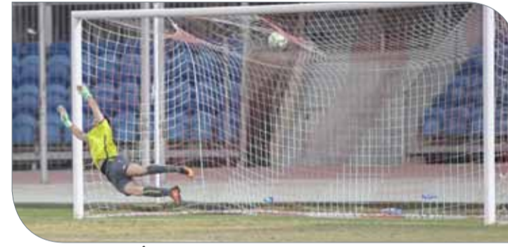
شباك الزلزال استقبلت أهداف في 3 مباريات

الأول للمسابقة، ولم تتجدد مرارة الفشل بمجرد الوداع الحزين، بل إن النتائج كانت مفاجئة للغاية حيث تلقى 3 هزائم أمام فيكتوروس (-4) ومن فيفا والمراكز الشبابية (2-0)، قبل أن يمني بهزيمته الثالثة أمام فريق الزعيم بالخسارة (1-2).