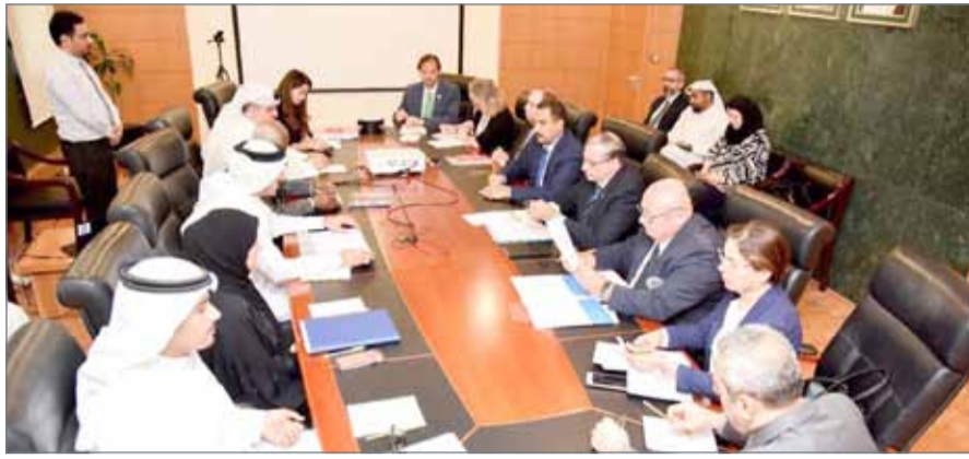
• وكيل "الخارجية" يرأس اجتماع لجنة التنسيق والمتابعة بين مملكة البحرين والأمم المتحدة

المنعقدة بتاريخ 23 نوفمبر 2017، والتي حددت وزارة الخارجية لرئاسة اللجنة، وتشمل عضوية ممثلين عن مكتب النائب الأول لرئيس مجلس الوزراء، ووزارة شؤون مجلس الوزراء، ووزارة المالية، وتختص اللجنة بمتابعة تنفيذ المشاريع والمبادرات المقترحة بين الجهات الحكومية ووكالات وهيئات الأمم المتحدة المقيمة والإقليمية، لضمان المواءمة مع برنامج عمل الحكومة، والرؤية الاقتصادية لمملكة البحرين 2030، والتأكد من توافر الاعتمادات المالية اللازمة، وعدم ازدواجية المشاريع.