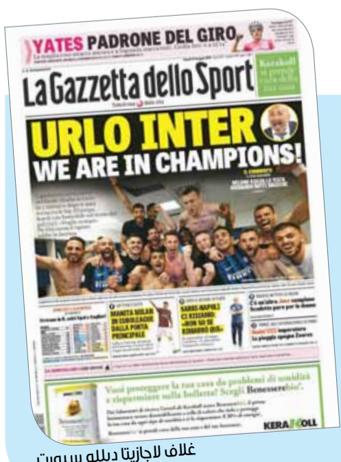
غلاف لاجازيتا ديللو سبورت

وأضافت: "ساري يكرها مرة أخرى، لا أعرف إذا كنت سأبقى أم لا". وتابعت: "ميلان يتأهل إلى الدوري الأوروبي من الباب الأمامي"، بعد أن نجح في التأهل للبطولة مباشرة دون لعب مرحلة التصفيات، بعد الفوز على فيورنتينا 5-1.