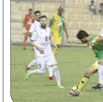
من لقاء المالكية والنخبة في نصف النهائي

بطل في أغلب المباريات وخصوصاً التنافسية منها عبر ظهوره القوي والمؤثر.