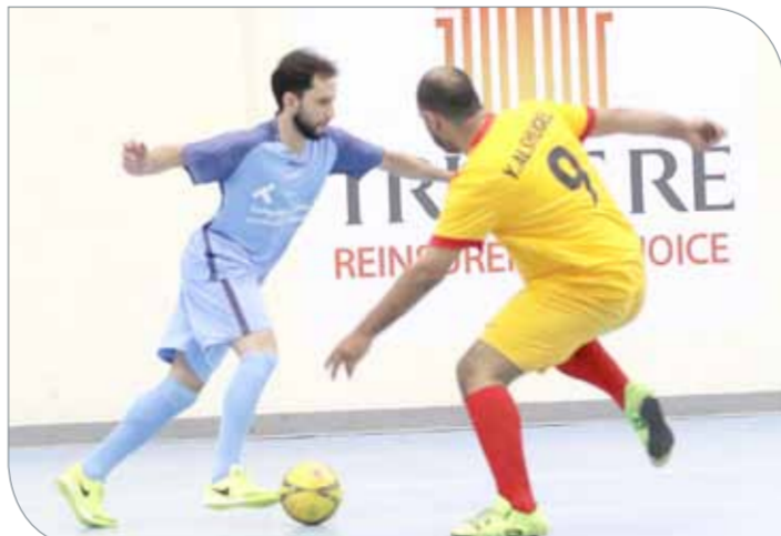
من منافسات بطولة ”تأمين 10“

في ختام مباريات الفريقين في المجموعة الثالثة، وبهذا الفوز تصدر فريق مصرف البحرين المركز إلى صدارة المجموعة برصيد 7 نقاط، وسينتظر حتى نهاية الدور التمهيدي لمعرفة ترتيبه النهائي في المجموعة، إذ يتنافس على الصدارة فريق سوليدريتي الذي سيختتم مبارياته اليوم