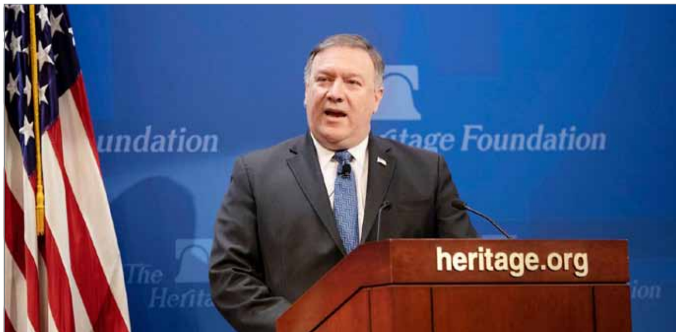
• وزير الخارجية الأميركي يتحدث في واشنطن أمس الإثنين

جانب الخطوط العريضة للسياسة الخارجية الأميركية تجاه البرنامج النووي والصاروخي لطهران، وكذلك استمرار قمع حراك الشعب الإيراني من أجل التغيير وانتهاكات حقوق الإنسان.