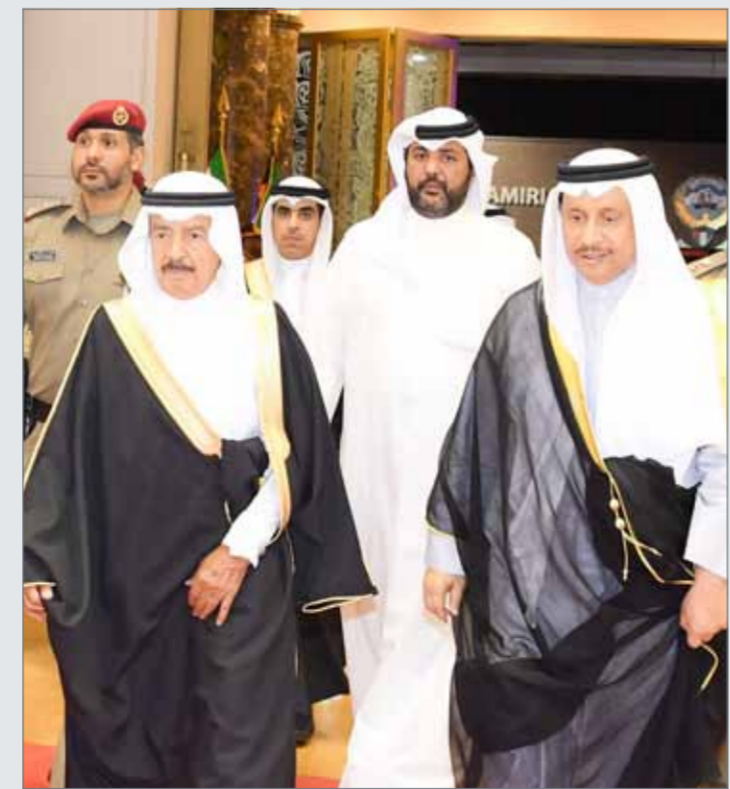
• سمو رئيس الوزراء بمفادرا دولة الكويت الشقيقة

تم بحث عدد من الموضوعات التي تستهدف دعم وتعزيز العلاقات البحرينية الكويتية والارتقاء بالتعاون الثنائي بين البلدين. وكان في وداع صاحب السمو الملكي