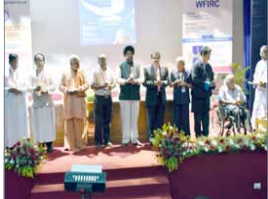
• لحظة تذكارية على هامش المؤتمر

جلالة الملك. ويعتبر بيبي بالرحلة التي صاحب فيها المغفور له بإذن الله سمو الأمير عيسى بن سلمان آل خليفة وصاحب الجلالة الملك حمد بن عيسى آل خليفة الذي كان ولياً للعهد آنذاك وصاحب السمو الملكي رئيس الوزراء وصاحب السمو الملكي ولي العهد أثناء زيارتهما الرسمية للهند.