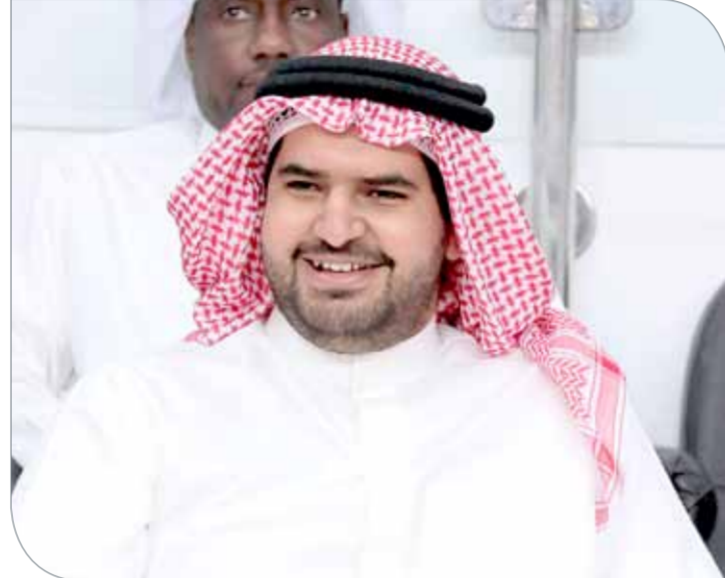
سمو الشيخ عيسى بن علي

وجه رئيس الاتحاد البحريني لكرة السلة سمو الشيخ عيسى بن علي آل خليفة، اللجنة المنظمة لبطولة البحرين الدولية لكرة السلة برئاسة الشيخ سلمان بن عبدالله آل خليفة بفتح أبواب المدرجات مجاناً للجماهير البحرينية وذلك في مباريات البطولة التي تقام برعاية سمو الشيخ عيسى بن علي آل خليفة. وأكد سمو الشيخ عيسى بن علي آل خليفة أن هذا القرار يأتي تقديرًا للجماهير