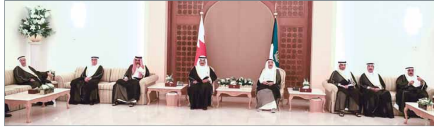
• سمو رئيس الوزراء لدى وصوله دولة الكويت وفي استقباله سمو رئيس مجلس الوزراء الكويتي

علاقتنا مميزة بعمقها التاريخي وبعدها الحضاري... سمو رئيس الوزراء: