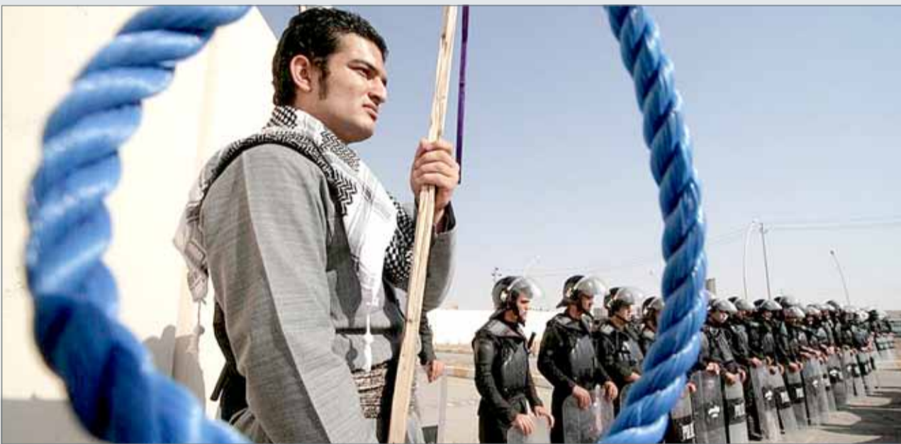
• من عمليات الإعدام التي ينفذها النظام الإيراني ضد الأقليات

رصدت منظمة "سلام بلا حدود" العالمية أحوال الأقليات في إيران وما تتعرض له من جرائم إبادة واضطهاد ضد الأقليات العرقية في إيران متجذر منذ العام 1925، لكن الأقليات الدينية كان لديها بعض الحقوق في إيران خلال عهد البهلوي. ومع ذلك، فإن الاضطهاد الحالي في إيران ضد الأقليات الدينية وكذلك الجماعات العرقية قد ترسخ منذ استولى النظام الحالي على السلطة في العام 1979. وقد تم إعدام أو إلقاء القبض على عدد كبير من نشطاء الأقليات مثل اليهود والمسيحيين والبهائيين؛ بسبب مطالبهم المشروعة. وهذا يعني أن وضع الأقليات الدينية في إيران يثير القلق بسبب الدستور والأيدولوجية السياسية للنظام الإيراني. تضاعف الاضطهاد ضد اليهود والبهائيين كأقليات دينية في إيران منذ تولي النظام الحالي السلطة في العام 1979. بالإضافة إلى ذلك، تعتبر السلطات الإيرانية أن الدين البهائي واليهودية يشكلان تهديداً لأمن النظام، وأطلقت السلطات حملات قمعية واسعة النطاق ضد النشطاء الأقليات الدينية، بما في ذلك المسلمون الذين اعتنقوا المسيحية واليهود والبهائيين كمرتدين، وبالتالي يواجه النشطاء محاكمات غير عادلة.