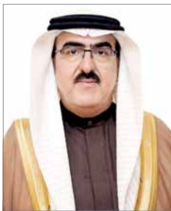
• ياسر الناصر

هو 79% عبر الآليات ومبادرات العمل التي اتخذتها الوزارات والجهات الحكومية، وبناء عليه قرر مجلس الوزراء تمديد خطة عمل الاستراتيجية الوطنية للطفولة للأعوام الخمسة المقبلة؛ لاستكمال تنفيذ المتبقي من الخطة بما يعزز النتائج والمكاسب المتحققة في مجال تنمية الطفولة وحمايتها ويفضي إلى زيادة التنسيق بين الجهات المختلفة لتوسيع قاعدة المستفيدين من تلك الخطة، ووجه مجلس الوزراء أن تكون هذه الاستراتيجية المرجعية عند إصدار الجهات الحكومية لتقاريرها ذات العلاقة بالطفولة، وذلك خلال استعراض المجلس للتقرير المرفوع بهذا الخصوص من وزير العمل والتنمية الاجتماعية.