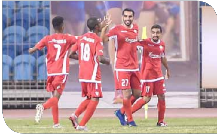
فرحة فريق صقور البحرين في الجولة الماضية