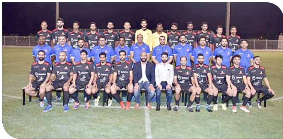
فريق بتلكو جنرز يوناييتد