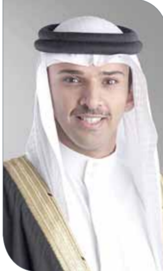
الشيخ علي بن خليفة

تقديم مباراة بمستوى فني عال يعكس تطور الكرة البحرينية ويشكل صورة جميلة لختام الموسم الكروي.