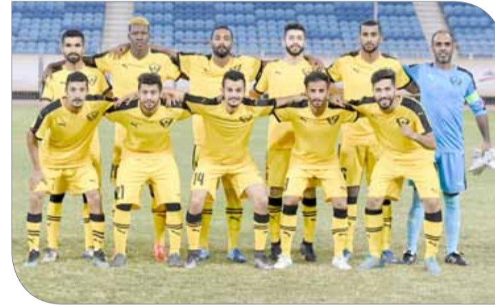
فريق الصقر الأبيض