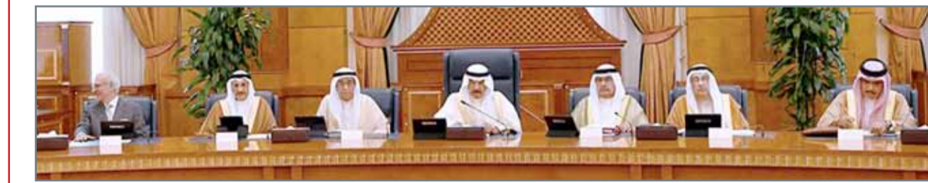
سمو رئيس الوزراء مترأساً جلسة مجلس الوزراء أمس

تنفيذ الاحتياجات من المدارس والطرق الداخلية والخدمات الصحية والمراكز الشبابية ومراكز التسوق المركزي والتجاري للتسهيل والتيسير على قاطنيها، وأن يتم التنسيق في هذا الخصوص مع سمو محافظ الجنوبية.