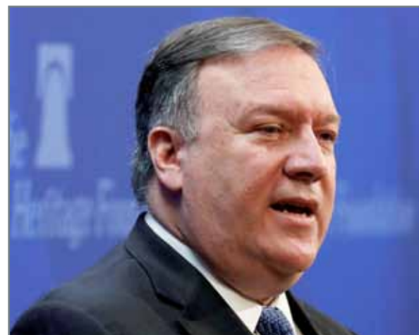
وزير الخارجية الأميركي يتحدث في واشنطن أمس الإثنين

واشنطن - وكالات: أعلن وزير الخارجية الأميركي مايك بومبيو، أمس الإثنين، عن سياسة الولايات المتحدة لمواجهة سلوك إيران حول دعم الإرهاب وزعزعة الاستقرار في المنطقة، إلى جانب الخطوط العريضة للسياسة الخارجية الأميركية تجاه البرنامجين النووي والصاروخي لطهران، وكذلك استمرار قمع حراك الشعب الإيراني من أجل التغيير وانتهاكات حقوق الإنسان. وقال إن على إيران وقف دعم الإرهاب وحزب الله والحوثيين وسحب قواتها من سوريا. وأضاف إن حزب الله بات أكثر قوة بسبب الدعم الإيراني المتزايد منذ توقيع الاتفاق النووي، فيما أن جماعة الحوثي التي تدعمها إيران تنوع الشعب اليمني وتهدد جيران اليمن. وأوضح وزير الخارجية الأميركي أن الإستراتيجية الأميركية الجديدة تتكون من 7 محاور للتعامل مع إيران. وقال إن "العقوبات على إيران تنتهي فوراً بمجرد تنفيذ ما هو مطلوب منها"، مشدداً على أن هناك 12 مطلباً أميركياً من إيران. وأكدت وزارة الخارجية البحرينية الدعم الكامل للاستراتيجية الأميركية تجاه إيران، التي أعلنتها وزير خارجية الولايات المتحدة الأميركية الصديقة مايك بومبيو أمس.