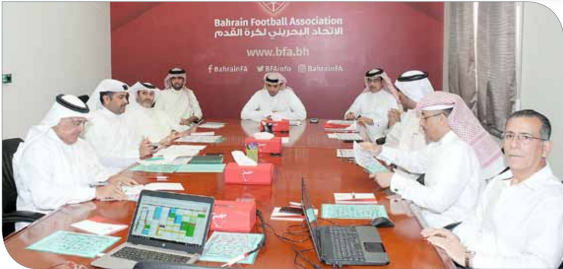
من اجتماع مجلس الإدارة

26 لاعباً بما فيهم المحترفون على أن يكون من ضمنهم 3 لاعبين بحرينيين تحت 21 سنة كحد أدنى.