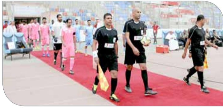
الحكام لم يستخدموا البطاقة الحمراء في الجولة الثانية