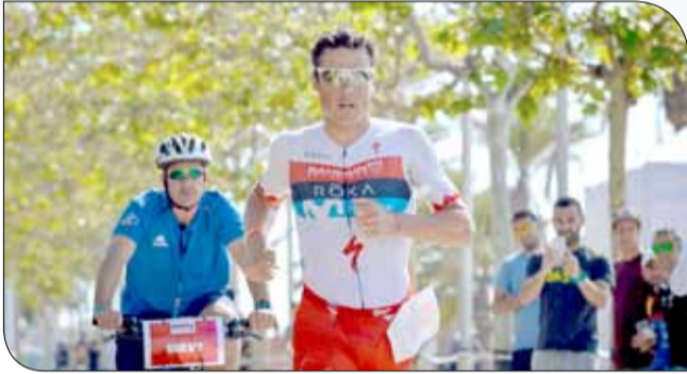
من المنافسات في بطولة برشلونة

استطاع متسابق فريق البحرين للتحمل 13 خافيير غوميز الانتصار في القمة ببطولة برشلونة للرجل الحديدي 70.3 بفارق 3 دقائق عن أقرب منافسيه، منهيًا السباق في أربع ساعات ودقيقة و39 ثانية. واستطاع المتسابق الإسباني أن يقدم أداءً مميزاً خلال هذه المسابقة، حيث خرج من سباق الماء متصدراً، إلا أن منافسيه استطاعوا الاقتراب منه خلال سباقات الدراجات، ولكنه عاد ليعزز صدارته في سباق الجري، منهيًا السباق في المركز الأول. وهذا السباق بمثابة تجربة مهمة لغوميز قبل مشاركته في بطولة العالم في كونا، والمحطة القادمة للمتسابق الإسباني ستكون في كيرنز، حيث سيشارك للمرة الأولى في سباق الرجل الحديدي الذي سيقام هناك.