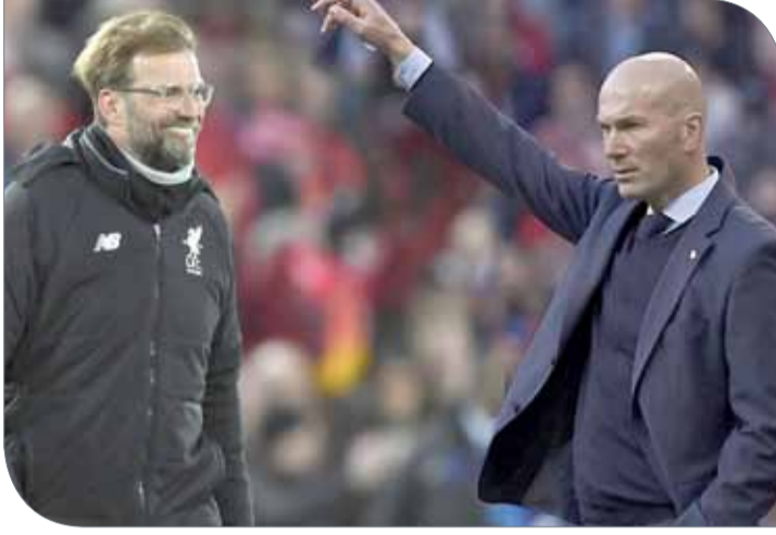
يورجن كلوب وزين الدين زيدان

ويستهدف ريال إحراز لقب دوري الأبطال للموسم الثالث على التوالي تحت قيادة زيدان، لاعب منتخب فرنسا السابق، بينما سيحاول كلوب أن يقود ليفربول للتتويج باللقب للمرة السادسة في تاريخه والأولى منذ 2005 عندما يلتقي العملاقان في كييف. وقال كلوب لموقع النادي على الإنترنت: "أنا سعيد لأننا لن نلعب ضد بعضنا البعض.. لن أحتاج إلى مراقبته