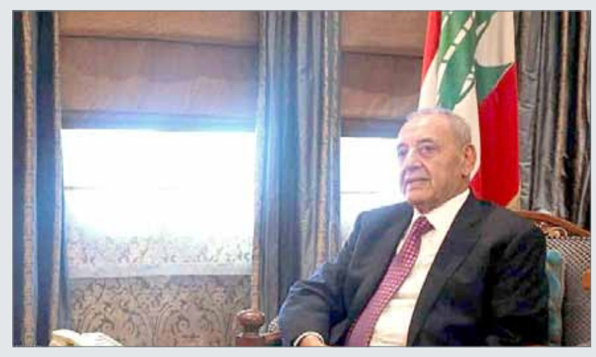
• نبيه بري

وألقي الحريري بلائمة الخسائر على النظام الانتخابي الجديد وعلى تقصير "تيار المستقبل"، مما دفعه إلى إعادة ترتيب داخلي خلال الحزب.