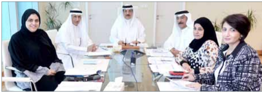
وزير العمل يتراء الاجتماع الثاني لمجلس إدارة الصندوق الوطني

للمصندوق عن العام 2017، واستعراض التقرير المالي الربع سنوي لمصرفات الصندوق للعام 2018، فضلا عن بحث الخطط المستقبلية لتحقيق شراكة مجتمعية أوسع مع منظمات المجتمع المدني، بهدف الارتقاء بالخدمات المقدمة للمواطنين ضمن اختصاص الصندوق وتطويرها.