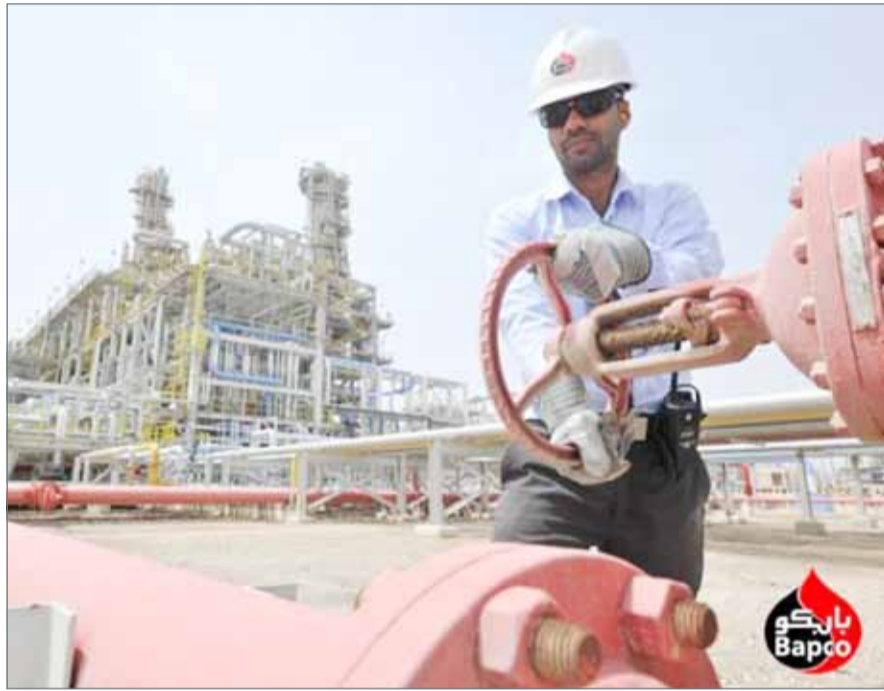
تعمل السياسة الاقتصادية بالبحرين على تنويع الإيرادات بعيدا عن النفط

أما بالنسبة للتأثيرات على المدى الطويل لتغيرات أسعار النفط وفق التقديرات، وجد التقرير أن استجابة عائدات الأسهم ليست ذات دلالة إحصائية في البحرين والمملكة العربية السعودية، سواء كانت تغيرات أسعار النفط إيجابية أو سلبية، بينما تظهر البيانات الأخرى أن التغيرات السلبية (أو الإيجابية) في أسعار النفط لها آثار جوهريّة على عائدات سوق الأسهم في كل من الكويت وعمان وقطر.