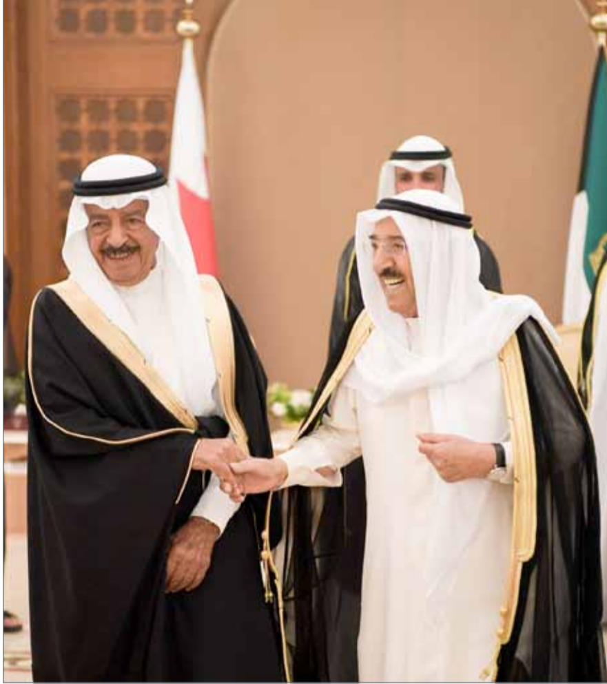
من لقاء سمو رئيس الوزراء وسمو أمير الكويت في الزيارة الأخيرة

ولاشك أن هذا التقدير البحريني الكبير يدفع نحو المزيد من التعاون في جميع المجالات مع دولة الكويت الشقيقة في ظل تجدد وتنوع العلاقات المشتركة ورعاية ودعم كل من عاهل البلاد صاحب الجلالة الملك حمد بن عيسى آل خليفة، وأخيه أمير دولة الكويت صاحب السمو الشيخ صباح الأحمد.