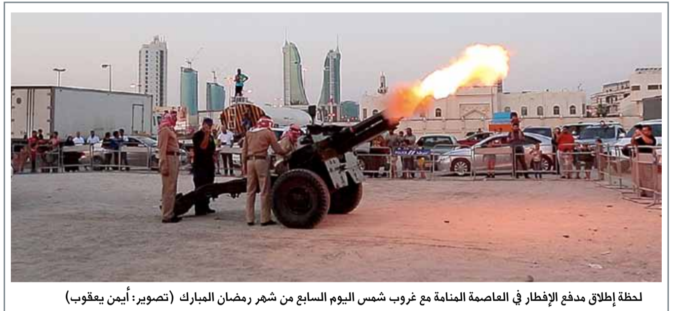
لحظة إطلاق مدفع الإفطار في العاصمة المنامة مع غروب شمس اليوم السابع من شهر رمضان المبارك

حالة الطقس الطقس حسن ولكنه حار خلال النهار.