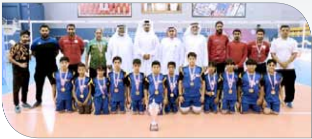
تتويج الفائزين في بطولة الكرة الطائرة للبنين

هذه البطولة بعد أن حققها في العام الدراسي الماضي كذلك، وهو يعكس الاهتمام بالعبة في المدرسة، في حين شهدت المباراة النهائية تنافساً كبيراً بين الفريقين من أجل الانتصار لكن الكلمة العليا في النهاية كانت لليومك الذي انتصر بشوطين دون رد.