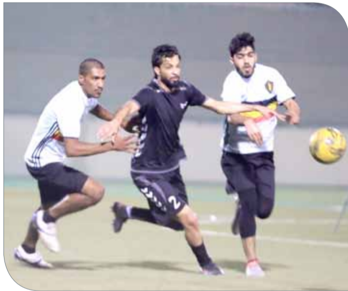
من منافسات البطولة

وتستمر منافسات البطولة بإقامة الجولة الرابعة حيث سيلتقي فريق إيليا بفريق عذاري، وفريق شباب المحرق بفريق مركز شباب عراد، وسيجمع اللقاء الأخير الذيب العيناوي بالأحلام.