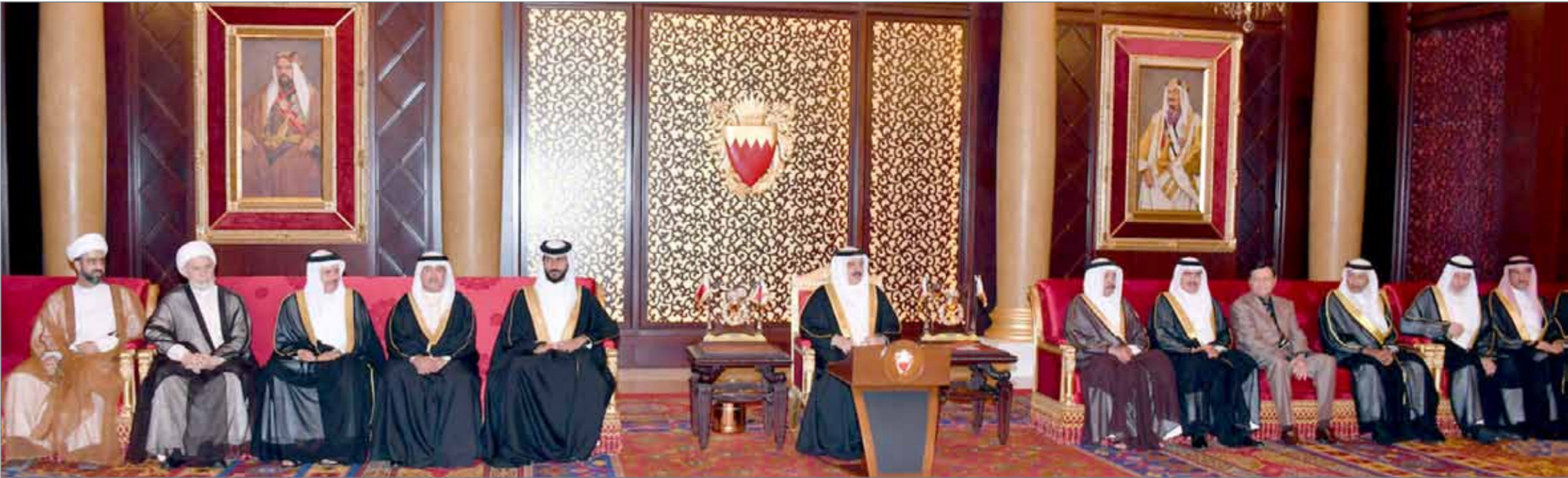
• جلالة الملك مستقبلاً الممثلين من أهالي محافظة العاصمة

تهيئة الظروف للجيل الجديد ليكون واعيا بمسؤولياته وواجباته... جلالة الملك: