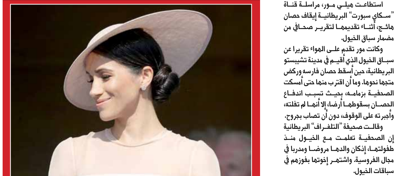
بدأت زوجة الأمير هاري حفيد ملكة بريطانيا، ميفان ماركل، في أول إطلالة رسمية لها كدوقة ساكس وفيه لاسلوبها البسيط في مجال الأناقة، فاختارت ثوبا ربيعيا من الكريب الصوفي باللون الزهري الفاتح جدا تميز بأكمامه الطويلة الشفافة.

استطاعت هيلي مور، مراسلة قناة "سكاى سبورتنج" البريطانية إيقاف حصان هائج، أثناء تقديمها لتقرير صحفي من مضمار سباق الخيول. وكانت مور تقدم على الهواء تقريرها عن سباق الخيول الذي أقيم في مدينة تشيبستون البريطانية، حين أسقط حصان فارسه وركض متجها نحوها. وما أن اقترب منها حتى أمسكت الصحفية بزمامه، بحيث تسبب اندفاع الحصان بسقوطها أرضا، إلا أنها لم تفلته، وأجبرته على الوقوف، دون أن تصاب بجروح. وقالت صحفية "تلغراف" البريطانية إن الصحفية تعلمت مع الخيول منذ طفولتها، إذ كان والدها مروضاً ومدرباً في مجال الفروسية، واشتهر إخوتها بفوزهم في سباقات الخيول.