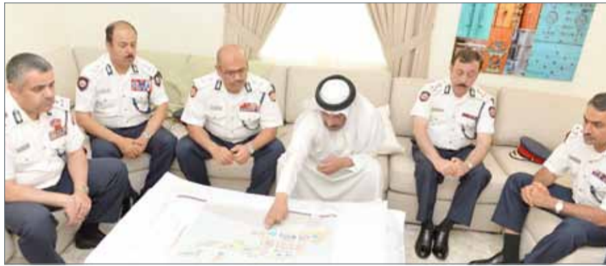
رئيس الأمن العام ووكيل الإسكان أثناء الزيارة التفقدية لمدينة سلمان

الأمن العام ومرافقه إلى إيجاز تضمن الخطط اللازمة لتأمين مدينة سلمان والبرامج التدريبية الهادفة إلى رفع معدلات الكفاءة والجاهزية.