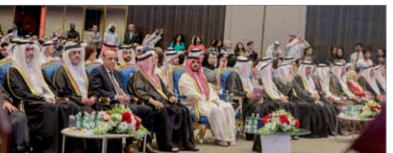
سمو الشيخ محمد بن سلمان يرعى حفل تخرج مدرسة عبدالرحمن كانوا الدولية

المنامة - بنا: تحت رعاية سمو الشيخ محمد بن سلمان بن حمد آل خليفة، أقامت مدرسة عبدالرحمن كانوا الدولية حفل تخرج الفوج التاسع من طلبتها مساء أمس في فندق أرت روتانا، بحضور عدد من أفراد العائلة المالكة الكريمة والمسؤولين بالمملكة، وجمع من أولياء أمور الطلبة والضيوف. وهنا سمو الشيخ محمد بن سلمان بن حمد آل خليفة الخريجين متمنياً لهم التوفيق والنجاح في مستقبلهم العلمي والعمل، مبرحاً سموه عن سروره بمشاركةهم وأهلهم هذه المناسبة السعيدة التي هي عنوان انطلاقتهم نحو بناء مستقبلهم ليحققوا طموحهم وآمالهم ولينضموا إلى أبناء البحرين الذين تفخر بهم المملكة ممن يسهمون كل من موقعه في خدمة الوطن ومسيرة التنمية الشاملة فيه