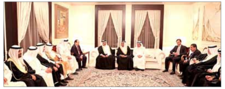
سمو ولي العهد في زيارة لمجلس المرحوم عبدالله أحمد ناس