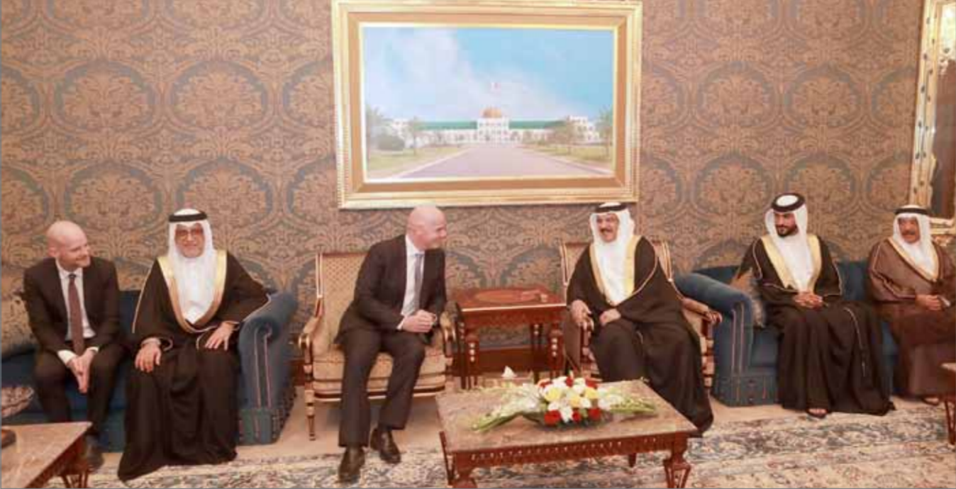
• جلالة الملك مستقبلاً، بحضور سمو الشيخ ناصر بن حمد، رئيس الاتحاد الدولي لكرة القدم (الفيفا)

وأشاد جللته بالتعاون الوثيق والتنسيق المستمر بين الاتحاد البحريني لكرة القدم والاتحاد الدولي لكرة القدم، منوهماً بالإنجازات التي تواصل تحقيقها المنتخبين والفرق والأندية الوطنية وما تقدمه من أداء متميز بمشاركاتها في المنافسات الإقليمية والعالمية والذي كان له دور كبير في بلوغها نتائج مثمرة وحصدوا للعديد من الألقاب القارية والدولية في مختلف الألعاب الرياضية. كما أكد جلالة الملك دعم مملكة البحرين لتطويرها عالمياً ودعمها والنموض للرياضة من دور مهم في تعزيز علاقات الصداقة ومد جسور التواصل وتعزيز قيم مستوى العالم.