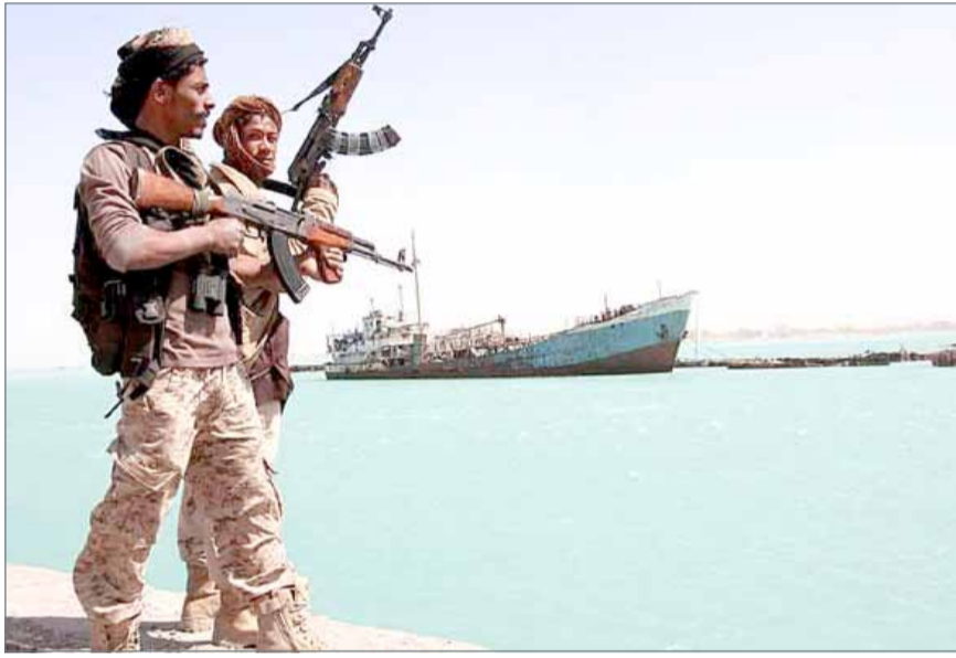
• جنديان من قوات الشرعية على ساحل البحر الأحمر باليمن

العربي تعزيزات للمليشيا الحوثية، وأظهرت صور بثها التحالف العربي استهدافا دقيقا ومهارة عالية لقوات التحالف في التعامل مع الأهداف القتالية المتروعة.