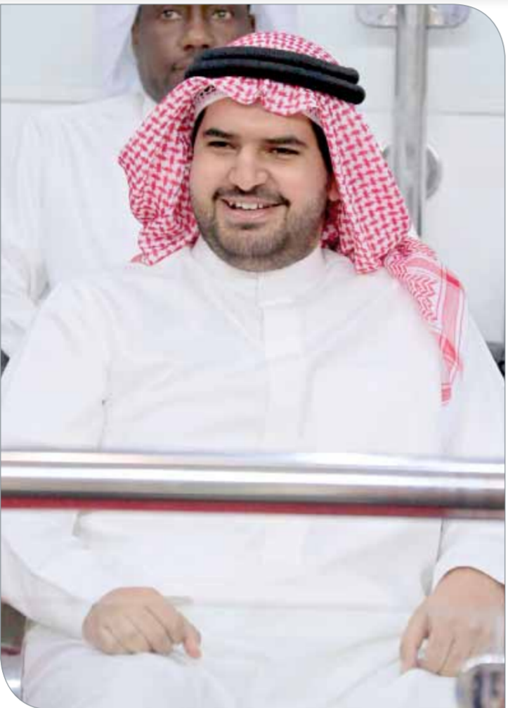
سمو الشيخ عيسى بن علي

- تشهد المرحلة المقبلة اهتماما كبيرا بلعبة كرة السلة الثلاثية "3 أون 3" التي ستكون لها مكانتها وشأنها في المنطقة قريبا.