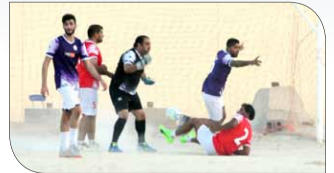
لقطة من المباراة