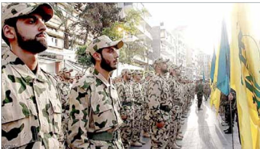
• عناصر من مليشيا حزب الله الموالية لإيران

وحذرت إسرائيل من أنها لن تقبل بوجود عسكري إيراني دائم في سوريا، وقصفت إسرائيل عددا من الأهداف الإيرانية هناك في وقت سابق من الشهر الجاري بعد ما قالت إنه هجوم صاروخي إيراني وقع عبر الحدود.