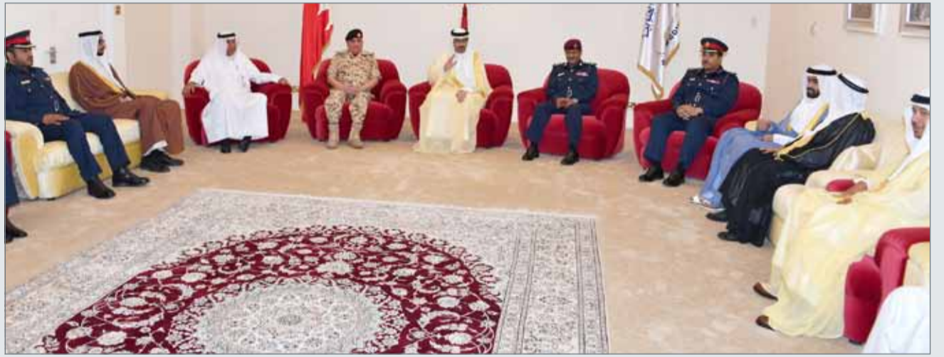
• سمو محافظ الجنوبية مستقبلا جموع المهنتين من أهالي المحافظة

الوزراء وضمن رؤيته الحكيمة للتوسع في الخطط التنموية.