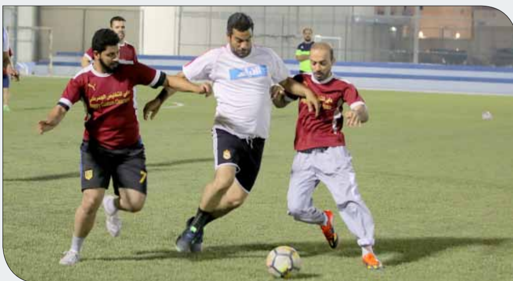
لقطة من منافسات المتقاعدين