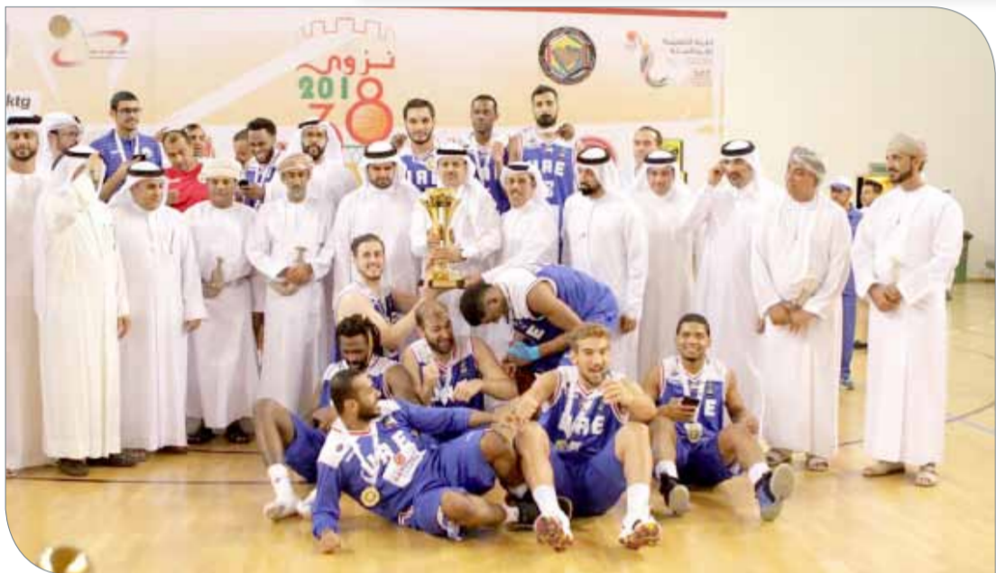
الشارقة متوجا بالبطولة لـ٣٨ لكرة السلة