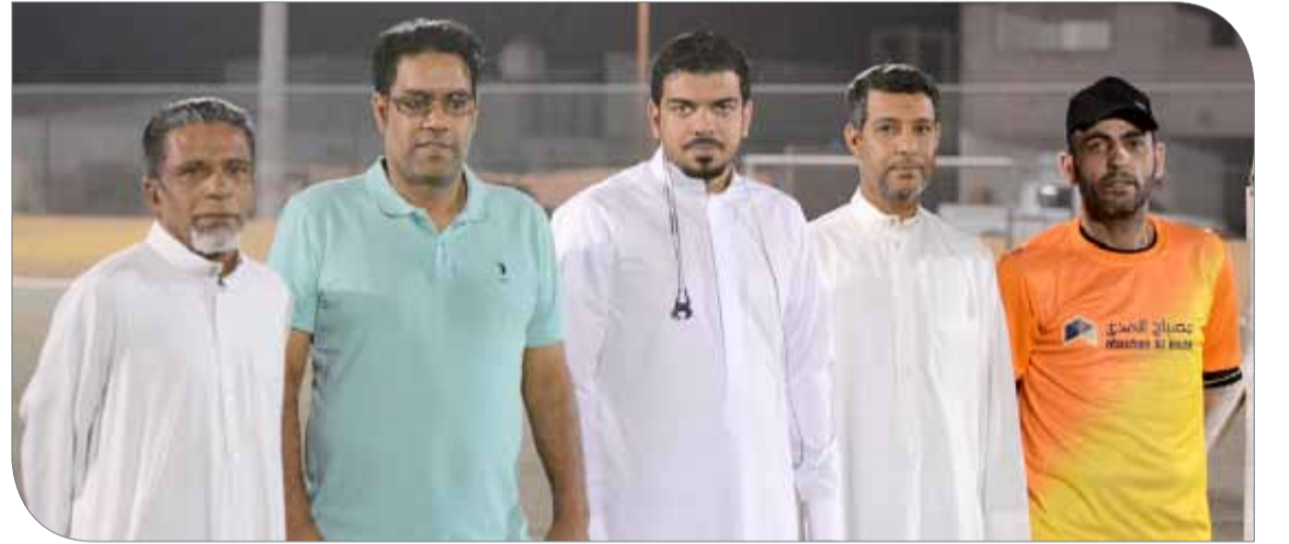
لحظة انطلاق البطولة