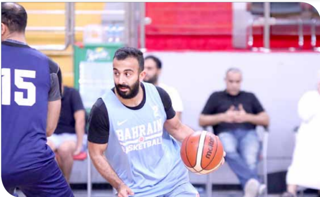
من تدريبات منتخبنا الوطني لكرة السلة

وتابع: "تركيزي حالياً منصب على الاستفادة الفينة من مواجهة لكرة السلة والتي تهدف إلى زيادة جرعة المشاركات الدولية للمنتخبات الوطنية، مؤكداً أن السلة البحرينية صعيد المشاركات الدولية، وهذا الشيء يفقده اللاعب البحريني". وأثاد مدرب منتخبنا الوطني الأول لكرة السلة بالرؤية الثاقبة التي