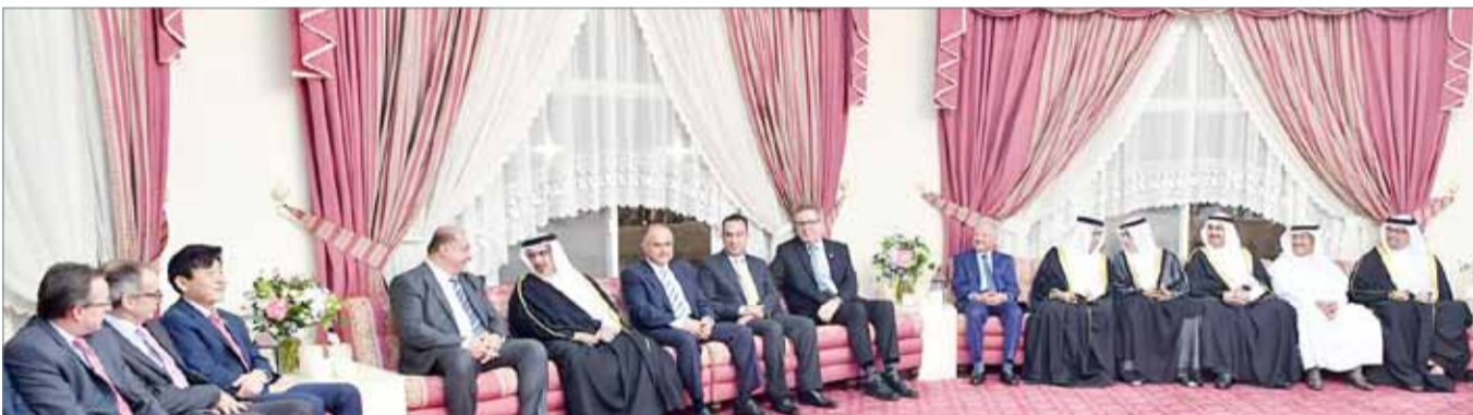
• وسموه يزور مجلس عائلة كازروني