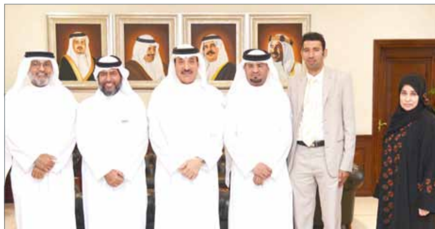
• وزير العمل في لقاء مع رئيس المجلس البلدي بالشمال

مدينة عيسى - وزارة العمل والتنمية الاجتماعية: التقى وزير العمل والتنمية الاجتماعية جميل حميدان أمس رئيس المجلس البلدي في المحافظة الشمالية محمد بومود، وعضو المجلس البلدي حسين الحياض. وتم خلال اللقاء، بحث سبل التعاون المشترك لوضع آلية للتعامل مع الأسر المتضررة من حريق المساكن، ووضع أفضل الحلول والإجراءات اللازمة؛ لمساعدة الأسر التي قد تتعرض لمثل هذه الحوادث الاستثنائية، ولتجنبها التأخير والانتظار؛ من أجل الاستفادة من خدمات الدعم التي تقدمها الوزارة لتعويض الأسر من ذوي الدخل المحدود نتيجة تعرض مساكنهم لتلك الحوادث المؤسفة، بما يؤمن لهم الاستقرار العائلي.