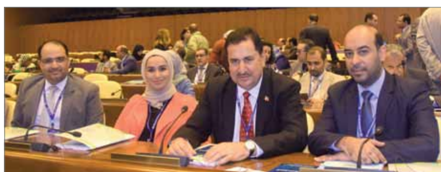
• وكيل العمل مشاركا باجتماع المجموعة العربية بجنيف

مدينة عيسى - وزارة العمل والتنمية الاجتماعية: شارك وكيل وزارة العمل والتنمية الاجتماعية صباح الدوري، مساء أمس، في اجتماع المجموعة العربية الذي يعقد على هامش الدورة الـ (107) لمؤتمر العمل الدولي المنعقد حاليا في جنيف في الفترة من 28 مايو إلى 8 يونيو 2018، وبحث الاجتماع تنسيق المواقف العربية في مؤتمر العمل الدولي والقضايا التي تهم المنطقة العربية، خصوصا تطبيق التوصيات والناتج الصادرة عن الأنشطة المشتركة بين منظمة العمل العربية ومنظمة العمل الدولية، ودعم القضايا العربية في الشأن العمالي.