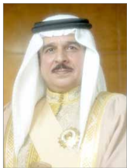
• جلالة الملك

المنامة - بنا: صادق عاهل البلاد صاحب الجلالة الملك حمد بن عيسى آل خليفة، وأصدر قانوناً رقم (21) لسنة 2018 بالتصديق على اتفاقية بين مملكة البحرين وروسيا الاتحادية بشأن تسليم المجرمين، بعد إقراره من جانب مجلس الشورى ومجلس النواب. وقد جاء في مادة القانون الأولى أنه صودق على اتفاقية بين مملكة البحرين وروسيا الاتحادية بشأن تسليم المجرمين الموقعة في مدينة موسكو بتاريخ 27 مايو 2016، والمرافقة لهذا القانون. كما نصت المادة الثانية من القانون أنه على رئيس مجلس الوزراء والوزراء - كل فيما يخصه - تنفيذ أحكام هذا القانون، ويعمل به من اليوم التالي لتاريخ نشره في الجريدة الرسمية.