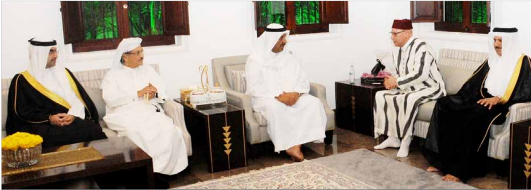
• جانب من الاستقبال

المنامة - بنا: استقبل وزير الديوان الملكي الشيخ خالد بن أحمد آل خليفة، والقائد العام لقوة دفاع البحرين المشير الركن الشيخ خليفة بن أحمد آل خليفة، مساء أمس، رئيس المجلس الأعلى للصحة الفريق طبيب الشيخ محمد بن عبدالله آل خليفة، ومحافظ الجنوبية سمو الشيخ خليفة بن علي آل خليفة، وسفير المملكة المغربية الشقيقة لدى مملكة البحرين أحمد خطابي، والأمين العام لدول مجلس التعاون لدول الخليج العربية عبداللطيف الزباني، وعددا من المسؤولين وجموعاً من المواطنين والمقيمين، الذين قدموا أصدق التهاني وأطيب التبريكات بحلول شهر رمضان المبارك، والذي يأتي في إطار الحرص على تكريس العادة السنوية في التواصل وتأكيد عادات المجتمع البحريني الأصيلة في الشهر الفضيل والمستمدة من روح ديننا الإسلامي الحنيف.