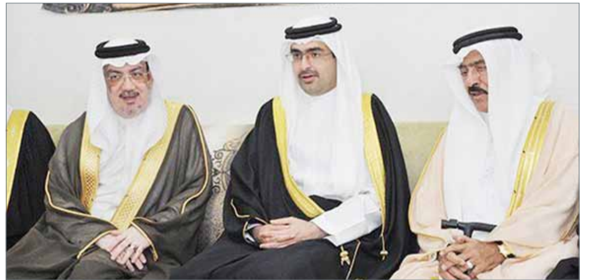
• سمو محافظ الجنوبية في زيارة لمجلس مدينة عيسى