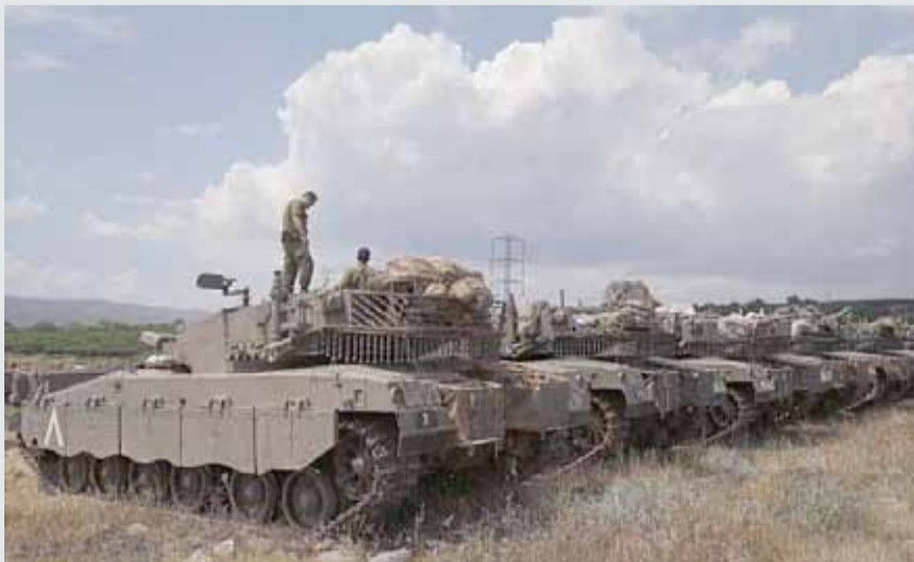
• دبابات للجيش الإسرائيلي في الجولان المحتل.

من جهة أخرى، أعلن الاتحاد الأوروبي، أمس الاثنين، تمديد العقوبات المفروضة على سوريا سنة إضافية وفق مقترحات الترتيبات الأوروبية، ردا على سياسات القمع التي يواصل النظام تنفيذها ضد السكان المدنيين. وتستهدف العقوبات إلى حد اليوم 259 مسؤولا و67 كيانا اقتصاديا. وشمل آخر إجراء عقابي في شهر مارس الماضي 4 مسؤولين سوريين، يعتقد الاتحاد بصلووعهم