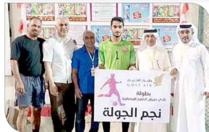
تكريم أفضل لاعب في دور الثمانية للبطولة

ستقام عند العاشرة من مساء يوم غد الخميس. وكانت مباريات دور الثمانية قد أقيمت يوم أمس الأول الأحد، وشهدت أغلبها تنافسا قويا من