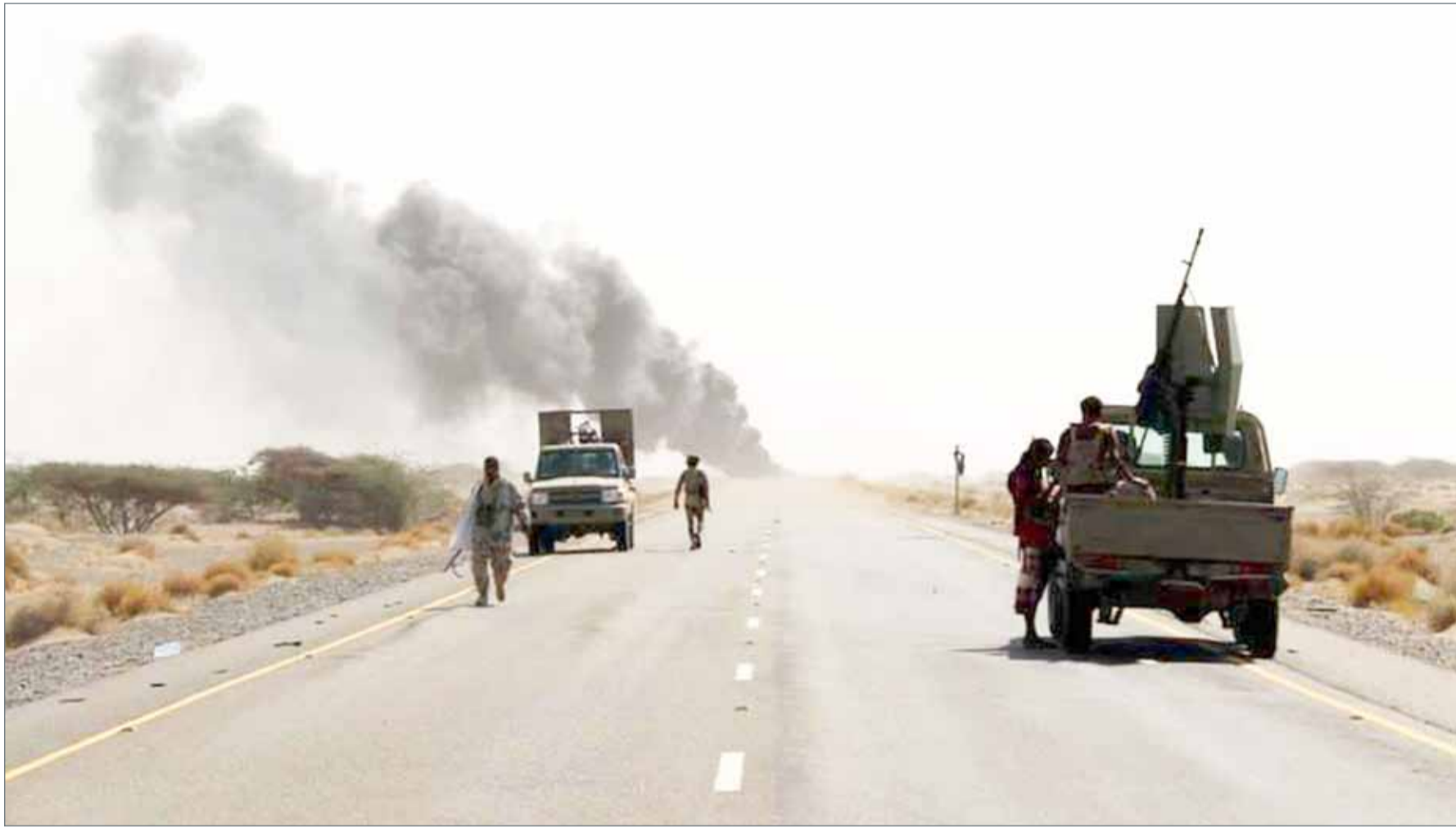
• قوات الشرعية خلال مواجهات مع المتمردين في محافظة الحديدة