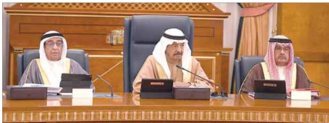
• سمو رئيس الوزراء مترئسا جلسة مجلس الوزراء أمس

• إتمام البنية التحتية والمرافق في "شرق الحد" و "إسكان البحر"