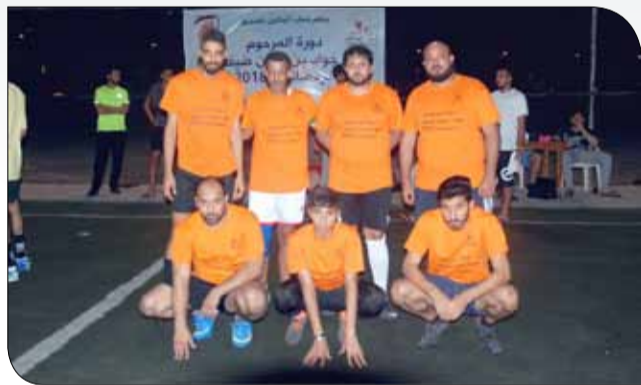
إحدى الفرق المشاركة في دورة ضيف