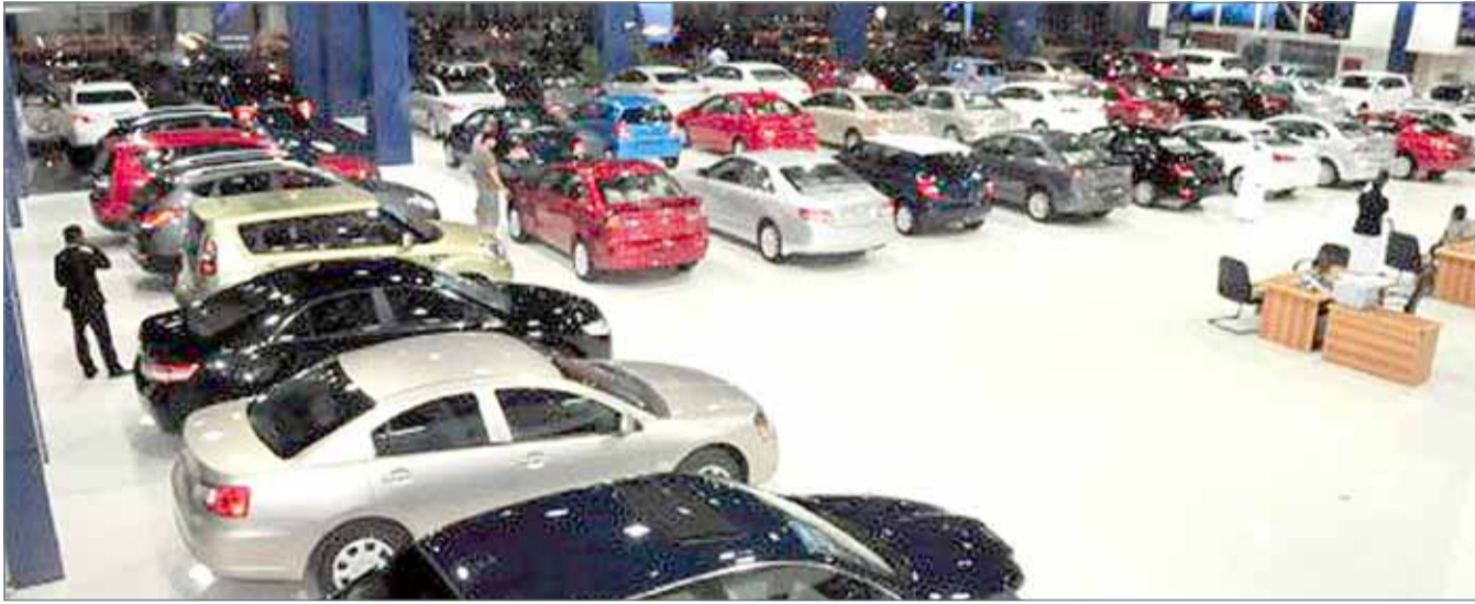
• شركات السيارات تطلق عروضاً ترويجية واسعة في رمضان المبارك

الماضية، أشار الشيخ إلى أن الثقافة الاستهلاكية في قطاع السيارات تتزايد، وهذا يخلق فرص مستقبلية جيدة لهذه السيارات الموفرة للوقود والتي تعتبر أكثر مراعاة للبيئة.