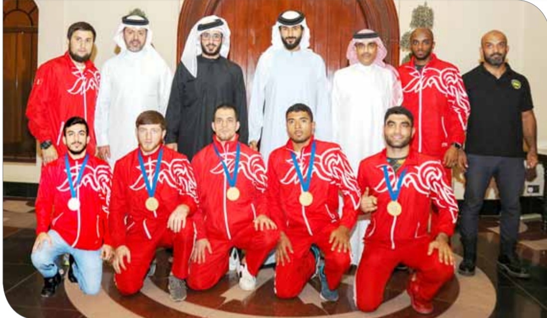
سمو الشيخ ناصر بن حمد وسمو الشيخ خالد بن حمد في صورة جماعية مع الأبطال

وأضاف سموه: "هذا الإنجاز يبعث في نفوسنا البهجة والسرور، خصوصا وأنه يعتبر الأعلى من حيث الميداليات الذهبية في جميع مشاركات المنتخب الوطني لفنون القتال المختلطة، والذي نعتبره نتيجة غير مسبوقه يحققها أفراد المنتخب في هذه المشاركة، والتي عكست بالفعل إصرار هؤلاء الأبطال على ظهور بصورة مشرفة من أجل حصد الألقاب والوصول لمنصة التتويج لرفع علم البحرين. وفي ختام اللقاء حرص أفراد المنتخب على التقاط صورة تذكارية مع سمو الشيخ ناصر بن حمد آل خليفة وسمو الشيخ خالد بن حمد آل خليفة.