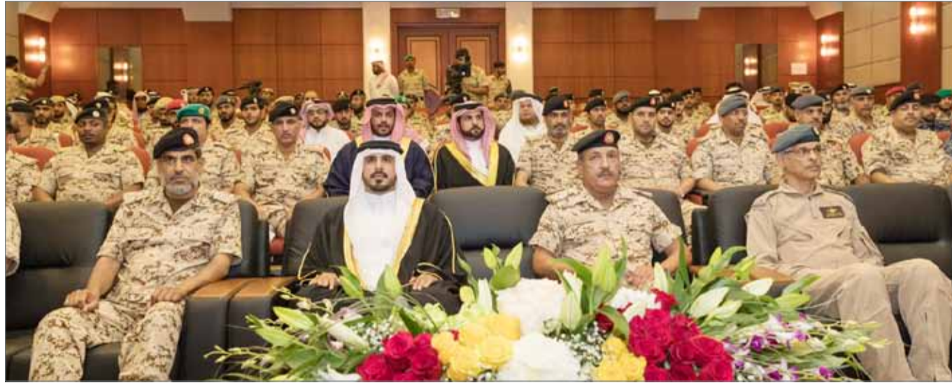
• سمو الشيخ محمد بن سلمان يرعى حفل ختام مسابقة قوة الدفاع الكبرى في حفظ القرآن الكريم وتجويدته