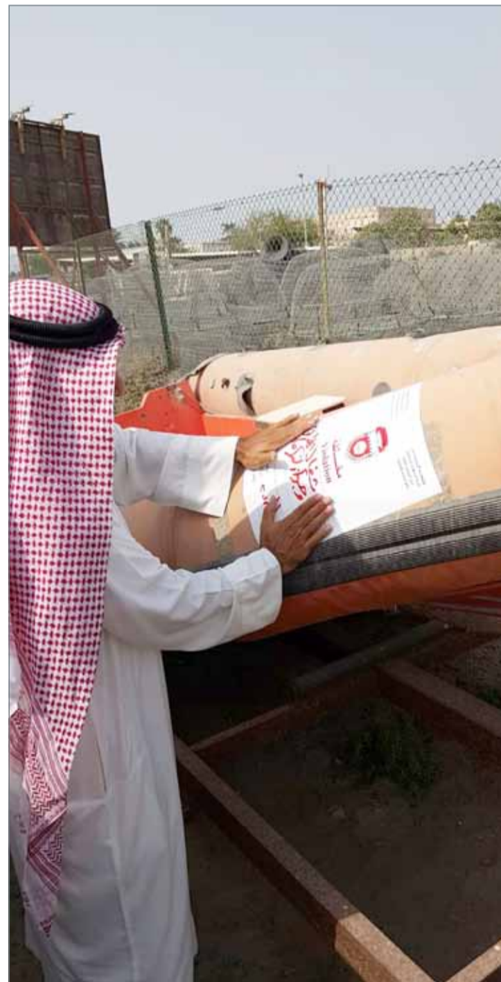
● حملة إخطار القوارب الشاغلة للطريق العام بالقرب من فرسة بندر الدار

الرفاع - بلدية الجنوبية: نظمت بلدية المنطقة الجنوبية وبالتعاون مع مديرية أمن المحافظة الجنوبية حملة على القوارب الشاغلة للطريق العام بالقرب من فرسة بندر الدار. ويأتي ذلك في إطار جهود البلدية، للحد من المخالفات والظواهر السلبية التي تشوه المظهر العام، وتتسبب في قلق راحة المواطنين والمقيمين في مختلف مناطق الجنوبية.