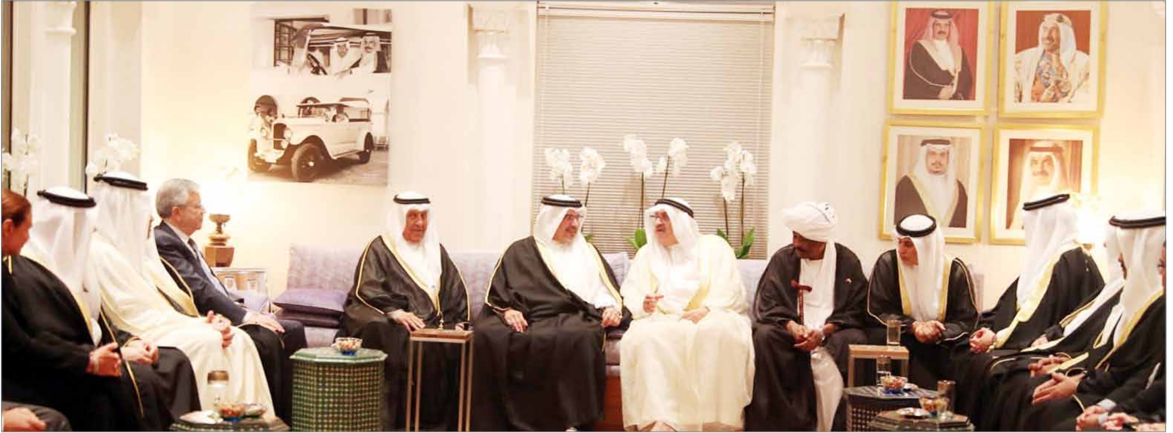
• سمو ولي العهد في زيارة لمجلس أبناء المرحوم راشد عبدالرحمن الزباني