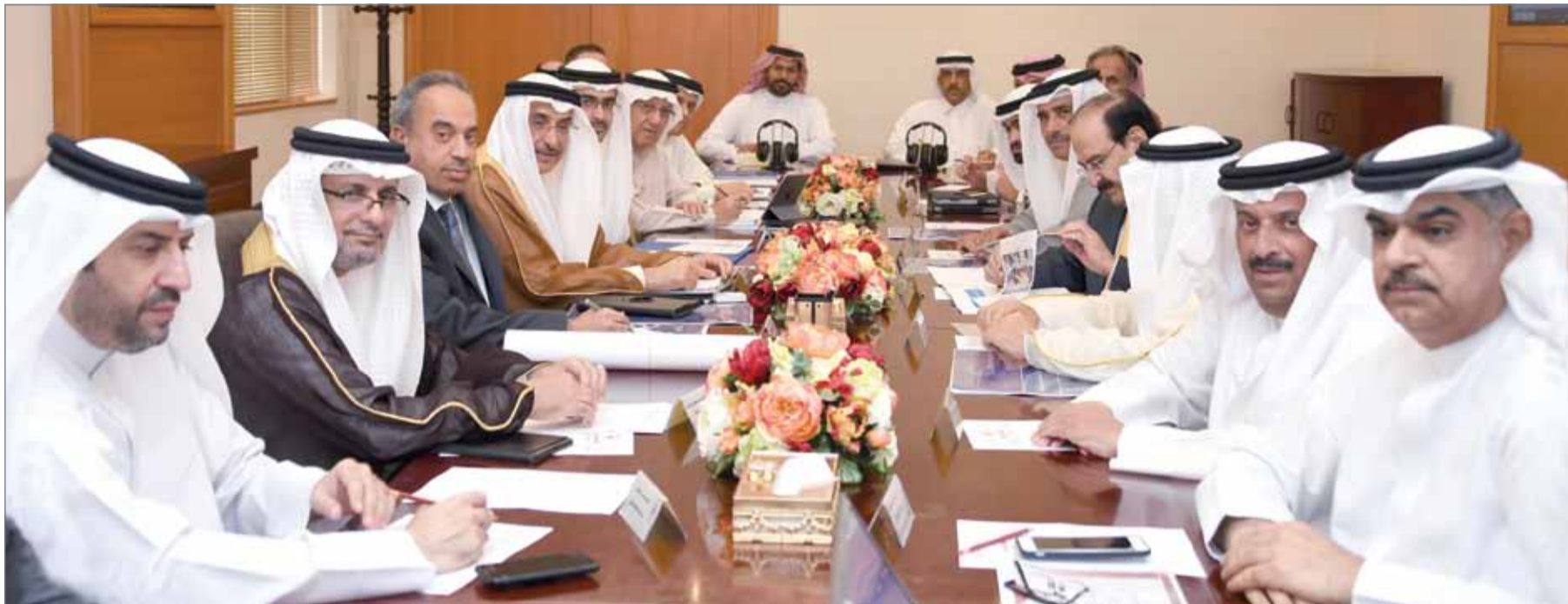
● نائب رئيس مجلس الوزراء مهندساً اجتماع عمل إعداد خطة استكمال احتياجات مدينة خليفة

● إنشاء أكثر من 6 آلاف وحدة في المدينة على 4 مراحل ● انتهاء المرحلة الأولى بطاقة 1600 وحدة نهاية العام