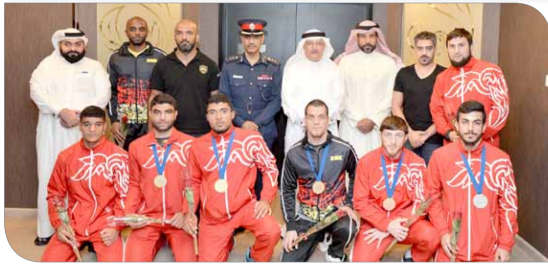
عسكر والخياط يتوسلان أبطال البطولة الإفريقية لفنون القتال

صاحبة السيف | اللجنة الأولمبية البحرينية