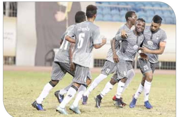
فريق طموح يعول على روح الفريق الواحد