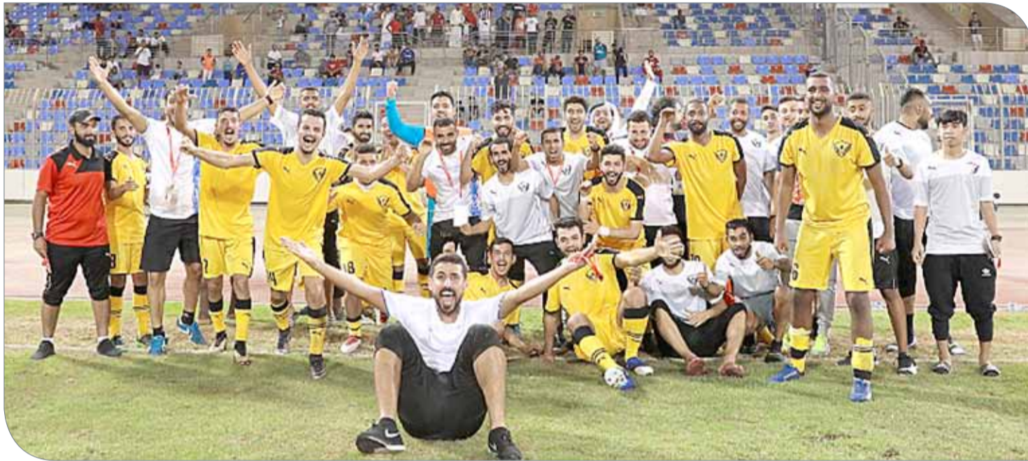
فرحة لاعبو الصقر الأبيض بالتأهل لنصف النهائي