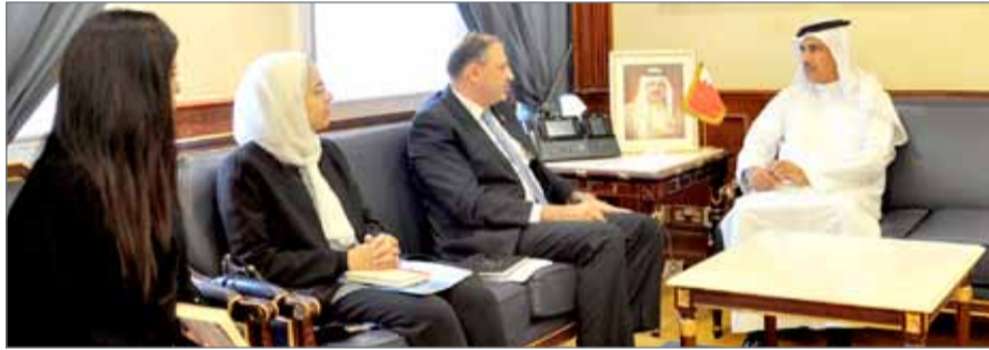
• وزير الإسكان مستقبلاً الممثل المقيم لبرنامج الأمم المتحدة الإنمائي

ينص على "جعل المدن والمستوطنات البشرية شاملة للجميع وآمنة وقادرة على الصمود ومستدامة"، حيث تشهد البحرين حالياً طفرة نوعية على صعيد تنفيذ 5 مدن إسكانية متكاملة والمرافق والخدمات التعليمية والصحية والتجارية والخدمات والأمنية وغيرها، بما يؤهلها لأن تشكل مجتمعات عمرانية جديدة بالمملكة.