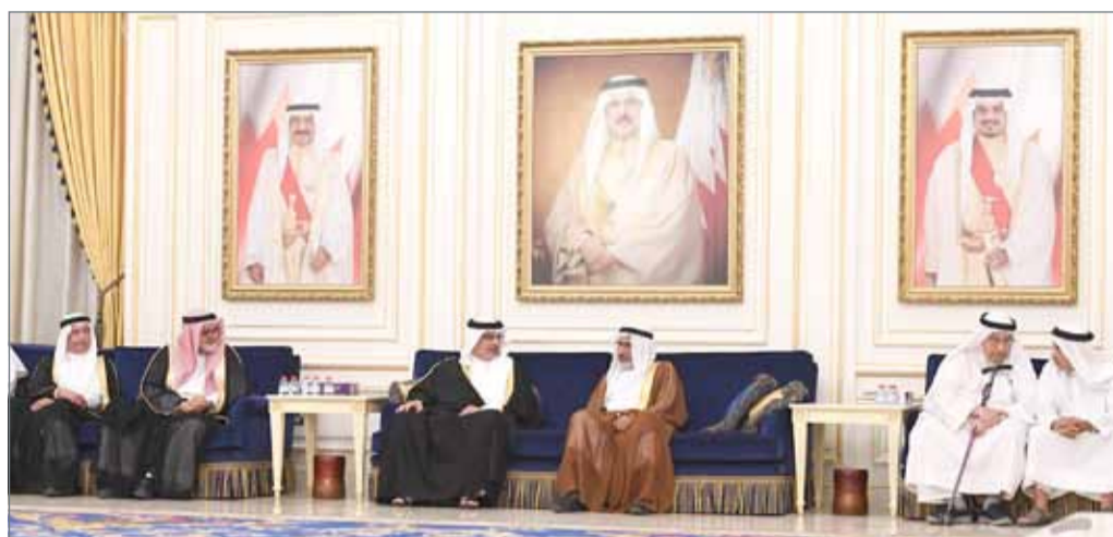
... وسموه يزور مجلس عائلة الكوهجي