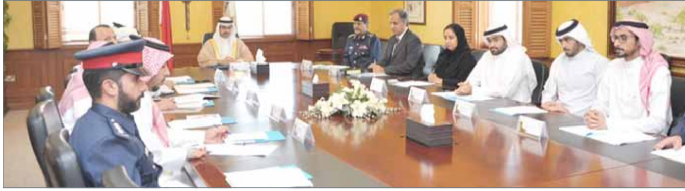
• سمو الشيخ خليفة بن علي آل خليفة متحدثاً اجتماعياً بمقر المحافظة الجنوبية

وأكد سموه أن المحافظة تعمل على مبدأ الشراكة والتعاون الدائم مع مختلف الجهات لإيجاد حلول مناسبة لقضايا المجتمع والوقوف للتأكد من معالجتها، حرصاً من المحافظة الجنوبية لخدمة المواطن والعمل بالحفاظ على أمنه واستقراره. من جانبهم، عبر الحضور عن شكرهم وتقديرهم لمساعي واهتمام سمو محافظ الجنوبية لمباشرة سموه كل ما من شأنه الحفاظ على أمن وسلامة ومصالح مواطني المحافظة الجنوبية ودعم سموه المستمر لمسؤولياتهم وأنشطتهم المختلفة، مؤكداً لسموه تعاونهم الكامل لبذل مزيد من العمل خدمة للمحافظة الجنوبية وأهلها.