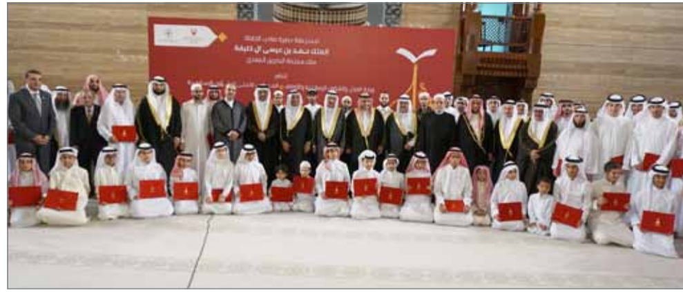
• اختتام الدورة الـ 23 من جائزة البحرين الكبرى للقرآن الكريم