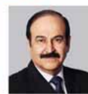
الرئيس التنفيذي وزير شؤون الكهرباء والماء