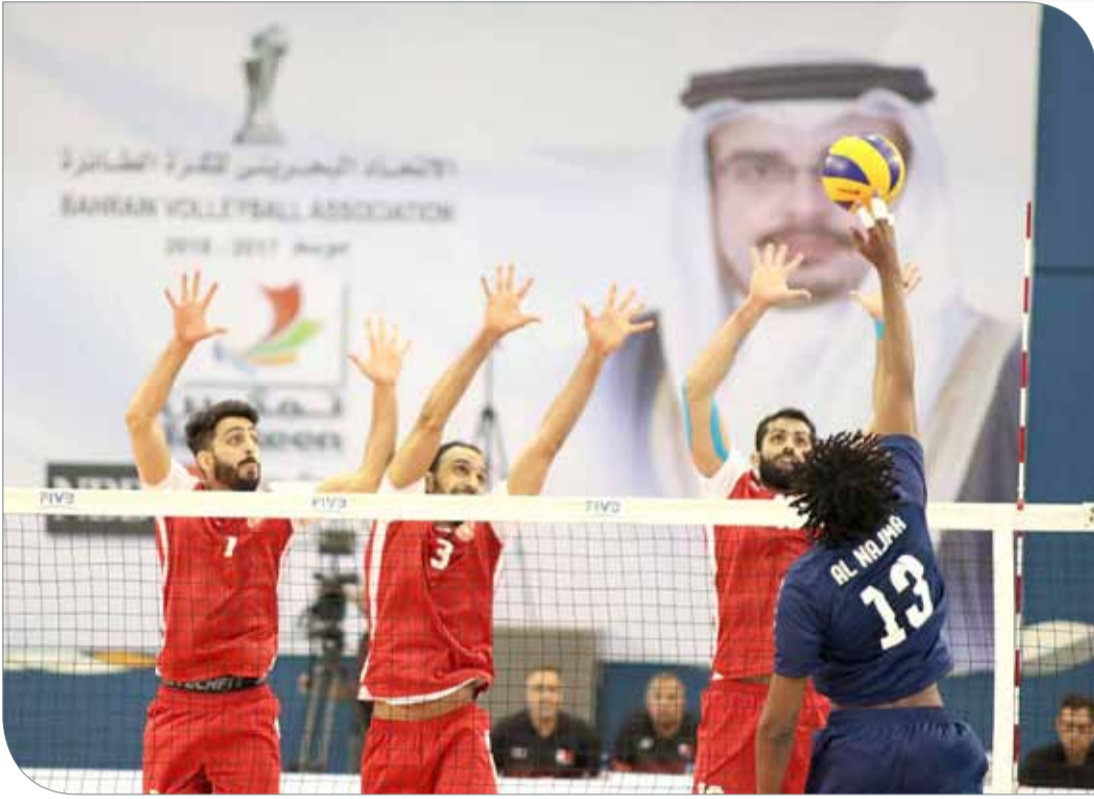
من منافسات الكرة الطائرة بالموسم الماضي

سيتمحور بتسجيل 40 لاعبا في المهرجانات و6 لاعبين في استمارة المباراة، وتسجيل 30 لاعبا في كشف استمارة الصغار و10 - 18 لاعبا في استمارة المباراة، ولا يسمح بتسجيل لاعب حر، وتسجيل 20 لاعبا في الكشف بمسابقة الأشبال و12 لاعبا في استمارة المباراة، ولا يسمح بتسجيل لاعب حر. كما يسمح بتسجيل 20 لاعبا في الكشف بمسابقات الناشئين و12 لاعبا في استمارة المباراة ويسمح بتسجيل لاعب حر، وتسجيل 18 لاعبا بالكشف بمسابقة فئة الشباب و12 لاعبا في استمارة المباراة، ويسمح بتسجيل لاعب حر، وأخيرا يسمح بتسجيل 18 لاعبا بمن فيهم اللاعب المعار والأجنبي في كشوفات مسابقات الدرجة الأولى والثانية وتسجيل 12 لاعبا في استمارة المباراة، ويسمح بتسجيل اللاعب الحر.