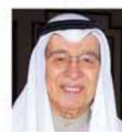
الرئيس التنفيذي المرحوم الوجيه عيارت كانو