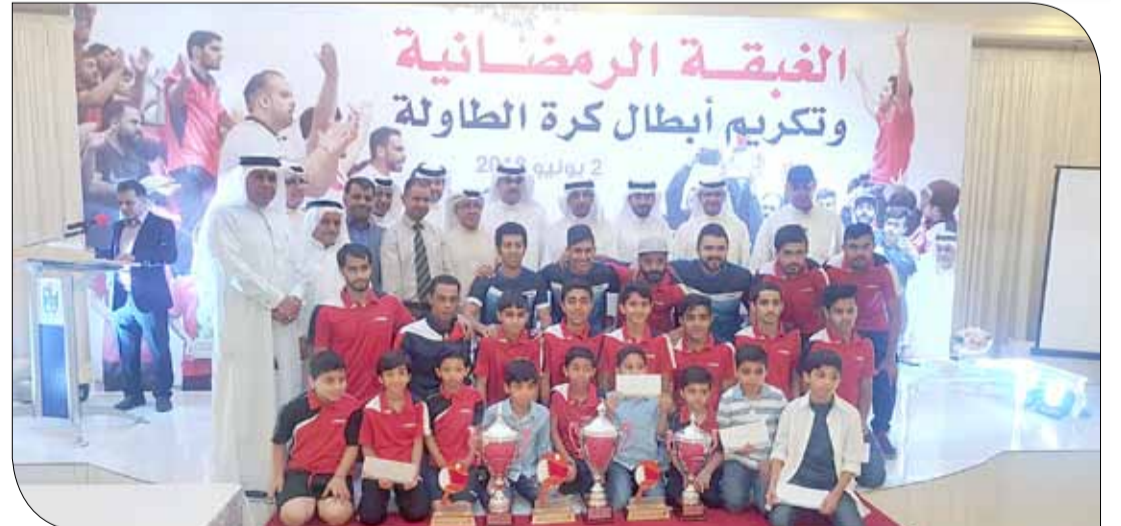
جانب من تكريم أبطال الطاولة