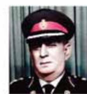
الرئيس التنفيذي المرحوم العميد علي ميرزا