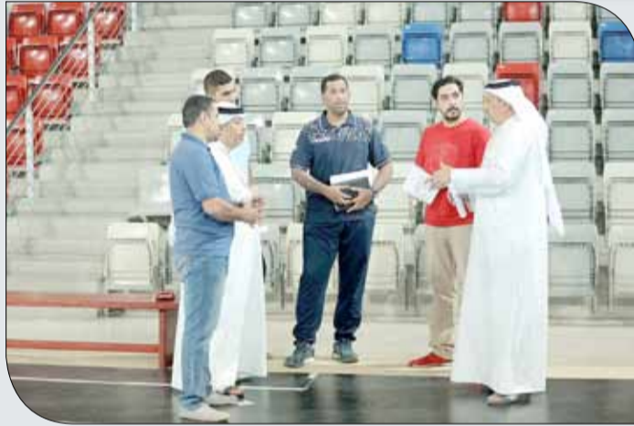
من زيارة صالة مدينة خليفة الرياضية

ويأتي دوري سمو الشيخ خالد بن حمد آل خليفة لكرة الصالات في نسخته السادسة ضمن إطار مبادرات سموه في المجالين الرياضي والإنساني، إذ يتبنى سموه العديد من المبادرات التي تخدم القطاع الشبابي في المملكة، حيث يقوم المكتب الإعلامي لسموه بالإشراف على تنفيذ هذه المبادرات بالتنسيق مع الجهات الحكومية. ويأتي حرص سموه الكبير على تفعيل دور الشباب للارتقاء بالأنشطة المندرجة تحت مظلة مبادرات سموه، وذلك بالشراكة مع وزارة شؤون الشباب في تنظيم أكبر دوري في مملكة البحرين من حيث عدد الأفرقة المشاركة.