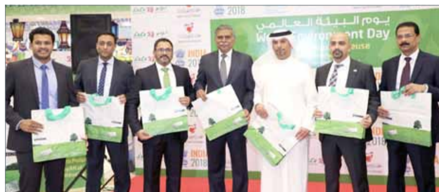
• لقطة تذكارية

علمنا على التعاون معنا من أجل عالم أفضل. كما أوضح روباوالا أنه بمناسبة اليوم العالمي للبيئة والذي يصادف الخامس من يونيو وفرت أسواق "اللؤلؤ هاوير" 6000 كيس غير قابل للتحلل، ليتم توزيعها مجانًا في جميع الفروع على الزبائن ومرتادي أسواق "اللؤلؤ هاوير" لتشجيعهم على استخدامها لدى تسوقهم لخفض نسبة استخدام الأكياس البلاستيكية.