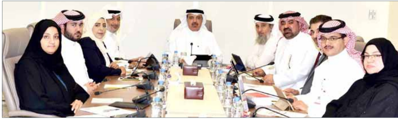
● صورة أرشيفية لاجتماع سابق للجنة الخدمات النيابية

● لا انتقاص من المزايا أو زيادة اشتراكات الإلقانون