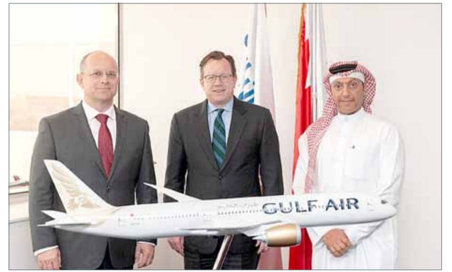
• ”طيران الخليج“ مستقبلة السفير الأميركي لدى البحرين

المنامة - طيران الخليج: استضافت طيران الخليج سفير الولايات المتحدة الأميركية لدى البحرين جستن سيبيريل في مقرها الرئيسي بالمرق، حيث كان في استقباله الرئيس التنفيذي للشركة كريشمير كوتشكو، ونائب الرئيس التنفيذي القبطان وليد عبدالحميد العلوي. وتم خلال اللقاء مناقشة أوجه