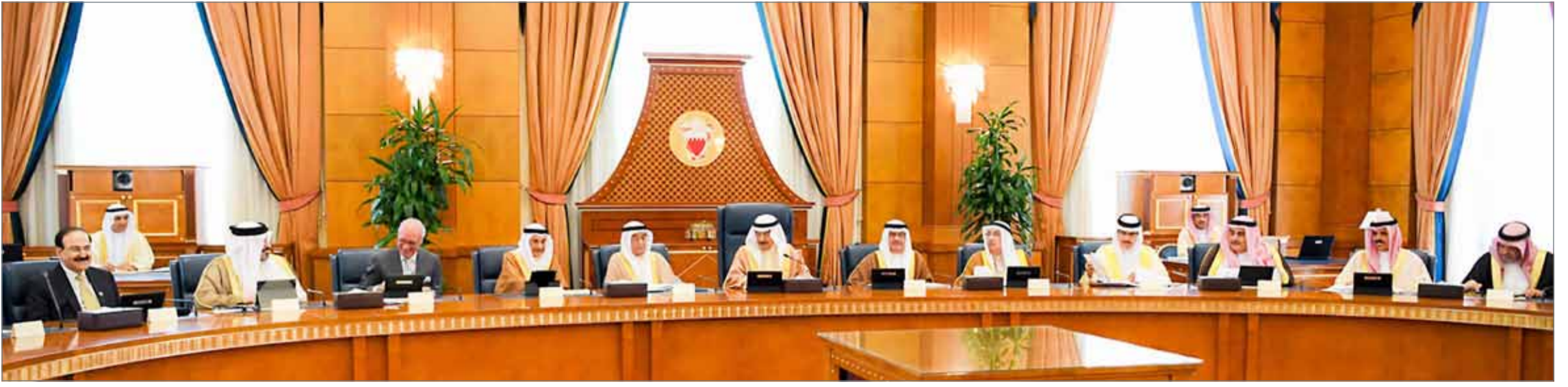
• سمو رئيس الوزراء مترأساً جلسة مجلس الوزراء أمس