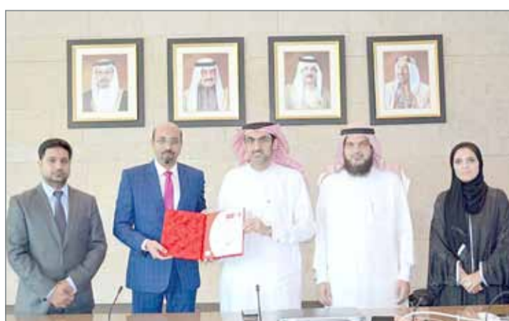
القائد متسلماً شهادة الأيزو ISO20000:2011 لنظام إدارة خدمات تقنية المعلومات

والتحولات المتسارعة في التكنولوجيا. من جانبه، قال مدير عام العمليات والحكومة بالمهئية الشيخ سلمان بن محمد آل خليفة إن حصول قطاع تقنية المعلومات على الشهادة، تحت