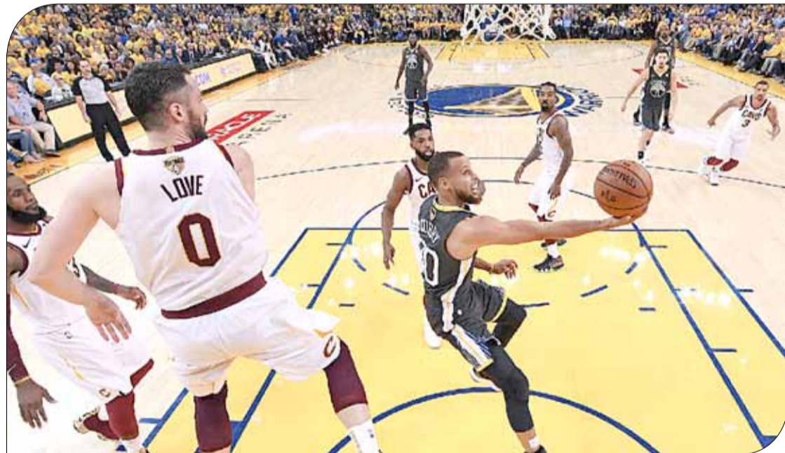
من مواجهة غولدن ستايت وكليفلاند

كليفلاند الذي يستضيف أيضاً المباراة الرابعة الجمعة، قبل أن يتبادل الفريقان الاستضافة إذا اقتضت الحاجة لأن الفريق الذي يسبق منافسه للفوز بأربع مباريات من أصل سبع يحسم المواجهة ويتوج باللقب.