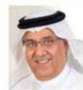
الرئيس التنفيذي بنك البحرين والكويت