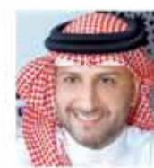
الرئيس التنفيذي رئيس مجلس إدارة وهو الممثل مجموعة العود الدولية