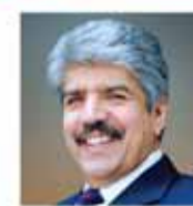
الرئيس التنفيذي الأمين العام للمؤسسة الخيرية الملكية