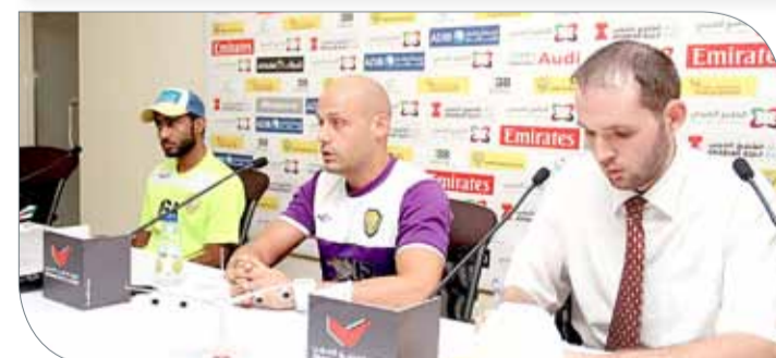
بيدرو جوميز كارمونا

كالديرون، والذي قاد المنتخب في كأس الخليج العربي "خليجي 21". وبحسب السيرة الذاتية للمدرب بيدرو جوميز كارمونا، فإنه سبق له الإشراف الفني على عدد من الفرق سواء في القارة الأوروبية كنادي