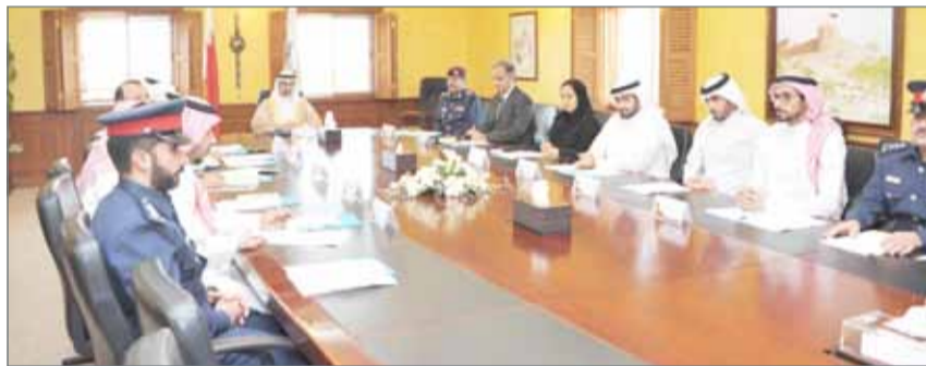
• سمو الشيخ خليفة بن علي آل خليفة مترأساً اجتماعاً بمقر المحافظة الجنوبية

بالتنسيق مع الجهات المختصة... سمو الشيخ خليفة بن علي: حريصون على حل قضية السكراب نهائياً