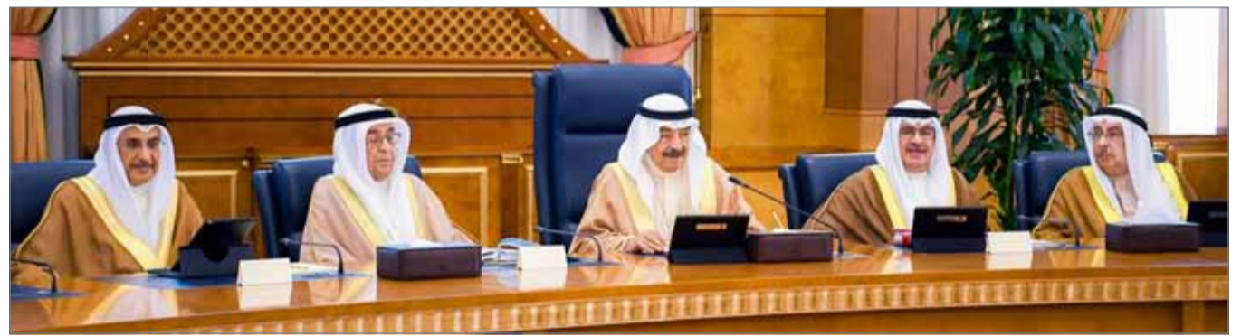
• سمو رئيس الوزراء مترأساً جلسة مجلس الوزراء

• منح الأجانب إقامة 10 سنوات برسوم 600 دينار