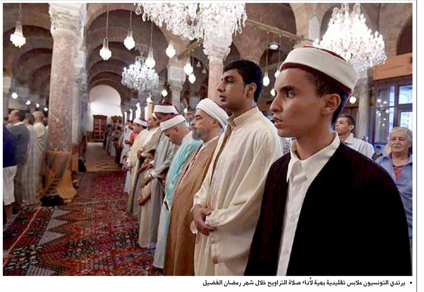
• يرتدي التونسيون ملابس تقليدية بجملة لأداء صلاة التراويح خلال شهر رمضان الفضيل

حالة الطقس الطقس رطب نسبياً أحياناً ولكنه حار خلال النهار. الرياح شرقية عموماً من 5 إلى 10 عقد وتصل من 10 إلى 15 عقدة أحياناً. ارتفاع الموج من قدم إلى 3 أقدام. درجة الحرارة العظمى 40 والصغرى 30. الرطوبة النسبية العظمى 85% والصغرى 25%.