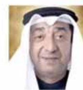
الرئيس التنفيذي رئيس غرفة تجارة ومصناعة البحرين