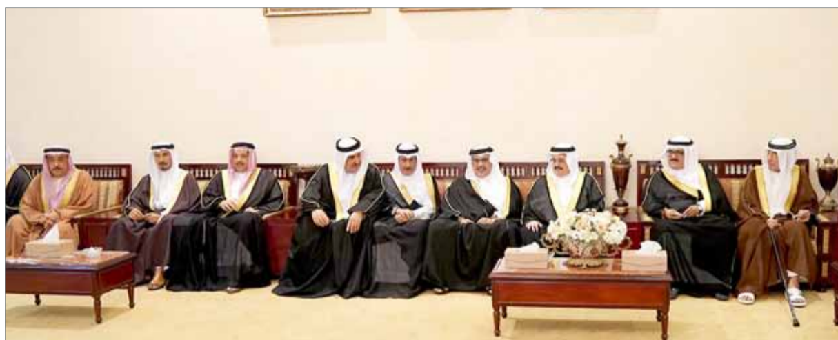
سمو ولي العهد يزور مجلس عائلة الدوسري

وأولاده، منوها سموه بما يتمتع به شهر رمضان المبارك من تواصل وتآلف من خلال الزيارات الرمضانية والتي تعزز عادات المجتمع التي ورثها الآباء والأجداد. وأشار سموه إلى أن المملكة تعمل على تنفيذ المشاريع التنموية الكبرى التي تغطي القطاعات الحيوية كافة التي تصب في خدمة الاقتصاد وتنويع مصادر الدخل، بما يساهم في ترسيخ الموقع الاقتصادي للمملكة والتنافسية فيها، وخلق فرص عمل نوعية، وجذب استثمارات تعزز من دور القطاعات الاقتصادية الرئيسية في المملكة. من جانبهم، أعرب أصحاب المجالس عن شكرهم وتقديرهم لصاحب السمو الملكي ولي العهد نائب القائد الأعلى النائب الأول لرئيس مجلس الوزراء على ما يبديه سموه من اهتمام بزيارة المجالس في هذا الشهر الفضيل، وحرص سموه على مصلحة الوطن والمواطن بما يلي التطلعات المنشودة.