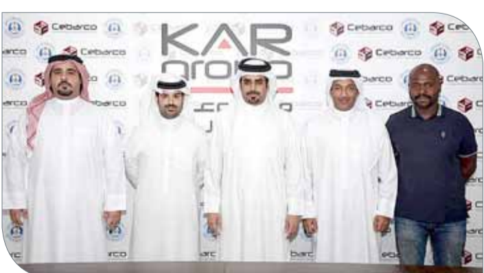
الجهاز الإداري الجديد مع رئيس النادي