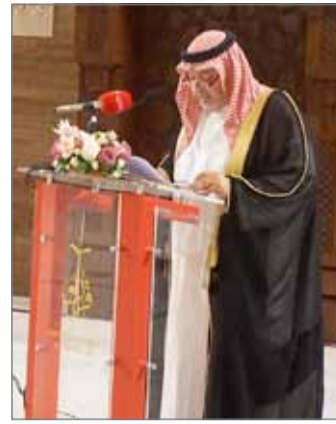
• وزير العدل