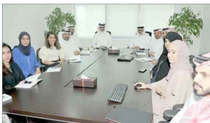
الرئيس التنفيذي لمركز الاتصال الوطني مستقبلاً فريق إدارة الأداء المؤسسي

فريقاً من إدارة الأداء المؤسسي في ديوان الخدمة المدنية؛ لعرض مشروع الأداء المؤسسي “تكامل”. وأضاف أن “مركز الاتصال الوطني اتخذ القرار بأن يكون من أوائل المؤسسات الحكومية